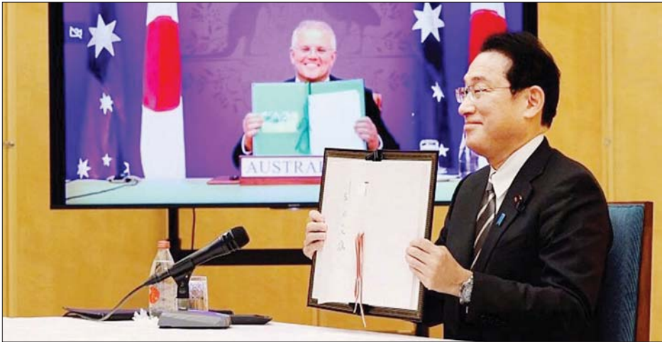
ဂျပန်ဝန်ကြီးချုပ် ကိရိုးဒါးဖူမိယိုနှင့် ဩစတြေးလျဝန်ကြီးချုပ် စကော့မောရစ်ဆင်။

တိုကျို ဇန်နဝါရီ ၆ ဂျပန်နှင့် ဩစတြေးလျနိုင်ငံတို့သည် လုံခြုံရေးဆိုင်ရာ ပူးပေါင်းဆောင်ရွက်မှုများကို တိုးမြှင့်ခဲ့ပြီး နှစ်နိုင်ငံခေါင်းဆောင်များသည် ကာကွယ်ရေးနှင့် လုံခြုံရေးပူးပေါင်းဆောင်ရွက်မှုဆိုင်ရာ သဘောတူစာချုပ်ကို လက်မှတ်ရေးထိုးခဲ့သည်။ ဂျပန်နိုင်ငံအနေဖြင့် ယခုလို ကာကွယ်ရေးနှင့် လုံခြုံရေးပူးပေါင်းဆောင်ရွက်မှု သဘောတူစာချုပ်ကို လက်မှတ်ရေးထိုးရာတွင် ဩစတြေးလျသည် ပထမဆုံးနိုင်ငံဖြစ်သည်။ ဂျပန်ဝန်ကြီးချုပ် ကိရိုးဒါးဖူမိယိုသည် ဩစတြေးလျဝန်ကြီးချုပ် စကော့မောရစ်ဆင်နှင့် ဇန်နဝါရီ ၆ ရက် အွန်လိုင်းအစည်းအဝေးတွင် တွေ့ဆုံခဲ့သည်။ ဂျပန်ကိုယ်ပိုင် ကာကွယ်ရေးတပ်ဖွဲ့နှင့် ဩစတြေးလျစစ်ဘက်တို့ အပြန်အလှန်စစ်ရေး