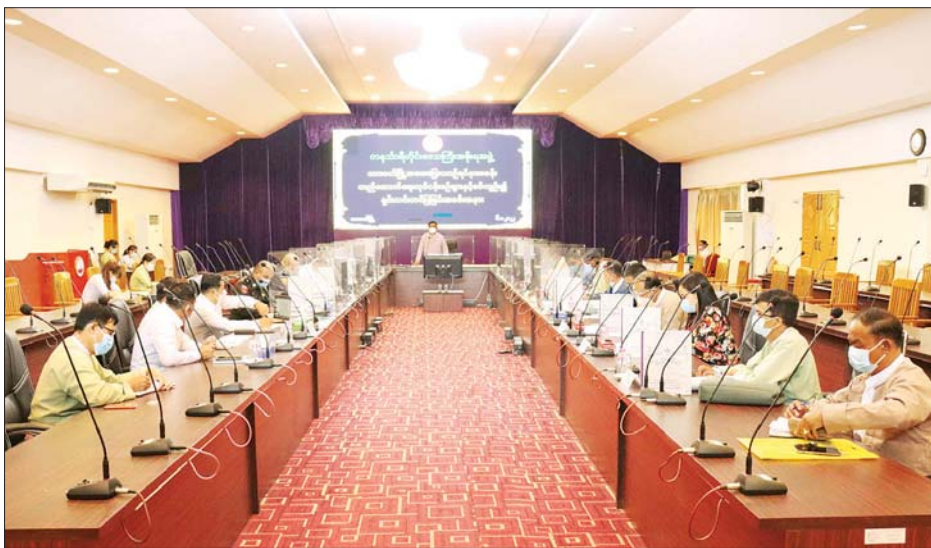
ထားဝယ်မြို့ အဝေးပြေးယာဉ်ရပ်နားစခန်းတည်ဆောက်ရေးနှင့် ပတ်သက်၍ ရှင်းလင်းဆွေးနွေးပွဲကျင်းပစဉ်။

အစိုးရအဖွဲ့အနေဖြင့် တနင်္သာရီတိုင်းဒေသကြီးအတွင်း ဒေသဖွံ့ဖြိုးတိုးတက်ရေးလုပ်ငန်းများကို အလေးအနက်ထား၍ ကြိုးစားဆောင်ရွက်လျက်ရှိကြောင်း၊ တိုင်းအတွင်း ဆောင်ရွက်ရန်ကျန်ရှိသည့် လုပ်ငန်းများကိုလည်း အကောင်းဆုံးဖြစ်အောင် ကြိုးစားဆောင်ရွက်ပေးမည်ဖြစ်ကြောင်း ပြောကြားသည်။ ယင်းနောက် ခန့်ရွှေပြည်ကုမ္ပဏီလီမိတက်က တည်ဆောက်ရေးလုပ်ငန်းများနှင့် ပတ်သက်၍ ဆောင်ရွက်ထားရှိမှု အခြေအနေများကို ရှင်းလင်းတင်ပြရာ တိုင်းဒေသကြီးဝန်ကြီးများက လိုအပ်သည်များ ဆွေးနွေးပြီး တိုင်းဒေသကြီးဝန်ကြီးချုပ်က ပေါင်းစပ်ညှိနှိုင်း ဆောင်ရွက်ပေးခဲ့ကြောင်း သိရသည်။ တိုင်းဒေသကြီး(ပြန်/ဆက်)