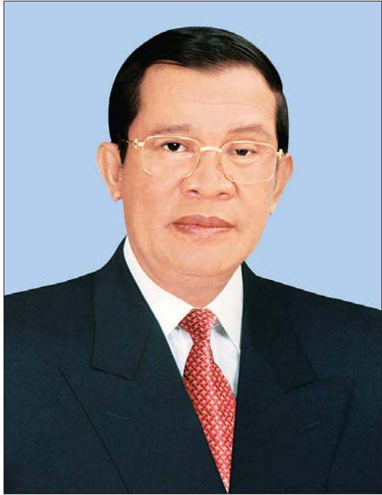
ကမ္ဘောဒီးယားနိုင်ငံ ဝန်ကြီးချုပ် ဆမ်ဒက် အာခါ မိုဟာ ဆီနာ ပါတိုင်း တွဲချီ ဟွန်ဆင်

နေပြည်တော် ဇန်နဝါရီ ၆ ပြည်ထောင်စုသမ္မတမြန်မာနိုင်ငံတော်၊ နိုင်ငံတော်စီမံအုပ်ချုပ်ရေးကောင်စီဥက္ကဋ္ဌ၊ နိုင်ငံတော်ဝန်ကြီးချုပ် ဗိုလ်ချုပ်မှူးကြီး မင်းအောင်လှိုင်၏ ဖိတ်ကြားချက်အရ ကမ္ဘောဒီးယားနိုင်ငံဝန်ကြီးချုပ် ဆမ်ဒက် အာခါ မိုဟာ ဆီနာ ပါတိုင်း တွဲချီ ဟွန်ဆင်သည် ၂၀၂၂ ခုနှစ်၊ ဇန်နဝါရီ ၇ ရက်မှ ၈ ရက်အထိ မြန်မာနိုင်ငံသို့ အလုပ်သဘော ခရီးစဉ်လာရောက်မည် ဖြစ်သည်။