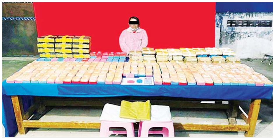
မခေါန်ဆန် ကို သိမ်းဆည်းရမိသည့် မူးယစ်ဆေးဝါးများနှင့်အတူ တွေ့ရစဉ်။

လက် စစ်ဆေးဖော်ထုတ်လျက်ရှိ ကြောင်း သိရသည်။ သတင်းစဉ်