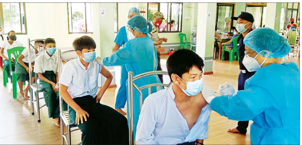
စာမျက်နှာ ၁၀ ကော်လံ ၁၀

နေပြည်တော် ဇန်နဝါရီ ၆ အာရှကျော် ပရမံ လာဘ် ဟူသည့်စကားနှင့်အညီ ကျန်းမာရေး ကောင်းမွန်ခြင်းသည် လူတိုင်းအတွက် လာဘ်ကြီးတစ်ပါးဖြစ်ပြီး ကျန်းမာရေးကောင်းမွန်မှသာ လူမှုရေး၊ စီးပွားရေး၊ စားဝတ်နေရေး၊ ပညာရေး စသည်တို့ကို အောင်မြင်စွာ ဆောင်ရွက်နိုင်မည်ဖြစ်သည်။ “ကျန်းမာမှ အလုပ်လုပ်နိုင်မည်၊ ကျန်းမာမှ ပညာသင်ကြားနိုင်မည် ဟူသော နိုင်ငံတော်စီမံအုပ်ချုပ်ရေးကောင်စီဥက္ကဋ္ဌ၊ တပ်မတော်ကာကွယ်ရေးဦးစီးချုပ် ဗိုလ်ချုပ်မှူးကြီး မင်းအောင်လှိုင်၏ မူဝါဒလမ်းညွှန်ချက်နှင့်အညီ တပ်မတော်အနေဖြင့် အဓိကတာဝန်ဖြစ်သည့် နိုင်ငံတော် ကာကွယ်ရေးနှင့် လုံခြုံရေးတာဝန်များကို ထမ်းဆောင်နေသည့် အပြင် ပြည်သူ့အကျိုးပြု လုပ်ငန်းတာဝန်များဖြစ်သည့် ကျန်းမာရေး၊ သဘာဝဘေးအန္တရာယ် ကူညီကယ်ဆယ်ရေးလုပ်ငန်းများကိုလည်း ခေတ်အဆက်ဆက်တွင် တစ်ဖက်တစ်လမ်းမှ ဆောင်ရွက်ပေးလျက် ရှိသည်။