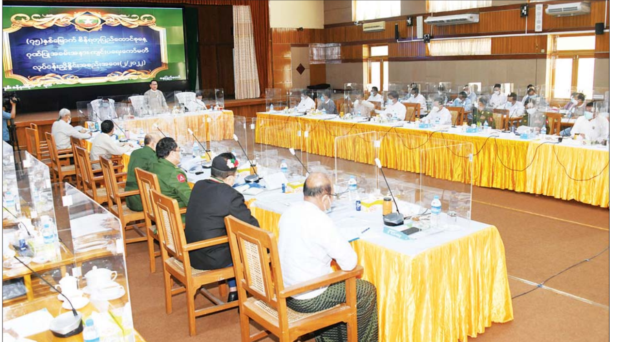
ပြည်ထောင်စုဝန်ကြီး ဦးမောင်မောင်အုန်း (၇၅)နှစ်မြောက် စိန်ရတုပြည်ထောင်စုနေ့ ဂုဏ်ပြုအခမ်းအနားကျင်းပရေးကော်မတီ လုပ်ငန်းညှိနှိုင်းအစည်းအဝေးတွင် အမှာစကားပြောကြားစဉ်။

အခမ်းအနားတစ်ခုဖြစ် ရှေးဦးစွာ ဂုဏ်ပြုအခမ်းအနားကျင်းပရေး ကော်မတီဥက္ကဋ္ဌ ပြည်ထောင်စုဝန်ကြီးဦးမောင်မောင်အုန်းက (၇၅)နှစ်မြောက် စိန်ရတုပြည်ထောင်စုနေ့ကို ဂုဏ်ပြုသောအားဖြင့် ဗိုလ်ရှုခံရင်ပြင်၌ ကျင်းပမည့် အခမ်းအနားသည် တိုင်းရင်းသားအားလုံး ပူးပေါင်းပါဝင် ဆောင်ရွက်မည့် အခမ်းအနားတစ်ခုဖြစ်ပြီး တိုင်းရင်းသား စည်းလုံးညီညွတ်ရေးအတွက် အရေးကြီးပါကြောင်း၊ သို့ဖြစ်၍ ယနေ့အစည်းအဝေးတွင် မိမိတို့ကဏ္ဍအလိုက် ဆောင်ရွက်မည့် အခြေအနေများကို ဆွေးနွေးတင်ပြကြရန် ဖြစ်ပါကြောင်း ပြောကြားသည်။ ထို့နောက် ဂုဏ်ပြုအခမ်းအနားကျင်းပရေး ကော်မတီ ဒုတိယဥက္ကဋ္ဌ ပြည်ထောင်စုဝန်ကြီး ဦးမင်းသိန်းဇံနှင့် နေပြည်