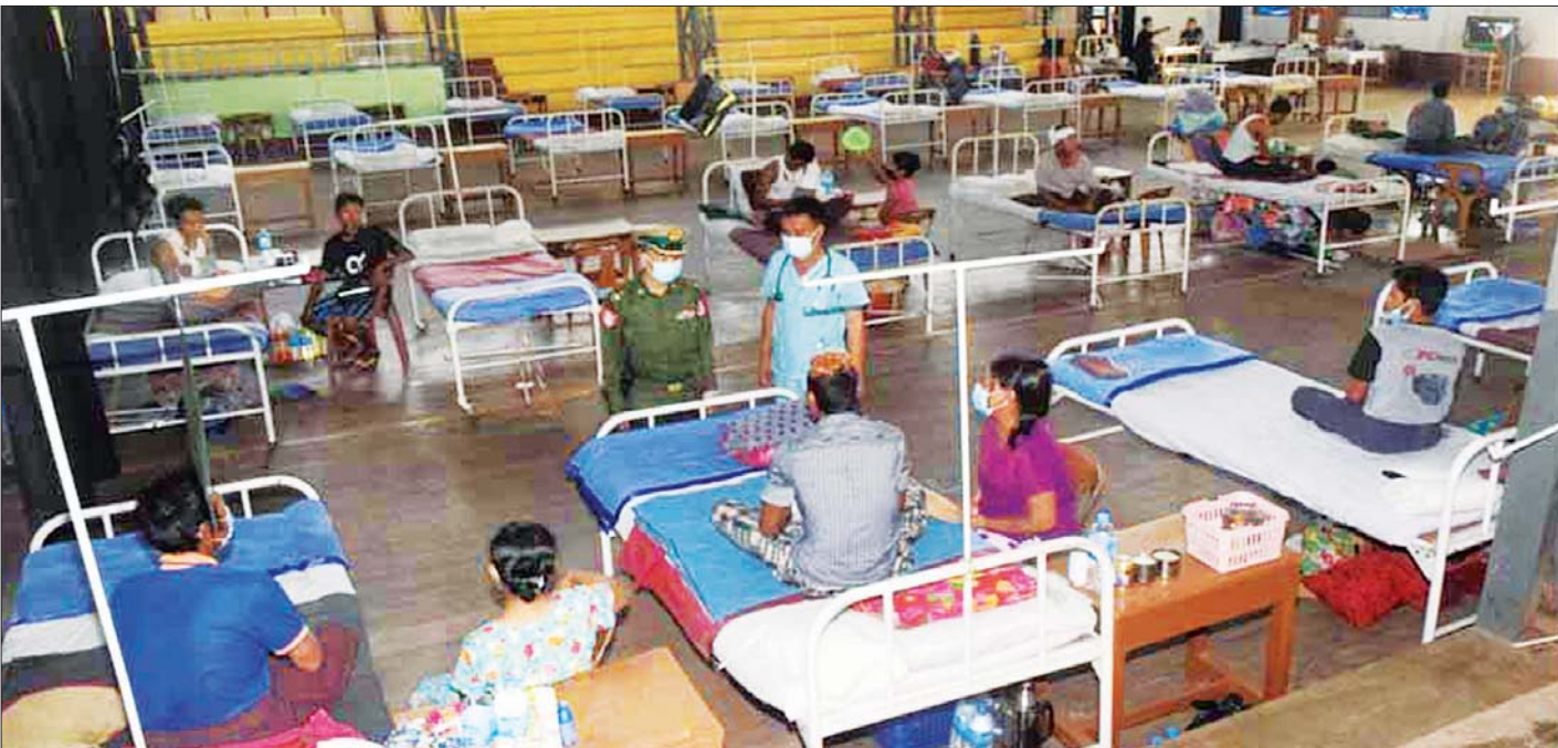
ကိုဗစ်-၁၉ လူနာများအား ဆေးရုံများ၌ ကျန်းမာရေးစောင့်ရှောက်မှုများ ဆောင်ရွက်ပေးစဉ်။

တပ်မတော်အနေဖြင့် တိုင်းနှင့် ပြည်နယ်အသီးသီးရှိ တပ်မတော်ဆေးရုံ၊ ဆေးတပ်ရင်းများတွင် ဒေသခံပြည်သူများကို ကျန်းမာရေးစောင့်ရှောက်မှုများ ဆောင်ရွက်ပေးရုံမက တပ်မတော်နယ်လှည့်အထူးကုဆေးအဖွဲ့များ၊ တိုင်းစစ်ဌာနချုပ် အသီးသီးရှိ နယ်လှည့်ဆေးကုသရေးအဖွဲ့များဖြင့်လည်း ဒေသခံပြည်သူများကို ကျန်းမာရေးစောင့်ရှောက်မှုများကို ကိုဗစ်-၁၉ ရောဂါအပြင် အခြားရောဂါများနှင့် ပတ်သက်သည့် အသိပညာပေးဟောပြောမှုများကို ဆောင်ရွက်ပေးလျက်ရှိသည်။ အဆိုပါ နယ်လှည့်ဆေးကုသရေးအဖွဲ့များတွင် ခေတ်မီရွေ့လျားခွဲစိတ်ကုသယာဉ်၊ ဓာတ်မှန်ရိုက်ယာဉ်များပါဝင်ခြင်း၊ ဆေးကုသမှုအတွေ့အကြုံများသည့် ဝါရင့်ပါရဂူများ ပါဝင်ခြင်း စသည်တို့ကြောင့် အသက်အန္တရာယ်ရှိသည့် ရောဂါဝေဒနာရှင်များအား အချိန်မီ အရေးပေါ်ကုသပေးနိုင်ခဲ့ခြင်း၊ နီးစပ်ရာ တပ်မတော်ဆေးရုံများသို့ အချိန်မီပို့ဆောင်ကုသပေးနိုင်ခြင်းတို့ကြောင့် ပြည်သူလူထု၏ အသက်ပေါင်းများစွာကို ကယ်တင်နိုင်ခဲ့သည့်အပြင် ကျန်းမာရေးစောင့်ရှောက်မှုကို တိုးမြှင့်လုပ်ဆောင်ပေးနိုင်ခဲ့ကြောင်းနှင့် ဆက်လက်၍လည်း တပ်မတော်အနေဖြင့် တိုင်းရင်းသားပြည်သူများ၏ ကျန်းမာရေးကဏ္ဍ အရှိန်အဟုန်မြှင့်တင်ရေးတွင် စဉ်ဆက်မပြတ် ဆက်လက်ဖြည့်ဆည်းဆောင်ရွက်ပေးလျက်ရှိကြောင်း သတင်းရရှိသည်။ သတင်းစဉ်