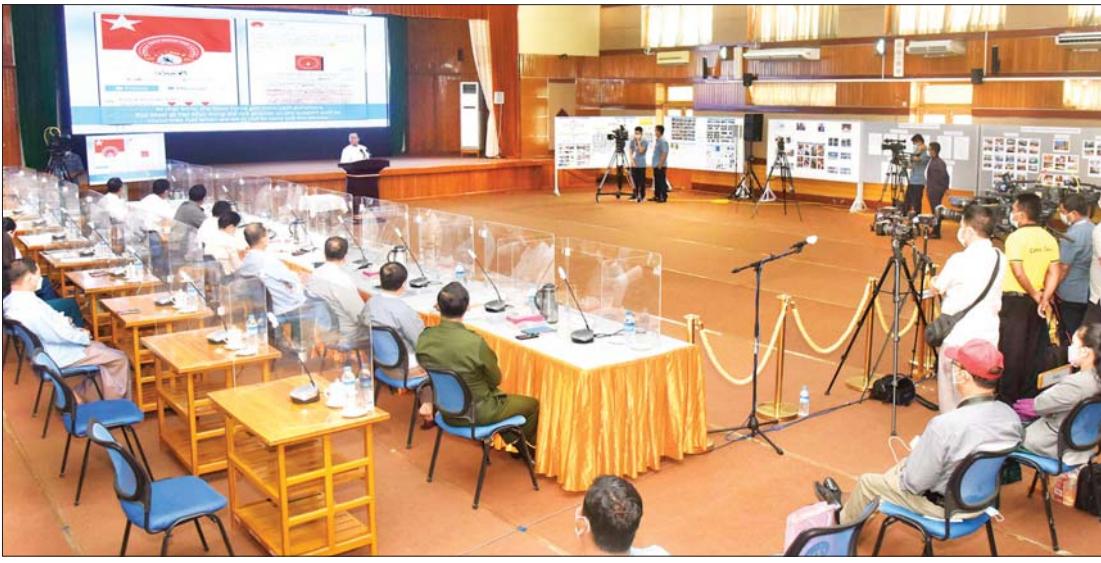
၂၀၂၁ ခုနှစ် နိုဝင်ဘာ ၂၆ ရက်က ပြုလုပ်သည့် နိုင်ငံတော်စီမံအုပ်ချုပ်ရေးကောင်စီ၊ သတင်းထုတ်ပြန်ရေးအဖွဲ့၏ ၁၀/၂၀၂၁ ကြိမ်မြောက် သတင်းစာရှင်းလင်းပွဲ။

ဂျပန်အစိုးရ၏ မြန်မာနိုင်ငံ အမျိုးသား ပြန်လည်သင့်မြတ်ရေးဆိုင်ရာ အထူးကိုယ်စားလှယ် မစ္စတာ ဆာဆာကာဝါနှင့် အဖွဲ့ဝင်များသည် နိုဝင်ဘာ ၁၅ ရက်က ရခိုင်ပြည်နယ် စစ်တွေမြို့သို့ တပ်မတော်လေယာဉ်ဖြင့် ရောက်ရှိခဲ့ကြသည်။ ဂျပန်နိုင်ငံ၏ အထူးကိုယ်စားလှယ်နှင့်အဖွဲ့ဝင်များသည် အောင်မြေဗောဓိဓမ္မရိပ်သာ အလိုတော်ပြည့်ကျောင်းတိုက်ရှိ တိုက်ပွဲရှောင်စခန်းနှင့် ဥဿလင်း ဘုန်းတော်ကြီးကျောင်းတိုက်ရှိ တိုက်ပွဲရှောင်စခန်းတို့၌ ယာယီနေထိုင်လျက်ရှိသည့် ဒေသခံပြည်သူများနှင့် သက္ကယ်ပြင်ကျေးရွာရှိ ကယ်ဆယ်ရေးစခန်း၌ နေထိုင်လျက်ရှိသည့် ဘင်္ဂါလီများအား သွားရောက်