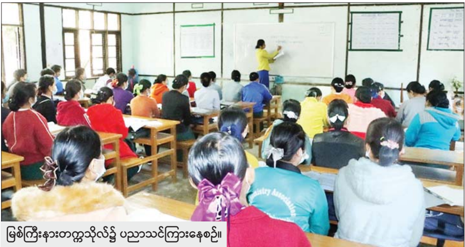
မြစ်ကြီးနားတက္ကသိုလ်၌ ပညာသင်ကြားနေစဉ်။

မြန်မာနိုင်ငံတွင် ကိုဗစ်-၁၉ ကူးစက်မှုထိန်းချုပ်လာနိုင်ရန်အတွက် ကျောင်းသား ကျောင်းသူများ သင်ယူမှု အဆက်မပြတ်စေရန်အတွက် ပညာရေးဝန်ကြီးဌာနမှ အဆင့်မြင့်ပညာဦးစီးဌာနရှိ တက္ကသိုလ်၊ ဒီဂရီကောလိပ်၊ ကောလိပ်များတွင် နေ့သင်တန်းများကို ယနေ့ စတင်ဖွင့်လှစ်ခဲ့သည်။