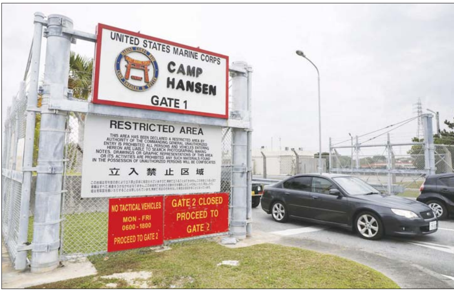
အမေရိကန် မရင်းတပ်ဖွဲ့ဂိတ် ၁ ကို တွေ့ရစဉ်။

တိုကျို ဇန်နဝါရီ ၆ ဂျပန်နိုင်ငံ အိုကီနာဝါခရိုင် အုပ်ချုပ်ရေးမှူးက ဇန်နဝါရီ ၅ ရက်က ကိုဗစ်-၁၉ ဖြစ်ပွားသူ ၆၂၃ ဦးရှိရာမှ ဇန်နဝါရီ ၆ ရက်တွင် နေ့စဉ်ကိုဗစ်-၁၉ ကူးစက်ဖြစ်ပွားမှုသည် ၁၀၀၀ နားကပ်လာပြီဖြစ်ကြောင်း ပြောကြားလိုက်သည်။ ခရိုင်အတွင်း နေ့စဉ် ကိုဗစ်-၁၉ ကူးစက်ဖြစ်ပွားမှု နောက်ဆုံး ကိန်းဂဏန်းသည် ၉၈၀ ခန့် ရှိလာပြီဖြစ်ကြောင်း၊ အဆိုပါ နှုန်းသည် အိုကီနာဝါခရိုင်အတွက် ကိုဗစ်-၁၉ ကူးစက် ဖြစ်ပွားမှု အမြင့်ဆုံးဖြစ်ကြောင်းနှင့် လွန်ခဲ့သောနှစ် ဩဂုတ် ၂၅ ရက်က စံချိန်တင်ခဲ့သော ကိုဗစ်-၁၉ ကူးစက်ဖြစ်ပွားသူ ၈၀၉ ဦးထက် ကျော်လွန်ခဲ့ကြောင်း ဒန်နီတာမာကီက ပြောသည်။ ဇန်နဝါရီ ၆ ရက်က အိုကီနာဝါခရိုင်ကို တစ်စိတ်တစ်ပိုင်း အရေးပေါ်ပြဋ္ဌာန်းရန် ခရိုင်အစိုးရက ဗဟိုအစိုးရထံ တောင်းဆို