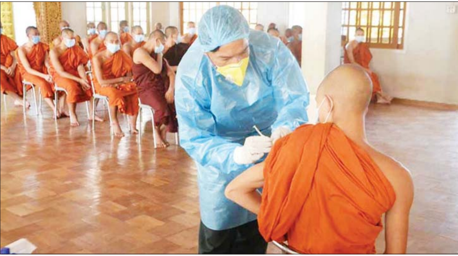
သံဃာတော်များနှင့် သာသနာ့နယ်ဝင်များအား ကိုဗစ်-၁၉ ကာကွယ်ဆေး ထိုးနှံပေးစဉ်။