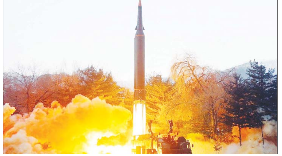
အသံထက်မြန်သော ဒုံးကျည်ကို ပစ်ခတ်စမ်းသပ်နေသည့်ကို တွေ့ရစဉ်။

ပြုယမ်း ဇန်နဝါရီ ၆ မြောက်ကိုရီးယား နိုင်ငံပိုင်သတင်းမီဒီယာက မြောက်ကိုရီးယားနိုင်ငံသည် အသံထက်မြန်သော ဒုံးကျည်ကို ပစ်ခတ်စမ်းသပ်ခဲ့ကြောင်း အတည်ပြုထုတ်ပြန်ဖော်ပြခဲ့သည်။ အာဏာရ အလုပ်သမားပါတီ သတင်းစာ ရီဒွန်ဆင်မွမ်က ကာကွယ်ရေးသိပ္ပံ အကယ်ဒမီက အဆိုပါစမ်းသပ်မှုကို လုပ်ဆောင်ခဲ့ခြင်းဖြစ်ကြောင်း ဖော်ပြခဲ့သည်။ ထို့အပြင် အဆိုပါဒုံးကျည်သည် ကီလိုမီတာ ၇၀၀ ခန့်ကို ပစ်ခတ်နိုင်ကြောင်းနှင့် ရည်ရွယ်ထားသည့် ပစ်မှတ်ကို ထိမှန်အောင် ပစ်ခတ်နိုင်ကြောင်း ဆက်လက်ဖော်ပြထားသည်။ အဆိုပါ ဒုံးကျည်ပစ်လွှတ်စမ်းသပ်မှုကို ဂျပန်ဂန်ပြည်နယ်တွင် ပြုလုပ်ခဲ့ပြီး ဒုံးကျည်ကို ပင်လယ်ဘက်သို့ ပစ်လွှတ်စမ်းသပ်ခဲ့သည်။ အသံထက်မြန်သော ဒုံးကျည်ကို အသံထက်မြန်သော မြောက်ကိုရီးယား သည် မြန်စေရန် ပုံဖော်ထုတ်လုပ်ထားသည်။ အဆိုပါ ဒုံးကျည်သည် အမြင့်ပေမီတာ ၅၀၀၀ အချိန်ကာလကြာမြင့်စွာ ပျံသန်းနိုင်ရန် နှင့် ခြေရာမခံနိုင်အောင် ပုံစံပြုလုပ်ထားသည်။ အမေရိကန် ပြည်ထောင်စု၊ ရုရှား၊ တရုတ်နိုင်ငံတို့သည် အသံထက်မြန်သော ဒုံးကျည်များကို လုပ်ဆောင်နေသည့် နိုင်ငံများဖြစ်သည်။ မြောက်ကိုရီးယား သည် စက်တင်ဘာလက အလားတူ စမ်းသပ်မှုပြုလုပ်ခဲ့သည်။ လွန်ခဲ့သောနှစ်က မြောက်ကိုရီးယားသည် ငါးနှစ်ကြာ ကာကွယ်ရေး အစီအစဉ် တစ်ခုပြုလုပ်ခဲ့သည်။ အဆိုပါအစီအစဉ်တွင် ဒုံးကျည်အမျိုးအစားပေါင်းများစွာ ဖွံ့ဖြိုး