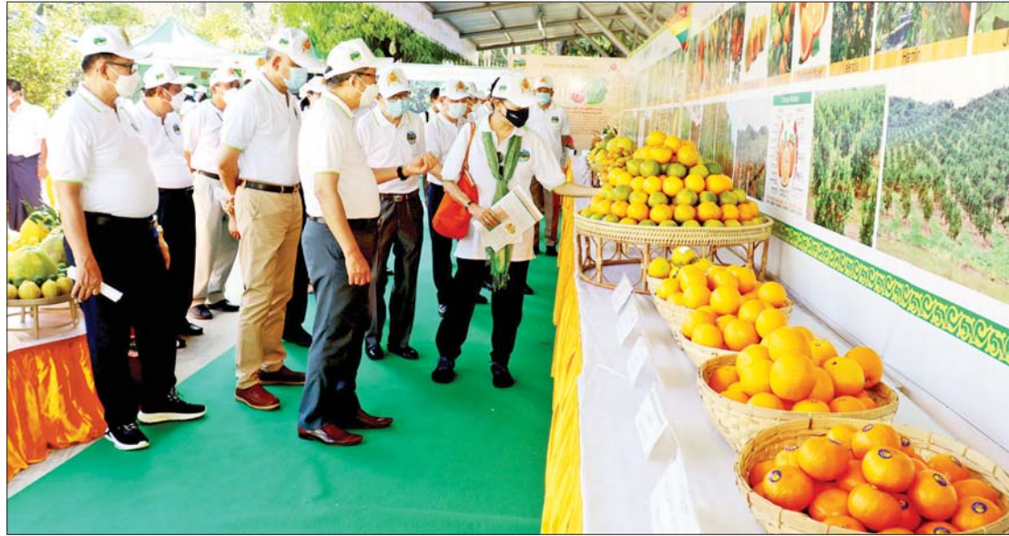
၂၀၂၁ ခုနှစ် နိုဝင်ဘာ ၂၇ ရက်တွင် စိုက်ပျိုးရေး၊ မွေးမြူရေးနှင့် ဆည်မြောင်းဝန်ကြီးဌာနက ကျင်းပသည့် ရှောက်၊ လိမ္မော်၊ သံပရာမျိုးများ ပြပွဲ၊ ပြိုင်ပွဲနှင့် ဆွေးနွေးပွဲ (Citrus Fair, 2021) ဖွင့်ပွဲအခမ်းအနားတွင် ခင်းကျင်းပြသထားသည့် ပြိုင်ပွဲဝင် သစ်သီးများကို တာဝန်ရှိသူများက လှည့်လည်ကြည့်ရှုစဉ်။

ဆွေးနွေးမှာကြားခဲ့သည်။ မွေးမြူရေးကဏ္ဍ ဖွံ့ဖြိုးတိုးတက်ရေး လုပ်ငန်းညှိနှိုင်းအစည်းအဝေးကို နိုဝင် ဘာ ၂၄ ရက်က စိုက်ပျိုးရေး၊ မွေးမြူရေး နှင့် ဆည်မြောင်းဝန်ကြီးဌာနမှ အွန်လိုင်း စနစ်ဖြင့် ကျင်းပရာ လူ့စွမ်းအားအရင်း အမြစ် တိုးပွားရေးအတွက် သင်ကြား လေ့ကျင့်ပေးထုတ်ပေးနိုင်ရန် စိုက်ပျိုး ရေးသိပ္ပံ (နေပြည်တော်) ပျဉ်းမနား၊ ပုသိမ်ကြီးနှင့် ဟံဟိုးတို့တွင် ရှေ့ပြေး ဖွင့်လှစ်မည့် အစီအမံများအား စတင် ဆောင်ရွက်နေပြီး မွေးမြူရေးကဏ္ဍတစ်ခု လုံးကို ဖြည့်မိသော သုတေသနလုပ်ငန်း များဖြစ်စေရေးနှင့် လက်တွေ့အသုံးချ သုတေသနလုပ်ဆောင်ရေး၊ မွေးမြူရေး ကို အခြေခံသော ပုဂ္ဂလိကစီးပွားရေး လုပ်ငန်းများ ဖွံ့ဖြိုးတိုးတက်ရေးတို့ အတွက် လိုအပ်ချက်များ ကူညီပံ့ပိုးပေး ရန် ဆွေးနွေးညှိနှိုင်းခဲ့ကြသည်။ မျိုးစေ့ဆိုင်ရာ အမျိုးသားကော်မတီ (National Seed-Related Committee, NSC)၏ အကြိမ် (၂၀) မြောက် အစည်း အဝေးကို နိုဝင်ဘာ ၂၆ ရက်က စိုက်ပျိုး ရေး၊ မွေးမြူရေးနှင့် ဆည်မြောင်းဝန်ကြီး ဌာန၌ အွန်လိုင်းစနစ်ဖြင့် ကျင်းပရာ သီးနှံကျွမ်းကျင်မှုဆိုင်ရာ လုပ်ငန်းအဖွဲ့ များနှင့် မျိုးစေ့ကျွမ်းကျင်မှုဆိုင်ရာ ကော်မတီတို့က မျိုးစေ့ဥပဒေ၊ လုပ်ထုံး လုပ်နည်းများနှင့်အညီ အဆင့်ဆင့် စိစစ်ပြီး သဘောထားမှတ်ချက်များဖြင့် တင်ပြထားသော စမ်းသပ်စိုက်ပျိုးသီးနှံ မျိုးကွဲမျိုးသစ်များ အသိအမှတ်ပြု လက်မှတ်ထုတ်ပေးနိုင်ရေး ဆွေးနွေး ကြသည်။