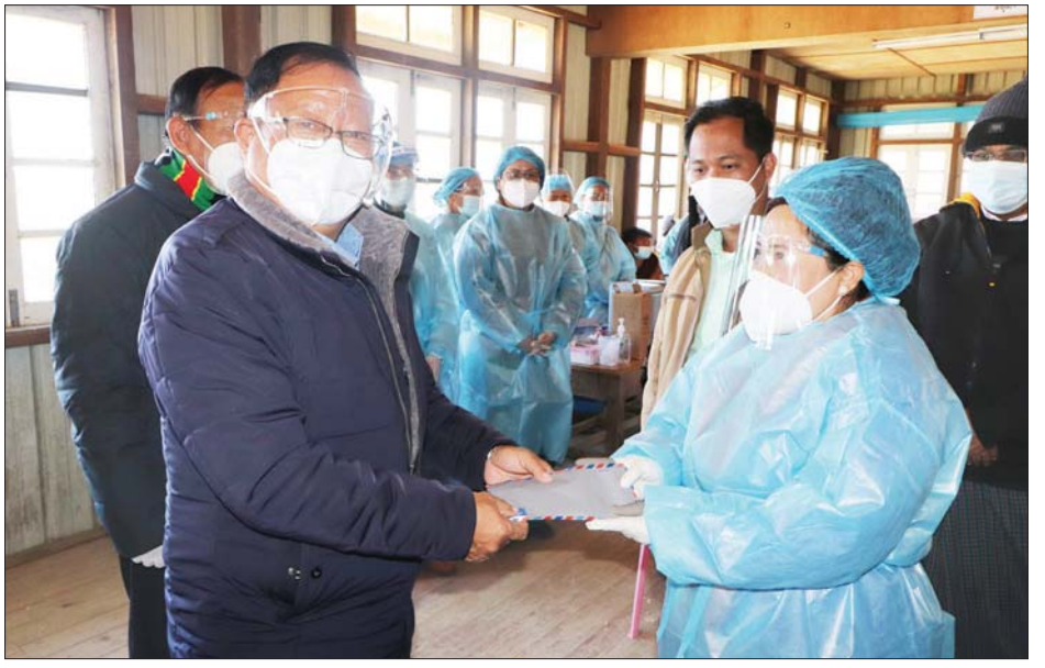
ချင်းပြည်နယ်ဝန်ကြီးချုပ် ဦးဌာနဆန်းအောင် ကျန်းမာရေးဝန်ထမ်းများနှင့် စေတနာ့ဝန်ထမ်းများအတွက် ထောက်ပံ့ငွေပေးအပ်စဉ်။

များ လေလွင့်ပျက်စီးဆုံးရှုံးခြင်းမှ ကာကွယ်နိုင်ရန် အပြင် ဘေးသင့်ပြည်သူများထံ ဖြန့်ခွဲထောက်ပံ့ပေးရာတွင် မိမိတို့ဝန်ထမ်းများ သတ်မှတ်ထားသည့် လုပ်ထုံးလုပ်နည်း၊ စည်းမျဉ်း စည်းကမ်းများနှင့်အညီ နားလည်လိုက်နာဆောင်ရွက်နိုင်ရန် ဖွင့်လှစ်ခြင်းဖြစ်သည့်အတွက် လက်တွေ့လုပ်ငန်းခွင်တွင် များစွာ အထောက်အကူဖြစ်စေမည် ဖြစ်ပါကြောင်း။ သင်တန်းကို Zoom Application အသုံးပြု၍ ဖွင့်လှစ်ပို့ချသွားမည်ဖြစ်ပြီး ယနေ့သင်တန်းတွင် ကနဦးအနေဖြင့် ဦးစီးအရာရှိ ၂၁ ဦးကို လေ့ကျင့်ပို့ချမည်ဖြစ်ပါကြောင်း၊ သင်တန်းတက်ရောက်ရန် ကျန်ရှိနေသည့် ဦးစီးဌာန၊ ရုံးချုပ်အပါအဝင် တိုင်းဒေသကြီး/ပြည်နယ်/ခရိုင်/မြို့နယ်အသီးသီးတွင် တာဝန်ထမ်းဆောင်နေကြသည့် ဦးစီးအရာရှိမှ ဒုတိယဦးစီးမှူးရာထူးအဆင့်ထိ ဝန်ထမ်းစုစုပေါင်း ၂၁၄ ဦးကို သင်တန်းရစ်ကြိမ်ဖြင့် ဖွင့်လှစ်ဆောင်ရွက်သွားမည်ဖြစ်၍ သင်တန်းသား၊ သင်တန်းသူများ အနေဖြင့် သင်တန်းတွင်ဆွေးနွေးမည့် လုပ်ထုံးလုပ်နည်းများ၊ လုပ်ငန်းစဉ်များ၊ နည်းပညာများကို မိမိတို့၏အတွေ့အကြုံနှင့်ပေါင်းစပ်ကာ လုပ်ငန်းခွင်တွင် ပြန်လည်အသုံးပြုရန် တိုက်တွန်းပါကြောင်း ပြောကြားသည်။ အဆိုပါသင်တန်းကို Online စနစ်ဖြင့် ယနေ့မှ ဇန်နဝါရီ ၁၂ ရက်အထိ သင်တန်းကာလ ခုနစ်ရက်ကြာ ဖွင့်လှစ်မည်ဖြစ်ကြောင်း သိရသည်။ သတင်းစဉ်