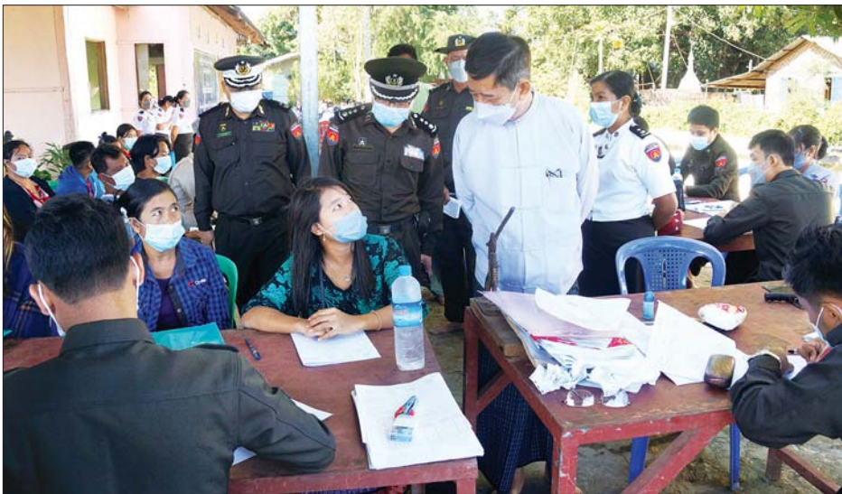
ပြည်သူများ၊ ကျောင်းသား နှုတ်ဆက်ပြီး ပန်းခင်းစီမံချက်ဖြင့် ပြီး(အပေါ်ပုံ) ဆောင်ရွက်ပြီးစီး သော အိမ်ထောင်စု လူဦးရေ ကျောင်းသား ရင်းရင်းနှီးနှီး ဆောင်ရွက်နေမှုများကို ကြည့်ရှု

ပြည်ထောင်စုနယ်မြေနေပြည်တော် ဒက္ခိဏာခရိုင် ဇေယျသီရိမြို့နယ်တွင် ပန်းခင်းစီမံချက်ဖြင့် အိမ်ထောင်စု လူဦးရေစာရင်းနှင့် နိုင်ငံသား စိစစ် ရေးကတ်ပြား ပေးအပ်ပွဲ အခမ်း အနားကို ယနေ့နံနက် ၁၁ နာရီက ဇေယျသီရိမြို့နယ် အောင်ဇေယျ ရပ်ကွက် ကိုးနဝင်းဆုတောင်း ပြည့်ဘုရား အောင်ချမ်းသာ ဓမ္မာရုံ အတွင်း ကျင်းပသည်။