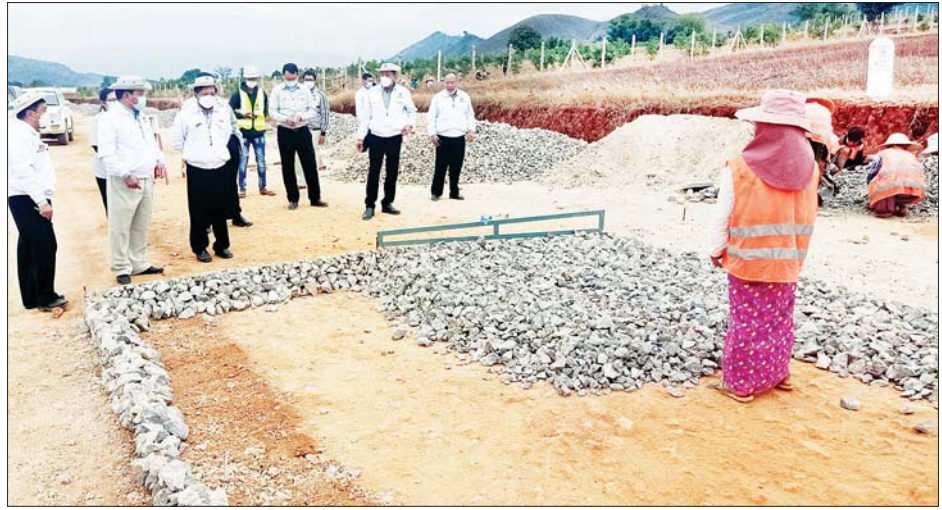
ဒုတိယဝန်ကြီး ဦးမင်းထိန်နှင့်အဖွဲ့ဝင်များ လမ်းအဆင့်မြှင့်တင် ဆောင်ရွက်နေမှုလုပ်ငန်းခွင်ကို ကြည့်ရှုစစ်ဆေးစဉ်။

နေပြည်တော် ဇန်နဝါရီ ၁၃ ဆောက်လုပ်ရေးဝန်ကြီး ဌာန ဒုတိယဝန်ကြီး ဦးမင်းထိန်သည် တာဝန်ရှိသူများနှင့်အတူ ဇန်နဝါရီ ၁၂ ရက် နံနက်ပိုင်းက ရွှေညောင်ထီးရီ(မွေးမြူရေးစု)- လင်ကင်းညိုမီး-လေးမိုင်ကွေ့လမ်း တိုးချဲ့မှုလုပ်ငန်း ဆောင်ရွက်နေမှုကို ကြည့်ရှုစစ်ဆေးပြီး လမ်းဘေး ဝ/ယာ ရေနုတ်မြောင်းများ ပြုလုပ်ဆောင်ရွက်ထားရှိရန်၊ ၁၂ ပေ ဆောက်လုပ်ထားရှိရန်၊ ၁၂ ပေ အကျယ်ကတ္တရာလမ်းချဲ့ခြင်း ဖြစ်သည့်အတွက် ယာဉ်အန္တရာယ်မဖြစ်စေရေး အဆိုပါလမ်းပေါ်ရှိ တံတားများ အဆင့်မြှင့်တင်တည်ဆောက်သွားရန်မှာကြားသည်။ အဆိုပါလမ်းသည် မိတ္ထီလာ-တောင်ကြီး-ကျိုင်းတုံ-တာချီလိတ်လမ်း၊ အေးသာယာ-ညောင်ရွှေလမ်းနှင့် တောင်ကြီး-ကျောက်တလုံး-ကတ္တရာလမ်းတို့ကို ချိတ်ဆက်ထားသောလမ်းဖြစ်ကြောင်း သိရသည်။ ကြည့်ရှုစစ်ဆေးဆက်လက်၍ ဒုတိယဝန်ကြီးသည် အေးသာယာ-ညောင်ရွှေ-မိုင်းသောက် - နမ့်ပန်- တုံဟုံး-ပင်လောင်းလမ်းကို လည်းကောင်း၊ အောင်ပန်း-ပင်မိုင်းလမ်းကို လည်းကောင်း အင်းတိန်လမ်းကို လည်းကောင်း ကြည့်ရှုစစ်ဆေးသည်။ သတင်းစဉ်