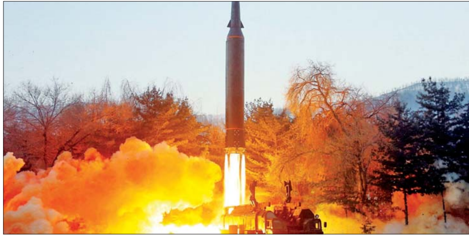
မြောက်ကိုရီးယား ဒုံးကျည်စမ်းသပ်ပစ်လွှတ်နေသည်ကို တွေ့ရစဉ်။