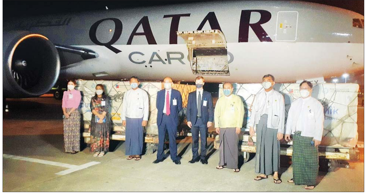
ရုရှားသမ္မတနိုင်ငံက မြန်မာနိုင်ငံသို့ လှူဒါန်းသော Spuntnik Light ကိုဗစ်-၁၉ ကာကွယ်ဆေး လေးသိန်း Doses အား ရန်ကုန်အပြည်ပြည်ဆိုင်ရာ လေဆိပ်၌ တာဝန်ရှိသူများနှင့် တွေ့ရစဉ်။

ချစ်ကြည်ရေး အထိမ်းအမှတ်အဖြစ် လှူဒါန်းသော Spuntnik Light ကိုဗစ်-၁၉ ကာကွယ်ဆေးများသည် မြန်မာနိုင်ငံ၏ ကိုဗစ်-၁၉ ကပ်ရောဂါထိန်းချုပ်ရေးတွင် များစွာအထောက်အကူပြုနိုင်မည်ဖြစ်ပါကြောင်း၊ ယနေ့ကျင်းပပြုလုပ်သည့် အခမ်းအနားသည် သမိုင်းဝင်အခမ်းအနားဖြစ်ပြီး ရုရှားနိုင်ငံနှင့် မြန်မာနိုင်ငံ၏ ချစ်ကြည်ရင်းနှီးမှုကို အနာဂတ်မျိုးဆက်သစ်များအနေဖြင့် သိရှိနိုင်မည်ဖြစ်ပါကြောင်း၊ ဆက်လက်၍ မြန်မာ-ရုရှားနှစ်နိုင်ငံ ချစ်ကြည်ရင်းနှီးစွာဖြင့် ကိုဗစ်-၁၉ ကပ်ရောဂါ တိုက်ဖျက်ရေးလုပ်ငန်းများအား ပူးပေါင်းဆောင်ရွက်သွားမည် ဖြစ်ပါကြောင်း ပြောကြားသည်။ ထို့နောက် ရုရှားသမ္မတနိုင်ငံ