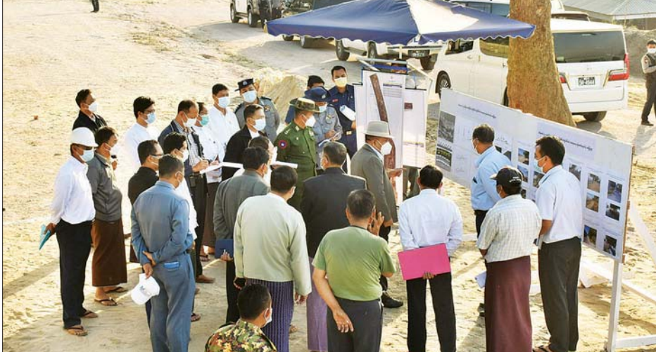
မင်းကွန်းဆိပ်ကမ်းရှိ မရမ်းခြံ မြစ်ကြောင်း ဥပဒေနှင့်အညီ မြစ်ကြောင်းထိခိုက်မှုများ သွားလာမှု အန္တရာယ်ရှိ

မန္တလေး ဇန်နဝါရီ ၁၃ မန္တလေးတိုင်းဒေသကြီး ဝန်ကြီးချုပ် ဦးမောင်ကိုသည် တိုင်းဒေသကြီး ဝန်ကြီးများဖြစ်ကြသည့် ဗိုလ်မှူးကြီး ကျော်ကျော်မင်း၊ မန္တလေးမြို့တော်ဝန် ဦးကျော်ဆန်း၊ ဦးသိန်းဌေး၊ ဦးမျိုးအောင်၊ ရဲမှူးချုပ် စိန်လွင်တို့နှင့်အတူ ရောဂါတိုက်ဖျက်(မရမ်းခြံ) မင်းကွန်းဆိပ်ကမ်းသို့ ယနေ့ညနေပိုင်းက ရောက်ရှိပြီးနောက် မြို့တော်ဝန် ဦးကျော်ဆန်းနှင့် ရေအရင်းအမြစ်နှင့် မြစ်ချောင်းများဖွံ့ဖြိုးတိုးတက်ရေးဦးစီးဌာနမှ ညွှန်ကြားရေးမှူးတို့က ဆိပ်ကမ်းသန့်ရှင်းသာယာလှပရေး လုပ်ငန်းဆောင်ရွက်