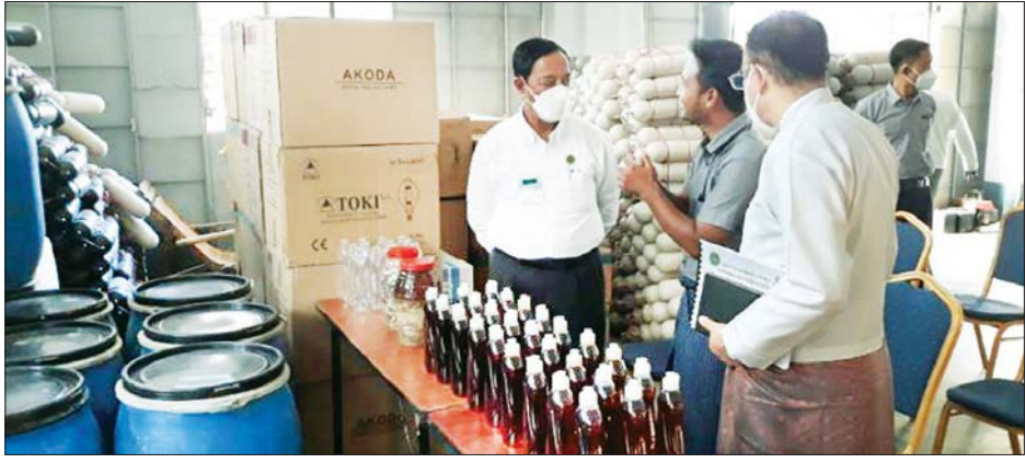
ပြည်ထောင်စုဝန်ကြီး ဦးလှဝင်း ပြောရည်ထုတ်လုပ်ရေးလုပ်ငန်းကို ကြည့်ရှုစစ်ဆေးစဉ်။

အသက်မွေးဝမ်းကျောင်းအထောက်အကူပြုသင်တန်းများ ဖွင့်လှစ်ပို့ချပေးပြီး သင်တန်းအောင်မြင်ပြီးသူများ တစ်နိုင်တစ်ပိုင် စီးပွားရေးလုပ်ငန်းများ ဆောင်ရွက်လိုပါက သမဝါယမအသင်းများဖွဲ့စည်းပေး၍ ငွေကြေးအရင်းအနှီး ထူထောင်ပေးကာ ဈေးကွက်ရရှိအောင် ချိတ်ဆက်ဆောင်ရွက်ပေးရမည်ဖြစ်ကြောင်း၊ ခေတ်မီစက်မှုလယ်ယာစနစ်နှင့် Contract Farming စနစ် အကောင်အထည်ဖော်ဆောင်ရွက်နိုင်ရေးတို့ အတွက် စိုက်ပျိုးရေး၊ မွေးမြူရေးနှင့် ဆည်မြောင်းဝန်ကြီးဌာနနှင့် ပူးပေါင်းဆောင်ရွက်သွားရမည်ဖြစ်ကြောင်း၊ ယခုဘဏ္ဍာရေးနှစ်အတွင်း အကောင်အထည်ဖော်ရမည့် စီမံကိန်းများ၊ ကျေးလက်ကုန်ထုတ်လမ်း၊ ကျေးလက်ရေရရှိရေး၊ ကျေးလက်မီးလင်းရေး