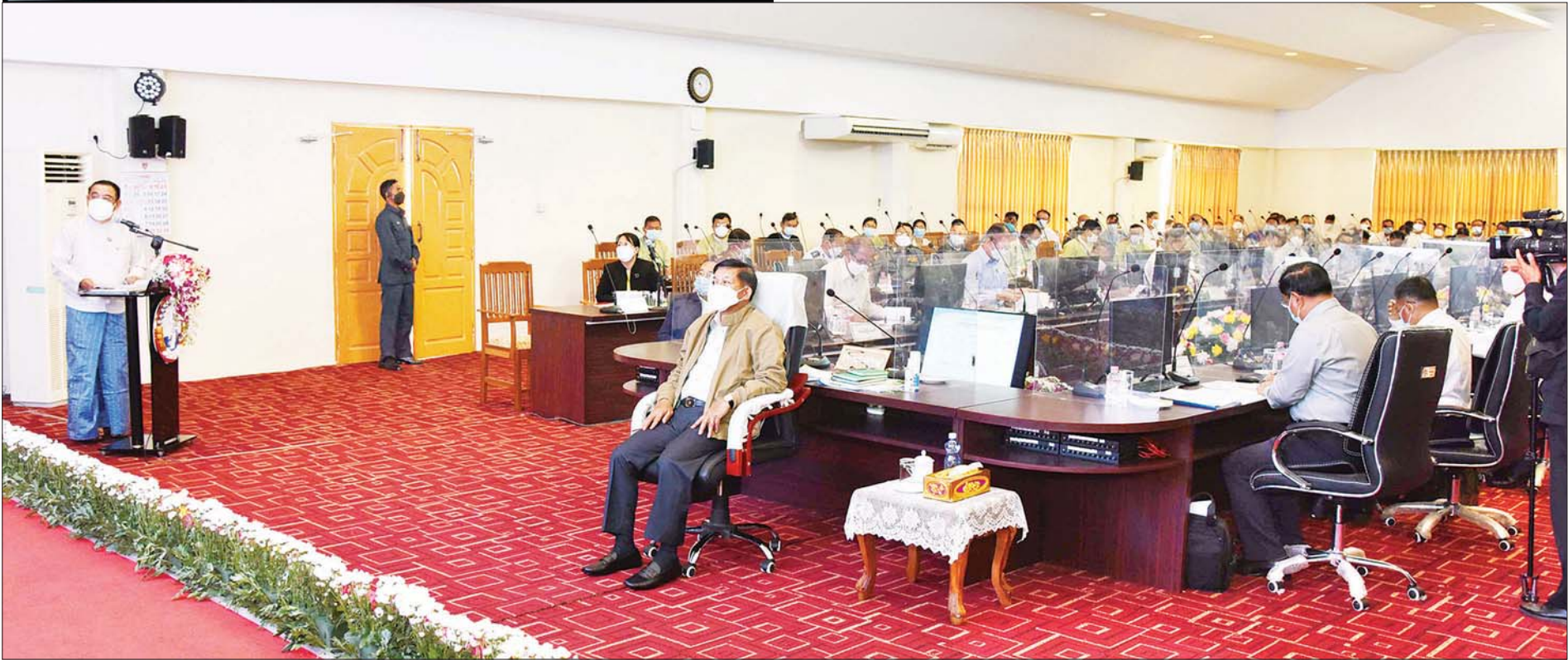
နိုင်ငံတော်စီမံအုပ်ချုပ်ရေးကောင်စီဥက္ကဋ္ဌ၊ နိုင်ငံတော်ဝန်ကြီးချုပ် ဗိုလ်ချုပ်မှူးကြီး မင်းအောင်လှိုင်နှင့် အဖွဲ့ဝင်များအား တနင်္သာရီတိုင်းဒေသကြီး ဝန်ကြီးချုပ် ဦးမြတ်ကိုက ရှင်းလင်းတင်ပြစဉ်။

“တပ်မတော်သည် ပြည်သူ့ကြားမှ ပေါက်ဖွားလာခဲ့ခြင်းပင် ဖြစ်သည့်အတွက် ပြည်သူတို့ လိုလားတောင့်တနေရသည့် ပါတီစုံ ဒီမိုကရေစီလမ်းကြောင်းပေါ်၌ ခိုင်ခိုင်မာမာလျှောက်လှမ်းနိုင်ရေး ဆောင်ရွက်ခဲ့ပြီး ယခင်တပ်မတော်အစိုးရလက်ထက် ဒီမိုကရေစီ မကူးပြောင်းမီကာလများတွင် နိုင်ငံတကာတွင် ကျင့်သုံးလျက်ရှိ သည့် ဒီမိုကရေစီကျင့်သုံးပုံများကိုလေ့လာပြီး ဒီမိုကရေစီပြုပြင် ပြောင်းလဲမှုအဆင့်ဆင့်ကို ပုံဖော်ခဲ့ရ”