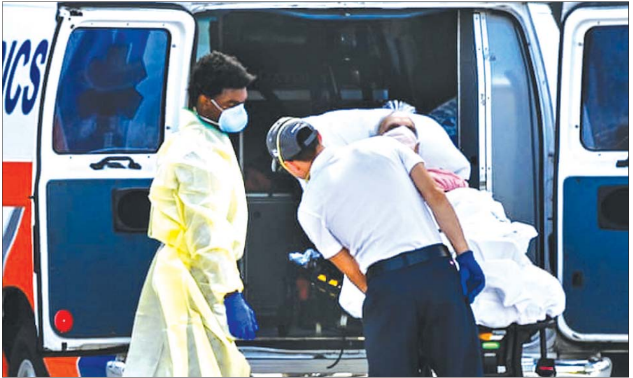
ဖလော်ရီဒါ၌ လူနာတစ်ဦးကို ဆေးရုံသို့ သယ်ဆောင်လာသည့် ကျန်းမာရေးဝန်ထမ်းများကို တွေ့ရစဉ်။

တောမီးကဲ့သို့ လျင်လျင်မြန်မြန် ပျံ့နှံ့လာသည့်အတွက် ဆေးရုံများတွင်လည်း ဝန်ဆောင်မှုအခက်အခဲ ဖြစ်လာရသည်။ အမေရိကန်သူနာပြုအဖွဲ့အစည်းကလည်း သူနာပြုအင်အားပြတ်လပ်နေခြင်းကို