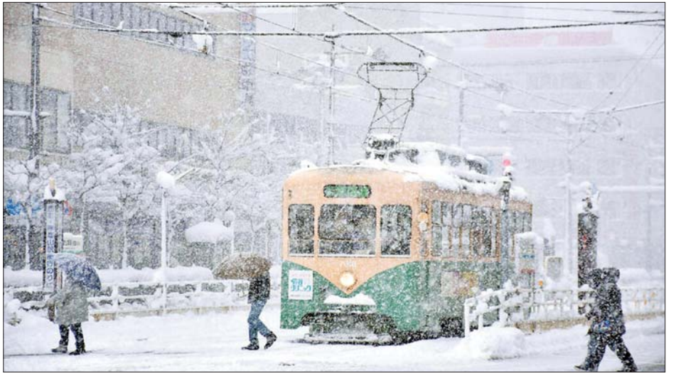
ဂျပန်နိုင်ငံ တိုယာမာမြို့တွင် ဆီးနှင်းများ ထူထပ်စွာကျဆင်းနေသည့်ကြားက ပြည်သူများ ခရီးသွားလာနေသည်ကို တွေ့ရစဉ်။