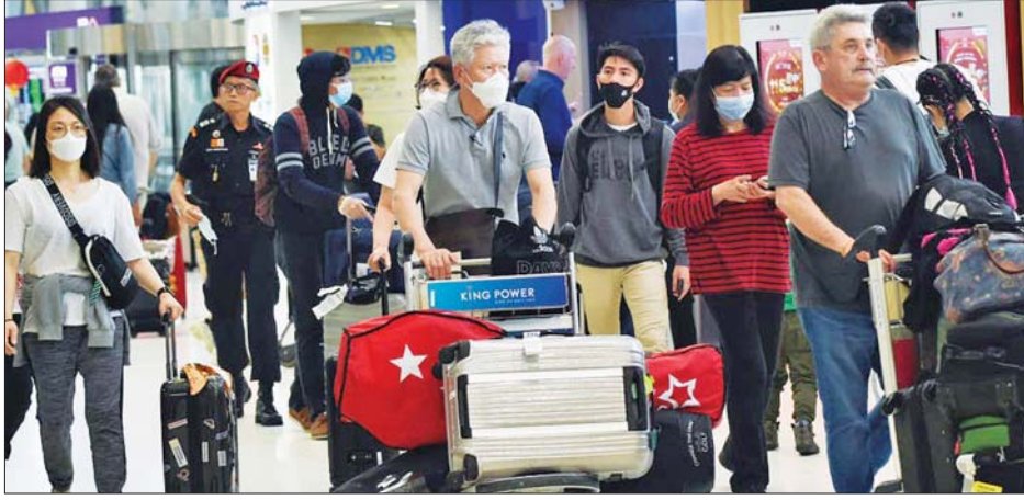
ထိုင်းနိုင်ငံ သုဝဏ္ဏဘူမိလေဆိပ်အတွင်း နိုင်ငံတကာခရီးသွားများကို တွေ့ရစဉ်။

အဆိုပါ ရရှိလာသော ရန်ပုံငွေများကို ခရီးသွားအာမခံနှင့် နိုင်ငံခြားသားဆွဲဆောင်ရာနေရာများကို ပိုမိုတိုးတက်အောင်လုပ်ဆောင်ရာတွင် အသုံးပြုသွားမည်ဖြစ်သည်။ ယခုနှစ်တွင် နိုင်ငံခြားသား ၁၅ သန်းကို ဆွဲဆောင်နိုင်ရန် မျှော်မှန်းထားကြောင်းနှင့် အမေရိကန်ဒေါ်လာ အနည်းဆုံး ၂၄ ဘီလီယံရရှိရန်