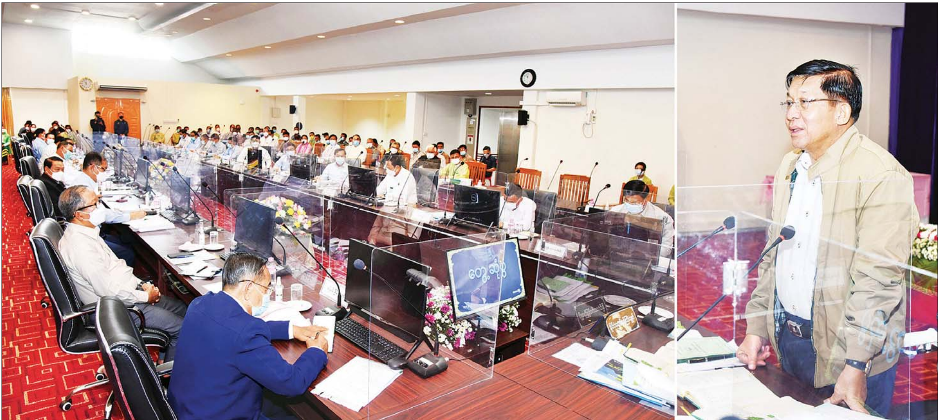
နိုင်ငံတော်စီမံအုပ်ချုပ်ရေးကောင်စီဥက္ကဋ္ဌ၊ နိုင်ငံတော်ဝန်ကြီးချုပ် ဗိုလ်ချုပ်မှူးကြီး မင်းအောင်လှိုင် တနင်္သာရီတိုင်းဒေသကြီးအစိုးရအဖွဲ့ဝင်များနှင့် ခရိုင်၊ မြို့နယ်အဆင့် ဌာနဆိုင်ရာများနှင့် မြို့မိမြို့ဖများအား တွေ့ဆုံအမှာစကားပြောကြားစဉ်။

၄။ တစ်နိုင်ငံလုံး ထာဝရငြိမ်းချမ်းရေးရရှိရေးအတွက် တစ်နိုင်ငံလုံး ပစ်ခတ်တိုက်ခိုက်မှု ရပ်စဲရေးသဘောတူစာချုပ် (NCA) ပါ သဘောတူညီချက်များအတိုင်း ဖြစ်နိုင်သမျှ အလေးထား လုပ်ဆောင်သွားမည်။ ၅။ အရေးပေါ်ကာလဆိုင်ရာ ပြဋ္ဌာန်းချက်များနှင့်အညီ ဆောင်ရွက်ပြီးစီးပါက ဖွဲ့စည်းပုံအခြေခံဥပဒေ (၂၀၀၈ ခုနှစ်) နှင့်အညီ လွတ်လပ်ပြီး တရားမျှတသော ပါတီစုံဒီမိုကရေစီအထွေထွေရွေးကောက်ပွဲအား ပြန်လည်ကျင်းပ၍ အနိုင်ရသည့်ပါတီအား ဒီမိုကရေစီစံနှုန်းများနှင့်အညီ နိုင်ငံတော်တာဝန်အား လွှဲအပ်နိုင်ရေး ဆက်လက်ဆောင်ရွက်သွားမည်။