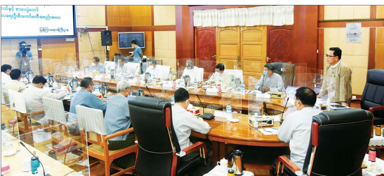
ပြည်ထောင်စုဝန်ကြီး ဦးမောင်မောင်အုန်း စိန်ရတုပြည်ထောင်စုနေ့ အထိမ်းအမှတ် လူငယ်နှင့်စာပေပွဲတော်ကျင်းပရေး လုပ်ငန်းညှိနှိုင်းအစည်းအဝေး၌ အမှာစကား ပြောကြားစဉ်။

နေပြည်တော် ဇန်နဝါရီ ၁၃ စိန်ရတုပြည်ထောင်စုနေ့အထိမ်းအမှတ် လူငယ်နှင့် စာပေပွဲတော်ကျင်းပရေးနှင့် ပတ်သက်သည့် လုပ်ငန်းညှိနှိုင်းအစည်းအဝေးကို ယနေ့ မွန်းလွဲ ၁ နာရီတွင် နေပြည်တော်ရှိ ပြန်ကြားရေးဝန်ကြီးဌာန အစည်းအဝေးခန်းမ၌ ကျင်းပသည်။