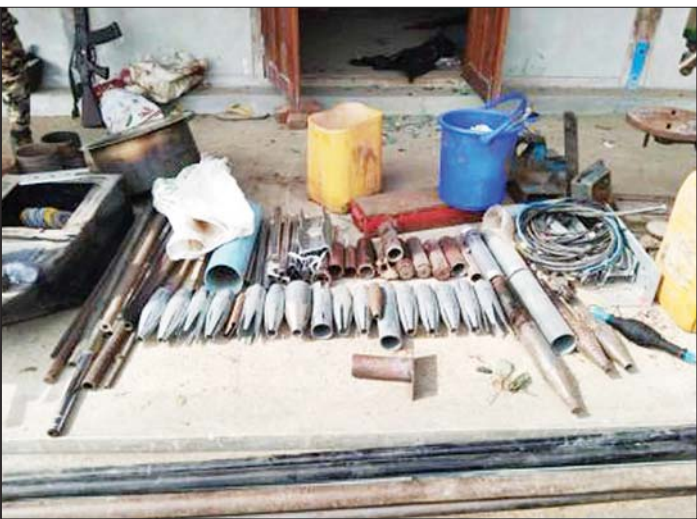
ထီးချိုင့်မြို့နယ် မရသိမ်ကျေးရွာရှိ စာသင်ကျောင်းအတွင်း ဝင်ရောက်စခန်းချ၍ အဖျက်အမှောင့်လုပ်ငန်းများ ဆောင်ရွက်နေသည့် PDF အမည်ခံ အကြမ်းဖက်သမားများအား ဝင်ရောက်ဖမ်းဆီးရာတွင် သိမ်းဆည်းရမိသည့် လက်နက်ပစ္စည်းများကို တွေ့ရစဉ်။