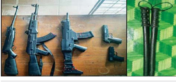
ချမ်းမြသာစည်မြို့နယ် (၁၁၁) လမ်း၊ ၇၄ နှင့် ၇၅ လမ်းကြား က-၇ အနီးအင်းကျေးလမ်းအတွင်း၌ ဖြစ်မှုကျူးလွန်သူများ ရပ်ထားခဲ့သော ESTIMA လိုင်စင်မဲ့ယာဉ်အတွင်းမှ သိမ်းဆည်းရမိသည့် ငွေနှင့် လုံခြုံရေး အသုံးအဆောင်ပစ္စည်းများ။