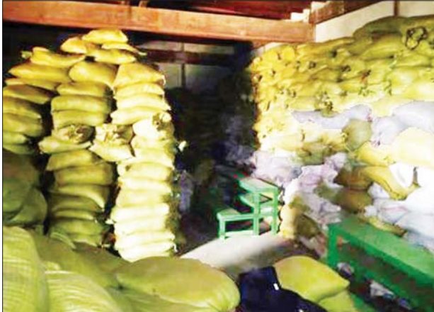
ထီးချိုင့်မြို့နယ် မရသိမ်ကျေးရွာရှိ စာသင်ကျောင်းအတွင်း ဝင်ရောက်စခန်းချ၍ အဖျက်အမှောင်လုပ်ငန်းများ ဆောင်ရွက်နေသည့် PDF အမည်ခံ အကြမ်းဖက်သမားများအား ဝင်ရောက်ဖမ်းဆီးခဲ့မှု မှတ်တမ်း ဓာတ်ပုံများ။