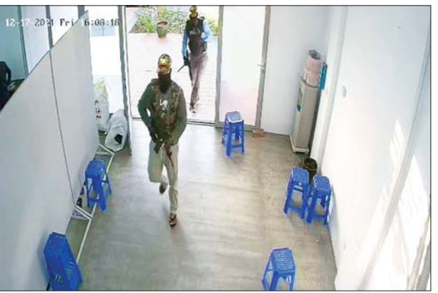
၂၀၂၁ ခုနှစ် ဒီဇင်ဘာ ၁၇ ရက် ညနေပိုင်းတွင် ချမ်းမြသာစည်မြို့နယ်ရှိ ရွှေလွယ်အင်းကုမ္ပဏီ လုယက်ခံရမှု မှတ်တမ်းဓာတ်ပုံ။