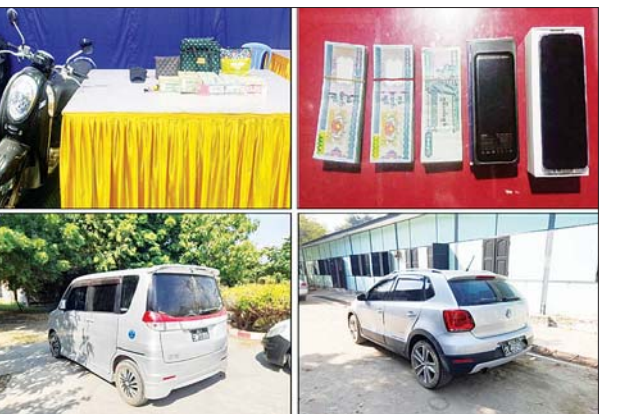
တရားခံ သက်ပိုင်စိုးထံမှ သိမ်းဆည်းရမိသည့် ငွေစက္ကူနှင့် မော်တော် ယာဉ်များ၏ မှတ်တမ်းဓာတ်ပုံ။

သို့ဖြစ်ပါ၍ လုံခြုံရေးတပ်ဖွဲ့ ဝင်များ၏ ပူးပေါင်းချိတ်ဆက် ဖော်ထုတ်မှုနှင့် ဒုစရိုက်မှုကိုမလို လားသည့် တာဝန်သိပြည်သူ များ၏ ဝိုင်းဝန်းပူးပေါင်းကူညီ ဆောင်ရွက်မှုများ ကြောင့် “ရွှေလွယ်အင်း” ကုမ္ပဏီ လုယက် မှုကျူးလွန်ခဲ့သူများကို ကျူးလွန် ရာတွင် အသုံးပြုခဲ့သော သက်သေခံ ပစ္စည်းများ၊ ကျူးလွန်ရာမှ ရရှိ သည့် ငွေကြေးများ၊ ဝယ်ယူထား သည့် ယာဉ်၊ မြေ၊ အခြားပစ္စည်း များနှင့်အတူ ဖော်ထုတ်ဖမ်းဆီး ရမိခဲ့သဖြင့် ပြစ်မှုကျူးလွန်သူများ ကို ဥပဒေနှင့်အညီ ထိရောက် စွာ အရေးယူနိုင်ရေး ဆက်လက် ဆောင်ရွက်လျက် ရှိကြောင်း သိရသည်။ သတင်းစဉ်