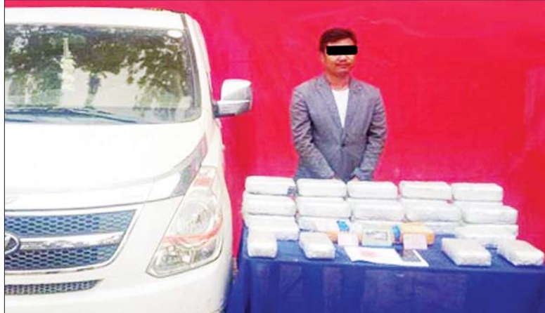
ခင်စောမောင် ကို သိမ်းဆည်း ရမိသည့် စိတ်ကြွ ရှားသွပ် ဆေးပြားများ နှင့်အတူ တွေ့ရစဉ်။