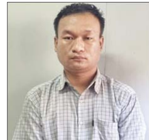
သက်ပိုင်စိုး

အထက်ပါဖြစ်စဉ်မှ လုယက်မှု ကျူးလွန်သူများကို ဖော်ထုတ်ဖမ်းဆီးနိုင်ရေးအတွက် လုံခြုံရေး တပ်ဖွဲ့များက အချိန်နှင့်တစ်ပြေးညီ စုံစမ်းပိတ်ဆို့ ရှာဖွေခြင်းများ ဆောင်ရွက်ခဲ့ရာ ညပိုင်းတွင် ချမ်းမြသာစည်မြို့နယ်၊ (၁၁၁) လမ်း၊ ၇၄ နှင့် ၇၅ လမ်းကြား၊ က-၇၊ အနီးအင်းကျေးလမ်း အတွင်းရှိ ကန္တာရခြံများကြား၌ ဖြစ်မှုကျူးလွန်သူများ ရပ်ထားခဲ့သော MDY/9C-4145 နံပါတ်ပါ