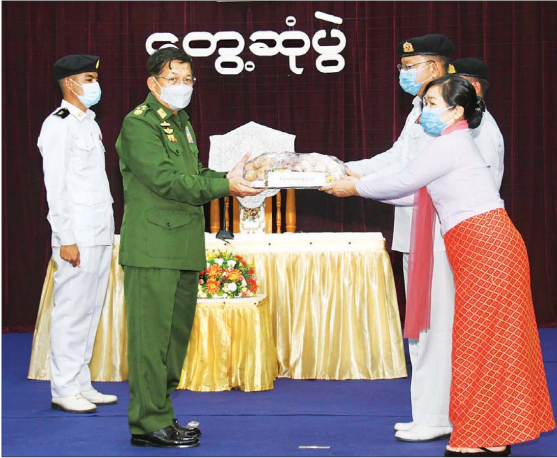
နိုင်ငံတော်စီမံအုပ်ချုပ်ရေးကောင်စီဥက္ကဋ္ဌ၊ တပ်မတော်ကာကွယ်ရေးဦးစီးချုပ် ဗိုလ်ချုပ်မှူးကြီး မင်းအောင်လှိုင်က အရာရှိ၊ စစ်သည်၊ မိသားစုများအတွက် စားသောက်ဖွယ်ရာများပေးအပ်ရာ ရေတပ်စခန်းဌာနချုပ်မှူးနှင့် ဇနီးတို့က လက်ခံရယူစဉ်။

☀ တပ်ပိုင်စိုက်ပျိုးမွေးမြူရေးလုပ်ငန်းများကို အောင်မြင်ဖြစ်ထွန်းအောင် ဆောင်ရွက်ကြရန်လိုသကဲ့သို့ မိမိတို့ တစ်ဦးချင်းအလိုက် တစ်ပိုင်တစ်နိုင် စိုက်ပျိုးမွေးမြူရေးများကို အောင်မြင်ဖြစ်ထွန်းအောင် ဆောင်ရွက်ခြင်းဖြင့် အပိုဝင်ငွေရရှိနိုင် ☀ တပ်နှင့်ပြည်သူ တစ်သားတည်းရှိနေစေရန်အတွက် တပ်ပြင်စည်းရုံးရေးလုပ်ငန်းများအား လက်တွေ့ကျကျဖြင့် ဆောင်ရွက်ကြရန်လို