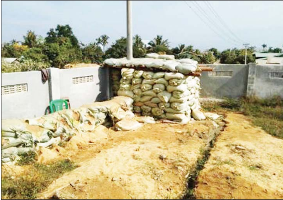
ထီးချိုင့်မြို့နယ် မရသိမ်ကျေးရွာရှိ စာသင်ကျောင်းအတွင်း ဝင်ရောက်စခန်းချ၍ အဖျက်အမှောင်လုပ်ငန်းများ ဆောင်ရွက်နေသည့် PDF အမည်ခံ အကြမ်းဖက်သမားများအား ဝင်ရောက်ဖမ်းဆီးခဲ့မှု မှတ်တမ်းဓာတ်ပုံများ။