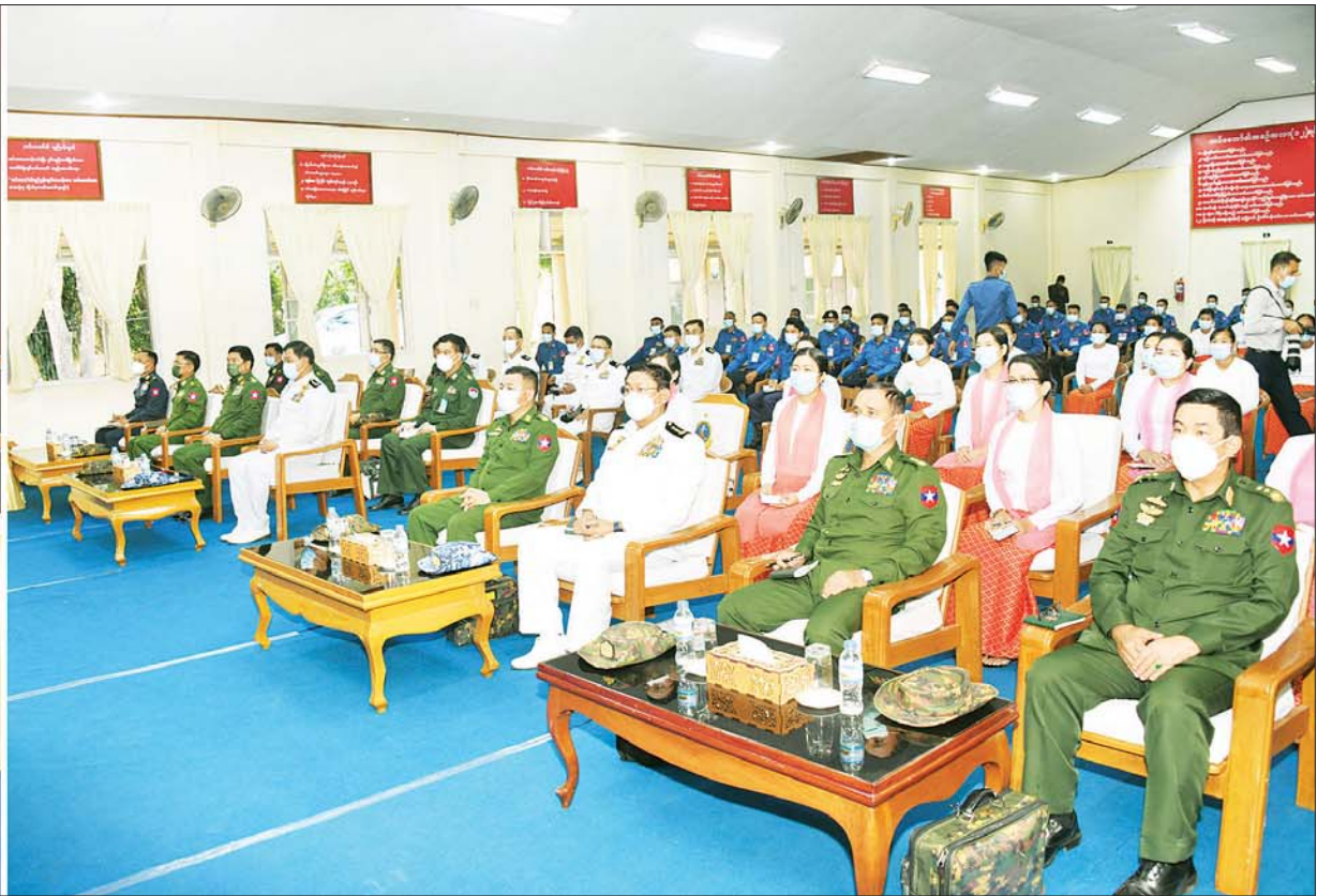
နိုင်ငံတော်စီမံအုပ်ချုပ်ရေးကောင်စီဥက္ကဋ္ဌ၊ တပ်မတော်ကာကွယ်ရေးဦးစီးချုပ် ဗိုလ်ချုပ်မှူးကြီး မင်းအောင်လှိုင် ကမ်းရိုးတန်းဒေသတိုင်းစစ်ဌာနချုပ်၊ မောရဝတီ ရေတပ်စခန်းဌာနချုပ်မှ အရာရှိ၊ စစ်သည်မိသားစုများအား တွေ့ဆုံအမှာစကားပြောကြားစဉ်။