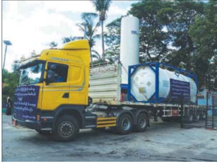
သုံးနေဆဲဖြစ်ပါတယ်။ မြောက်တန်ခွဲ ၂၀ ဆိုတော့ ဒါကို ဖြည့်နေရင်းနဲ့ ကိုဗစ်-၁၉ လူနာတွေကို တောက်လျှောက်

မြဝတီနယ်စပ်မှတစ်ဆင့် ဝယ်ယူတင် သွင်းသည့် အောက်ဆီဂျင်အရည် တန် ၂၀ သယ်ဆောင်လာသည့် မော်တော်ယာဉ် သည် မန္တလေးအထွေထွေရောဂါကု ဆေးရုံကြီးသို့ ယနေ့နံနက်ပိုင်းက ရောက်ရှိသည်။