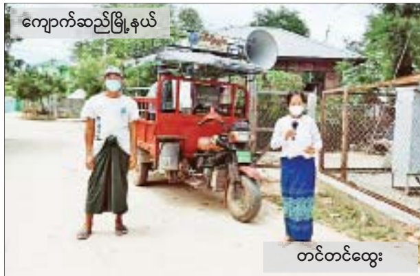
တင်တင်ထွေး