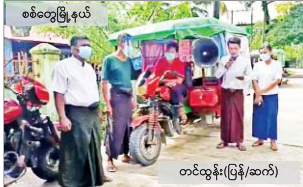
တင်ထွန်း(ပြန်/ဆက်)