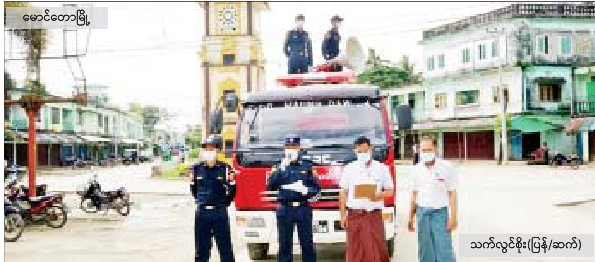
သက်လွင်စိုး(ပြန်/ဆက်)