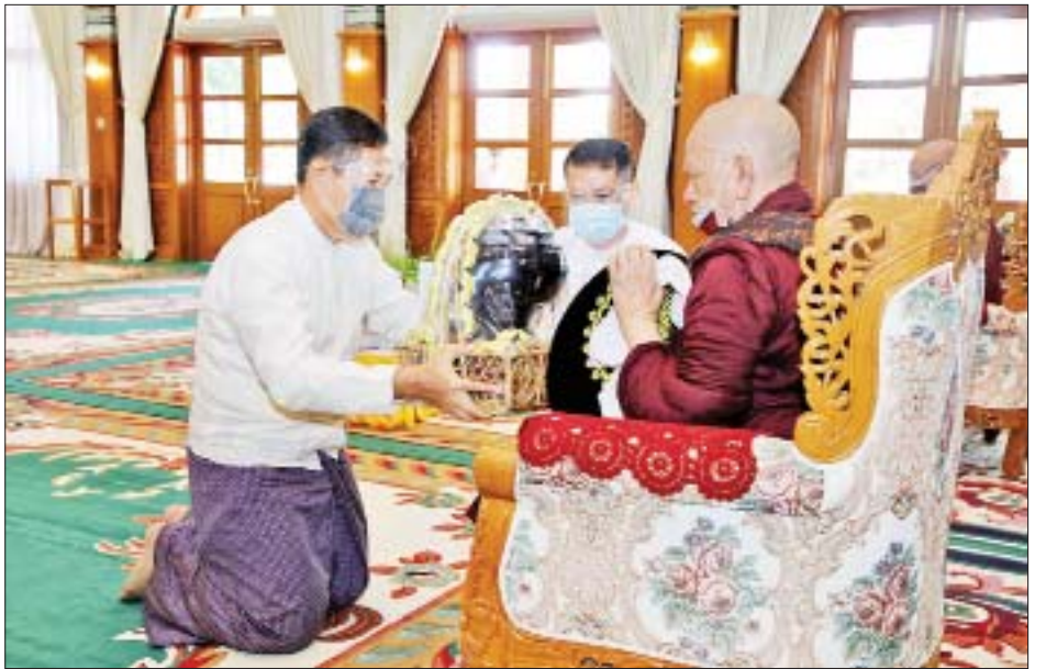
နိုင်ငံတော်စီမံအုပ်ချုပ်ရေးကောင်စီဒုတိယဥက္ကဋ္ဌ၊ ဒုတိယတပ်မတော်ကာကွယ်ရေးဦးစီးချုပ် ကာကွယ်ရေးဦးစီးချုပ်(ကြည်း) ဒုတိယဗိုလ်ချုပ်မှူးကြီးစိုးဝင်း မဟာသီဟနာဒ ဆရာတော်ကြီးထံ လှူဖွယ် ပစ္စည်းများ ဆက်ကပ်စဉ်။