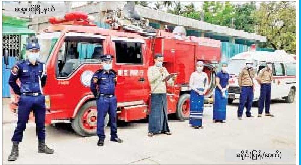
ခရိုင်(ပြန်/ဆက်)

ယင်းသို့ ဆောင်ရွက်ရာတွင် မီးသတ်တပ်ဖွဲ့ဝင်များ၊ ဌာနဆိုင်ရာများမှ တာဝန်ရှိသူများ၊ ရပ်ကွက်အုပ်ချုပ်ရေးမှူးများ၊ လူမှုကူညီရေးအသင်းများမှ စေတနာ့ဝန်ထမ်းများ ပူးပေါင်း၍ ပြည်သူများအတွက် သတိပေးနှိုးဆော်ခဲ့ကြကြောင်း သိရသည်။