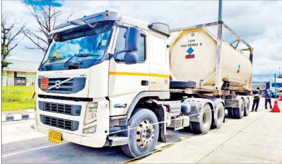
မြဝတီကုန်သွယ်ရေးဇုန်မှ တင်သွင်းလာသည့် အောက်ဆီဂျင်အရည်(Bowser) ယာဉ်ကို တွေ့ရစဉ်။