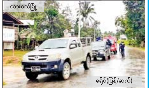
ခရိုင်(ပြန်/ဆက်)