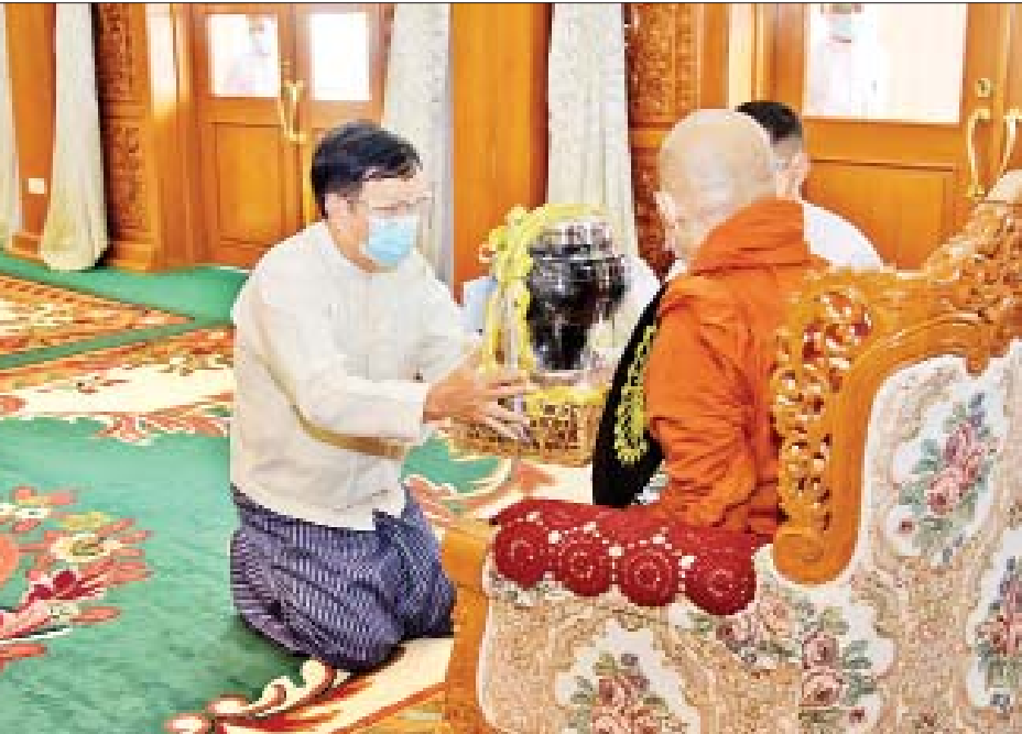
နိုင်ငံတော်စီမံအုပ်ချုပ်ရေးကောင်စီ အတွင်းရေးမှူး ဒုတိယဗိုလ်ချုပ်ကြီး အောင်လင်းဒွေး ဆရာတော်ထံ လှူဖွယ်ပစ္စည်းများ ဆက်ကပ်စဉ်။ (သတင်း-ရှေ့ဖုံး)