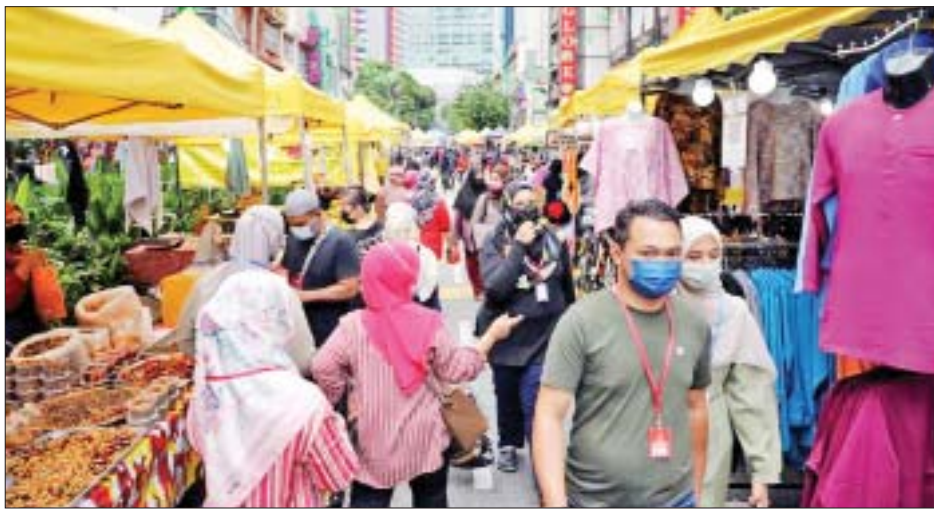
ကူးစက်ခံရသူစုစုပေါင်း ၉၅၁၈၈၄ ဦးအထိ ရှိလာကြောင်း မလေးရှားကျန်းမာရေးဝန်ကြီးဌာနမှ ညွှန်ကြားရေးမှူးချုပ် ဟစ်ရှမ်အဗ္ဗူလကာ ပြောကြားသည်။

ကွာလာလမ်ပူ ဇူလိုင် ၂၁ မလေးရှားနိုင်ငံ၌ ယနေ့တွင် ကိုဗစ်-၁၉ ရောဂါကြောင့် သေဆုံးသူ ၁၉၉ ဦးရှိခြင်းကြောင့် နိုင်ငံတစ်ဝန်းတွင် ကိုဗစ်-၁၉ ရောဂါကြောင့် သေဆုံးသူ စုစုပေါင်း ၇၄၄၀ ရှိလာကြောင်း မလေးရှားကျန်းမာရေးဝန်ကြီးဌာနက ပြောကြားသည်။