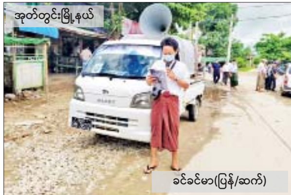
ခင်ခင်မာ(ပြန်/ဆက်)