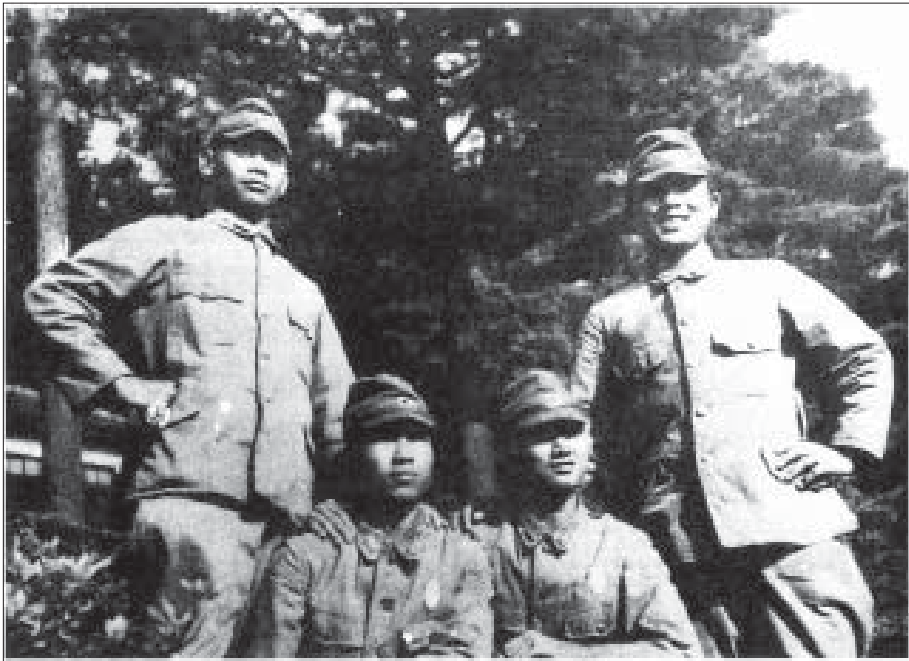
ဂျပန်ပြည် စစ်ပညာသင်ဘဝ