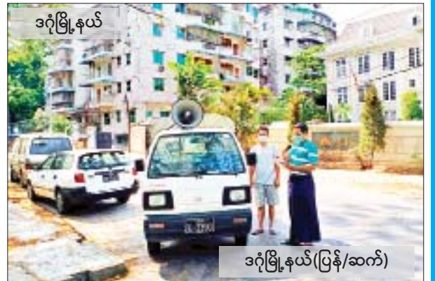
ဒဂုံမြို့နယ်(ပြန်/ဆက်)