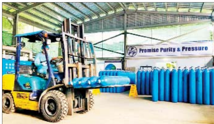
ပြုရန်လိုအပ်သော အောက်ဆီဂျင် အတွက် စက်ရုံအသီးသီးရှိ အောက်ဆီ ဓာတ်ငွေ့များ တိုးမြှင့်ထုတ်လုပ်နိုင်ရေး ဂျင်ဓာတ်ငွေ့ထုတ်လုပ်နိုင်သော စက်များ

နေပြည်တော် ဇူလိုင် ၂၁ ကိုဗစ်-၁၉ ရောဂါ ကာကွယ်၊ ထိန်းချုပ်၊ ကုသရေးလုပ်ငန်းများတွင် အောက်ဆီဂျင် လိုအပ်ချက်များကို အထောက်အကူ ဖြစ်စေရန်အတွက် မြန်မာစီးပွားရေး ကော်ပိုရေးရှင်းစက်ရုံများမှ ထုတ်လုပ် သော အောက်ဆီဂျင်ဓာတ်ငွေ့များအား သက်ဆိုင်ရာ နယ်မြေဒေသအသီးသီးရှိ ဆေးရုံများနှင့် ကိုဗစ်ကုသရေးစင်တာ များသို့ နေ့စဉ် ဖြန့်ဖြူးပေးလျက် ရှိကြောင်း သိရသည်။