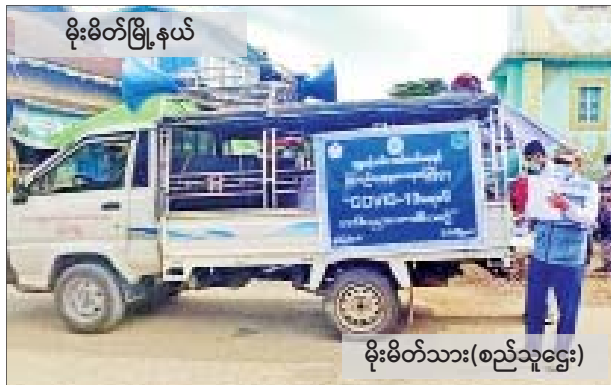
မိုးမိတ်သား(စည်သူဌေး)