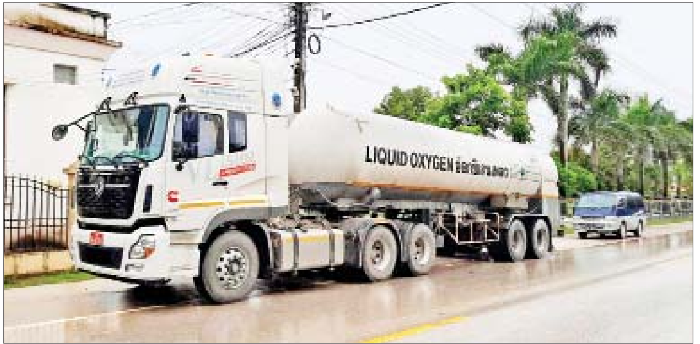
မြဝတီကုန်သွယ်ရေးဇန်မှ တင်သွင်းလာသည့် အောက်ဆီဂျင်အရည်(Bowser) ယာဉ်ကို တွေ့ရစဉ်။