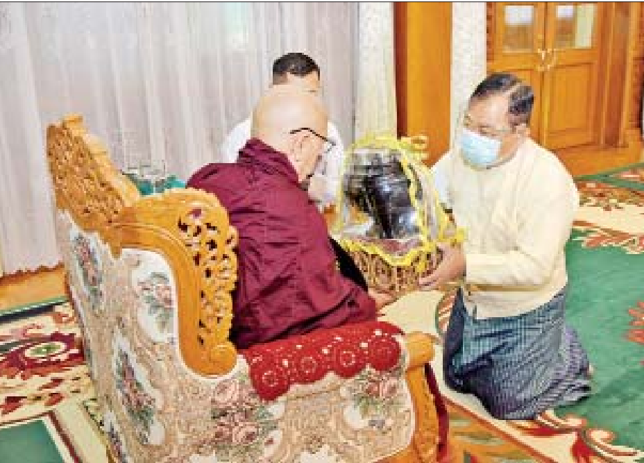
နိုင်ငံတော်စီမံအုပ်ချုပ်ရေးကောင်စီဝင် ဒုတိယဗိုလ်ချုပ်ကြီး စိုးထွဋ် ဆရာတော်ထံ လှူဖွယ်ပစ္စည်း များ ဆက်ကပ်စဉ်။ (သတင်း-ရှေ့ဖုံး)