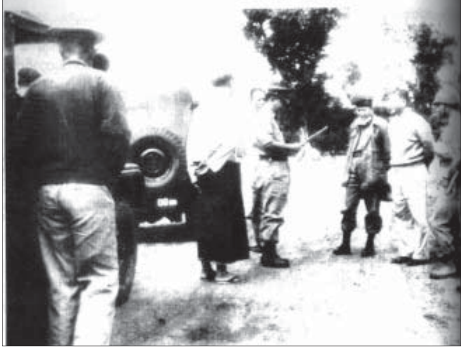
စာရေးဆရာတင့်ဆွေ(ဖျာပုံ) တိုင်းစစ်ဦးစီးချုပ် တာဝန်ထမ်းဆောင်စဉ် ကယားပြည်နယ်တစ်နေရာ သို့ ရောက်ရှိစဉ်က အမှတ်တရဓာတ်ပုံ။