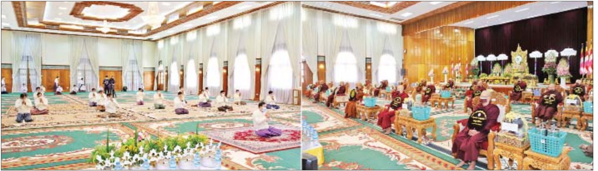
ဥပ္ပါတသန္တိစေတီတော်ဂေါပကအဖွဲ့၊ ဩဝါဒါစရိယ ဆရာတော်၊ နေပြည်တော် လယ်ဝေးမြို့၊ ပေါက်မြိုင်ကျောင်းတိုက် ပဓာနနာယက၊ အဘိဓမ္မဟာရဋ္ဌဂုရု ဘဒ္ဒန္တ ဇနိန္ဒထံမှ နိုင်ငံတော်စီမံအုပ်ချုပ်ရေး ကောင်စီဥက္ကဋ္ဌ တပ်မတော်ကာကွယ်ရေးဦးစီးချုပ် ဗိုလ်ချုပ်မှူးကြီးမင်းအောင်လှိုင်နှင့် အခမ်းအနားတက်ရောက်လာကြသူများက ကိုးပါးသီလ ခံယူဆောက်တည်ကြစဉ်။