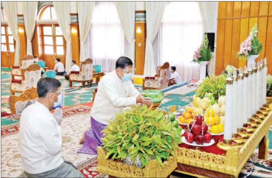
နိုင်ငံတော်စီမံအုပ်ချုပ်ရေးကောင်စီဥက္ကဋ္ဌ တပ်မတော်ကာကွယ်ရေးဦးစီးချုပ် ဗိုလ်ချုပ်မှူးကြီး မင်းအောင်လှိုင် အနော်ရထာခန်းမအတွင်းရှိ ဗုဒ္ဓရုပ်ပွားတော်မြတ်အား မြသပိတ်ဆွမ်းတော်နှင့် ပန်း၊ ရေချမ်း၊ ဆီမီးတို့ကို ဆက်ကပ်လှူဒါန်းစဉ်။