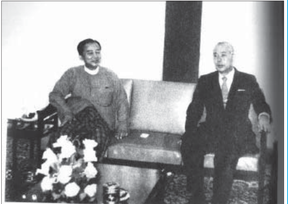
အမှတ်(၁) စက်မှုဝန်ကြီးဌာနတွင် တာဝန်ထမ်းဆောင်စဉ် စာရေးသူနှင့် နိုင်ငံခြားဧည့်သည်တစ်ဦး

စာရေးသူသည် စစ်ပညာတတ်မြောက်မှ လွတ်လပ်ရေးရမည်ဟု ခံယူထားသည့်အတွက် ဂျပန်နိုင်ငံတွင် စစ်ပညာကို ရွပ်ရွပ်ချွံချွံ တတ်မြောက်အောင် သင်ယူကြခဲ့သည်။ ဂျပန်ပြည် စစ်ပညာသင်ဘဝ အတွေ့အကြုံများ၊ ခက်ခဲကြမ်းတမ်းခဲ့ပုံများကို တိုရှင်းထိမိသည့် အရေးအသားဟန်တို့ဖြင့် စာရှုသူတို့မျက်စိတွင် ကွက်ကွက်ကွင်းကွင်း ရှင်းလင်းနားလည်အောင် ရေးသားထားသည်ကို ဤစာအုပ်တွင် တွေ့ရသည်။