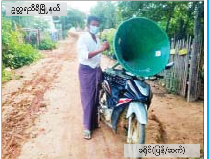
ခရိုင်(ပြန်/ဆက်)