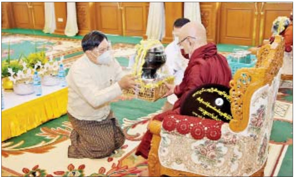
နိုင်ငံတော်စီမံအုပ်ချုပ်ရေးကောင်စီဝင် ဗိုလ်ချုပ်ကြီးတင်အောင်စန်း ဆရာတော်ထံ လှူဖွယ်ပစ္စည်း များ ဆက်ကပ်စဉ်။

★ ရှေးဖုံးမှ ဒုတိယတပ်မတော်ကာကွယ်ရေးဦးစီးချုပ် ကာကွယ် ရေးဦးစီးချုပ်(ကြည်း) ဒုတိယဗိုလ်ချုပ်မှူးကြီးစိုးဝင်း၊ ကောင်စီဝင်များဖြစ်ကြသည့် ဗိုလ်ချုပ်ကြီးမြထွန်းဦး၊ ဗိုလ်ချုပ်ကြီးတင်အောင်စန်း၊ ဒုတိယဗိုလ်ချုပ်ကြီး စိုးထွန်း၊ အတွင်းရေးမှူး ဒုတိယဗိုလ်ချုပ်ကြီး အောင်လင်းဒွေး၊ တွဲဖက်အတွင်းရေးမှူး ဒုတိယ ဗိုလ်ချုပ်ကြီးရဲဝင်းဦး၊ ပြည်ထောင်စုဝန်ကြီးများ၊ ကာကွယ်ရေးဦးစီးချုပ်ရုံးမှ တပ်မတော်အရာရှိကြီး များနှင့် တာဝန်ရှိသူများ တက်ရောက်ကြသည်။ ဦးစွာ နိုင်ငံတော်စီမံအုပ်ချုပ်ရေးကောင်စီဥက္ကဋ္ဌ တပ်မတော်ကာကွယ်ရေးဦးစီးချုပ်က အနော်ရထာ