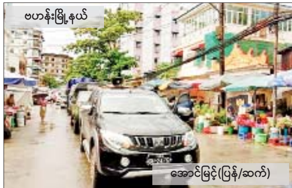
အောင်မြင့်(ပြန်/ဆက်)