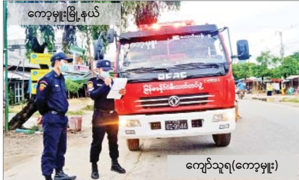
ကျော်သူရ(ကျော့မှူး)