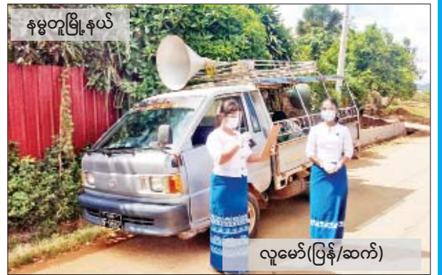
လူမော်(ပြန်/ဆက်)