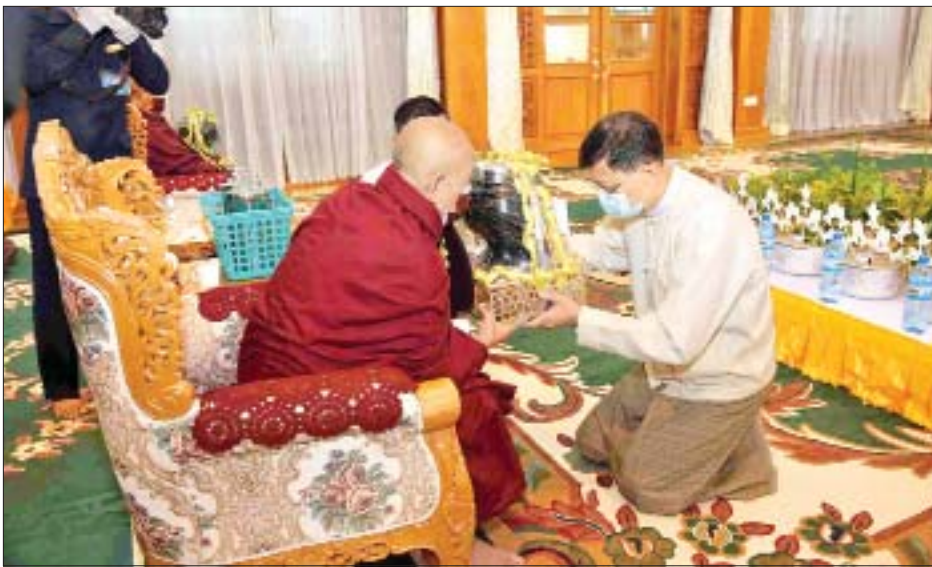
နိုင်ငံတော်စီမံအုပ်ချုပ်ရေးကောင်စီဝင် ဗိုလ်ချုပ်ကြီးမြထွန်းဦး ဆရာတော်ထံ လှူဖွယ်ပစ္စည်းများ ဆက်ကပ်စဉ်။