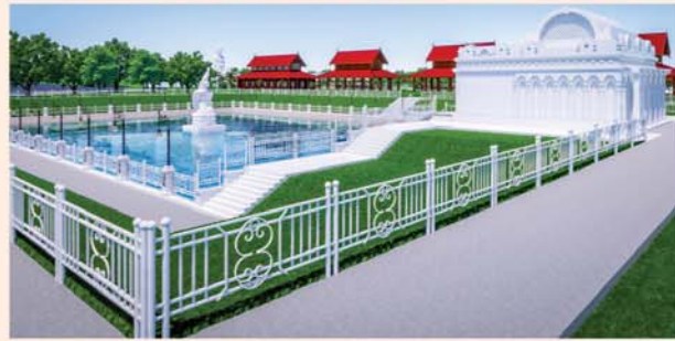
မုစလိန္နအိုင်

၁။ နိုင်ငံတော်စီမံအုပ်ချုပ်ရေးကောင်စီဥက္ကဋ္ဌ၊ တပ်မတော်ကာကွယ်ရေးဦးစီးချုပ် ဗိုလ်ချုပ်မှူးကြီးမင်းအောင်လှိုင် ဦးဆောင်သည့် (၇)ရက်သား၊ သမီး၊ ဘုရားဒါယကာ၊ ဒါယိကာမတို့က မာရဝိဇယပုဒ္ဒရုပ်ပွားတော်မြတ်ကြီးအား မြန်မာနိုင်ငံတွင် ထေရဝါဒဗုဒ္ဓသာသနာတော်ထွန်းလင်းတောက်ပလျက်ရှိသည်ကို ကမ္ဘာကိုပြသရန်၊ တိုင်းပြည်အေးချမ်းသာယာမှုရှိစေရန်၊ ရုပ်ပွားတော်မြတ်ကြီးအား ပြည်တွင်း၊ ပြည်ပဘုရားဖူးများလာရောက်ခြင်းဖြင့် ဒေသတိုးတက်စည်ကားမှုကို အထောက်အကူဖြစ်စေရန်၊ နိုင်ငံတော်ဖွံ့ဖြိုးတိုးတက်မှုအား အထောက်အကူ ဖြစ်စေရန်ရည်သန်လျက် ပြည်ထောင်စုနယ်မြေ နေပြည်တော်၊ ဒက္ခိဏသီရိမြို့နယ်အတွင်း၌ သာသနာတော်ထုံး၊ ရုပ်ပွားဆင်းတုတော်ထုံး၊ မြန်မာ့ရိုးရာတည်ထုံးများနှင့်အညီ တည်ဆောက် ပူဇော်လျက်ရှိပါသည်။