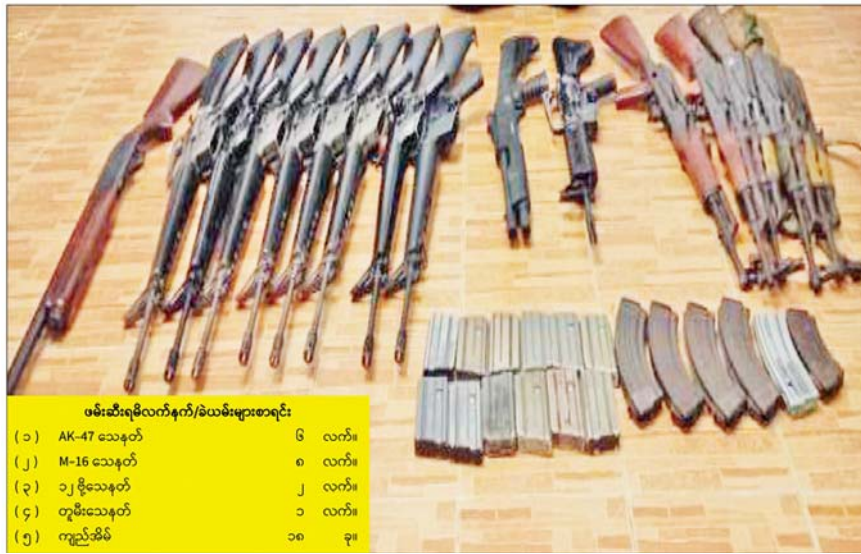
ဖမ်းဆီးရရှိလက်နက်/ခဲယမ်းများစာရင်း (၁) AK-47 သေနတ် ၆ လက်၊ (၂) M-16 သေနတ် ၈ လက်၊ (၃) ၁၂ ဗို့သေနတ် ၂ လက်၊ (၄) တူးမီးသေနတ် ၁ လက်၊ (၅) ကျည်အိမ် ၁၈ ခု။