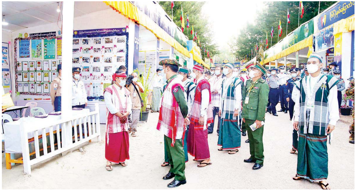
ကြားပြီး ပြည်နယ်တရားလွှတ်တော် ဆောင်မှု ထူးချွန်ဆု၊ မွေးမြူရေးထူးချွန်ဆု၊ ဟင်းသီးဟင်းရွက်နှင့် သစ်သီးဝလံ တရားသူကြီးချုပ်၊ ပြည်နယ်ဝန်ကြီးများ၊ စိုက်ပျိုးရေးထူးချွန်ဆု၊ တက္ကသိုလ် ထူးချွန်ဆု အစရှိသည့် ထူးချွန်ဆု စုစု ပြည်နယ်ဥပဒေချုပ်နှင့် ပြည်နယ်အစိုးရ ကောလိပ်များမှ အားကစားထူးချွန်ဆု၊ ပေါင်းဆု ၆၀ ကိုချီးမြှင့်ပေးအပ်ခဲ့ကြောင်း သိရသည်။ စောမျိုးမင်းသိန်း(ပြန်/ဆက်)

အထိမ်းအမှတ် မုခ်ဦးနှင့်ပြခန်းများကို စက်ခလုတ်နှိပ်ဖွင့်လှစ်ပေးကာ တာဝန်ရှိသူများနှင့်အတူ ပြခန်းများကို လှည့်လည်ကြည့်ရှုအားပေးခဲ့ကြသည်။ ယင်းနောက် သီရိကင်းရီစင်မြင့်တွင် ကရင်ရိုးရာခုံအကများဖြင့် ဖျော်ဖြေတင်ဆက်ကပြကြရာ ခေတ္တဝန်ကြီးချုပ်၊ ပြည်နယ်တရားလွှတ်တော် တရားသူကြီးချုပ်၊ ပြည်နယ်ဝန်ကြီးများ၊ တိုင်းရင်းသားလက်နက်ကိုင်ငြိမ်းချမ်းရေးအဖွဲ့အစည်းများမှ ကိုယ်စားလှယ်များ၊ တိုင်းရင်းသားပြည်သူများက ကြည့်ရှုအားပေးခဲ့ကြသည်။ ဆက်လက်၍ (၆၆)နှစ်မြောက် ကရင်ပြည်နယ်နေ့အထိမ်းအမှတ် ပြည်နယ်ဂုဏ်ဆောင်ထူးချွန်သူများအား ဂုဏ်ပြုဆုများချီးမြှင့်ပေးအပ်သည့်အခမ်းအနားကို နံနက် ၁၀ နာရီတွင် ဘားအံမြို့ ဇွဲကပင်ခန်းမ၌ ကျင်းပရာ ခေတ္တပြည်နယ်ဝန်ကြီးချုပ်က အဖွင့်အမှာစကား ပြော