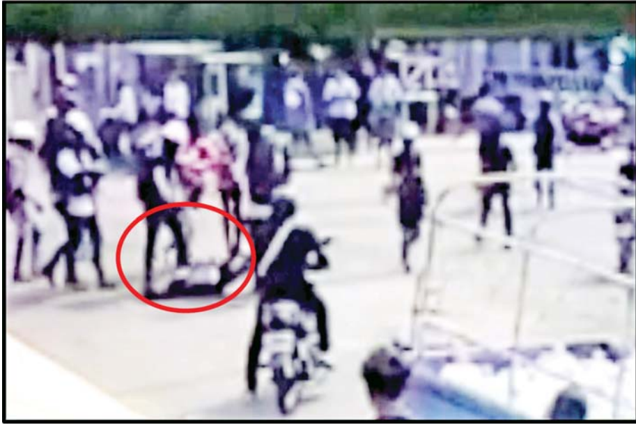
မတ်လ ၂၉ ရက် မန္တလေးမြို့တွင် မူးယစ်ဆေးစွဲလူငယ်များ ရဲအရာရှိတစ်ဦးအား သတ်ဖြတ်နေပုံ။

အဲဒီဆောင်းပါးမှာ ဖော်ပြချက်တွေအပြင် မြေပြင်မှာ အမှန်တကယ်ဖြစ်ခဲ့တဲ့ ဖြစ်စဉ်တွေအရ ဆန္ဒပြပွဲတွေ အရှိန်မြှင့်ခဲ့တဲ့ ဖေဖော်ဝါရီလနဲ့ မတ်လ ငြိမ်းချမ်းစွာဆန္ဒပြမှုတွေမှာ ဆန္ဒပြပွဲတွေကို ဦးဆောင် စီစဉ်ခဲ့သူတချို့က တူညီဝတ်စုံများ၊ တူညီ