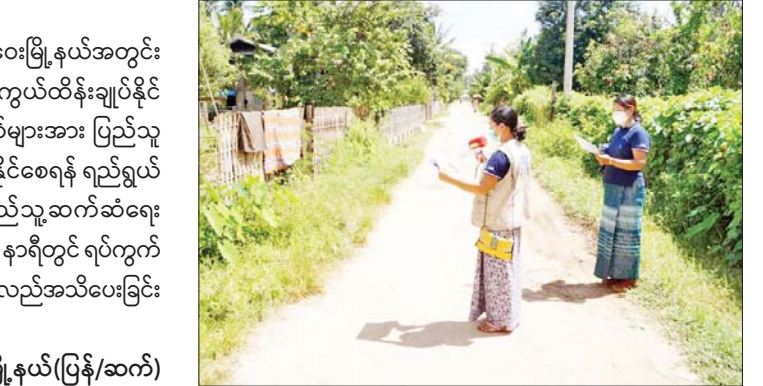
မြို့နယ်(ပြန်/ဆက်)

လယ်ဝေး နိုဝင်ဘာ ၇ ပြည်ထောင်စုနယ်မြေ ဒက္ခိဏခရိုင် လယ်ဝေးမြို့နယ်အတွင်း ကိုဗစ်-၁၉ ရောဂါစနစ်တကျ ကြိုတင်ကာကွယ်ထိန်းချုပ်နိုင် ရေးအတွက် လိုက်နာရမည့်အချက်အလက်များအား ပြည်သူ များသိရှိပြီး ပူးပေါင်းပါဝင်ဆောင်ရွက်လာနိုင်စေရန် ရည်ရွယ် ချ၍ လယ်ဝေးမြို့နယ် ပြန်ကြားရေးနှင့်ပြည်သူ့ဆက်ဆံရေး ဦးစီးဌာနမှ ဝန်ထမ်းများက ယနေ့နံနက် ၁၀ နာရီတွင် ရပ်ကွက် နှင့် ကျေးရွာများတွင် အသံချဲ့စက်ဖြင့် လှည့်လည်အသိပေးခြင်း လုပ်ငန်းများဆောင်ရွက်ခဲ့ကြသည်။