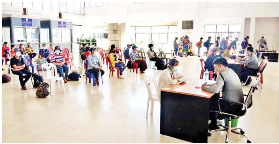
ပေးခဲ့ကြောင်းနှင့် ရောဂါပိုးတွေ့ရှိသူများကို သက်ဆိုင်ရာနေရာများ၌ သီးသန့်ထားရှိ၍ လိုအပ် သည့် ကျန်းမာရေးဆိုင်ရာများနှင့် အုပ်ချုပ်မှုဆိုင်ရာ

ထို့နောက် မြို့နယ်စီမံအုပ်ချုပ်ရေးအဖွဲ့များက စီစဉ်ဆောင်ရွက်ပေးသည့် ခရီးသည်တင်ယာဉ်များ ဖြင့် ၎င်းတို့နေရပ်အသီးသီးသို့ လိုက်လံပို့ဆောင်