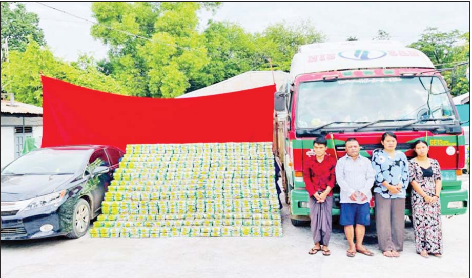
ရွာငံမြို့နယ်၌ ငွေကျပ် ၁၂ ဒသမ ၉ ဘီလီယံတန်ဖိုးရှိ အိုက်စ ၈၆၀ ကီလိုနှင့်အတူ တရားခံလေးဦး ဖမ်းဆီးရမိမှု။