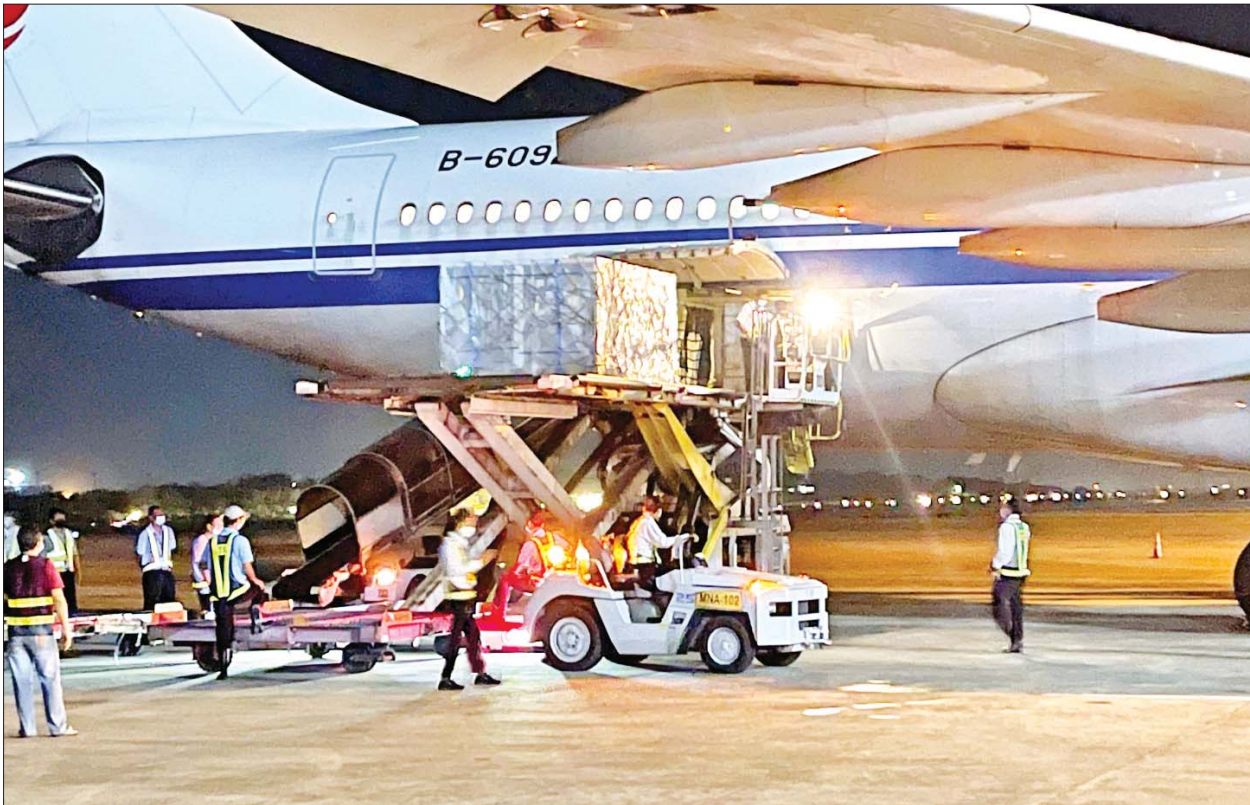
တရုတ်ပြည်သူ့သမ္မတနိုင်ငံမှ ဝယ်ယူသည့် Sinopharm အမှတ်တံဆိပ် ကိုဗစ်-၁၉ ရောဂါ ကာကွယ်ဆေး လေးသန်း doses (ဆဋ္ဌမအသုတ်) ရန်ကုန်အပြည်ပြည်ဆိုင်ရာ လေဆိပ်သို့ ရောက်ရှိစဉ်။

နိုင်ငံဘာ ၆ ရက်အထိ လူဦးရေစုစုပေါင်း ၁၃ ဒသမ ၉ သန်းအား ထိုးနှံပေးပြီးဖြစ်၍ ကာကွယ်ဆေးနှစ်ကြိမ် အပြည့်ထိုးနှံပြီးစီးသူ ၈ ဒသမ ၂၄ သန်းနှင့် ပထမအကြိမ်ထိုးနှံပြီးစီးသူ ၅ ဒသမ ၆၅ သန်း ရှိပြီဖြစ်