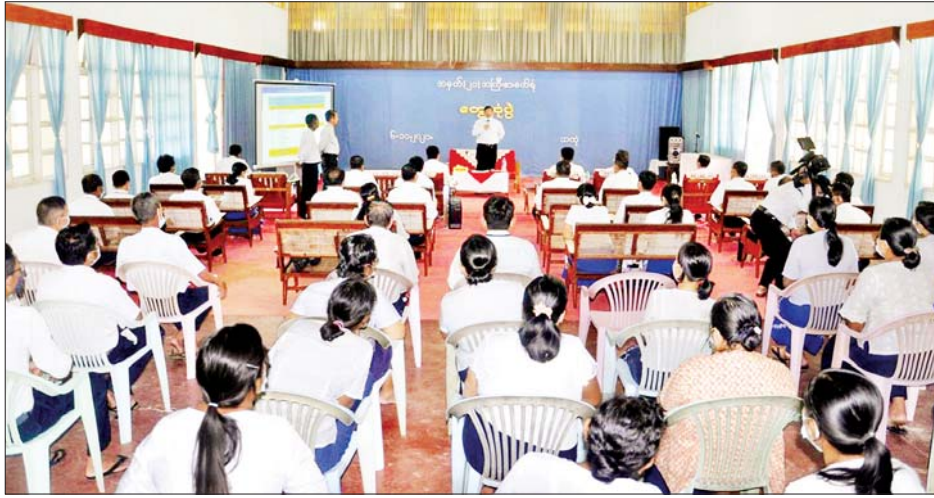
ပြည်ထောင်စုဝန်ကြီး ဒေါက်တာချာလီသန်း အမှတ်(၂၁) အကြီးစားစက်ရုံရှိ ဝန်ထမ်းများနှင့်တွေ့ဆုံစဉ်။

နေပြည်တော် နိုဝင်ဘာ ၇ စက်မှုဝန်ကြီးဌာန ပြည်ထောင်စုဝန်ကြီး ဒေါက်တာ ချာလီသန်းသည် ယမန်နေ့ နံနက်ပိုင်းတွင် မွန်ပြည်နယ် သထုံမြို့နယ် အင်းရှည်ကျေးရွာအနီးရှိ သထုံစက်မှု နယ်မြေနှင့် အမှတ်(၂၁) အကြီးစားစက်ရုံသို့ ရောက်ရှိပြီး စက်မှုနယ်မြေ (သထုံ) ကို ရော်ဘာအခြေခံ တန်ဖိုးမြှင့် ထုတ်ကုန်ပစ္စည်းများ ထုတ်လုပ်နိုင်သည့် စက်မှုလုပ်ငန်းများ ဖွံ့ဖြိုးတိုးတက်အောင်ဆောင်ရွက် မည့် စက်မှုလုပ်ငန်းများ ထူထောင်နိုင်ရေး စီမံ ဆောင်ရွက်ရန်ရှိပြီး အခြေခံအဆောက်အအုံများနှင့် မြေနေရာများကို အကျိုးရှိစွာ အသုံးပြုနိုင်ရေး အတွက် ပြည်တွင်း၊ ပြည်ပမှ ရင်းနှီးမြှုပ်နှံမည့် လုပ်ငန်းရှင်များကို ဖိတ်ခေါ်ရန်၊ အမှတ်(၂၁)အကြီးစား စက်ရုံအနေဖြင့် စက်ရုံရှိ နည်းပညာနှင့် အရင်းအမြစ် များကို အကျိုးရှိအောင် အသုံးပြုနိုင်ရေး စီမံဆောင်ရွက် ရန်၊ လုပ်ငန်းတာဝန်များကို Business Plan ရေးဆွဲ ဆောင်ရွက်ရန် မှာကြားကာ စက်မှုနယ်မြေအတွင်း လှည့်လည်ကြည့်ရှုစစ်ဆေးသည်။