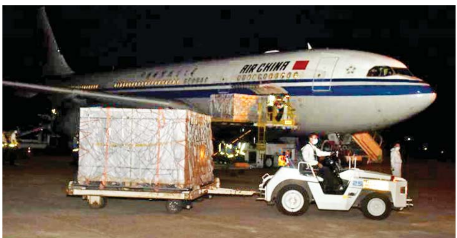
တရုတ်ပြည်သူ့သမ္မတနိုင်ငံမှ ဝယ်ယူသည့် Sinopharm အမှတ်တံဆိပ် ကိုဗစ်-၁၉ ရောဂါ ကာကွယ်ဆေး လေးသန်း doses (ဆဋ္ဌမအသုတ်) ရန်ကုန်အပြည်ပြည်ဆိုင်ရာလေဆိပ်သို့ ရောက်ရှိစဉ်။

ဖွင့်လှစ်ထားရှိ မြန်မာနိုင်ငံတွင် စိုက်ပျိုးရေးတက္ကသိုလ်တစ်ခု၊ မွေးမြူရေးဆိုင်ရာ ဆေးတက္ကသိုလ် တစ်ခုရှိပြီး စိုက်ပျိုးရေးသိပ္ပံကျောင်း ၁၅ ကျောင်းကို တိုင်းဒေသ ကြီး/ ပြည်နယ်အသီးသီးတွင် ဖွင့်လှစ်ထားရှိသည်။ ယခုအခါ မွေးမြူရေးကဏ္ဍတွင် လိုအပ်လျက်ရှိနေ သည့် အသက်မွေးဝမ်းကျောင်းလုပ်ငန်း ကျွမ်းကျင်သူ များသင်ကြားလေ့ကျင့် မွေးထုတ်ပေးနိုင်ရေးအတွက် စိုက်ပျိုးရေးသိပ္ပံကျောင်းများတွင် ယခုနှစ် ကျောင်းဖွင့် ရာသီမှစတင်၍ မွေးမြူရေးဒီပလိုမာသင်တန်းများ တိုးချဲ့ဖွင့်လှစ်ရေး ဆောင်ရွက်လျက်ရှိပြီး စက်မှု လယ်ယာ ဒီပလိုမာသင်တန်းများ တိုးချဲ့ဖွင့်လှစ်ရေး ကိုလည်း မျှော်မှန်းဆောင်ရွက်လျက်ရှိနေကြောင်း၊ လက်တွေ့အသုံးပြုပညာရပ်များကို အသက်မွေးဝမ်း ကျောင်းပညာရပ်များအဖြစ် အသုံးပြုလုပ်ကိုင်နိုင် ကြခြင်းဖြင့် လူငယ်များအတွက် အစိုးရဌာနများနှင့် ပုဂ္ဂလိကလုပ်ငန်းများတွင် အလုပ်အကိုင် အခွင့် အလမ်းရရှိရေးသာမက စိုက်ပျိုးမွေးမြူရေးလုပ်ငန်း များတွင် ကိုယ်တိုင်လုပ်ကိုင်ကြမည့် လယ်ယာစီးပွား လုပ်ငန်းရှင်များ ပေါ်ထွက်လာခြင်းကြောင့် လယ်ယာ ကဏ္ဍဖွံ့ဖြိုးတိုးတက်မှု အရှိန်အဟုန် ကောင်းမွန်လာ စေရန် ရည်ရွယ်ဆောင်ရွက်နေခြင်းဖြစ်ကြောင်း သိရသည်။