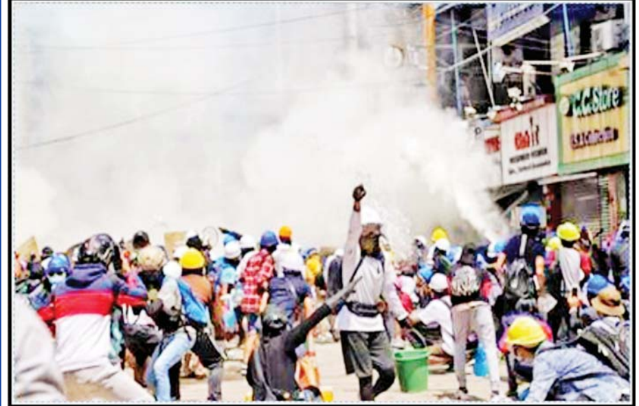
မူးယစ်ဆေးဝါးသုံးစွဲထားသည့် ဆူပူဆန္ဒပြလူငယ်များ၏ လှုပ်ရှားမှုများ။

နောက်ကွယ်က အမှန်တကယ်ရည်ရွယ်ချက်ကတော့ သာမန်ထက်လွန်ကဲတဲ့ စိတ်ဓာတ် တက်ကြွမှုတွေဖြစ်ပြီး ယခင်ကမလုပ်ရဲတဲ့အလုပ်တွေကို လုပ်ရဲလာအောင်၊ အကြမ်းဖက် မှုတွေကို မကြောက်မရွံ့ဆောင်ရွက်နိုင်လာအောင် နောက်ကွယ်က ပံ့ပိုးပေးသူတွေက ရည်ရွယ်ခဲ့ကြတာ ဖြစ်ပါတယ်။ ဘယ်လိုပဲပြောပြော မြန်မာနိုင်ငံက ဆန္ဒပြမှုတွေကတော့ နောက်ကွယ်ကလူတွေ ဖြစ်စေချင်တဲ့အတိုင်း မူးယစ်ဆေးဝါးသုံးစွဲတဲ့လူငယ်များရဲ့ လှုပ်ရှားမှုများကြောင့် အကြမ်းဖက်မှုတွေဆီ ဦးတည်သွားခဲ့ပါတယ်။