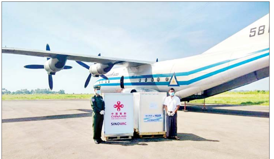
ကြောင်း သိရသည်။ အဆိုပါ ပေးပို့ဖြန့်ဖြူးပေးသော ကိုဗစ်-၁၉ ရောဂါ ကာကွယ်ဆေးများကို ဦးတည်အုပ်စုလူဦးရေ ဦးစားပေးအစီအစဉ်များနှင့်အညီ ပြည်သူများသို့ အမြန်ဆုံးထိုးနှံပေးနိုင်ရေးအတွက် ဆောင်ရွက်ခြင်း ဖြစ်ကြောင်း သိရသည်။ တင်ထွန်း(ပြန်/ဆက်)

တွင် သံတွဲမြို့သို့ ကိုဗစ်-၁၉ ရောဂါကာကွယ်ဆေး Sinopharm ၂၅၆၁၀၊ Sinovac အလုံးအရေအတွက် ၃၀၀၀၀ နှင့် ဆေးထိုးအပ်အချောင်း ၉၁၉၂၆ ချစ် စစ်တွေမြို့သို့ ကိုဗစ်-၁၉ ရောဂါ ကာကွယ်ဆေး Sinopharm ၃၆၇၁၈ လုံး၊ Sinovac အလုံးအရေ အတွက် ၄၃၈၈၆ လုံးနှင့် ချင်းပြည်နယ် ပလက်ဝ မြို့နယ်သို့ ကိုဗစ်-၁၉ ရောဂါကာကွယ်ဆေး Sinopharm ၈၀၀၊ Sinovac အလုံးအရေအတွက် ၂၀၇၇ လုံးနှင့် ဆေးထိုးအပ် ၈၁၅၄ ခုတို့ကို တပ်မတော်လေယာဉ်ဖြင့် သယ်ယူရောက်ရှိလာရာ မြို့နယ်အလိုက် တာဝန်ရှိသူများက လက်ခံရရှိ ကြောင်းနှင့် ရခိုင်ပြည်နယ်အတွင်း အခြားမြို့နယ် အသီးသီးသို့ ဆက်လက် ပြန်ဝေပေးသွားမည်ဖြစ်