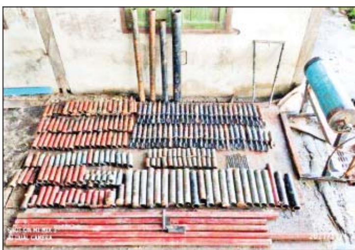
နိုဝင်ဘာ ၄ ရက်က တွဲတေးမြို့နယ် ကျွဲလမ်းကျေးရွာ ငါးကန်မှ သိမ်းဆည်းရမိသည့် လက်လုပ်ပုံး၊ လက်လုပ်စီနီပြောင်းနှင့် ဆက်စပ်ပစ္စည်းများကို တွေ့ရစဉ်။

ကျေးရွာ ရဲကင်းနှင့် ရပ်ကွက်စီမံအုပ်ချုပ်ရေးအဖွဲ့မှူး တစ်ဦးကို လည်းကောင်း၊ လှည်းကူးမြို့နယ်ရှိ ထွေ/အုပ်ရုံး၊ မြေစာရင်းရုံး၊ EPC ရုံး၊ သမဝါယမရုံး၊ မြို့မရဲစခန်းနှင့် ၃-လမ်းဆုံ လုံခြုံရေးစခန်းတို့ကို လည်းကောင်း၊ ဒလမြို့နယ်ရှိ မှော်စက်ရေဖမ်း၊ မြို့ဝင်ဆိပ်ကြီးနှင့် လုံခြုံရေးစခန်းတို့ကို လည်းကောင်း၊ မင်္ဂလာဒုံမြို့နယ်ရှိ မြို့နယ်ရဲစခန်း၊ ရပ်ကွက်စီမံအုပ်ချုပ်ရေးအဖွဲ့ရုံး၊ EPC ရုံးနှင့် လမ်းဆုံမီးပွိုင့်တို့ကို လည်းကောင်း လက်လုပ်ပုံးဖြင့် တိုက်ခိုက်ရန် ညွှန်ကြားစေခိုင်းထားကြောင်း