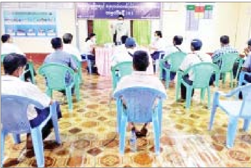
ထွန်းက အခြေခံငါးမွေးမြူရေးနှင့်ပတ်သက်၍ ရေးဇန်မှ NAG အဖွဲ့ဝင် ရေလုပ်သားများ လည်းကောင်း ပို့ချပေးခဲ့သည်။ သင်တန်းသို့ စုစုပေါင်း ၁၆ ဦး တက်ရောက်ခဲ့ကြောင်း သိရ ငါးမွေးကန်ပိုင်ရှင်များ ငါးသယံဇာတ ထိန်းသိမ်း သတင်းစဉ်

မအူပင် နိုဝင်ဘာ ၈ ရော့ပတ်တိုင်းဒေသကြီး မအူပင်ခရိုင်ငါးလုပ်ငန်း ဦးစီးဌာနမှ ကြီးမှူး၍ ငါးလုပ်ငန်းများ ရေရှည် ဖွံ့ဖြိုးတိုးတက်စေရေး ငါးရိက္ခာများ ပိုမိုစားသုံး နိုင်ရေးနှင့် ကျေးလက်နေပြည်သူများ ငါးလုပ်ငန်း ဆောင်ရွက်ခြင်းဖြင့် အလုပ်အကိုင်အခွင့်အလမ်း များရရှိစေနိုင်ရန်ရည်ရွယ်၍ ပန်းတနော်မြို့ ပန်းတနော်ငါးလုပ်ငန်းစခန်းတွင် အခြေခံငါး မွေးမြူရေးနှင့် ရေနေသယံဇာတ ထိန်းသိမ်းရေး ပညာပေးသင်တန်းကို ယနေ့ နံနက်ပိုင်းက ဖွင့်လှစ်ခဲ့သည်။