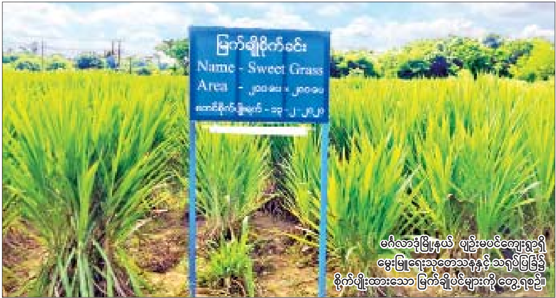
ဓလီလားဒုံမြို့နယ် ဖျဉ်းမပင်ကျေးရွာရှိ မွေးမြူရေးသုတေသနနှင့် ဆက်သွယ်ရေး ဗိုလ်မှူးထူးသော မြက်ချိုပင်များကို တွေ့ရစဉ်။

ရန်ကုန် နိုဝင်ဘာ ၈ အာရှဘောလုံးအဖွဲ့ချုပ်က ကျင်းပမည့် ၂၀၂၁ အာရှအမျိုးသမီးကလပ်ပြိုင်ပွဲ အုပ်စုပထမနေ့ကို နိုဝင်ဘာ ၇ ရက်က ဂျော်ဒန်နိုင်ငံ၌ ကျင်းပရာ မြန်မာတိုက်စစ်မှူး ဝင်းသိင်္ဂီထွန်းကစားနေသည့် အိန္ဒိယကလပ် ဂိုကူလမ်အသင်း ရှုံးပွဲကြုံတွေ့ခဲ့သည်။ ပထမနေ့တွင် အိမ်ရှင်ဂျော်ဒန်ကလပ် အမ်မန်အသင်းက အိန္ဒိယကလပ် ဂိုကူလမ်အသင်းကို နှစ်ဂိုး-တစ်ဂိုး၊ စာမျက်နှာ ၂၂ ကော်လံ ၅ သို့ ၀