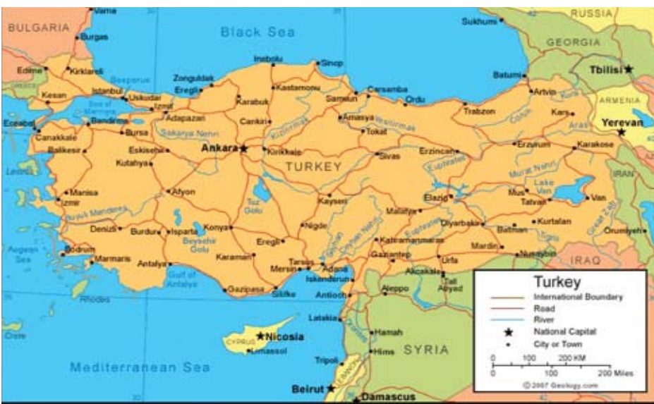
တူရကီနိုင်ငံ၏အုပ်ချုပ်မှုနယ်မြေများပြမြေပုံ

နိုင်ငံတော်အကြီးအကဲနှင့် နိုင်ငံတော်အုပ်ချုပ်ရေးအကြီးအကဲသည် နိုင်ငံတော်သမ္မတဖြစ်သည်။ နိုင်ငံတော်သမ္မတသည် လိုအပ်ပါက ဥပဒေပြုနှစ်၏ ပထမနေ့တွင် လွှတ်တော်၌ မိန့်ခွန်းပြောကြားနိုင်သည်။ နိုင်ငံတော်သမ္မတသည် နိုင်ငံခြားရေးမူဝါဒ၊ နိုင်ငံတော်၏မူဝါဒများကို လွှတ်တော်တွင် မိန့်ခွန်းပြောကြားခွင့်၊ သဝဏ်လွှာပေးပို့ခွင့်ရှိသည်။ နိုင်ငံတော်သမ္မတသည်ပြည်ထောင်စုအစိုးရအဖွဲ့၏ အကြီးအကဲဖြစ်ပြီး ဒုတိယသမ္မတအပါအဝင် ပြည်ထောင်စုအစိုးရဝန်ကြီးများအား ခန့်အပ်ခြင်း၊ တာဝန်မှရပ်စဲခြင်းများ ဆောင်ရွက်နိုင်သည်။ နိုင်ငံ