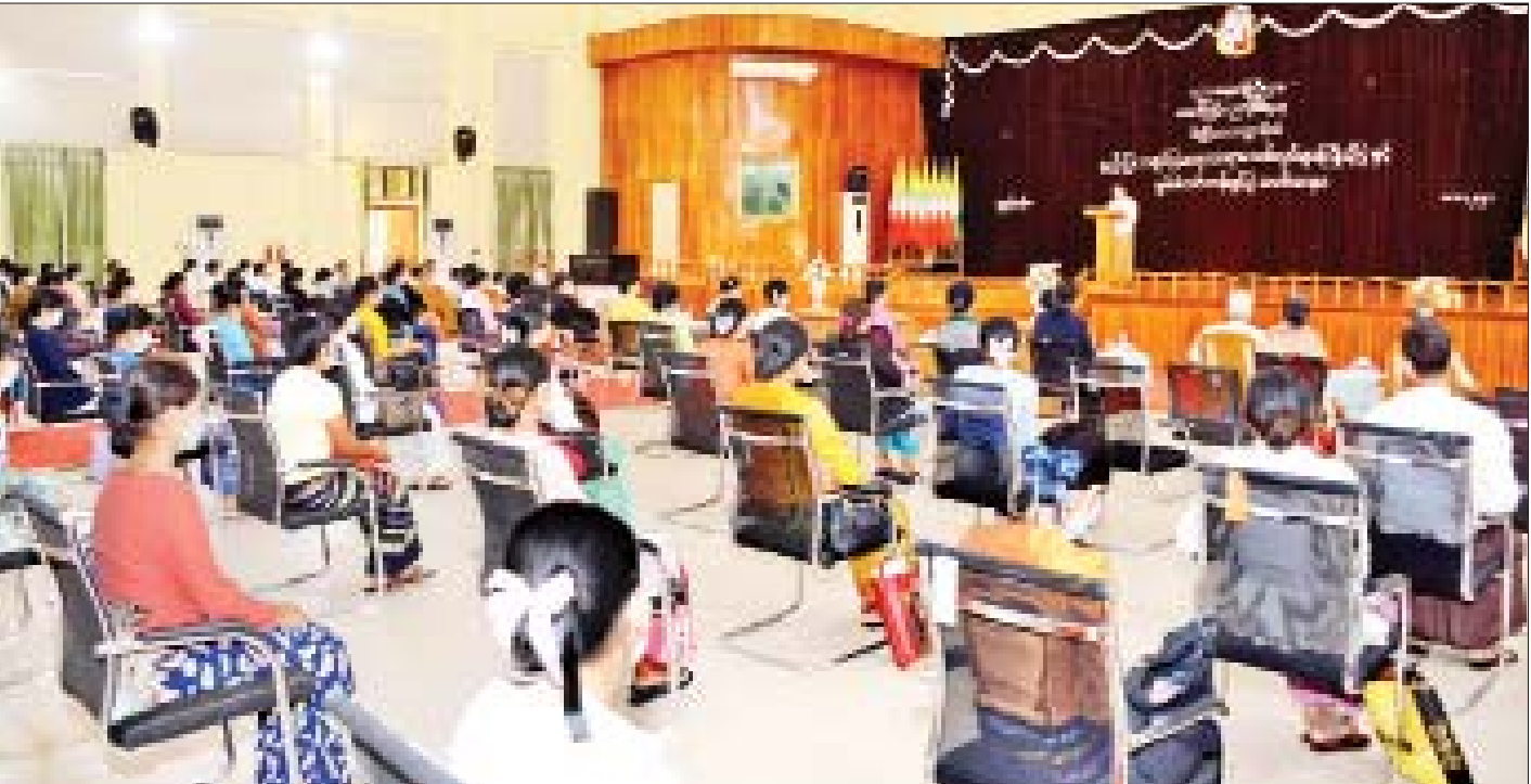
အသစ်ခန့်အပ်သည့် နည်းပြ၊ သရုပ်ပြ ဆရာ ဆရာမသစ်လွင်များ ကြိုဆိုပွဲနှင့် မွမ်းမံသင်တန်း ဖွင့်ပွဲအခမ်းအနားကျင်းပစဉ်။

အိန္ဒိယနိုင်ငံ၌ ကိုဗစ်-၁၉ ရောဂါ ကူးစက်ခံရသူပေါင်း ၃၄ ဒသမ ၃၆ သန်းကျော်ရှိလာ စာမျက်နှာ » ၁၃