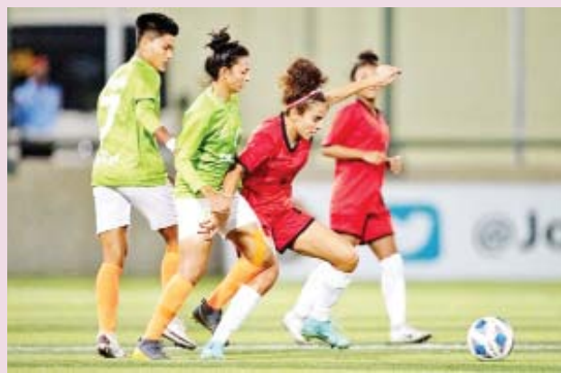
ဂိုကူလမ်အသင်းနှင့် အမ်မန်အသင်းတို့ ယှဉ်ပြိုင်နေစဉ်။

နောက်ဆုံးအဆင့် အုပ်စုမဲခွဲထားမှုအရ ခြေစစ်ပွဲအောင်အသင်းသည် အုပ်စု (A) သို့ ကျရောက်မည်ဖြစ်ရာ တီမောအသင်းသည် ထိုင်း၊ မြန်မာ၊ ဖိလစ်ပိုင်၊ စင်ကာပူအသင်းတို့နှင့် တစ်အုပ်စုတည်း ကစားရမည်ဖြစ်သည်။ အုပ်စု(B)တွင်မူ လက်ရှိချန်ပီယံ ဗီယက်နမ်၊ မလေးရှား၊ အင်ဒိုနီးရှား၊ ကမ္ဘောဒီးယားနှင့် လာအိုအသင်းတို့ ပါဝင်နေသည်။