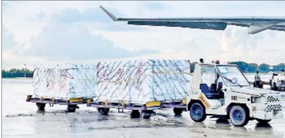
တရုတ်ပြည်သူ့သမ္မတနိုင်ငံမှ Sinovac အမှတ်တံဆိပ် ကိုဗစ်-၁၉ ရောဂါ ကာကွယ်ဆေး နှစ်သန်း doses ရန်ကုန်အပြည်ပြည်ဆိုင်ရာ လေဆိပ်သို့ ရောက်ရှိစဉ်။

နေပြည်တော် နိုဝင်ဘာ ၁၂ တရုတ်ပြည်သူ့သမ္မတနိုင်ငံမှ မြန်မာနိုင်ငံသို့ လှူဒါန်း သည့် Sinovac ကိုဗစ်-၁၉ ရောဂါ ကာကွယ်ဆေးများ လွှဲပြောင်းလက်ခံခြင်း အခမ်းအနားကို ဗီဒီယို ကွန်ဖရင့်စနစ်ဖြင့်ကျင်းပရာ ကျန်းမာရေးဝန်ကြီးဌာန ပြည်ထောင်စုဝန်ကြီး ဒေါက်တာသက်ခိုင်ဝင်း၊ မြန်မာနိုင်ငံဆိုင်ရာ တရုတ်ပြည်သူ့သမ္မတနိုင်ငံ သံအမတ်ကြီး Mr. CHEN HAI နှင့် တာဝန်ရှိသူများ တက်ရောက်ခဲ့ကြသည်။