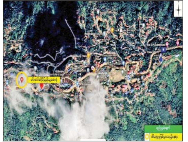
မင်းတပ်မြို့ရှိ ပြည်သူများအနက် ကိုဗစ်-၁၉ ရောဂါကူးစက်မှု ခံထားရ သည့် ပြည်သူ ၆၃ ဦးအား ကုသပေးလျက်ရှိသည့် ကုသရေးစင်တာ အား CDF အကြမ်းဖက်သမားများက သေနတ်ဖြင့် လာရောက် ပစ်ခတ်ခဲ့သည့် နေရာပြမြေပုံ