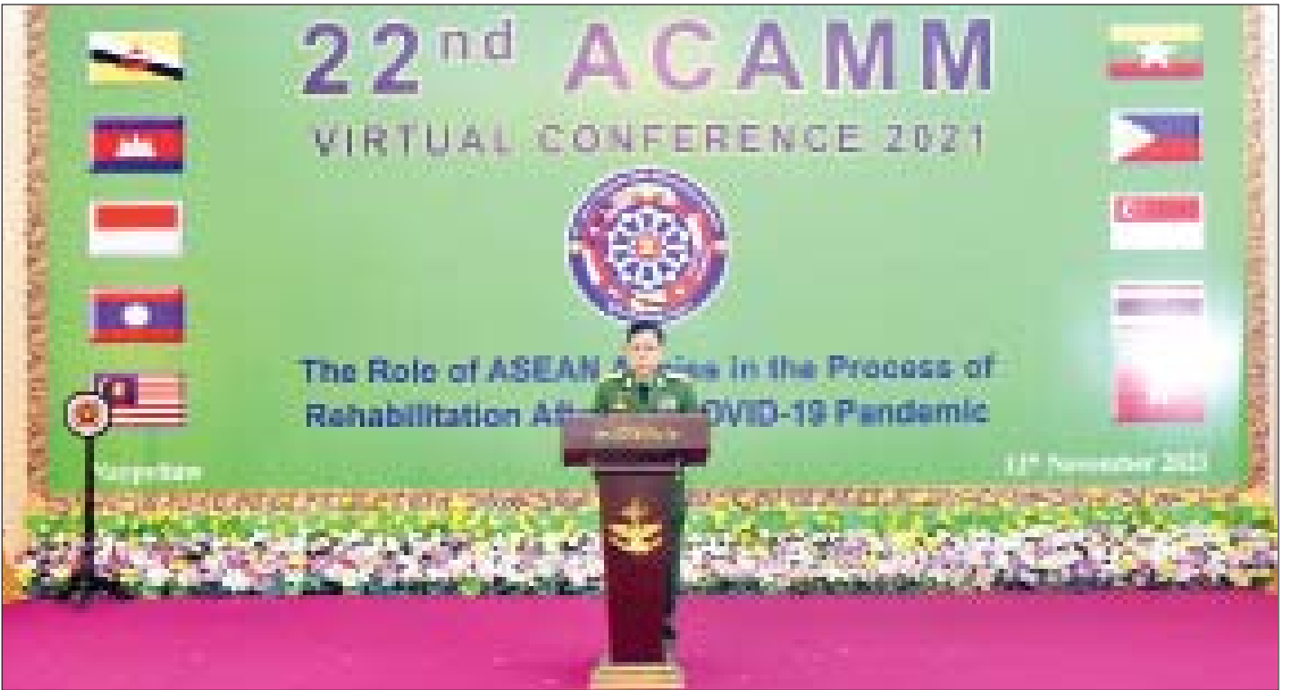
နိုင်ငံတော်စီမံအုပ်ချုပ်ရေးကောင်စီ ဒုတိယဥက္ကဋ္ဌ၊ ဒုတိယတပ်မတော်ကာကွယ်ရေးဦးစီးချုပ်၊ ကာကွယ်ရေးဦးစီးချုပ်(ကြည်း) ဒုတိယဗိုလ်ချုပ်မှူးကြီး စိုးဝင်း (၂)ကြိမ်မြောက် အာဆီယံကြည်းတပ်ဦးစီးချုပ်များအစည်းအဝေးတွင် အမှာစကားပြောကြားစဉ်။

ယင်းနောက်နိုင်ငံတော်စီမံအုပ်ချုပ်ရေးကောင်စီ ဒုတိယဥက္ကဋ္ဌ၊ ဒုတိယတပ်မတော်ကာကွယ်ရေး ဦးစီးချုပ်၊ ကာကွယ်ရေးဦးစီးချုပ်(ကြည်း) ဒုတိယ ဗိုလ်ချုပ်မှူးကြီး စိုးဝင်းက “ကိုဗစ်-၁၉ ကပ်ရောဂါ အလွန် ပြန်လည်ထူထောင်ရေးတွင် အာဆီယံ ကြည်းတပ်များ၏အခန်းကဏ္ဍ (The Role of ASEAN Armies In the Process of Rehabilitation After the COVID-19 Pandemic)ခေါင်းစဉ်နှင့် ပတ်သက်၍ ဦးဆောင်ဆွေးနွေးရာတွင် အာဆီယံ ဒေသအပါအဝင် ကမ္ဘာတစ်ဝန်းလုံးတွင် ကိုဗစ်-၁၉ ရောဂါဆိုး ရိုက်ခတ်မှုဒဏ်ကို ခံစားနေကြရသည်မှာ အချိန်ကာလအားဖြင့် နှစ်နှစ်နီးပါးရောက်ရှိလာကြပြီ ဖြစ်ကြောင်း၊ ရောဂါကာကွယ်ဆေးများ ထုတ်လုပ်နိုင် ခဲ့ပြီး ကမ္ဘာတစ်ဝန်းလုံးတွင် ထိုးနှံမှုများ လုပ်ဆောင် နိုင်ခဲ့ပြီဖြစ်သော်လည်း ရောဂါကူးစက်ပျံ့နှံ့မှုကို ထိန်းချုပ်နိုင်ရန် ခက်ခဲနေဆဲဖြစ်သည့်အပြင် မျိုးရိုး ဗီဇကွဲပြားရပ်စဲသစ်များ ထပ်မံပေါ်ထွက်လာနေသည့် အန္တရာယ်ကို ရင်ဆိုင်နေကြရသည်ကို အားလုံး အသိပင်ဖြစ်ကြောင်း၊ ကိုဗစ်-၁၉ ရောဂါကြောင့် လူ သန်းပေါင်းများစွာထိခိုက်ခံစားခဲ့ကြရပြီး ကမ္ဘာလုံး ဆိုင်ရာ စီးပွားရေးမှာလည်း သိသိသာသာ ကျဆင်း သွားခဲ့ကြောင်း၊ စီးပွားရေးနှင့်ဆက်စပ်ပြီး လူမှုစီးပွား ဘဝ ပြန်လည်နာလန်ထူထောင်ရေးလုပ်ငန်းသည် ကိုဗစ်-၁၉