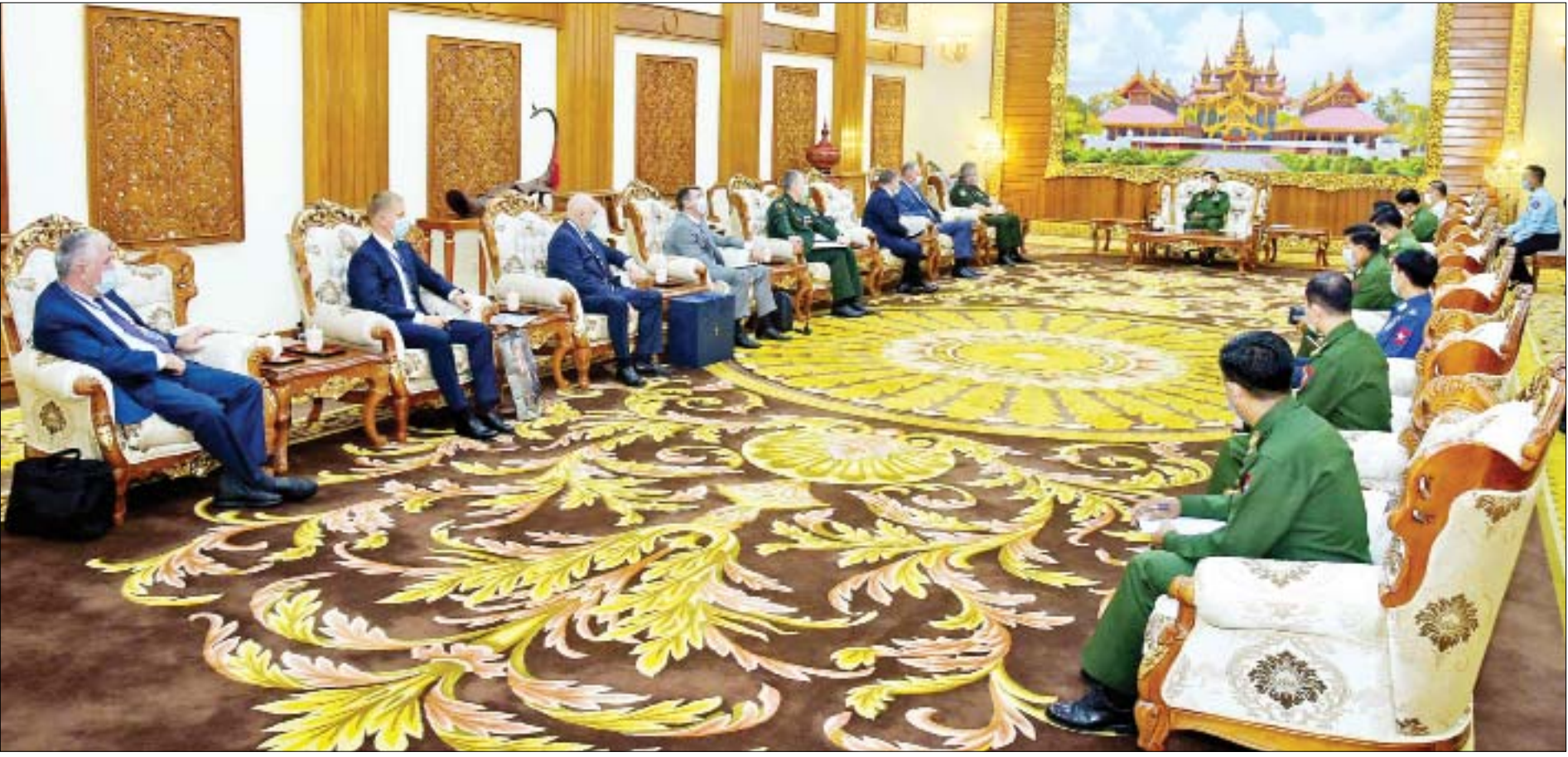
နိုင်ငံတော်စီမံအုပ်ချုပ်ရေးကောင်စီဥက္ကဋ္ဌ၊ တပ်မတော်ကာကွယ်ရေးဦးစီးချုပ် ဗိုလ်ချုပ်မှူးကြီး မင်းအောင်လှိုင် ရုရှား-မြန်မာ စစ်ဘက်နည်းပညာ ပူးပေါင်းဆောင်ရွက်ရေးပူးတွဲကော်မရှင်ဥက္ကဋ္ဌ၊ FSMTC of Russia ၏ ဒုတိယညွှန်ကြားရေးမှူး Mr.Vladimir Drozhzhov နှင့် JSC “Rosoboronexport” ကုမ္ပဏီမှ ဒုတိယညွှန်ကြားရေးမှူးချုပ် Mr.A.L.Chekmarev တို့ ဦးဆောင်သည့် ကိုယ်စားလှယ်အဖွဲ့အား လက်ခံတွေ့ဆုံစဉ်။

နိုင်ငံတော်စီမံအုပ်ချုပ်ရေးကောင်စီဥက္ကဋ္ဌ၊ တပ်မတော်ကာကွယ်ရေးဦးစီးချုပ် ဗိုလ်ချုပ်မှူးကြီး မင်းအောင်လှိုင် ရုရှား-မြန်မာ စစ်ဘက်နည်းပညာ ပူးပေါင်းဆောင်ရွက်ရေးပူးတွဲကော်မရှင်ဥက္ကဋ္ဌ၊ FSMTC of Russia ၏ ဒုတိယညွှန်ကြားရေးမှူးနှင့် JSC “Rosoboronexport” ကုမ္ပဏီမှ ဒုတိယညွှန်ကြားရေးမှူးချုပ်တို့ ဦးဆောင်သည့် ကိုယ်စားလှယ်အဖွဲ့အား လက်ခံတွေ့ဆုံ နှစ်နိုင်ငံ ကာကွယ်ရေးပိုင်းဆိုင်ရာ ပူးပေါင်းဆောင်ရွက်မှုများအပြင် စီးပွားရေးဆိုင်ရာ ပူးပေါင်းဆောင်ရွက်မှုများကိုလည်း ကဏ္ဍပေါင်းစုံ၌ တိုးမြှင့်လုပ်ဆောင်နိုင်မည့် အခြေအနေများ အမြင်ချင်းဖလှယ် ဆွေးနွေး