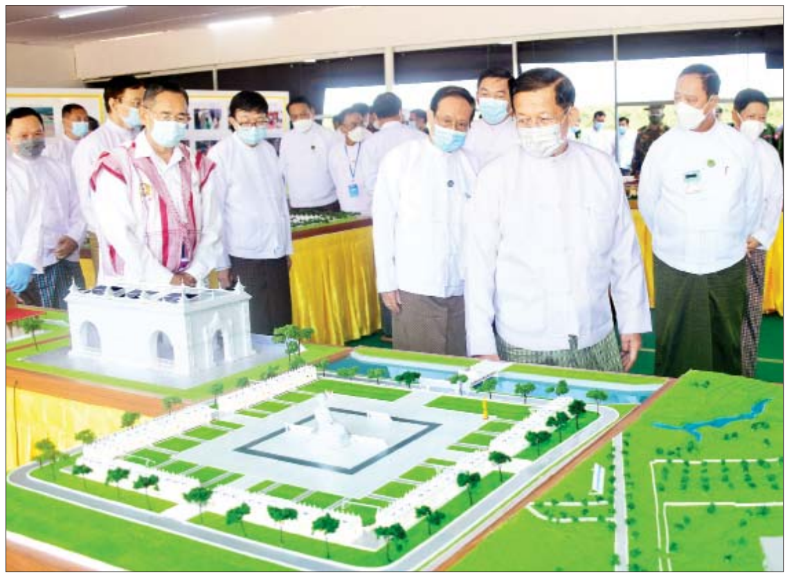
နိုင်ငံတော်စီမံအုပ်ချုပ်ရေးကောင်စီဥက္ကဋ္ဌ၊ နိုင်ငံတော်ဝန်ကြီးချုပ် ဗိုလ်ချုပ်မှူးကြီး မင်းအောင်လှိုင်နှင့် အခမ်းအနားတက်ရောက် လာကြသူများ မာရဝိဇယ ကျောက်ဆစ်ဗုဒ္ဓရုပ်ပွားတော်မြတ်ကြီး တည်ထားကိုးကွယ်မည့် ပုံစံအတိုင်း ပြုလုပ်ပုံဖော်ထားသည့် ပုံစံငယ်များကို လှည့်လည်ကြည့်ရှုစဉ်။

ဆုံး စာအုပ်ကြီးအဖြစ် ဂရင်းနစ်စံချိန်တင် ထားသည့် မန္တလေးမြို့ မဟာလောက မာရဇိန် ကုသိုလ်တော်ဘုရားရှိ ပဉ္စသင်္ဂါ ယနာတင် ပိဋကတ်ကျောက်စာရုံများအား အလေးထားစံပြု၍ တည်ထားကိုးကွယ် နိုင်ရေး ဆောင်ရွက်လျက်ရှိကြောင်း၊ တည်ထားပုံအရလည်း ဗုဒ္ဓမြတ်စွာ၏ နှုတ်ကပိဋတော်များကို ဗုဒ္ဓ၏ မျက်နှာ တော်ရှေ့တွင် ထားရှိဖူးမြော်နိုင်သော ပုံစံဖြင့် တည်ဆောက်နေခြင်းဖြစ်ကြောင်း၊ ဥယျာဉ်တော်ကြီးအတွင်း ရာသီမရွေး သာယာလှပစေရေးအတွက် သစ်ပင် ပန်းမန်များ စိုက်ပျိုးသွားမည်ဖြစ်ကြောင်း၊ ပြည်သူများ မာရဝိဇယဗုဒ္ဓရုပ်ပွားတော် မြတ်ကြီးအား စိတ်လက်ကြည်သာစွာဖြင့် ဖူးမြော်နိုင်ရေးနှင့် အေးချမ်းသာယာမှု ရှိစေရေးတို့အတွက် မာရဝိဇယဗုဒ္ဓဥယျာဉ် တော်ကြီးအဖြစ် တည်ဆောက်သွားမည် ဖြစ်ကြောင်း Powerpoint များ၊ 3D Animation များဖြင့် ရှင်းလင်းပြောကြား ပြီး ဗုဒ္ဓသာသနံ စိရိတိဋ္ဌတု သုံးကြိမ်ရွတ်ဆို ၍ အခမ်းအနားအား ရုပ်သိမ်းလိုက်သည်။