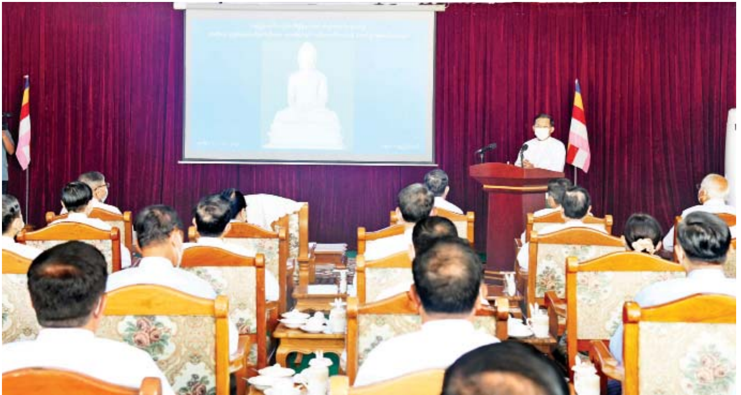
နိုင်ငံတော်စီမံအုပ်ချုပ်ရေးကောင်စီဥက္ကဋ္ဌ၊ နိုင်ငံတော်ဝန်ကြီးချုပ် ဗိုလ်ချုပ်မှူးကြီးမင်းအောင်လှိုင် “မာရဝိဇယ” ဗုဒ္ဓရုပ်ပွားတော်မြတ်ကြီးအား ထုဆစ်ခြင်းနှင့် တည်ထားကိုးကွယ်ရန် ဆောင်ရွက်နေမှုအခြေအနေများနှင့်ပတ်သက်၍ ရှင်းလင်းပြောကြားစဉ်။

နေပြည်တော် နိုဝင်ဘာ ၁၂ ပြည်ထောင်စုနယ်မြေ နေပြည်တော် ဒက္ခိဏသီရိမြို့နယ်ရှိ ဗုဒ္ဓဥယျာဉ်တော် တွင် တည်ထားပူဇော်မည့် “မာရဝိဇယ” ဗုဒ္ဓရုပ်ပွားတော်မြတ်ကြီးအား ထုဆစ်ခြင်း နှင့် တည်ထားကိုးကွယ်ရန်ဆောင်ရွက်နေမှု အခြေအနေများနှင့်ပတ်သက်၍ နိုင်ငံတော် စီမံအုပ်ချုပ်ရေးကောင်စီ ဥက္ကဋ္ဌ၊ နိုင်ငံတော်ဝန်ကြီးချုပ် ဗိုလ်ချုပ်မှူးကြီး မင်းအောင်လှိုင်က နိုင်ငံတော်အဆင့် တာဝန်ရှိပုဂ္ဂိုလ်များအား ရှင်းလင်းပြောကြားခြင်းအခမ်းအနားကို ယနေ့နံနက်ပိုင်းတွင် အဆိုပါ ဗုဒ္ဓဥယျာဉ်တော်အတွင်း ရှိ မဟာမင်္ဂလာမဏ္ဍပ်တော်၌ ကျင်းပပြုလုပ်သည်။