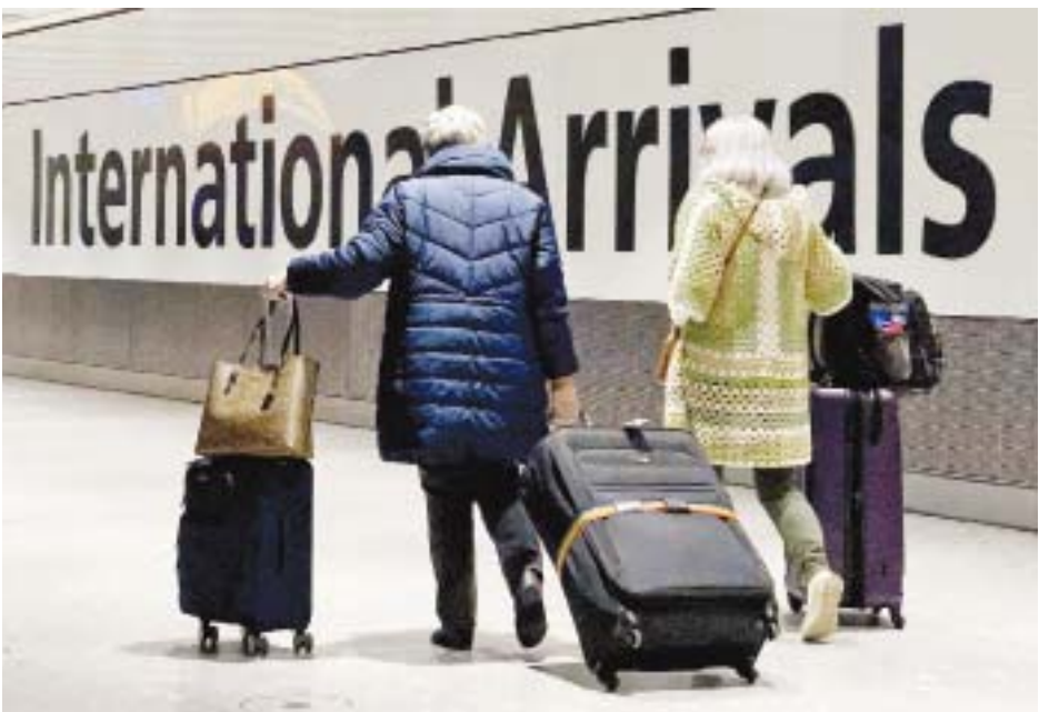
ရောဂါဆိုင်ရာလုပ်ငန်းအဖွဲ့သည် ကိုဗစ်-၁၉ ရောဂါကူးစက်မှုမြင့်တက်နေသည့် ဥရောပနိုင်ငံများမှ လေကြောင်းလိုင်းများကို ရပ်ဆိုင်းခဲ့သည့်အပြင် အိုမီခရွန်ဗီဇပြောင်းဗိုင်းရပ်စ်ကူးစက်မှုကို ကာကွယ်ရန် အာဖရိကနိုင်ငံအများစုမှ လေကြောင်းလိုင်းများကိုလည်း ပိတ်ပင်တားမြစ်ခဲ့ကြောင်း သိရသည်။

မနီလာ နိုဝင်ဘာ ၂၉ ဖိလစ်ပိုင်နိုင်ငံသည် တောင်အာဖရိက၌ စတင်တွေ့ရှိသည့် အိုမီခရွန်ဗီဇပြောင်းကိုရိုနာဗိုင်းရပ်စ်ကူးစက်ပျံ့နှံ့မှုများကို ကြိုတင်ကာကွယ်ရန်အတွက် ကိုဗစ်-၁၉ ရောဂါကာကွယ်ဆေးထိုးနှံပြီးသည့် နိုင်ငံခြားသားခရီးသွားများအား နိုင်ငံအတွင်း ဝင်ရောက်ခွင့်ပြုမည့် ဆုံးဖြတ်ချက်ကို ယာယီရပ်ဆိုင်းလိုက်ကြောင်း ယနေ့ သတင်းများအရ သိရသည်။