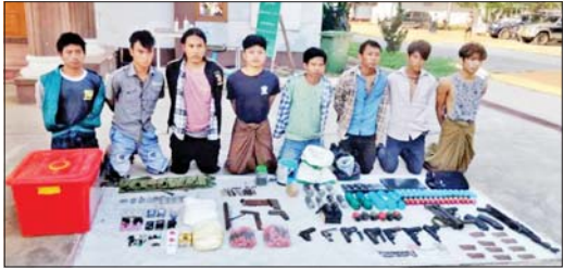
စာမျက်နှာ ၁၂

မုံရွာမြို့အတွင်း အကြမ်းဖက်ဖောက်ခွဲရေးလုပ်ငန်းနှင့် လုပ်ကြံသတ်ဖြတ်မှုများ ကျူးလွန်နေသော မုံရွာ သံမဏိ PDF အမည်ခံ အကြမ်းဖက်အဖွဲ့များအား လက်နက်/ခဲယမ်းများနှင့်အတူ ဖမ်းဆီးရမိ