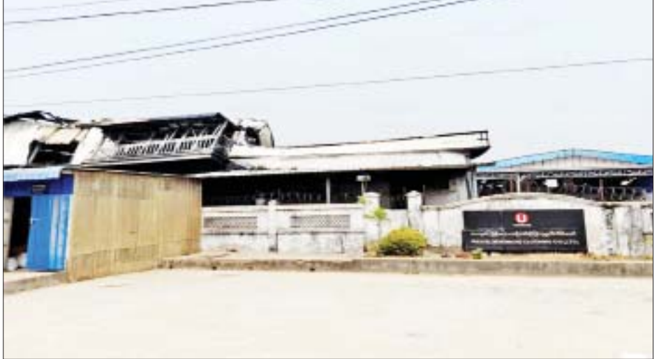
လှိုင်သာယာ(အရှေ့ပိုင်း)မြို့နယ် ကစင်ကျေးရွာ ရွှေလင်ပန်းစက်မှုဇုန် မီးရှို့မှု။