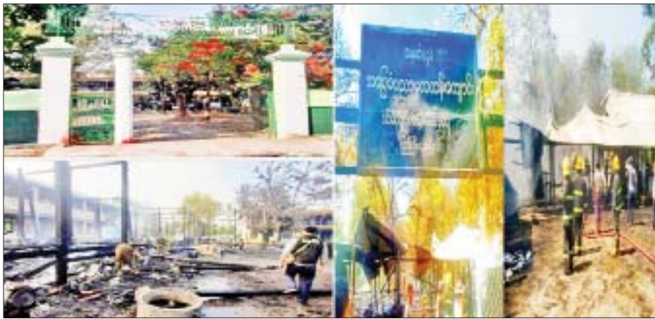
အကြမ်းဖက်သမားများ၏ မိုင်းထောင်ဖောက်ခွဲ၊ မီးရှို့ဖျက်ဆီးမှုများကြောင့် စာသင်ကျောင်းပေါင်း ၄၄၄ ကျောင်း ပျက်စီးဆုံးရှုံးမှု