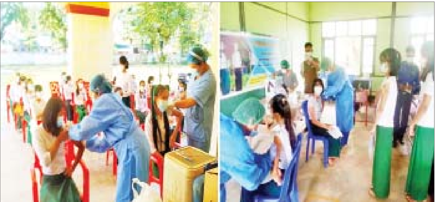
တိုင်းဒေသကြီးနှင့် ပြည်နယ်များ၌ အသက် ၁၂ နှစ်နှင့်အထက် အခြေခံပညာအလယ်တန်းနှင့် အထက်တန်းအဆင့် ကျောင်းသား ကျောင်းသူများအား ကိုဗစ်-၁၉ ရောဂါ ကာကွယ်ဆေးများ ထိုးနှံပေးနေမှု။

နိုင်ငံသားတိုင်း၏ အခွင့်အရေး ပြည်ထောင်စု ရွေးကောက်ပွဲ ကော်မရှင်အဖွဲ့ဝင် ဦးခင်မောင်ဦး က ထိုကိစ္စနှင့်ပတ်သက်ပြီး ဖွဲ့စည်းပုံအခြေခံ ဥပဒေနှင့် လွှတ်တော်ရွေးကောက်ပွဲဥပဒေ တို့တွင် ပါပြီးဖြစ်ကြောင်း၊ ဖွဲ့စည်းပုံ အခြေခံဥပဒေအရ နိုင်ငံတော်၏ သမိုင်း နှင့် ဖြစ်စဉ်လိုအပ်ချက်အရ ဖွဲ့စည်းပုံ အခြေခံဥပဒေနှင့်ရွေးကောက်ပွဲတော်မြောက် ခြင်းနှင့် လွှတ်တော်ဖွဲ့စည်းခြင်း အပိုင်း များကို ပြဋ္ဌာန်းထားခြင်းဖြစ်ကြောင်း၊ ထိုပြဋ္ဌာန်းချက်များအတိုင်းသာ လုပ်ဆောင် သွားမည်ဖြစ်ကြောင်း၊ Voter Right သည် နိုင်ငံသားတိုင်း၏ အခွင့်အရေးဖြစ်ကြောင်း၊ နိုင်ငံသားတိုင်း၏ မူလအခွင့်အရေးနှင့် တာဝန်အခန်းတွင်လည်း ပါဝင်ကြောင်း၊ နိုင်ငံသားတိုင်းသည် ဆန္ဒမဲပေးပိုင်ခွင့်ရှိ သကဲ့သို့ ရွေးကောက်ခံပိုင်ခွင့်လည်းရှိ ကြောင်း၊ ထို့ကြောင့် ဥပဒေနှင့်အညီသာ ဆက်လက် ဆောင်ရွက်သွားမည်ဖြစ် ကြောင်း၊ အပေါ်တွင် သတင်းထောက်ကြီး မေးမြန်းခဲ့သည့် မေးခွန်းနှင့်ပတ်သက်ပြီး ဖြေကြားရာတွင် ကျန်ခဲ့သည့်အဖြေအား ဖြည့်စွက် ဖြေကြားပေးသွားမည်ဖြစ် ကြောင်း၊ ပြီးခဲ့သည့်ရွေးကောက်ပွဲတွင် ရွေးကောက်ပွဲစောင့်ကြည့် လေ့လာရေး အဖွဲ့အချို့ လာရောက်လေ့လာခဲ့ကြ ကြောင်း၊ ပြည်တွင်းရွေးကောက်ပွဲ စောင့်ကြည့်လေ့လာရေးအဖွဲ့မှ လူပေါင်း ၈၀၀၀ကျော်နှင့်နိုင်ငံတကာရွေးကောက်ပွဲ စောင့်ကြည့်လေ့လာရေး အဖွဲ့များမှ လူပေါင်း ၆၄၁ ဦးရှိကြောင်း၊ အဆိုပါအဖွဲ့ များအနေဖြင့် ရွေးကောက်ပွဲကျင်းပပြီး ရက်ပေါင်း ၉၀ အတွင်း ကနဦးအစီရင်ခံစာ နှင့် အသေးစိတ်အစီရင်ခံစာများ တင်ရ ကြောင်း၊ သို့သော် ကနဦးအစီရင်ခံစာ အချို့သာရရှိခဲ့ပြီး အသေးစိတ်အစီရင်ခံစာ များ ရရှိခဲ့ခြင်းမရှိကြောင်း၊ အဆိုပါ အစီရင်ခံစာများအထဲတွင် ထူးခြားသည်