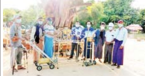
ကသာမြို့၌ တွန်းလှည်းများနှင့် စတီးရေချမ်းစင်များလှူဒါန်း

ကသာ နိုဝင်ဘာ ၂၉ စစ်ကိုင်းတိုင်းဒေသကြီး ကသာမြို့တွင် ယနေ့ မွန်းလွဲ ၃ နာရီက အောက်ဆီဂျင်သယ်ယူသည့် တွန်းလှည်းများနှင့် စတီးရေချမ်းစင်များ လှူဒါန်းခြင်းအခမ်းအနားကို ကသာခရိုင် ပြည်သူ့ဆေးရုံဝင်း၌ ကျင်းပကြောင်း သိရသည်။