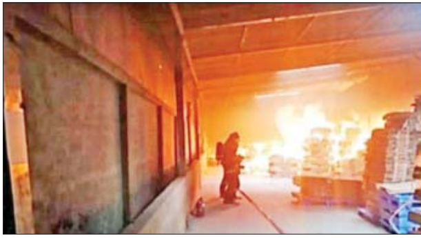
ရွှေပြည်သာမြို့နယ် (၁၈)ရပ်ကွက်ရှိ Sun Time (JCK) အထည်ချုပ်စက်ရုံ မီးရှို့မှု။