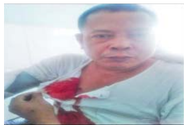
အောက်တိုဘာလ ၂၄ ရက်တွင် မုံရွာမြို့ နယ် မအူကျေးရွာနေ အပြစ်မဲ့ပြည်သူ တစ်ဦးအား အကြမ်းဖက်သမားများက လက်နက်ငယ်ဖြင့် ပစ်ခတ်ခဲ့သည့် မှတ်တမ်းဓာတ်ပုံ။