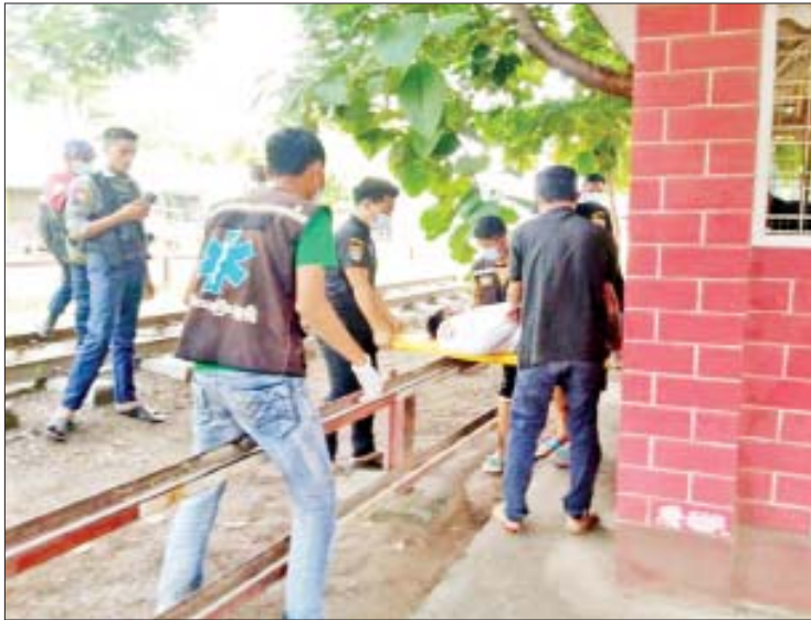
စက်တင်ဘာ ၂၂ ရက်တွင် မုံရွာမြို့ အောင်မင်္ဂလာရပ်ကွက်ရှိ ထန်းတောမီးပွိုင့်တွင် တာဝန်ထမ်းဆောင်နေသော လုံခြုံရေးတပ်ဖွဲ့ဝင်အား သတ်ဖြတ်ခဲ့သည့် မှတ်တမ်းဓာတ်ပုံ။