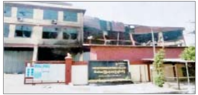
လှိုင်သာယာ(အနောက်ပိုင်း)မြို့နယ် ရွှေလင်ပန်းစက်မှုဇုန်ရှိ TMR အထည်ချုပ်စက်ရုံ မီးရှို့မှု။