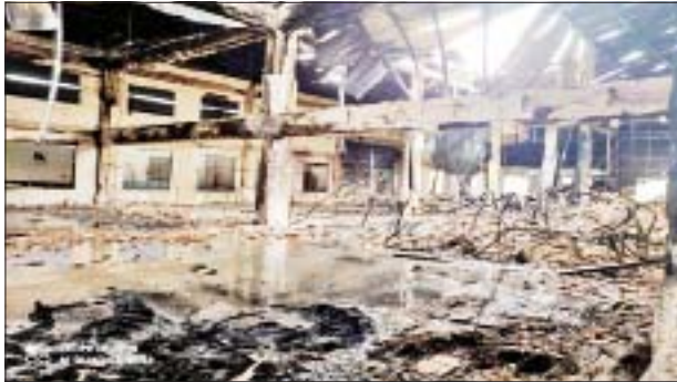
ရွှေပြည်သာမြို့နယ်တွင် အထည်ချုပ်စက်ရုံ မီးရှို့မှု။