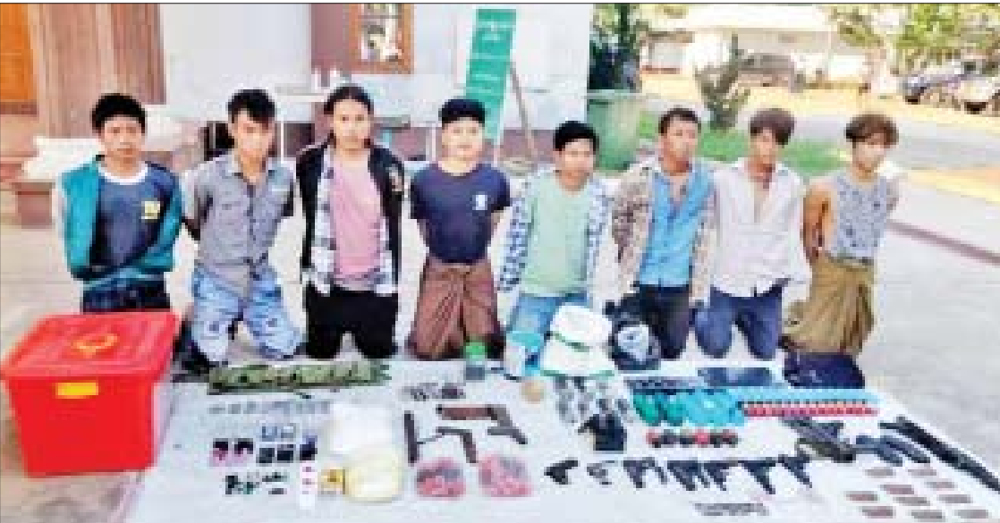
မုံရွာမြို့တွင် PDF သံမဏိ အကြမ်းဖက် အဖွဲ့ဝင်များအား လက်နက်/ခဲယမ်းများနှင့်အတူ ဖမ်းဆီးရမိခဲ့သည့် မှတ်တမ်းဓာတ်ပုံ။