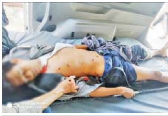
စက်တင်ဘာလ ၂၃ ရက်တွင် သံမဏိအဖွဲ့မှ မုံရွာမြို့ မြဝတီရပ်ကွက် Mytel ရုံးရှိ လုံခြုံရေးတပ်ဖွဲ့ဝင်အား အကြမ်းဖက်သူ နှစ်ဦးက လက်နက်ငယ်ဖြင့် ပစ်ခတ်ခဲ့သည့် မှတ်တမ်းဓာတ်ပုံ။