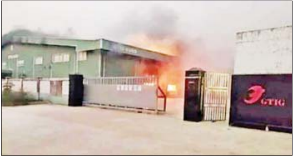
ရွှေပြည်သာမြို့နယ် ဝါးတစ်ရာစက်မှုဇုန် အမှတ်(၄၉/၁၄၇) GTIG Hubo အထည်ချုပ်စက်ရုံအား မီးရှို့မှု။

အကြမ်းဖက်အဖွဲ့များအနေဖြင့် စက်ရုံ၊ အလုပ်ရုံများအား ယခုကဲ့သို့ မိုင်းထောင်ဖောက်ခွဲ၊ မီးရှို့ဖျက်ဆီးခြင်းများ လုပ်ဆောင်နေမှုအပေါ် ပြည်သူ့ထုတစ်ရပ်လုံးအနေဖြင့် နိုင်ငံတော်ဖွံ့ဖြိုးတိုးတက်ရေးနှင့် တည်ငြိမ်အေးချမ်းရေးအတွက် ပူးပေါင်းကာကွယ်သွားကြပါရန်နှင့် အကြမ်းဖက်သမားများ၏ လှုပ်ရှားမှုသတင်းများကိုရရှိပါက နီးစပ်ရာလိုခြံရေးတပ်ဖွဲ့ဝင်များထံသို့ လျှို့ဝှက်စွာ ဆက်သွယ်သတင်းပေးပို့၍ အကြမ်းဖက်သမားများ ရပ်တည်မှုမရှိနိုင်အောင် ထိခိုက်ပျက်စီးစေရန်အတွက် ပူးပေါင်းဆောင်ရွက်သွားကြပါရန် မေတ္တာရပ်ခံ သတင်းထုတ်ပြန်ထားကြောင်း သက်ဆိုင်ရာမှ သိရသည်။