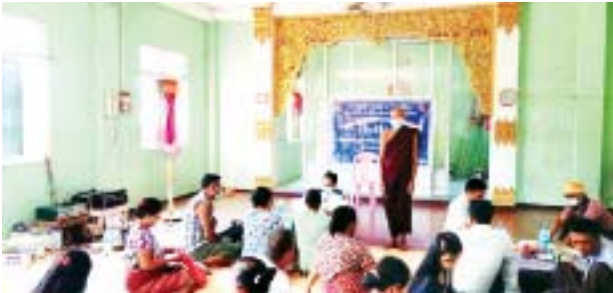
ထန်းတပင်မြို့နယ်၌ နိုင်ငံသားစိစစ်ရေးကတ်ပြားများ ကွင်းဆင်းဆောင်ရွက်ပေး

ထိန်းထားနိုင်သော်လည်း မဆင်မခြင်ဆက်လက် ပြုမူနေထိုင်ပါက AIDS ရောဂါဝေဒနာရှင်အဆင့် သေချာပေါက်ရောက်ရှိမည်ဖြစ်သည်။ ကမ္ဘာပေါ်တွင် AIDS ရောဂါကုသသည့်ဆေးဝါးများ ယနေ့အချိန် အထိ မပေါ်ထွက်သေးပါ။ AIDS ရောဂါဖြစ်လာပြီ ဆိုလျှင် မိသားစုတစ်ခုလုံး၊ ဆွေမျိုးသားချင်း တစ်သိုက်လုံး လူ့အသိုင်းအဝိုင်း လူမှုပတ်ဝန်းကျင်မှ ဖယ်ကြည့်ရှောင်ကွင်း ခွဲခြားဆက်ဆံခြင်းခံရပြီး