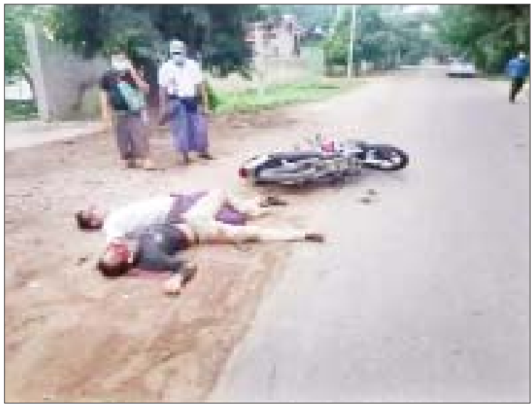
အောက်တိုဘာလ ၂၆ ရက်တွင် မုံရွာမြို့ စက်မှုဇုန်ရပ်ကွက်၌ အပြစ်မဲ့ပြည်သူများအား အကြမ်းဖက်သမားများက သတ်ဖြတ်ခဲ့သည့် မှတ်တမ်းဓာတ်ပုံ။