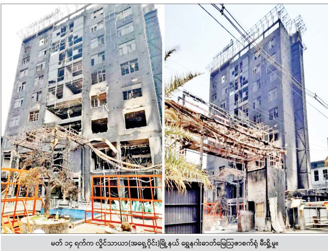
မတ် ၁၄ ရက်က လှိုင်သာယာ(အရှေ့ပိုင်း)မြို့နယ် ရွှေနဂါးဓာတ်မြေဩဇာစက်ရုံ မီးရှို့မှု။