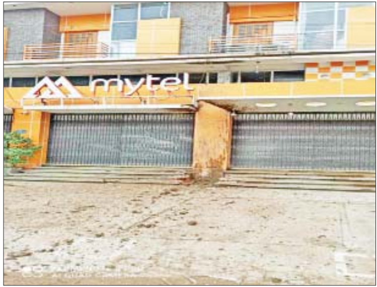
စက်တင်ဘာလ ၁၅ ရက်တွင် မုံရွာမြို့ မြဝတီရပ်ကွက် Mytel ဆက်သွယ်ရေးရုံးရှေ့အုတ်ခုံ၌ လက်လုပ်မိုင်း ပေါက်ကွဲခဲ့သည့် မှတ်တမ်းဓာတ်ပုံ။

အောင်၊ ငပုတို့နှင့် တောက်တီး တို့သည် စက်မှုဇုန်ရပ်ကွက်အတွင်းရှိ (၈၁)ကာရာအိုကေဆိုင်ရှေ့၌ အပြစ်မဲ့ပြည်သူနှစ်ဦးကို လက်နက်ငယ်ဖြင့် ပစ်ခတ်သတ်ဖြတ်ခဲ့ကြောင်း ဖော်ထုတ်သိရှိရသည်။ အထက်ပါဖမ်းဆီးရမိသူများအား တရားဥပဒေအရ ထိရောက်စွာအရေးယူ နိုင်ရေး ဆက်လက်ဆောင်ရွက်သွားမည် ဖြစ်ကြောင်းနှင့် ဆက်စပ်တရားခံများအား အမြန်ဆုံး ဖမ်းဆီးရမိရေးအတွက် ၎င်းတို့ပုန်းခိုရာနေရာများ၊ လှုပ်ရှားသွားလာနေထိုင်မှုသတင်းများ ရရှိပါက သက်ဆိုင်ရာသို့ လျှို့ဝှက်စွာ သတင်းပေး တိုင်ကြားနိုင်ပါကြောင်းနှင့် မြို့ရွာများ အမြန်ဆုံး အေးချမ်းတည်ငြိမ်ရေးအတွက် ပြည်သူတစ်ရပ်လုံး ပူးပေါင်းပါဝင်ကြိုးပမ်း ဆောင်ရွက်နိုင်ပါရန် မေတ္တာရပ်ခံထားကြောင်း သက်ဆိုင်ရာမှ သတင်းရရှိသည်။ သတင်းစဉ်