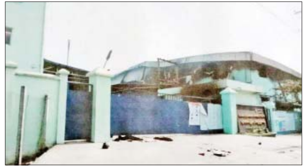
လှိုင်သာယာ(အနောက်ပိုင်း)မြို့နယ် ရွှေလင်ပန်းစက်မှုဇုန်ရှိ SeM Ma Te အထည်ချုပ်စက်ရုံ မီးရှို့မှု။