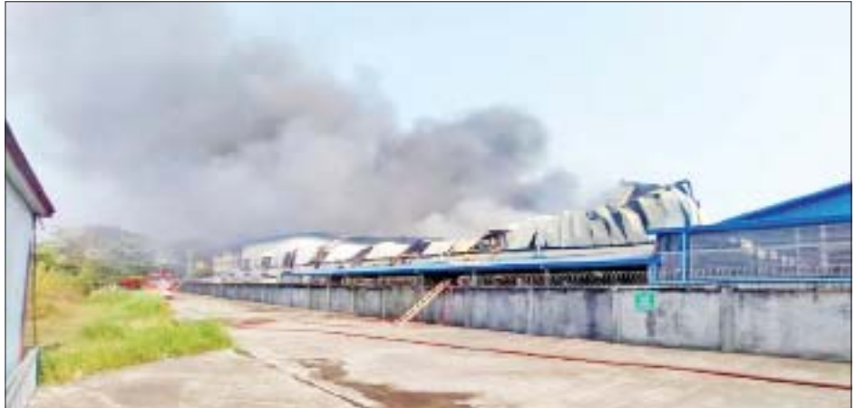
လှိုင်သာယာ(အရှေ့ပိုင်း)မြို့နယ် စက်မှုဇုန်(၁)ရှိ Winco Bag (အိတ်ချုပ်)စက်ရုံ မီးရှို့မှု။