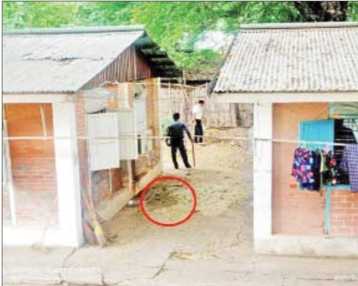
ဩဂုတ် ၁၆ ရက်တွင် မုံရွာမြို့ ရုံးကြီးရပ်ကွက် မြို့နယ်အကောက်ခွန်ဦးစီးဌာနရုံး ဝန်ထမ်းအိမ်ရာ၌ လက်လုပ်ဗုံး ပေါက်ကွဲခဲ့သည့် မှတ်တမ်းဓာတ်ပုံ။