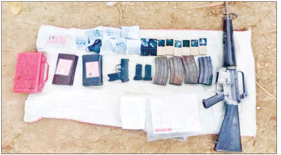
၂၀၂၁ ခုနှစ် ဒီဇင်ဘာ ၅ ရက်တွင် ငပုတောမြို့နယ် ဂုံညှင်းတန်းအုပ်စု လဲလောင်းကျေးရွာအနီး ခြေတော်ရာဘုန်းကြီးကျောင်း၌ သိမ်းဆည်းရမိသည့် လက်နက်/ခဲယမ်းများ၏ မှတ်တမ်းဓာတ်ပုံ။