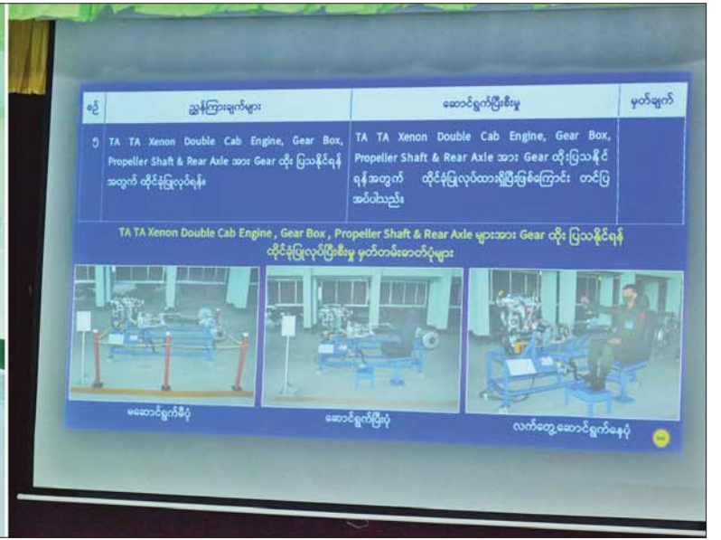
နိုင်ငံတော်စီမံအုပ်ချုပ်ရေးကောင်စီဥက္ကဋ္ဌ၊ တပ်မတော်ကာကွယ်ရေးဦးစီးချုပ် ဗိုလ်ချုပ်မှူးကြီး မင်းအောင်လှိုင်နှင့် အဖွဲ့ဝင်များအား လျှပ်စစ်နှင့် စက်မှုအင်ဂျင်နီယာညွှန်ကြားရေးမှူးရုံး ညွှန်ကြားရေးမှူး ဗိုလ်မှူးချုပ် နေမျိုးဦးက ရှင်းလင်းတင်ပြစဉ်။