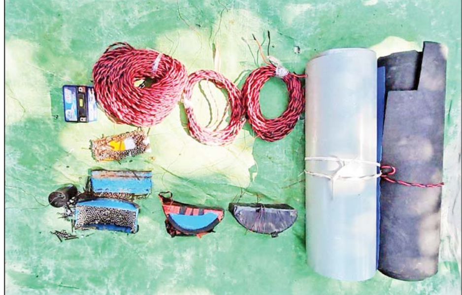
၂၀၂၁ ခုနှစ် ဒီဇင်ဘာ ၅ ရက်တွင် ငပုတောမြို့နယ် လဲလောင်းကျေးရွာအနီး ခြေတော်ရာဘုန်းကြီး ကျောင်း၌ သိမ်းဆည်းရမိသည့်ပစ္စည်းများ မှတ်တမ်းဓာတ်ပုံ။

ပေးမည်ဖြစ်ကြောင်းနှင့် မြို့ရွာ များ အမြန်ဆုံး အေးချမ်းတည်ငြိမ် ရေးအတွက် ပြည်သူတစ်ရပ်လုံး ပူးပေါင်းပါဝင် ကြိုးပမ်းဆောင် ရွက်နိုင်ပါရန် သက်ဆိုင်ရာက မေတ္တာရပ်ခံထားသည်။ သတင်းစဉ်