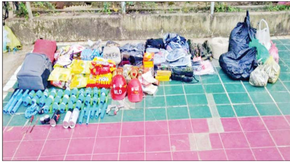
၂၀၂၁ ခုနှစ် ဒီဇင်ဘာ ၂ ရက်တွင် ပုသိမ်မြို့ (၁၀)ရပ်ကွက် စက်ကုန်းရပ်၌ ဖမ်းဆီးရမိသည့် ဖောက်ခွဲ ဖျက်ဆီးရေး ဆက်စပ်ပစ္စည်းများ မှတ်တမ်းဓာတ်ပုံ။