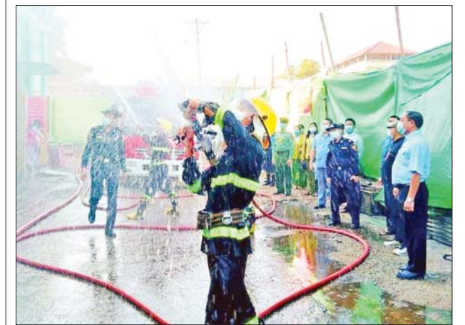
တောင်ငူမြို့မဈေးကြီး မီးဘေးအန္တရာယ် ကာကွယ်ရေးသရုပ်ပြ