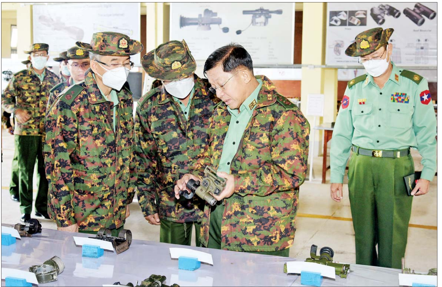
နိုင်ငံတော်စီမံအုပ်ချုပ်ရေးကောင်စီဥက္ကဋ္ဌ၊ တပ်မတော်ကာကွယ်ရေးဦးစီးချုပ် ဗိုလ်ချုပ်မှူးကြီး မင်းအောင်လှိုင် ပြင်ဦးလွင်တပ်နယ်ရှိ နယ်မြေခံစက်မှုအင်ဂျင်နီယာ သင်တန်းကျောင်းအတွင်း ကြည့်ရှုစစ်ဆေးစဉ်။

နိုင်ငံတော်စီမံအုပ်ချုပ်ရေးကောင်စီဥက္ကဋ္ဌ၊ တပ်မတော် ကာကွယ်ရေးဦးစီးချုပ် ဗိုလ်ချုပ်မှူးကြီး မင်းအောင်လှိုင်သည် ယနေ့နံနက်ပိုင်းတွင် ကာကွယ်ရေး ဦးစီးချုပ်(ရေ) ဗိုလ်ချုပ်ကြီး မိုးအောင်၊ ကာကွယ်ရေးဦးစီးချုပ်(လေ) ဗိုလ်ချုပ်ကြီး မောင်မောင်ကျော်၊ ကာကွယ်ရေးဦးစီးချုပ် ရုံးမှ တပ်မတော်အရာရှိကြီးများ၊ အလယ် ပိုင်းတိုင်းစစ်ဌာနချုပ်တိုင်းမှူး၊ ဗိုလ်ချုပ် ကိုကိုဦးနှင့် တာဝန်ရှိသူများလိုက်ပါ၍ ပြင်ဦးလွင်တပ်နယ်ရှိ နယ်မြေခံစက်မှု အင်ဂျင်နီယာ သင်တန်းကျောင်းသို့ သွားရောက်ကြည့်ရှုစစ်ဆေးသည်။