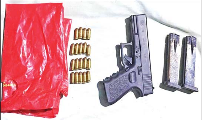
၂၀၂၁ ခုနှစ် ဒီဇင်ဘာ ၄ ရက်တွင် ပုသိမ်မြို့နယ် လင်းဝင်းကြီးအုပ်စု ပိတောက်ချောင်းကုန်းကျေးရွာနေ အေးသောင်းနေအိမ်၌ သိမ်းဆည်းရမိသည့် လက်နက်/ခဲယမ်းများ မှတ်တမ်းဓာတ်ပုံ။