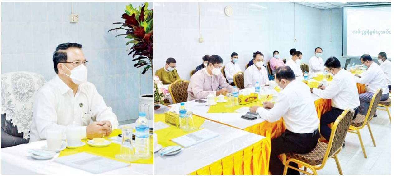
ပြည်ထောင်စုဝန်ကြီး ဦးမောင်မောင်အုန်း ရန်ကုန်မြို့ ဗဟန်းမြို့နယ်ရှိ မြန်မာ့အလင်းသတင်းစာတိုက်တွင် တာဝန်ရှိသူများအား တွေ့ဆုံ မှာကြားစဉ်။

Light of Myanmar သတင်းစာ ပုံနှိပ်ထုတ်ဝေ ဖြန့်ချိနေမှုနှင့် စပ်လျဉ်း၍ ရှင်းလင်းတင်ပြကြ သည်။ ယင်းနောက် ပြည်ထောင်စု ဝန်ကြီးက တွေ့ဆုံပွဲသို့ တက်ရောက် လာကြသည့် သတင်းနှင့် စာနယ် ဇင်းလုပ်ငန်း(ရုံးချုပ်)၊ မြန်မာ့ အလင်း၊ ကြေးမုံနှင့် The Global New Light of Myanmar သတင်းစာတိုက်တို့မှ တာဝန်ရှိ သူများ၊ စာတည်းအဖွဲ့ဝင်များအား လိုအပ်သည်များ မှာကြားပြီး ပုံနှိပ်စက်ခန်းနှင့် စာတည်း ဌာနတို့ကို လှည့်လည်ကြည့်ရှု စစ်ဆေးသည်။