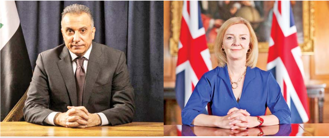
အီရတ်ဝန်ကြီးချုပ် မူစတာဖာအယ်လ်ခါဟီမီနှင့် ဗြိတိန်နိုင်ငံခြားရေးဝန်ကြီး လစ်ထရပ်စ်။