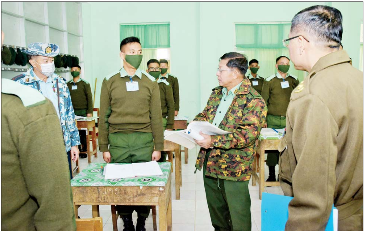
နိုင်ငံတော်စီမံအုပ်ချုပ်ရေးကောင်စီဥက္ကဋ္ဌ၊ တပ်မတော်ကာကွယ်ရေးဦးစီးချုပ် ဗိုလ်ချုပ်မှူးကြီး မင်းအောင်လှိုင် သင်တန်းသား သင်တန်းသူများအား ရင်းရင်းနှီးနှီးနှုတ်ဆက်ပြီး လေ့ကျင့်ဆောင်ရွက်နေမှု အခြေအနေများနှင့်ပတ်သက်၍ မေးမြန်းဆွေးနွေးစဉ်။

☆ ရှေ့ဖိုးမှ ရှင်းလင်းတင်ပြမှုများအပေါ် နိုင်ငံတော်စီမံအုပ်ချုပ်ရေးကောင်စီဥက္ကဋ္ဌ၊ တပ်မတော်ကာကွယ်ရေးဦးစီးချုပ်က တပ်မတော်အတွင်း ဖွင့်လှစ်သင်ကြားလျက်ရှိသည့် စက်မှုအင်ဂျင်နီယာသင်တန်းကျောင်းများအနေဖြင့် အခြေခံသင်ရိုးညွှန်းတမ်းများအား တူညီမှုရှိစွာ ဆောင်ရွက်ရမည်ဖြစ်ကြောင်း၊ ယခုသင်တန်းကျောင်းသည် အခြေခံအကျဆုံးသော စက်မှုဆိုင်ရာဘာသာရပ်များကို သင်ကြားပေးရသည့် သင်တန်းကျောင်းတစ်ခုဖြစ်ကြောင်း၊ သင်တန်းဆင်းသူများအနေဖြင့် တပ်မတော်အတွင်း စက်မှုဆိုင်ရာ လိုအပ်ချက်များကို သက်ဆိုင်ရာဘာသာရပ်များအလိုက် ကျွမ်းကျင်ပိုင်နိုင်စွာ ထမ်းဆောင်နိုင်ရေး သင်ကြားပို့ချပေးနိုင်ရမည်ဖြစ်ကြောင်း၊ သင်တန်းသားများ၏ စားသောက်နေထိုင်ရေးတို့အား ဆောင်ရွက်ပေးရာတွင် သတ်မှတ်နှုန်းထားများအတိုင်း ပြည့်မီစွာ ဆောင်ရွက်ရန်လိုပြီး သင်တန်းသားများအနေဖြင့် သင်ခန်းစာကို ရာနှုန်းပြည့် သင်ယူလေ့လာနိုင်ရမည်ဖြစ်ကြောင်း၊