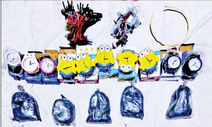
၂၀၂၁ ခုနှစ် ဒီဇင်ဘာ ၄ ရက်တွင် ပုသိမ်မြို့ (၁၀)ရပ်ကွက် (၁)လမ်းမကြီးနေ ဒေါ်မြနှစ်နေအိမ်၌ သိမ်းဆည်းရမိသည့် ဖောက်ခွဲဖျက်ဆီးရေးပစ္စည်းများ၏ မှတ်တမ်းဓာတ်ပုံ။

နေပြည်တော် ဒီဇင်ဘာ ၆ အကြမ်းဖက်အဖွဲ့အစည်းများမှ နိုင်ငံတော်အစိုးရ၏ အုပ်ချုပ်မှုယန္တရားပျက်ပြားစေရန် ရည်ရွယ်၍ ဖောက်ခွဲဖျက်ဆီးခြင်းနှင့် အပြစ်မဲ့ပြည်သူများအား အဓိကပစ်မှတ်ထား၍ သတ်ဖြတ်ခြင်းတို့အား ဆောင်ရွက်နိုင်မှုမရှိစေရေး ဖော်ထုတ်ဖမ်းဆီးမှုများ