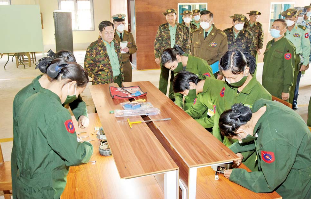
နိုင်ငံတော်စီမံအုပ်ချုပ်ရေးကောင်စီဥက္ကဋ္ဌ၊ တပ်မတော်ကာကွယ်ရေးဦးစီးချုပ် ဗိုလ်ချုပ်မှူးကြီး မင်းအောင်လှိုင် သင်တန်းအထောက်အကူပြု သရုပ်ပြစက်ပစ္စည်းကိရိယာများကို အသုံးပြု၍ သင်တန်းသားများကိုယ်တိုင် လက်တွေ့ဆောင်ရွက်နေမှုကို ကြည့်ရှုစဉ်။

ထို့နောက် နိုင်ငံတော်စီမံအုပ်ချုပ်ရေးကောင်စီဥက္ကဋ္ဌ၊ တပ်မတော်ကာကွယ်ရေးဦးစီးချုပ်နှင့် အဖွဲ့ဝင်များသည် သင်တန်းကျောင်းအတွင်း လှည့်လည်၍ သင်တန်းဆောင်များအတွင်း သင်တန်းသား သင်တန်းသူများ၏ဘာသာရပ်အလိုက်သင်ယူနေမှုအခြေအနေ၊ သင်တန်းအထောက်အကူပြု သရုပ်ပြစက်ပစ္စည်းကိရိယာများကို အသုံးပြု၍ သင်တန်းသားများကိုယ်တိုင် လက်တွေ့ဆောင်ရွက်နေမှု အခြေအနေများအား လိုက်လံကြည့်ရှု၍ သင်တန်းသားများအနေဖြင့် ၎င်းတို့သင်ယူထားသည့် သင်ခန်းစာများအား လက်တွေ့နယ်ပယ်တွင် အမှန်တကယ်အသုံးချနိုင်ရေး လူမှန်နေရာမှန် တာဝန်ပေးအပ်ရန် လိုအပ်သည့် အခြေအနေ၊ အရေးပေါ်အခြေအနေများတွင် ကိရိယာတန်ဆာပလာအနည်းဆုံးဖြင့် စက်မှုဆိုင်ရာ အခက်အခဲများကို ထိုးထွင်းကြံဆဖြေရှင်းဆောင်ရွက် တတ်စေရေးတို့အတွက်လည်း ထည့်သွင်းသင်ကြားပေးရန် လိုအပ်သည့် အခြေအနေများနှင့်ပတ်သက်၍ တာဝန်ရှိသူများအား မှာကြားသည်။ ယင်းနောက် သင်တန်းသား သင်တန်းသူများအား ရင်းရင်းနှီးနှီးနှုတ်ဆက်ပြီး လေ့ကျင့်ဆောင်ရွက်နေမှု အခြေအနေများနှင့်ပတ်သက်၍ မေးမြန်းဆွေးနွေးခဲ့ကြောင်းနှင့် သင်တန်းကျောင်း အဆင့်မြှင့်တင်ရေးအတွက် အဆောက်အအုံများ ထပ်မံတိုးချဲ့ဆောက်လုပ်နေမှု အခြေအနေများကို လိုက်လံကြည့်ရှုစစ်ဆေးခဲ့ကြောင်း သိရသည်။ သတင်းစဉ်