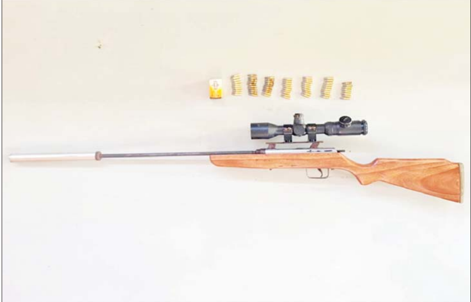
၂၀၂၁ ခုနှစ် ဒီဇင်ဘာ ၅ ရက်တွင် ပုသိမ်မြို့ (၁၀)ရပ်ကွက် စက်ကုန်းလမ်းနေ တရားခံ ဖိုးထွေး၏ နေအိမ်မှ သိမ်းဆည်းရမိသည့် လက်နက်/ခဲယမ်းများ မှတ်တမ်းဓာတ်ပုံ။