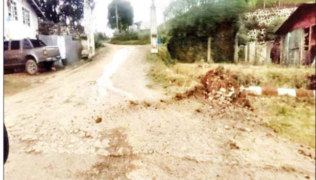
မိုးကုတ်မြို့ မြို့မရပ်ကွက် ထင်းရှူးခြံရပ်ကွက်၌ လုံခြုံရေးဆောင်ရွက် နေသည့် ယာဉ်အား လက်လုပ်ချိန်ကိုက်မိုင်းဖြင့် ဖောက်ခွဲခဲ့သည့် မှတ်တမ်းဓာတ်ပုံ။