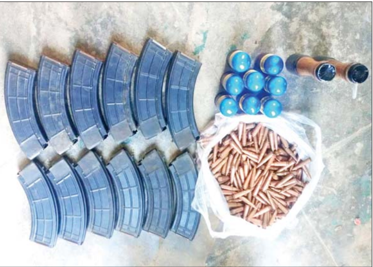
၃-၁၂-၂၀၂၁ ရက်တွင် ကျောက်လုပ်ကွက်ဟောင်းအနီး တောင်ယာတဲတွင် သိမ်းဆည်းရမိသည့် လက်နက်/ခဲယမ်းများ မှတ်တမ်းဓာတ်ပုံ။