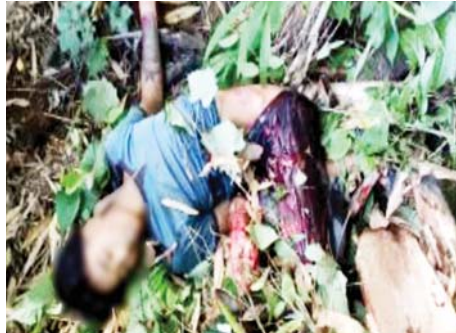
ဘိုစည်(၂၅)နှစ်(သေဆုံး)

- မိုးကုတ်(အနောက်ပိုင်း) PDF အကြမ်းဖက် အဖွဲ့မှ ဇူလိုင်လ ၁၃ ရက်တွင် မိုးကုတ်မြို့ မြို့မရပ်ကွက် ညောင်သုံးပင်ရပ်နေ အပြစ်မဲ့ ပြည်သူ တစ်ဦးအား လည်းကောင်း၊ နိုဝင်ဘာ လ ၁၂ ရက်တွင် မိုးကုတ်မြို့ ကျပ်ပြင်ကျေးရွာ ကျောက်ဖားရပ်နေ အပြစ်မဲ့ပြည်သူ တစ်ဦး အားလည်းကောင်း၊ နိုဝင်ဘာလ ၃၀ ရက် တွင် မိုးကုတ်မြို့ ကျပ်ပြင်ကျေးရွာအုပ်စု ပန်းမ(အောက်)ရပ်နေ အပြစ်မဲ့ ပြည်သူ နှစ်ဦးအားလည်းကောင်း လက်နက်ငယ်ဖြင့် ပစ်ခတ်သတ်ဖြတ်ခဲ့ကြောင်း။