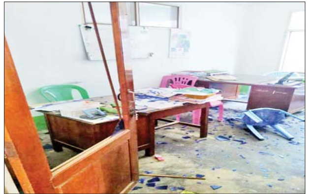
၂၀၂၁ ခုနှစ် စက်တင်ဘာ ၃ ရက်တွင် မိုးကုတ်မြို့နယ် မြို့မရပ်ကွက်ရှိ မြို့နယ်စည်ပင်သာယာရုံးအား လက်လုပ်မိုင်းဖြင့် ဖောက်ခွဲခဲ့သည့် မှတ်တမ်းဓာတ်ပုံ။