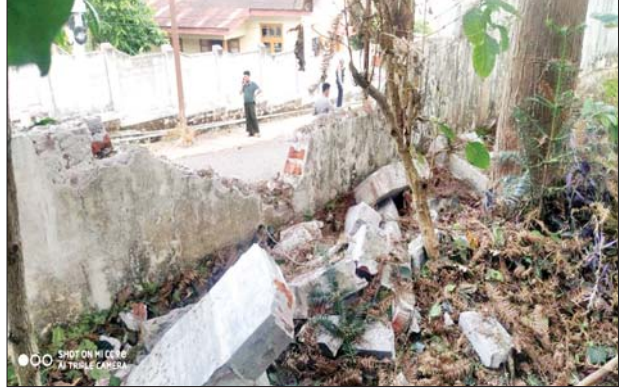
၂၀၂၁ ခုနှစ် မေ ၁၆ ရက်တွင် မိုးကုတ်မြို့နယ် မြို့မရပ်ကွက်ရှိ ရပ်ကွက်စီမံအုပ်ချုပ်ရေးမှူးရုံးအား လက်လုပ်မိုင်းဖြင့် ဖောက်ခွဲခဲ့သည့် မှတ်တမ်းဓာတ်ပုံ။