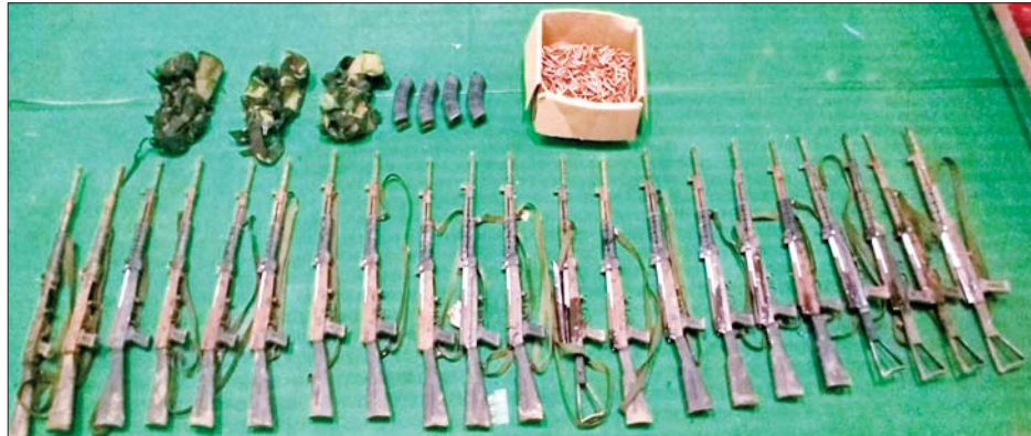
၃-၁၂-၂၀၂၁ ရက်တွင် မိုးကုတ်မြို့နယ် မင်းတံတားရပ်ကွက် လွယ်ဆစ်တောင်ကုန်းအနီး သိမ်းဆည်း ရမိသည့် လက်နက်/ခဲယမ်းများ မှတ်တမ်းဓာတ်ပုံ။