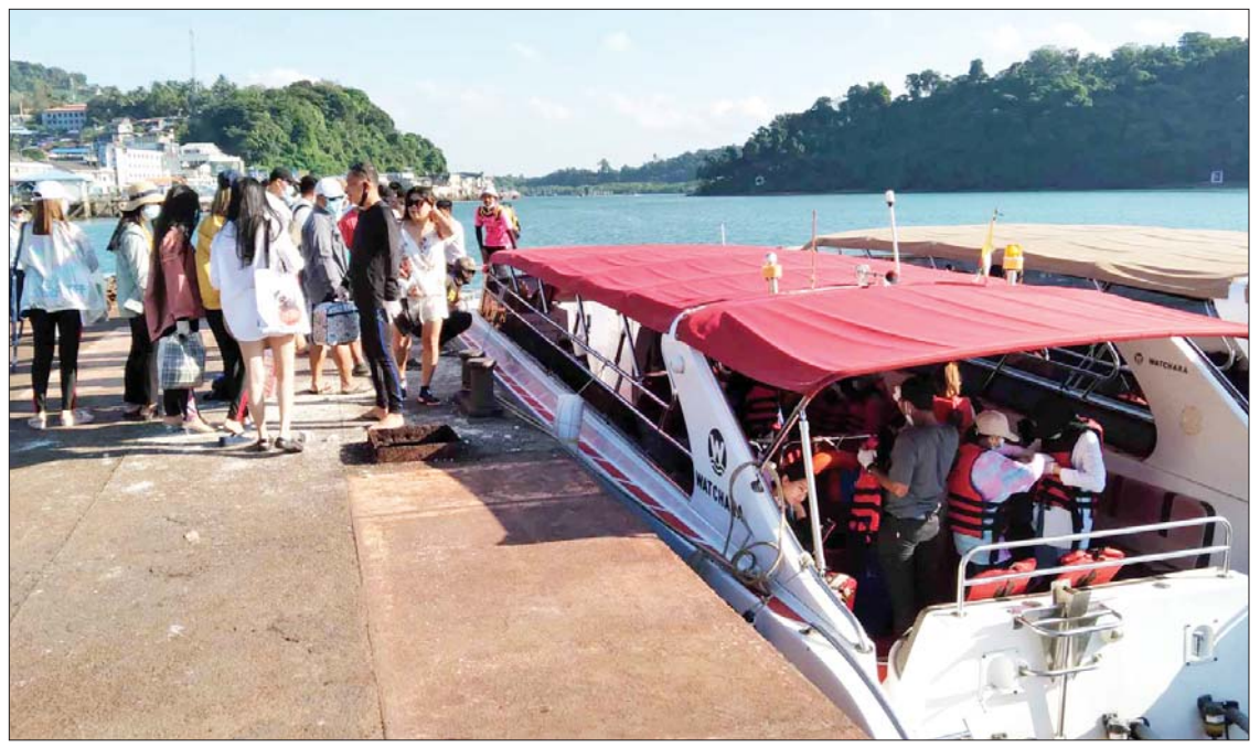
လူနေမှုစနစ်အတွင်းမှ လတ်ဆတ် သည့် ရေမြေတောတောင် ပင်လယ် ရည်ရွယ်ချက်ဖြင့် လာရောက်လည်ပတ် သန့်ရှင်းသည့် ပင်လယ်လေကို အားပါး သတ္တဝါများစွာ၏ သဘာဝအရိတရားကို ကြခြင်းဖြစ်ကြောင်း သိရသည်။ ကျော်စိုး(ကော့သောင်း)

ကြောင်း သိရသည်။ ဒေသခံ ခရီးသွားကုမ္ပဏီများ၏ ပြောပြချက်အရ ပင်လယ်အပန်းဖြေခရီး သွားမည့် ဧည့်သည်များအနေဖြင့် ကိုဗစ်- ၁၉ ရောဂါထိန်းချုပ်ရေး စည်းကမ်းချက် များနှင့် အညီ ကိုဗစ်-၁၉ ရောဂါကာကွယ် ဆေး နှစ်ကြိမ်ထိုးနှံပြီးကြောင်း အထောက် အထားများ တင်ပြနိုင်ရမည်ဖြစ်ပြီး ခရီးစဉ်တစ်လျှောက် လက်အိတ်နှင့် ပါးစပ်နှာခေါင်းစည်းများ တပ်ဆင်ထားရန် လိုအပ်ကြောင်း၊ ပင်လယ်ခရီးစဉ်ဖြစ် သဖြင့် ခရီးသွားများ အသက်အန္တရာယ် မဖြစ်ပေါ်ရေး၊ ပင်လယ်ကြမ်းပြင် သဘာဝ သယံဇာတများ၊ ဂေဟစနစ်များ ပျက်စီး ဆုံးရှုံးမှုမဖြစ်ပေါ်စေရေး ဟိုတယ်နှင့် ခရီးသွား ညွှန်ကြားမှုဦးစီးဌာနနှင့် ခရီးသွား လုပ်ငန်းကုမ္ပဏီများ၏ စည်းကမ်းချက်များ လိုက်နာရန် လိုအပ်ကြောင်း သိရသည်။ ခရီးသွားဧည့်သည် အများစုမှာ ကိုဗစ်-၁၉ ရောဂါ ထိန်းချုပ်မှုကာလ တစ်လျှောက် မွန်းကျပ်ခဲ့သည့် မြို့ပြ၏