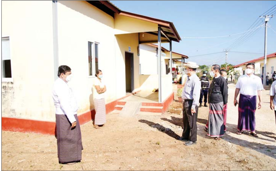
ဦးသိန်းကိုကို၊ လုံခြုံရေးနှင့် နယ်စပ်ရေးရာဝန်ကြီး ဦးစောခင်မောင်မြင့်နှင့် လမ်းပန်းဆက်သွယ်ရေး ဗိုလ်မှူးကြီး မျိုးမင်းနောင်၊ စီးပွားရေးရာဝန်ကြီး ဝန်ကြီး ရဲမှူးကြီးခင်ဇော်တို့က စုပေါင်းဝန်ထမ်းအိမ်ရာ

ဘားအံ ဒီဇင်ဘာ ၁၂ ကရင်ပြည်နယ်အတွင်း တာဝန်ထမ်းဆောင်လျက်ရှိသော ဝန်ထမ်းများ၏ နေထိုင်မှုဘဝ အဆင်ပြေစေရေးအတွက် ပြည်နယ်ဘဏ္ဍာရန်ပုံငွေဖြင့် မြို့ပြနှင့် အိမ်ရာဖွံ့ဖြိုးရေးဦးစီးဌာနမှ စုပေါင်းဝန်ထမ်းအိမ်ရာ ၇၈ လုံး၊ အခန်းပေါင်း ၅၁၀ ကို တည်ဆောက်ပေးနိုင်ခဲ့ပြီး မြေနေရာရရှိမှုနှင့် ဘဏ္ဍာငွေရရှိမှုအပေါ်မူတည်၍ ပြည်နယ်အတွင်း နေရာဒေသစုံတွင် ဆက်လက် အကောင်အထည်ဖော် ဆောင်ရွက်ပေးသွားမည် ဖြစ်ကြောင်း ဒီဇင်ဘာ ၁၂ ရက် နံနက်ပိုင်းက ဘားအံမြို့ လှာကမြင်ကွက်သစ်ရှိ စုပေါင်းဝန်ထမ်းအိမ်ရာဖွင့်ပွဲအခမ်းအနားမှ သိရသည်။