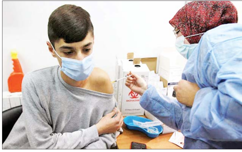
ကာကွယ်ဆေးထိုးနှံမှုအစီအစဉ်ကို ဇန်နဝါရီ ၁၄ ရက်တွင် စတင်ခဲ့သည်။ လက်ရှိတွင် တူရကီနိုင်ငံ၌ ကိုဗစ်-၁၉ ရောဂါ ကာကွယ်ဆေးတစ်ကြိမ် ထိုးနှံပြီးသူပေါင်း ၅၆ ဒသမ ၅ သန်းကျော်ရှိကြောင်း၊ ကာကွယ်ဆေး နှစ်ကြိမ်ထိုးနှံပြီးသူပေါင်း ၅၀ ဒသမ ၈၉ သန်းကျော်ရှိကြောင်းနှင့် ကိုဗစ်-၁၉ ရောဂါ ကာကွယ်ဆေးအလုံးရေပေါင်း ၁၂၁ ဒသမ ၆ သန်းကျော် အသုံးပြုပြီးဖြစ်ကြောင်း တူရကီ ကျန်းမာရေးဝန်ကြီးဌာနက ပြောကြားသည်။ ကိုးကား - ဆင်ဟွာ ဘာသာပြန် - အလင်းသစ်

အန်ကာရာ ဒီဇင်ဘာ ၁၂ တူရကီနိုင်ငံ၌ လွန်ခဲ့သည့်တစ်ရက်အတွင်း ကိုဗစ်-၁၉ ရောဂါ ကူးစက်ခံရသူ ၁၉၂၅၅ ဦး ထပ်မံတွေ့ရှိခြင်းကြောင့် နိုင်ငံတစ်ဝန်းတွင် ကိုဗစ်-၁၉ ရောဂါ ကူးစက်ခံရသူပေါင်း ၉၀၂၂၂၃ ဦးရှိလာကြောင်း တူရကီနိုင်ငံ ကျန်းမာရေးဝန်ကြီးဌာနက ယနေ့တွင် ပြောကြားသည်။