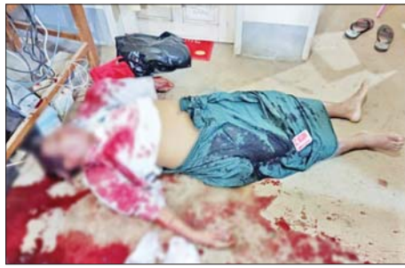
၂၀၂၁ ခုနှစ် စက်တင်ဘာ ၂၂ ရက်တွင် မိုးကုတ်မြို့ မင်းတံတားရပ်ကွက်ရှိ မြို့နယ်လျှပ်စစ် ရုံး၌ နိုင်ငံ့ဝန်ထမ်း တစ်ဦးအား လက်နက်ငယ်ဖြင့် ပစ်ခတ်သတ်ဖြတ်ခဲ့သည့် မှတ်တမ်းဓာတ်ပုံ။