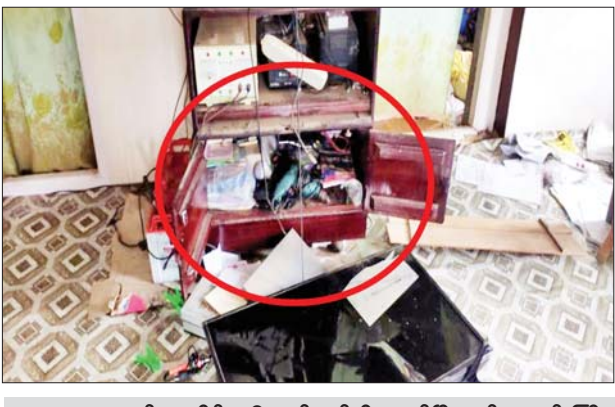
၂၀၂၁ ခုနှစ် နိုဝင်ဘာ ၁၂ ရက်တွင် မိုးကုတ်မြို့နယ် ကျပ်ပြင်ကျေးရွာ ကျောက်ဖားရပ်နေ အပြစ်မဲ့ပြည်သူ တစ်ဦးအား လက်နက်ငယ်ဖြင့် ပစ်ခတ်သတ်ဖြတ်ခဲ့သည့် မှတ်တမ်းဓာတ်ပုံ။