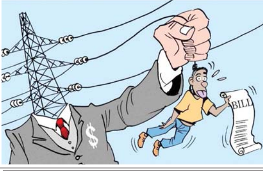
လျှပ်စစ်ကို ဈေးတာဝန်ရှိခြင်းဖြင့် ဝီတာများများ ကျသင့်ခြင်းမှ ရှောင်ရှားပါ။