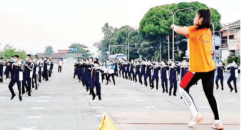
သူ့ကိုယ်လက်ကျန်းမာကြံ့ခိုင်မှုရှိစေရေး အားကစားလှုပ်ရှားမှုများ ဆောင်ရွက်နိုင်ရန်နှင့် လေကောင်း၊ လေသန့်ရရှိပြီး စိတ်လက်အပန်းဖြေစရာနေရာ ဆောင်ရွက်ပေးထားသည်။ ဇာဖြူဝင်း(ပြန်/ဆက်)

ကာယပညာသိပ္ပံ(မော်လမြိုင်)မှ သင်တန်းနည်းပြများက ကျန်းမာရေးအထောက်အကူပြုစေရန်နှင့် ကစားနည်းကို စိတ်ပါဝင်စားစွာ လိုက်ပါကစားနိုင်စေရန် သရုပ်ပြပေးရာတွင် ပါဝင်ကစားသူများသည် ကျန်းမာရေးဝန်ကြီးဌာနမှ ထုတ်ပြန်ထားသည့် ကိုဗစ်-၁၉ ရောဂါ ကာကွယ်ရေး နည်းလမ်းများနှင့်အညီ ပါဝင်ဆင်နွှဲကြသည်။ မွန်ပြည်နယ်အနေဖြင့် မြန်မာ့အားကစားအဆင့်အတန်း တိုးတက်မြှင့်တင်ရေးအတွက် အမျိုးသားရေး တာဝန်တစ်ရပ်အဖြစ်ခံယူကာ ပြည်သူများကိုယ်ကာယကြံ့ခိုင်မှုရှိမှသာ ကျန်းမာပျော်ရွှင်သောဘဝပိုင်ဆိုင်နိုင်မည်ဖြစ်သည်နှင့်အညီ မော်လမြိုင်ကမ်းနားလမ်းတစ်လျှောက်တွင်လည်း အများပြည်