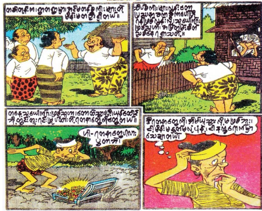
ဓလေ့သွား ကျားနယ် အထွဲ(၅)၊ အမှတ်(၄)၊ (၂၇-၁-၇၃)