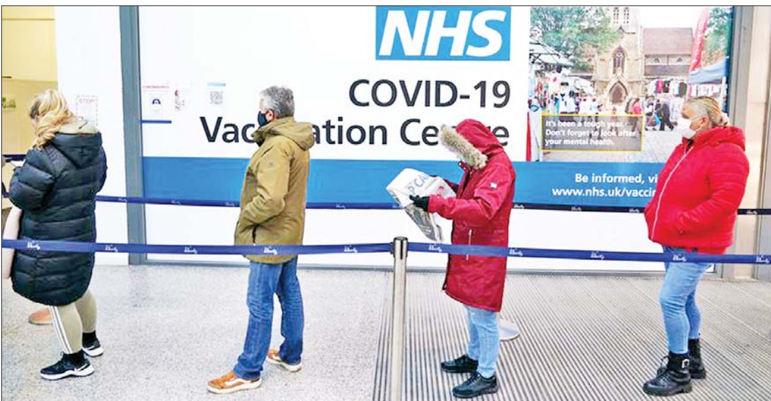
တစ်ရက်အတွင်း ကိုဗစ်-၁၉ ရောဂါ ဓာတ်ခွဲအတည်ပြုလူနာသစ် ၅၄၀၇၃ ဦး ထပ်မံစစ်ဆေးတွေ့ရှိခဲ့ပြီးနောက် အဆိုပါ ရောဂါ ကူးစက်ခံရသူပေါင်း ၁၀၇၇၁၄၄ ဦးရှိလာကြောင်း သိရသည်။ အလားတူ ဗြိတိန်တွင် တစ်ရက်အတွင်း ကိုဗစ်-၁၉ ရောဂါကြောင့် ၁၃၂ ဦး ထပ်မံသေဆုံးခဲ့သဖြင့် လက်ရှိအချိန်အထိ ထိုရောဂါဖြင့် သေဆုံးသူပေါင်း ၁၄၆၃၈၇ ဦးရှိလာသည်။ ကိုးကား - ဆင်ဟွာ ဘာသာပြန် - ဂျေတီ

နေ့စဉ်ရောဂါကူးစက်မှု နောက်ဆုံးအချက်အလက် ထွက်ပေါ်လာရခြင်းဖြစ်သည်။ ဗြိတိန်နိုင်ငံတွင် လက်ရှိ အိုမီခရွန်ဗီဇပြောင်းပိုင်းကို ရှိရာပိုင်းရပ်စ် ကူးစက်မှုနှုန်းအတိုင်း ဆက်လက်ကူးစက်ပါက ယခုနှစ်ဒီဇင်ဘာလတွင် ကိုဗစ်-၁၉ ရောဂါ ကူးစက်ခံရသူအားလုံး၏ ၅၀ ရာခိုင်နှုန်းကျော်သည် အိုမီခရွန်ဗီဇပြောင်းပိုင်းကို ရှိရာပိုင်းရပ်စ် ကူးစက်ခံရသူဖြစ်လာမည်ဖြစ်ကြောင်း ဗြိတိန်ကျန်းမာရေးအေဂျင်စီက ခန့်မှန်းထားသည်။