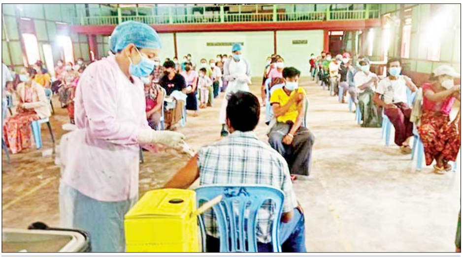
ပဲခူးတိုင်းဒေသကြီး ထန်းတပင်မြို့နယ်အတွင်းရှိ ဒေသခံပြည်သူများအား ကိုဗစ်-၁၉ ရောဂါ ကာကွယ် ဆေး ထိုးနှံပေးစဉ်။

သတင်းထုတ်ပြန်ရေးအဖွဲ့ နိုင်ငံတော်စီမံအုပ်ချုပ်ရေးကောင်စီ