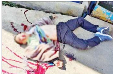
၂၀၂၁ ခုနှစ် ဒီဇင်ဘာ ၃ ရက်တွင် မိုးကုတ် မြို့ ရှေ့လီဝိုင်းရပ်ကွက် ပိတ်စွယ်နယ်မြေ(၃)နေ အပြစ်မဲ့ပြည်သူတစ်ဦးအား လက်နက်ငယ်ဖြင့် ပစ်ခတ်သတ်ဖြတ်ခဲ့သည့် မှတ်တမ်းဓာတ်ပုံ။