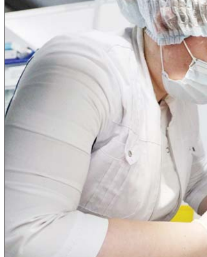
မြို့တော်မော်စကိုသည် ရုရှားနိုင်ငံ၌ ကိုဗစ်-၁၉ ရောဂါကူးစက်မှုအများဆုံးဒေသဖြစ်ပြီး လွန်ခဲ့သည့်တစ်ရက်အတွင်း ကိုဗစ်-၁၉ ရောဂါကူးစက်ခံရသူ ၂၈၆၂ ဦးရှိခြင်းကြောင့် မြို့တော်တစ်ဝန်းတွင် ကိုဗစ်-၁၉ ရောဂါ ကူးစက်ခံရသူပေါင်း ၁၉၈၄၇၈ ဦးရှိလာကြောင်း သိရသည်။ ရုရှားနိုင်ငံ၌ နိုင်ငံသား ၇၄ သန်းကျော်သည် ကိုဗစ်-၁၉ ရောဂါ ကာကွယ်ဆေး တစ်ကြိမ် ထိုးနှံမှုခံယူပြီး ဖြစ်ကြောင်းနှင့် ၆၇ သန်းကျော်သည် ကာကွယ်ဆေးနှစ်ကြိမ်ထိုးနှံမှု ခံယူပြီး ဖြစ်ကြောင်း သိရသည်။ ကိုးကား - ဆင်ဟွာ ဘာသာပြန် - အလင်းသစ်

စောင့်ကြည့်ရေးနှင့် တုံ့ပြန်ရေးစင်တာ၏ ပြောကြားချက်အရ သိရသည်။ ရုရှားနိုင်ငံတစ်ဝန်း၌ လွန်ခဲ့သည့်တစ်ရက်အတွင်း ကိုဗစ်-၁၉ ရောဂါကြောင့် သေဆုံးသူ ၁၁၃၂ ဦးထပ်မံတွေ့ရှိခဲ့သဖြင့် ကိုဗစ်-၁၉ ရောဂါကြောင့် သေဆုံးသူပေါင်း ၂၈၉၄၈၃ ဦးရှိလာကြောင်း သိရသည်။