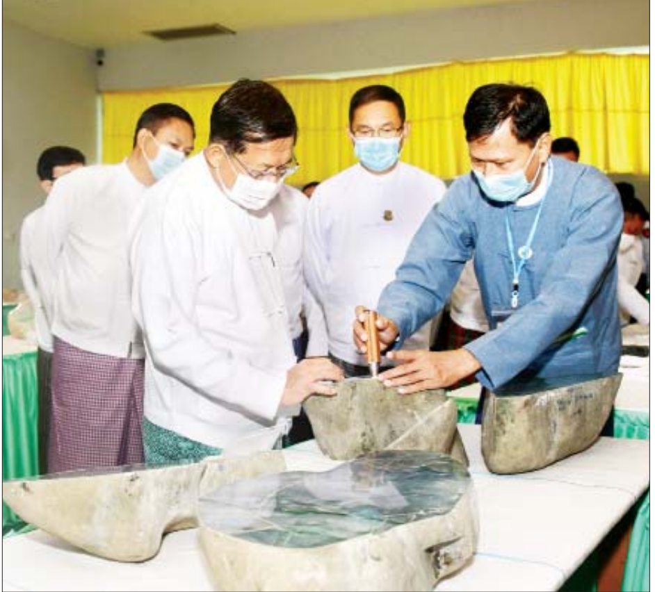
နိုင်ငံတော်စီမံအုပ်ချုပ်ရေးကောင်စီဥက္ကဋ္ဌ၊ နိုင်ငံတော်ဝန်ကြီးချုပ် ဗိုလ်ချုပ်မှူးကြီးမင်းအောင်လှိုင် ၂၀၂၁ ခုနှစ် ပုလဲအတွဲများနှင့် ကျောက်စိမ်းအတွဲများပြပွဲ၌ ရောင်းချရန် ခင်းကျင်းပြသထားသည့် ကျောက်စိမ်းအတွဲများကို ကြည့်ရှုစစ်ဆေးစဉ်။