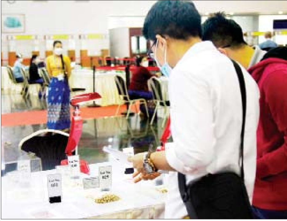
၂၀၂၁ ခုနှစ် ပုလဲအတွဲများနှင့် ကျောက်စိမ်းအတွဲများ ပြပွဲပထမနေ့တွင် ပြည်တွင်း/ပြည်ပ ရတနာကုန်သည်များက ပုလဲအတွဲများကို စိတ်ကြိုက်ကြည့်ရှုလေ့လာကြစဉ်။