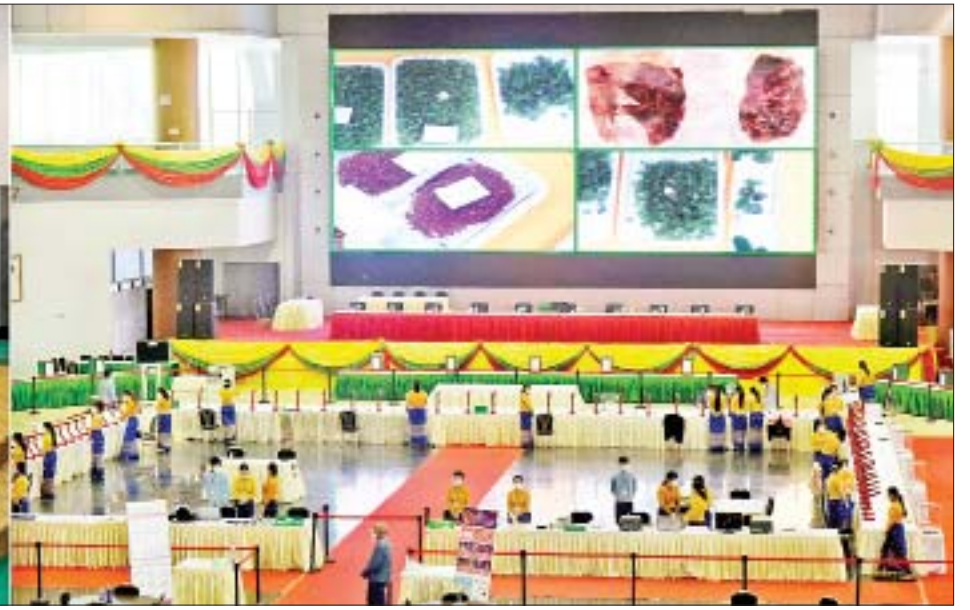
နိုင်ငံတော်စီမံအုပ်ချုပ်ရေးကောင်စီဥက္ကဋ္ဌ၊ နိုင်ငံတော်ဝန်ကြီးချုပ် ဗိုလ်ချုပ်မှူးကြီးမင်းအောင်လှိုင်နှင့် အခမ်းအနား တက်ရောက်လာကြသူများက ၂၀၂၁ ခုနှစ် ပုလဲအတွဲများနှင့် ကျောက်စိမ်းအတွဲများပြပွဲ အခမ်းအနားကျင်းပနိုင်ရေး ပြင်ဆင်ဆောင်ရွက်ခဲ့မှု ဖီဒီယိုမှတ်တမ်းကို ကြည့်ရှုကြစဉ်။