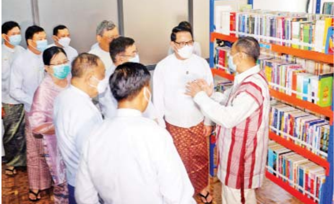
နိုင်ငံတော်စီမံအုပ်ချုပ်ရေးကောင်စီအဖွဲ့ဝင်များ၊ ပြည်ထောင်စုဝန်ကြီးများ၊ ဒုတိယဝန်ကြီးနှင့် ရခိုင်ပြည်နယ်အစိုးရအဖွဲ့ဝင် ဝန်ကြီးများ သံတွဲခရိုင်လူထုအခြေပြုဗဟိုဌာနအတွင်း လှည့်လည်ကြည့်ရှုကြစဉ်။

ကိုယ်စား ပြည်နယ်တိုင်းရင်းသားရေးရာ ဝန်ကြီး ဦးတင်လှက အမှာစကားပြော ကြားပြီး သံတွဲမြို့ မြို့မိမြို့ဖဦးထွန်းသန့် ကျော်က ကျေးဇူးတင်စကား ပြောကြား သည်။ ယင်းနောက် ပြည်ထောင်စုဝန်ကြီး ဦးမောင်မောင်အုန်းက သံတွဲမြို့နယ် အတွင်းရှိ ရပ်ကွက်/ကျေးရွာများတွင် ဖမ်းယူကြည့်ရှုနိုင်ရန်အတွက် MRTV DVB-T2 Set Top Box အလုံး ၅၀၀ ကို ပေးအပ်လျှင်ဒါန်းရာ သံတွဲခရိုင် ဒုတိယ ခရိုင်အုပ်ချုပ်ရေးမှူး ဦးမိုးဇော်လင်းက လက်ခံရယူပြီး တိုင်းရင်းသားလူမျိုးများ ရေးရာဝန်ကြီးဌာန ဒုတိယဝန်ကြီး ဦးဇော်အေးမောင်က သံတွဲခရိုင်ပြည်သူ့ စာကြည့်တိုက်အတွက် ရခိုင်တိုင်းရင်း သားစာပေနှင့် ယဉ်ကျေးမှုဆိုင်ရာ စာအုပ် စာစောင်များကို ပေးအပ်လျှင်ဒါန်းရာ ပြန်ကြားရေးနှင့် ပြည်သူ့ဆက်ဆံရေး ဦးစီးဌာန သံတွဲခရိုင်ဦးစီးမှူးက လက်ခံ ရယူသည်။