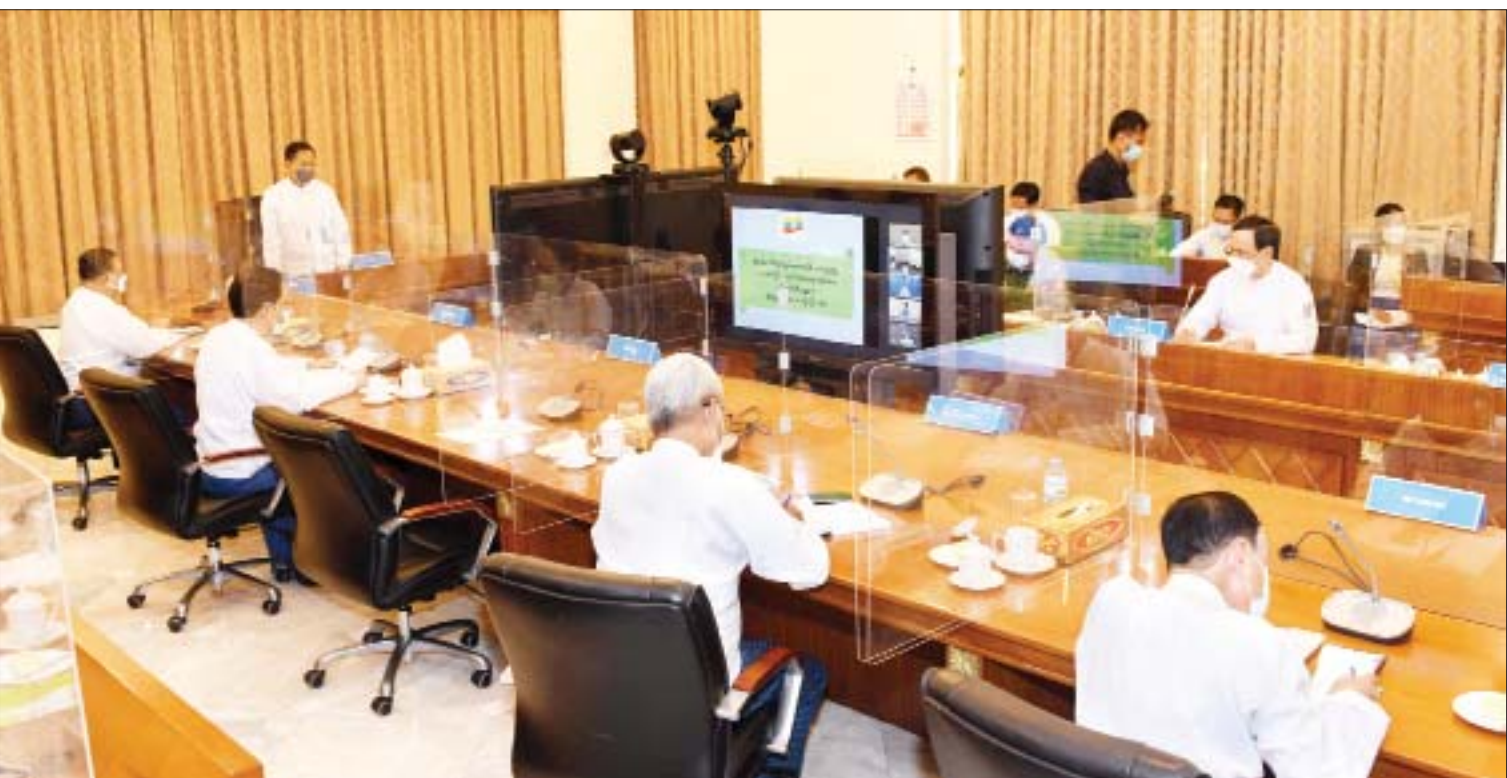
နိုင်ငံတော်စီမံအုပ်ချုပ်ရေးကောင်စီ ဒုတိယဥက္ကဋ္ဌ၊ ဒုတိယဝန်ကြီးချုပ် ဒုတိယဗိုလ်ချုပ်မှူးကြီး စိုးဝင်း (၇၄)နှစ်မြောက် လွတ်လပ်ရေးနေ့ ကျင်းပရေးဗဟိုကော်မတီ တတိယအကြိမ် ညှိနှိုင်းအစည်းအဝေးတွင် အမှာစကားပြောကြားစဉ်။

အစည်းအဝေးသို့ပြည်ထောင်စုဝန်ကြီးများဖြစ်ကြသည့် ဦးဝဏ္ဏမောင်လွင်၊ ဒုတိယဗိုလ်ချုပ်ကြီး ရာပြည့်၊ ဒေါက်တာ သက်ခိုင်ဝင်း၊ နေပြည်တော်ကောင်စီဥက္ကဋ္ဌ ဒေါက်တာမောင်မောင်နိုင်၊ ဒုတိယဝန်ကြီးများနှင့် တာဝန်ရှိသူများ တက်ရောက်ကြပြီး တာဝန်ရှိဖိတ်ကြားထားသူများက ဗီဒီယိုကွန်ဖရင့်ဖြင့် တက်ရောက်ကြသည်။ စာမျက်နှာ ၅ ကော်လံ ၁ သို့ ❖