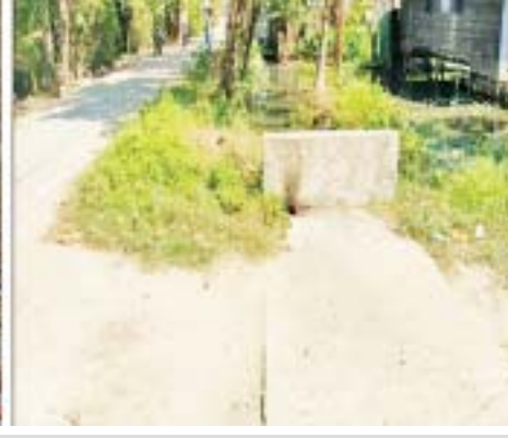
ရွှေပေါက်ကံမြို့သစ်ရှိ အမှတ်(၆) အခြေခံပညာ အထက်တန်းကျောင်းအနီးရှိ ရေမြောင်းအုတ်ခုံ အောက်ခြေ၌ ပေါက်ကွဲပြီး လက်လုပ်မိုင်းတစ်လုံးနှင့် မပေါက်ကွဲသေးသည့် တစ်လုံးတွေ့ရှိခဲ့မှု မှတ်တမ်းဓာတ်ပုံ။

နေပြည်တော် ဒီဇင်ဘာ ၁၇ NUG၊ CRPH အမည်ခံအကြမ်းဖက်အဖွဲ့များသည် အေးချမ်းစွာနေထိုင်သော ပြည်သူလူထုများနှင့် တရားဥပဒေစိုးမိုးရေးအတွက် ပိုင်းဝန်းဆောင်ရွက် နေသော အုပ်ချုပ်ရေးတာဝန်ရှိသူများအား ထိခိုက် ဒဏ်ရာရရှိစေရန် ရည်ရွယ်ချက်ဖြင့် အကြမ်းဖက် ဖောက်ခွဲရေးလုပ်ရပ်များကို အချို့နေရာများတွင် လုပ်ဆောင်လျက်ရှိသည့်အပြင် ကလေးသူငယ်များ၏ ပညာသင်ယူခွင့်ကိုဆုံးရှုံးစေရန်အတွက် ပညာ သင်ကြားရေးအတွက် အခြေခံအဆောက်အအုံများ ဖြစ်သည့် စာသင်ကျောင်းများကို လက်လုပ်ဗုံး၊ လက်လုပ်မိုင်းများဖြင့်ထောင်ကာ ဖောက်ခွဲခြင်း၊ ပစ်ခတ်ခြင်းများ ပြုလုပ်ဆောင်ရွက်လျက်ရှိသည်။