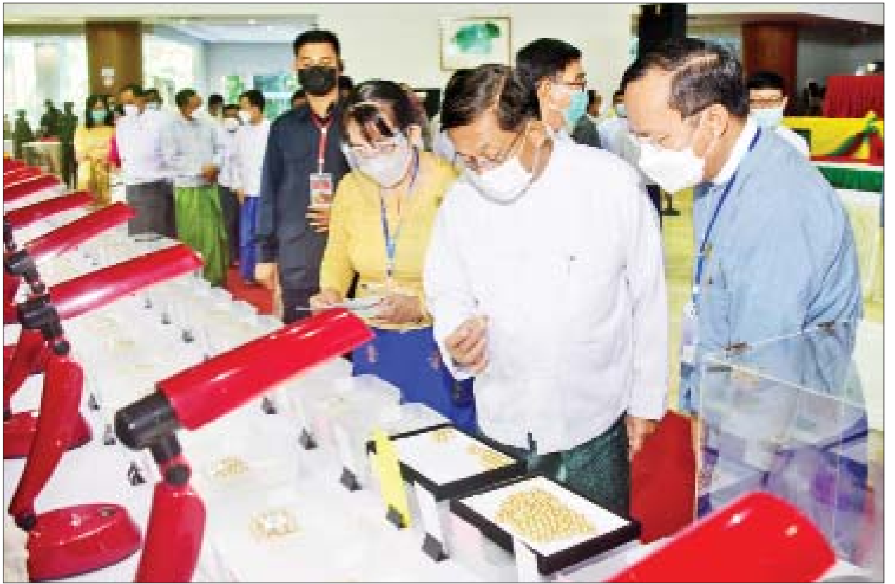
နိုင်ငံတော်စီမံအုပ်ချုပ်ရေးကောင်စီဥက္ကဋ္ဌ၊ နိုင်ငံတော်ဝန်ကြီးချုပ် ဗိုလ်ချုပ်မှူးကြီးမင်းအောင်လှိုင် ၂၀၂၁ ခုနှစ် ပုလဲအတွဲများနှင့် ကျောက်စိမ်းအတွဲများပြပွဲ၌ ရောင်းချရန် ခင်းကျင်းပြသထားသည့် ပုလဲအတွဲများကို ကြည့်ရှုစစ်ဆေးစဉ်။