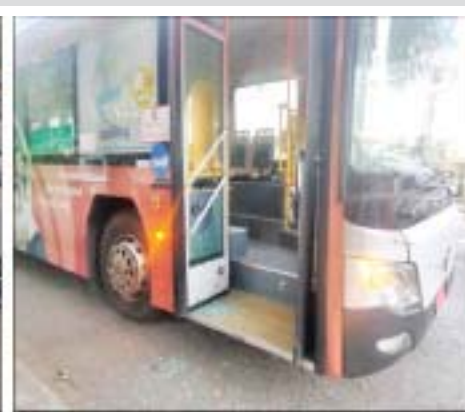
ကြည့်မြင်တိုင်မြို့နယ် အိုးဘိုရပ်ကွက်ရှိ အမှတ်(၆) အခြေခံပညာမူလတန်းကျောင်းခြံစည်းရိုး အနီး၌ လက်လုပ်မိုင်းတစ်လုံးပေါက်ကွဲ၍ ယာဉ် နှစ်စီးပျက်စီးခဲ့မှု မှတ်တမ်းဓာတ်ပုံ။

ထိုသို့အကြမ်းဖက်ဖောက်ခွဲရေး လုပ်ရပ်များ ပြုလုပ်ခဲ့ရာ ဒီဇင်ဘာ ၁၆ ရက် နံနက် ၁၀ နာရီခွဲ တွင် စစ်ကိုင်းတိုင်းဒေသကြီး ချောင်းဦးမြို့နယ် နတ်ရေကန်ကျေးရွာရှိ အခြေခံပညာအလယ်တန်း ကျောင်းရှေ့ခြံစည်းရိုးအုတ်တံတိုင်းအနီး၌ အကြမ်း ဖက်သူများက လက်လုပ်မိုင်းတစ်လုံးဖောက်ခွဲခဲ့ရာ ခြံစည်းရိုးအုတ်တံတိုင်း ပျက်စီးခဲ့ကြောင်း သိရသည်။ အလားတူ နံနက် ၁၁ နာရီ မိနစ် ၅၀ တွင် ရန်ကုန် တိုင်းဒေသကြီး မြောက်ဥက္ကလာပမြို့နယ် ရွှေပေါက် ကံမြို့သစ် (၁၄) ရပ်ကွက်ရှိ အမှတ်(၆) အခြေခံပညာ အထက်တန်းကျောင်းအနီး ပေါက်ကွဲမှုဖြစ်ပွား ကြောင်း သတင်းအရ လုံခြုံရေးတပ်ဖွဲ့ဝင်များက သွားရောက်စစ်ဆေးခဲ့ရာ ကျောင်းအနီးရှိရေမြောင်း အုတ်ခုံအောက်၌ ပေါက်ကွဲထားသည့် PVC ပိုက်နှင့် ဓာတ်ခဲအပိုင်းအစများ တွေ့ရှိရပြီး မပေါက်ကွဲသေး သည့် လက်လုပ်မိုင်းတစ်လုံးအား ထပ်မံတွေ့ရှိရ သဖြင့် သက်မဲ့ပြုလုပ်သိမ်းဆည်းခဲ့သည်။