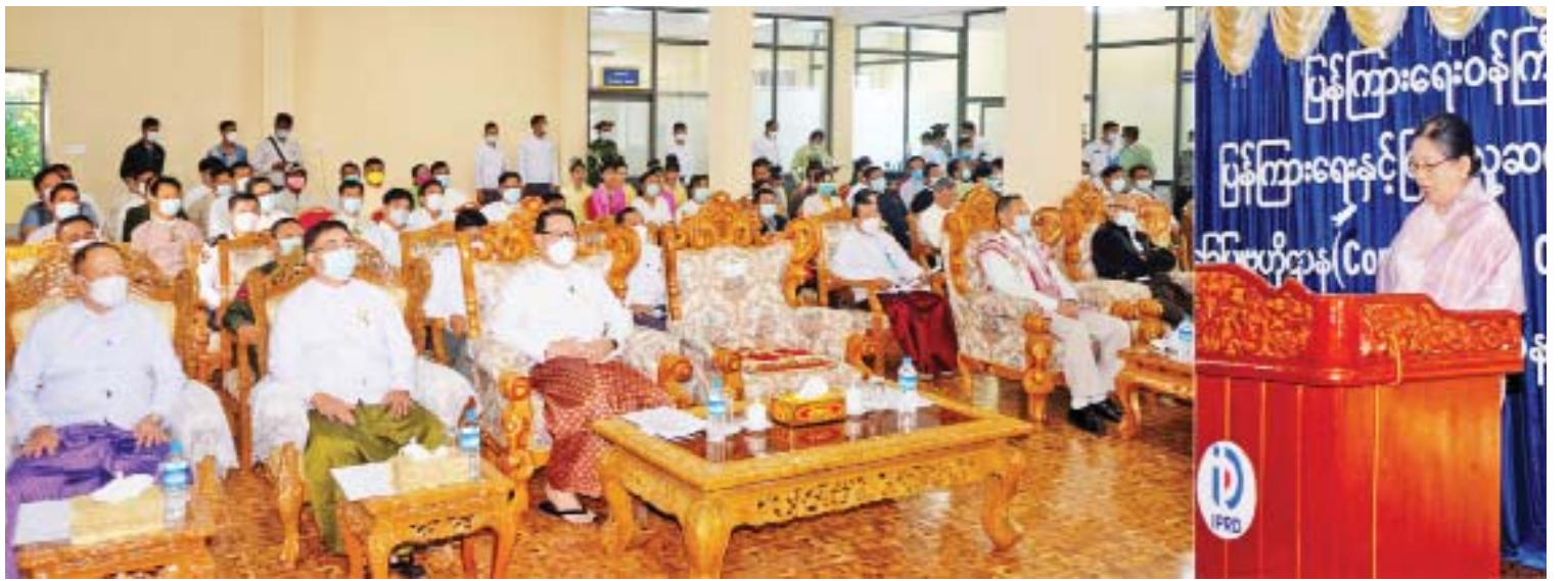
နိုင်ငံတော်စီမံအုပ်ချုပ်ရေးကောင်စီအဖွဲ့ဝင် ဒေါ်အေးနုစိန် သံတွဲခရိုင် လူထုအခြေပြုဗဟိုဌာန အဆောက်အအုံသစ် ဖွင့်ပွဲအခမ်းအနားတွင် အမှာစကားပြောကြားစဉ်။

သံတွဲ ဒီဇင်ဘာ ၁၇ (၄၇)နှစ်မြောက် ရခိုင်ပြည်နယ်နေ့ကို ဂုဏ်ပြုသောအားဖြင့် ပြန်ကြားရေး ဝန်ကြီးဌာန ပြန်ကြားရေးနှင့် ပြည်သူ့ ဆက်ဆံရေးဦးစီးဌာနက သံတွဲမြို့၌ တည်ဆောက်ပြီးစီးခဲ့သည့် လူထုအခြေ ပြုဗဟိုဌာန (Community Centre) အဆောက်အအုံသစ်ဖွင့်လှစ်ပွဲအခမ်းအနား ကို ယနေ့နံနက် ၁၀ နာရီတွင် အဆိုပါ အဆောက်အအုံသစ်ရှေ့၌ ကျင်းပရာ နိုင်ငံတော်စီမံအုပ်ချုပ်ရေး ကောင်စီအဖွဲ့ ဝင်များဖြစ်ကြသော မန်းငြိမ်းမောင်၊ ဒေါ်အေးနုစိန်နှင့် ဦးမောင်မောင်၊ ပြည်ထောင်စုဝန်ကြီး ဦးမောင်မောင်အုန်း၊ ဒေါက်တာညွန့်ဖေ၊ ဦးမင်းသိန်း၊ ဒုတိယ ဝန်ကြီး ဦးဇော်အေးမောင်၊ ရခိုင်ပြည်နယ် အစိုးရအဖွဲ့ဝင် ဝန်ကြီးများ တက်ရောက် ကြသည်။