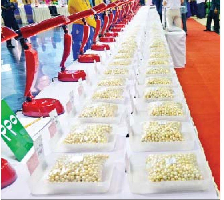
၂၀၂၁ ခုနှစ် ပုလဲအတွဲများနှင့် ကျောက်စိမ်းအတွဲများပြပွဲ၌ ရောင်းချရန် ခင်းကျင်းပြသထားသည့် ပုလဲအတွဲများကို တွေ့ရစဉ်။