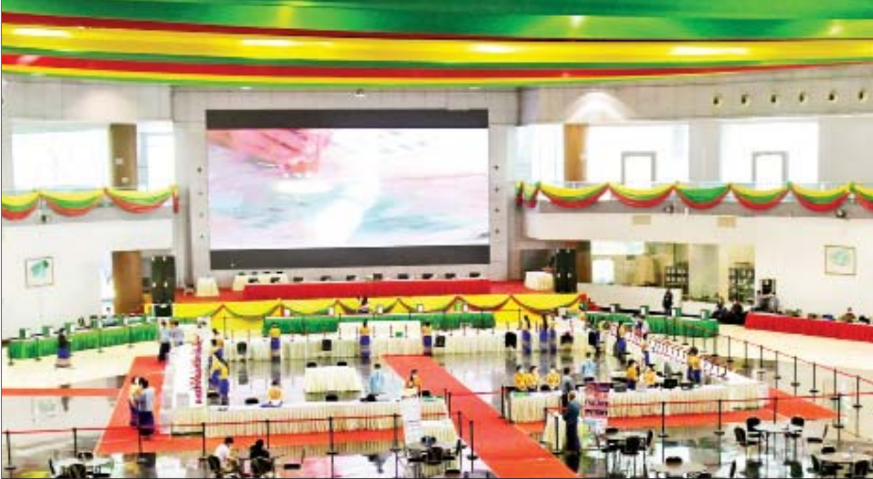
၂၀၂၁ ခုနှစ် ပုလဲအတွဲများနှင့် ကျောက်စိမ်းအတွဲများ ပြပွဲကျင်းပစဉ်။

ယခုပြပွဲတွင်ရောင်းချမည့် ပုလဲအတွဲများအတွက် အနိမ့်ဆုံးအခြေခံ ဈေးမှာ အမေရိကန်ဒေါ်လာ ၁၀၀၀ ဖြစ်ပြီး ကျောက်စိမ်းအတွဲများ အတွက် သတ်မှတ်ထားသည့် အနိမ့်ဆုံးအခြေခံဈေးမှာ ယူရိုငွေ ၅၀၀၀ ဖြစ်ကြောင်း၊ ပုလဲအတွဲများကို ဒီဇင်ဘာ ၁၈ ရက်နှင့် ၁၉ ရက်တို့တွင် အိတ်ဖွင့်တင်ဒါစနစ်ဖြင့် ရောင်းချပေးသွားမည်ဖြစ်ပြီး ကျောက်စိမ်း