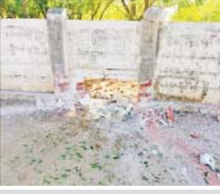
ချောင်းဦးမြို့နယ် နတ်ရေကန်ကျေးရွာရှိ အခြေခံပညာအလယ်တန်းကျောင်းရှေ့ခြံစည်းရိုးအုတ်တံတိုင်း အနီး၌ လက်လုပ်မိုင်းတစ်လုံးပေါက်ကွဲမှုကြောင့် ပျက်စီးခဲ့မှု မှတ်တမ်းဓာတ်ပုံ။