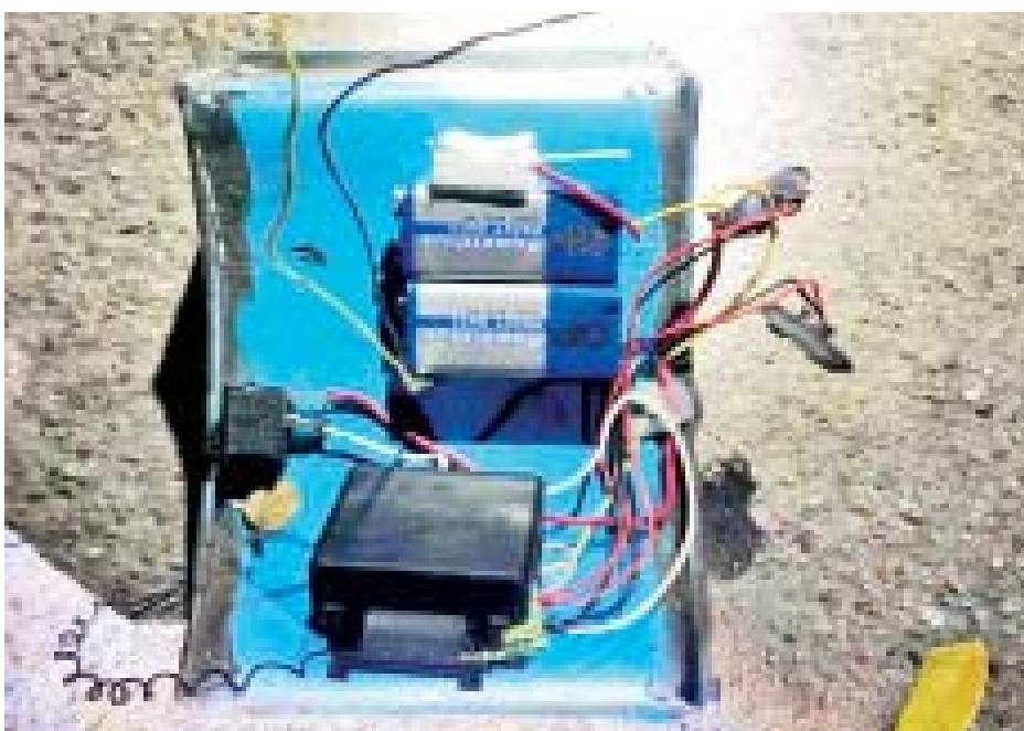
လှိုင်တက္ကသိုလ်ခြံစည်းရိုးအုတ်တံတိုင်းအနီး အကြမ်းဖက်သူများ ထောင်ထားသည့် လက်လုပ် မိုင်းတစ်လုံး၏ မှတ်တမ်းဓာတ်ပုံ။

လက်လုပ်မိုင်းတစ်လုံး တွေ့ရှိ အလားတူ ညနေ ၅ နာရီခွဲတွင် လှိုင်မြို့နယ် (၁၂) ရပ်ကွက်ရှိ လှိုင်တက္ကသိုလ် ခြံစည်းရိုးအုတ်တံတိုင်း ဝင်ပေါက်အနီး၌ မသင်္ကာဖွယ်အထုပ်တစ်ထုပ် တွေ့ရှိကြောင်း သတင်းအရ လုံခြုံရေးတပ်ဖွဲ့ဝင်များ က သွားရောက်စစ်ဆေးရာ အဆိုပါအထုပ်အတွင်းမှ ဓာတ်ခဲ နှစ်လုံး၊ Wifi လွှင့်စက် တစ်ခု၊ ခလုတ် တစ်ခု တို့ဖြင့် ချိတ်ဆက်ထားသည့် PVC ပိုက်ဖြင့် ပြုလုပ်ထားသည့် လက်လုပ်မိုင်းတစ်လုံးအား တွေ့ရှိရသဖြင့် သက်မဲ့ပြုလုပ်သိမ်းဆည်းခဲ့ကြောင်း သိရသည်။ အထက်ပါဖြစ်စဉ်များမှ အကြမ်းဖက်မှုလုပ်ရပ် များကို ကျူးလွန်သူများအား ဥပဒေနှင့်အညီ ထိရောက်စွာအရေးယူနိုင်ရေးလုံခြုံရေးတပ်ဖွဲ့ဝင်များ က စုံစမ်းဖော်ထုတ်လျက်ရှိကြောင်း သိရသည်။