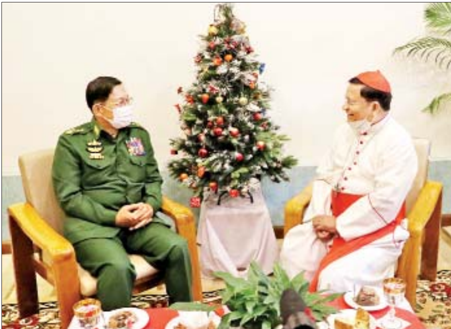
နိုင်ငံတော်စီမံအုပ်ချုပ်ရေးကောင်စီဥက္ကဋ္ဌ၊ နိုင်ငံတော်ဝန်ကြီးချုပ် ဗိုလ်ချုပ်မှူးကြီးမင်းအောင်လှိုင် နှင့် ရန်ကုန်ကက်သလစ်ဂိုဏ်းချုပ်သာသနာ ဂိုဏ်းချုပ်ဆရာတော်ကြီး ကာဒီနယ်ချားလ်စ်ဘိုတို့ တွေ့ဆုံ ဆွေးနွေးစဉ်။

☆ ရှေးဟောင်းမှ မြို့တော်ဝန်၊ ရန်ကုန်ကက်သလစ် ဂိုဏ်းချုပ်သာသနာ ဂိုဏ်းချုပ် ဆရာတော်ကြီး ကာဒီနယ် ချားလ်စ်ဘိုနှင့် ရန်ကုန်တိုင်းဒေသ ကြီးအတွင်းရှိ ကက်သလစ်ဆရာ တော်များ၊ ရဟန်းတော်များ၊ ကက်သလစ် သီလရှင်များ၊ ကက်သလစ် လူငယ်အဖွဲ့များနှင့် ခရစ်ယာန်ဘာသာဝင် ရုပ်မိရပ်ဖ များ တက်ရောက်ကြသည်။ အမြင်ချင်းဖလှယ် ဆွေးနွေး ဦးစွာ နိုင်ငံတော်စီမံအုပ်ချုပ်ရေး ကောင်စီဥက္ကဋ္ဌ၊ နိုင်ငံတော်ဝန်ကြီး ချုပ်နှင့် အဖွဲ့ဝင်များသည် ကက်သလစ် ဆရာတော်ကျောင်း တိုက်ခန်းမသို့ ရောက်ရှိကြရာ ရန်ကုန်ကက်သလစ် ဂိုဏ်းချုပ် သာသနာ၊ ဂိုဏ်းချုပ်ဆရာတော် ကြီး ကာဒီနယ် ချားလ်စ်ဘိုနှင့် သင်းအုပ်ဆရာကြီးများက ကြိုဆို နှုတ်ဆက်ကြသည်။ ယင်းနောက် နိုင်ငံတော်စီမံအုပ်ချုပ်ရေးကောင်စီ ဥက္ကဋ္ဌ၊ နိုင်ငံတော်ဝန်ကြီးချုပ်နှင့် ရန်ကုန်ကက်သလစ် ဂိုဏ်းချုပ် သာသနာ၊ ဂိုဏ်းချုပ်ဆရာတော်