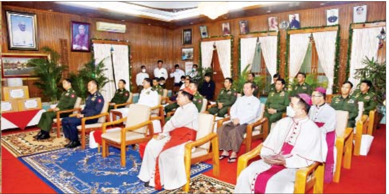
နိုင်ငံတော်စီမံအုပ်ချုပ်ရေးကောင်စီဥက္ကဋ္ဌ၊ နိုင်ငံတော်ဝန်ကြီးချုပ် ဗိုလ်ချုပ်မှူးကြီးမင်းအောင်လှိုင် ၂၀၂၁ ခုနှစ် ခရစ္စမတ်နေ့အထိမ်းအမှတ် စုပေါင်းဂုဏ်ပြုဆုတောင်းပွဲ အခမ်းအနားတွင် ခရစ္စမတ်နှုတ်ခွန်းဆက်စကား ပြောကြားစဉ်။

☆ ရှေးဟောင်းမှ မြို့တော်ဝန်၊ ရန်ကုန်ကက်သလစ် ဂိုဏ်းချုပ်သာသနာ ဂိုဏ်းချုပ် ဆရာတော်ကြီး ကာဒီနယ် ချားလ်စ်ဘိုနှင့် ရန်ကုန်တိုင်းဒေသ ကြီးအတွင်းရှိ ကက်သလစ်ဆရာ တော်များ၊ ရဟန်းတော်များ၊ ကက်သလစ် သီလရှင်များ၊ ကက်သလစ် လူငယ်အဖွဲ့များနှင့် ခရစ်ယာန်ဘာသာဝင် ရုပ်မိရပ်ဖ များ တက်ရောက်ကြသည်။ အမြင်ချင်းဖလှယ် ဆွေးနွေး ဦးစွာ နိုင်ငံတော်စီမံအုပ်ချုပ်ရေး ကောင်စီဥက္ကဋ္ဌ၊ နိုင်ငံတော်ဝန်ကြီး ချုပ်နှင့် အဖွဲ့ဝင်များသည် ကက်သလစ် ဆရာတော်ကျောင်း တိုက်ခန်းမသို့ ရောက်ရှိကြရာ ရန်ကုန်ကက်သလစ် ဂိုဏ်းချုပ် သာသနာ၊ ဂိုဏ်းချုပ်ဆရာတော် ကြီး ကာဒီနယ် ချားလ်စ်ဘိုနှင့် သင်းအုပ်ဆရာကြီးများက ကြိုဆို နှုတ်ဆက်ကြသည်။ ယင်းနောက် နိုင်ငံတော်စီမံအုပ်ချုပ်ရေးကောင်စီ ဥက္ကဋ္ဌ၊ နိုင်ငံတော်ဝန်ကြီးချုပ်နှင့် ရန်ကုန်ကက်သလစ် ဂိုဏ်းချုပ် သာသနာ၊ ဂိုဏ်းချုပ်ဆရာတော်