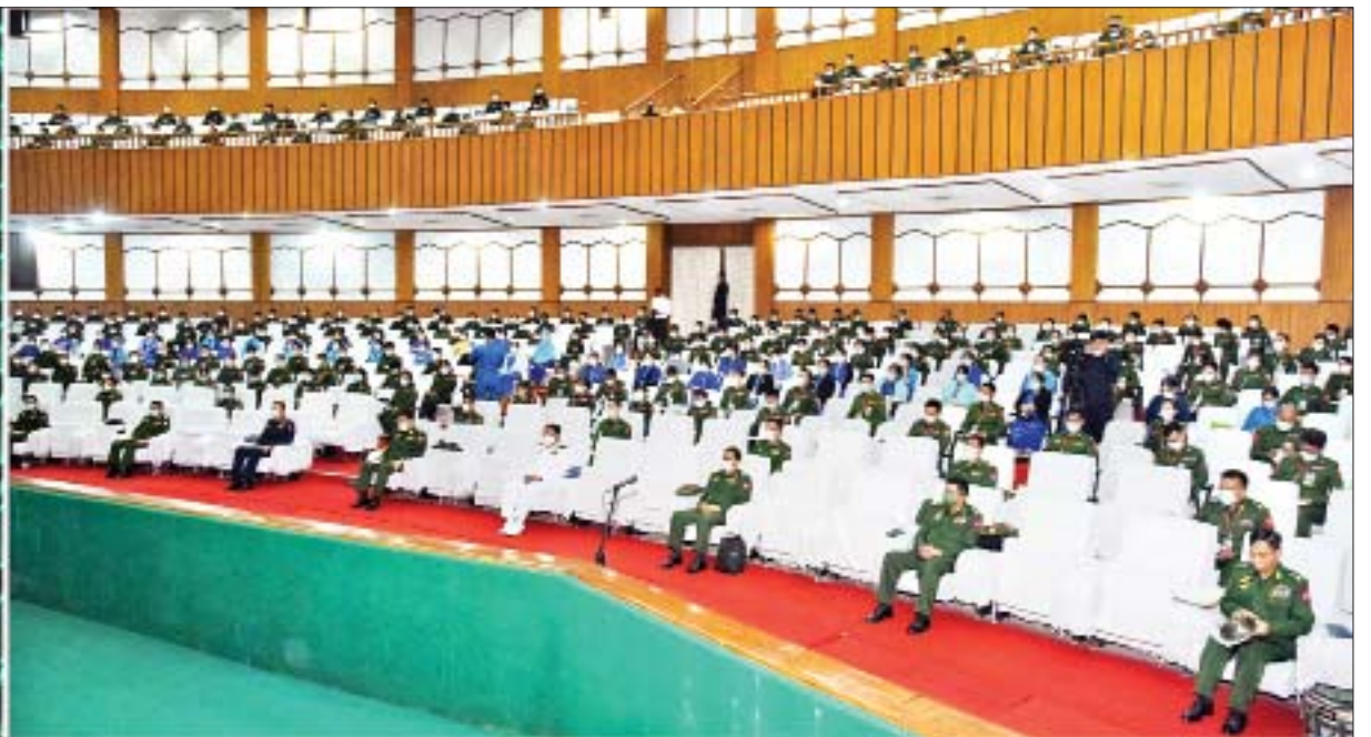
နိုင်ငံတော်စီမံအုပ်ချုပ်ရေးကောင်စီဥက္ကဋ္ဌ၊ တပ်မတော်ကာကွယ်ရေးဦးစီးချုပ် ဗိုလ်ချုပ်မှူးကြီး မင်းအောင်လှိုင် တပ်မတော်ဆေးတက္ကသိုလ်၊ တပ်မတော်သူနာပြုနှင့် ဆေးဘက်ပညာတက္ကသိုလ်၊ တပ်မတော် (ကြည်း) ဗိုလ်သင်တန်းကျောင်း(မှော်ဘီ)တို့မှ ကျောင်းအုပ်ကြီးများ၊ နည်းပြအရာရှိကြီးများ၊ ကထိကအရာရှိကြီးများ၊ ဆရာ ဆရာမကြီးများနှင့် သန္ဓေအရာရှိများအား တွေ့ဆုံအမှာစကားပြောကြားစဉ်။