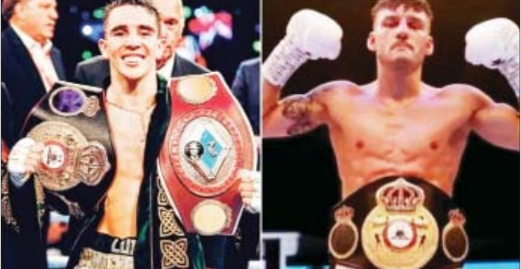
နောက်ဆုံးမှာတော့ လက်ရှိဒဗလျူဘီအေ ဇာတိမြို့ နေ့တင်ဟမ်မှာ ထိုးသတ်ဖို့ ဖယ်သာဝိတ်ခါးပတ်ချန်ပီယံ လိဂျီဂိုဒ်နဲ့ သဘောတူညီခဲ့တာဖြစ်ပါတယ်။

မိုက်ကယ်ကွန်လန်ဟာ ကနဦးက လိဂျီဂိုဒ်နဲ့ပွဲစဉ်ကို နယူးယောက်၊ မန်ချက်စတာနဲ့ ဘဲလ်ဖက် စတဲ့နေရာတွေ မှာ ယှဉ်ပြိုင်ထိုးသတ်ဖို့ စီစဉ်ခဲ့ပေမယ့်