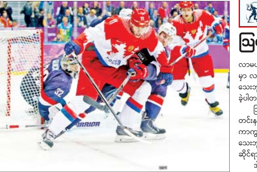
ငွေကြယ် - ရေးသားသည်

ဒါ့အပြင် ဟော်ကီပွဲစဉ်ပေါင်း ၅၀ ကို ရွှေ့ဆိုင်းထားတဲ့အပြင် အိုလံပစ်ပြိုင်ပွဲမှာလည်း ပါဝင်ဖို့မဖြစ်နိုင်တော့ဘူးလို့ အမေရိကန် အမျိုးသားဟော်ကီအဖွဲ့ချုပ်မှ တာဝန်ရှိသူ ဂယ်ရီဘက်မန်းက ပြောကြားခဲ့ပါတယ်။ ပေကျင်းဆောင်းရာသီ အိုလံပစ်ပြိုင်ပွဲကိုတော့ ၂၀၂၂ ခုနှစ် ဖေဖော်ဝါရီ ၄ ရက်မှာ ကျင်းပသွားမှာ ဖြစ်ပါတယ်။