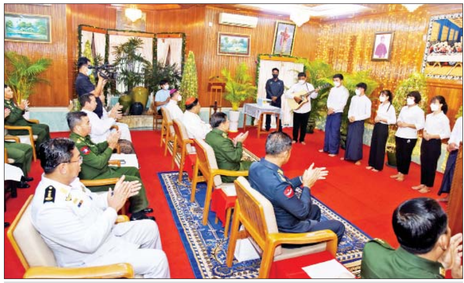
၂၀၂၁ ခုနှစ် ခရစ္စမတ်အထိမ်းအမှတ် စုပေါင်းဂုဏ်ပြုဆုတောင်းပွဲတွင် ကက်သလစ်ဆရာတော် ကျောင်းတိုက်မိသားစုက ခရစ္စမတ် Carol သီချင်းများဖြင့် သီဆိုဖျော်ဖြေကြစဉ်။

မည်သို့မျှ ရှောင်လွှဲ၍ မရသည့် အခြေအနေ ဖြစ်ပေါ်လာသည့် အတွက် နိုင်ငံတော်၏တာဝန်များ ကို တပ်မတော်ကထမ်းဆောင်ခဲ့ ရခြင်းဖြစ်ကြောင်း၊ ယင်းနောက် နိုင်ငံတော်စီမံ အုပ်ချုပ်ရေး ကောင်စီကိုဖွဲ့စည်းပြီး ရှေ့လုပ်ငန်း စဉ်(၅)ရပ်ကို ချမှတ်၍ နိုင်ငံတော် အေးချမ်းသာယာရေး၊ ဖွံ့ဖြိုး တိုးတက်ရေးအတွက် ဦးတည် ဆောင်ရွက်လျက်ရှိကြောင်း။ မေတ္တာရပ်ခံတိုက်တွန်း နိုင်ငံတော် အေးချမ်းသာယာ ဖွံ့ဖြိုးရေးအတွက် နိုင်ငံတော် အစိုးရ၊ တပ်မတော်နှင့် ဌာနဆိုင်ရာ အဖွဲ့အစည်းများ၏ ကြိုးပမ်း ဆောင်ရွက်မှုများအပြင် ဘာသာ ရေး၊ လူမှုရေးအဖွဲ့အစည်းများနှင့် ပြည်သူလူထုတို့ကလည်း ကဏ္ဍ အသီးသီးမှ ပူးပေါင်းပါဝင် ဆောင်ရွက်ကြရန် လိုအပ်မည်ဖြစ် ကြောင်း၊ ငြိမ်းချမ်းလိုသည့် ဖွံ့ဖြိုး တိုးတက်စေလိုသည့် စိတ်ဆန္ဒရှိ ရန် အဓိကအရေးကြီးပါကြောင်း၊ တိုင်းပြည်သာယာဝပြောရေးနှင့် စားနပ်ရိက္ခာ ပေါများရေးသည် လည်း အဓိကကျသည့်အတွက်