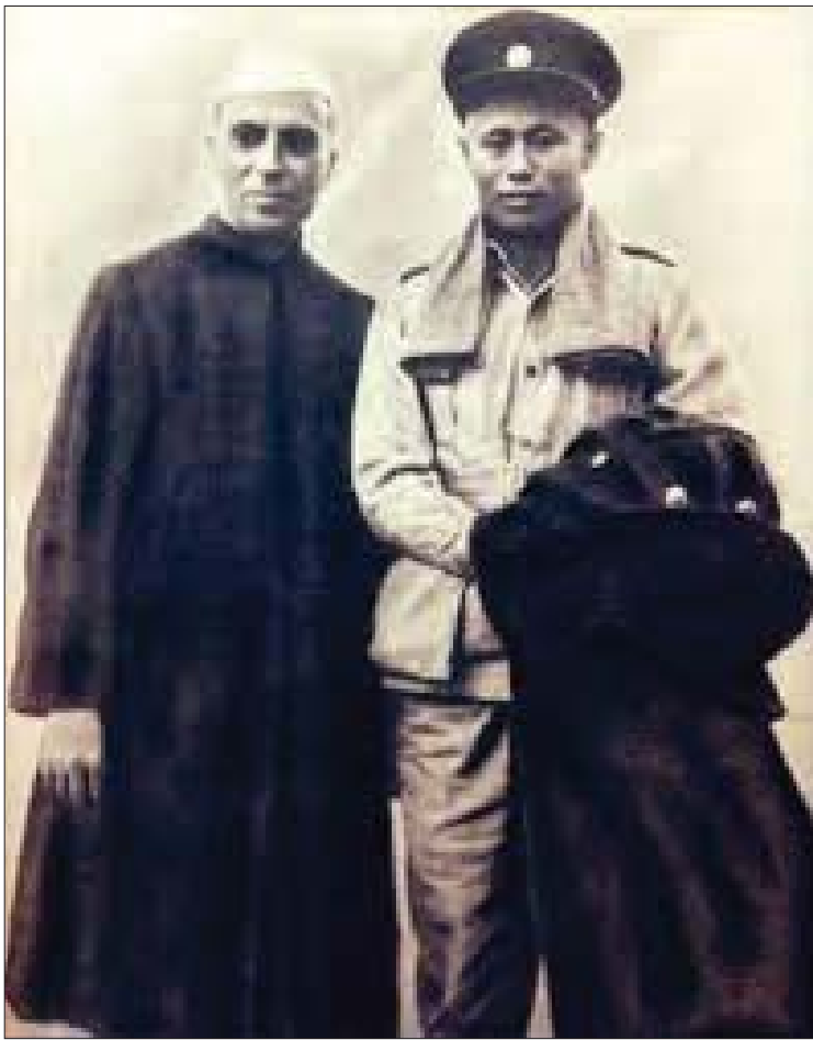
ဗိုလ်ချုပ်အောင်ဆန်းနှင့် အိန္ဒိယနိုင်ငံခေါင်းဆောင် ဂျဝါဟာလာပဏ္ဍစ်နေရူး။

အိန္ဒိယပြည်ကြီးက လွတ်လပ်ရေးရပြီးနောက် ပါကစ္စတန်၏ခွဲထွက်မှု၊