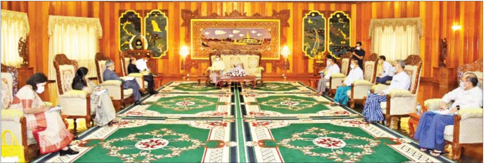
နိုင်ငံတော်စီမံအုပ်ချုပ်ရေးကောင်စီဥက္ကဋ္ဌ၊ နိုင်ငံတော်ဝန်ကြီးချုပ် ဗိုလ်ချုပ်မှူးကြီးမင်းအောင်လှိုင် အိန္ဒိယနိုင်ငံ ပြည်ပရေးရာဝန်ကြီးဌာန နိုင်ငံခြားရေးအတွင်းဝန် ရှုရီ ဟာရှ် ဗားဒ်ဟန် ရှုရင်ဂလာအား လက်ခံတွေ့ဆုံစဉ်။