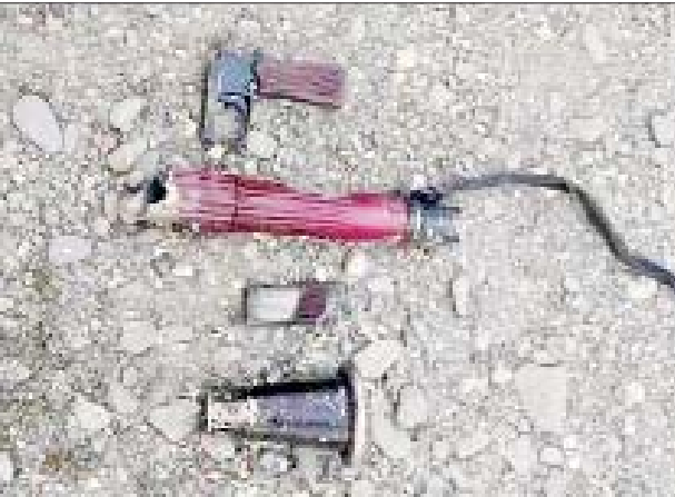
အကြမ်းဖက်သမားများထံမှ သိမ်းဆည်းရမိသည့် အာပီဂျီ၊ လက်လုပ်မိုင်း၊ လျှပ်စစ်ဒီတိုနေတာ၊ မီးရှို့စနက်တံနှင့် ယမ်းကြိုးခွေများကို တွေ့ရစဉ်။