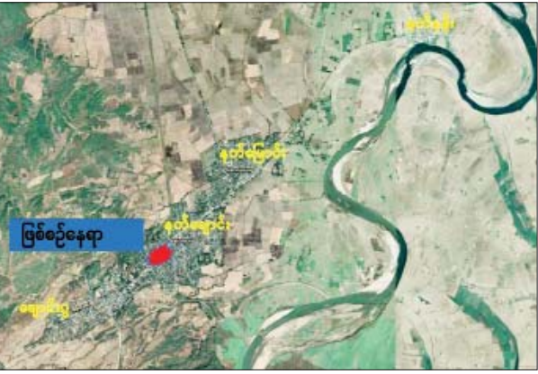
စစ်ကိုင်းတိုင်းဒေသကြီး ကလေးမြို့နယ် နတ်ချောင်းကျေးရွာ၌ လုံခြုံရေးဆောင်ရွက်နေသော တပ်ဖွဲ့ဝင်များအား အကြမ်းဖက်သမား များက လာရောက်ပစ်ခတ်တိုက်ခိုက်သည့် ဖြစ်စဉ်နေရာပြပုံ။

ပါ) လေးခွေတို့ကို သိမ်းဆည်းရမိခဲ့သည်။ အကြမ်းဖက်သမားများအနေဖြင့် ကျေးရွာ အချို့အတွင်း ဝင်ရောက်၍ အကြမ်းဖက်လုပ်ရပ် များ လုပ်ဆောင်နိုင်ခြင်းမရှိစေရန်အတွက် လုံခြုံရေး တပ်ဖွဲ့များက နယ်မြေလုံခြုံရေးလုပ်ငန်းများ တိုးမြှင့် ဆောင်ရွက်လျက်ရှိပြီး တာဝန်သိပြည်သူများအနေ ဖြင့်လည်း ပူးပေါင်းပါဝင်ကြရန် သက်ဆိုင်ရာက သတင်းထုတ်ပြန်ထားသည်။ သတင်းစဉ်