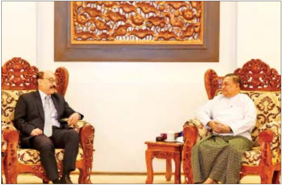
အိန္ဒိယပြည်ပရေးရာဝန်ကြီးဌာနမှ တွဲဖက်အတွင်းဝန် များ တက်ရောက်ခဲ့ကြသည်။ ရှရီမတီ စမိတာ ပန်နှင့် အိန္ဒိယနိုင်ငံမှ တာဝန်ရှိပုဂ္ဂိုလ် သတင်းစဉ်

တွေ့ဆုံပွဲသို့ နိုင်ငံခြားရေးဝန်ကြီးဌာန ဒုတိယ ဝန်ကြီးဦးကျော်မျိုးထွဋ်၊ အမြဲတမ်းအတွင်းဝန် ဦးချမ်းအေးနှင့် နိုင်ငံခြားရေးဝန်ကြီးဌာနမှ အဆင့်မြင့် အရာရှိကြီးများ တက်ရောက်ခဲ့ကြပြီး အိန္ဒိယ နိုင်ငံခြားရေးအတွင်းဝန်နှင့်အတူ မြန်မာနိုင်ငံဆိုင်ရာ အိန္ဒိယနိုင်ငံ သံအမတ်ကြီး ရှရီ ဆော်ရက်(ဘ်)ကူမား၊