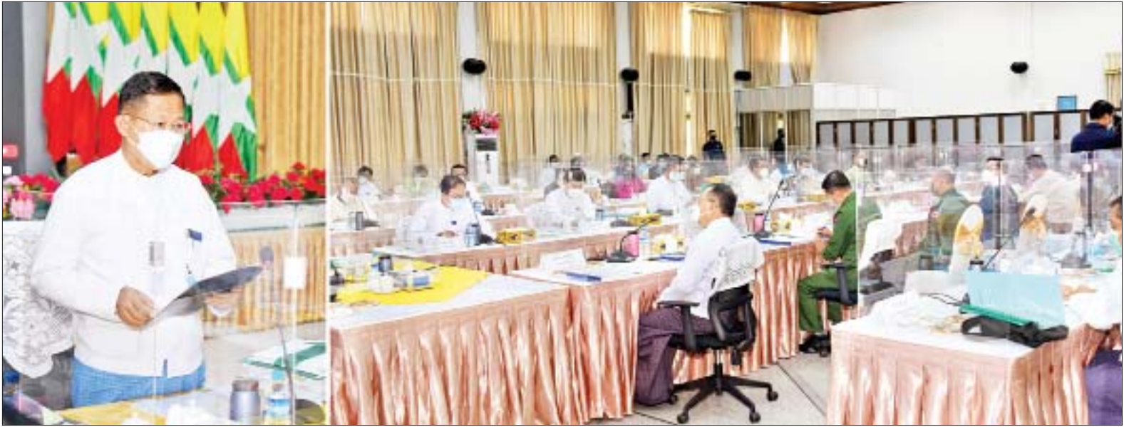
နိုင်ငံတော်စီမံအုပ်ချုပ်ရေးကောင်စီ ဒုတိယဥက္ကဋ္ဌ၊ ဒုတိယဝန်ကြီးချုပ် ဒုတိယဗိုလ်ချုပ်မှူးကြီးစိုးဝင်း တရားမဝင်ကုန်သွယ်မှုတိုက်ဖျက်ရေးဦးဆောင်ကော်မတီ၏ (၁/၂၀၂၁) အစည်းအဝေးတွင် အမှာစကားပြောကြားစဉ်။

နေပြည်တော် ဒီဇင်ဘာ ၂၃ တရားမဝင်ကုန်သွယ်မှုတိုက်ဖျက်ရေးဦးဆောင်ကော်မတီ၏ (၁/၂၀၂၁) အစည်းအဝေးကို ယနေ့မွန်းလွဲပိုင်းတွင် နေပြည်တော်ရှိ စီးပွားရေးနှင့် ကူးသန်းရောင်းဝယ်ရေးဝန်ကြီးဌာန အစည်းအဝေးခန်းမ၌ ကျင်းပရာ တရားမဝင်ကုန်သွယ်မှုတိုက်ဖျက်ရေးဦးဆောင်ကော်မတီ ဥက္ကဋ္ဌ နိုင်ငံတော်စီမံအုပ်ချုပ်ရေးကောင်စီ ဒုတိယဥက္ကဋ္ဌ၊ ဒုတိယဝန်ကြီးချုပ် ဒုတိယဗိုလ်ချုပ်မှူးကြီးစိုးဝင်း တက်ရောက်အမှာစကားပြောကြားသည်။ အစည်းအဝေးသို့ တရားမဝင်ကုန်သွယ်မှု တိုက်ဖျက်ရေးဦးဆောင်ကော်မတီ ဒုတိယဥက္ကဋ္ဌ စာမျက်နှာ ၇ ကော်လံ ၁ သို့