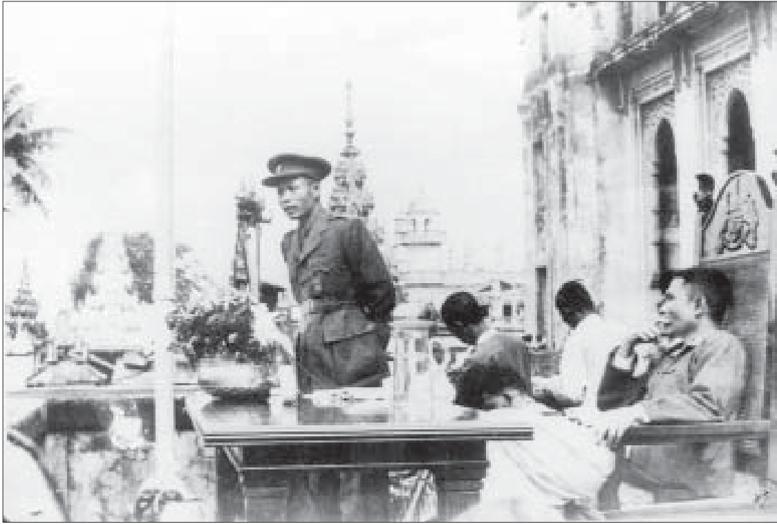
၁၉၄၇ ခုနှစ် ဇူလိုင် ၁၃ ရက်တွင် ရန်ကုန်မြို့တော်ခန်းမ၌ ဗိုလ်ချုပ်အောင်ဆန်း နောက်ဆုံးမိန့်ခွန်းပြောကြားစဉ်။

သို့ရာတွင် နေရူးသည် တစ်ဖက်က လည်းမားသားအိန္ဒိယ၏ကြီးလေးသော တာဝန်များကို ကြိုတင်၍ ခန့်မှန်း တွက်ချက်ထားခဲ့သည်။ သမီးဖြစ်သူ အင်ဒီရာဂန္ဒီထံ ထောင်တွင်းမှ ရေးသား ပေးပို့ခဲ့သည့် ‘သမီးထံသို့ပေးစာများ’ ထဲတွင် ‘လွတ်လပ်ရေးကို ဖေဖေတို့ အမှန်တကယ်လိုချင်တယ်။ ဒါပေမဲ့ လွတ်လပ်ရုံနဲ့မပြီးသေးဘူး။ အမိနိုင်ငံ မှာ ရှိနေတဲ့ ဖုန်မှုန့်အညစ်အကြေးတွေ၊ ဆင်းရဲငတ်ပြတ်မှုတွေ၊ ဒုက္ခတွေကို ဖယ်ရှားပစ်နိုင်ဖို့ လိုသေးတယ်။ ပြီးတော့ လူတွေရဲ့စိတ်ဓာတ်မြင့်မား လာအောင်လုပ်ရဦးမယ်။ အစွမ်းကုန် ဆောင်ရွက်ဖို့လိုတယ်။ ပူးပေါင်း ဆောင်ရွက်စရာတွေလည်း ရှိတယ်။ တိုင်းသူပြည်သားတွေရဲ့ ခံယူချက် မြင့်မားမလာရင် လုပ်စွမ်းနိုင်မှာ မဟုတ်ဘူး။ အခုလိုလုပ်ဖို့ရာ တာဝန် ကြီးလှတယ်။ အချိန်တွေ အများအပြား လိုမယ်။ အနည်းဆုံး အစပြုကြိုးစား ပြင်ဆင်ထားဖို့တော့ လိုလိမ့်မယ်သမီး’ ဟု ရေးသားခဲ့သည်။