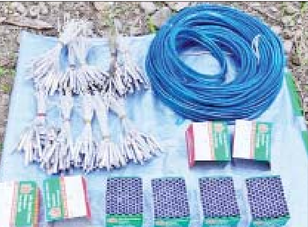
အကြမ်းဖက်သမားများထံမှ သိမ်းဆည်းရမိသည့် အာပီဂျီ၊ လက်လုပ်မိုင်း၊ လျှပ်စစ်ဒီတိုနေတာ၊ မီးရှို့စနက်တံနှင့် ယမ်းကြိုးခွေများကို တွေ့ရစဉ်။