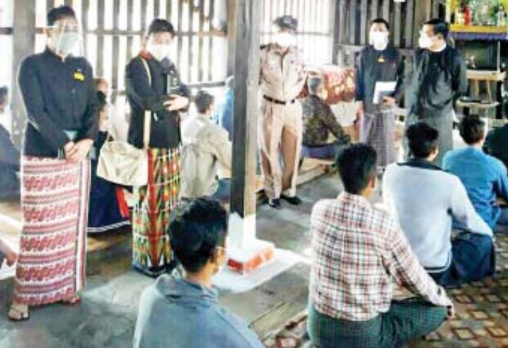
စောင့်ရှောက်မှုအခြေအနေနှင့် အသက် ဖြည့်ဆည်းဆောင်ရွက်ပေးရန် အကျဉ်းမွေးဝမ်းကျောင်းအတတ်ပညာ သင်ကြား ထောင် တာဝန်ရှိသူများအား လမ်းညွှန်မှုအခြေအနေများကို ကြည့်ရှုစစ်ဆေး မှာကြားခဲ့ကြောင်း သိရသည်။ မြို့နယ်(ပြန်/ဆက်)