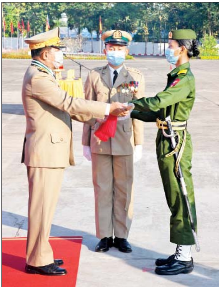
နိုင်ငံတော်စီမံအုပ်ချုပ်ရေးကောင်စီဥက္ကဋ္ဌ၊ တပ်မတော်ကာကွယ်ရေးဦးစီးချုပ် ဗိုလ်ချုပ်မှူးကြီး မဟာသရေစည်သူ မင်းအောင်လှိုင် တပ်မတော်သူနာပြုနှင့် ဆေးဘက်ပညာတက္ကသိုလ် အမျိုးသမီးသူနာပြုနှင့် ဆေးဘက်ပညာသိပ္ပံဘွဲ့သင်တန်း အမှတ်စဉ်(၆)မှ အကောင်းဆုံးသင်တန်းသူဆု ရရှိသူ သင်တန်းသူ သဗ္ဗာထွေး အား ဆုပေးအပ်ချီးမြှင့်စဉ်။

ထိရောက်တွင်ကျယ်စွာ အသုံးပြုလာယနေ့ခေတ် နိုင်ငံတကာဆေးပညာနယ်ပယ်တွင် Telemedicine နည်းပညာကို စစ်မြေပြင်ဆေးပညာ(Military Medicine)အဖြစ် ထိရောက်တွင်ကျယ်စွာ အသုံးပြုလာသည်ကို တွေ့ရှိရကြောင်း၊ Telemedicine ဆိုသည်မှာ ရုပ်သံ