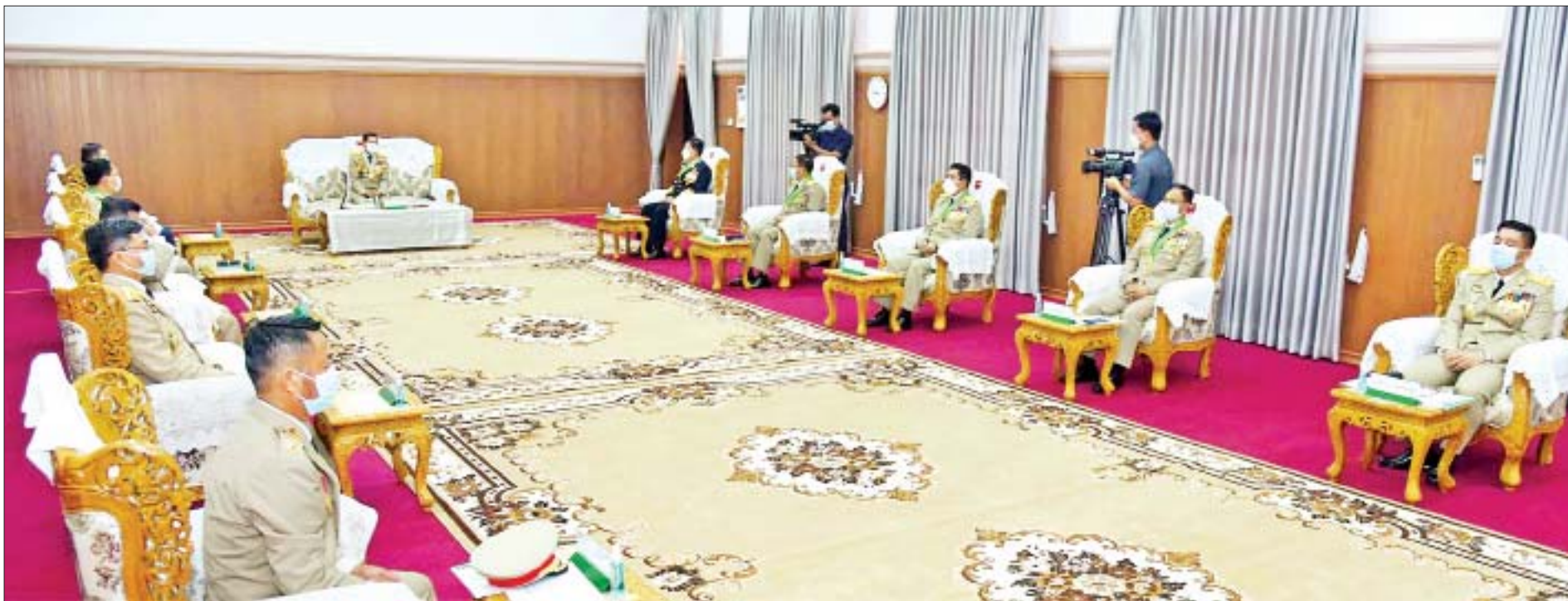
နိုင်ငံတော်စီမံအုပ်ချုပ်ရေးကောင်စီဥက္ကဋ္ဌ၊ တပ်မတော်ကာကွယ်ရေးဦးစီးချုပ် ဗိုလ်ချုပ်မှူးကြီး မဟာသရေစည်သူ မင်းအောင်လှိုင် ထူးချွန်ဆုရရှိကြသည့် သင်တန်းသား သင်တန်းသူများကို တွေ့ဆုံ၍ ဂုဏ်ပြုအမှာစကားပြောကြားစဉ်။

»» စာမျက်နှာ ၄ မှ လေးစားလိုက်နာပြီး သူနာပြုနှင့် ဆေးဘက်ပညာသည်များ ဖြစ်သော ကြောင့် ဆေးဘက်ဆိုင်ရာ ကျင့်ထုံးဥပဒေ များကိုပါ လိုက်နာရမည့်နည်းတူ ကျင့်ထုံး သိက္ခာပိုင်းဆိုင်ရာကိုလည်း သာမန်ထက် ပိုပြီး စောင့်ထိန်းသွားကြရမည်ဖြစ် ကြောင်း၊ စစ်သည်တော်ကောင်းတစ်ဦး ဖြစ်လာစေရေး စစ်ရေးစွမ်းရည်၊ စည်းရုံး ရေးစွမ်းရည်၊ အုပ်ချုပ်ရေးစွမ်းရည် ဟူသည့်စွမ်းရည်သုံးရပ်နှင့် ပြည့်စုံအောင် ပြုမူကျင့်ကြံပြီး သူနာပြုများ ခံယူကျင့်သုံး အပ်သည့် အဓိဋ္ဌာန်ပြုကတိသစ္စာ ၉ ချက် နှင့်အညီ စောင့်ထိန်းလိုက်နာကာ နိုင်ငံတော်နှင့် တပ်မတော်က ဂုဏ်ယူ အားထားရသည့် သူနာပြုနှင့် ဆေးဘက် ဆိုင်ရာ ကျွမ်းကျင်သူပညာရှင်များဖြစ် စေရေး စောင့်ထိန်းလိုက်နာ ကြိုးစားသွား ကြရန် မှာကြားလိုကြောင်း။