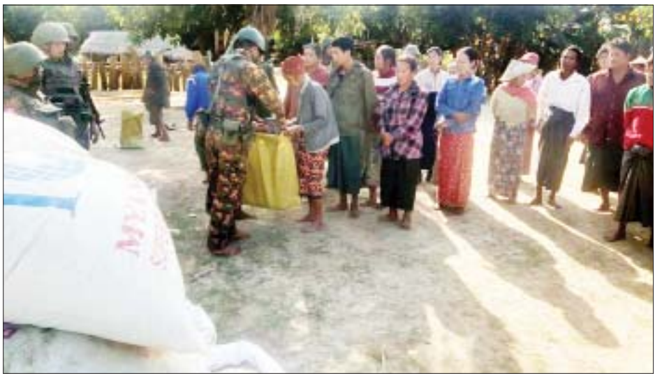
ဖော်ထုတ်သိမ်းဆည်းရမိ ဆန်အိတ်များကို အိမ်ထောင်စု ၅၀ အတွက် တစ်စုလျှင် ၁၁ ပြည်နှုန်း ဖြင့် ထောက်ပံ့ပေးအပ်စဉ်။

ဆန် ၂၂ အိတ်ကို သိမ်းဆည်းရမိခဲ့သည်။ ဖြန့်ဝေပေးအပ် လုံခြုံရေးတပ်ဖွဲ့ဝင်များက ကျေးရွာအတွင်း လိုအပ်သည့်စစ်ဆေးမှုများ ဆက်လက်ဆောင်ရွက် ခဲ့ပြီး အကြမ်းဖက်မှုနှင့် ပါဝင်ပတ်သက်ခြင်းမရှိသော ကျေးရွာသူ ကျေးရွာသားများကို သိမ်းဆည်းရမိ သည့် ဆန် ၂၂ အိတ်ကို ဖြန့်ဝေပေးအပ်ခဲ့ကြောင်း နှင့် လုံခြုံရေးလုပ်ငန်းများ ဆက်လက်ဆောင်ရွက် လျက်ရှိကြောင်း သိရသည်။ သတင်းစဉ်