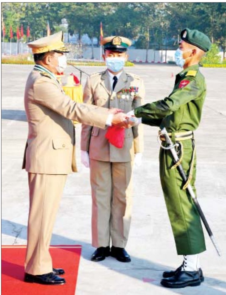
နိုင်ငံတော်စီမံအုပ်ချုပ်ရေးကောင်စီဥက္ကဋ္ဌ၊ တပ်မတော်ကာကွယ်ရေးဦးစီးချုပ် ဗိုလ်ချုပ်မှူးကြီး မဟာသရေစည်သူ မင်းအောင်လှိုင် တပ်မတော်သူနာပြုနှင့် ဆေးဘက်ပညာတက္ကသိုလ် သူနာပြုနှင့် ဆေးဘက်ပညာသိပ္ပံဘွဲ့သင်တန်း အမှတ်စဉ်(၁၉)မှ အကောင်းဆုံးသင်တန်းသားဆုရရှိသူ သင်တန်းသား မင်းကိုကိုခန့်အား ဆုပေးအပ်ချီးမြှင့်စဉ်။

တိုင်းရင်းဆေးဝါး ဖော်စပ်မှုအပိုင်းတွင်လည်း စစ်မှန်ပြီး အရည်အသွေးပြည့်ဝသည့် တိုင်းရင်းဆေးကုန်ကြမ်းပစ္စည်းများကို ရွေးချယ်အသုံးပြုခြင်းနှင့် ဆေးဝါးအရည်အသွေးကို ထိန်းသိမ်းနိုင်စေရန်အတွက် ဖော်စပ်မှုအဆင့်တိုင်းတွင် အရည်အသွေးဆိုင်ရာ ဓာတ်ခွဲစမ်းသပ်ခြင်းများကို ဆောင်ရွက်လျက်ရှိကြောင်း၊ “နွယ်မြက်သစ်ပင် ဆေးဖက်ဝင်၏” ဟူသည့် ဆိုရိုးစကားအတိုင်း မိမိတို့နိုင်ငံ