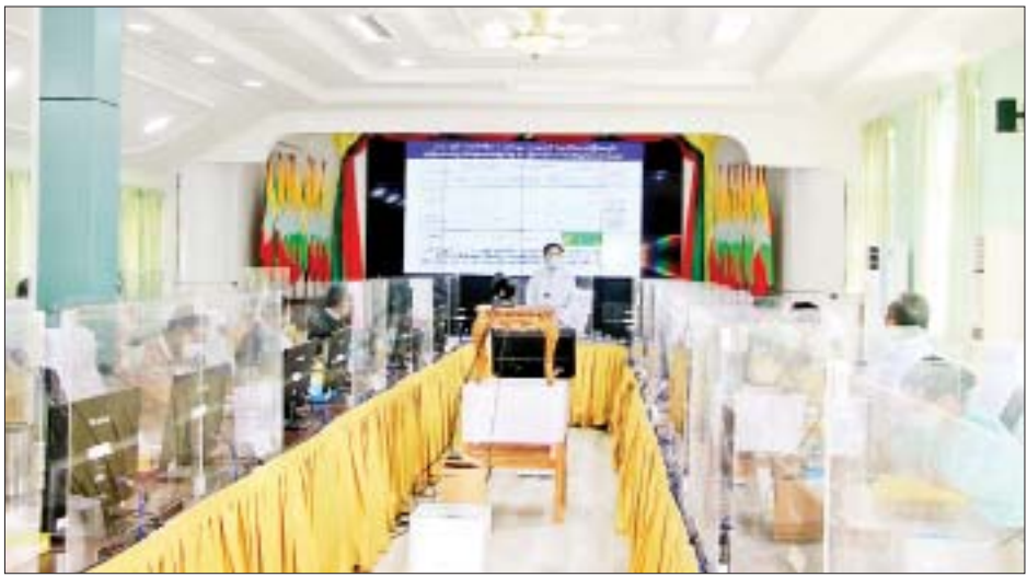
၁ ရက်မှ ဒီဇင်ဘာလအထိ နိုင်ငံခြားသားရင်းနှီးမြှုပ်နှံ မှုနှင့် မြန်မာနိုင်ငံသားရင်းနှီးမြှုပ်နှံမှု အမေရိကန် ဒေါ်လာ ၉၁ ဒသမ ၁၃၉ သန်းနှင့် မြန်မာကျပ်ငွေ ၂၄၄၁ ဒသမ ၈၂ သန်း ဝင်ရောက်ခဲ့ပြီး အလုပ်သမား ၄၇၁၇ ဦးအတွက် အလုပ်အကိုင် အခွင့်အလမ်း ဖန်တီးပေးနိုင်ခဲ့ကြောင်း သိရသည်။ သတင်းစဉ်

များခံစားရရှိနိုင်ရေးနှင့် ဥပဒေအရအကာအကွယ် ပေးရမည့် လုပ်ငန်းစဉ်များကိုလည်း ဆောင်ရွက်ပေး ကြရမည်ဖြစ်ကြောင်း၊ စက်မှုလုပ်ငန်းများအတွက် လိုအပ်သော လျှပ်စစ်၊ ရေနံလမ်းများကိုလည်း ညှိနှိုင်းဆောင်ရွက်ပေးသွားမည်ဖြစ်ကြောင်း ပြောကြား သည်။ ရှင်းလင်းတင်ပြ ထို့နောက် ပဲခူးတိုင်းဒေသကြီးရင်းနှီးမြှုပ်နှံမှု နှင့်ကုမ္ပဏီများညွှန်ကြားမှုဦးစီးဌာန ညွှန်ကြားရေး မှူးက တိုင်းဒေသကြီးအတွင်း ဆောင်ရွက်လျက် ရှိသည့် ရင်းနှီးမြှုပ်နှံမှုများနှင့် ရင်းနှီးမြှုပ်နှံမှုတိုးချဲ့ ဆောင်ရွက်နိုင်ရေးဆိုင်ရာများကို ရှင်းလင်းတင်ပြရာ တိုင်းဒေသကြီး ရင်းနှီးမြှုပ်နှံမှုကော်မတီဝင်များက အကြံပြုဆွေးနွေးကြပြီး တိုင်းဒေသကြီးဝန်ကြီးချုပ် က ဥပဒေလုပ်ထုံးလုပ်နည်းနှင့်အညီ လုပ်ငန်း ဆောင်ရွက်ခွင့်ပြုပေးသည်။ ပဲခူးတိုင်းဒေသကြီးအတွင်း ၂၀၂၁ ခုနှစ် ဖေဖော်ဝါရီ