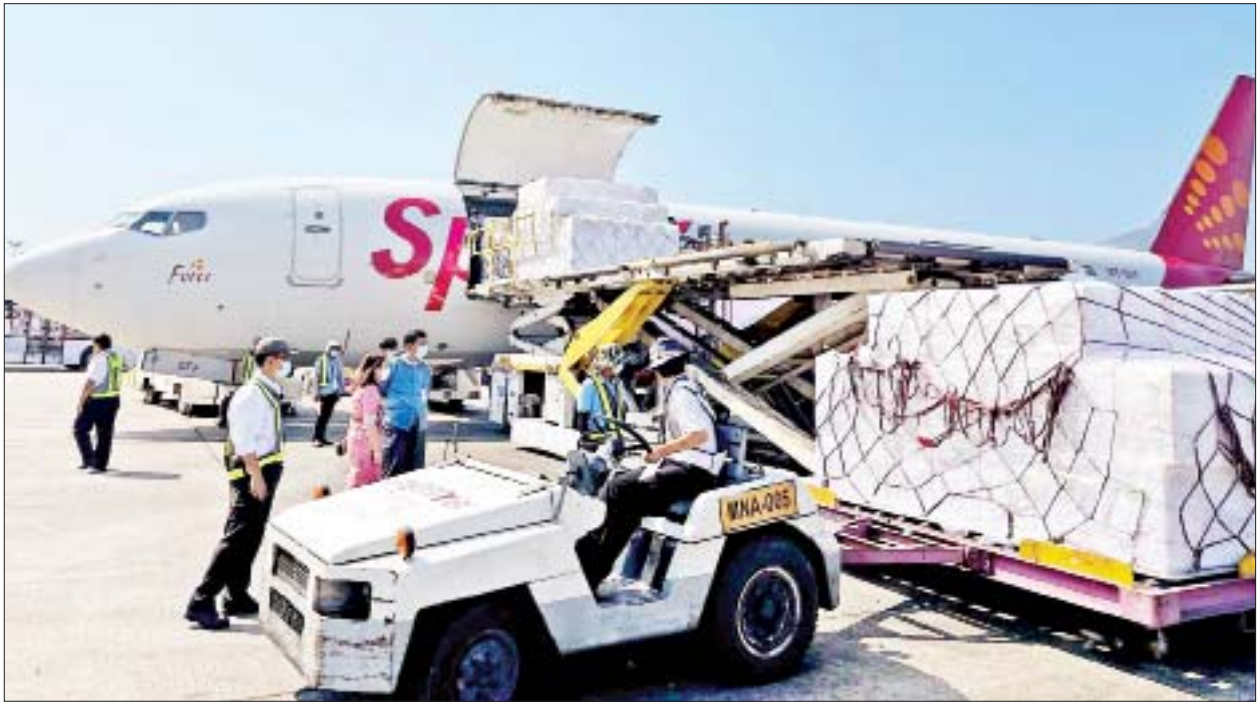
အိန္ဒိယနိုင်ငံမှ ထပ်မံဝယ်ယူထားသည့် COVISHIELD အမှတ်တံဆိပ် ကိုဗစ်-၁၉ ရောဂါ ကာကွယ်ဆေးများ ရန်ကုန်အပြည်ပြည်ဆိုင်ရာ လေဆိပ်သို့ ရောက်ရှိစဉ်။

ကိုဗစ်-၁၉ ရောဂါကာကွယ်ဆေးထိုးနှံပြီးစီးမှုအနေဖြင့် ဒီဇင်ဘာ ၂၇ ရက်အထိ အသက် ၁၈ နှစ်နှင့် အထက်ရှိသူ ၁၃ ဒဿမ ၄၅ သန်းကို နှစ်ကြိမ်အပြည့်ထိုးနှံပေးခဲ့ပြီး ၅ ဒဿမ ၅၄ သန်းကို တစ်ကြိမ် ထိုးနှံပေးခဲ့ပြီးဖြစ်သည်။ ကိုဗစ်-၁၉ ရောဂါ ကာကွယ်ဆေး အနည်းဆုံး တစ်ကြိမ်နှင့်အထက် ထိုးနှံပြီးသည့် အသက် ၁၈ နှစ်နှင့် အထက်ရှိသူ စုစုပေါင်း ၁၉ သန်းခန့်ရှိပြီဖြစ်သောကြောင့် ရည်မှန်းလူဦးရေ အားလုံး၏ ၅၀ ရာခိုင်နှုန်းကျော်ကို ထိုးနှံပြီးစီးခဲ့ပြီးဖြစ်သည်။ ထို့ပြင် စာမျက်နှာ ၁၁ ကော်လံ ၅ သို့ ❁