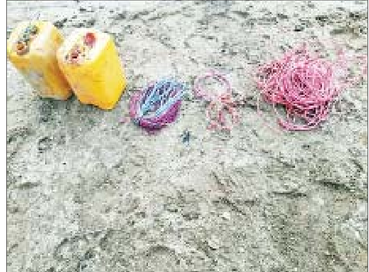
ပတ်ဝန်းကျင်နယ်မြေအတွင်း ပတ်သက် ဆက်လက်ဆောင်ရွက်လျက်ရှိကြောင်း သိရသည်။

ကြမ်းခင်းအောက်၌ ဖောက်ခွဲရန်အသင့် ကို ဆင့်လျက်တွေ့ရှိရ၍ လုံခြုံရေး ပတ်ဝန်းကျင်နယ်မြေအတွင်း ပတ်သက် ဆက်လက်ဆောင်ရွက်လျက်ရှိကြောင်း သိရသည်။ ဖြစ်နေသည့် ယမ်းအပြည့်ဖြည့်လျက် တပ်ဖွဲ့ဝင်များက အချိန်မီရှင်းလင်းနိုင် ဆက်စပ်သူများကို ဖော်ထုတ်ရရှိ သိရသည်။ စနက်ကြီးတပ်လျက် ငါးဂါလန်ပုံး နှစ်ပုံး ဖြစ်စဉ်နေရာတစ်ဝိုက်နှင့် နိုင်ငံရေး လုံခြုံရေးတပ်ဖွဲ့ဝင်များက သတင်းစဉ်