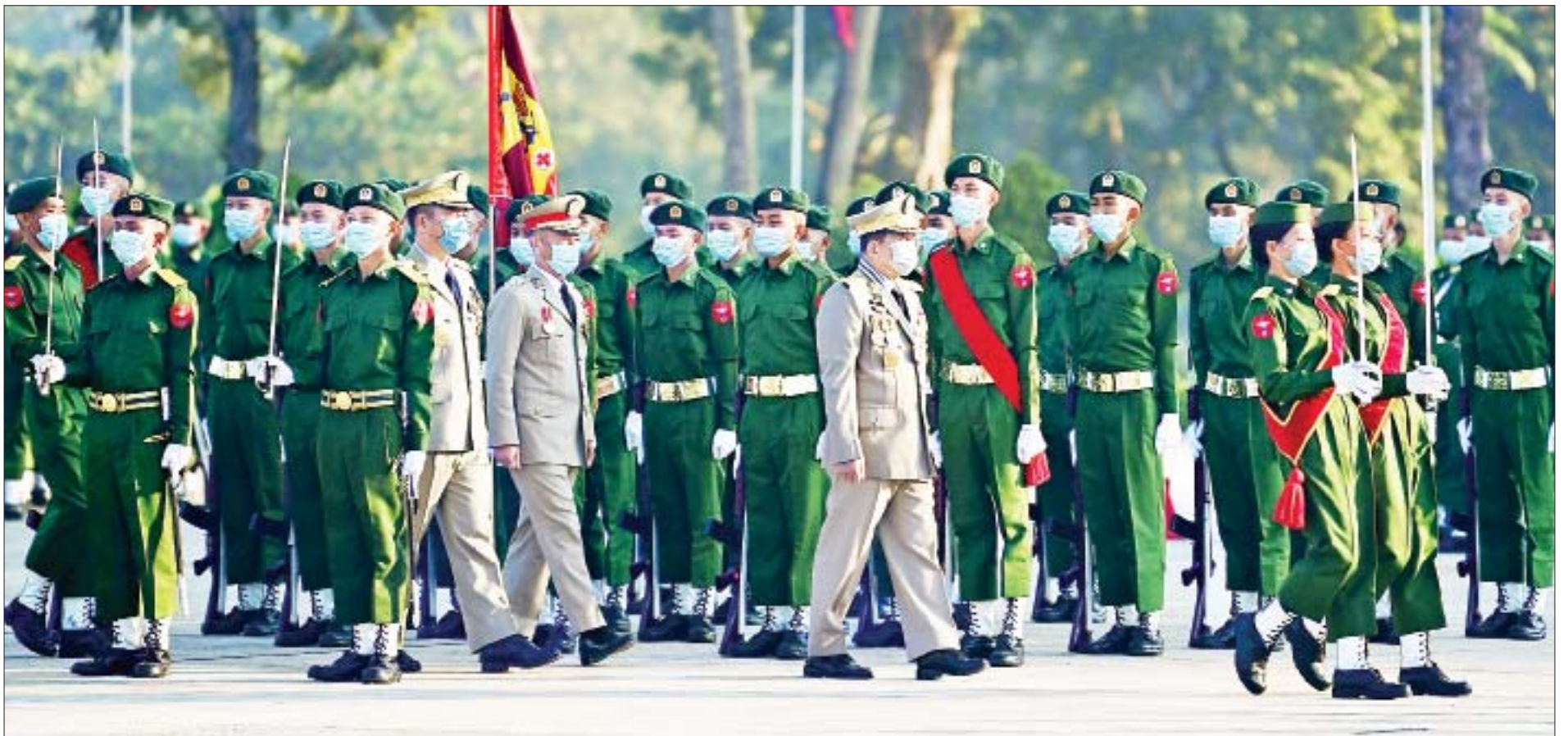
နိုင်ငံတော်စီမံအုပ်ချုပ်ရေးကောင်စီဥက္ကဋ္ဌ၊ တပ်မတော်ကာကွယ်ရေးဦးစီးချုပ် ဗိုလ်ချုပ်မှူးကြီး မဟာသရေစည်သူ မင်းအောင်လှိုင် တပ်မတော်သူနာပြုနှင့် ဆေးဘက်ပညာတက္ကသိုလ် သူနာပြုနှင့် ဆေးဘက်ပညာ သိပ္ပံဘွဲ့သင်တန်း အမှတ်စဉ်(၁၉)နှင့် အမျိုးသမီးသူနာပြုနှင့် ဆေးဘက်ပညာသိပ္ပံဘွဲ့သင်တန်း အမှတ်စဉ်(၆) သင်တန်းဆင်းဂုဏ်ပြုစစ်ရေးပြအခမ်းအနားတွင် ကျောင်းဆင်းတပ်ခွဲအား စစ်ဆေးစဉ်။