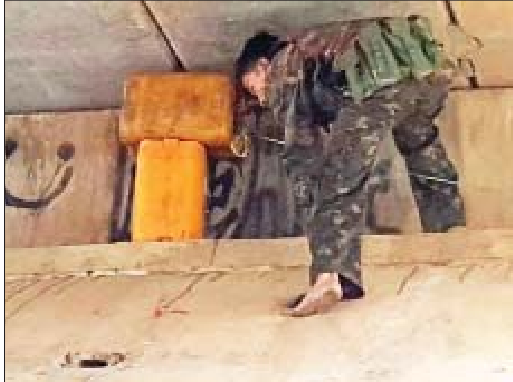
ကော့ကရိတ်မြို့နယ် ကော့နွဲ့တံတား၌တွေ့ရှိခဲ့သည့် ဒေသန္တရလက်လုပ်မိုင်း မှတ်တမ်းဓာတ်ပုံ။

နေပြည်တော် ဒီဇင်ဘာ ၂၇ ဒီဇင်ဘာ ၂၄ ရက် မွန်းလွဲ ၂ နာရီခွဲတွင် ကော့ကရိတ်-မြဝတီသွား အာရှလမ်းမ ကြီးပေါ်ရှိ ကော့နွဲ့ကျေးရွာအနီး ကော့နွဲ့ တံတားအောက်၌ လက်လုပ်မိုင်း နှစ်လုံး ကို အချိန်မီဖော်ထုတ်သိမ်းဆည်းနိုင်ခဲ့ သည်။ အချိန်မီရှင်းလင်းနိုင် ဖြစ်စဉ်မှာ ငြိမ်းချမ်းမှုကို လိုလား သော ပြည်သူလူထုအချို့ သတင်းပို့ချက် အရ အကြမ်းဖက်လုပ်ရပ်ကို လက်ခံသော KNLA လက်အောက်ခံတပ်မှူးအချို့နှင့် NUG၊ PDF အမည်ခံအကြမ်းဖက်သမား များက မြဝတီ-ကော့ကရိတ် အဓိက ဆက်သွယ်ရေးလမ်းမကြီးအား ခရီးသွား ပြည်သူများနှင့် ကုန်စည်စီးဆင်းမှု ရပ်တန့်စေရန် ရည်ရွယ်ချက်ဆိုးဖြင့် ကော့နွဲ့ကျေးရွာအနီး အရှည် ၁၉၆ ပေ၊ အကျယ်ပေ ၄၀ ရှိသည့်ကုန်ကရစ်တံတား