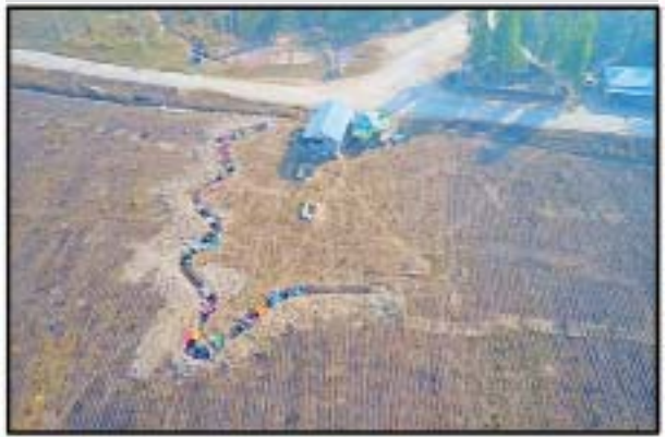
ထီးမယ်ဝါးဒီးတွင် အကြမ်းဖက် PDF ပူးပေါင်းအဖွဲ့ အခြေပြုသည့် စခန်းမှတ်တမ်းဓာတ်ပုံ။