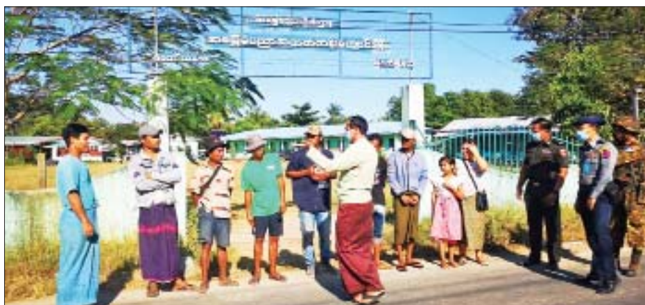
မယ်ထော်သလေး စစ်ဘေးရှောင်ပြည်သူများအား နေရပ်သို့ပြန်လာရာတွင် တာဝန်ရှိသူများက ကြိုဆိုနေသည့် မှတ်တမ်းဓာတ်ပုံ။

ကရင်ပြည်နယ် မြဝတီမြို့နယ်နှင့် ရန်ကုန်တိုင်းဒေသကြီးအတွင်း ဖော်ထုတ်သိမ်းဆည်းရမိခဲ့သော လက်နက်၊ ခဲယမ်းများနှင့် မြဝတီ-ရန်ကုန် ဆက်သွယ်ရေးလမ်းကြောင်းတစ်လျှောက် ဖော်ထုတ်သိမ်းဆည်းရမိခဲ့သည့် လက်နက်၊ ခဲယမ်းများ အများစုမှာ ကရင်ပြည်နယ် လေးကျောက်မြို့သစ်ရှိ လူသားချင်းစာနာထောက်ထားမှု ခေါင်းစဉ်ဖြင့် ပုန်းကွယ်နေထိုင်ကြသည့် အကြမ်းဖက်သမားများအနေဖြင့် ၎င်းမြို့သစ်မှတစ်ဆင့် မြို့ကြီးများသို့ လုံခြုံရေးတပ်ဖွဲ့ဝင်များ၏ အလစ်အပိုက် နည်းမျိုးစုံဖြင့် သယ်ဆောင်ခြင်း၊ ပို့ဆောင်ခြင်းများပြုခဲ့ကြကြောင်း ဖမ်းဆီးရမိသူများ၏ ဖော်ထုတ်စစ်ဆေးချက်များအရ အဆိုပါဒေသအတွင်း စာမျက်နှာ ၁၆ ကော်လံ ၁ သို့