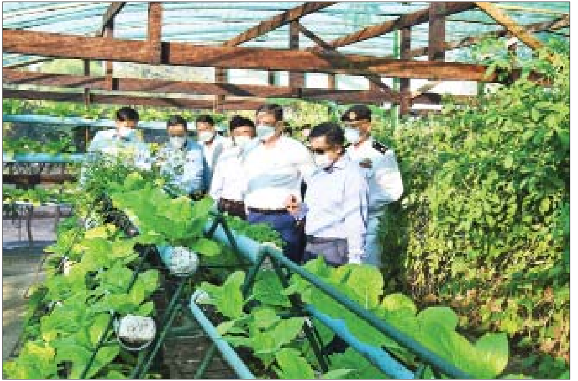
နိုင်ငံတော်စီမံအုပ်ချုပ်ရေးကောင်စီဥက္ကဋ္ဌ၊ နိုင်ငံတော်ဝန်ကြီးချုပ် ဗိုလ်ချုပ်မှူးကြီး မင်းအောင်လှိုင်နှင့်အဖွဲ့ဝင်များ နယ်မြေခံရေတပ်စခန်းဌာနချုပ် Green House များအတွင်း သီးနှံများစိုက်ပျိုးထားရှိမှုအခြေအနေကို ကြည့်ရှုစစ်ဆေးစဉ်။