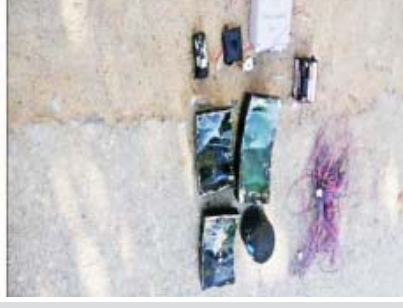
လျှိုင်ကော်မြို့၌ ဒေသခံပြည်သူများနှင့် ကျောင်းသား ကျောင်းသူများ ထိခိုက်စေရန် အကြမ်း ဖက်သမားများက ထောင်ထားသည့် လက်လုပ်မိုင်းများ တွေ့ရှိရသည့် နေရာများ။