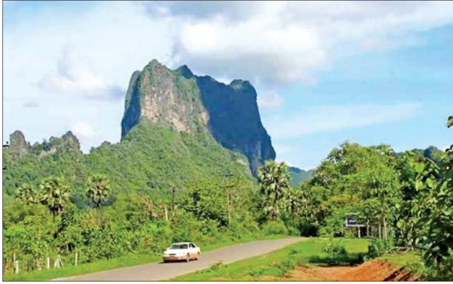
ဘားအံမြို့နယ်ရှိ ဇွဲကပင်တောင်။

ထိုသို့ကရင်ပြည်နယ်ကြီး အေးချမ်းတည်ငြိမ် သာယာလာသည်နှင့်အမျှ ကျွန်တော်သည် ဘားအံ ကော့ကရိတ် မြဝတီ၊ ရွှေဂွန်း၊ လှိုင်းဘွဲ့၊ မြိုင်ကြီးငူ၊ ထိုကော်ကိုးပါမကျန် သွားပါများခရီး ရောက်ခဲ့သည်။ ငြိမ်းချမ်းရေးနှင့်အတူ ဟန်ချက်ညီစွာ ဖြစ်ထွန်းပေါ်ပေါက်လာခဲ့သော ဖွံ့ဖြိုးရေး လုပ်ငန်းများစွာကိုလည်း လေ့လာခွင့်ရခဲ့သည်။