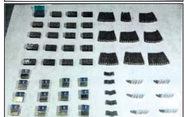
ထီးမယ်ဝါးဒီးတွင် သိမ်းဆည်းရမိသည့် လက်နက်၊ ခဲယမ်းနှင့် ဆက်စပ်ပစ္စည်းများ မှတ်တမ်းဓာတ်ပုံ။