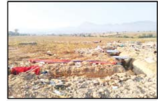
ထီးမယ်ဝါးဒီးတွင် အကြမ်းဖက် PDF ပူးပေါင်းအဖွဲ့ အခြေပြုသည့် စခန်းရှိ ဆက်သွယ်ရေးမြောင်း မှတ်တမ်းဓာတ်ပုံ။