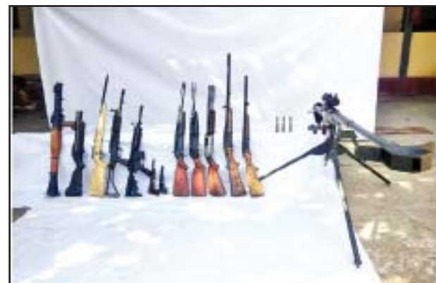
ထီးမယ်ဝါးဒီးလမ်းဆုံတွင် သိမ်းဆည်းရမိသော လက်နက်များ မှတ်တမ်းဓာတ်ပုံ။