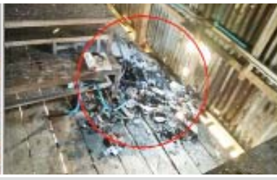
မော်လမြိုင်ကျွန်းမြို့နယ် အလက(ခွဲ)(လှိုင်းဘုန်း)၌ ကျောင်းသုံးစာအုပ်များ မီးရှို့ဖျက်ဆီးမှု။