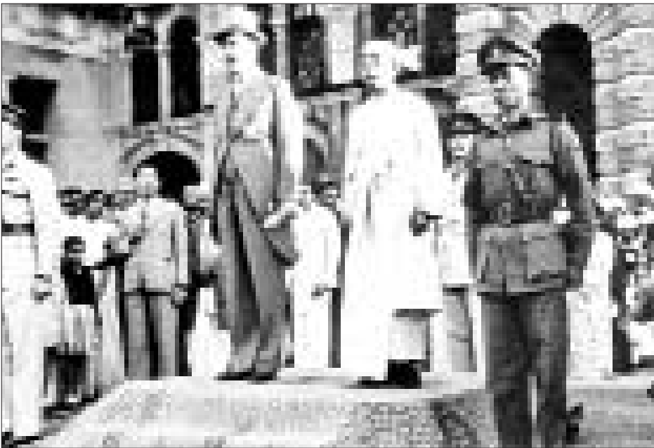
သမ္မတကြီးစစ်ရွှေသိုက်နှင့် ဘုရင်ခံဆာဟူးဘတ် အယ်လ်ပင်ရန့်စ် တို့ကို ၁၉၄၈ ခုနှစ် လွတ်လပ်ရေးနေ့ အလံတင်အခမ်းအနားတွင် တွေ့ရစဉ်။

မာနမှ သက်ဆင်းလာသော “မာန်”ကိုလည်း အောက်ပါအတိုင်း တွေ့နိုင်သည်။ (၁) သေယျမာန် (ငါသည် သူတို့ထက် အမျိုး လည်းမြတ်သည်။ အကျင့်လည်းမြတ်သည်။