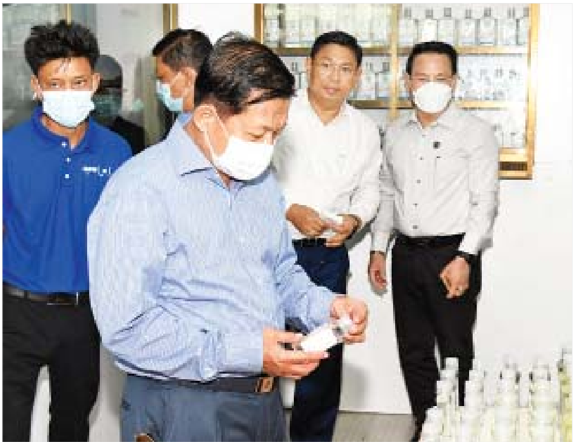
နိုင်ငံတော်စီမံအုပ်ချုပ်ရေးကောင်စီဥက္ကဋ္ဌ၊ နိုင်ငံတော်ဝန်ကြီးချုပ် ဗိုလ်ချုပ်မှူးကြီး မင်းအောင်လှိုင် ကိုကိုးကျွန်းမြို့ အုန်းနှင့် အုန်းထွက်ပစ္စည်းထုတ်လုပ်မှုလုပ်ငန်း အုန်းဆီသန့်စက်ရုံမှ ထုတ်ကုန်များအား ကြည့်ရှုစစ်ဆေးစဉ်။

ကျန်းမာရေးကဏ္ဍနှင့် ပတ်သက်၍ ယခင်ကထက် လမ်းပန်းဆက်သွယ်ရေး နှင့် နေရေး၊ စားရေးတို့တွင် အဆင်ပြေမှု ရှိလာပြီဖြစ်သဖြင့် ရုပ်ပိုင်း၊ စိတ်ပိုင်း ဆိုင်ရာတွင် များစွာတိုးတက်ကောင်းမွန် လာပြီး ကျန်းမာရေးဆိုင်ရာများတွင်လည်း တိုးတက် ကောင်းမွန်လာသည်ကို တွေ့ရှိရသဖြင့် ဝမ်းသာပါကြောင်း၊ ကျန်းမာရေးဝန်ထမ်းများကို တာဝန် ပေးအပ်ရာတွင် အလှည့်ကျစနစ်ဖြင့် မဟုတ်ဘဲ နှစ်ကာလအပိုင်းအခြားဖြင့် တာဝန်ထမ်းဆောင်စေရမည်ဖြစ်ကြောင်း၊ ထိုသို့ဆောင်ရွက်မှသာလျှင် တာဝန် ထမ်းဆောင်သည့် ဝန်ထမ်းများအနေဖြင့် ဒေသခံလူထု၏ ကျန်းမာရေးအခြေအနေ များနှင့် လိုအပ်ချက်များကို အတွင်းကျကျ သိရှိနိုင်မည်ဖြစ်ပြီး လုပ်ငန်းတာဝန်များ ကိုလည်း ဖိစီးစီးဖြင့် အပြည့်အဝ ထမ်းဆောင်နိုင်မည်ဖြစ်ကြောင်း၊ ဒေသ၏ ကျန်းမာရေး၊ လူမှုစီးပွားဘဝ ဖွံ့ဖြိုး တိုးတက်ရေးတို့အတွက် တပ်မတော်နှင့် ဌာနဆိုင်ရာဝန်ထမ်းများ ပူးပေါင်း၍ ညီညီညွတ်ညွတ်ဖြင့် အတူတကွ ဝိုင်းဝန်း ဆောင်ရွက်သွားကြရမည်ဖြစ်ကြောင်း မှာကြားသည်။