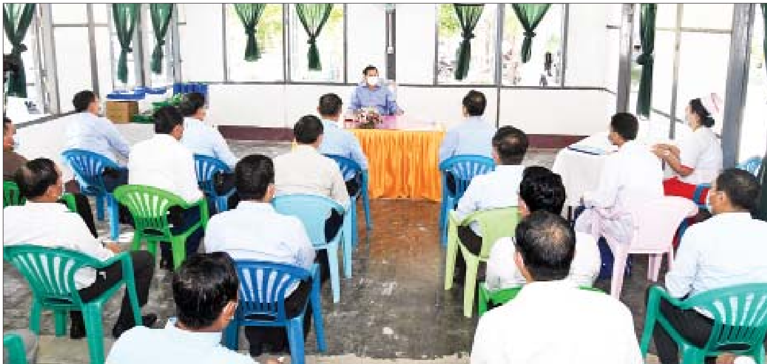
နိုင်ငံတော်စီမံအုပ်ချုပ်ရေးကောင်စီဥက္ကဋ္ဌ၊ နိုင်ငံတော်ဝန်ကြီးချုပ် ဗိုလ်ချုပ်မှူးကြီး မင်းအောင်လှိုင် ကိုကိုးကျွန်းမြို့နယ် ပြည်သူ့ဆေးရုံအစည်းအဝေးခန်းမ၌ အမှာစကားပြောကြားစဉ်။

နိုင်ငံတော်စီမံအုပ်ချုပ်ရေးကောင်စီဥက္ကဋ္ဌ၊ နိုင်ငံတော်ဝန်ကြီးချုပ် ဗိုလ်ချုပ်မှူးကြီး မင်းအောင်လှိုင်သည် ကောင်စီဝင်များ ဖြစ်သည့် ဗိုလ်ချုပ်ကြီးတင်အောင်စန်း၊ ဗိုလ်ချုပ်ကြီး မောင်မောင်ကျော်၊ ဒုတိယဗိုလ်ချုပ်ကြီးမိုးမြင့်ထွန်း၊ ကောင်စီတွဲဖက်အတွင်းရေးမှူး ဒုတိယဗိုလ်ချုပ်ကြီး ရဲဝင်းဦး၊ ပြည်ထောင်စုဝန်ကြီးများ၊ ရန်ကုန်တိုင်းဒေသကြီး ဝန်ကြီးချုပ်၊ ရန်ကုန်တိုင်းစစ်ဌာနချုပ် တိုင်းမှူး၊ ရန်ကုန်တိုင်းဒေသကြီး အစိုးရအဖွဲ့ စည်ပင်သာယာရေးဝန်ကြီးနှင့် တာဝန်ရှိသူများလိုက်ပါပြီး ယနေ့နံနက်ပိုင်းတွင် ရန်ကုန်တိုင်းဒေသကြီး ကိုကိုးကျွန်းမြို့သို့ သွားရောက်၍ မြို့နယ် ပြည်သူ့ဆေးရုံနှင့် အခြေခံပညာအထက်တန်းကျောင်းတို့ကို ကြည့်ရှုစစ်ဆေးသည်။