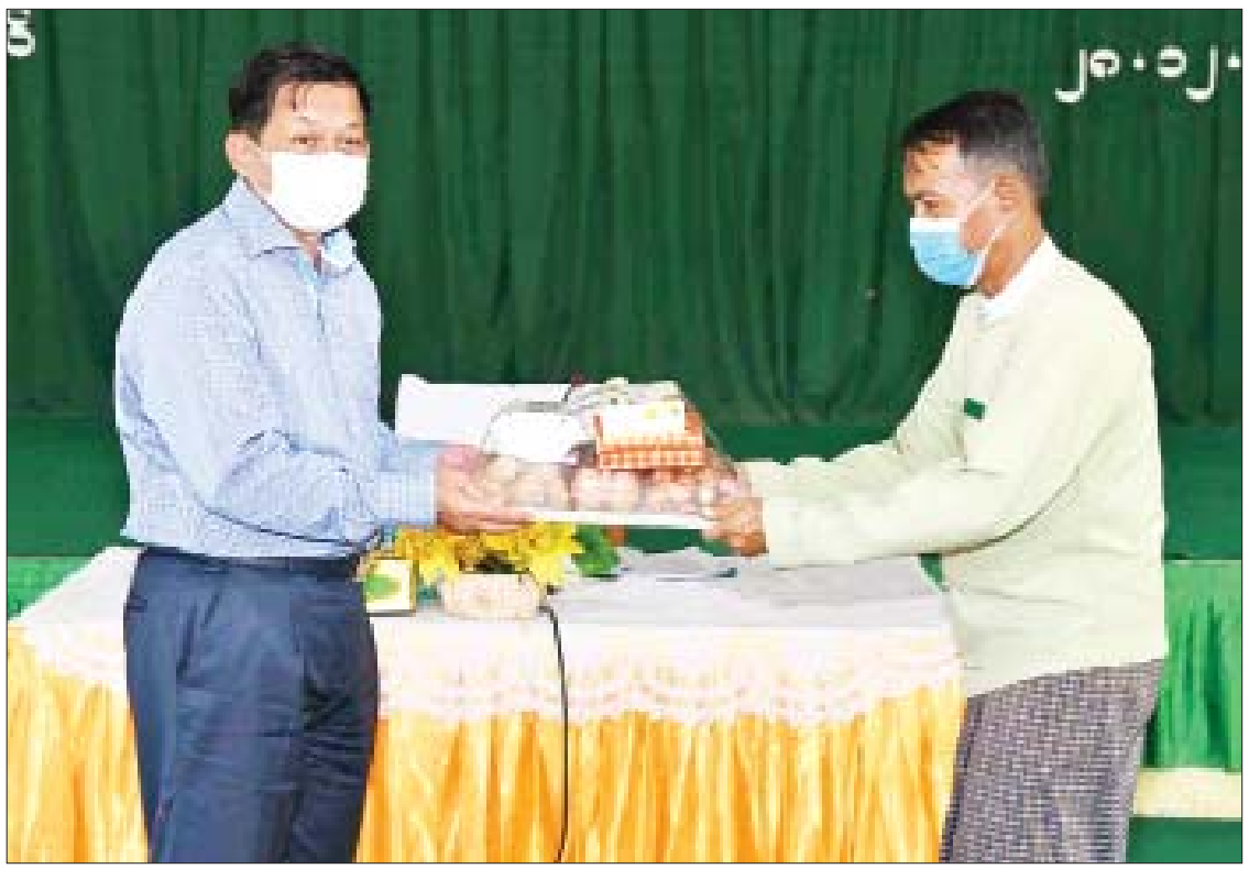
နိုင်ငံတော်စီမံအုပ်ချုပ်ရေးကောင်စီဥက္ကဋ္ဌ၊ နိုင်ငံတော်ဝန်ကြီးချုပ် ဗိုလ်ချုပ်မှူးကြီး မင်းအောင်လှိုင် ကိုကိုးကျွန်းဒေသအတွက် စားသောက်ဖွယ်ရာများနှင့် အားကစားပစ္စည်းများ ပေးအပ်စဉ်။

* ရှေ့ဖုံးမှ တပ်မတော်မှ ဆေးကုသရေးအဖွဲ့များ ဖြည့်ဆည်းပေးစေလိုသည့် အခြေအနေ၊ ရေယာဉ်များ ဆိုက်ကပ်ပါက အဆင်ပြေစေရေးအတွက် ကမ်းထိုးတံတား မွမ်းမံဆောင်ရွက်ပေးစေလိုသည့် အခြေအနေ၊ ကိုဗစ်-၁၉ ရောဂါနှင့် ပတ်သက်၍ ကာကွယ်ရေးလုပ်ငန်း ဆောင်ရွက်ပေးစေလိုသည့် အခြေအနေနှင့် ဒေသခံများ စိတ်အပန်းပြေစေရေး ဆောင်ရွက်ပေးစေလိုသည့် အခြေအနေ၊ သောက်ရေသုံးရေအတွက် အဓိက အားထားနေရသည့် ကိုကိုးရေလှောင်တံမံ၏ ကြံ့ခိုင်ရေး၊ ရေလုံလောက်မှုရှိစေရေး ဆောင်ရွက်ပေးစေလိုသည့် အခြေအနေ၊ ကိုကိုးကျွန်းနှင့်ပတ်သက်၍ နိုင်ငံတော်စီမံအုပ်ချုပ်ရေးကောင်စီဥက္ကဋ္ဌ၊ နိုင်ငံတော်ဝန်ကြီးချုပ်က လိုအပ်သည်များ ဖြည့်ဆည်းဆောင်ရွက်ပေးလျက်ရှိသဖြင့် ကျေးဇူးတင်ရှိကြောင်းနှင့် ဆက်လက်၍လည်း ဒေသဖွံ့ဖြိုးတိုးတက်ရေးလုပ်ငန်းများကို ဆက်လက်ကူညီ ဆောင်ရွက်ပေးစေလိုသည့်အခြေအနေများနှင့် ပတ်သက်၍ တင်ပြကြသည်။