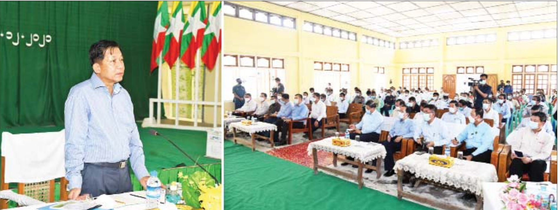
နိုင်ငံတော်စီမံအုပ်ချုပ်ရေးကောင်စီဥက္ကဋ္ဌ၊ နိုင်ငံတော်ဝန်ကြီးချုပ် ဗိုလ်ချုပ်မှူးကြီး မင်းအောင်လှိုင် ကိုကိုးကျွန်းမြို့နယ်ရှိ ဌာနဆိုင်ရာဝန်ထမ်းများနှင့် ရပ်မိရပ်ဖများအား မြို့တော်ခန်းမ၌ တွေ့ဆုံ အမှာစကားပြောကြားစဉ်။

နေပြည်တော် ဒီဇင်ဘာ ၂၈ နိုင်ငံတော်စီမံအုပ်ချုပ်ရေးကောင်စီဥက္ကဋ္ဌ၊ နိုင်ငံတော်ဝန်ကြီးချုပ် ဗိုလ်ချုပ်မှူးကြီး မင်းအောင်လှိုင်သည် ကောင်စီဝင်များဖြစ်ကြသည့် ဗိုလ်ချုပ်ကြီး တင်အောင်စန်း၊ ဗိုလ်ချုပ်ကြီး မောင်မောင်ကျော်၊ ဒုတိယ ဗိုလ်ချုပ်ကြီးမိုးမြင့်ထွန်း၊ ကောင်စီတွဲဖက်အတွင်းရေးမှူး ဒုတိယ ဗိုလ်ချုပ်ကြီး ရဲဝင်းဦး၊ ပြည်ထောင်စုဝန်ကြီးများ၊ ရန်ကုန်တိုင်းဒေသကြီး ဝန်ကြီးချုပ်၊ ရန်ကုန်တိုင်းစစ်ဌာနချုပ်တိုင်းမှူး၊ ရန်ကုန်တိုင်းဒေသကြီး အစိုးရအဖွဲ့ စည်ပင်သာယာရေးဝန်ကြီးနှင့် တာဝန်ရှိသူများလိုက်ပါ၍ ယနေ့ မွန်းလွဲပိုင်းတွင် ရန်ကုန်တိုင်းဒေသကြီး ကိုကိုးကျွန်းမြို့နယ် ရှိ ဌာနဆိုင်ရာဝန်ထမ်းများနှင့် ရပ်မိရပ်ဖများအား မြို့တော်ခန်းမ၌ တွေ့ဆုံသည်။ ဦးစွာ ကိုကိုးကျွန်းမြို့နယ် အုပ်ချုပ်ရေးမှူး ဦးဆန်းမင်း၊ ရပ်မိရပ်ဖ များဖြစ်ကြသည့် ဦးအောင်ဇော်၊ ဦးကြည်၊ ဦးမောင်မြင့်၊ ဦးသိန်းထွန်းနှင့် ဦးမောင်သန်းတို့က ဒေသဆိုင်ရာအချက်အလက်များ၊ ဒေသဖွံ့ဖြိုး တိုးတက်ရေး၊ လမ်းပန်းဆက်သွယ်ရေး၊ ဒေသခံလူငယ်လူရွယ်များ အလုပ်အကိုင်အခွင့်အလမ်းရရှိရေးအတွက် ဆောင်ရွက်ပေးစေလိုသည့် အခြေအနေ၊ ကျန်းမာရေးအတွက် ကျန်းမာရေးဝန်ထမ်းလိုအပ်ချက် များနှင့် စာမျက်နှာ ၃ ကော်လံ ၁ သို့ *