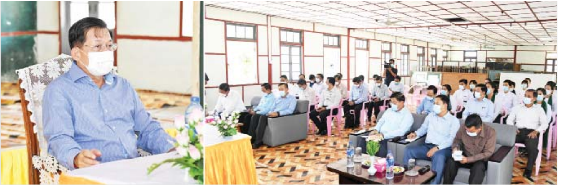
နိုင်ငံတော်စီမံအုပ်ချုပ်ရေးကောင်စီဥက္ကဋ္ဌ၊ နိုင်ငံတော်ဝန်ကြီးချုပ် ဗိုလ်ချုပ်မှူးကြီး မင်းအောင်လှိုင် ကိုကိုးကျွန်းမြို့နယ် အခြေခံပညာအထက်တန်းကျောင်းခန်းမ၌ ဆရာ ဆရာမများနှင့် တွေ့ဆုံအမှာစကား ပြောကြားစဉ်။