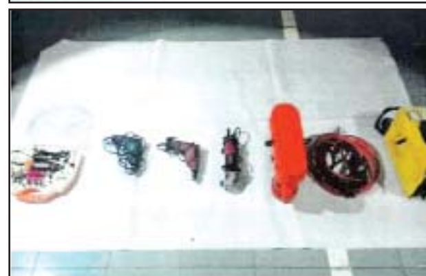
ထီးမယ်ဝါးဒီးတွင် သိမ်းဆည်းရမိသည့် လက်နက်၊ ခဲယမ်းနှင့် ဆက်စပ်ပစ္စည်းများ မှတ်တမ်းဓာတ်ပုံ။