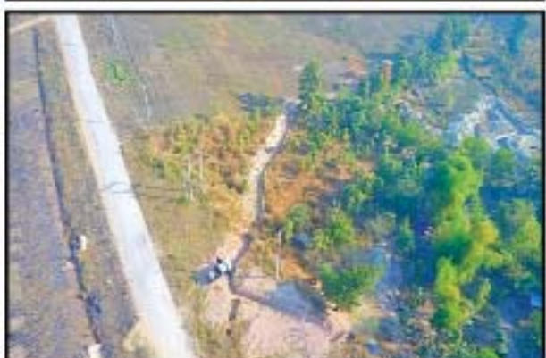
ထီးမယ်ဝါးဒီးတွင် အကြမ်းဖက် PDF ပူးပေါင်းအဖွဲ့ အခြေပြုသည့် စခန်းမှတ်တမ်းဓာတ်ပုံများ။