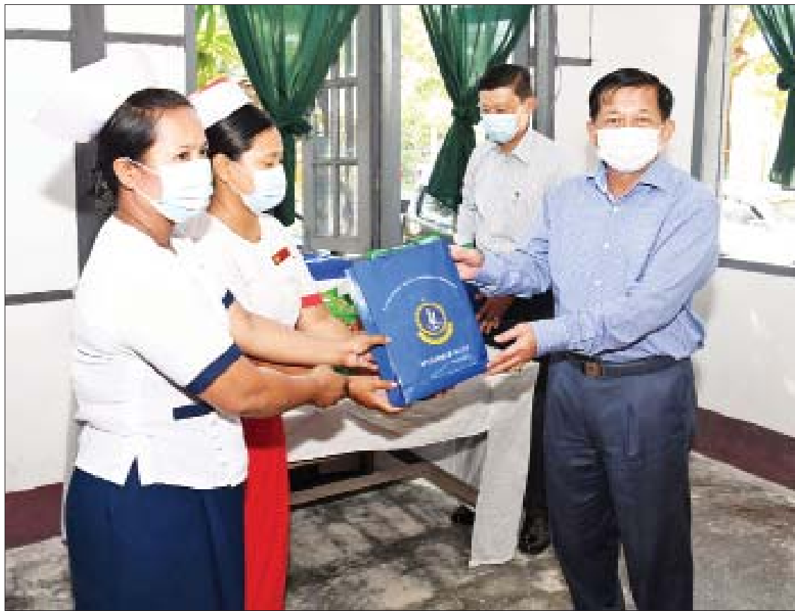
နိုင်ငံတော်စီမံအုပ်ချုပ်ရေးကောင်စီဥက္ကဋ္ဌ၊ နိုင်ငံတော်ဝန်ကြီးချုပ် ဗိုလ်ချုပ်မှူးကြီး မင်းအောင်လှိုင် ကိုကိုးကျွန်းမြို့နယ် ပြည်သူ့ဆေးရုံအတွက် စားသောက်ဖွယ်ရာပစ္စည်းများ ထောက်ပံ့ပေးအပ်စဉ်။

ဆောင်ရွက်ပေးခဲ့ကြောင်း၊ ယခုအခါ ယခင်ကထက် များစွာတိုးတက်ပြောင်းလဲလာပြီဖြစ်သော်လည်း လိုအပ်ချက်များ ရှိနေဦးမည်ဖြစ်သဖြင့် ဒေသဖွံ့ဖြိုးရေး၊ လမ်းပန်းဆက်သွယ်မှု လွယ်ကူချောမွေ့ရေး၊ ကျန်းမာရေးတို့အတွက် ဆက်လက် ဖြည့်ဆည်းဆောင်ရွက်ပေး သွားမည်ဖြစ်ကြောင်း၊ ကိုကိုးကျွန်းသည် အခြားကျွန်းများနှင့်မတူဘဲ လမ်းပန်းဆက်သွယ်ရေး ဝေးကွာမှု အခက်အခဲများ၊ ရာသီဥတုအခက်အခဲများရှိခြင်းကြောင့် တပ်မတော်အနေဖြင့် ဒေသဖွံ့ဖြိုးတိုးတက်စေလိုသည့် ရည်ရွယ်ချက်ဖြင့်သာ အစဉ်အဆက် လိုအပ်သည်များ ပံ့ပိုးဖြည့်ဆည်း ကူညီဆောင်ရွက်ပေးနေခြင်းသာဖြစ်ကြောင်း၊ ထို့ကြောင့် နယ်မြေခံတပ်များ၊ ဌာနဆိုင်ရာများနှင့် ဒေသခံတို့အတူတကွ ပိုင်းဝန်း၍ ဒေသဖွံ့ဖြိုး တိုးတက်ရေးလုပ်ငန်းများကို ကြိုးပမ်း ဆောင်ရွက်သွားကြရမည် ဖြစ်ကြောင်း။ စာမျက်နှာ ၆ သို့ ၀