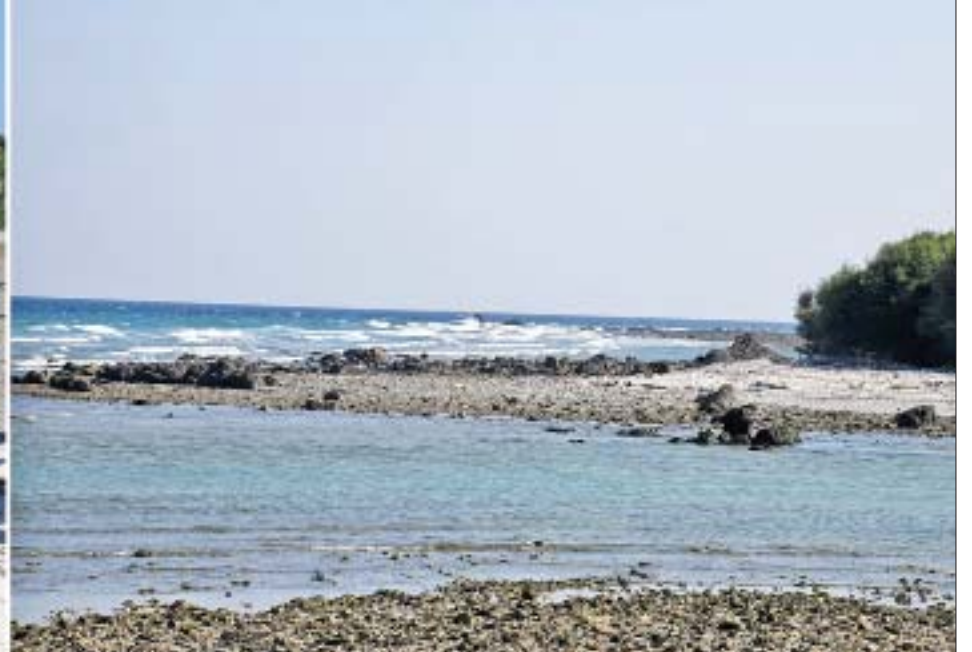
နိုင်ငံတော်စီမံအုပ်ချုပ်ရေးကောင်စီဥက္ကဋ္ဌ၊ နိုင်ငံတော်ဝန်ကြီးချုပ် ဗိုလ်ချုပ်မှူးကြီး မင်းအောင်လှိုင်နှင့်အဖွဲ့ဝင်များ ဂျယ်ရီကျွန်းနှင့်ကျွန်းမကြီးအား ကျွန်းဆက်လမ်းဖောက်လုပ်မည့် အခြေအနေများကို ကြည့်ရှုစစ်ဆေးစဉ်။