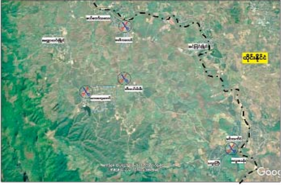
လေးကော့ကော်မရှီသစ်ဝန်းကျင်တစ်ဝိုက် အကြမ်းဖက်သမားများနှင့် ထိတွေ့တိုက်ပွဲဖြစ်ပွားသည့် ဖြစ်စဉ်နေရာပြပုံ။

အကြမ်းဖက်မှုကိုလှိုင်းပြီး NCA ကိုဖျက်ဆီးစေလို သည့် ခေါင်းဆောင်တချို့ ပါဝင်သော NUGi PDF အမည်ခံအကြမ်းဖက်သမားများက စတင်ပစ်ခတ် တိုက်ခိုက်ခဲ့သဖြင့် တပ်မတော်မှ အရာရှိ၊ စစ်သည် များအပါအဝင် လုံခြုံရေးတပ်ဖွဲ့ဝင်များ ထိခိုက်ကျဆုံး၊ ဒဏ်ရာရရှိခဲ့ပြီး တချို့မှာ ဖမ်းဆီးခံခဲ့ရသည်။ ထို့ကြောင့် မိမိကိုယ်မိမိခံကာကွယ်ရန် အလို့ငှာ တပ်မတော်အနေဖြင့် အကန့်အသတ်ဖြင့် အနည်းဆုံးအင်အားကို အသုံးပြု၍ ၂၀၂၁ ခုနှစ် ဒီဇင်ဘာလ ၁၅ ရက်မှစ၍ KNU တပ်ခေါင်းဆောင် တချို့နှင့်တပ်ဖွဲ့တချို့၊ NUG နှင့် PDF အမည်ခံ အကြမ်းဖက်သမားများအား ချေမှုန်းတိုက်ခိုက်ခဲ့ရာ အထက်ပါအကြမ်းဖက်အုပ်စုများမှလည်း အင်အား များပြားစွာစုစည်းလျက် မိမိတပ်မတော်စစ်ကြောင်း များအား နေ့/ည ဝိုင်းဝန်းပိတ်ဆို့လျက် တန်ပြန် တိုက်ခိုက်လာသဖြင့် တိုက်ပွဲများ ပြင်းထန်လာခဲ့ သည်။ စာမျက်နှာ ၁၇ သို့ □