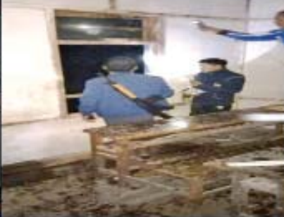
ဗန်းမောက်မြို့ အထက်ကျောင်းအား အကြမ်းဖက်အုပ်စု(စိစစ်ဆဲ)က ဓာတ်ဆီပုလင်းများ ဖြင့် မီးရှို့၍ ပစ်ပေါက်ခဲ့မှု။