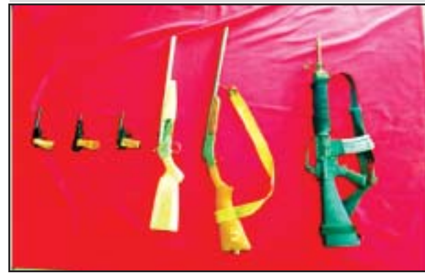
ထီးမယ်ဝါးဒီးလမ်းဆုံအနီးတွင် သိမ်းဆည်းရမိသော လက်နက်များ မှတ်တမ်းဓာတ်ပုံ။