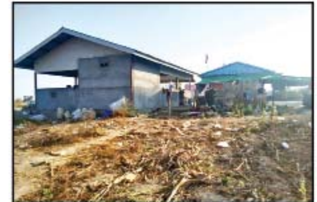
ထီးမယ်ဝါးဒီးတွင် အကြမ်းဖက် PDF ပူးပေါင်းအဖွဲ့ အခြေပြုသည့် အဆောက်အအုံ မှတ်တမ်းဓာတ်ပုံ။