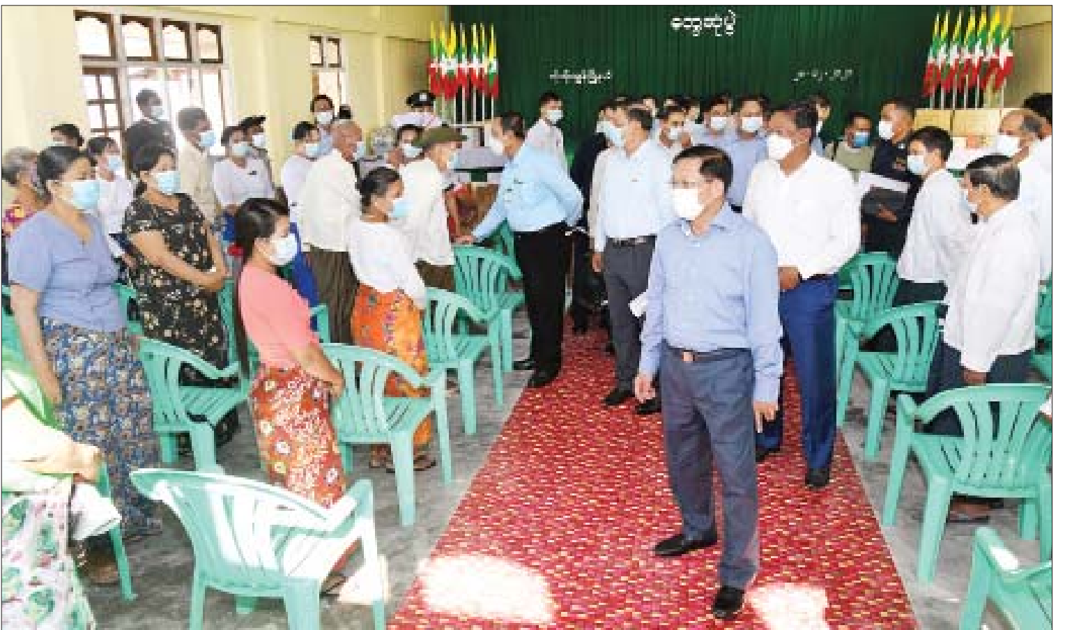
နိုင်ငံတော်စီမံအုပ်ချုပ်ရေးကောင်စီဥက္ကဋ္ဌ၊ နိုင်ငံတော်ဝန်ကြီးချုပ် ဗိုလ်ချုပ်မှူးကြီး မင်းအောင်လှိုင်နှင့် အဖွဲ့ဝင်များက ဌာနဆိုင်ရာဝန်ထမ်းများ၊ ရပ်မိရပ်ဖများအား ရင်းရင်းနှီးနှီး နှုတ်ဆက်ကြစဉ်။

ပညာရေးကို အားပေးမြှင့်တင်ဒေသခံများ၏ တင်ပြချက်များတွင် ပါဝင်သည့် ဒေသအတွက် အမှန်တကယ် လိုအပ်ချက်များကို အတတ်နိုင်ဆုံး ဖြည့်ဆည်းပေးမည်ဖြစ်ကြောင်း၊ ကျန်းမာရေး ကောင်းမွန်မှုရှိရန်နှင့် ပညာရေး ကောင်းမွန်မှုရှိရန်ဖြစ်သဖြင့် ဒေသခံများက မိမိကိုယ်ကို ဂရုစိုက်နေထိုင်ရန်နှင့် ပညာရေးကို အားပေးမြှင့်တင်ကြရမည် ဖြစ်ပြီး ပတ်ဝန်းကျင်ကောင်းကို ဖန်တီး ကြရမည်ဖြစ်ကြောင်း၊ ပတ်ဝန်းကျင် ကောင်းအတွက် မိမိယခင်လာရောက်စဉ် ကတည်းကပင် ခြံစည်းရိုးကာရံပေးခြင်း များ၊ လမ်းဖောက်ပေးခြင်းများ၊ သွပ်အမိုး အကာလဲပေးခြင်းများနှင့် သန့်ရှင်း သာယာလှပရေးတို့ကို လုပ်ဆောင်ပေးခဲ့ ကြောင်း၊ အမြင်ကောင်းပါက စိတ်ကြည် လင်ပြီး သန့်ရှင်းသပ်ရပ်မှုကို လူတိုင်း နှစ်သက်ကြသည်မှာ လူတို့၏ စိတ်သဘောပင်ဖြစ်ကြောင်း၊ ထို့ပြင် ပတ်ဝန်းကျင် သန့်ရှင်းသပ်ရပ်ခြင်း သည် သက်ရှည်ကျန်းမာမှုကိုလည်း အထောက်အကူဖြစ်စေမည် ဖြစ်ကြောင်း၊ မိမိတို့နိုင်ငံ၏ မျှော်မှန်းသက်တမ်းသည် ၆၅ နှစ်ဖြစ်ပြီး ၂၀၁၆ ခုနှစ်တွင် ၆၅ ဒသမ