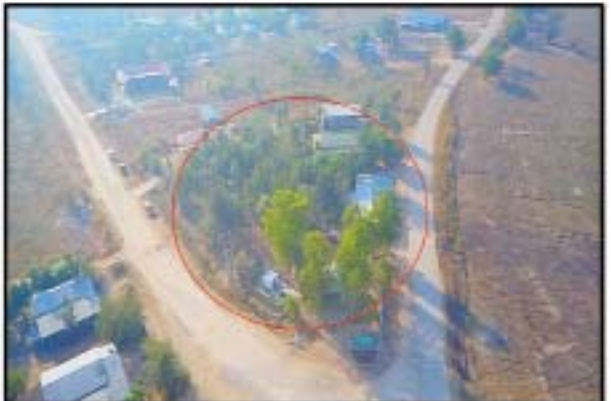
ထီးမယ်ဝါးဒီးလမ်းဆုံတွင် အကြမ်းဖက် PDF ပူးပေါင်းအဖွဲ့ အခြေပြုသည့် စခန်းမှတ်တမ်းဓာတ်ပုံ။