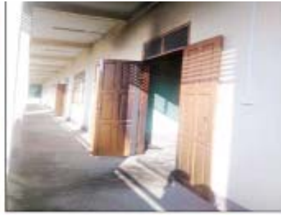
ကလေးမြို့ တောင်ဖီလာရပ်ကွက်ရှိ အခြေခံပညာအထက်တန်းကျောင်း(ခွဲ)အတွင်းရှိ စာသင် ဆောင်တစ်ခု၏ လျှောက်လမ်း၌ ဓာတ်ဆီလောင်းမီးရှို့ခဲမှု။