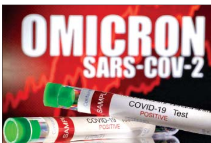
ဆောင်းပါး စာမျက်နှာ » ၁၀

ကိုဗစ်-၁၉ ရောဂါ ဓာတ်ခွဲအတည်ပြု လူနာသစ် ၂၇၆ ဦး တွေ့ရှိ၊ ရောဂါပိုးတွေ့ရှိမှုရာခိုင်နှုန်းမှာ ၂ ဒသမ ၁၁ ရာခိုင်နှုန်းရှိ