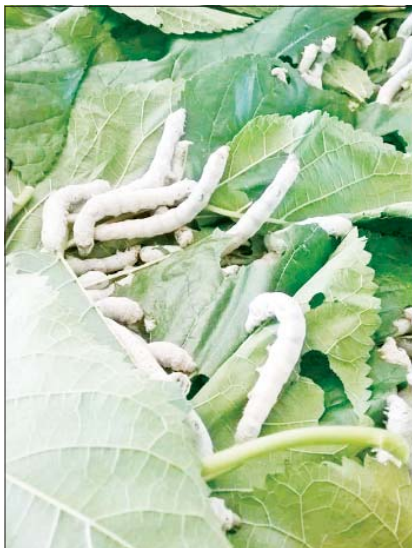
စာမျက်နှာ » ၆

တစ်နှစ်လျှင် ပိုးအိမ်တန်ချိန် ၃၀၀ နီးပါး တရုတ်နိုင်ငံသို့ တင်ပို့လျက်ရှိ