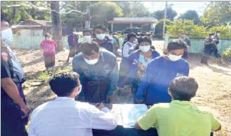
လေးကျောက်ဒေသရှိ ကျေးရွာများမှ စစ်ဘေးရှောင်ပြည်သူများ ပြန်လည်ဝင်ရောက်လာမှု မှတ်တမ်း ဓာတ်ပုံ။

☉ ကျော့ဖုံးမှ တစ်ဖက်နိုင်ငံသို့ ထွက်ပြေးတိမ်းရှောင်နေသည့် အပြစ်မဲ့ပြည်သူများ ပြန်လည်နေထိုင်နိုင်ရေးအတွက် အသံချဲ့စက်များဖြင့် ကရင်ဘာသာ၊ မြန်မာဘာသာ စကားများဖြင့် ပြန်လည်ဖိတ်ခေါ်ခြင်း၊ ထိုင်း-မြန်မာ နယ်ခြားကော်မတီများမှ လိုအပ်သည်များ ညှိနှိုင်း ဆောင်ရွက်ခြင်းများကြောင့် ထွက်ပြေးတိမ်းရှောင် နေသူများအနက်မှ ယနေ့တွင် အင်ကြင်းမြိုင်၊ မင်းလက်ပံ၊ မယ်ထော်သလေးနှင့် မေတ္တာလင်းမြိုင် ကျေးရွာတို့တွင် နေထိုင်သူ အမျိုးသား ၈၀၇ ဦးနှင့် အမျိုးသမီး ၉၀၁ ဦး စုစုပေါင်း ၁၇၀၈ ဦးတို့သည် ၎င်းတို့နေရပ်သို့ ပြန်လည်ဝင်ရောက်လာကြောင်း သိရသည်။ အဆိုပါ ပြန်လည်ဝင်ရောက်လာသူများအား သက်ဆိုင်ရာတာဝန်ရှိသူများက စနစ်တကျ လက်ခံခဲ့ ပြီး လိုအပ်သည်များ ညှိနှိုင်းဆောင်ရွက်ပေးခဲ့ကြောင်း သိရသည်။ သတင်းစဉ်