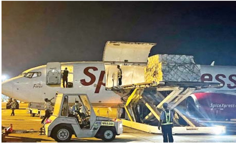
အိန္ဒိယနိုင်ငံမှ ဝယ်ယူထားသည့် COVISHIELD အမှတ်တံဆိပ် ကိုဗစ်-၁၉ ရောဂါ ကာကွယ်ဆေး ဒုတိယအသုတ် ၆ ဒသမ ၇ သန်း doses ရန်ကုန်အပြည်ပြည်ဆိုင်ရာလေဆိပ်သို့ ရောက်ရှိလာစဉ်။

ကိုဗစ်-၁၉ ရောဂါကာကွယ်ဆေးထိုးနှံပြီးစီးမှု အနေဖြင့် ဒီဇင်ဘာ ၂၈ ရက်အထိ အသက် ၁၈ နှစ်