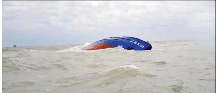
တူနီးရှားနိုင်ငံ အရှေ့တောင်ပိုင်းဂါဘီးစ်ကမ်းရိုးတန်း၌ နှစ်မြုပ်သွားခဲ့သည့် လောင်စာဆီတင်သင်္ဘောအား တွေ့ရစဉ်။

တူးနစ် ဧပြီ ၁၈ တူနီးရှားနိုင်ငံရှိ လောင်စာဆီတင်သင်္ဘောနှစ်မြုပ်မှုမှ တစ်ဆင့် သဘာဝပတ်ဝန်းကျင်ဆိုင်ရာထိခိုက်မှုများရှိလာ နိုင်သဖြင့် လိုအပ်သည့် သဘာဝဘေးကာကွယ်ရေးဆိုင်ရာ အစီအမံများဆောင်ရွက်ရန် တူနီးရှားရေတပ်မှ တာဝန်ရှိသူ များအား သမ္မတ ကိုင်ဆီက ယမန်နေ့တွင် ညွှန်ကြားခဲ့ကြောင်း ကာကွယ်ရေးဝန်ကြီးဌာနမှ ထုတ်ပြန်ချက်အရ သိရသည်။ တာဝန်ရှိသူများအကြား ညှိနှိုင်းပေါင်းစပ်ဆောင်ရွက်မှု များကို တိုးမြှင့်ဆောင်ရွက်ခြင်းဖြင့် အဆိုပါသင်္ဘောမှ သဘာဝ ပတ်ဝန်းကျင်ညစ်ညမ်းစေမည့်အရာများ ပင်လယ်ထဲသို့ မရောက်ရှိစေရန် ပြင်ဆင်ဆောင်ရွက်သွားရမည်ဖြစ်ကြောင်း