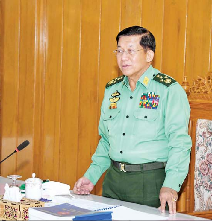
နိုင်ငံတော်စီမံအုပ်ချုပ်ရေးကောင်စီဥက္ကဋ္ဌ တပ်မတော်ကာကွယ်ရေးဦးစီးချုပ် ဗိုလ်ချုပ်မှူးကြီး မင်းအောင်လှိုင် ပြင်ဦးလွင်တပ်နယ်ရှိ တက္ကသိုလ်နှင့် လေ့ကျင့်ရေးကျောင်းများ၏ လေ့ကျင့်ရေးဆိုင်ရာ ညှိနှိုင်း အစည်းအဝေးတွင် အမှာစကားပြောကြားစဉ်။