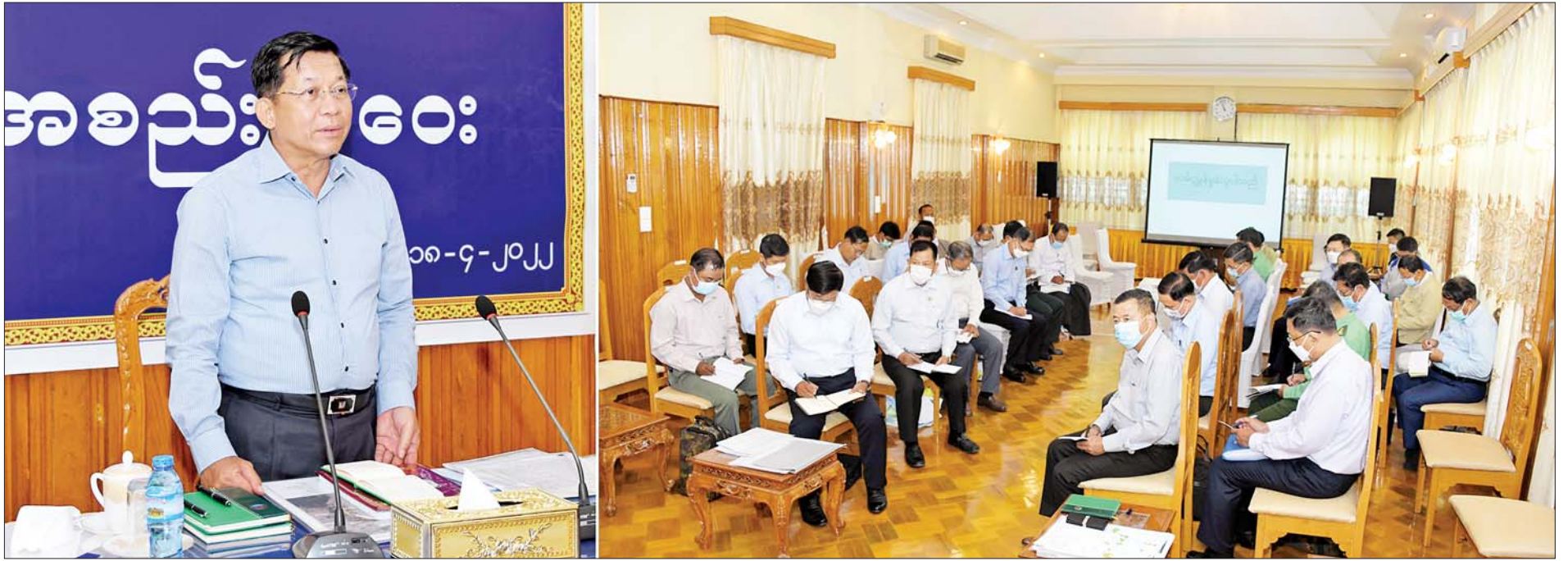
နိုင်ငံတော်စီမံအုပ်ချုပ်ရေးကောင်စီဥက္ကဋ္ဌ နိုင်ငံတော်ဝန်ကြီးချုပ် ဗိုလ်ချုပ်မှူးကြီးမင်းအောင်လှိုင် မန္တလေးတိုင်းဒေသကြီး ပြင်ဦးလွင်ခရိုင်နှင့် မြို့နယ်အတွင်းရှိ ဌာနဆိုင်ရာဝန်ထမ်းများအား မြို့ဖွံ့ဖြိုးတိုးတက်ရေးဆိုင်ရာကိစ္စရပ်များကို တွေ့ဆုံ ဆွေးနွေးမှာကြားစဉ်။