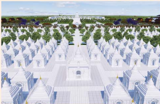
ကျောက်စာရုံစေတီ(၁၂ x ၁၂x ၁၈)ပေ ၁ ဆူ တန်ဖိုး- ၂၇၉ သိန်း