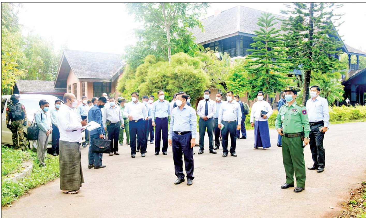
နိုင်ငံတော်စီမံအုပ်ချုပ်ရေးကောင်စီဥက္ကဋ္ဌ နိုင်ငံတော်ဝန်ကြီးချုပ် ဗိုလ်ချုပ်မှူးကြီး မင်းအောင်လှိုင်နှင့် အဖွဲ့ဝင်များ ပြင်ဦးလွင်မြို့ ဘုရင်ခံအိမ်တော် (Governor House) ထိန်းသိမ်းထားရှိမှုတို့အား လှည့်လည်ကြည့်ရှုစစ်ဆေးစဉ်။

ထို့နောက် နိုင်ငံတော်စီမံအုပ်ချုပ်ရေးကောင်စီ ဥက္ကဋ္ဌ နိုင်ငံတော်ဝန်ကြီးချုပ်နှင့် အဖွဲ့ဝင်များသည် အမျိုးသားကန်တော်ကြီးဥယျာဉ်အတွင်း မော်တော် ယာဉ်များဖြင့် လှည့်လည်ကြည့်ရှုစစ်ဆေးပြီး ရေဝေ ရေလဲဧရိယာနေရာများနှင့် ဥယျာဉ်အတွင်း ရေဝင်၊ ရေထွက်နှင့် လေဝင်၊ လေထွက် ကောင်းမွန်စေရေး အောက်ခြေရှင်းလင်းခြင်းများနှင့် အလင်းဖွင့်ခြင်းများ လုပ်ဆောင်ပေးရန်နှင့် လိုအပ်ပါက တတ်ကျွမ်းသည့် ပညာရှင်များဖြင့် တိုင်ပင်လုပ်ဆောင်ကြရန် လိုအပ် သည့် အခြေအနေများနှင့်ပတ်သက်၍ တာဝန်ရှိသူ များကို မှာကြားသည်။ ယင်းနောက် နိုင်ငံတော် စီမံအုပ်ချုပ်ရေးကောင်စီဥက္ကဋ္ဌ နိုင်ငံတော်ဝန်ကြီးချုပ် နှင့် အဖွဲ့ဝင်များသည် ကန်တော်လေး ရေထိန်းတံခါး ပြုလုပ်ဆောင်ရွက်ထားရှိသည့်နေရာသို့ ရောက်ရှိ စစ်ဆေးကာ လိုအပ်သည်များ မှာကြားသည်။ အဆိုပါ အမျိုးသားကန်တော်ကြီးဥယျာဉ်အတွင်းရှိ ရေကန်များသို့ ယခင်နှစ်ပိုင်းက ရေဝင်ရောက်မှု နည်းပါးနေသည့်အတွက် နိုင်ငံတော်စီမံအုပ်ချုပ်ရေး ကောင်စီဥက္ကဋ္ဌ နိုင်ငံတော်ဝန်ကြီးချုပ်၏ ၂၀၂၁ ခုနှစ် စက်တင်ဘာလနှင့် ဒီဇင်ဘာလအတွင်း ပြင်ဦးလွင်