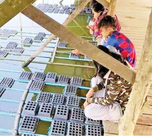
ရခိုင်ပြည်နယ်တွင် မွေးမြူထုတ်လုပ်လျက်ရှိသည့် ကဏန်းမွေးမြူရေးကန် တစ်ခု၌ အစာကျွေးခြင်းနှင့် အခွံမာမှအခွံပျော့သို့ ပြောင်းလဲချိန်အားစောင့်ဆိုင်း ထုတ်ယူနေကြစဉ်။

ဂရမ်အထက်များကို အရေပျော့မွေးကန် သို့ပေးပို့ခြင်း၊ အရေခွဲလဲသည့်အထိ (၄၅ ရက်မှ ရက်ပေါင်း ၆၀ အထိ) မွေးမြူခြင်း၊ အရေပျော့ကဏန်းဖမ်းဆီးခြင်း၊ အရေခွဲ များ ပြန်မမာစေရန် 15 ppm ကလိုရင်း ဖြတ်၍ မိနစ် ၃၀ ခန့်ရေချိုစိမ်ခြင်း၊ ကုန်ချောထုတ်လုပ်ရန် အအေးခန်းသို့ ပေးပို့ခြင်းတို့ကို ဆောင်ရွက်ရသည်။ ကုန်ချောပြုပြင်ထုတ်လုပ်မှုတွင် ကဏန်း ပျော့မွေးကန်မှ ပေးပို့သော ကဏန်းများ ကို ဆေးကြောခြင်း၊ ပိုးသတ်ခြင်း၊ ပုံစံညှပ် ခြင်း၊ သန့်စင်ခြင်း၊ အရွယ်အစားရွေးခြင်း၊ ထပ်မံပိုးသတ်ခြင်း၊ ချိန်တွယ်ခြင်း၊ အေးခဲခြင်း၊ ထုပ်ပိုးခြင်း၊ သိုလှောင်ခြင်းနှင့် ဈေးကွက်သို့တင်ပို့ခြင်းဖြင့် ကဏန်းပျော့ (Soft Shell Crab)များကို ပြည်ပနိုင်ငံ များသို့ တင်ပို့လျက်ရှိကြောင်း သိရသည်။ ကဏန်းပျော့ထုတ်လုပ်သော လုပ်ငန်း တွင် ကုန်ကြမ်းမှကုန်ချောအဖြစ် တန်ချိန်