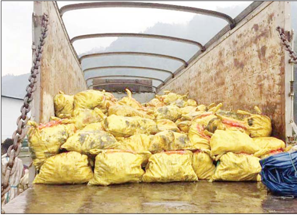
ကချင်ပြည်နယ်၌ ကျောက်စိမ်းအရိုင်းတုံးများ သိမ်းဆည်းရမိမှု။

တရားမဝင်ကုန်သွယ်မှုတိုက်ဖျက်ရေး ဦးဆောင်ကော်မတီ၏ ကြီးကြပ်ကွပ်ကဲမှုဖြင့် တရားမဝင် ကုန်သွယ်မှုများကို ဥပဒေနှင့်အညီ ထိရောက်စွာ တားဆီးအရေးယူနိုင်ရေး ဆောင်ရွက်လျက်ရှိရာ ကချင်ပြည်နယ် တရားမဝင်ကုန်သွယ်မှုတိုက်ဖျက်ရေးအဖွဲ့၏ စီမံခန့်ခွဲမှုဖြင့် စစ်ဆေးမှုများဆောင်ရွက်ခဲ့ရာ ဧပြီ ၁၁ ရက်တွင် ရှေ့တန်းအမှတ်(၃၈၁)ခြေမြန်တပ်ရင်းမှ ယာယီတပ်ရင်းမှူး ဦးဆောင် သော စစ်ဆေးရေးအဖွဲ့က ကန်ပိုက်တီကုန်သွယ်ရေးစခန်းနှင့် မြန်မာ- တရုတ်ချစ်ကြည်ရေး လိုဏ်ခေါင်းအနီး (မြန်မာဘက်ခြမ်း)၌ ရပ်တန့် ထားသော ၁၂ ဘီးကုန်တင်ယာဉ်သုံးစီးပေါ်မှ တရားမဝင် ကျောက်စိမ်းအရိုင်းတုံးများ ၄၀၉၂၁ ကီလိုဂရမ် (ခန့်မှန်းတန်ဖိုး ငွေကျပ် ၂၄၀၅၁၄၄၈၀)ကို မြန်မာ့ကျောက်မျက်ရတနာဥပဒေအရ လည်းကောင်း၊ ဧပြီ ၁၀ ရက်နှင့် ၁၅ ရက်များတွင် ပြည်နယ် သစ်တောဦးစီးဌာန ဦးဆောင်သော စစ်ဆေးရေးအဖွဲ့က တရားမဝင် ကျွန်းသစ်များ ၇ ဒသမ ၀၃၄ တန် (ခန့်မှန်းတန်ဖိုးငွေကျပ် ၅၇၄၅၀၀) ကို သစ်တောဥပဒေအရလည်းကောင်း သိမ်းဆည်းအရေးယူဆောင်ရွက် လျက်ရှိသည်။