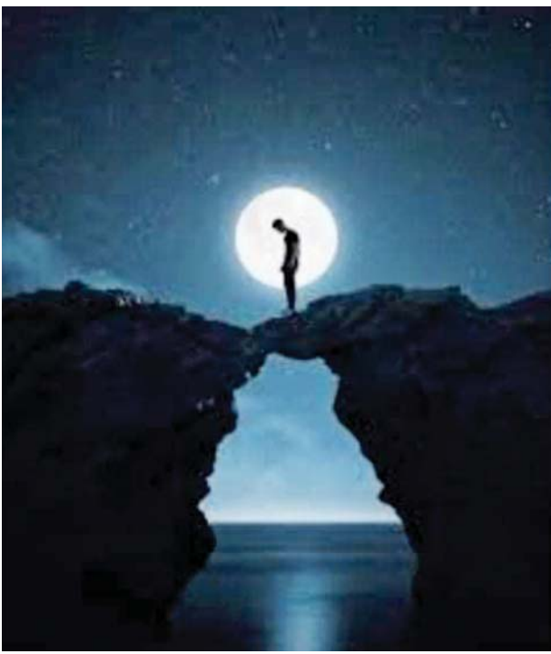
ပညာရှာနိုင်စေဖို့ လမ်းညွှန်ကူညီခြင်းသာဖြစ်တယ်။

ပညာဆိုတာ တက္ကသိုလ်နဲ့ စာသင်ခန်းအတွင်းမှာသာရှိနေတာ မဟုတ်ပါ။ လောကပြင်ကျယ် မိုးနဲ့မြေကြားမှာ ပညာသဘောက ရှိနေတာပါပဲ။ အခြေခံပညာ၊ အဆင့်မြင့်ပညာ၊ ကောလိပ်တက္ကသိုလ် တွေက ပညာရှာရာမှာ သက်သာလွယ်ကူစေဖို့ အထောက်အပံ့ ပေးတယ်။ ဆရာဆရာမတွေက စာသင်သားကို အခက်အခဲနည်းနည်းနဲ့