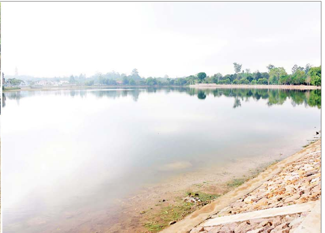
နိုင်ငံတော်စီမံအုပ်ချုပ်ရေးကောင်စီဥက္ကဋ္ဌ နိုင်ငံတော်ဝန်ကြီးချုပ် ဗိုလ်ချုပ်မှူးကြီး မင်းအောင်လှိုင်နှင့် အဖွဲ့ဝင်များ ပြင်ဦးလွင်မြို့ အမျိုးသားကန်တော်ကြီးဥယျာဉ်အတွင်း ကြည့်ရှုစစ်ဆေးစဉ်။

နေပြည်တော် ဧပြီ ၁၈ နိုင်ငံတော် စီမံအုပ်ချုပ်ရေးကောင်စီဥက္ကဋ္ဌ နိုင်ငံတော်ဝန်ကြီးချုပ် ဗိုလ်ချုပ်မှူးကြီး မင်းအောင်လှိုင်သည် ကောင်စီအဖွဲ့ဝင် ဗိုလ်ချုပ်ကြီး တင်အောင်စန်း၊ ကောင်စီတွဲဖက်အတွင်းရေးမှူး ဒုတိယဗိုလ်ချုပ်ကြီး ရဲဝင်းဦး၊ ပြည်ထောင်စုဝန်ကြီး များဖြစ်ကြသည့် ဦးတင်ထွဋ်ဦး၊ ဦးခင်မောင်ရီ၊ မန္တလေးတိုင်းဒေသကြီး ဝန်ကြီးချုပ် ဦးမောင်ကို၊ ကာကွယ်ရေးဦးစီးချုပ်ရုံးမှ တပ်မတော်အရာရှိ ကြီးများ၊ အလယ်ပိုင်းတိုင်းစစ်ဌာနချုပ် တိုင်းမှူး ဗိုလ်ချုပ်ကိုဦးနှင့် တာဝန်ရှိသူများ လိုက်ပါ၍ ယနေ့နံနက်ပိုင်းတွင် ပြင်ဦးလွင်မြို့ အမျိုးသား ကန်တော်ကြီးဥယျာဉ်နှင့် ဘုရင်ခံအိမ်တော် (Governor House) ထိန်းသိမ်းထားရှိမှု အခြေအနေ များကို သွားရောက်ကြည့်ရှုစစ်ဆေးသည်။