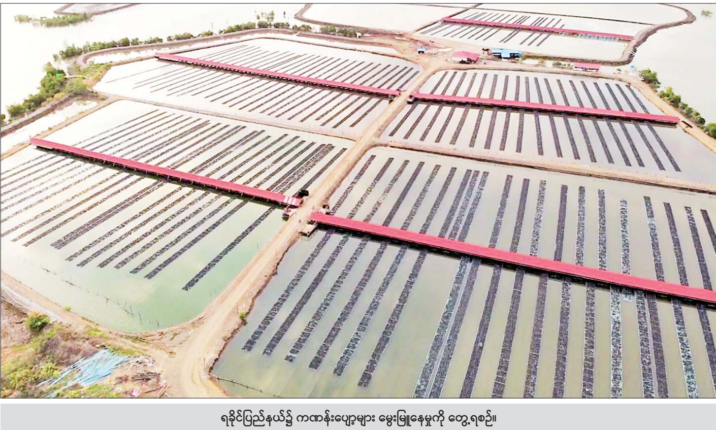
ရခိုင်ပြည်နယ်၌ ကဏန်းပျော့များ မွေးမြူနေမှုကို တွေ့ရစဉ်။

ရန်ကုန် ဧပြီ ၁၈ ပြည်ပပို့ကုန်ဈေးကွက် ခိုင်မာစွာရရှိထားသော ကဏန်းပျော့များကို ရခိုင်ပြည်နယ် မြို့နယ်သုံးခုရှိ မွေးမြူရေးကန်များမှ မွေးမြူထုတ်လုပ်လျက်ရှိပြီး လက်ရှိမွေးမြူရေးကန် ၁၆၇ ဧကကျော်မှ ဧက ၅၀၀ ခန့်အထိ တိုးချဲ့မွေးမြူထုတ်လုပ်နိုင်ရန် ကြိုးပမ်း ဆောင်ရွက်လျက်ရှိကြောင်း သိရသည်။ မွေးမြူထုတ်လုပ်လျက်ရှိ ရခိုင်ပြည်နယ်၌ စစ်တွေ၊ တောင်ကုတ်၊ ကျောက်ဖြူ မြို့နယ်တို့တွင် ကဏန်းပျော့ မွေးမြူရေးလုပ်ငန်းကို ၂၀၀၉-၂၀၁၀ ခုနှစ်ဝန်းကျင်က စတင်စမ်းသပ် မွေးမြူခဲ့ပြီး ကျောက်ဖြူမြို့နယ် ချီကျွန်းဒေသ၌ လုပ်ငန်းရှင်တစ်ဦးက ကဏန်းကောင်ရေ ၅၀၀၀၀ ခန့်ကို စမ်းသပ်မွေးမြူခဲ့သည်။ ကဏန်းပျော့မွေးမြူရေး လုပ်ငန်းကို စစ်တွေမြို့နယ်နှင့် ပုဏ္ဏားကျွန်းမြို့နယ် တို့တွင် ၉၇ ဒသမ ၈၅ ဧက၊ ကျောက်ဖြူမြို့နယ်တွင် ၃၇ ဒသမ ၇၅ ဧက၊ သံတွဲခရိုင်တောင်ကုတ်မြို့နယ်တွင် ဧက ၃၁ ဒသမ ၉၀ ဖြင့် စုစုပေါင်း ဧက ၁၆၇ ဒသမ ၅၀ တွင် မွေးမြူထုတ်လုပ်လျက်ရှိကြောင်း သိရသည်။ မွေးမြူရေးကန်များ၌ ကဏန်းမှ ကဏန်းပျော့ အဖြစ် အရေခွဲလဲချိန်တွင် ထုတ်ယူပြီး အအေးခန်း စက်ရုံသို့ စာမျက်နှာ ၁၅ ကော်လံ ၁ သို့ ၀