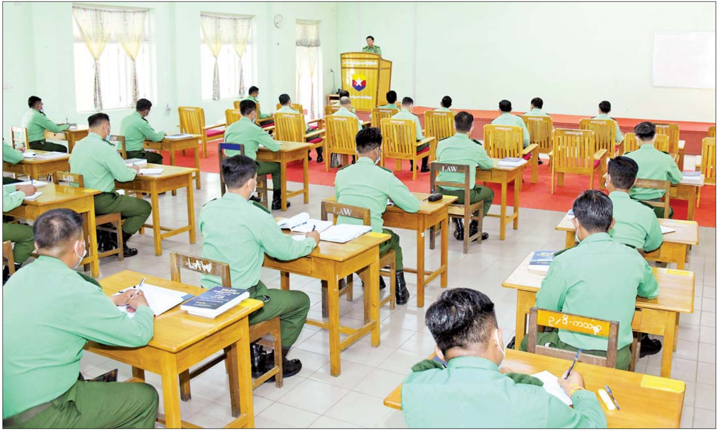
နိုင်ငံတော်စီမံအုပ်ချုပ်ရေးကောင်စီဥက္ကဋ္ဌ တပ်မတော်ကာကွယ်ရေးဦးစီးချုပ် ဗိုလ်ချုပ်မှူးကြီး မင်းအောင်လှိုင် ပြင်ဦးလွင်တပ်နယ်ရှိ တပ်မတော်အုပ်ချုပ်မှု ကျောင်း၌ ဥပဒေဒီပလိုမာသင်တန်းသားအရာရှိများအား တွေ့ဆုံ အမှာစကားပြောကြားစဉ်။

ဦးစွာ နိုင်ငံတော်စီမံအုပ်ချုပ်ရေးကောင်စီဥက္ကဋ္ဌ တပ်မတော်ကာကွယ်ရေးဦးစီးချုပ်က အမှာစကား ပြောကြားရာတွင် လေ့ကျင့်ရေးနှင့်ပတ်သက်၍ မှာကြားနိုင်ရေး ယခုကဲ့သို့ စုစုစည်းစည်းဖြင့် တွေ့ဆုံ ခြင်းဖြစ်ကြောင်း၊ တပ်မတော်တိုင်းတွင် စွမ်းရည် ထက်မြက်ရေးအတွက် လေ့ကျင့်ရေးသည် မရှိမဖြစ် လိုအပ်ပြီး စွမ်းရည် စွမ်းအားရှိသည့် အရည်အချင်းရှိ သည့် တပ်မတော်ကို လေ့ကျင့်ရေးဖြင့် တည်ဆောက် ရမည်ဖြစ်ကြောင်း၊ ထိုသို့တည်ဆောက်ရာတွင် အခြေခံလေ့ကျင့်ရေးနှင့် တန်းမြင့်လေ့ကျင့်ရေးတို့ကို သင်ကြားပို့ချပေးလျက်ရှိကြောင်း၊ စစ်သားကောင်း တစ်ယောက်ဖြစ်စေရေးအတွက် စိတ်ဓာတ်၊ စည်းကမ်းကောင်းရန်၊ ကျန်းမာကြံ့ခိုင်မှုရှိရန် လိုအပ် မည်ဖြစ်ကြောင်း၊ “ချွေးထွက်များမှ သွေးထွက်နည်း မည်” ဟူသည့် ဆောင်ပုဒ်နှင့်အညီ သင်တန်းကျောင်း များတွင် လေ့ကျင့်ပေးသည်များရှိသကဲ့သို့ တစ်ဦးချင်း နေ့စဉ် လုပ်ဆောင်နေရသည့် တာဝန်များကို မှန်မှန် ကန်ကန် လုပ်ဆောင်လိုက်နာခြင်းသည်လည်း လေ့ကျင့်ရေးဆောင်ရွက်နေခြင်းပင် ဖြစ်ကြောင်း၊ “လေ့လာ၊ လေ့ကျင့်၊ လိုက်နာ” ဟူသည့် လေ့ကျင့်ရေး