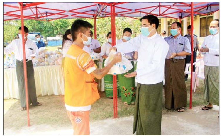
သာယာရေးဝန်ထမ်း ၁၂၀ အား ဆန်၊ ဆီ၊ ကြောင်း သိရသည်။ ဘဲဥ၊ ကြက်သွန်နီများ ထောက်ပံ့ပေးအပ်ခဲ့ တိုင်းဒေသကြီး(ပြန်/ဆက်)

ဆောင်ရွက်ရာတွင် သတိရှိရှိဖြင့် မပေါ့ဆ ဘဲ လုပ်ကိုင်ဆောင်ရွက်စေလိုကြောင်းနှင့် ပဲခူးမြို့အား အစဉ်အမြဲသန့်ရှင်းသာယာ လှပစေရေး ကြိုးစားဆောင်ရွက်ပေးကြ စေလိုကြောင်း ပြောကြားသည်။ ထောက်ပံ့ပေးအပ် ထို့နောက် တိုင်းဒေသကြီး ဝန်ကြီး ချုပ်၊ တိုင်းဒေသကြီး တရားလွှတ်တော် တရားသူကြီးချုပ်ဒေါ်လွင်လွင်အေးကျော်၊ အစိုးရအဖွဲ့ဝန်ကြီးများ၊ တိုင်းဒေသ ကြီးစည်ပင်သာယာရေးအဖွဲ့ ညွှန်ကြား ရေးမှူး ဦးအောင်မြင်တို့က စည်ပင်