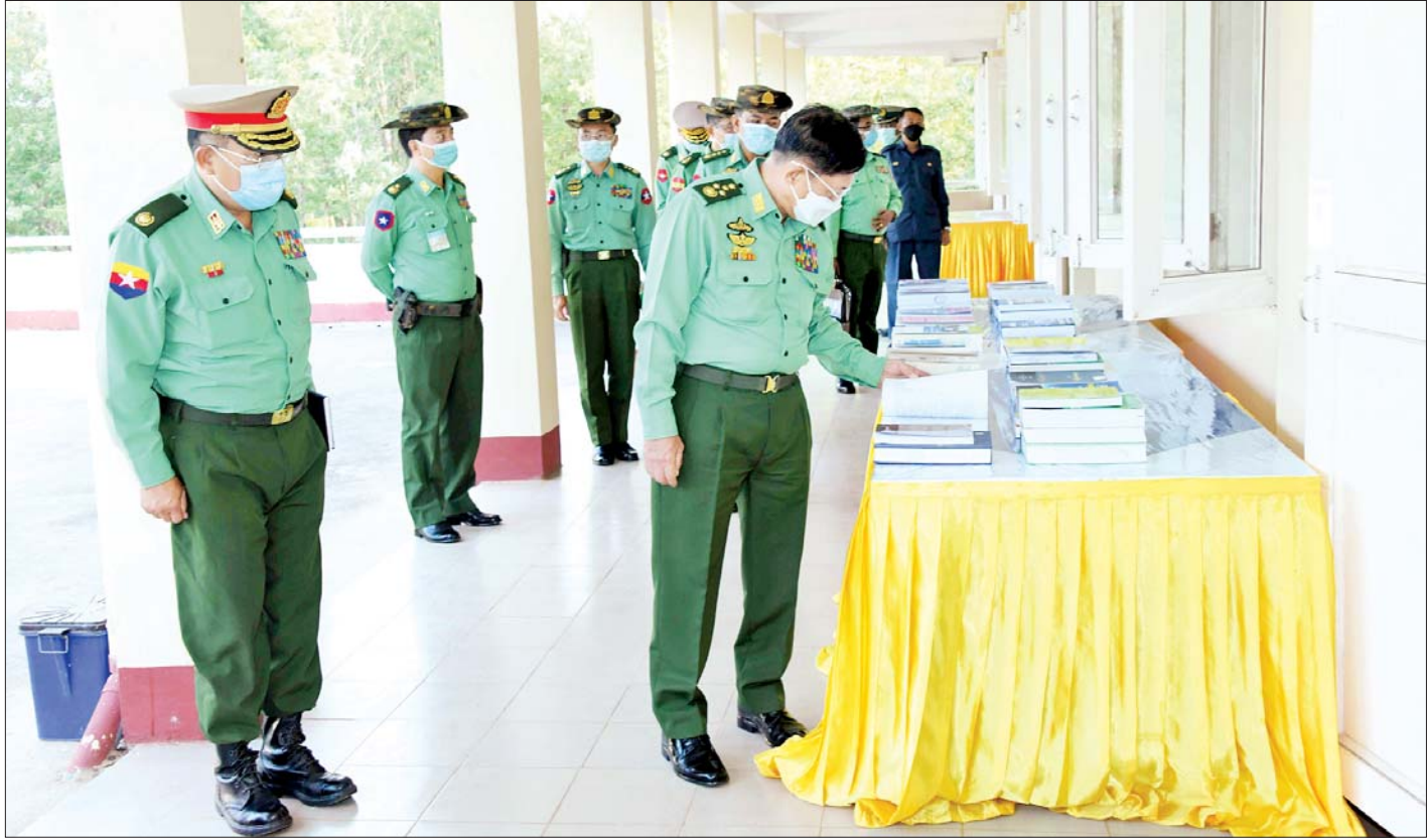
နိုင်ငံတော်စီမံအုပ်ချုပ်ရေးကောင်စီဥက္ကဋ္ဌ တပ်မတော်ကာကွယ်ရေးဦးစီးချုပ် ဗိုလ်ချုပ်မှူးကြီး မင်းအောင်လှိုင် ပြင်ဦးလွင်တပ်နယ်ရှိ တပ်မတော်အုပ်ချုပ်မှု ကျောင်း၌ သင်တန်းအထောက်အကူပြုဆိုင်ရာ ဥပဒေစာအုပ်စာတမ်းများကို ကြည့်ရှုစစ်ဆေးစဉ်။

စစ်သည်တိုင်းကို စစ်အခြေခံလေ့ကျင့်ရေးမှ သည် တာဝန်ထမ်းဆောင်သည့် နေရာဌာနအပေါ် မူတည်၍ တစ်ဆင့်မြင့် လေ့ကျင့်ရေးများကို ဆောင်ရွက်ပေးလျက်ရှိကြောင်း၊ ထိုသို့ သင်ကြား ပေးရာတွင်လည်း သင်ရိုးညွှန်းတမ်းရေးဆွဲခြင်းသည် အဓိကကျပြီး သင်ရိုးညွှန်းတမ်းရေးဆွဲရာ၌ နိုင်ငံတော်၏ ကာကွယ်ရေးမူဝါဒနှင့် ကိုက်ညီမှု ရှိ၊ မရှိ၊ မိမိတပ်များ၏ စွမ်းရည်ကို မြှင့်တင်နိုင်မှု ရှိ၊ မရှိ သုံးသပ်ဆောင်ရွက်ရမည်ဖြစ်ပြီး ပိုမိုပြည့်စုံ ကောင်းမွန်စေရေး နိုင်ငံတကာမှ သင်ရိုးညွှန်းတမ်း များကိုလေ့လာ၍သော်လည်းကောင်း၊ ခေတ်အလိုက် သင်ကြားရာမှ လိုအပ်ချက်များကို ထပ်မံဖြည့်စွက်၍ သော်လည်းကောင်း ရေးဆွဲရမည်ဖြစ်ပြီး ကောင်းမွန် သည့် လေ့ကျင့်ရေးမှ ကောင်းမွန်ပြီး အရည်အသွေးရှိ သည့် စစ်သည်များကို မွေးထုတ်ပေးနိုင်ရမည်ဖြစ် ကြောင်း၊ သက်ဆိုင်ရာကဏ္ဍအလိုက် တတ်ကျွမ်း သည့် စစ်သည်များကို မွေးထုတ်ပေးနိုင်ရမည်ဖြစ် ကြောင်း၊ သင်ကြားမှု၊ သင်ယူမှု အထောက်အကူပြု ပစ္စည်းများ ပြည့်စုံစွာရှိရေးကိုလည်း ဆောင်ရွက်ရန် လိုကြောင်း၊ ထိုသို့ဆောင်ရွက်ထားမှသာလျှင် လေ့ကျင့်သားပြည့်စုံမည်ဖြစ်ပြီး တစ်ဦးချင်း ကိုင်တွယ်ရမည့် လက်နက်နှင့် လက်ရုံးတပ်ဖွဲ့များ အလိုက် ကိုင်တွယ်ရမည့် ကိရိယာများကို ကျွမ်းကျင် ပိုင်နိုင်မည်ဖြစ်ကြောင်း။