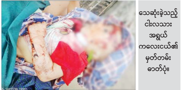
သေဆုံးခဲ့သည့် ငါးလသား အရွယ် ကလေးငယ်၏ မှတ်တမ်း ဓာတ်ပုံ။