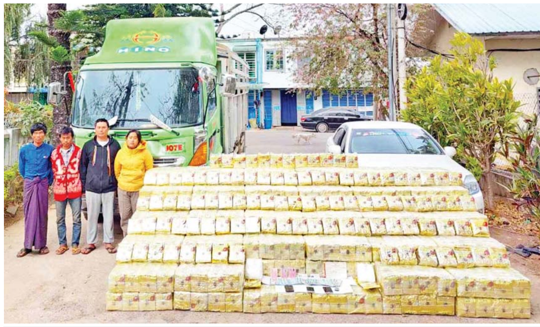
ပြင်ဦးလွင်မြို့၊ ညောင်ကုန်း ပူးပေါင်းစစ်ဆေးရေးဂိတ်၌ ၄-၂-၂၀၂၂ ရက်က ငွေကျပ် ဘီလီယံ ၃၀ တန်ဖိုးရှိ မူးယစ်ဆေးဝါးများနှင့်အတူ တရားခံများအား ဖမ်းမိစဉ်။

၁၈၂၆ ခုနှစ် ပထမ အင်္ဂလိပ်-မြန်မာစစ်ပွဲအပြီး ရခိုင်ပြည်နယ်နှင့် တနင်္သာရီတိုင်းတို့ကို နယ်ချဲ့ပြုတိသျှတို့က သိမ်းယူခဲ့သည်။ ထို့နောက် ပြုတိသျှတို့သည် ရခိုင်နှင့် တနင်္သာရီသို့ သင်္ဘောဖြင့် ဘီနန်းများကိုတင်သွင်းခဲ့သည်။ မြန်မာတိုင်းရင်းသားများ ဘီနန်းမရှူတတ်၊ မစားတတ်သောကြောင့် အခမဲ့ပေး၍ ဖြန့်ဝေခြင်း၊ ရှူပုံရှူနည်းပြသခြင်းဖြင့် ရခိုင်တွင် လိုင်စင်ရ ဘီနန်းခန်းများဖွင့်လှစ်ရန် ဆောင်ရွက်ပေးခဲ့ရာ လိုင်စင်စီရင်္ဂိသူများမှာ တရုတ်နှင့် ဘင်္ဂါလီများဖြစ်သည်။ ဘီနန်းခန်းများ ဖွင့်လှစ်ခွင့်ပြုသောအခါ ရခိုင်ပြည်နယ်အတွင်း၌ ဘီနန်းရှူ၊ ဘီနန်းစားခြင်းများ ပြန့်ပွားလာခဲ့သည်။ ထိုအခါ ရခိုင်ပြည်နယ်ရှိ ရဟန်းရှင်လူပြည်သူတို့က ဘီနန်းခန်းများ ထပ်မံဖွင့်ရန်မေတ္တာရပ်ခံခဲ့