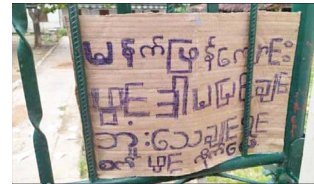
သရက်မြို့နယ် သဲဖြူအခြေခံပညာအလယ်တန်းကျောင်း၌ အကြမ်းဖက်သမားများ ချိတ်ဆွဲထားသည့် ခြိမ်းခြောက်စာ မှတ်တမ်းဓာတ်ပုံ။

ကြောင်း သိရသည်။ အလားတူ ဇွန် ၂၂ ရက် နံနက် ၈ နာရီခန့်တွင် ကရင်ပြည်နယ် သံတောင်ကြီးမြို့နယ် ရွှေညောင်ပင်ကျေးရွာရှိ အခြေခံပညာ အလယ် တန်းကျောင်း၌လည်းကောင်း၊ နံနက် ၈ နာရီခန့်တွင် မန္တလေး တိုင်းဒေသကြီး ကျောက်ပန်းတောင်းမြို့နယ် လေးပင်ကျေးရွာရှိ အခြေခံ ပညာအထက်တန်းကျောင်း၌လည်းကောင်း၊ အမရပူရမြို့နယ် အောင်ချမ်းသာရပ်ကွက်ရှိ မြစ်ငယ် အခြေခံပညာအထက်တန်းကျောင်း၌ လည်းကောင်း၊ နံနက် ၉ နာရီခန့်တွင် မကွေးတိုင်းဒေသကြီး သရက် မြို့နယ် သဲဖြူကျေးရွာရှိ အခြေခံပညာအလယ်တန်း ကျောင်း၌ လည်းကောင်း PDF အမည်ခံအကြမ်းဖက်သမားများက ကျောင်းတက် ရောက်မှုကို ခြိမ်းခြောက်သည့် ခြိမ်းခြောက်စာများ လာရောက်ချိတ်ဆွဲ ထားကြောင်း သိရသည်။ အထက်ပါ ဖြစ်စဉ်မှ ကျောင်းသား ကျောင်းသူ ဆရာ၊ မိဘများ အား အထိတ်တလန့်ဖြစ်စေရန်နှင့် စာသင်ကျောင်းများ ဖွင့်လှစ်သင်ကြား ခြင်းမပြုနိုင်စေရန် ရည်ရွယ်၍ ခြိမ်းခြောက်အကြမ်းဖက်ခြင်းများ ပြုလုပ်ခဲ့သည့် နိုင်ငံရေးအစွန်းရောက်အကြမ်းဖက်များအား ဖော်ထုတ်