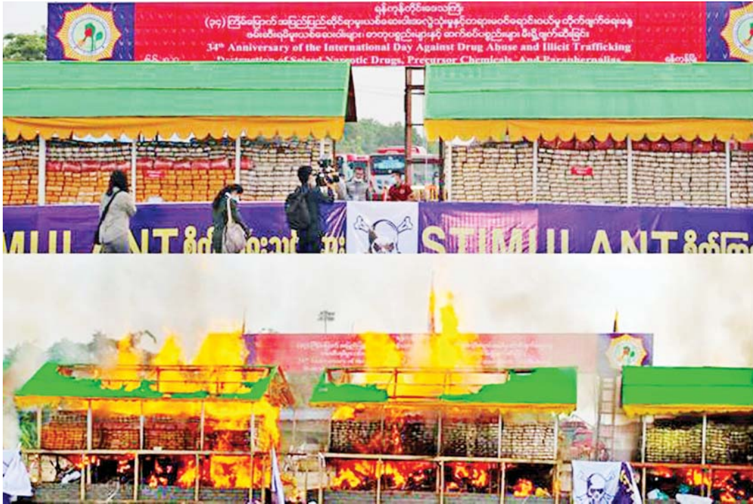
၂၆-၆-၂၀၂၁ ရက်က ရန်ကုန်မြို့၌ သိမ်းဆည်းရမိမူးယစ်ဆေးဝါးများအား မီးရှို့ဖျက်ဆီးစဉ်။

မူးယစ်ဆေးဝါး၏ ပင်ရင်းဖြစ်သည့် “ဘီနန်း” ဟူသော ဝေါဟာရသည် မြန်မာဝေါဟာရမဟုတ်ဘဲ မူလဇာတိဒေသဖြစ်သော ဥရောပတိုက်မြေထဲပင်လယ်အာရှမိုင်းနားဒေသတွင် အိဗွန်ဟုခေါ်ဆို၍ ယင်းကို အိန္ဒိယဘာသာစကားဖြင့် ‘အဖိန်း’ ဟု ခေါ်ဆိုရာမှ မွန်မြန်မာဘာသာဖြင့် ‘ဘီနန်း’ ဟူ၍ ဖြစ်ပေါ်လာခြင်းဖြစ်သည်။