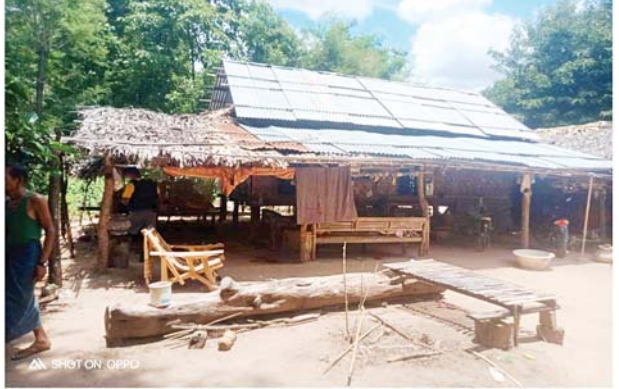
ဖြစ်စဉ်ဖြစ်ပွားခဲ့သည့် နေအိမ်မှတ်တမ်းဓာတ်ပုံ။