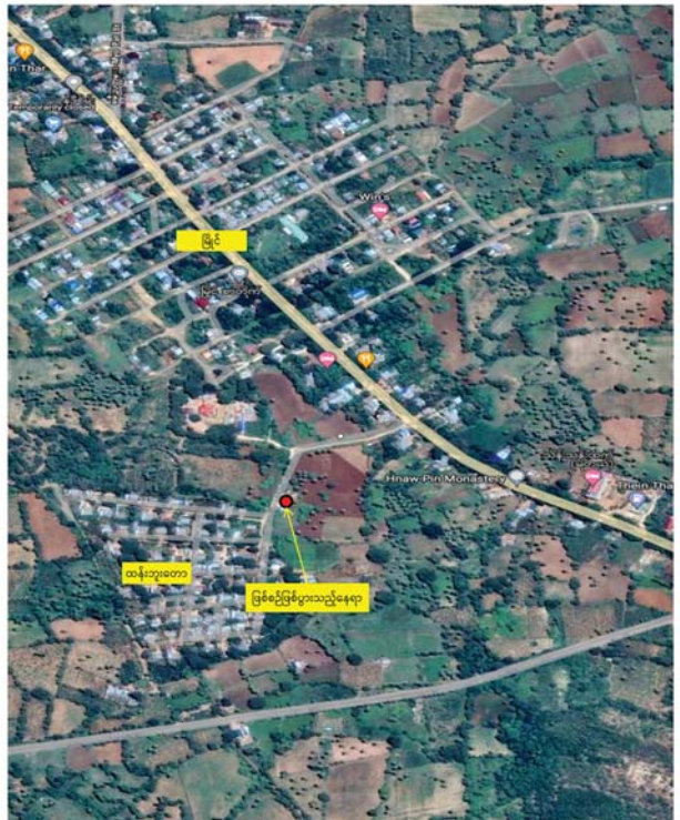
PDF အမည်ခံအကြမ်းဖက်သမားများ၏ Drone ဖြင့် တိုက်ခိုက်ခဲ့သည့် ဖြစ်စဉ်နေရာပြပုံ။