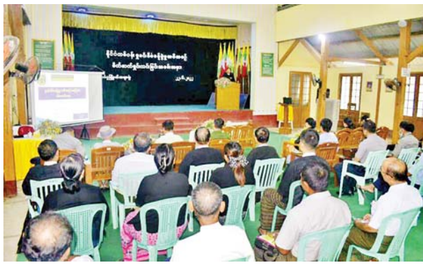
အင်္ဂုပူမြို့နယ်တွင် နိုင်ငံတစ်ဝန်း မှုခင်းစီမံခန့်ခွဲမှုအစီအစဉ် မိတ်ဆက်ရှင်းလင်းခြင်း အခမ်းအနား ကျင်းပ

PDF အမည်ခံအကြမ်းဖက်သမားများအနေဖြင့် စစ်ရေးနှင့်မသက်ဆိုင်သော အရပ်ဘက် နေအိမ်အဆောက်အအုံများ၊ အရပ်သားပြည်သူများ အပေါ် ယခုကဲ့သို့ အကြမ်းဖက်တိုက်ခိုက်ခြင်းသည် ဂျီနီဗာကွန်ဗင်းရှင်း များနှင့် အပြည်ပြည်ဆိုင်ရာ ဥပဒေတို့အရ စစ်ရာဇဝတ်မှု (War Crime) ကို ကျူးလွန်ခြင်းဖြစ်ပြီး အထက်ပါဖြစ်စဉ်နှင့်ပတ်သက်၍ အကြမ်းဖက်မှုကို ကျူးလွန်ခဲ့သူများအား ပြည်သူ့လူထု တစ်ရပ်လုံးမှ ရွံရှာစက်ဆုတ် လျက်ရှိကြောင်းနှင့် ၎င်းတို့အား ဖမ်းဆီးရမိရေးအတွက် လုံခြုံရေး တပ်ဖွဲ့ဝင်များက ဒေသပြည်သူများနှင့်ပူးပေါင်း၍ လုပ်ထုံးလုပ်နည်းနှင့် အညီ ဆက်လက်ဆောင်ရွက်လျက်ရှိကြောင်း သိရသည်။ သတင်းစဉ်