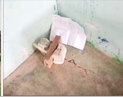
ကလေးမြို့နယ် သာမိုင်းခမ်းကျေးရွာ အခြေခံပညာမူလတန်းကျောင်း၌ အကြမ်းဖက်သမား များက လက်လုပ်မိုင်းတစ်လုံးနှင့် ခြိမ်းခြောက်စာတစ်စောင် လာရောက်ချထားမှု မှတ်တမ်း ဓာတ်ပုံ။