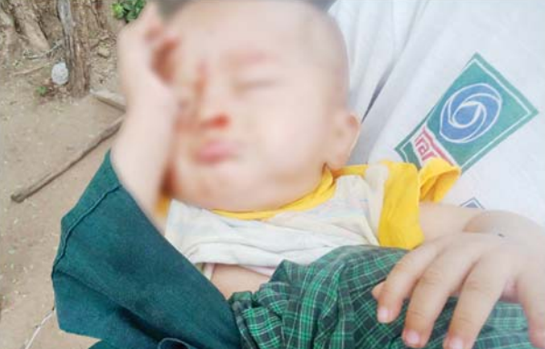
ဒဏ်ရာရရှိခဲ့သည့် ငါးလသားအရွယ် ကလေးငယ်၏ မှတ်တမ်း ဓာတ်ပုံ။