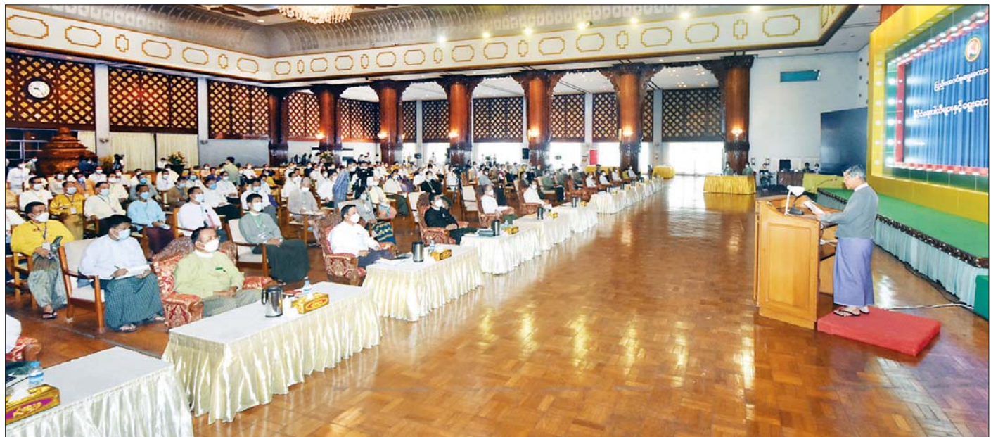
ပြည်ထောင်စုရွေးကောက်ပွဲကော်မရှင်ဥက္ကဋ္ဌ ဦးသိန်းစိုး ပြည်ထောင်စုရွေးကောက်ပွဲကော်မရှင်နှင့် နိုင်ငံရေးပါတီများ ရွေးကောက်ပွဲစနစ်ဆိုင်ရာ ဆွေးနွေးပွဲတွင် အမှာစကားပြောကြားစဉ်။