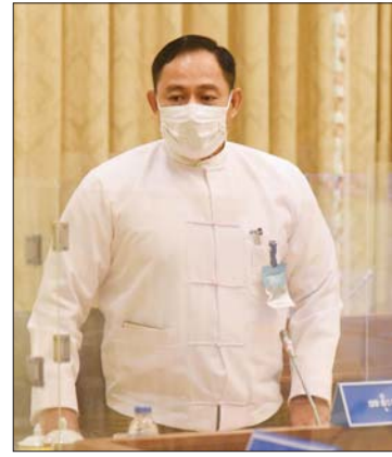
ပြည်ထောင်စုဝန်ကြီး ဒုတိယဗိုလ်ချုပ်ကြီး ရာပြည့်

ဆွေးနွေးတင်ပြမှုများအပေါ် (၇၄) နှစ်မြောက် လွတ်လပ်ရေးနေ့ ကျင်းပရေး ဗဟိုကော်မတီ ဥက္ကဋ္ဌ နိုင်ငံတော်စီမံအုပ် ချုပ်ရေးကောင်စီ ဒုတိယ ဥက္ကဋ္ဌက (၇၄) နှစ်မြောက် လွတ်လပ်ရေးနေ့ အခမ်း အနားအား အနုစာရရှိစွာဖြင့် အောင်မြင်စွာ ကျင်းပနိုင်ရေးနှင့် ပတ်သက်၍ လုံခြုံရေးဆိုင်ရာ ကိစ္စရပ် များအား စနစ်တကျဖြင့် ကြပ်မတ် ဆောင်ရွက်ရန်၊ ကိုဗစ် - ၁၉ စည်းကမ်း ချက်များနှင့်အညီ ကျင်းပနိုင်ရေး ဆောင်ရွက်ရန်၊ ဧည့်ခံကျွေးမွေးမှုများ စနစ်တကျဖြစ်စေရေး ဆောင်ရွက်ရန်၊ မီးရှူးမီးပန်းများ ပစ်ဖောက်ရာတွင် မီးဘေးအန္တရာယ်ကင်းရှင်းရေး လုပ်ငန်း များအား ကြိုတင်ပြင်ဆင်ဆောင်ရွက် ထားရန်၊ လွတ်လပ်ရေးနေ့ အထိမ်း အမှတ်အားကစားပွဲများနှင့် ပျော်ပွဲရွှင်ပွဲ များ ကျင်းပပြုလုပ်ရာတွင် ကိုဗစ်-၁၉