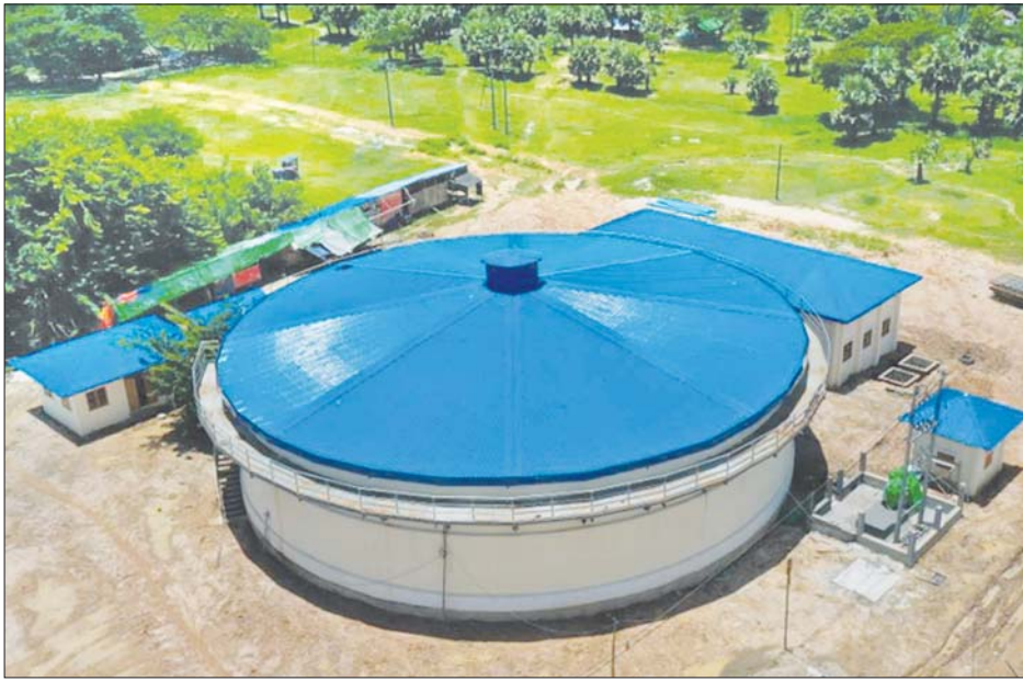
ဂါလန် ၁၄ သိန်းဆုံ ရေဖြန့်ဝေကန်။

စီမံကိန်းလုပ်ငန်းကို ဂျပန်နိုင်ငံ နှစ်ရှည်ချေးငွေ (JICA ODA Loan) ဖြင့် ဆောင်ရွက်ခဲ့ပြီး အသေးစိတ်စီမံကိန်း Design ရေးဆွဲခြင်းလုပ်ငန်းကို Singa System Co.,Ltd က တာဝန်ယူကာ တည်ဆောက်ရေးနှင့် ရေပိုက်လိုင်သွယ်တန်းခြင်းလုပ်ငန်းများကို Lot(1) နှင့် Lot(2) ခွဲ၍ တင်ဒါခေါ်ယူပြီး တင်ဒါအောင်ကုမ္ပဏီဖြစ်သော Authentic Co.,Ltd နှင့် ၂၀၁၉ ခုနှစ် မေ ၂၃ ရက်က စာချုပ်ချုပ်ဆိုခဲ့သည်။ စီမံကိန်းအတွက် လျာထားကုန်ကျငွေကျပ် ၁၉ ဒသမ ၉၈ ဘီလီယံဖြစ်ပြီး စီမံကိန်းကာလမှာ ၂၀၁၇-၂၀၁၈ ခုနှစ်မှ ၂၀၂၀-၂၀၂၁ ခုနှစ်အထိ ဖြစ်သည်။ စီမံကိန်းကို ၂၀၁၉ ခုနှစ် မေ ၂၃ ရက်က စတင်ဆောင်ရွက်ခဲ့ပြီး ၂၀၂၁ ခုနှစ် အောက်တိုဘာ ၃၀ ရက်အထိ လုပ်ငန်းပြီးစီးမှုမှာ တည်ဆောက်ရေး လုပ်ငန်း Lot(1) တွင် ၉၉ ရာခိုင်နှုန်း ပြီးစီးပြီဖြစ်ပြီး ရေပိုက်လိုင်သွယ်တန်းခြင်းလုပ်ငန်းများမှာ ၉၈ ရာခိုင်နှုန်း ပြီးစီးပြီ