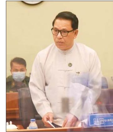
ပြည်ထောင်စုဝန်ကြီး ဦးမောင်မောင်အုန်း

စည်းကမ်းချက်များနှင့်အညီ ဆောင်ရွက် ၍ရသည့် အားကစားပြိုင်ပွဲများကိုသာ ကျင်းပပြုလုပ်ရန်နှင့်အခြား လိုအပ်သည် များအား ဖြည့်စွက်မှာကြားသည်။ ထို့နောက် (၇၄) နှစ်မြောက် လွတ်လပ်ရေးနေ့ ကျင်းပရေးဗဟို ကော်မတီဥက္ကဋ္ဌ နိုင်ငံတော်စီမံအုပ်ချုပ် ရေးကောင်စီဒုတိယဥက္ကဋ္ဌ ဒုတိယ ဝန်ကြီးချုပ် ဒုတိယဗိုလ်ချုပ်မှူးကြီး စိုးဝင်းက နိဂုံးချုပ်အမှာစကားပြောကြား ရာတွင် ယခုအစည်းအဝေးတွင် လုပ်ငန်း ဆောင်ရွက်မှုများ တိုးတက်လာသည်ကို တွေ့ရှိရပြီး ဆက်လက်အကောင်အထည် ဖော်ဆောင်ရွက်သွားရန်လိုအပ်ကြောင်း၊ နိုင်ငံတော် အဆင့်အနုစာရရှိသည့် လွတ်လပ်ရေးနေ့ အခမ်းအနားဖြစ်သည့် အတွက် နိုင်ငံတော်အဆင့်နှင့် လျော်ညီ စွာဖြင့် အဆင့်ရှိစွာ ကျင်းပနိုင်ရေး ဆပ် ကော်မတီများအလိုက် စနစ်တကျ