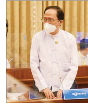
ပြည်ထောင်စုဝန်ကြီး ဒေါက်တာ သက်ခိုင်ဝင်း

ကြပ်မတ်စစ်ဆေး ဆောင်ရွက်ကြရန် လိုကြောင်း၊ အခမ်းအနားများအားလုံးအား လုံခြုံရေးအရ စနစ်တကျဖြစ်စေရေး တာဝန်ရှိသူများအနေဖြင့် သတိရှိစွာဖြင့်