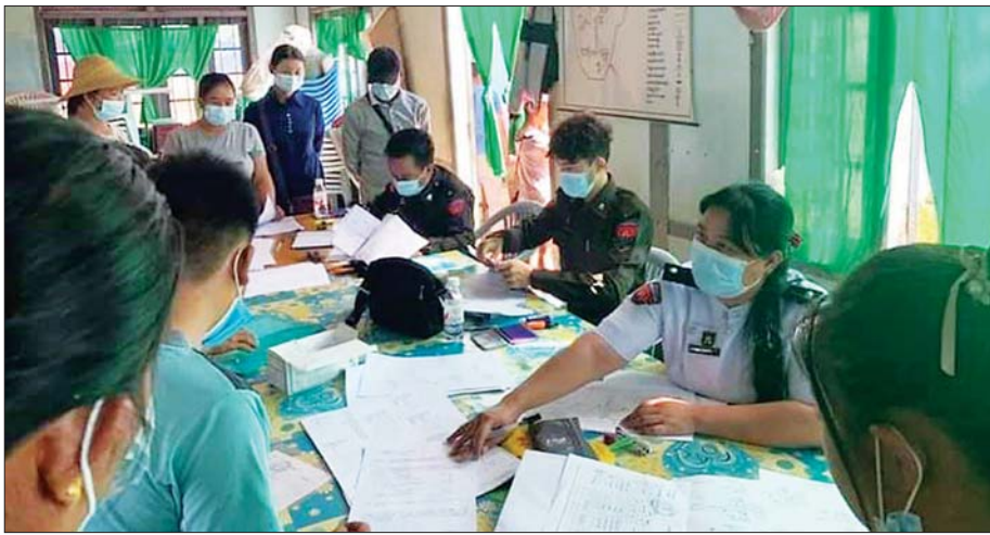
နမူနာမြို့နယ်၌ ပန်းခင်းစီမံချက်ဖြင့် အိမ်ထောင်စုလူဦးရေစာရင်းနှင့် နိုင်ငံသားစိစစ်ရေးကတ်ပြားများ ဆောင်ရွက်ပေးစဉ်။

ဖြေ ။ ဒီစီမံချက်ကာလက ကျွန်တော်တို့ရဲ့ အချိန်ကန့်သတ်ချက်နဲ့ ဆောင်ရွက်နေ တာဖြစ်တဲ့အတွက် အခုလိုအခြေအနေမှာ ရုံးမှာ ရော၊ ကွင်းဆင်းတာရောကို ရတဲ့အခြေအနေပေါ်မှာ မူတည်ပြီးတော့ ဆောင်ရွက်နေပါတယ်။ လက်ရှိ အနေအထားအရတော့ ကွင်းဆင်းဆောင်ရွက်လို့ ရှိရင် All One Stop Service ဖြစ်နိုင်အောင် ပြင်ဆင် ဆောင်ရွက်နေတာ ရှိပါတယ်။ ဒါတွေကတော့ သက်ဆိုင်ရာ လုံခြုံရေးအဖွဲ့အစည်းတွေနဲ့ ကြိုတင် ညှိနှိုင်းထားတာတွေ၊ ခရိုင်၊ မြို့နယ်၊ ရပ်ကွက်၊ ကျေးရွာအုပ်စုတွေနဲ့ ကြိုတင်လူစုပြီးတော့ ရှေ့ပြေး လျှောက်လွှာတွေ ဖြည့်စွက်နိုင်အောင် ကြိုတင် ဆောင်ရွက်ထားတာတွေကို အခု လက်ရှိလုပ်နေ ပါတယ်။