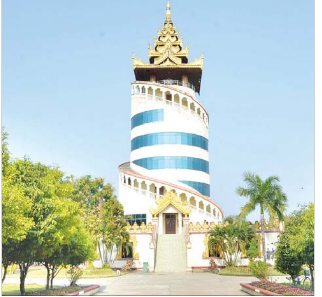
ပြည်ထောင်စုတိုင်းရင်းသားကျေးရွာအတွင်းရှိ နန်းမြင့်မျှော်စင်။