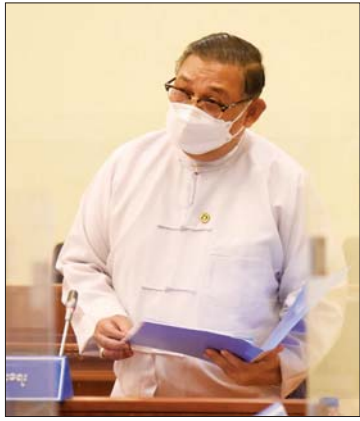
ပြည်ထောင်စုဝန်ကြီး ဦးဝဏ္ဏမောင်လွင်

ထို့နောက် နိုင်ငံတော်အလံတင်နှင့် နိုင်ငံတော် အလံအလေးပြုပွဲ စစ်ရေးပြ ဆပ်ကော်မတီ၊ နိုင်ငံတော်အလံ အလေးပြုပွဲအခမ်းအနား ကျင်းပရေး၊ ပြင်ဆင်ရေးနှင့် ဖိတ်ကြားရေး ဆပ် ကော်မတီ၊ လွတ်လပ်ရေးနေ့ ဧည့်ခံပွဲနှင့် ညစာစားပွဲကျင်းပရေး ဆပ်ကော်မတီ၊ မီးရှူးမီးပန်းများ ပစ်ဖောက်ရေး ဆပ် ကော်မတီ၊ လုံခြုံရေးဆပ်ကော်မတီ၊ ပြန်ကြားရေးဆပ် ကော်မတီ၊ လွတ်လပ် ရေးနေ့ သဝဏ်လွှာ ပြုစုရေးဆပ် ကော်မတီ၊ ကျန်းမာရေးဆပ်ကော်မတီ၊ အားကစားပြိုင်ပွဲများ ကျင်းပရေးဆပ် ကော်မတီနှင့် စာရင်းစစ်ဆေးရေးဆပ် ကော်မတီများမှ ကော်မတီ ဥက္ကဋ္ဌများနှင့် တာဝန်ရှိသူများက ကော်မတီများ အလိုက် စီမံဆောင်ရွက်လျက်ရှိမှု အခြေ အနေများကို ရှင်းလင်းဆွေးနွေး တင်ပြကြသည်။