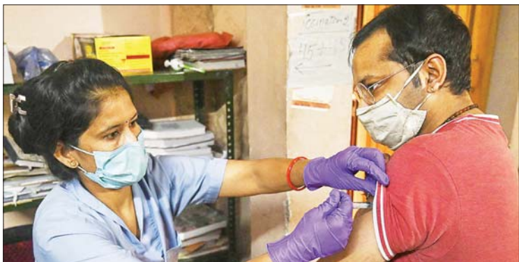
အိန္ဒိယနိုင်ငံတွင် ကိုဗစ်-၁၉ ကာကွယ်ဆေးထိုးနှံပေးနေသည်ကိုတွေ့ရစဉ်။

အတွင်း ကိုဗစ်-၁၉ ထပ်မံကူးစက်ဖြစ်ပွား သူ ၁၂၇၂၉ ဦးရှိလာသောကြောင့် နိုဝင်ဘာ