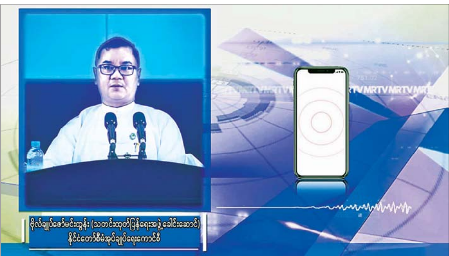
နိုင်ငံတော်စီမံအုပ်ချုပ်ရေးကောင်စီ သတင်းထုတ်ပြန်ရေးအဖွဲ့ခေါင်းဆောင် ဗိုလ်ချုပ် ဇော်မင်းထွန်း IMF ၏ RCF / RFI ချေးငွေများနှင့် ပတ်သက်၍ ရှင်းလင်းပြောကြားစဉ်။

ခုနစ်ပြောတဲ့ RCF ချေးငွေတွေက ဆိုင်းငံ့ကာလ ငါးနှစ် ခွင့်ပြုပြီးတော့ ချေးငွေသက်တမ်းက ၁၀ နှစ်ဖြစ်ပါတယ်။ RFI ချေးငွေကတော့ ဆိုင်းငံ့ကာလ သုံးနှစ်ကျော်ဖြစ်ပြီးတော့ ချေးငွေသက်တမ်းက ငါးနှစ် ဖြစ်ပါတယ်။ ကျွန်တော်ပြောလိုတာ ပြန်လည်ပေးဆပ်ရမယ့် ချေးငွေတွေ