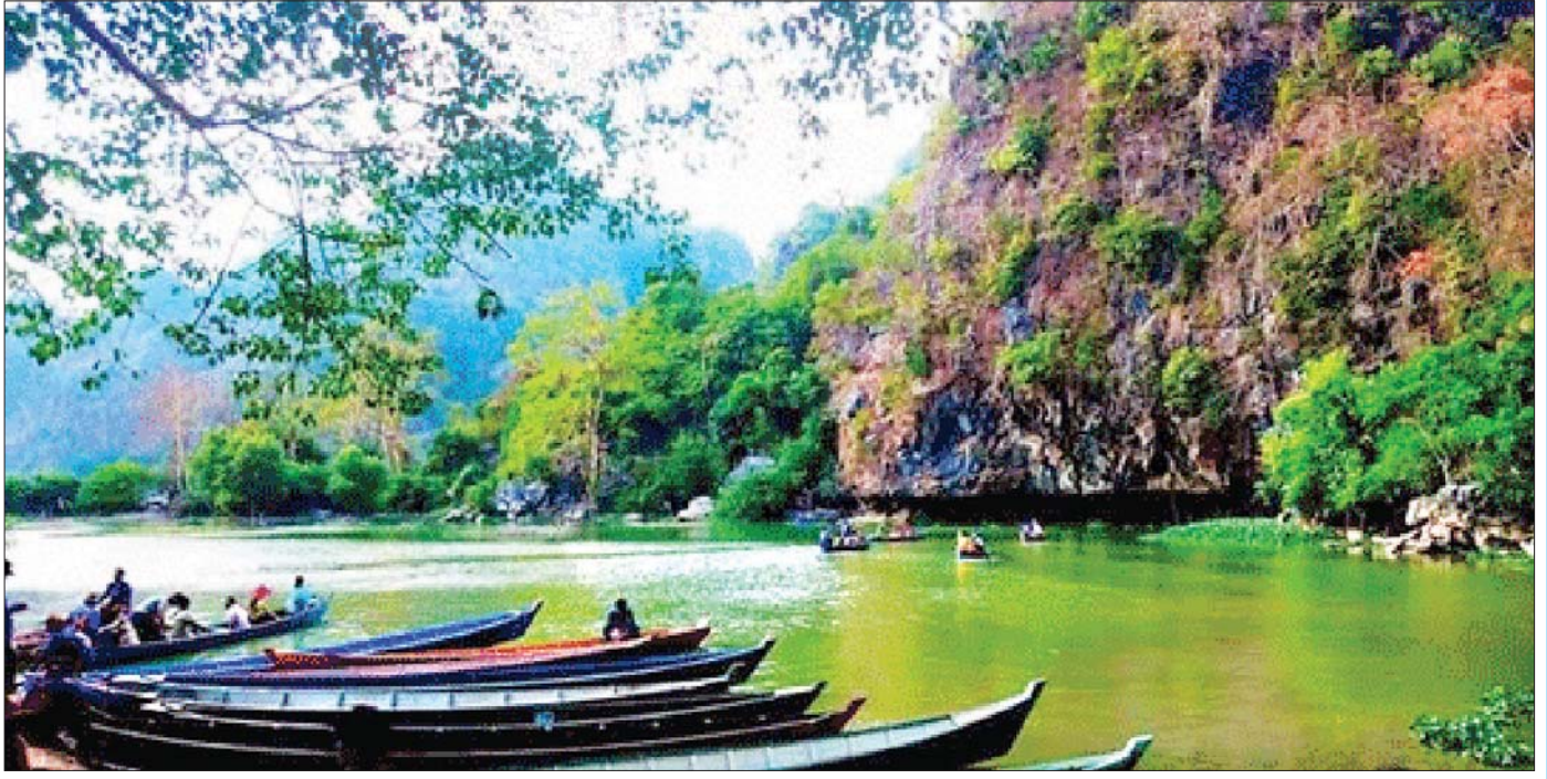
ဆဒွန်ဂူ၊ ဓာတ်ပုံ - KSG

သံတောင်ကြီးမြို့တွင် ကရင်လူမျိုးအများဆုံးနှင့် မြန်မာ၊ ဟိန္ဒူ၊ ကရင်နီ စသည့်လူမျိုးများ နေထိုင်ပြီး အများစု ၉၀ ရာခိုင်နှုန်းကျော်မှာ ခရစ်ယာန်ဘာသာကို ကိုးကွယ်ကြပါသည်။ ကရင်ရေးဟောင်းဒဏ္ဍာရီ နော်ဘူဘောတောင်နှင့် ဆုတောင်းတောင်တို့တွင် ခရစ်ယာန်ဘာသာရေးအခမ်းအနားများ ကျင်းပပြုလုပ်ချိန်၌ လာရောက်လည်ပတ်သူ အထူးပင် စည်ကားလှပြီး ပြည်ပခရီးသွား အနည်းငယ်လည်း စိတ်ဝင်စားစွာ လာရောက်လည်ပတ်မှုများ ရှိသဖြင့် ၂၀၁၅ ခုနှစ် အောက်တိုဘာလမှစတင်ကာ ဒေသခံတိုင်းရင်းသားများက ခရီးသွားများအတွက် အိပ်ရာနှင့် နံနက်စာဝန်ဆောင်မှုပေးသည့်