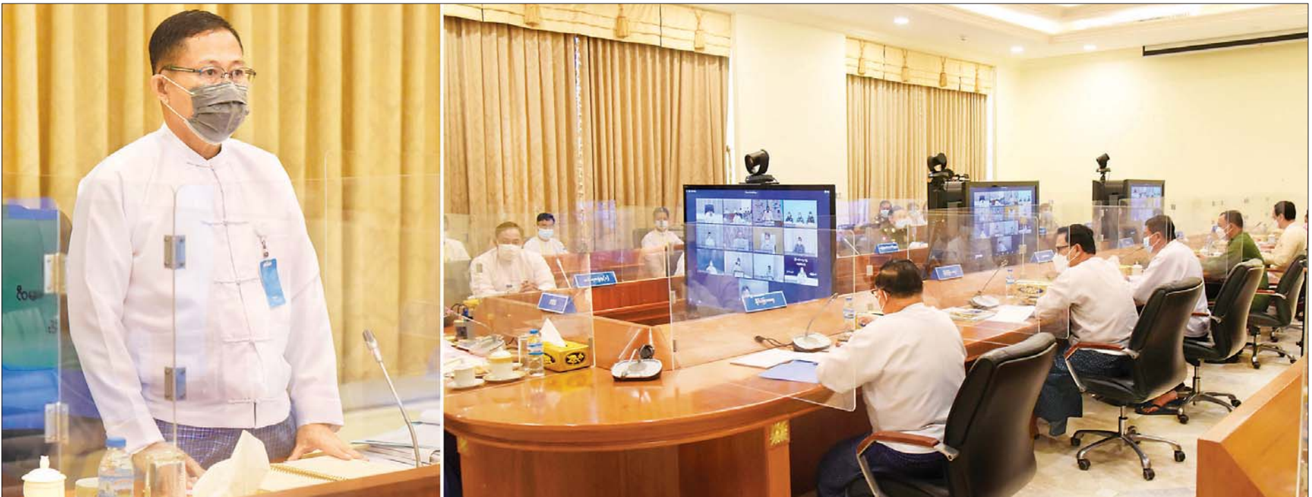
နိုင်ငံတော်စီမံအုပ်ချုပ်ရေးကောင်စီ ဒုတိယဥက္ကဋ္ဌ ဒုတိယဝန်ကြီးချုပ် ဒုတိယဗိုလ်ချုပ်မှူးကြီး စိုးဝင်း ၂၀၂၂ ခုနှစ် (၇၄) နှစ်မြောက် လွတ်လပ်ရေးနေ့ ကျင်းပရေးဗဟိုကော်မတီ ဒုတိယအကြိမ် ညှိနှိုင်းအစည်းအဝေးတွင် အမှာစကားပြောကြားစဉ်။

၅။ အရေးပေါ်ကာလဆိုင်ရာ ပြဋ္ဌာန်းချက်များနှင့်အညီ ဆောင်ရွက်ပြီးစီးပါက ဖွဲ့စည်းပုံအခြေခံဥပဒေ (၂၀၀၈ ခုနှစ်) နှင့်အညီ လွတ်လပ်ပြီး တရားမျှတသော ပါတီစုံဒီမိုကရေစီအထွေထွေရွေးကောက်ပွဲအား ပြန်လည်ကျင်းပ၍ အနိုင်ရသည့်ပါတီအား ဒီမိုကရေစီစံနှုန်းများနှင့်အညီ နိုင်ငံတော်တာဝန်အား လွှဲအပ်နိုင်ရေး ဆက်လက်ဆောင်ရွက်သွားမည်။