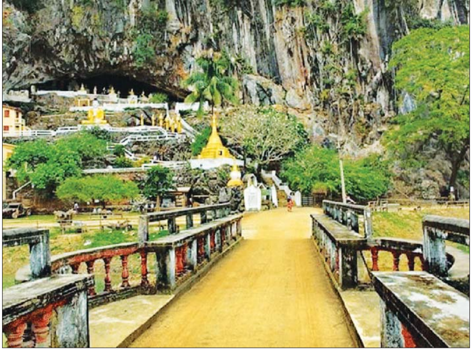
ရသေ့ပျံဂူ။

ကျောက်ကလပ် ကျောက်ကလပ်စေတီသည် လယ်ကွင်း အတွင်း လူတို့ပြုလုပ်ထားသော ရေကန်၏အလယ် တွင် ထူးခြားစွာ ထိုးထွက်နေသော ကျောက်လုံးကြီး ပေါ်တွင် တည်ထားပါသည်။ စေတီသည် ဘားအံမြို့ မှ ခုနစ်မိုင်ခန့်ကွာဝေးပြီး သံလွင်မြစ်၏ အရှေ့ဘက် ကမ်း တော်ပုံကျေးရွာအနီးတွင် တည်ရှိသည်။ စေတီသည် မြန်မာပြည်ရှိ အခြားသော ဘုရားစေတီ များနှင့်မတူဘဲ ရှည်မျောမျော ကျောက်တုံးကြီးပေါ် တွင် တည်ရှိပါသည်။ ကျောက်တောင်ပေါ်မှနေ၍ ဘေးပတ်ဝန်းကျင် ရှုခင်းများနှင့် မလှမ်းမကမ်းမှ ဇွဲကပင်စေတီကို လှမ်းမြင်ရသည်။ ညနေခင်းနေဝင် ချိန်အလှကိုလည်း တောင်ပေါ်မှ မြင်နိုင်ပါသည်။ စေတီသို့ လာရောက်သည့် ခရီးသွားဧည့်သည် များအား သက်သတ်လွတ်ဟင်းလျာများ နေ့စဉ် ကျွေးမွေးလျက်ရှိသည်။