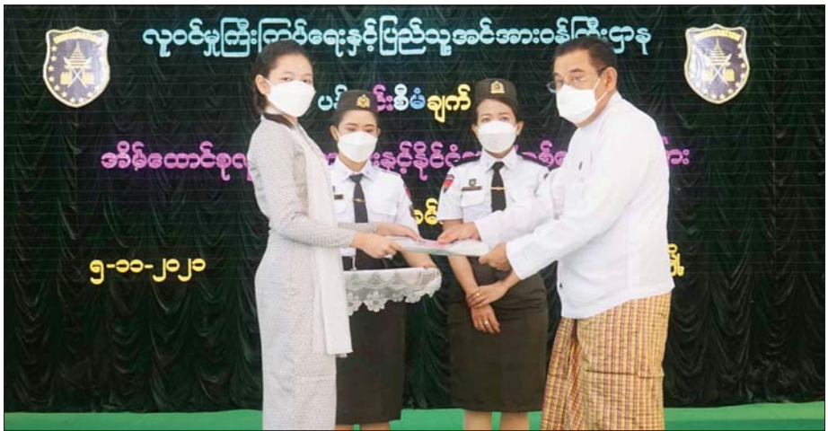
ထားဝယ်မြို့၌ ပန်းခင်းစီမံချက်ဖြင့် နိုင်ငံသားစိစစ်ရေးကတ်ပြားနှင့် အိမ်ထောင်စုလူဦးရေစာရင်းများကို ပေးအပ်စဉ်။

အခု “ပန်းခင်း” စီမံချက်ကာလကို ရောက်ရှိ လာတဲ့အခါမှာ နိုင်ငံတော်ရဲ့ လိုအပ်ချက်ဖြစ်တယ်၊ နိုင်ငံတော်ကလည်း မူဝါဒတွေချမှတ်ပြီးတော့ ကျွန်တော်တို့ဝန်ကြီးဌာနကို တာဝန်ပေးတယ်၊ ကျွန်တော်တို့ဝန်ကြီးဌာနရဲ့ အဓိကလုပ်ငန်းတာဝန် လည်း ဖြစ်တဲ့အတွက် နိုင်ငံသားတွေ နိုင်ငံသား တစ်ယောက်အဖြစ် အခိုင်အမာ အသိအမှတ်ပြုနိုင်ဖို့ နဲ့ နိုင်ငံတော်ရဲ့အနာဂတ် ရှေ့လုပ်ရမယ့် လုပ်ငန်းစဉ် တွေမှာ မရှိမဖြစ် လိုအပ်တဲ့ ဒီနိုင်ငံသားစိစစ်ရေး ကတ်ပြားကို “ပန်းခင်း” ဆိုတဲ့ စီမံချက်နဲ့ လုပ်ပေး နေတာ ဖြစ်ပါတယ်။ လူတွေအေးမြစေဖို့အတွက် “မိုးပွင့်” နဲ့ စခဲ့တယ်။ “သစ္စာ” တရားနဲ့ ရှင်သန်ခဲ့ပြီး တော့ ရရှိလာခဲ့တဲ့ အကျိုးကျေးဇူးတွေ၊ အဖူးအပွင့် တွေ၊ အတွေ့အကြုံတွေနဲ့ အခုနိုင်ငံတော်တစ်ဝန်းလုံး