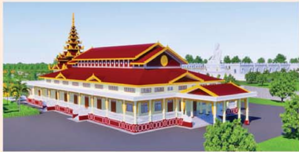
မောရ်(၂၀၃x၉၀)ပေ ၁ လုံး-၈၇၀၀ သိန်း