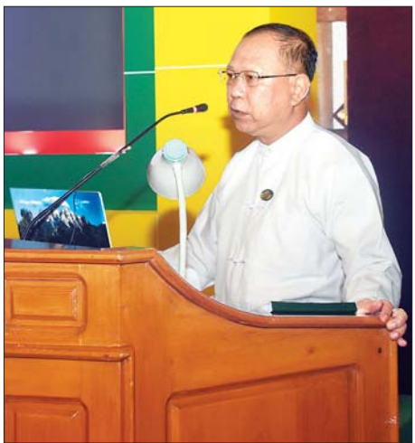
ပြည်ထောင်စုရွေးကောက်ပွဲကော်မရှင် အဖွဲ့ဝင် ဦးသိန်းစိုး ရှင်းလင်းပြောကြားစဉ်။

PR စနစ်သည် မဲဆန္ဒနယ်ကို ဧရိယာကျယ်ပြန့်စွာ သတ်မှတ်၍ ယင်းမဲဆန္ဒနယ်မှ ရွေးကောက် တင်မြှောက်ရမည့် ကိုယ်စားလှယ်ဦးရေကိုပါ သတ်မှတ်ပေးပြီး ပါတီအဖွဲ့အစည်းအလိုက် ယှဉ်ပြိုင်စေခြင်းဖြစ်ကြောင်း၊ ရွေးကောက်ပွဲတွင်