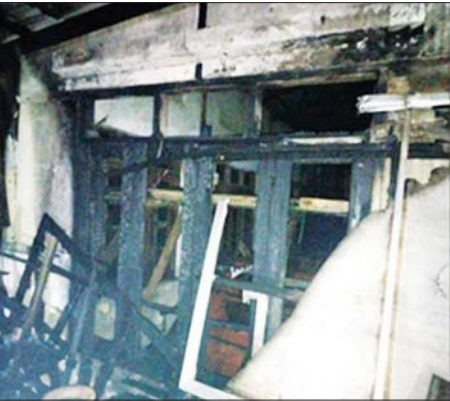
ကန်ကြီးထောင့်မြို့နယ်ရှိ ဆူပူအကြမ်းဖက်သူများက စာသင်ကျောင်းအား မိုင်းထောင်ဖောက်ခွဲမှုကြောင့် ပျက်စီးမှုနှင့် လက်လုပ်မိုင်းအပိုင်းအစများကို တွေ့ရစဉ်။

နေပြည်တော် နိုဝင်ဘာ ၅ အကြမ်းဖက်အဖွဲ့များဖြစ်သော CRPH နှင့် NUG တို့သည် အလုံးစုံပျက်သုဉ်းရေး ဦးတည်ချက်များဖြင့် PDF အမည်ခံ အကြမ်းဖက်အဖွဲ့ကို ဖွဲ့စည်း၍ အချို့သောဒေသများတွင် အေးချမ်းစွာ နေထိုင်ကြသော ပြည်သူများ၊ အပြစ်မဲ့ပြည်သူများကို အကြောင်းပြချက်မျိုးစုံဖြင့် စွပ်စွဲသတ်ဖြတ်ခြင်း၊ မိုင်းထောင်ဖောက်ခွဲတိုက်ခိုက်ခြင်း၊ နေအိမ်များအား မီးရှို့ဖျက်ဆီးခြင်းနှင့် ပစ္စည်းများကို လုယက်ခြင်းတို့ကို လုပ်ဆောင်လျက်ရှိသည်။ လက်ရှိအချိန်တွင် ပညာသင်ကြားရမည့် ကျောင်းသား ကျောင်းသူများ၏ စာသင်နှစ် နှစ်နာမူမရှိစေရန်အတွက် ကျောင်းများ ပြန်လည်ဖွင့်လှစ်ခြင်းအပေါ် ထိခိုက်ပျက်စီးစေလိုသော အကြမ်းဖက်သမားများက အန္တရာယ်အစဉ်ဆက်ဆက် ဆရာ ဆရာမများ ပညာရေးဝန်ထမ်းများနှင့် ကျောင်းသား ကျောင်းသူများအား ခြိမ်းခြောက်ခြင်းများအပြင် လုပ်ကြံသတ်ဖြတ်သည် အထိပါ အကြမ်းဖက်မှုလုပ်ရပ်များကို ကျူးလွန်လျက်ရှိကြသည်။