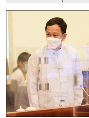
နေပြည်တော်ကောင်စီဥက္ကဋ္ဌ ဒေါက်တာမောင်မောင်နိုင်

စနစ်တကျစီမံဆောင်ရွက်သွားကြရန်လို ကြောင်း မှာကြားခဲ့ပြီး အစည်းအဝေးကို ရုပ်သိမ်းခဲ့ကြောင်း သတင်းရရှိသည်။ သတင်းစဉ်