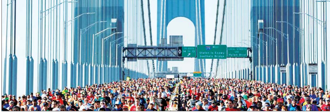
ယခင် ကျင်းပခဲ့သည့်နယူးယောက် မာရသွန်ပြိုင်ပွဲတွင် ပါဝင်ဆင်နွှဲနေသူများကို တွေ့ရစဉ်။