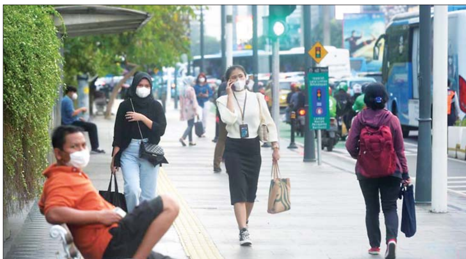
ပါးစပ်၊ နှာခေါင်းစည်းတပ်ဆင်ထားသူများ အင်ဒိုနီးရှားနိုင်ငံ ဂျပန်အစိုးရမှ လမ်းတစ်ခုပေါ်တွင် သွားလာ လှုပ်ရှားနေသည်ကိုတွေ့ရစဉ်။

လာသူ ၄၀၉၅၈၆ ဦးအထိ ရှိလာသည်။ တရုတ်ကိုဗစ်-၁၉ ကာကွယ်ဆေး ဆီဗက်ကို အရေးပေါ်အသုံးပြုရန် သက်ဆိုင်ရာအာဏာပိုင် များက အတည်ပြုလိုက်ချိန်မှစကာ အင်ဒိုနီးရှားနိုင်ငံ တွင် အစုလိုက်အပြုံလိုက် ကာကွယ်ဆေးထိုးနှံမှုကို ဇန်နဝါရီ ၁၃ ရက်တွင် စတင်ခဲ့သည်။