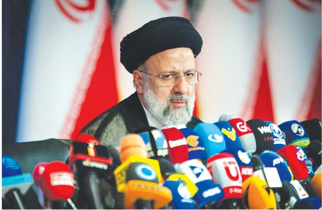
အီရန်သမ္မတ အီဘရာဟင်ရိုင်းစီ။

အရင်က ဘက်ပေါင်းစုံ ပူးပေါင်းလုပ်ဆောင်ရေးလုပ်ငန်း အစီအစဉ် (ဂျေစီပီအိုအေ)လို့ခေါ်တဲ့ ၂၀၁၅ နျူကလီးယားသဘောတူစာချုပ်ကို ပြန်လည်အသက်သွင်းဖို့ ဆွေးနွေးပွဲတွေ ရပ်ဆိုင်းသွားပြီး ငါးလအကြာမှာတော့ အီရန်နဲ့ ဥရောပသမဂ္ဂတို့ဟာ ရပ်ဆိုင်းထားတဲ့ ဆွေးနွေးပွဲတွေကို နောက်တစ်ကြိမ် ပြန်လည်အသက်သွင်းဖို့ ခြေလှမ်းတစ်ရပ် စတင်လိုက်တဲ့အနေနဲ့ နိုဝင်ဘာ ၂၉ ရက်ကို ဆွေးနွေးပွဲတွေ ပြန်လည် စတင်မယ့်ရက်အဖြစ် ကြေညာခဲ့ပါတယ်။