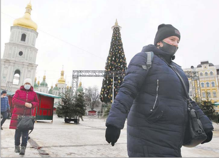
ကီယက်စ်မြို့ ဆိုဖီရာရင်ပြင်တွင် ပါးစပ်၊ နှာခေါင်းစည်း ဝတ်ဆင်ကာသွားလာနေကြသူများအား တွေ့ရစဉ်။

ဦးအထိရှိလာသည်ဟု သိရသည်။ နိုဝင်ဘာ ၃ ရက်တွင် ကိုဗစ်- ၁၉ ကူးစက်ခံရသူပေါင်း ၂၇၃၇၇ ဦး ကို တွေ့ရှိခဲ့ရသည်။ နွေရာသီ အကုန်ပိုင်းမှစတင်ကာ ယူကရိန်း နိုင်ငံတွင် ကိုဗစ်- ၁၉ ကူးစက်မှု နှုန်းနှင့် ဆေးရုံတက်ရမှုပေါင်းမှာ တဖြည်းဖြည်းချင်း မြင့်မားလာ သည်။ ဆေးရုံများတွင် လူနာခုတင် ၇၀ ရာခိုင်နှုန်းမှာ ကိုဗစ် - ၁၉ လူနာများအတွက် ဖြစ်သည်ဟု ကျန်းမာရေးဝန်ကြီးဌာနက ပြော သည်။ ယူကရိန်းနိုင်ငံတွင် ဖေဖော်ဝါရီ ၂၄ ရက်မှ စတင်ကာ ကိုဗစ်- ၁၉ ကာကွယ်ဆေးထိုးနှံ ပေးမှုများ ပြုလုပ်ခဲ့သည်။ ယူကရိန်းနိုင်ငံတွင် ၇ ဒသမ ၆ သန်းကျော်ရှိ နှစ်ကြိမ်ကာကွယ် ဆေးအပြည့် ထိုးပြီးပြီဖြစ်ကြောင်း တရားဝင်အချက်အလက်များအရ သိရသည်။ ဆင်ဟွာ