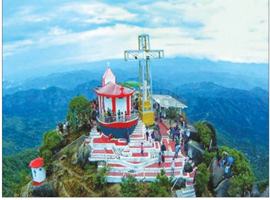
သံတောင်ကြီးမြို့နယ်ရှိ နော်ဘူဘောတောင်၊ ဓာတ်ပုံ - KSG

ကော့ဂွန်းဂူသည် သမိုင်းအရ ရှေးအကျဆုံးနှင့် လေ့လာဖော်ထုတ်၍ မပြည့်စုံနိုင်သော လိုဏ်ဂူကြီး ဖြစ်သည်။ ဘားအံမြို့မှ သံလွင်မြစ်အတိုင်း စုန်ဆင်း၍ ငါးမိုင်ခန့်အကွာတွင် အနောက်ဘက်ကမ်း၌ တည်ရှိပြီး ပင်လယ်ရေမျက်နှာပြင်အထက် ၁၁၆ ပေရှိသော ဖားကပ်ရွာ၌ တည်ရှိသည်။ ကော့ဂွန်းတောင်မှာ လယ်ကွင်းပြင်တွင် တစ်တန်းတည်း တည်ရှိနေသော ထုံးကျောက်တောင်ဖြစ်၏။ ကော့ဂွန်းတောင်၏ အရှေ့မြောက်မျက်နှာစာတွင် ကော့ဂွန်းလိုဏ်ဂူ တည်ရှိသည်။ ကော့ဂွန်းဂူ၏