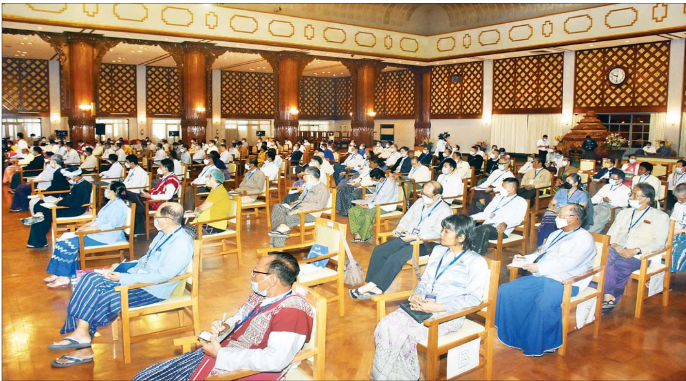
ပြည်ထောင်စုရွေးကောက်ပွဲကော်မရှင်နှင့် နိုင်ငံရေးပါတီများ ရွေးကောက်ပွဲစနစ်ဆိုင်ရာ ဆွေးနွေးပွဲသို့တက်ရောက်သည့် နိုင်ငံရေးပါတီများမှ ကိုယ်စားလှယ်များ အား တွေ့ရစဉ်။

မြန်မာနိုင်ငံလွတ်လပ်ရေးရပြီးနောက် ၁၉၄၇ ခုနှစ် ဖွဲ့စည်းအုပ်ချုပ်ပုံ အခြေခံဥပဒေအရ ၁၉၄၈ ခုနှစ်မှ ၁၉၆၂ ခုနှစ်အတွင်း ကျင်းပခဲ့သည့် ပါလီမန် အထွေထွေရွေးကောက်ပွဲများ၊ ၁၉၇၄ ခုနှစ် ဖွဲ့စည်းပုံ အခြေခံဥပဒေအရ ၁၉၇၄ ခုနှစ်မှ ၁၉၈၈ ခုနှစ်အတွင်း ကျင်းပခဲ့သည့် ရွေးကောက်ပွဲများ၊ ၁၉၉၀ ပြည့်နှစ် တွင် ကျင်းပခဲ့သည့် ပါတီစုံဒီမိုကရေစီ အထွေထွေ ရွေးကောက်ပွဲ၊ ၂၀၀၈ ခုနှစ် ဖွဲ့စည်းပုံအခြေခံဥပဒေ အရ ကျင်းပခဲ့သည့် ပါတီစုံဒီမိုကရေစီအထွေထွေ ရွေးကောက်ပွဲများတွင် မဲများသူ အနိုင်ရတဲ့စနစ် (FPTP) ကိုသာ ကျင့်သုံးခဲ့ပြီး နိုင်ငံအကုန်ယူသည့် မဲပေးသော စနစ်နှင့်အတူ ကြီးပြင်းလာခဲ့သူများဖြစ် သည့်အလျောက် ဤစနစ်ကိုပင် ဒီမိုကရေစီနိုင်ငံ အများအပြားက ကျင့်သုံးသည်ဟု မှတ်ယူခဲ့ကြပါ ကြောင်း၊ ပြောင်းလဲခဲ့သည့် ခေတ်ကာလအခြေအနေ အရ ဒီမိုကရေစီနိုင်ငံအများစုသည် မဲဆန္ဒနယ် တစ်နယ်တွင် ကိုယ်စားလှယ်တစ်ဦး ရွေးကောက် သည့် စနစ်မှာ ခေတ်နောက်ကျ၍ မျှတမှုမရှိသဖြင့် နိုင်ငံအများအပြားက ယင်းစနစ်ကို ငြင်းပယ်ခဲ့ကြပြီး အချိုးကျ ကိုယ်စားပြုစနစ်ကို အစားထိုးကျင့်သုံးနေ သည်ကို တွေ့မြင်ရမည်ဖြစ်ပါကြောင်း၊ နိုင်ငံသူ အကုန်ယူစနစ်ဖြင့် ရွေးကောက်တင်မြှောက်ရာတွင် ထောက်ခံဆန္ဒမဲ ၅၁ ရာခိုင်နှုန်း ရရှိသည့် ကိုယ်စားလှယ်လောင်းသည် အနိုင်ရရှိသဖြင့် ၁၀၀ ရာခိုင်နှုန်းကို ကိုယ်စားပြုခြင်းအခွင့်အရေးကို ရရှိ သွားပြီး ၄၉ ရာခိုင်နှုန်းရရှိသည့် အခြားကိုယ်စား လှယ်လောင်းသည် ကိုယ်စားပြုခွင့် လုံးဝရရှိခြင်း မရှိသဖြင့် ၄၉ ရာခိုင်နှုန်းသော မဲဆန္ဒရှင်များ၏ မဲများမှာ အဟောသိက်ဖြစ်ခဲ့ကြောင်း၊ အချိုးကျ ကိုယ်စားပြုခြင်းဆိုသည့် သဘောတရားမှာ အများစုသည် ဆုံးဖြတ်ပိုင်ခွင့်ရှိသော်လည်း လူတိုင်း