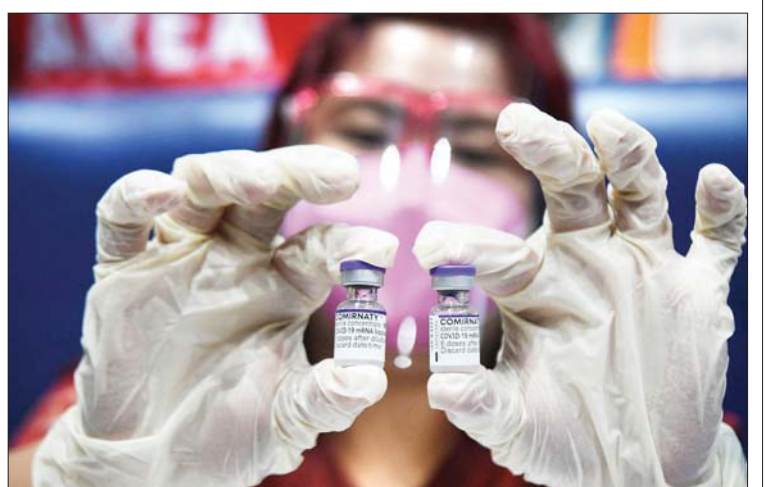
ကျန်းမာရေးဝန်ထမ်းတစ်ဦးက ကိုဗစ်-၁၉ ကာကွယ်ဆေးဘူးများကို ပြသနေစဉ်။

နိုင်ငံအတွင်း ကိုဗစ်-၁၉ ကြောင့် ၂၆၀ ထပ်မံသေဆုံးမှုနှင့်အတူ စုစုပေါင်း ကိုဗစ်- ၁၉ သေဆုံးသူပေါင်း ၄၄၀၈၅ ဦးအထိ ရှိလာခဲ့သည်။