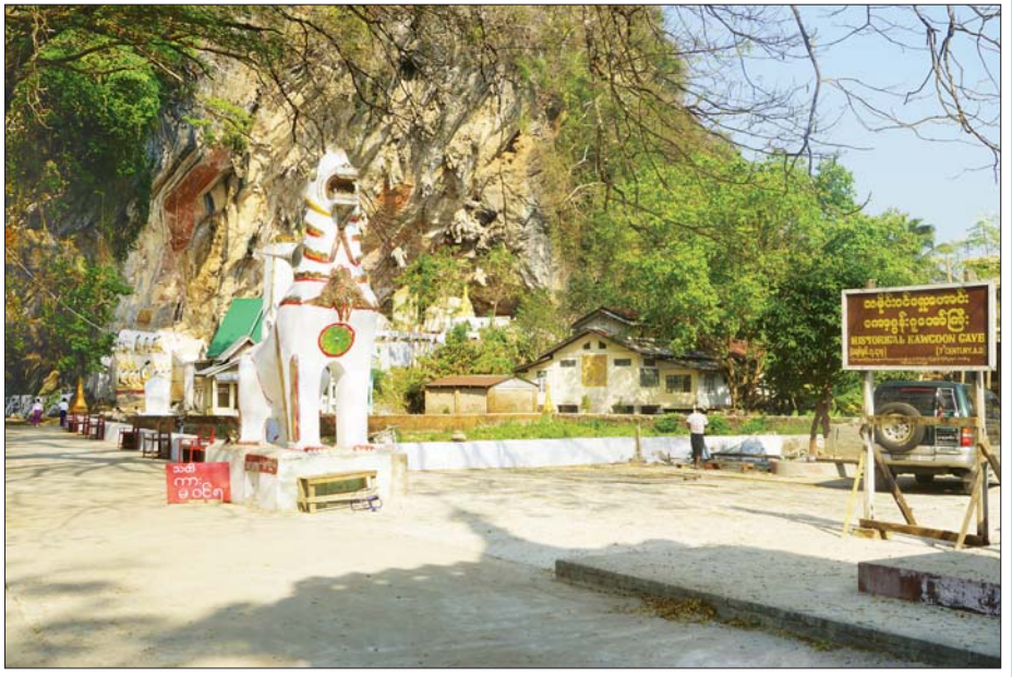
ကော့ဂွန်းဂူ၊ ဓာတ်ပုံ - စောမျိုးမင်းသိန်း

ခရီးစဉ်ဒေသတစ်ခုအဖြစ် ပေါ်ပေါက်လာရေးအတွက် ကျန်ရှိနေသေးသော ရွာအဝင်/အထွက် မြေသားလမ်းပြုပြင်ရန်၊ ရွာအဝင်ဆိုင်းဘုတ်၊ အမှိုက်ပုံး၊ အမှိုက်ကျင်း၊ ငါးမွေးကန်ပြုပြင်ရန်၊ မိဘမဲ့ ကလေးထိန်းသိမ်းစောင့်ရှောက်ရေးကျောင်း စနစ်တကျမွမ်းမံရန်၊ တိုင်းရင်းဆေးခန်းနှင့် တစ်ကေအကျယ် ပရဆေးခြံများ အပြီးသတ်