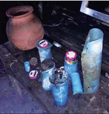
သေနတ်ဖြင့် ပစ်ခတ်ခံရ၍ သေဆုံးသွားသည့် အထက်တန်း ပြခရာမ ဒေါ်လှလှသန်း။