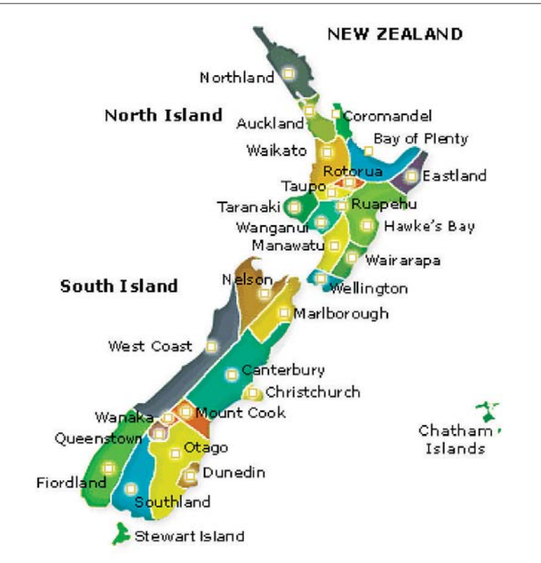
နယူးဇီလန်နိုင်ငံ၏ အုပ်ချုပ်မှုနယ်မြေမြေပုံ

နယူးဇီလန်နိုင်ငံသည် စည်းမျဉ်းခံဘုရင်စနစ် အုပ်ချုပ်သော နိုင်ငံတစ်နိုင်ငံဖြစ်ပြီး နိုင်ငံ၏ အုပ်ချုပ်မှုကို ဗြိတိန်နန်းတော်၏ကိုယ်စား ဘုရင်ခံမှ အုပ်ချုပ်သည်။ ကိုလိုနီခေတ်ကာလကတည်းက ဗြိတိန်နန်းတော်၏ အုပ်ချုပ်မှုအောက်တွင် တည်ရှိခဲ့သော နိုင်ငံတစ်နိုင်ငံဖြစ်ပါသည်။ နိုင်ငံ၏ ဥပဒေပြုမှုအနေနှင့် အထွေထွေညီလာခံတစ်ရပ်ထားရှိပြီး အထွေထွေညီလာခံတွင် လွှတ်တော်နှင့် ဘုရင်ခံပါဝင်ဖွဲ့စည်းထားသည်။ ဗြိတိန်နန်းတော်နှင့် ဘုရင်ခံသည် နိုင်ငံရေးအရ ကြားနေအနေအထားရှိ၍ လွှတ်တော်ကိုယ်စားလှယ်များကို ရွေးကောက်ပွဲများ ကျင်းပ၍ ပြည်သူများမှ သုံးနှစ်တစ်ကြိမ် ရွေးချယ်ခြင်းဖြစ်သည်။ အထွေထွေညီလာခံသည် ဥပဒေပြုရေး အမြင့်ဆုံးအာဏာရှိသော အဖွဲ့အစည်းဖြစ်သည်။ နယူးဇီလန်နိုင်ငံသည် အင်္ဂလန်နိုင်ငံ၏ ဝက်စ်မင်စတာ (Westminster system) အုပ်ချုပ်မှုစနစ်ကို ကျင့်သုံးသော နိုင်ငံတစ်နိုင်ငံဖြစ်သည်။ ဝက်စ်မင်စတာ (Westminster system) ဆိုသည်မှာ အုပ်ချုပ်မှုအပိုင်းတွင် ဥပဒေပြုရေးမှအဖွဲ့များပါဝင်၍ အစိုးရကို ဖွဲ့စည်းအုပ်ချုပ်ပြီး အစိုးရအဖွဲ့မှ လွှတ်တော်အတွင်း ဆွေးနွေး၍ ဥပဒေများပြုစုအုပ်ချုပ်သောစနစ် ဖြစ်သည်။ အစိုးရခေါင်းဆောင်နှင့်မတူသော မင်းခမ်းမင်းနားများအတွက် နိုင်ငံ၏ခေါင်းဆောင်တစ်ဦး (ဥပမာ-ဘုရင်) ကို ထားရှိသော စနစ်ဖြစ်သည်။ အထွေထွေညီလာခံမှတစ်ဆင့် ဝန်ကြီးချုပ်နှင့် အစိုးရအဖွဲ့ဝင် ဝန်ကြီးများကို လည်းကောင်း၊ ရှေ့နေချုပ်၏ တင်ပြချက်အရ ဘုရင်ခံမှ တရားသူကြီးများကိုလည်းကောင်း