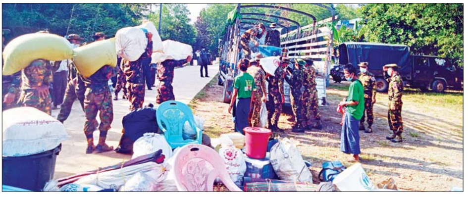
နေရပ်ပြန်ပြည်သူများအား တပ်မတော်သားများက ကူညီဆောင်ရွက်ပေးစဉ်။

ဗိုလ်မှူးချုပ် အောင်ကျော်မင်း နှင့် တာဝန်ရှိသူများ၊ မြို့နယ်စီမံ အုပ်ချုပ်ရေးအဖွဲ့ဝင်များနှင့် ဌာန ဆိုင်ရာ တာဝန်ရှိသူများက ကြည့်ရှု၍ အားပေးစကား ပြောကြားကာ ဒါးလက်ကျေးရွာ အုပ်စု အလယ်ကျွန်းကျေးရွာသို့ ပြန်လည်ပို့ဆောင်ပေးခဲ့ကြောင်း သိရသည်။ မြို့နယ်(ပြန်/ဆက်)