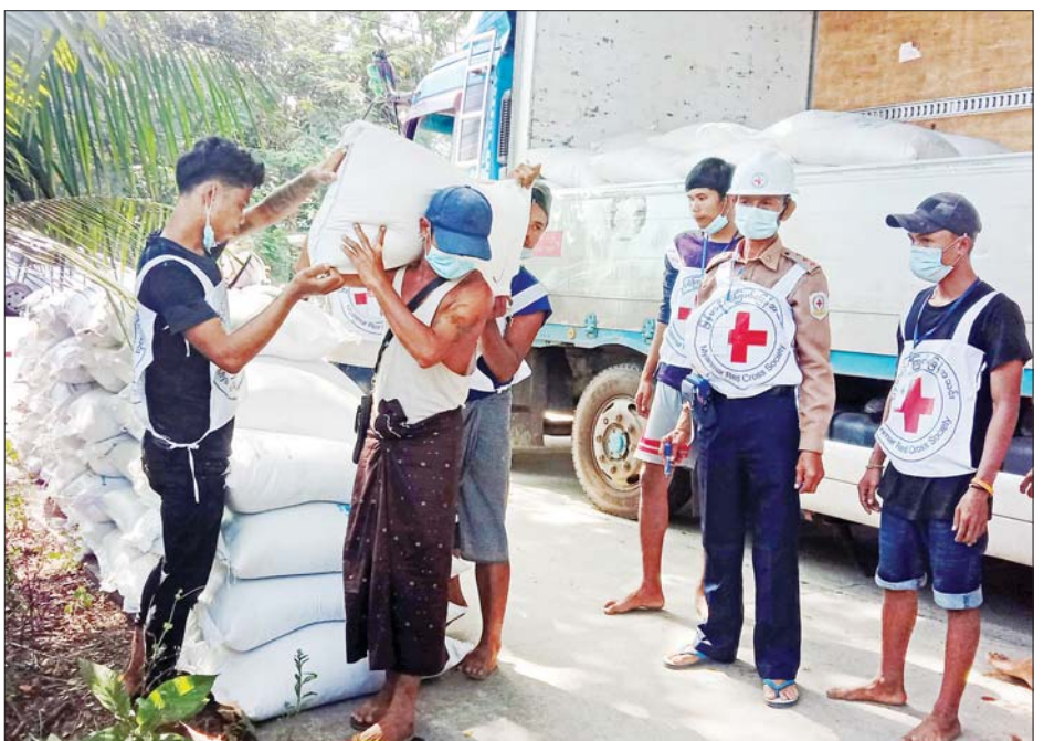
ကမ္ဘာ့စားနပ်ရိက္ခာအစီအစဉ်(WFP)က ထောက်ပံ့သည့် ဆန်အိတ်များအား ရွှေပြည်သာမြို့နယ်ရှိ ပြည်သူများအား မြန်မာနိုင်ငံ ကြက်ခြေနီအသင်းက ကူညီထောက်ပံ့ပေးစဉ်။

ရွှေပြည်သာ နိုဝင်ဘာ ၆ ရန်ကုန်တိုင်းဒေသကြီး ရွှေပြည်သာမြို့နယ်ရှိ ပြည်သူများအား ကုလသမဂ္ဂ ကမ္ဘာ့စားနပ်ရိက္ခာအစီအစဉ်(WFP)က ထောက်ပံ့သည့် ဆန်အိတ်များအား ရွှေပြည်သာမြို့နယ်ရှိ အမှတ်(၂)ရပ်ကွက်၊ အမှတ်(၃)ရပ်ကွက်နှင့် အမှတ်(၄)ရပ်ကွက်ရှိ လက်လုပ်လက်စား ပြည်သူများထံ မြန်မာနိုင်ငံကြက်ခြေနီအသင်းက ယမန်နေ့ နံနက်ပိုင်းက ဖြန့်ဝေပေးသည်။ ထိုသို့ထောက်ပံ့ပေးအပ်ရာတွင် အိမ်ထောင်စု တစ်စုလျှင် ဆန် တစ်အိတ်နှုန်းဖြင့် အမှတ်(၂)ရပ်ကွက်ရှိ အိမ်ထောင်စု ၄၂၆ စုအား ဆန်အိတ် ၄၂၆ အိတ်၊ အမှတ်(၃)ရပ်ကွက်ရှိအိမ်ထောင်စု ၁၁၇၉ စုအား ဆန်အိတ် ၁၁၇၉ အိတ်၊ အမှတ်(၄)ရပ်ကွက်ရှိ အိမ်ထောင်စု ၅၂၉ စုအား ဆန်အိတ် ၅၂၉ အိတ်တို့ကို ထောက်ပံ့