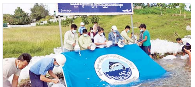
တက်ရောက်ပြီး ဆည်အတွင်းငါးမျိုးများ စိုက်ထည့်ကြကြောင်း သိရ သည်။ (အပေါ်ပုံ)