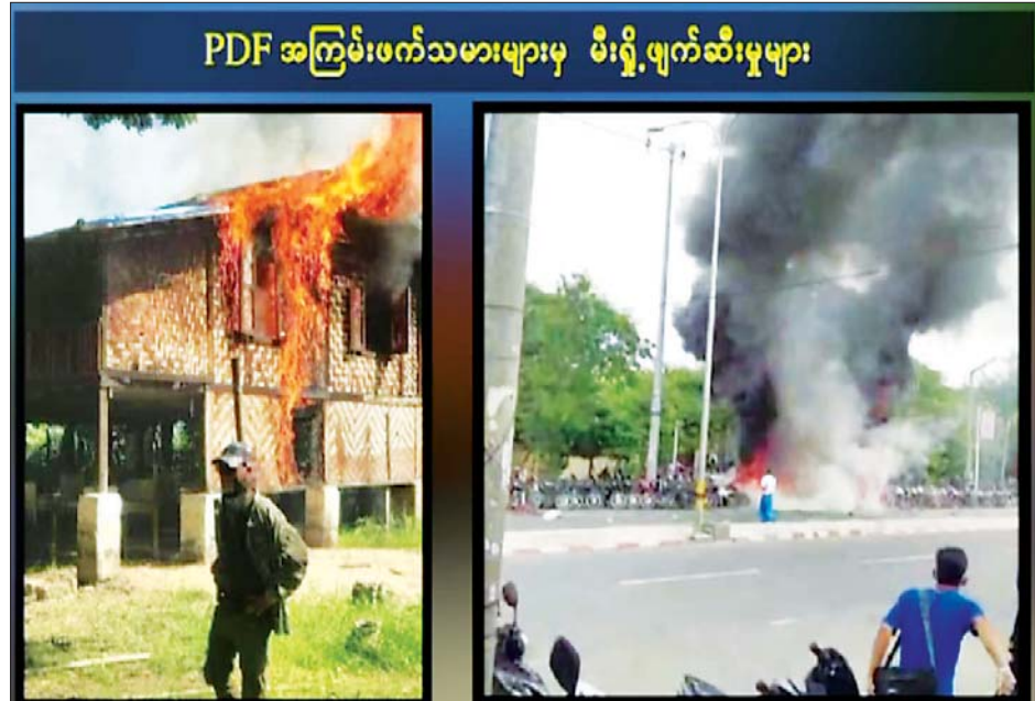
PDF အကြမ်းဖက်သမားများမှ မီးရှို့ဖျက်ဆီးမှုများ