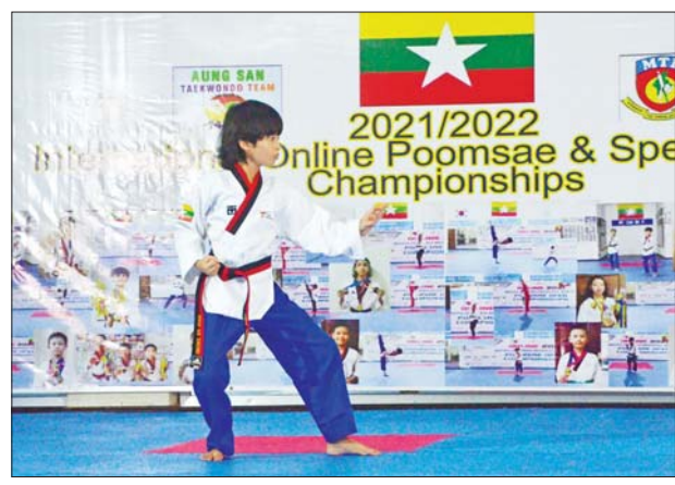
အမျိုးသမီး ကကွက်တစ်ဦးချင်းပြိုင်ပွဲတွင် မြို့တော်စည်ပင်မှ ပြိုင်ပွဲဝင်တစ်ဦး ယှဉ်ပြိုင်စဉ်။

ယင်းပြိုင်ပွဲတွင် ပထမဆု(ရွှေ)တံဆိပ်နှင့်အတူ ကိုရီးယား တိုက်ကွမ်ဒို ဒိုဘုခါ၊ ဒုတိယ(ငွေ)တံဆိပ်နှင့်အတူ တိုက်ကွမ်ဒိုနှစ်ထပ် ခြေကန်ပက်၁၊ တတိယ(ကြေး)တံဆိပ်နှင့်အတူ တိုက်ကွမ်ဒိုရိုးရိုးခြေကန် ပက် ၁ အသီးသီးချီးမြှင့်ပေးသွားမည်ဖြစ်ပြီး သက်တန်းအလိုက်၊ ကာလာအဆင့်နှင့် ခါးစည်းအနက်အဆင့်အမျိုးအစား နှစ်မျိုးခွဲ၍ ရွှေ တံဆိပ် အများဆုံး၊ ငွေတံဆိပ်အများဆုံး၊ ကြေးတံဆိပ်အများဆုံးအပေါ် မူတည်ပြီး ကာလာအဆင့်တံခွန်စိုက်ဖလား ပထမဖလားနှင့်အတူ ရေခဲသေတ္တာ၊ ဒုတိယဖလားနှင့်အတူ တီဖွဲ့၊ တတိယဖလားနှင့်အတူ ဒီဗွီဒီ၊ ခါးစည်း အနက်အဆင့် တံခွန်စိုက်ပထမဖလားနှင့်အတူ ရေခဲသေတ္တာ၊ ဒုတိယ ဖလားနှင့်အတူ တီဖွဲ့၊ တတိယဖလားနှင့်အတူ ဒီဗွီဒီများ ချီးမြှင့်ပေးအပ်သွားမည်ဖြစ်ကြောင်း သိရသည်။