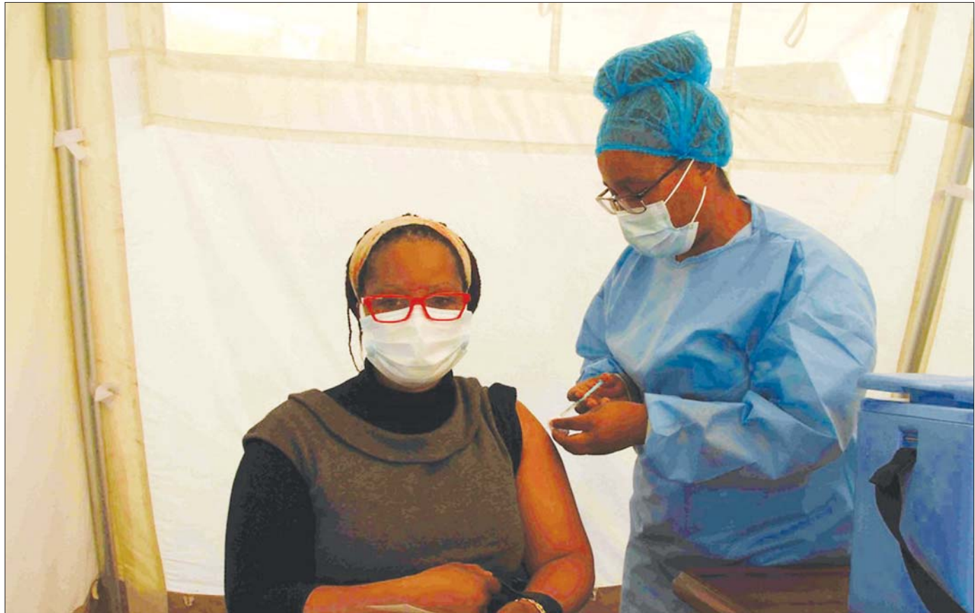
ဇင်ဘာဘေ့ဒ်နိုင်ငံ ဟာရာရီမြို့တွင် ကိုဗစ် -၁၉ ကာကွယ်ဆေးထိုးနှံမှု ခံယူနေသည့် အမျိုးသမီးတစ်ဦးကို တွေ့ရစဉ်။

ကပ်ရောဂါဖြစ်ပွားခြင်း မရှိသကဲ့သို့ ၎င်းတို့၏ လုပ်ငန်းဆောင်တာများကို လုပ်ဆောင်နေသည်။ တိုင်းပြည်အတွင်း ကပ်ရောဂါ တတိယအကျော့ ရိုက်ခတ်စဉ်ကာလအတွင်း ကာကွယ်ဆေးထိုးနှံခြင်း လုပ်ငန်းများကို အင်တိုက်အားတိုက် လုပ်ဆောင်