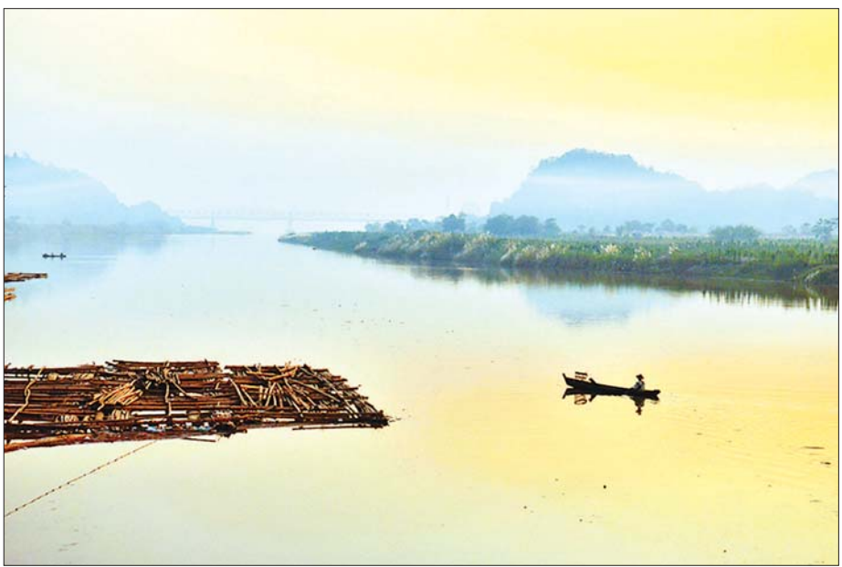
သံလွင်မြစ်ကြောင်း ခရီးစဉ်တွင် တွေ့ရမည့် သံလွင်မြစ်ရှုခင်း။

ဘုရားသုံးဆူမြို့နယ် မက္ကသာ( ထီလောင်ယျား) ရေတံခွန်ခရီးစဉ် ကြာအင်းဆိပ်ကြီးမြို့နယ် ဘုရားသုံးဆူမြို့ အနီး မက္ကသာဘေးမှ သစ်တောဧရိယာအတွင်းရှိ ထီလောင်ယျားရေတံခွန်သည် သဘာဝရေတံခွန် တစ်ခုဖြစ်ပြီး အပျော်တမ်းလှေစီးခြင်း၊ ရေကူးခြင်း၊ အပန်းဖြေစားသောက်နိုင်သော စားသောက်ဆိုင် များ တည်ဆောက်ထားရှိပါသည်။ ဘုရားသုံးဆူမြို့နယ် သဘာဝရေကူးကန်နှင့် အပန်းဖြေစခန်း ဘုရားသုံးဆူမြို့ ကျောက်ပလူးကျေးရွာတွင်