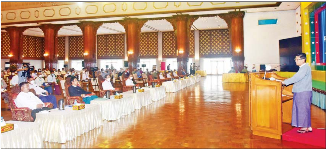
ပြည်ထောင်စုရွေးကောက်ပွဲကော်မရှင်ဥက္ကဋ္ဌ ဦးစိုးသိန်း နိုင်ငံရေးပါတီများ ရွေးကောက်ပွဲစနစ်ဆွေးနွေးပွဲတွင် နိဂုံးချုပ် အမှာစကား ပြောကြားစဉ်။

၁၉၅၁ ခုနှစ်၊ ဖွဲ့စည်းပုံအခြေခံဥပဒေပြင်ဆင်ချက် အက်ဥပဒေအမှတ် (၆၂) အရ သံလွင်ခရိုင်၊ ဖာပွန်ဒေသကို ကရင်ပြည်နယ်အဖြစ် လည်းကောင်း၊ ၁၉၅၂ ခုနှစ်၊ ကရင်ပြည်နယ်တိုးချဲ့သတ်မှတ်ရေး အက်ဥပဒေအမှတ် (၁၄)အရ သံလွင်ခရိုင်နှင့် ဆက်စပ်ဒေသဖြစ်သည့် စာမျက်နှာ ၃ ကော်လံ ၁ *