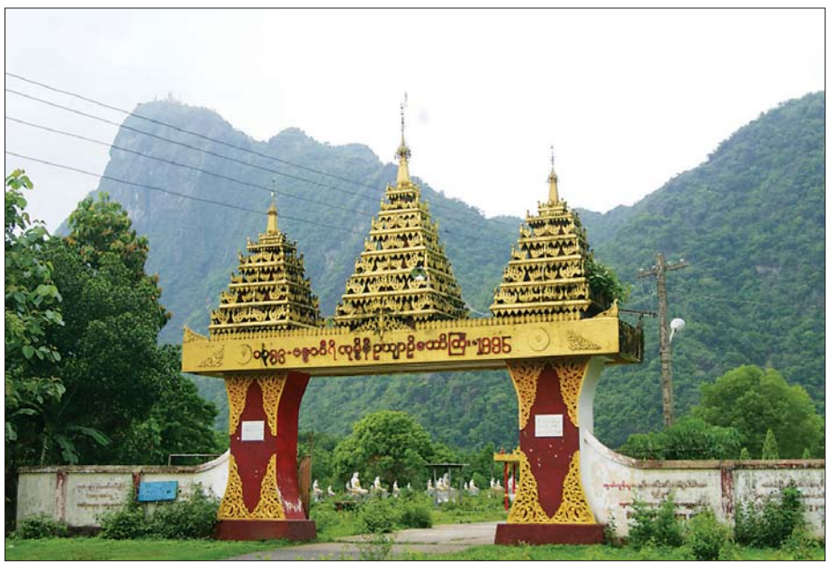
ဘားအံမြို့နယ် လှေဖွဲ့ဥယျာဉ်တော်ကြီးနှင့် ဇွဲကပင်တောင်။