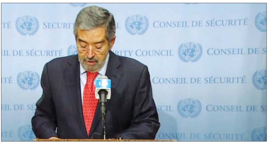
ကုလသမဂ္ဂဆိုင်ရာ မက္ကဆီကိုသံအမတ်ကြီး ဂျူအန်းရေမွန်ဒီလာဖလန်တီ။

တိုက်ပွဲများပြင်းထန်နေသည့်အပေါ် အလွန်အမင်း စိုးရိမ်မိသည်ဟု ကြေညာချက်တွင် ပါရှိသည်။ ရေရှည်တည်တံ့သည့် အပစ်အခတ်ရပ်စဲရေးနှင့် ပဋိပက္ခများကို ဖြေရှင်းနိုင်ရေးအတွက် အမျိုးသား ဆွေးနွေးပွဲပြုလုပ်ရန်နှင့် ငြိမ်းချမ်းရေးနှင့် တည်ငြိမ် ရေးအတွက် အခြေခံအုတ်မြစ်ချရန်လည်း တောင်းဆို ထားသည်။ အိသီယိုပီးယားနိုင်ငံ၌ လူသားချင်းစာနာ ထောက်ထားမှုဆိုင်ရာ ပဋိပက္ခများ၏ အကျိုးဆက် များ သက်ရောက်လာမည်ကိုလည်း အလွန်အမင်း စိုးရိမ်မိသည်ဟု လုံခြုံရေးကောင်စီက ဖော်ပြခဲ့သည်။ အဒစ်အဘာဘာမြို့ရှိ အမေရိကန်သံရုံးကလည်း အမေရိကန်နိုင်ငံသားများကို အိသီယိုပီးယားနိုင်ငံမှ ထွက်ခွာကြရန် အကြံပေးထားသည်။ ဆင်ဟွာ