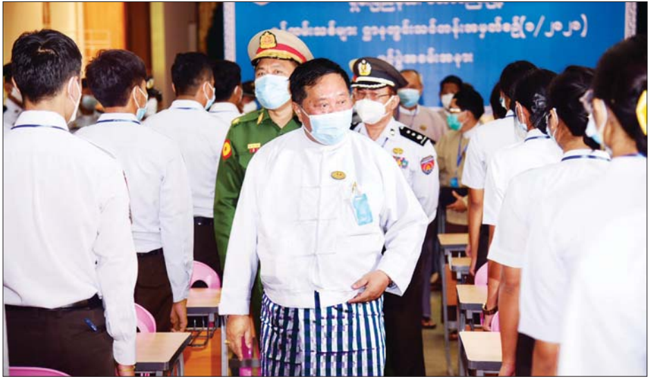
ပြည်နယ်ဝန်ကြီးချုပ် ဒေါက်တာကျော်ထွန်း ဝန်ထမ်းသစ်များအား ရင်းရင်းနှီးနှီးနှုတ်ဆက်စဉ်။

မှာကြားလိုကြောင်း၊ ရှမ်းပြည်နယ်အတွင်းရှိ ပြည်သူ များ၏ အကျိုးသာမက မိမိတို့နိုင်ငံသူနိုင်ငံသားတို့ ၏ အကျိုးစီးပွားများတိုးတက်ရေးတို့ကိုပါ ကြိုးစား ဆောင်ရွက်ပေးကြရန် မှာကြားသည်။ ဆက်လက်၍ ရှမ်းပြည်နယ် လူမှုရေးဝန်ကြီး၊ လူဝင်မှုကြီးကြပ်ရေးနှင့် ပြည်သူ့အင်အားဦးစီးဌာန၊ ပြည်နယ်ဦးစီးရုံး၊ ညွှန်ကြားရေးမှူး ဦးအောင်မြင့် က ဌာနဆိုင်ရာ ဘာသာရပ်သင်တန်းနှင့် ပတ်သက် ၍ ရှင်းလင်းတင်ပြသည်။ အဆိုပါ တောင်ကြီးခရိုင်အတွင်းရှိ မြို့နယ်ရုံးများ မှ ခန့်အပ်သည့် ဝန်ထမ်းသစ်များအား ဌာနဆိုင်ရာ ဘာသာရပ်သင်တန်းကို သင်တန်းသား၊ သင်တန်းသူ ၅၈ ဦး တက်ရောက်ပြီး သင်တန်းတွင် စီမံအာဏာရပ်၊ အမျိုးသားမှတ်ပုံတင်နှင့် နိုင်ငံသားဘာသာရပ်၊ လူဝင်မှုကြီးကြပ်ရေးဘာသာရပ်၊ ပြည်သူ့အင်အား