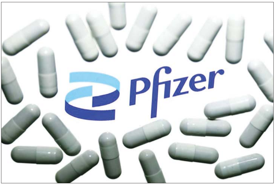
ဖိုက်ဇာလိုဂိုပေါ်တွင် ဆေးတောင့်များ ပြသထားစဉ်။

နောက်ဆုံးအဆင့်ကို ပြုလုပ်နေ လည်ဟု ကုမ္ပဏီက ပြောသည်။ ဖိုက်ဇာကိုဗစ်-၁၉ သောက်ဆေး ပေးထားသည့် လူနာများမှာ သေဆုံးမှုနှင့် ဆေးရုံတက်ရောက် ကုသရမှုကို ၈၉ ရာခိုင်နှုန်း လျော့ချပေးနိုင်သည်ဟု တွေ့ရှိ ရသည်။ ဆေးဘက်ဆိုင်ရာ တိုးတက် မှုကြီးတစ်ခုဟု ထင်မြင်မိကြောင်း ဖိုက်ဇာကုမ္ပဏီမှ သိပ္ပံဆိုင်ရာ အကြီးအကဲ မိုက်ကယ် ဒေါ်ဆန် ကပြောသည်။ ပြီးခဲ့သည့် လအတွင်းက