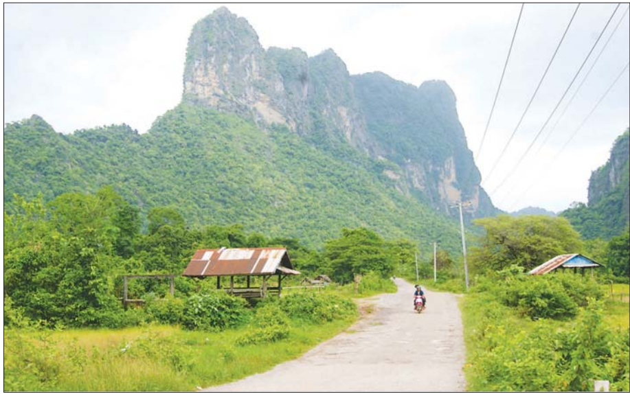
ဘားအံမြို့နယ် ဆံတော်ရှင် ဇွဲကပင်တောင်။

တည်ရှိပြီး လူလုပ်သဘာဝရေတံခွန်(ရေကူးကန်) တစ်ခုဖြစ်ကာ (၉၃/၉၄) ကီလိုမီတာအကြား အကျယ် (၂၀၀ x ၆၀) ပေခန့်၊ အနက် လေးပေရှိ၍ အနားယူအလုံး ၃၀ အား ကန်ပတ်လည်တွင် တည်ဆောက်ထားရှိပြီး အများသုံးအိမ်သာ(ကျား/မ) လေးခန်းတွဲ တစ်လုံးကိုလည်း တည်ဆောက်လျက် ရှိပါသည်။