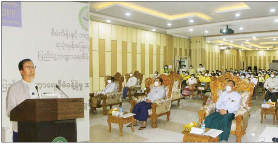
ပြည်ထောင်စုဝန်ကြီး ဦးဝင်းရှိန် ပြည်သူ့ဘဏ္ဍာရေးစီမံခန့်ခွဲမှု အထူးမှမ်းမံသင်တန်း အမှတ်စဉ် (၁) ဖွင့်ပွဲအခမ်းအနားတွင် အမှာစကားပြောကြားစဉ်။

ဖွင့်လှစ်ဆောင်ရွက်ပေးလျက်ရှိ ပြည်သူ့ဘဏ္ဍာရေး စီမံခန့်ခွဲမှုသင်တန်းကျောင်းတွင် ပြည်သူ့ဘဏ္ဍာရေး စီမံခန့်ခွဲမှုဆိုင်ရာ အခြေခံ သင်တန်းများ၊ ကာလတိုအထူးသင်တန်းများ၊ အလုပ်ရုံဆွေးနွေးပွဲများ၊ ဘာသာရပ်ဆိုင်ရာ နှီးနှောဖလှယ်ပွဲများကို စဉ်ဆက်မပြတ် ဖွင့်လှစ်ဆောင်ရွက်ပေးလျက်ရှိကြောင်း သိရသည်။ သတင်းစဉ်