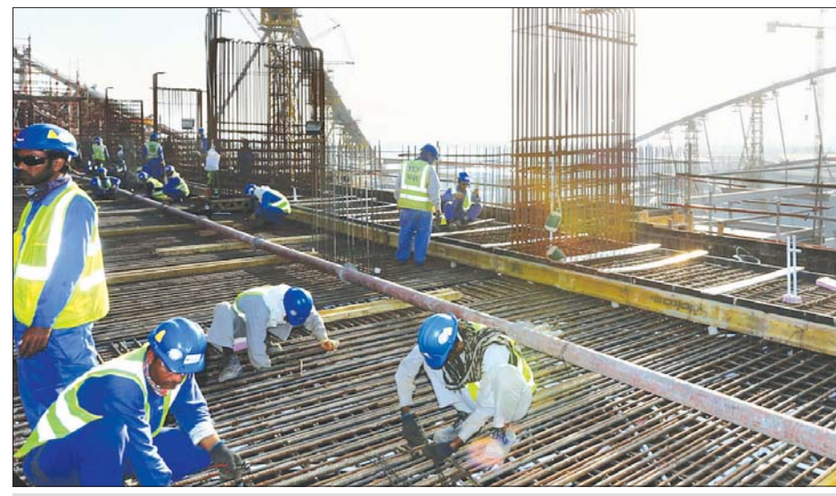
ကာတာနိုင်ငံဆောက်လုပ်ရေးလုပ်ငန်းခွင်မှ အလုပ်သမားများကို တွေ့ရစဉ်။

၎င်းတို့ သေဆုံးခြင်းအကြောင်းကို စုံစမ်းမှုများ မရှိဟုလည်း အဆိုပါအဖွဲ့က ဆက်လက်ပြောကြားခဲ့ သည်။ လုပ်ငန်းခွင်အခြေအနေများ တိုးတက် ကောင်းမွန်ရေးနှင့် အလုပ်သမားများအတွက်