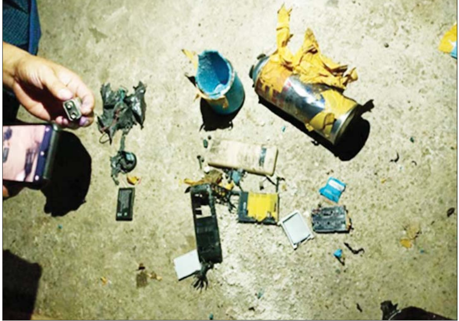
၆-၆-၂၀၂၁ ရက်တွင် မအူပင်မြို့ ခရိုင်ပြည်သူ့ဆေးရုံကြီးရုံးဝင်းအတွင်း၌ လက်လုပ်မိုင်းပေါက်ကွဲမှု။