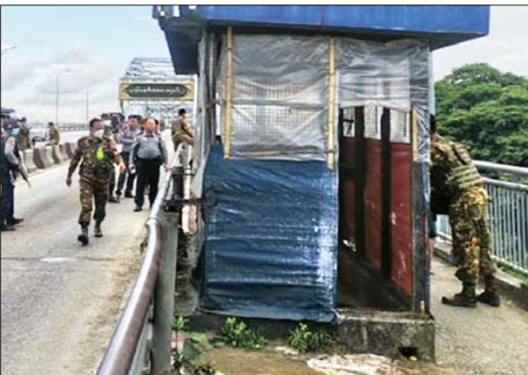
၂၂-၈-၂၀၂၁ ရက်တွင် လှိုင်သာယာမြို့နယ်၊ ဘုရင့်နောင်တံတားအဆင်းရှိ လုံခြုံရေးရဲကင်းပစ်ခတ်ခံရမှုမှတ်တမ်းဓာတ်ပုံ