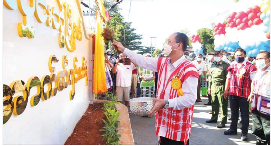
ကရင်ပြည်နယ်ဝန်ကြီးချုပ် ဦးစောမြင့်ဦး လှိုင်းဘွဲ့မြို့နယ် အောက်ဆီဂျင်စက်ရုံဆိုင်ရာအဖွဲ့အစည်း နံ့သာရည် ပက်ဖျန်းပေးစဉ်။

ထိရောက်မှုကန့်သတ် ဆောင်ရွက် ဖွင့်ပွဲအခမ်းအနားတွင် ဥပဒေရေးရာဝန်ကြီးဌာန ပြည်ထောင်စုဝန်ကြီးနှင့် ပြည်ထောင်စုရှေ့နေချုပ် ဒေါက်တာသီတာဦးက ဥပဒေရေးရာဝန်ကြီးဌာနသည် နိုင်ငံတော်စီမံအုပ်ချုပ်ရေးကောင်စီဥက္ကဋ္ဌ၏ လမ်းညွှန်ချက်နှင့်အညီ ဥပဒေအသိပညာပြန့်ပွားရေးလုပ်ငန်းများကို ဆောင်ရွက်လျက်ရှိရာ ဥပဒေရေးရာဝန်ကြီးဌာနမှ အရာထမ်းများအတွက် ဘာသာရပ်ဆိုင်ရာ သင်တန်းများ ဖွင့်လှစ်ပို့ချပေးလျက်ရှိကြောင်း၊ ဥပဒေရေးရာဝန်ကြီးဌာန၊ မဟာဗျူဟာစီမံကိန်း (၂၀၂၀-၂၀၂၄)၏ မဟာဗျူဟာ ရည်မှန်းချက်ပါ ဝန်ထမ်းများ စွမ်းဆောင်ရည်မြှင့်တင်ရေးကို အကောင်အထည်ဖော် ဆောင်ရွက်ရန်နှင့် ဥပဒေ