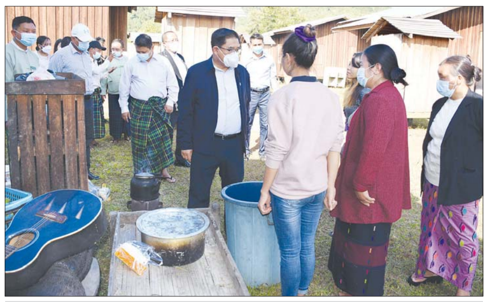
ပြည်နယ်ဝန်ကြီးချုပ် ဦးခင်ထိန်နန် ယာယီကယ်ဆယ်ရေးစခန်းမှ ပြောင်းရွှေ့လာသည့် ပြည်သူများအား တွေ့ဆုံအားပေးစကားပြောကြားစဉ်။

မြစ်ကြီးနား နိုဝင်ဘာ ၂၂ မြစ်ကြီးနားမြို့နယ် အတွင်းရှိ ယာယီကယ်ဆယ်ရေးစခန်းများမှ အိမ်ထောင်စု ၁၆ စုအား ယမန်နေ့က ပလနက်ကျေးရွာအုပ်စု ငွေပျော်စံပြ ကျေးရွာအတွင်း အသစ် ဆောက်လုပ်ပြီးသည့် တန်ဖိုးနည်း အိမ်ရာများသို့ ပြောင်းရွှေ့နေရာ ချထားပေးခဲ့သည်။ ရှေးဦးစွာ ပြည်နယ်ဝန်ကြီးချုပ် ဦးခင်ထိန်နန်က IDPs စခန်းများရှိပြည်သူများ နေရပ်ပြန်နိုင်ရေးအတွက် ကချင်ပြည်နယ်အစိုးရအဖွဲ့အနေဖြင့် လိုအပ်သည်များကို အဘက်ဘက်မှ ကူညီဆောင်ရွက်ပေးမည် ဖြစ်ကြောင်း၊ IDPs စခန်းများအတွက်