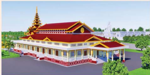
မောရ်(၂၀၃x၉၀)ပေ ၁ လုံး-၈၇၀၀ သိန်း