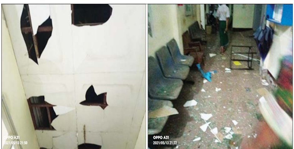
၁၃-၅-၂၀၂၁ ရက်တွင် လှိုင်းဘွဲ့မြို့ ပြည်သူ့ဆေးရုံ၌ အသုံးစွဲတစ်လုံး ပေါက်ကွဲမှု။