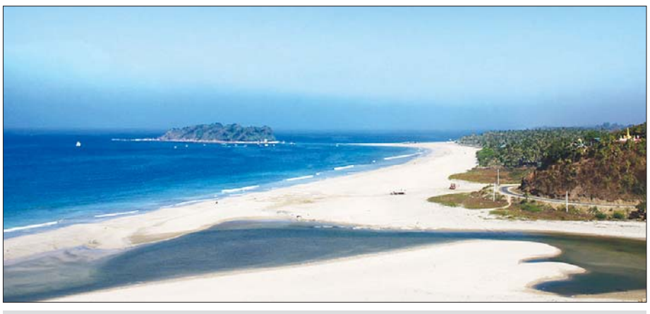
ငွေဆောင်ကမ်းခြေအလှကို မြင်တွေ့ရစဉ်။

စာမျက်နှာ ၂၀ မှ ထို့အပြင် “ကမ်းခြေစည်းကမ်းထိန်းသိမ်းရေး နှင့်လုံခြုံရေးအဖွဲ့”များကို ဌာနဆိုင်ရာများ၊ ဟိုတယ် ဇုန်တာဝန်ရှိသူများ၊ ဒေသခံများနှင့် ပူးပေါင်းဖွဲ့စည်း ကာ အဆိုးများခွဲ၍ ကွင်းဆင်းစောင့်ရှောက်ပေး နေပါသည်။