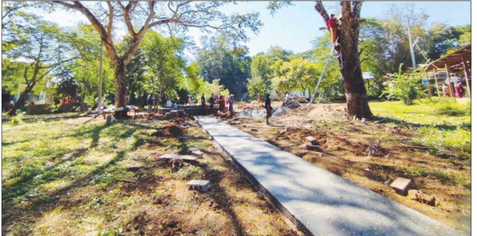
လင်းခေးပြည်သူ့ဆေးရုံပန်းခြံ တည်ဆောက်နေမှုကို တွေ့ရစဉ်။

မည် ဖြစ်ကြောင်း၊ တည်ဆောက်ရေးလုပ်ငန်း ပြီးစီးအောင်မြင်ရန် ခန့်မှန်းတန်ဖိုးငွေကျပ် သိန်း ၁၀၀ ခန့် ကုန်ကျမည်ဖြစ်ကြောင်း သိရသည်။ လှူဒါန်းနိုင်ယင်း တည်ဆောက်ရေးအတွက် စေတနာအလှူရှင်များ မည်သူမဆို အလှူငွေ(သို့မဟုတ်) ပန်းအလှူ ပျိုးပင်မျိုးစုံတို့ကို တည်ဆောက်ရေး ကော်မတီ၊ မြို့နယ်ကျန်းမာရေးဦးစီးဌာနတို့