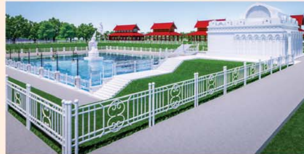
မုစလိန္နအိုင်

၁။ နိုင်ငံတော်စီမံအုပ်ချုပ်ရေးကောင်စီဥက္ကဋ္ဌ၊ တပ်မတော်ကာကွယ်ရေးဦးစီးချုပ် ဗိုလ်ချုပ်မှူးကြီးမင်းအောင်လှိုင် ဦးဆောင်သည့် (၇)ရက်သား၊ သမီး၊ ဘုရားဒါယကာ၊ ဒါယိကာမတို့က မာရဝိဇယပုဒ္ဓရုပ်ပွားတော်မြတ်ကြီးအား မြန်မာနိုင်ငံတွင် ထေရဝါဒဗုဒ္ဓသာသနာတော်ထွန်းလင်းတောက်ပလျက်ရှိသည်ကို ကမ္ဘာကိုပြသရန်၊ တိုင်းပြည်အေးချမ်းသာယာမှုရှိစေရန်၊ ရုပ်ပွားတော်မြတ်ကြီးအား ပြည်တွင်း၊ ပြည်ပဘုရားဖူးများလာရောက်ခြင်းဖြင့် ဒေသတိုးတက်စည်ကားမှုကို အထောက်အကူဖြစ်စေရန်၊ နိုင်ငံတော်ဖွံ့ဖြိုးတိုးတက်မှုအား အထောက်အကူ ဖြစ်စေရန်ရည်သန်လျက် ပြည်ထောင်စုနယ်မြေ နေပြည်တော်၊ ဒက္ခိဏသီရိမြို့နယ်အတွင်း၌ သာသနာတော်ထုံး၊ ရုပ်ပွားဆင်းတုတော်ထုံး၊ မြန်မာ့ရိုးရာတည်ထုံးများနှင့်အညီ တည်ဆောက် ပူဇော်လျက်ရှိပါသည်။