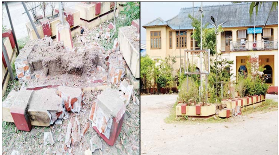
၄-၅-၂၀၂၁ ရက်တွင် မိုင်းပေါက်ကွဲမှုဖြစ်ပွားသည့် ဗန်းမော်မြို့ ပြည်သူ့ဆေးရုံ။

အကြမ်းဖက်အုပ်စုများဖြစ်သော CRPH ၊ NUG ၊ PDF စသည့်အဖွဲ့အစည်းများက နိုင်ငံအကျိုး တာဝန် ထမ်းဆောင်နေသော ကျန်းမာရေးဝန်ထမ်းများကို အကြောင်းမဲ့ရက်စက်စွာ သတ်ဖြတ်ခဲ့ခြင်းများအပြင် ဆေးရုံ၊ ဆေးခန်းများကိုလည်း မိုင်းထောင်ဖောက်ခွဲ၊ မီးရှို့ဖျက်ဆီးခြင်းများ လုပ်ဆောင်ခဲ့ခြင်းကြောင့် ၂၀၂၁ ခုနှစ်၊ ဖေဖော်ဝါရီ ၁ ရက်နေ့မှ နိုဝင်ဘာလ ၁၅ ရက်နေ့အထိ ဆေးရုံ၊ ဆေးခန်း ၂၅ ခု ပျက်စီးဆုံးရှုံးခဲ့ရမှုကို ဖော်ပြပါအတိုင်း တွေ့ရှိရသည် -