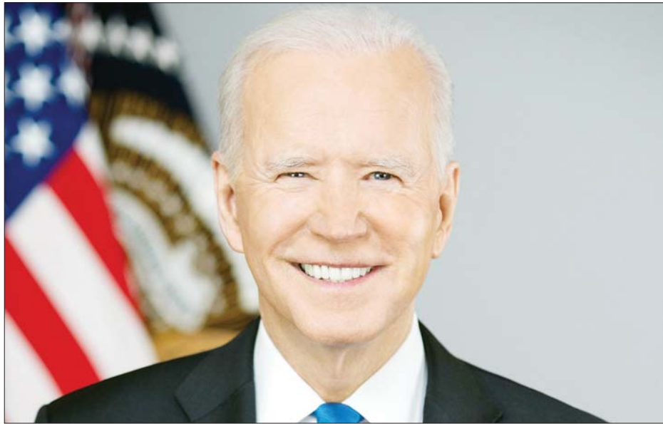
အမေရိကန်သမ္မတ ဂျိုးဘိုင်ဒင်။

ယခင်က အမေရိကန်သမ္မတ ဟောင်း ရော်နယ်ရီဂင်သည် အိမ်ဖြူတော်မှ ထွက်ခွာချိန်တွင် အသက် ၇၇ နှစ်ရှိပြီး အသက် အကြီးဆုံး အမေရိကန်သမ္မတ ဖြစ်ခဲ့သည်။ သမ္မတဘိုင်ဒင်၏ ကျန်းမာရေး ဆေးစစ်ချက်ကို နိုဝင်ဘာ ၁၉ ရက်တွင် ကြေညာ ခဲ့ပြီး ၎င်း၏ဆရာဝန်က သမ္မတ