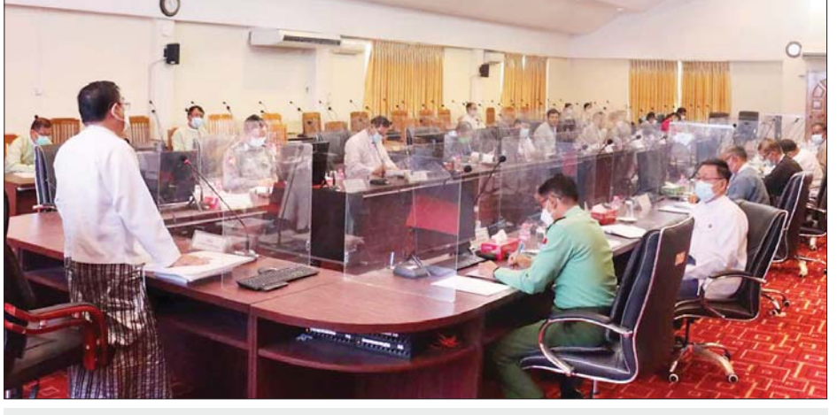
တိုင်းဒေသကြီး ဝန်ကြီးချုပ် ဦးမြတ်ကို ထားဝယ်မြို့နယ်၌ ၆ မဂ္ဂါဝပ် အသေးစားရေအားလျှပ်စစ်စီမံကိန်း လုပ်ငန်းဆောင်ရွက်ရန် ရှင်းလင်းဆွေးနွေးပွဲတွင် အမှာစကားပြောကြားစဉ်။

မည့် ၆ မဂ္ဂါဝပ် လျှပ်စစ်ဓာတ်အား ထုတ်လုပ်ရေးအတွက် လာရောက် ရှင်းလင်းပြောကြားသည့် အခမ်းအနား ဖြစ်ကြောင်း၊ တနင်္သာရီတိုင်း ဒေသကြီးသည် မြန်မာနိုင်ငံ၏ တောင်ဘက်အစွန်ဆုံးကျပြီး ကမ်းရိုးတန်းဒေသဖြစ်သည့်အတွက် မြေအနေအထားအရ တောင်နှင့်မြောက် သွယ်တန်းပြီး ရှည်လျားသော ကြောင့် လျှပ်စစ်ဓာတ်အား ရရှိရေးအတွက် အခက်အခဲအနည်းငယ်ရှိကြောင်း၊ တနင်္သာရီတိုင်းဒေသကြီးတွင် မိုးများသည့်အတွက် ဆည်မြောင်း၊ တာတမံ တည်ဆောက်လုပ်ရာတွင် ဂရုတစိုက် ဆောင်ရွက်ရမည် ဖြစ်ကြောင်း၊ တိုင်းဒေသကြီးအစိုးရအဖွဲ့အနေဖြင့် လုပ်ငန်းများကို အောင်မြင်အောင် လုပ်ဆောင်စေလိုသောဆန္ဒရှိပြီး လိုအပ်ချက်များကိုလည်း ဖြည့်ဆည်းဆောင်ရွက်ရန် အသင့်ရှိကြောင်း၊ တိုင်းဒေသကြီးအတွင်း လျှပ်စစ်မီးများ