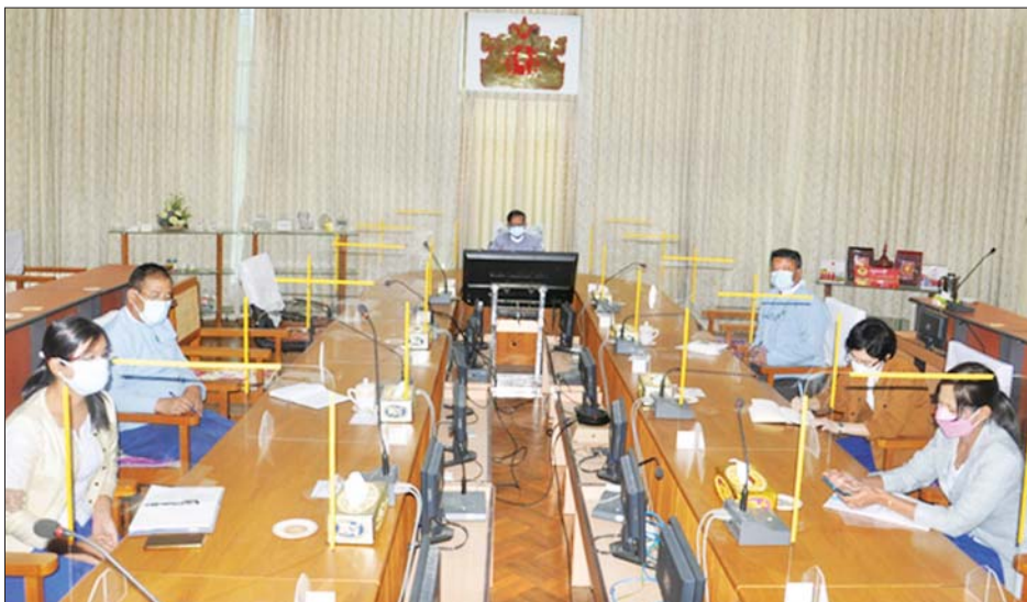
ပြည်ထောင်စုဝန်ကြီး ဒေါက်တာချာလီသန်း၊ စက်မှုဝန်ကြီးဌာနနှင့် သိပ္ပံနှင့်နည်းပညာဝန်ကြီးဌာနတို့ ပူးပေါင်းကျင်းပသည့် အဖွဲ့အစည်းများ၏ အရည်အသွေးစီမံခန့်ခွဲမှုသင်တန်းအတွက် အမှာစကား ပြောကြားစဉ်။

သိရှိနားလည်နိုင်ရန် အရေးကြီး စက်မှုဝန်ကြီးဌာနအနေဖြင့် နည်းပညာ ဆပ် ကော်မတီ ၇ ခုကို တာဝန်ယူဆောင်ရွက်လျက်ရှိပြီး ချမှတ်ပြီးဖြစ်သည့် မြန်မာစံချိန်စံညွှန်း ၄၃၉ ခုအနက် စံချိန်စံညွှန်း အခု ၂၅၀ ကို အပြည်ပြည်ဆိုင်ရာ စံချိန် စံညွှန်းများကို ကိုးကား၍ ချမှတ်ပေးနိုင်ခဲ့ပြီးဖြစ် ကြောင်း၊ ထို့ကြောင့် စံချိန်စံညွှန်းများကို အသုံးချ ရန်နှင့် စံချိန်စံညွှန်းပါ ဖော်ပြချက်များကို သိရှိ နားလည်နိုင်ရန် အရေးကြီးကြောင်း၊ ယနေ့ကျင်းပ ပြုလုပ်သည့် သင်တန်းမှအစပြုပြီးစက်မှု စနစ်တကျ လိုက်ပါ အကောင်အထည်ဖော်နိုင်ခြင်းဖြင့် ISO 9004:2018 ပါ ဖော်ပြချက်များကို သိရှိလိုက်နာနိုင်ပြီး Quality Management System အရ အဖွဲ့အစည်း တစ်ခု၏အရည်အသွေး (Quality of an organization)