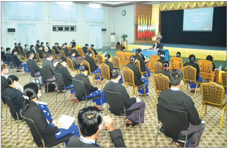
ဥပဒေရေးရာဝန်ကြီးဌာန ပြည်ထောင်စုဝန်ကြီးနှင့် ပြည်ထောင်စုရှေ့နေချုပ် ဒေါက်တာသီတာဦး တရားမမှုများ လိုက်ပါဆောင်ရွက်ခြင်းဆိုင်ရာသင်တန်း အမှတ်စဉ်(၁/၂၀၂၁)ဖွင့်ပွဲ အခမ်းအနားတွင် အမှာစကားပြောကြားစဉ်။

၁၁ ရက်ကြာ ဖွင့်လှစ် သင်တန်းဖွင့်ပွဲ အခမ်းအနားသို့ ညွှန်ကြားရေးမှူးချုပ်များ၊ ဒုတိယညွှန်ကြားရေးမှူးချုပ်များ၊ ညွှန်ကြားရေးမှူးများ၊ သင်တန်းဆရာများနှင့်