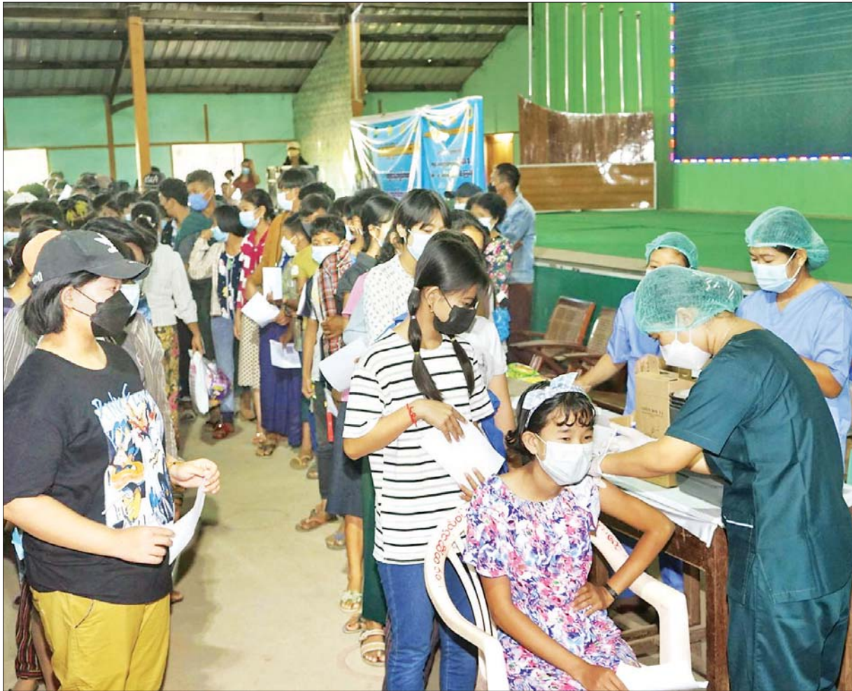
မကွေးတိုင်းဒေသကြီး ပခုက္ကူမြို့နယ်၌ ကျောင်းနေအရွယ်ကလေးတိုင်း ကျန်းမာပျော်ရွှင်စွာပညာသင်ကြားနိုင်ရန် ကိုဗစ်-၁၉ ရောဂါ ကာကွယ်ဆေးထိုးကြပါစို့ ဆောင်ပုဒ်နှင့်အညီ အခြေခံပညာကျောင်းများတွင် ပညာသင်ကြားလျက်ရှိသည့် အသက် ၁၂ နှစ်အထက် ကျောင်းသား ကျောင်းသူများအား နိုဝင်ဘာ ၂၂ ရက် နံနက်ပိုင်းက အမှတ် (၁) နှင့် (၄) အခြေခံပညာအထက်တန်းကျောင်း၌ ကိုဗစ်-၁၉ ကာကွယ်ဆေး ဒုတိယအကြိမ် ထိုးနှံပေးစဉ်။

၁၃၈၃ ခုနှစ်၊ တန်ဆောင်မုန်းလပြည့်ကျော် ၅ ရက်၊ ၂၀၂၁ ခုနှစ်၊ နိုဝင်ဘာ ၂၃ ရက်၊ အင်္ဂါနေ့၊ အတွဲ (၆၁)၊ အမှတ် (၀၅၄)