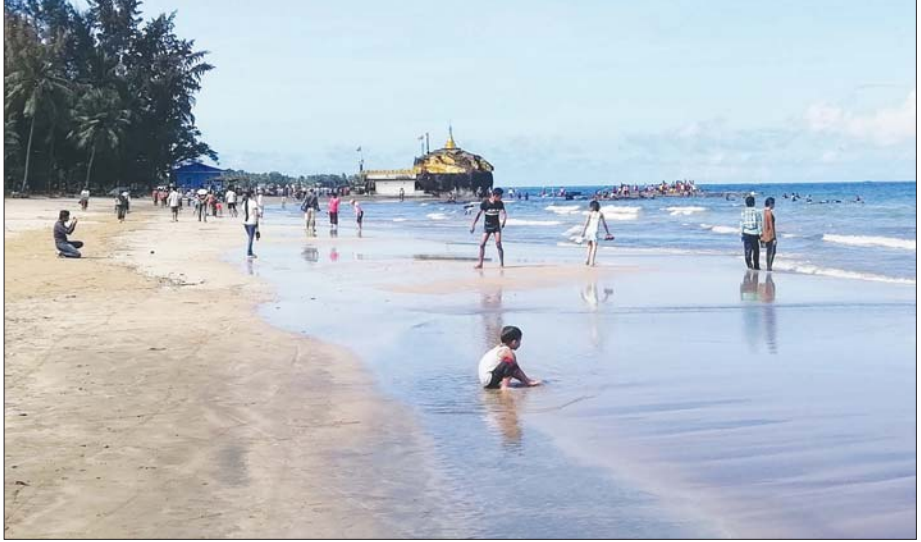
ကျောက်ပုထိုးစေတီနှင့် ချောင်းသာကမ်းခြေအလှကို မြင်တွေ့ရစဉ်။

ပုသိမ်မြို့မှ ၂၄ မိုင် ၄ ဖာလုံခန့်အကွာတွင် တည်ရှိပြီး ၂၀၀၀ ပြည့်နှစ်မှစတင်ကာ အပန်းဖြေကမ်းခြေဒေသတစ်ခုအဖြစ် အကောင်အထည်