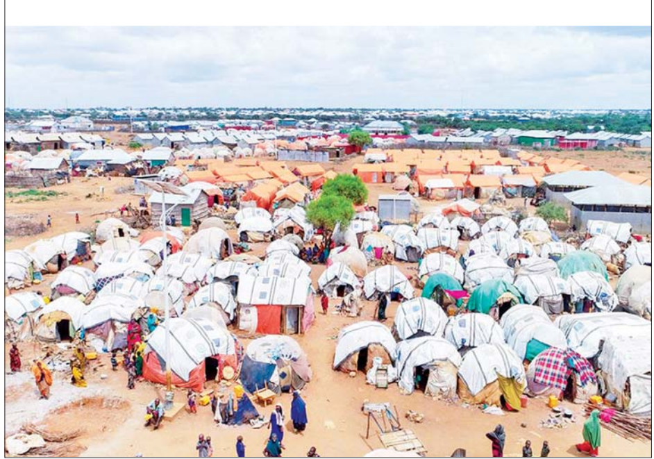
ဆိုမာလီယာနိုင်ငံ၌ မိုးခေါင်မှုကြောင့် နေရပ်ရွှေ့ပြောင်းကြရသူများ၏ စခန်းတစ်ခုကို တွေ့ရစဉ်။

ကွာလာလမ်ပူ နိုဝင်ဘာ ၂၈ မလေးရှားနိုင်ငံတွင် နိုဝင်ဘာ ၂၇ ရက် ကိုဗစ်-၁၉ နောက်ထပ်ကူးစက် ခံရသူ ၅၀၉၇ ဦး ထပ်မံတွေ့ရှိခဲ့ပြီး စုစုပေါင်းကူးစက်ခံရသူအရေအတွက် မှာ ၂၆၁၉၅၇၇ ဦး ရှိလာသည်ဟု ကျန်းမာရေးဝန်ကြီးဌာနက ပြောသည်။ ပြည်ပမှ ကူးစက်လာသူ ၁၇ ဦးရှိပြီး ၅၀၈၀ မှာ ပြည်တွင်းကူးစက်မှု များဖြစ်သည်ဟု ကျန်းမာရေးဝန်ကြီးဌာန၏ ဝက်ဘ်ဆိုက်တွင်ဖော်ပြ ထားသည်။ ကိုဗစ်-၁၉နှင့် ဆက်စပ်ပြီး နောက်ထပ်သေဆုံးသူ ၄၀ တိုးလာသည့်အတွက် သေဆုံးသူစုစုပေါင်းမှာလည်း ၃၀၂၈၀ ဖြစ်လာ ခဲ့သည်။ ဆင်ဟွာ