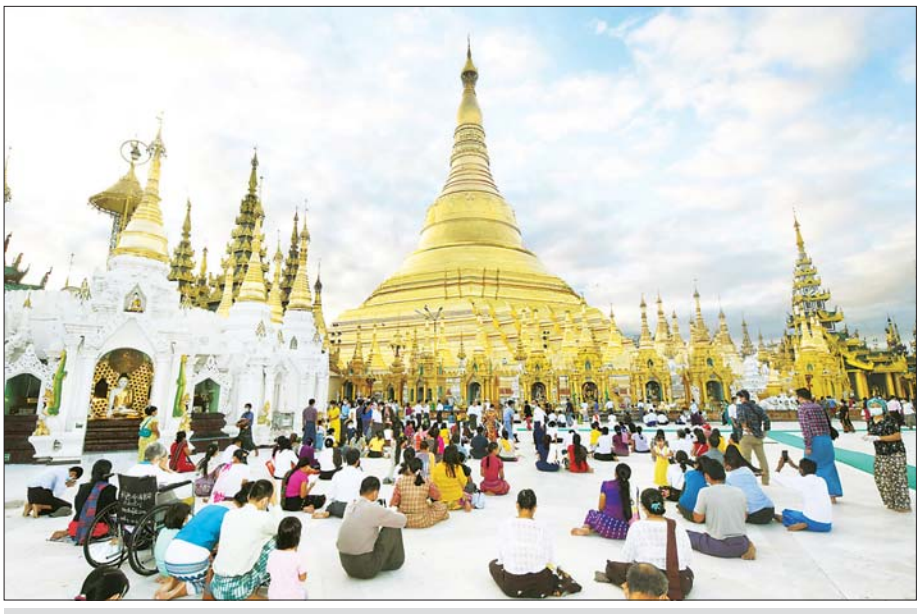
ရွှေတိဂုံစေတီတော်မြတ်ကြီး၌ အောက်တိုဘာ ၂၀ ရက်(သီတင်းကျွတ်လပြည့်နေ့)က ဘုရားဖူးပြည်သူများ စည်ကားနေသည်ကို တွေ့ရစဉ်။

ထို့အတူ မြန်မာနိုင်ငံ ဂီတအစည်းအရုံး(ဗဟို) မှ ယာယီအမှုဆောင်များ၊ မြန်မာနိုင်ငံ ရုပ်ရှင်အစည်းအရုံးမှ နာယကများ၊ အလုပ်အမှုဆောင်အဖွဲ့ဝင်များနှင့် အောက်တိုဘာလ ၁၂ ရက်က ပြန်ကြားရေးဝန်ကြီးဌာန ပြည်ထောင်စုဝန်ကြီးတွေ့ဆုံခဲ့ပြီး ရုပ်ရှင်နှင့် ဂီတလောက တိုးတက်ထွန်းကားရေး