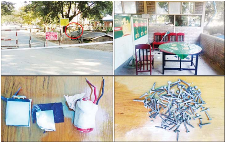
ဗန်းမော်မြို့ ကိုဗစ်-၁၉ ရောဂါ စစ်ဆေးရေးဂိတ်၌ အသံမိုင်းတစ်လုံး ပေါက်ကွဲမှု။

၂၀၂၁ ခုနှစ်၊ ဖေဖော်ဝါရီ ၁ ရက်မှ နိုဝင်ဘာ ၂၀ ရက် အထိ နိုင်ငံတော်ပိုင်ပစ္စည်း ၁၅၁ ခုနှင့် ပုဂ္ဂလိကပိုင် ပစ္စည်း ၇၉ ခုတို့ ပျက်စီးဆုံးရှုံးခဲ့မှုကို ဖော်ပြပါ အတိုင်း တွေ့ရှိရသည်-