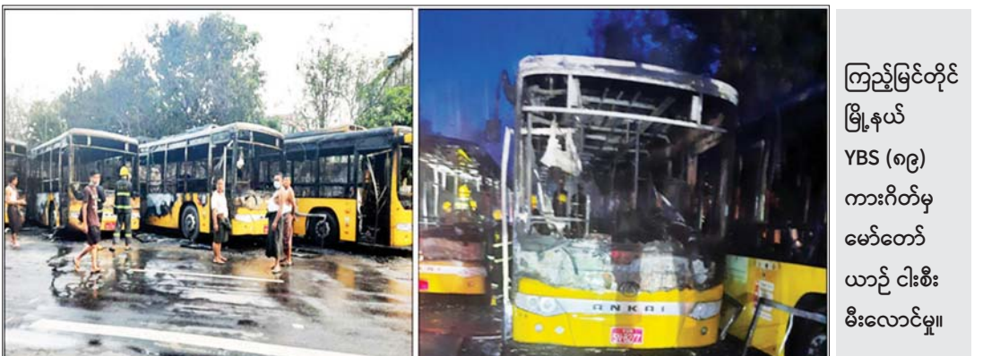
ကြည့်မြင်တိုင် မြို့နယ် YBS (၈၉) ကားဂိတ်မှ မော်တော်ယာဉ် ငါးစီး မီးလောင်မှု။