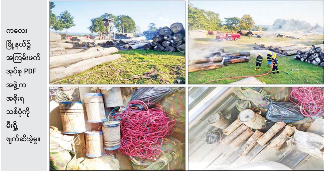
ကလေး မြို့နယ်၌ အကြမ်းဖက် အုပ်စု PDF အဖွဲ့က အစိုးရ သစ်ပုံကို မီးရှို့ ဖျက်ဆီးခဲ့မှု။