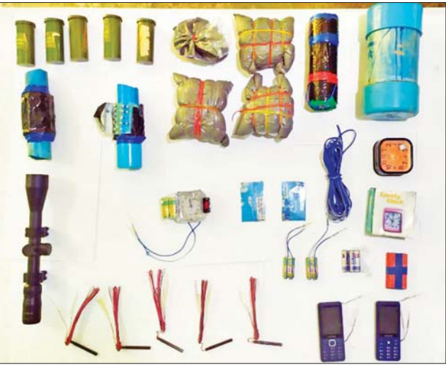
ကျိုက်လတ်မြို့နယ် ကျိုသီဝကျေးရွာ၌ သိမ်းဆည်းရမိသည့် ဖောက်ခွဲဖျက်ဆီးရေးပစ္စည်းများ မှတ်တမ်းဓာတ်ပုံ။