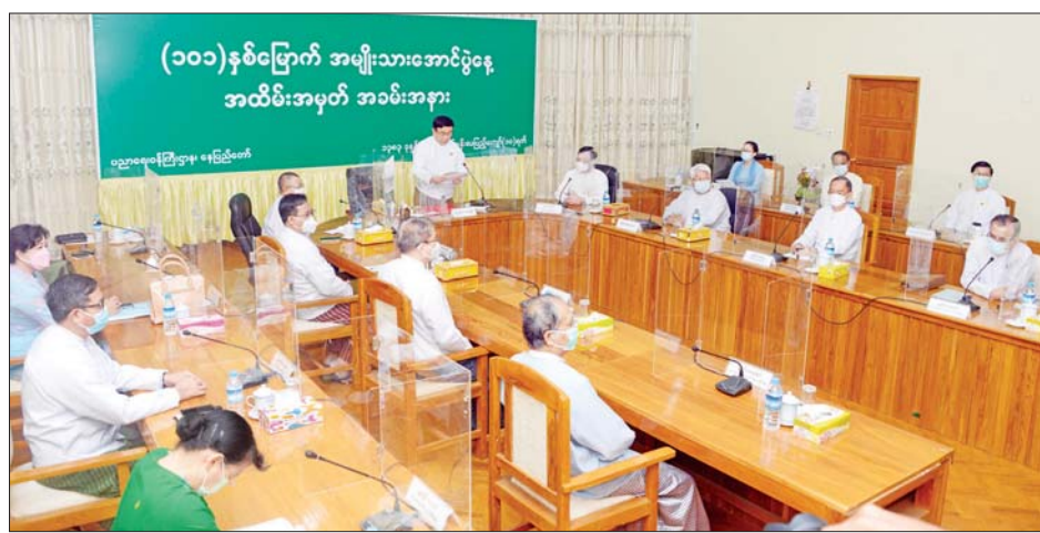
နှင့် တစ်သက်တာပညာရေးဦးစီးဌာနက စီစဉ်ရိုက်ကူး အခမ်းအနားကို ရုပ်သိမ်းလိုက်ကြောင်း သိရသည်။ သည့် မြန်မာ့ကျောင်းသီချင်းဗီဒီယိုကို ပြသကာ သတင်းစဉ်

ပါမောက္ခများ၊ တိုင်းဒေသကြီး၊ ပြည်နယ်၊ ခရိုင် ပညာရေးမှူးများ၊ အခြေခံပညာ အထက်တန်းကျောင်းအုပ်ကြီးများနှင့် တာဝန်ရှိသူများက အွန်လိုင်းစနစ်ဖြင့် ပါဝင်တက်ရောက်ကြသည်။ ရှေးဦးစွာ ဥက္ကဋ္ဌတသောင်း သီဆိုသော အမျိုးသားနေ့ သီချင်းဖြင့် ဂုဏ်ပြုတင်ဆက်သည်။ ထို့နောက် ပြည်ထောင်စုသမ္မတ မြန်မာနိုင်ငံတော်အစိုးရ နိုင်ငံတော်စီမံအုပ်ချုပ်ရေး ကောင်စီဥက္ကဋ္ဌ၊ နိုင်ငံတော်ဝန်ကြီးချုပ် ဗိုလ်ချုပ်မှူးကြီးမင်းအောင်လှိုင်ထံမှ (၁၀၁) နှစ်မြောက် အမျိုးသားအောင်ပွဲနေ့ အထိမ်းအမှတ် အခမ်းအနားသို့ ပေးပို့သည့် သဝဏ်လွှာကို ပညာရေးဝန်ကြီးဌာန ပြည်ထောင်စုဝန်ကြီး ဒေါက်တာညွန့်ဖေ က ဖတ်ကြားသည်။ ယင်းနောက် ပညာရေးဝန်ကြီးဌာန ကျောင်းပြင်ပ