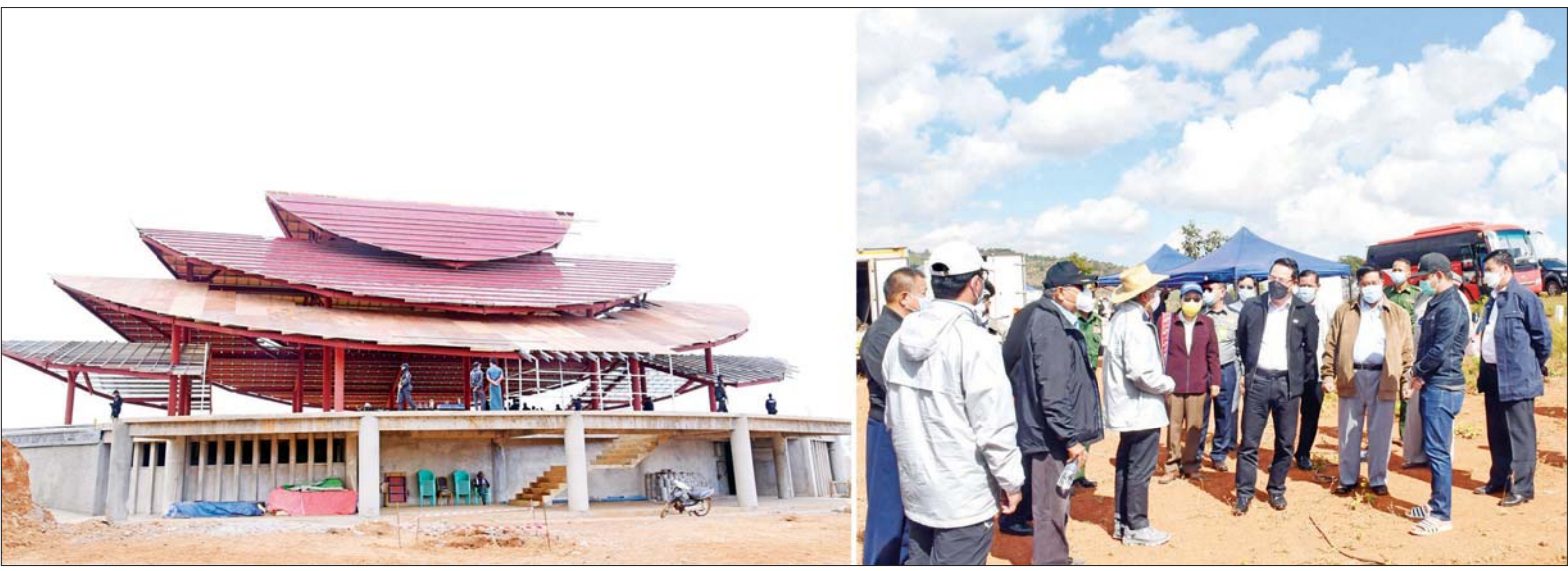
ပြည်ထောင်စုဝန်ကြီး ဦးမောင်မောင်အုန်း၊ ရှမ်းပြည်နယ်ဝန်ကြီးချုပ် ဒေါက်တာ ကျော်ထွန်းနှင့် အဖွဲ့ဝင်များ ပင်းတယဒေသရှိ ရုပ်မြင်သံကြား ရိုက်ကူးထုတ်လုပ်မှုလုပ်ငန်းများအတွက် အခြေခံအဆောက်အအုံများနှင့် စတူဒီယိုများ တည်ဆောက်နေမှုကို လှည့်လည်ကြည့်ရှုစဉ်။

နေပြည်တော် နိုဝင်ဘာ ၂၈ ပြန်ကြားရေးဝန်ကြီးဌာန ပြည်ထောင်စုဝန်ကြီး ဦးမောင်မောင် အုန်းသည် ရှမ်းပြည်နယ် ဝန်ကြီးချုပ် ဒေါက်တာ ကျော်ထွန်းနှင့် ပြည်နယ်ဝန်ကြီးများ၊ ဓနကိုယ်ပိုင်အုပ်ချုပ်ခွင့်ရဒေသ ဦးစီးအဖွဲ့ဥက္ကဋ္ဌ ဦးအာကာလင်းတို့နှင့်အတူ ယနေ့နံနက်ပိုင်းတွင် ဓနကိုယ်ပိုင်အုပ်ချုပ်ခွင့်ရ ဒေသပင်းတယဒေသရှိ Forever Yay Wati ကုမ္ပဏီလီမိတက်က အကောင်အထည်ဖော် ဆောင်ရွက်လျက်ရှိသော ရုပ်မြင်သံကြား ရိုက်ကူးထုတ်လုပ်မှု လုပ်ငန်းများအတွက် အခြေခံအဆောက်အအုံများနှင့် စတူဒီယိုများ တည်ဆောက်နေမှုကို သွားရောက်ကြည့်ရှုအေးပေးသည်။