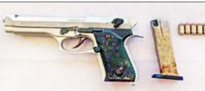
ဒေးဒရဲမြို့နယ် ကျိုက်လတ်မြစ်ကမ်းအနီး မိချောင်းအိုင်ချောင်းဝ၌ သိမ်းဆည်းရမိသည့် လက်နက်/ခဲယမ်း မှတ်တမ်းဓာတ်ပုံ။