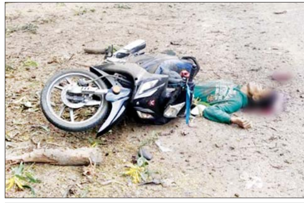
တန့်ဆည်မြို့ မေတ္တာမြိုင်ရပ်ကွက်၌ လက်လုပ်မိုင်းပေါက်ကွဲပြီး အကြမ်းဖက်သူတစ်ဦး သေဆုံး။

နေပြည်တော် နိုဝင်ဘာ ၂၈ CRPH နှင့် NUG အမည်ခံ အကြမ်းဖက် အဖွဲ့များသည် အလုံးစုံပျက်သုဉ်းရေး ဦးတည် ချက်များဖြင့် PDF အမည်ခံ အကြမ်းဖက်အဖွဲ့ကို ဖွဲ့စည်း၍ အချို့သောဒေသများတွင် အေးချမ်း စွာနေထိုင်ကြသော ပြည်သူများ အား အကြောင်းပြချက်မျိုးစုံဖြင့် စွပ်စွဲသတ်ဖြတ်ခြင်း၊ နိုင်ငံပိုင် အဆောက်အအုံများ၊ အများပြည်သူ နှင့်သက်ဆိုင်သော ဆေးရုံများ၊ ကျောင်းများ၊ နေအိမ်များ၊ ကျေးရွာများ၊ ဈေးများ၊ နိုင်ငံပိုင် ဘဏ်များ၊ ပုဂ္ဂလိကပိုင်ဘဏ်များ နှင့် ဌာနဆိုင်ရာရုံးများအား မီးရှို့ ဖျက်ဆီးခြင်း၊ မိုင်းထောင်ဖောက်ခွဲ ခြင်း စသည့်အကြမ်းဖက်လုပ်ရပ် များ လုပ်ဆောင်လျက်ရှိသဖြင့် လုံခြုံရေးတပ်ဖွဲ့ဝင်များက အများ ပြည်သူ အသက်အိုးအိမ်စည်းစိမ် အတွက် သက်ဆိုင်ရာနယ်မြေများ အလိုက် လုံခြုံရေးလုပ်ငန်းများ ဆောင်ရွက်လျက်ရှိသည်။ ထိုသို့ဆောင်ရွက်လျက်ရှိရာ စစ်ကိုင်းတိုင်းဒေသကြီး တန့်ဆည်