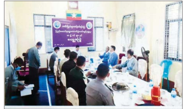
ပြည်ထောင်စုရွေးကောက်ပွဲကော်မရှင် ဥက္ကဋ္ဌ မှ သာပေါင်မြို့နယ် ရွေးကောက်ပွဲကော်မရှင်ရုံးသို့ သွားရောက်စစ်ဆေးခဲ့သည့် မှတ်တမ်းဓာတ်ပုံ