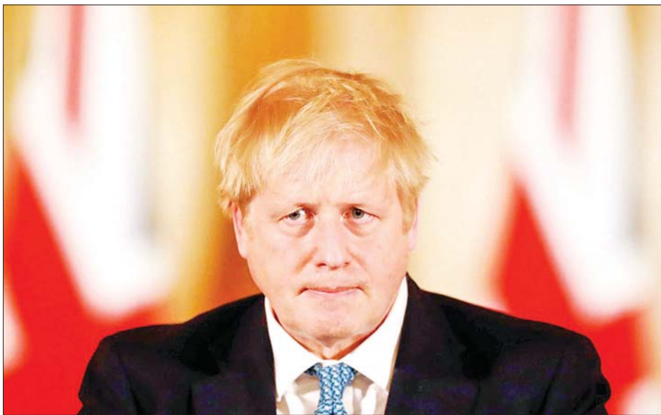
ဗြိတိန်ဝန်ကြီးချုပ် ဘောရစ်ဂျွန်ဆင်။

ကြောင်း ၎င်းက ပြောကြားသည်။ အိုမီခရစ် ကူးစက် ခံထားရသူများကို တောင်အာဖရိက၊ ဘော့ဆွာနာ၊ ဟောင်ကောင်၊ အစ္စရေးနှင့် ဘယ်လ်ဂျီယံတို့တွင် တွေ့ရှိထားသည်။ နယ်သာလန်နိုင်ငံတွင်လည်း တောင်အာဖရိကမှလာသော ခရီးသွားများတွင် ကိုဗစ်-၁၉ ကူးစက်ခံထားရကြောင်း စစ်ဆေးတွေ့ရှိ ခဲ့သည်။ အိုမီခရစ်သည် ကူးစက်မှုအလွန်လျင်မြန်ပြီး နှစ်ကြိမ်ကာကွယ်ဆေး ထိုးပြီးသူများတွင်လည်း လျင်မြန်စွာ ကူးစက်နိုင်သည်။ ထို့ကြောင့် ဗြိတိန်နိုင်ငံ အနေဖြင့် နယ်စပ်တင်းကြပ်မှုများ လုပ်ဆောင်ရခြင်း ဖြစ်ကြောင်း ဗြိတိန်ဝန်ကြီးချုပ် ဘောရစ်ဂျွန်ဆင်က ပြောသည်။ နိုဝင်ဘာ ၂၇ ရက်တွင် တောင်ကိုရီးယား၊ သီရိ လင်္ကာ၊ ထိုင်းနိုင်ငံတို့သည်လည်း တောင်အာဖရိကနှင့် အနီးပတ်ဝန်းကျင်နိုင်ငံများလာသော ခရီးသွားများ ကို ပြည်ဝင်ခွင့်တင်းကြပ်မှုများ ပြုလုပ်မည်ဟု ကြေညာခဲ့သည်။ အင်န်အိတ်ချ်ကော