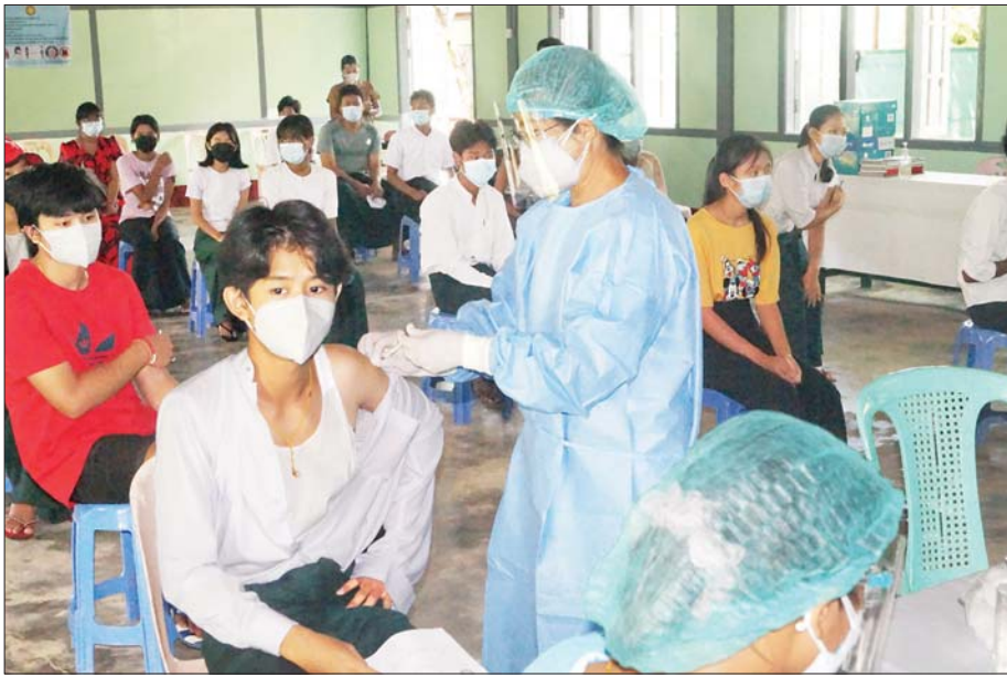
ပြည်ထောင်စုနယ်မြေ နေပြည်တော် လယ်ဝေးမြို့နယ် အမှတ်(၁) အခြေခံပညာအထက်တန်းကျောင်း၌ အောက်တိုဘာ ၁၂ ရက်က အသက် ၁၂ နှစ်နှင့်အထက် ကျောင်းသားကျောင်းသူများအား ကိုဗစ်-၁၉ ကာကွယ်ဆေးထိုးနှံပေးစဉ်။

ကိုဗစ်-၁၉ ကြောင့် ဖြစ်ပေါ်လာနိုင်သည့် စီးပွားရေးသက်ရောက်မှုများအပေါ် ကုစားရေး လုပ်ငန်းကော်မတီအစည်းအဝေးကို အောက်တို