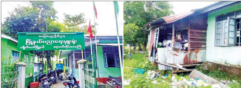
၂၉-၆-၂၀၂၁ ရက်တွင် ကျိုက်လတ်မြို့ (၃) ရပ်ကွက် ကန်တော်ကြီးလမ်းရှိ မြို့နယ်ပညာရေးမှူးရုံး အနောက်ဘက်ရှိ စတုရန်းဘေး၌ လက်လုပ်မိုင်းပေါက်ကွဲမှု မှတ်တမ်းဓာတ်ပုံ။