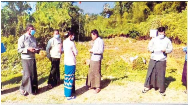
ပြည်ထောင်စုရွေးကောက်ပွဲကော်မရှင် ဥက္ကဋ္ဌ မှ ရေကြည်မြို့နယ် ရွေးကောက်ပွဲကော်မရှင်ရုံး အဆောက်အအုံမြေနေရာသို့ သွားရောက်စစ်ဆေးခဲ့သည့် မှတ်တမ်းဓာတ်ပုံ

ပြည်ထောင်စုရွေးကောက်ပွဲကော်မရှင်၏ လေ့လာဆန်းစစ်မှုအရ နိုင်ငံတကာ၌ ကျင့်သုံးသော အခြေခံရွေးကောက်ပွဲစနစ်တွင် အုပ်စုသုံးစနစ် မဲအများဆုံးရသူ အရွေးခံရသည့်စနစ် (Plurality / Majority System)၊ အချိုးကျကိုယ်စားပြုစနစ် (Proportional Representation System) နှင့် ရောနှောထားသောစနစ် (Mixed System) တို့ဖြစ်ကြောင်း၊ ထိုနေရာတွင် မဲအများဆုံးရသူ အနိုင်ရသည့်စနစ် FPTP ၏ အဓိကအားနည်းချက်အဖြစ် မဲကျန် (လေလွင့်မဲ) ကို ထောက်ပြကြောင်း၊ ဥပမာ ရွေးကောက်ပွဲတစ်ခုတွင် ဝင်ရောက်ယှဉ်ပြိုင် အရွေးခံသူ ကိုယ်စားလှယ်လောင်းလေးဦးအနက် ခိုင်လုံမဲ ၁၀၀ မှာ ဦးဖြူက ၄၀ မဲ၊ ဦးနီ ၃၀ မဲ၊ ဦးညို ၂၀ မဲ နှင့် ဦးဝါ ၁၀ မဲ ရရှိပါက ၄၀ မဲ ရရှိသည့် ဦးဖြူက အနိုင်ရမည်ဖြစ်ကြောင်း၊ ဦးဖြူသည်ရရှိသည့် ဆန္ဒမဲ ၄၀ ရာခိုင်နှုန်းဖြင့် အနိုင်ရခြင်းဖြစ်ပြီး မဲကျန် (လေလွင့်မဲ) ၆၀ ရာခိုင်နှုန်း ရှိမည်ဖြစ်ကြောင်း၊ တစ်နည်းအားဖြင့် ဦးဖြူအနိုင်ရခြင်းကို ဆန်းစစ်ပါက ယှဉ်ပြိုင်သူလေးဦးအနက်