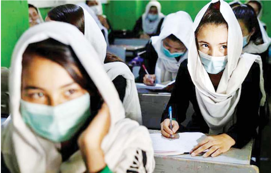
အာဖဂန် ကျောင်းသူများကို တွေ့ရစဉ်။

ကာဘူးလ် နိုဝင်ဘာ ၂၈ အာဖဂန်နစ္စတန်တွင် တာလီဘန် ကြားဖြတ်အစိုးရ ခေတ္တဝန်ကြီးချုပ် က ပညာရေးကဏ္ဍတွင် အမျိုး သားများသာမက အမျိုးသမီးများ ပါမဖြစ်မနေ ပညာသင်ကြားရမည် ဟု မိန့်ခွန်းတွင် ထည့်သွင်း ပြောကြားခဲ့သည်။ ခွင့်ပြုထားသည့် အခြေအနေ အောက်တွင် အမျိုးသမီးများပါ စာသင်ကျောင်းသို့ သွားရောက် ပညာသင်ခွင့်ရရှိမည် ဖြစ်သည်။ မြို့တော်ကာဘူးလ်နှင့် အခြား သောနေရာများတွင် အမျိုးသမီး များ အလယ်တန်းကျောင်းသို့ ဝင်ရောက်ခွင့် မပြုဟူသော ခေါင်းစဉ်ကို ခေတ္တဝန်ကြီးချုပ် မူလာဟတ်ဆန်အာကန်က ယခုလို ပြောကြားခဲ့ခြင်းဖြစ်သည်။ ၎င်း၏ မိန့်ခွန်းကို နိုဝင်ဘာ ၂၇ ရက်တွင် နိုင်ငံပိုင် မီဒီယာမှတစ်ဆင့် အသံ လွှင့်ခဲ့သည်။ ပညာရေးမှာ ကျား၊ မ မရွေး အရေးကြီးသည်ဟု ၎င်းက ပြောကြားခဲ့သည်။