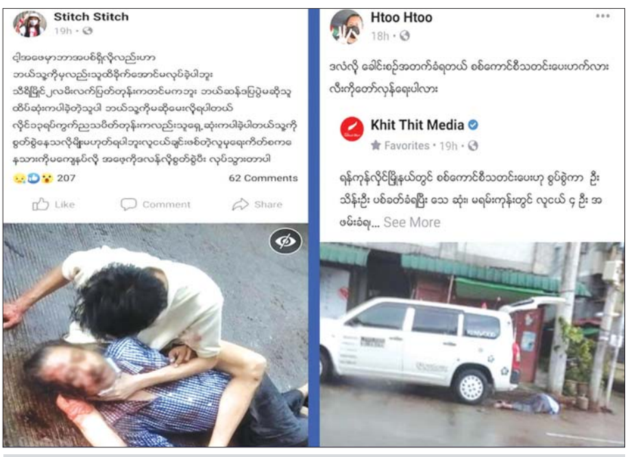
NLD ပါတီ ထောက်ခံသူအချင်းချင်း ဒလန်ခေါင်းစဉ်တပ် စွပ်စွဲသတ်ဖြတ်ခံရမှု။