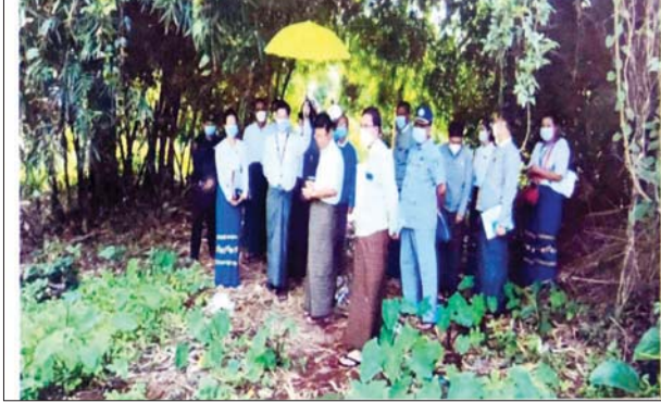
ပြည်ထောင်စုရွေးကောက်ပွဲကော်မရှင်ဥက္ကဋ္ဌမှ ညောင်တုန်းမြို့နယ် ရွေးကောက်ပွဲကော်မရှင်ရုံးသို့ သွားရောက်စစ်ဆေးမှု မှတ်တမ်းဓာတ်ပုံ