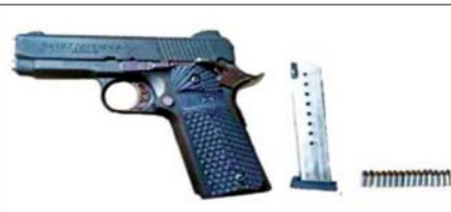
ကျိုက်လတ်မြို့နယ် သပြေတန်းကျေးရွာအနီး လယ်ကွင်း၌ သိမ်းဆည်းရမိ လက်နက်/ခဲယမ်း မှတ်တမ်းဓာတ်ပုံ။