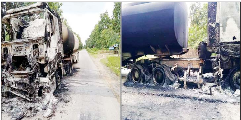
ထီးချိုင့်မြို့နယ်၌ အကြမ်းဖက်အုပ်စု PDF အဖွဲ့က ဆီဘောက်ဆာယာဉ်တစ်စီးကို မီးရှို့ဖျက်ဆီးခဲ့မှု။