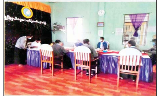
ပြည်ထောင်စုရွေးကောက်ပွဲကော်မရှင် ဥက္ကဋ္ဌ မှ ဝေပြည်မြို့နယ် ရွေးကောက်ပွဲကော်မရှင်ရုံးသို့ သွားရောက်စစ်ဆေးခဲ့သည့် မှတ်တမ်းဓာတ်ပုံ

ဦးဖြူက မဲဆန္ဒရှင်များပေးသော မဲအများဆုံးရရှိကာနိုင်ခြင်းဖြစ်သော်လည်း ဦးဖြူကို မဲမပေးသည့် မဲဆန္ဒရှင် လူနည်းစုသုံးစုဖြစ်သော ဦးနီ၊ ဦးညိုနှင့်ဦးဝါကို မဲပေးသူများကို ပေါင်းလိုက်ပါက ၆၀ ရာခိုင်နှုန်းရှိပြီး မဲဆန္ဒရှင်လူများစုအဖြစ် တွေ့ရမည်ဖြစ်၍ ဦးဖြူအနိုင်ရခြင်းက တရားမျှတပါသလားဟု စောဒကတက်နိုင်ကြောင်း၊ ထို့ကြောင့် FPTP စနစ်သည် လူများစု၏ ဆန္ဒကို မှန်မှန်ကန်ကန် ရရှိစေမည်ဆိုသည့် အာမခံချက်မရှိသည်ကို တွေ့ရမည်ဖြစ်ကြောင်း၊ ထိုအခြေအနေမျိုးတွင် အချိုးကျကိုယ်စားပြုစနစ် (PR) သဘောတရားအတိုင်း မဲဆန္ဒနယ်ကို ကျယ်ပြန့်စွာသတ်မှတ်ပြီး လွှတ်တော်ကိုယ်စားလှယ် ၁၀ ဦး ရွေးချယ်ရန်အတွက် A ပါတီ၊ B ပါတီ၊ C ပါတီနှင့် D တစ်သီးပုဂ္ဂလလေးဖွဲ့က ဝင်ရောက်ယှဉ်ပြိုင်ပြီး မဲရလဒ်ကလည်း A ပါတီ ၄၀ ရာခိုင်နှုန်း၊ B ပါတီ ၃၀ ရာခိုင်နှုန်း၊ C ပါတီ ၂၀ ရာခိုင်နှုန်းနှင့် D တစ်သီးပုဂ္ဂလတို့က ၁၀ ရာခိုင်နှုန်း ရမည်ဆိုပါက A ပါတီက ကိုယ်စားလှယ်လေးဦး၊ B ပါတီက ကိုယ်စားလှယ်သုံးဦး၊ C ပါတီက ကိုယ်စားလှယ်နှစ်ဦးနှင့် D တစ်သီးပုဂ္ဂလကိုယ်စားလှယ်တစ်ဦး အရွေးခံရမည်ဖြစ်၍ရရှိသည့် ဆန္ဒမဲအချိုးကျ အတိုင်း ကိုယ်စားလှယ်ရရှိမှုဖြစ်ပြီး မဲလေလွင့်ဆုံးရှုံးမှုမရှိဘဲ ပြည့်သူ့ဆန္ဒအစစ်အမှန်ကို ကိုယ်စားပြုဖော်ပြနိုင်မည်ဖြစ်ကြောင်း ပြောကြားသည်။