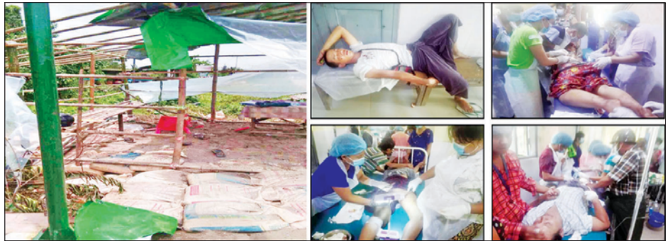
၂၉-၆-၂၀၂၁ ရက်တွင် ကျိုက်လတ်မြို့ (၁)ရပ်ကွက် ဖျာပုံ-ကျိုက်လတ်ကားလမ်းရှိ ကိုဗစ်-၁၉ စစ်ဆေးရေးဂိတ်၌ လက်လုပ်မိုင်းပေါက်ကွဲမှုနှင့် အပြစ်မဲ့ပြည်သူ ကျား လေးဦး၊ မ တစ်ဦး ထိခိုက် ဒဏ်ရာရရှိမှု မှတ်တမ်းဓာတ်ပုံ။