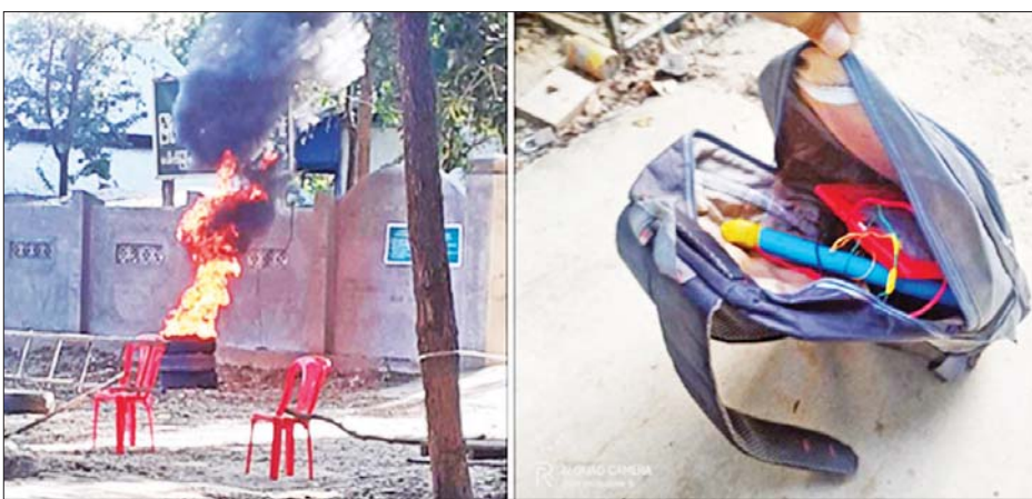
ပေါက်မြို့နယ်ပညာရေးမှူးရုံးဝင်ပေါက်အနီး မသင်္ကာဖွယ်တွေ့ရသည့် ကျောပိုးအိတ်အတွင်းမှ လက်လုပ် ချိန်ကိုမိုင်းတစ်လုံးအား စနစ်တကျ ဖျက်ဆီးနေသည့် မှတ်တမ်းဓာတ်ပုံ။

လုံခြုံရေးဆောင်ရွက်နေသည့် တပ်ဖွဲ့ဝင်တစ်ဦး မိုင်းစထိမှန်ဒဏ်ရာရရှိခဲ့ကြောင်း သိရှိရသည်။ အလားတူ နိုဝင်ဘာလ ၂၇ ရက် နံနက် ၈ နာရီ ၃၅ မိနစ်ခန့်တွင် ရန်ကုန်တိုင်းဒေသကြီး ရန်ကင်း မြို့နယ် (၁၄)ရပ်ကွက် မဂ္ဂင်လမ်းပေါ်ရှိ အမှတ်(၂) အခြေခံပညာ အလယ်တန်းကျောင်းအနီး၌ လည်း ကောင်း၊ နံနက် ၉ နာရီ ၁၀ မိနစ်ခန့်တွင် (၁)ရပ်ကွက် သစ္စာလမ်းနှင့် ရန်ကင်းလမ်းထောင့် သစ္စာလမ်းပေါ်၌ လည်းကောင်း၊ နံနက် ၉ နာရီခန့်တွင် (၁)ရပ်ကွက် ရန်ကင်းလမ်းစာတိုက်မှတ်တိုင်နှင့် ပေ ၄၀ ခန့်အကွာ ရှိပလက်ဖောင်းဘေး၌လည်းကောင်း ပေါက်ကွဲမှုများ ဖြစ်ပွားခဲ့သဖြင့် လုံခြုံရေးတပ်ဖွဲ့ဝင်များက သွားရောက်စစ်ဆေးခဲ့ရာ အဆိုပါနေရာများ၌ အကြမ်းဖက်သူများထောင်ထားသည့် ကြေးဘူရား ပန်းအိုးဖြင့် ပြုလုပ်ထားပြီး Keypad ဖုန်းဖြင့် ချိတ်ဆက်ထားသည့် လက်လုပ်မိုင်းတစ်လုံးစီ ပေါက်ကွဲထားသည်ကို တွေ့ရှိရပြီး ပေါက်ကွဲမှုများ ကြောင့် လူနှင့်အဆောက်အအုံ ထိခိုက်မှုမရှိကြောင်း သိရှိရသည်။ သက်မဲ့ပြုလုပ်သိမ်းဆည်း ထိုအတူ နိုဝင်ဘာ ၂၈ ရက် နံနက် ၈ နာရီ ၁၀ မိနစ်ခန့်တွင် မကွေးတိုင်းဒေသကြီး ပေါက်မြို့