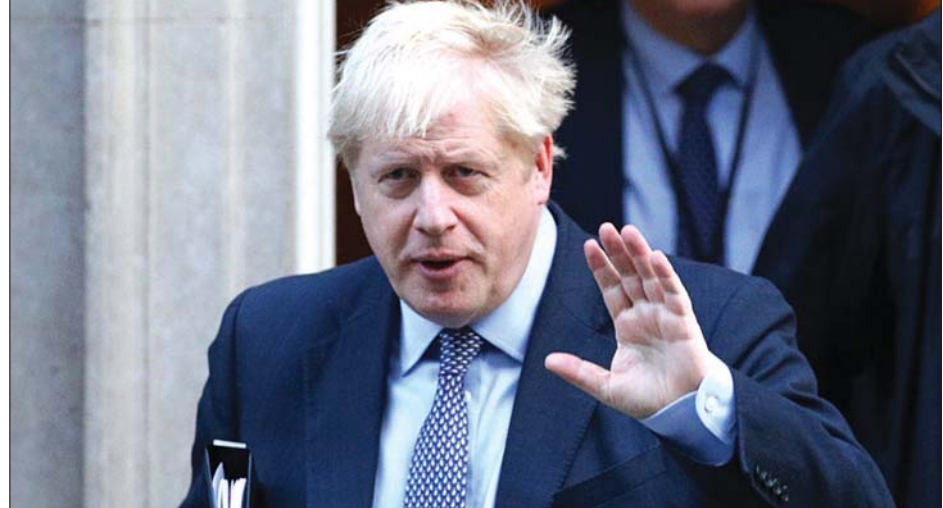
ဗြိတိန်ဝန်ကြီးချုပ် ဘောရစ်ဂျွန်ဆင်

နှစ်သစ်ကူးမတိုင်မီ အင်္ဂလန် တွင် အသက် ၁၈ နှစ်နှင့် အထက် များကို အပိုဆောင်းကာကွယ် ဆေးထိုးပေးနိုင်မည်ဟု ဘောရစ် ဂျွန်ဆင်ကပြောသည်။ အင်္ဂလန် သည် ဗြိတိန်နိုင်ငံရှိ လူဦးရေအများ အပြား နေထိုင်ရာနေရာလည်း ဖြစ်သည်။ အင်န်အိတ်ချ်ကေ