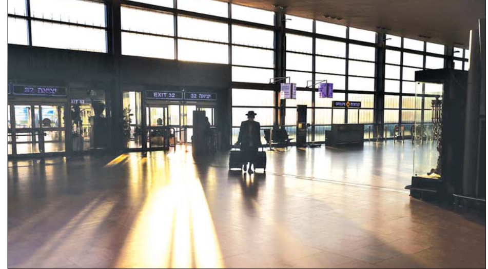
အစွရေးနိုင်ငံ ဘင်ဂူရီယန် အပြည်ပြည်ဆိုင်ရာလေဆိပ်သို့ ရောက်ရှိလာသည့် ခရီးသည်တစ်ဦးကို တွေ့ရစဉ်။

နိုင်ငံတွင် အိုမီခရွန်ကူးစက်မှုရသူ ၆၇ ဦးရှိသည်။ နောက်ထပ်သံသယ ရှိသူ ၈၀ ခန့်ရှိပြီး ၎င်းတို့၏ ဆေးစစ်ချက်အဖြေများကိုအတည် မပြုနိုင်သေးချေ။