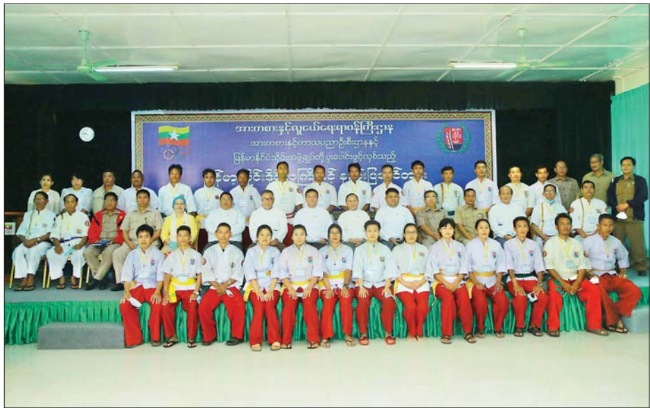
ပြည်ထောင်စုဝန်ကြီး ဦးမင်းသိန်းဇံနှင့် အဖွဲ့ဝင်များ မြန်မာနိုင်ငံ သိုင်းအဖွဲ့ချုပ်၏ မြန်မာ့သိုင်းဒိုင်လူကြီးနှင့် နည်းပြသင်တန်းတက်ရောက်သူများနှင့်အတူ စုပေါင်းမှတ်တမ်းတင်ဓာတ်ပုံရိုက်စဉ်။

အစဉ်အမြဲ ပူးပေါင်းဆောင်ရွက် သို့ဖြစ်၍ မြန်မာနိုင်ငံ သိုင်းအားကစား အဖွဲ့ချုပ်အနေ ဖြင့် ဝန်ကြီးဌာနနှင့် အစဉ်အမြဲ ပူးပေါင်း ဆောင်ရွက်ရန်လိုအပ်ပါ ကြောင်း၊ နိုင်ငံတော်အကြီးအကဲမှ လည်း မြန်မာ့သိုင်းပညာများကို ရှင်သန်တိုးတက်စေလိုပါကြောင်း၊ မြန်မာ့သိုင်း အဖွဲ့ချုပ်အားလုံး ပေါင်းစည်းရန်၊ အားပေးရန်၊ တိုးတက်ရန်၊ နိုင်ငံ့ဂုဏ်ဆောင်နိုင်