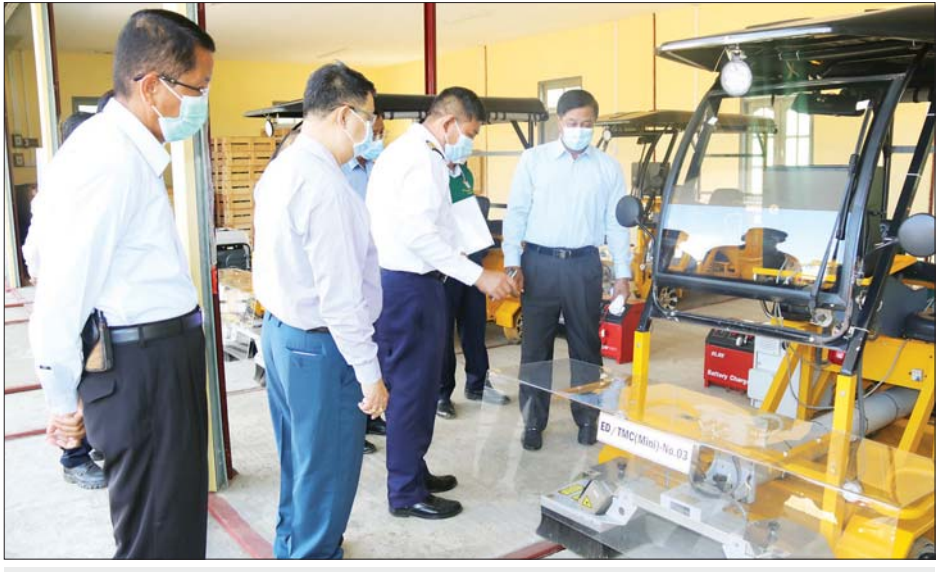
ပြည်ထောင်စုဝန်ကြီး ဗိုလ်ချုပ်ကြီး တင်အောင်စန်း သံလမ်းပြုပြင်ရေး စက်ယန္တရားအသစ်များနှင့် စက်ပစ္စည်းများကို ကြည့်ရှုစစ်ဆေးစဉ်။

ဖြစ်ကြောင်း၊ စက်ယန္တရားများကို သတ်မှတ်ထားသော မွမ်းမံထိန်းသိမ်းရေးလမ်းညွှန်ချက် (Maintenance Manual) များအတိုင်း ပုံမှန်စစ်ဆေး၊ မွမ်းမံထိန်းသိမ်းမှု လုပ်ငန်းစဉ်များကို မပျက်မကွက် ဆောင်ရွက်ရန်နှင့် မှတ်တမ်းစာအုပ် (Log Book) များ စနစ်တကျထားရှိမှု မှတ်တမ်းထားရှိရန် လိုအပ်ကြောင်း၊ လုပ်ငန်းခွင်၌ ဘေးအန္တရာယ်ကင်းရှင်းရေး အစီအမံ (Safety Plan) များ၌ ပြဋ္ဌာန်းထားသည့် သတ်မှတ်ချက်များအတိုင်း အမြဲမပြတ် ဂရုစိုက်လိုက်နာ ဆောင်ရွက်ကြရန် လိုအပ်ကြောင်း၊ စက်ယန္တရားကိုင်တွယ် မောင်းနှင်ရသည့် ဝန်ထမ်းများနှင့် မွမ်းမံပြုပြင် ထိန်းသိမ်းရေး တာဝန်ရှိသည့်ဝန်ထမ်းများကို ကျွမ်းကျင်မှုပြည့်ဝအောင် လေ့ကျင့်ပြုစုပျိုးထောင်ပေးရန်နှင့် လုပ်ငန်းခွင်ဘေးအန္တရာယ်ကင်းရှင်းရေးဆိုင်ရာ ဝတ်စုံပစ္စည်း (Safety Equipment) များကို ပြည့်စုံအောင် တပ်ဆင်ပေးရန်လိုအပ်ကြောင်း၊ ဝန်ထမ်းများအနေဖြင့် ကိုဗစ်-၁၉ ကူးစက်ရောဂါ ကြိုတင်ကာကွယ်ရေးနှင့် ပတ်သက်၍ ကျန်းမာရေးဝန်ကြီးဌာန၏ ညွှန်ကြားချက်များကို