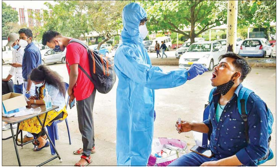
အိန္ဒိယတွင် ကိုဗစ်-၁၉ စမ်းသပ်စစ်ဆေးရန် အာခေါင်တို့ဖတ်နမူနာ ရယူနေသည်ကို တွေ့ရစဉ်။

အိန္ဒိယနိုင်ငံတွင် လတ်တလော ကိုဗစ်-၁၉ ကူးစက်ဖြစ်ပွားလျက် ရှိသူ ၉၁၄၅၆ ဦးရှိပြီး လွန်ခဲ့သော ရက်အတွင်း ကိုဗစ်-၁၉ ကူးစက် ဖြစ်ပွားလျက်ရှိသူ ၈၅၅ ဦး လျော့နည်းခဲ့သည်။