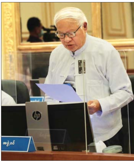
နိုင်ငံတော်စီမံအုပ်ချုပ်ရေးကောင်စီအဖွဲ့ဝင် ဦးသိန်းညွန့် ရှင်းလင်းတင်ပြစဉ်။