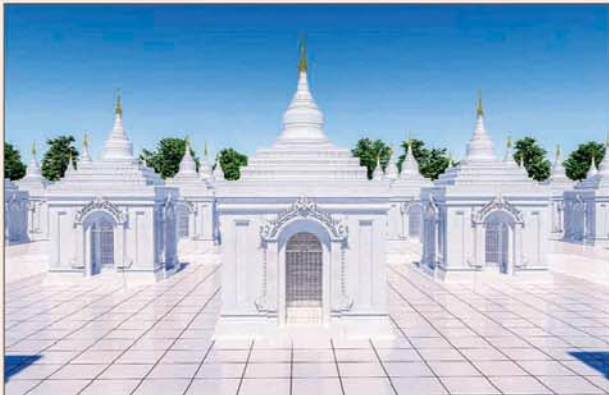
ကျောက်စာရုံစေတီ(၁၂ x ၁၂ x ၁၈)ပေ ၁ ဆူ တန်ဖိုး- ၂၇၉ သိန်း