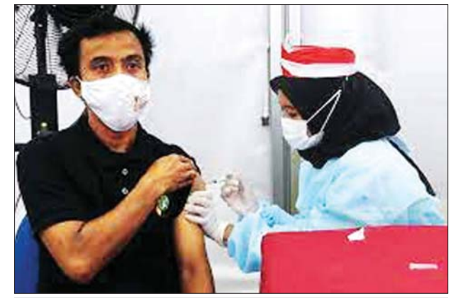
အင်ဒိုနီးရှားတွင် ကိုဗစ် - ၁၉ ကာကွယ်ဆေးထိုးနေသည်ကို တွေ့ရစဉ်။

ဂျကာတာ ဒီဇင်ဘာ ၁၃ အင်ဒိုနီးရှားနိုင်ငံတွင် ဒီဇင်ဘာ ၁၃ ရက်က ကိုဗစ်-၁၉ ထပ်မံကူးစက် ဖြစ်ပွားသူ ၁၀၆ ဦး တိုးလာမှုနှင့်အတူ နိုင်ငံအတွင်း ကိုဗစ်-၁၉ ကူးစက်ဖြစ်ပွားသူပေါင်း ၄၂၅၉၂၄၉ ဦးအထိ ရှိလာခဲ့သည်။ ထို့အတူ ကိုဗစ်-၁၉ ကြောင့် ၁၂ ဦး ထပ်မံသေဆုံးမှုနှင့်အတူ စုစုပေါင်းကိုဗစ်-၁၉ သေဆုံးသူ ၁၄၃၉၄၈ ဦးအထိ ရှိလာခဲ့ကြောင်း ကျန်းမာရေးဝန်ကြီးဌာနက ဖော်ပြသည်။ လွန်ခဲ့သော ၂၄ နာရီအတွင်း ကိုဗစ်-၁၉ ကူးစက်ဖြစ်ပွားမှုမှ ပြန်လည်ကောင်းမွန်လာပြီး ဆေးရုံမှဆင်းလာသူ ၂၇၈ ဦး ရှိလာသော ကြောင့် စုစုပေါင်း ကိုဗစ်-၁၉ ကူးစက်ဖြစ်ပွားမှုမှ ပြန်လည်ကောင်းမွန် လာသူ ၄၁၀၃၂၇ ဦးအထိ ရှိလာသည်။ အင်ဒိုနီးရှားနိုင်ငံတွင် တတိယအကြိမ် အပိုဆောင်း ကိုဗစ်-၁၉ ကာကွယ်ဆေးထိုးမှုအပါအဝင် ယနေ့အချိန်အထိ တစ်ခါထိုးကာကွယ် ဆေးပမာဏ ၂၅၁ ဒသမ ၂၃ သန်း ထိုးနှံပြီးဖြစ်သည်။ ကိုဗစ်-၁၉ ကာကွယ်ဆေး တစ်ကြိမ်ထိုးနှံပြီးသူပေါင်း ၁၄၆ ဒသမ ၈၇ သန်းရှိလာခဲ့ပြီဖြစ်သလို ၁၀၃ ဒသမ ၀၉ သန်းမှာ ကိုဗစ်-၁၉ ကာကွယ်ဆေးကို ဒုတိယအကြိမ်ထိုးနှံပြီးဖြစ်ကြောင်း ကျန်းမာရေး