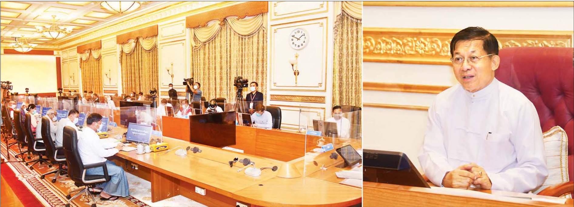
နိုင်ငံတော်စီမံအုပ်ချုပ်ရေးကောင်စီဥက္ကဋ္ဌ၊ နိုင်ငံတော်ဝန်ကြီးချုပ် ဗိုလ်ချုပ်မှူးကြီး မင်းအောင်လှိုင် နိုင်ငံတော်စီမံအုပ်ချုပ်ရေးကောင်စီ အစည်းအဝေး (၁၈/၂၀၂၁) သို့ တက်ရောက်အမှာစကားပြောကြားစဉ်။

နိုင်ငံတော်စီမံအုပ်ချုပ်ရေးကောင်စီဥက္ကဋ္ဌ၊ နိုင်ငံတော်ဝန်ကြီးချုပ် ဗိုလ်ချုပ်မှူးကြီး မင်းအောင်လှိုင် နိုင်ငံတော်စီမံအုပ်ချုပ်ရေးကောင်စီ အစည်းအဝေး (၁၈/၂၀၂၁) သို့ တက်ရောက်အမှာစကားပြောကြား