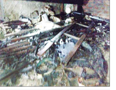
ရခိုင်ပြည်နယ် ဝှမြို့နယ်၌ အခြေခံပညာမူလတန်းလွန်ကျောင်းအား ဆူပူအကြမ်းဖက်သူများက မီးရှို့ဖျက်ဆီးမှု။

အစည်းအဝေး ခန်းမဆောင်အတွင်းရှိ စတိတ်စင်တစ်ခု၊ သစ်သားစားပွဲ ၁၂ လုံး၊ သစ်သားကုလားထိုင် ၁၀ လုံးနှင့် ကော်ဇောလိပ်တစ်ခုတို့ မီးလောင်ပျက်စီးခဲ့ပြီး အခင်းဖြစ်နေရာအနီးမှ ဓာတ်ဆီထည့်သည့် ဘူးခွဲ နှစ်ခုကို တွေ့ရှိသိမ်းဆည်းရမိခဲ့ကြောင်း သိရသည်။ အလားတူ ယနေ့နံနက်ပိုင်းတွင် ရခိုင်ပြည်နယ် ဝှမြို့နယ် ရွာမရပ်ကွက် မင်္ဂလာလမ်းရှိ အခြေခံပညာမူလတန်းလွန်ကျောင်းအား အကြမ်းဖက်သမားများက မီးရှို့ဖျက်ဆီးသွားကြောင်း သတင်းအရ လုံခြုံရေးတပ်ဖွဲ့ဝင်များ၊ မီးသတ်တပ်ဖွဲ့ဝင်များပါဝင်သော