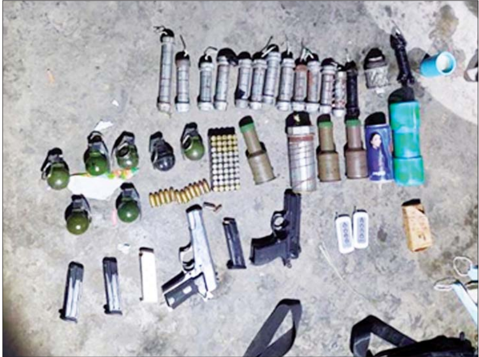
မန္တလေးမြို့၌ သူနာပြုတစ်ဦးအပါအဝင် ပြည်သူများအား သတ်ဖြတ်ခဲ့သည့် ဖြစ်စဉ်မှ ဖမ်းဆီးရမိသည့် လက်နက်ခဲယမ်းများနှင့် ဆက်စပ်ပစ္စည်းများ။