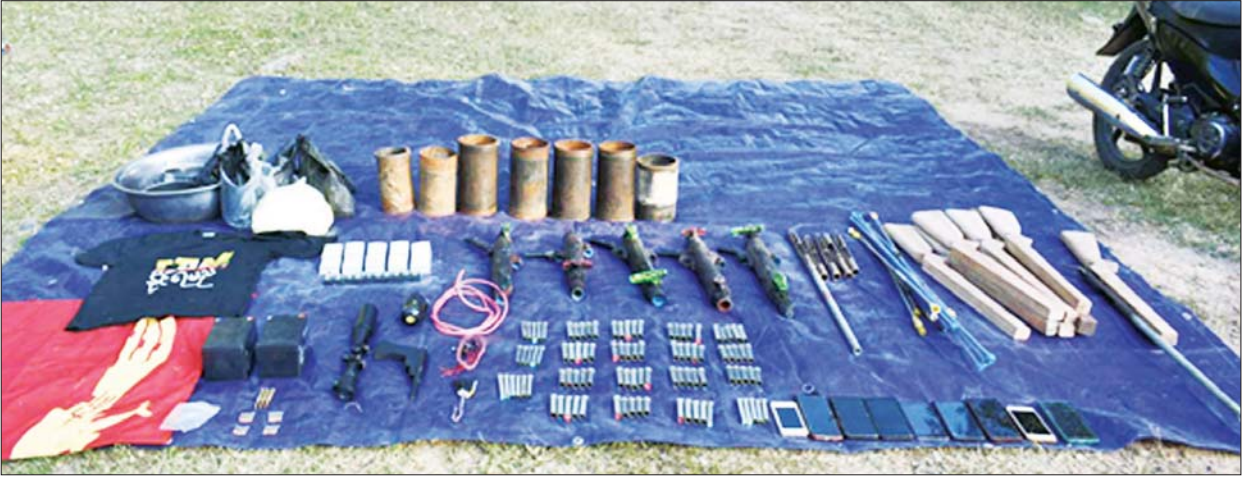
၁၂-၁၂-၂၀၂၁ ရက်က မုံရွာမြို့၊ အလုံရပ်ကွက် မြို့ဦးရပ်ရှိ ချမ်းသာကြီးဘုန်းကြီးကျောင်းအတွင်း၌ သိမ်းဆည်းရမိခဲ့သည့်ပစ္စည်းများ။

အသုံးပြုမည့် လက်နက်၊ ခဲယမ်းများကိုလည်း နည်းမျိုးစုံဖြင့် နိုင်ငံ အတွင်းပို့ဆောင်၍ အများပြည်သူ ယုံကြည်ကိုးကွယ်ရာဖြစ်သော ဘုန်းတော်ကြီးကျောင်းအချို့တွင် သိုလှောင်သိမ်းဆည်းခြင်း၊ ဘာသာရေး အရ ကိုးကွယ်ယုံကြည်မှုကို အလွဲသုံးစားပြုလုပ်၍ အကြမ်းဖက်လုပ်ငန်း များကို အားပေးခြင်း၊ ကိုယ်တိုင်ပြုလုပ်ခြင်းများ လုပ်ဆောင်လျက် ရှိသည်။ စာမျက်နှာ ၁၆ ကော်လံ ၁ □