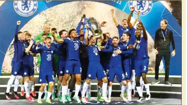
ယမန်နှစ် ချန်ပီယံလိဂ် ချန်ပီယံချယ်ဆီးအသင်း အောင်ပွဲခံနေစဉ်။

အကျောပွဲစဉ်များကို ဖေဖော်ဝါရီ ၁၅ ရက်၊ ၁၆ ရက်၊ ၂၂ ရက်နှင့် ၂၃ ရက်တို့တွင် ယှဉ်ပြိုင်ကစားသွားမည်ဖြစ်ပြီး ဒုတိယအကျောပွဲစဉ်များကို မတ် ၈ ရက်၊ ၉ ရက်၊ ၁၅ ရက်နှင့် ၁၆ ရက်တို့တွင် ယှဉ်ပြိုင်ကစားသွားမည် ဖြစ်သည်။ ယခုနှစ်ရာသီ၏ ချန်ပီယံလိဂ်ဗိုလ်လုပွဲကို မေ ၂၈ ရက်တွင် ရုရှားနိုင်ငံ စိန့်ပီတာစဘတ်၌ ကျင်းပမည်ဖြစ်သည်။ ယူရိုပါလိဂ်ရှုံးထွက်ပွဲစဉ်များကိုလည်း မဲနိုက်ရွေးချယ်ခဲ့ရာ ဆီဗီလာနှင့် ဒိုင်နမိုဇောဂရက်၊ ဇင်းနစ်နှင့် ဘက်တစ်၊ အတ္တလန္တာ နှင့် အိုလံပီယာကော့စ်၊ ဒေါ့မန်နှင့် ရိုနီးဂျား၊ လိုက်ပဲစ်နှင့် ဆိုစီဒင်၊ ရီးရဲမက်ဒရစ်နှင့် ဘရာဂါ၊ ဘာစီလိုနာနှင့် နာပိုလီ၊ ပေါ်တိုနှင့် လာဇီယိုအသင်းတို့ ဆုံတွေ့နေသည်။ အောင်ဇော်