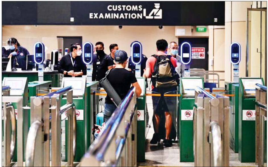
မလေးရှားလေဆိပ်တွင် ခရီးသည်များကို တွေ့ရစဉ်။

၁၉ ကြောင့်သေဆုံးသူ ၃၀၈၇၉ ဦး ရှိလာခဲ့ပြီဖြစ်သည်။ ကိုဗစ်-၁၉ ကူးစက်ဖြစ်ပွားမှုမှ ပြန်လည်ကျန်းမာ ပြီးဆေးရုံမှဆင်းလာသူ ၅၃၉၉ ဦးအပါအဝင် စုစုပေါင်း ကိုဗစ်-၁၉ ကင်းစင်သွားသူပေါင်း ၂၆၀၃၉၀၈ ဦး ရှိလာပြီဖြစ်သည်။ ကိုဗစ်-၁၉ ကူးစက်ဖြစ်ပွားလျက်ရှိသူ ၅၈၈၅၂ ဦး အနက် ၄၀၇ ဦးမှာ အထူးကြပ်မတ်ကုသဆောင်တွင် ဆေးကုသမှုခံယူလျက်ရှိပြီး ၎င်းတို့အနက် ၂၁၆ ဦးမှာ အသက်ရှူအထောက်အကူ လိုအပ်လျက်ရှိကြောင်း သိရသည်။ ဒီဇင်ဘာ ၁၂ ရက် တစ်ရက်တည်း၌ ကိုဗစ်-၁၉ ကာကွယ်ဆေးထိုးပြီးသူ ၆၇၃၇၆ ဦးရှိခဲ့ရာ လူဦးရေ၏ ၇၉ ဒသမ ၄ ရာခိုင်နှုန်းမှာ ကာကွယ်ဆေး အနည်းဆုံး တစ်ကြိမ်ထိုးနှံပြီးဖြစ်ကြောင်းသိရပြီး ၇၈ ဒသမ ၁ ရာခိုင်နှုန်းမှာ ကာကွယ်ဆေးအပြည့်အဝထိုးနှံပြီးပြီ ဖြစ်သည်။