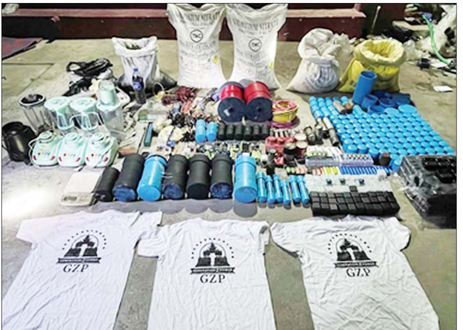
မန္တလေးမြို့၌ သူနာပြုတစ်ဦးအပါအဝင် ပြည်သူများအား သတ်ဖြတ်ခဲ့သည့် ဖြစ်စဉ်မှ ဖမ်းဆီးရမိသည့် လက်နက်ခဲယမ်းနှင့် ဆက်စပ်ပစ္စည်းများ။

CRPH နှင့် NUG အမည်ခံ NLD ထောက်ခံ အကြမ်းဖက်အဖွဲ့ အစည်းများသည် အလုံးစုံ ပျက်သုဉ်းရေး ဦးတည်ချက်များ ဖြင့် PDF အမည်ခံအကြမ်းဖက် အဖွဲ့ကို ဖွဲ့စည်း၍ အချို့သော ဒေသများတွင် အေးချမ်းစွာ နေထိုင်ကြသော ပြည်သူများကို အကြောက်တရားဖြင့် လွှမ်းမိုး ထိန်းချုပ်ရန်အတွက် အကြောင်း ပြချက်မျိုးစုံဖြင့် စွပ်စွဲသတ်ဖြတ် ခြင်း၊ နိုင်ငံပိုင်အဆောက်အအုံများ၊ အများပြည်သူနှင့် သက်ဆိုင် သော ဆေးရုံများ၊ ကျောင်းများ၊ နေအိမ်များ၊ ကျေးရွာများ၊ ဈေး များ၊ နိုင်ငံပိုင်ဘဏ်များ၊ ပုဂ္ဂလိက ပိုင်ဘဏ်များ၊ ဌာနဆိုင်ရာရုံးများ၊ စာမျက်နှာ ၁၇ ကော်လံ ၁ ◆