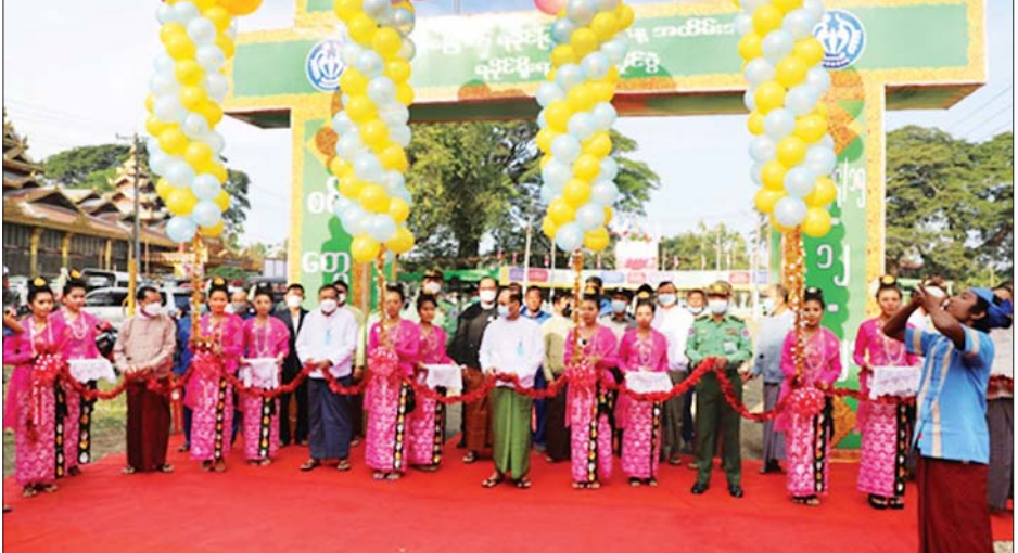
ပြည်နယ်ဝန်ကြီးချုပ် ဒေါက်တာ အောင်ကျော်မင်းနှင့် အဖွဲ့ဝင်များ (၄၇) နှစ် မြောက် ရခိုင်ပြည်နယ်နေ့ အထိမ်းအမှတ် ရခိုင်ရိုးရာကျင်ကိုင်ပြိုင်ပွဲကို ဖဲကြိုးဖြတ်ဖွင့်လှစ်ပေးစဉ်။

နေပြည်တော် ဒီဇင်ဘာ ၁၃ မည့် (၄၇)နှစ်မြောက် ရခိုင် ရခိုင်ရိုးရာကျင်ကိုင်ပြိုင်ပွဲ ဖွင့်ပွဲကို ဒီဇင်ဘာ ၁၅ ရက်တွင် ကျရောက် ပြည်နယ်နေ့ အထိမ်းအမှတ် ယနေ့နံနက်ပိုင်းတွင် စစ်တွေမြို့ရှိ