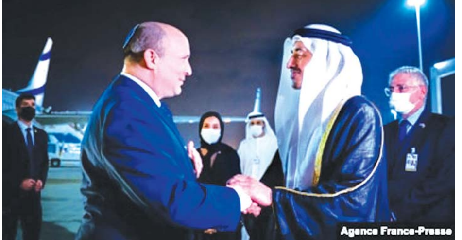
ယူအေအီးနိုင်ငံခြားရေးဝန်ကြီး ရှိတ်ခိမိုဟာမက်ဘင်ဇေယက်အယ်နာယန်က အဘူဒါဘီအပြည်ပြည် ဆိုင်ရာလေဆိပ်တွင် အစွရေးဝန်ကြီးချုပ်ကို ကြိုဆိုနေစဉ်။

ဘင်ဂူရီယန်လေဆိပ်တွင် သတင်းထောက်များကို ပြောသည်။ ခရီးစဉ်အတွင်း အဘူဒါဘီအိမ်ရှေ့ မင်းသား ရှိတ်ခိမိုဟာမက်ဘင်ဇေယက်အယ်နာယန် နှင့် ဒီဇင်ဘာ ၁၃ ရက်တွင် တွေ့ဆုံသွားမည်ဖြစ်သည်။ ထို့ပြင် ဝန်ကြီးများ၊ အဆင့်မြင့်အရာရှိကြီး များနှင့်လည်း တွေ့ဆုံသွားမည်ဖြစ်သည်။ အစွရေး နှင့် ယူအေအီးနိုင်ငံတို့ ပုံမှန်ဆက်ဆံရေးထူထောင်ပြီး ၁၄ လအကြာတွင် ယခုလို ချစ်ကြည်ရေးခရီးသွား ရောက်ခဲ့ခြင်းဖြစ်သည်ဟု အစွရေးဝန်ကြီးချုပ် မစ္စတာဘန်းနက်က ပြောသည်။ ဆင်ဟွာ