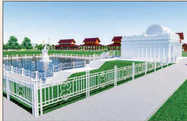
မုစလိန္နုတိုင်

၁။ နိုင်ငံတော်စီမံအုပ်ချုပ်ရေးကောင်စီဥက္ကဋ္ဌ၊ တပ်မတော်ကာကွယ်ရေးဦးစီးချုပ် ဗိုလ်ချုပ်မှူးကြီးမင်းအောင်လှိုင် ဦးဆောင်သည့် (၇)ရက်သား၊ သမီး၊ ဘုရားဒါယကာ၊ ဒါယိကာမတို့က မာရဝိဇယပုဒ္ဓရုပ်ပွားတော်မြတ်ကြီးအား မြန်မာနိုင်ငံတွင် ထေရဝါဒပုဒ္ဓသာသနာတော်ထွန်းလင်းတောက်ပလျက်ရှိသည်ကို ကမ္ဘာကိုပြသရန်၊ တိုင်းပြည်အေးချမ်းသာယာမှုရှိစေရန်၊ ရုပ်ပွားတော်မြတ်ကြီးအား ပြည်တွင်း၊ ပြည်ပဘုရားဖူးများလာရောက်ခြင်းဖြင့် ဒေသတိုးတက်စည်ကားမှုကို အထောက်အကူဖြစ်စေရန်၊ နိုင်ငံတော်ဖွံ့ဖြိုးတိုးတက်မှုအား အထောက်အကူဖြစ်စေရန် ရည်သန်လျက် ပြည်ထောင်စုနယ်မြေ နေပြည်တော်၊ ဒက္ခိဏသီရိမြို့နယ်အတွင်း၌ သာသနာတော်ထုံး၊ ရုပ်ပွားဆင်းတုတော်ထုံး၊ မြန်မာ့ရိုးရာတည်ထုံးများနှင့်အညီ တည်ဆောက်ပူဇော်လျက် ရှိပါသည်။