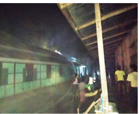
ဧရာဝတီတိုင်းဒေသကြီး မြန်အောင်မြို့နယ်၌ အခြေခံပညာအထက်တန်းကျောင်းအား ဆူပူအကြမ်းဖက်သူများက မီးရှို့ဖျက်ဆီးမှု။