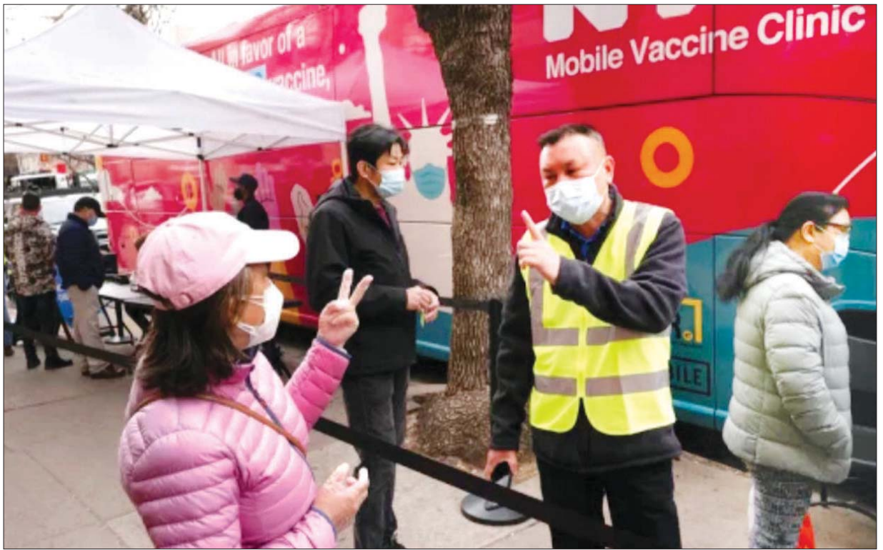
အမေရိကန်ပြည်ထောင်စု၌ ရွေ့လျားစနစ်ဖြင့် ကိုဗစ်-၁၉ ကာကွယ်ဆေး ထိုးပေးနေစဉ်။

ဒီဇင်ဘာ ၉ ရက်က အမေရိကန် အစားအသောက်နှင့်ဆေးဝါး ကွပ်ကဲရေး (အက်ဖ်ဒီအေ)က အသက် ၁၆ နှစ်နှင့် ၁၇ နှစ်တို့အတွက် ဖိုက်ဇာ ကိုဗစ်- ၁၉ ကာကွယ်ဆေးကို ထောက်ခံချက်ပေးခဲ့သည်။ နိုဝင်ဘာ ၁၉ ရက်မှစတင်ကာ အသက် ၁၈ နှစ်နှင့်အထက်များကို