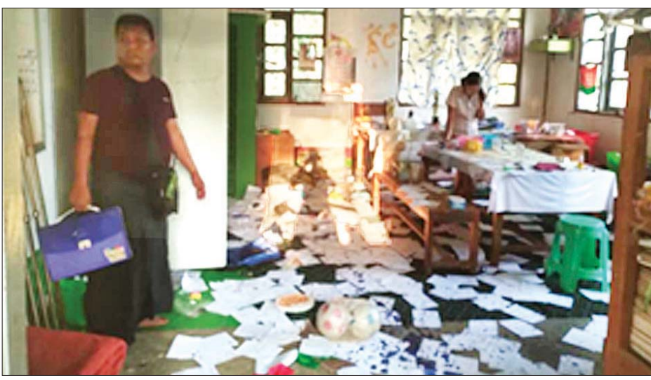
ပဲခူးမြို့နယ် ကင်းချောင်းကျေးရွာ အခြေခံပညာအလယ်တန်းကျောင်း၌ ကျောင်းအုပ်ကြီးရုံးခန်းနှင့် အခန်းအတွင်းရှိ စာရွက်စာတမ်းများအား အကြမ်းဖက်သမားများ ဖျက်ဆီးခဲ့မှု မှတ်တမ်းဓာတ်ပုံ။

ထို့ပြင် ဧပြီ ၄ ရက် နံနက် ၈ နာရီ ၅ မိနစ်ခန့်တွင် ကရင် ပြည်နယ်၊ ကြာအင်းဆိပ်ကြီးမြို့၊ (၁)ရပ်ကွက်ရှိ အခြေခံပညာ အထက်တန်းကျောင်း၌ ရှေ့ထွက် မိုင်းတစ်လုံးကို လည်းကောင်း၊ ယနေ့ နံနက် ၆ နာရီ မိနစ် ၂၀