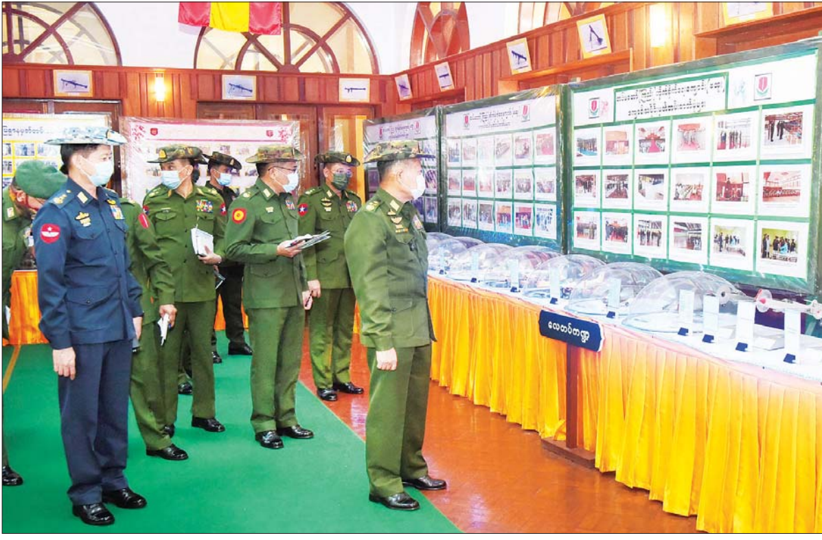
နိုင်ငံတော်စီမံအုပ်ချုပ်ရေးကောင်စီ ဒုတိယဥက္ကဋ္ဌ ဒုတိယတပ်မတော်ကာကွယ်ရေးဦးစီးချုပ် ကာကွယ်ရေးဦးစီးချုပ်(ကြည်း) ဒုတိယဗိုလ်ချုပ်မှူးကြီး စိုးဝင်း တပ်မတော်(ကြည်း) တိုက်ခိုက်ရေးကျောင်း(ဗထူး)မှ ကျောင်းသမိုင်းပြခန်းကို ကြည့်ရှုစစ်ဆေးစဉ်။

အနေများအား တင်ပြကြရာ နိုင်ငံတော်စီမံအုပ်ချုပ်ရေးကောင်စီ ဒုတိယဥက္ကဋ္ဌ ဒုတိယတပ်မတော်ကာကွယ်ရေးဦးစီးချုပ် ကာကွယ်ရေးဦးစီးချုပ် (ကြည်း) က သိရှိလိုသည်များ မေးမြန်း၍ လေ့ကျင့်သင်ကြားရေးဆိုင်ရာ ကိစ္စရပ်များနှင့် ကျောင်းအုပ်ချုပ်မှုဆိုင်ရာ လိုအပ်ချက်များကို ပေါင်းစပ်ညှိနှိုင်းဖြည့်ဆည်း ဆောင်ရွက်ပေးသည်။ ထို့နောက် နိုင်ငံတော်စီမံအုပ်ချုပ်ရေးကောင်စီ ဒုတိယဥက္ကဋ္ဌ ဒုတိယတပ်မတော် ကာကွယ်ရေးဦးစီးချုပ် ကာကွယ်ရေးဦးစီးချုပ် (ကြည်း) သည် ခြေလျင်တပ်ရင်းမှူး၊ တပ်ခွဲမှူး၊ တပ်စုမှူး သင်တန်းသား အရာရှိများအား စာမျက်နှာ ၅ သို့