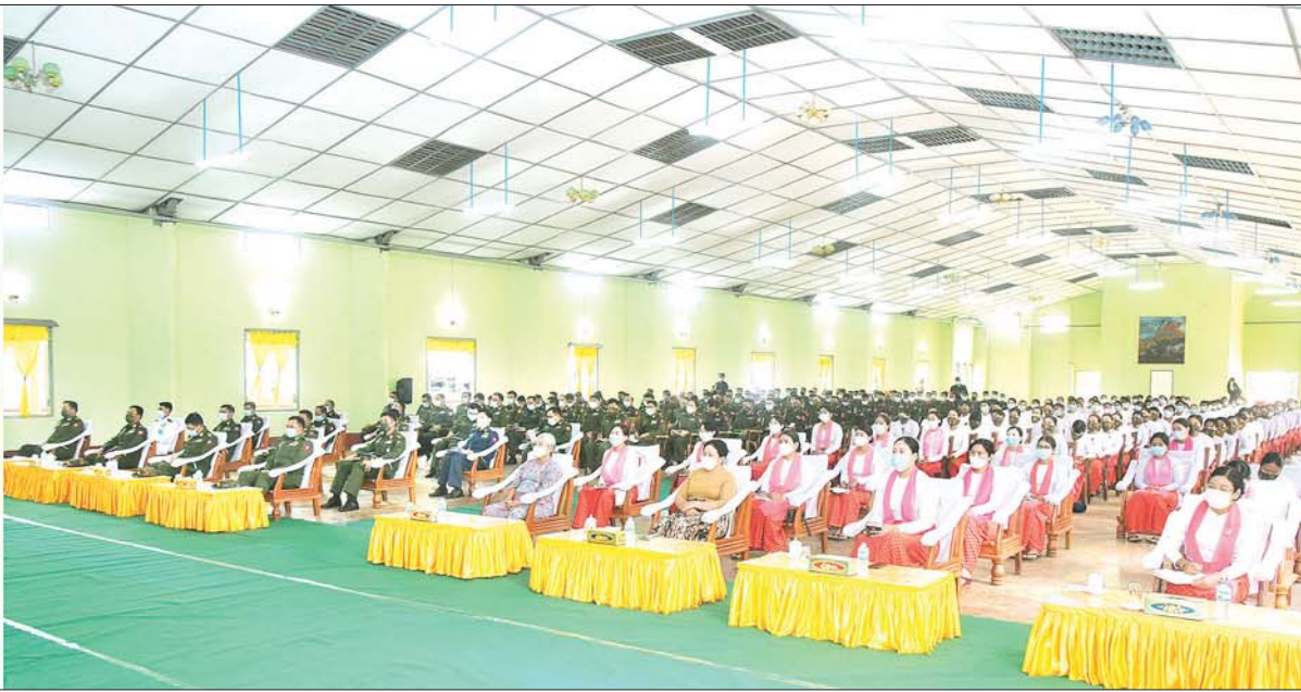
နိုင်ငံတော်စီမံအုပ်ချုပ်ရေးကောင်စီဒုတိယဥက္ကဋ္ဌ ဒုတိယတပ်မတော်ကာကွယ်ရေးဦးစီးချုပ် ကာကွယ်ရေးဦးစီးချုပ်(ကြည်း) ဒုတိယဗိုလ်ချုပ်မှူးကြီး စိုးဝင်း ဗဟူးတပ်နယ်မှ သင်တန်းနည်းပြများ၊ အရာရှိ၊ စစ်သည်၊ မိသားစုများအား တွေ့ဆုံအမှာစကားပြောကြားစဉ်။