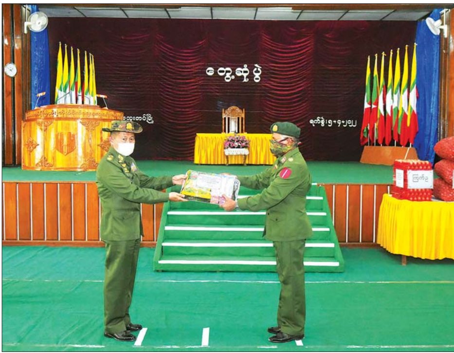
နိုင်ငံတော်စီမံအုပ်ချုပ်ရေးကောင်စီဒုတိယဥက္ကဋ္ဌ ဒုတိယတပ်မတော်ကာကွယ်ရေးဦးစီးချုပ် ကာကွယ်ရေးဦးစီးချုပ်(ကြည်း) ဒုတိယဗိုလ်ချုပ်မှူးကြီးစိုးဝင်း နည်းပြအရာရှိများ၊ အရာရှိ၊ စစ်သည်၊ မိသားစုများအတွက် စားသောက်ဖွယ်ရာများ ပေးအပ်စဉ်။

နိုင်ငံတော်၏ ကာကွယ်ရေးမဟာဗျူဟာသည် တပ်မတော်ကို မဏ္ဍိုင်ပြု၍ ပြည်သူတစ်ရပ်လုံးပါဝင်သည့် ပြည်သူ့စစ်မဟာဗျူဟာဖြစ်သဖြင့် ပြည်သူနှင့် တစ်သားတည်းဖြစ်အောင် နေထိုင်ပြုမူကျင့်ကြံသွားရန် လိုကြောင်း၊ ၂၀၂၁ ခုနှစ်၊ ဖေဖော်ဝါရီလ ၁ ရက်နေ့နောက်ပိုင်း အရေးပေါ်ကာလအတွင်း အမျိုးမျိုးသော စိန်ခေါ်မှု၊ ခြိမ်းခြောက်မှု၊ နှောင့်ယှက်မှုများကို အေးချမ်းစွာ နေထိုင်လိုသော ပြည်သူများ၊ သစ္စာရှိဝန်ထမ်းများ၊ လုံခြုံရေးတပ်ဖွဲ့ဝင်များ၏ စုပေါင်းညီညာသော စုစည်းညီညွတ်သည့်အင်အားဖြင့် ဖြတ်ကျော်နိုင်ခဲ့ကြောင်း၊ နိုင်ငံတော်စီမံအုပ်ချုပ်ရေးကောင်စီအနေဖြင့် ရှေ့လုပ်ငန်းစဉ်(၅)ရပ်၊ ဦးတည်ချက်(၉)ရပ် ချမှတ်၍ နိုင်ငံတော်နှင့် နိုင်ငံသားတို့၏ အကျိုးကို ဖော်ဆောင်လျက်ရှိကြောင်း၊ ရှေ့လုပ်ငန်းစဉ်များ ဖော်ဆောင်ရာတွင် လွတ်လပ်၍ တရားမျှတသော ရွေးကောက်ပွဲဖြစ်စေရန် အဓိကဆန္ဒမဲ ပေးခွင့်ရှိသူတိုင်း နိုင်ငံသားစိစစ်ရေးကတ်ရှိစေရေး ပန်းခင်းစီမံချက် ဆောင်ရွက်လျက်ရှိရာတွင် လုံခြုံရေးဆိုင်ရာ ကိစ္စရပ်များအပြင် အရေးကြီးလိုအပ်ချက်များကိုလည်း ပူးပေါင်းကူညီဆောင်ရွက်ပေးရန် လိုကြောင်း။ အလားတူ နိုင်ငံတော်အစိုးရအနေဖြင့် နိုင်ငံ