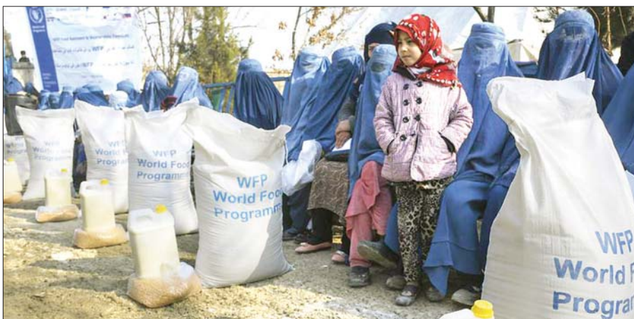
အာဖဂန်နစ္စတန်နိုင်ငံ၌ ဆင်းရဲချို့တဲ့သော မိသားစုဝင်များထံ ကမ္ဘာ့စားနပ်ရိက္ခာအဖွဲ့မှ ထောက်ပံ့ ပေးအပ်စဉ်။