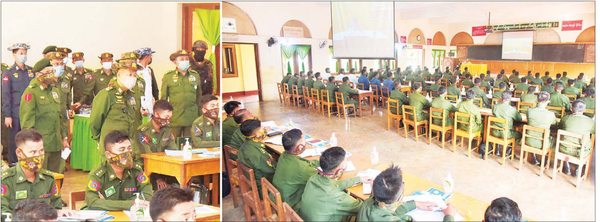
နိုင်ငံတော်စီမံအုပ်ချုပ်ရေးကောင်စီ ဒုတိယဥက္ကဋ္ဌ ဒုတိယတပ်မတော်ကာကွယ်ရေးဦးစီးချုပ် ကာကွယ်ရေးဦးစီးချုပ်(ကြည်း) ဒုတိယဗိုလ်ချုပ်မှူးကြီး စိုးဝင်း သင်တန်းသားများအား မြန်မာနိုင်ငံ အမျိုးသားလူ့အခွင့်အရေး ကော်မရှင်မှ သင်ခန်းစာများအား Video Conferencing ဖြင့် သင်ခန်းစာ ပို့ချသင်ကြားနေမှုကို ကြည့်ရှုစစ်ဆေးစဉ်။