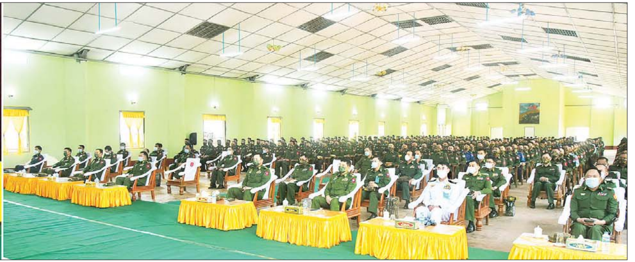
နိုင်ငံတော်စီမံအုပ်ချုပ်ရေးကောင်စီ ဒုတိယဥက္ကဋ္ဌ ဒုတိယတပ်မတော်ကာကွယ်ရေးဦးစီးချုပ် ကာကွယ်ရေးဦးစီးချုပ်(ကြည်း) ဒုတိယဗိုလ်ချုပ်မှူးကြီး စိုးဝင်း ခြေလျင်တပ်ရင်းမှူး၊ တပ်ခွဲမှူး၊ တပ်စုမှူး၊ သင်တန်းသား အရာရှိများအား တွေ့ဆုံအမှာစကားပြောကြားစဉ်။