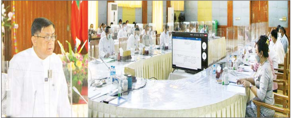
မှတ်သားဖွယ်ရာ မိုးရေချိန်များ နေပြည်တော် ဧပြီ ၅ မှတ်သားဖွယ်ရာ မိုးရေချိန်များမှာ ကော့သောင်းမြို့တွင် ၀ ဒသမ ၉၉ လက်မ၊ ပူတာအိုမြို့တွင် ၀ ဒသမ ၉၁ လက်မ၊ မချမ်းဘောမြို့တွင် ၀ ဒသမ ၅၅ လက်မ၊ ကိုကိုးကျွန်းမြို့တွင် ၀ ဒသမ ၄၄ လက်မနှင့် ဗန်းမော်မြို့တွင် ၀ ဒသမ ၂၈ လက်မတို့ဖြစ်ကြသည်။ မိုး/လ

ကြောင်း ပြောကြားသည်။ ဆက်လက်၍ ဝန်ထမ်းနှောင်ရေးဗဟိုရန်ပုံငွေ အကောင်အထည်ဖော်ရေးကော်မတီ အတွင်းရေးမှူး၊ ပင်စင်ဦးစီးဌာန ညွှန်ကြားရေးမှူးချုပ် ဦးရဲညွန့်က ဝန်ထမ်းနှောင်ရေး ဗဟိုရန်ပုံငွေအကောင်အထည် ဖော်ရေးနှင့် စပ်လျဉ်း၍ ဥပဒေကြမ်းရေးဆွဲပြီးစီးမှုကို ရှင်းလင်းတင်ပြရာ အစည်းအဝေးသို့ တက်ရောက် လာကြသည့် ကော်မတီဝင်များက လိုအပ်သည်များ အကြံပြုဆွေးနွေး တင်ပြခဲ့ကြသည်။ ယင်းနောက် အကြံပြုဆွေးနွေးချက်များအပေါ် ကော်မတီဥက္ကဋ္ဌက သုံးသပ်ဆွေးနွေး၍ နိဂုံးချုပ်အမှာ စကားပြောကြား သည်။ ဝန်ထမ်းနှောင်ရေးဗဟိုရန်ပုံငွေ အကောင် အထည်ဖော်ရေးကော်မတီကို ပြည်ထောင်စုသမ္မတ မြန်မာနိုင်ငံတော်၊ နိုင်ငံတော်စီမံအုပ်ချုပ်ရေး ကောင်စီ၏ ၂၀၂၁ ခုနှစ် မတ် ၂၄ အမိန့်ကြော်ငြာစာ အမှတ်၊ ၇၁/၂၀၂၁ ဖြင့် ပြင်ဆင်ဖွဲ့စည်းပေးခဲ့ပြီး စီမံ ကိန်းနှင့် ဘဏ္ဍာရေးဝန်ကြီးဌာန ဒုတိယဝန်ကြီးက ဥက္ကဋ္ဌအဖြစ် ဆောင်ရွက်၍ သက်ဆိုင်ရာဌာနများမှ ဦးဆောင်ညွှန်ကြားရေးမှူးများ၊ ညွှန်ကြားရေးမှူးချုပ် များလည်း ပါဝင်ကြောင်း၊ နိုင်ငံ့ဝန်ထမ်းများ၏ ပင်စင်ခစားခွင့်များနှင့် စပ်လျဉ်း၍ ရေရှည်တည်တံ့ ခိုင်မြဲပြီး အားကိုးအားထားပြုနိုင်သည့် ပင်စင်ရန်ပုံ ငွေစနစ်တစ်ရပ်ကို ထူထောင်ရန် ဆက်လက် ကြိုးပမ်းဆောင်ရွက်လျက်ရှိကြောင်း သိရသည်။ သတင်းစဉ်