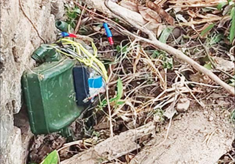
ကြာအင်းဆိပ်ကြီးမြို့ (၁)ရပ်ကွက်ရှိ အခြေခံပညာအထက်တန်းကျောင်း ခြံစည်းရိုးအနီး အကြမ်းဖက်သမားများ ထောင်ထားသည့် ရှေ့ထွက်မိုင်းတစ်လုံးအား တွေ့ရစဉ်။

နေပြည်တော် ဧပြီ ၅ နိုင်ငံတော်ဖွံ့ဖြိုးတိုးတက်ရေးအတွက် အဓိက အခြေခံကျသော ပညာရေးကဏ္ဍ မြှင့်တင်ရေးနှင့် လူငယ်လူရွယ်များ၏ အနာဂတ်ဘဝ သာယာလှပစေရေးတို့အတွက် နိုင်ငံတော်အစိုးရအနေဖြင့် အစွမ်းကုန် ကြိုးပမ်းလျက်ရှိပြီး ကျောင်းသား၊ ဆရာ၊ မိဘတို့ကလည်း ကျရာအခန်း ကဏ္ဍတို့တွင် ဝမ်းပန်းတသာ ပါဝင်ပူးပေါင်းဆောင်ရွက်လျက်ရှိသည်။ ထိုသို့ပူးပေါင်းဆောင်ရွက်လျက်ရှိခြင်းကြောင့် ၂၀၂၁-၂၀၂၂ ပညာ သင်နှစ်အတွက် အခြေခံပညာ အထက်တန်းအဆင့်၊ အလယ်တန်းအဆင့် နှင့် မူလတန်းအဆင့် အတန်းပညာရပ်များကို အောင်မြင်စွာ သင်ကြား နိုင်ခဲ့ပြီး အဆင့်မြင့်ပညာ ဆက်လက်သင်ကြားနိုင်ရန် ၂၀၂၂ ခုနှစ် တက္ကသိုလ်ဝင်စာမေးပွဲကိုလည်း အောင်မြင်စွာ ကျင်းပနိုင်ရေး ဆောင်ရွက်လျက်ရှိသည်။ နိုင်ငံတော်အစိုးရ၏ ဦးဆောင်မှု၊ ကျောင်းသား၊ ဆရာ၊ မိဘတို့၏ ပါဝင်ပူးပေါင်းဆောင်ရွက်မှုတို့ဖြင့် နိုင်ငံတော်၏ ပညာရေးကဏ္ဍ မြှင့်တင်ရေးနှင့် လူငယ်လူရွယ်များ၏ ပညာရည်မြှင့်တင်ရေးတို့အတွက် စာမျက်နှာ ၁၆ ကော်လံ ၁ ❖