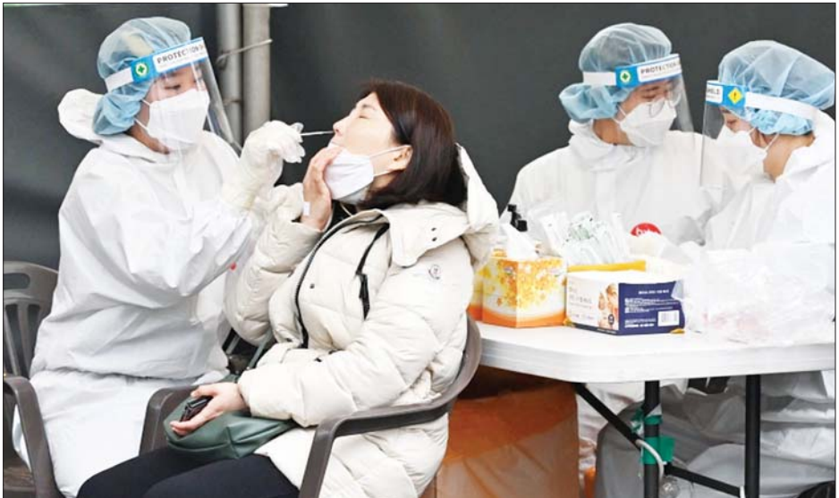
တောင်ကိုရီးယားနိုင်ငံ၌ ဆေးဝန်ထမ်းတစ်ဦးမှ နှာခေါင်းတို့ဖတ်နမူနာယူနေစဉ်။

နှင့် ၎င်း၏မျိုးကွဲ BA.2 ကူးစက် ပျံ့နှံ့မှုကြောင့် လက်ရှိ ကိုဗစ်-၁၉ ကူးစက်မှု မြင့်တက်လာခဲ့ခြင်းဖြစ် သည်။ အထူးသဖြင့် ဆိုးလ်မြို့ ဧရိယာတစ်ဝိုက်တွင် ကူးစက်ပျံ့နှံ့ ခဲ့ကြောင်း သိရသည်။ ကိုရီးယားနိုင်ငံ၌ ထပ်မံ ကူးစက်ခံရသူများအနက် ဆိုးလ် မြို့မှ ၅၁၅၀၀ ရှိပြီး ချုံဂီပြည်နယ် တွင် ၆၉၃၆၂ ဦးနှင့် အင်ချွန်နီး ဆိပ်ကမ်းမြို့မှ ၁၅၃၅၄ ဦး ဖြစ်သည်။