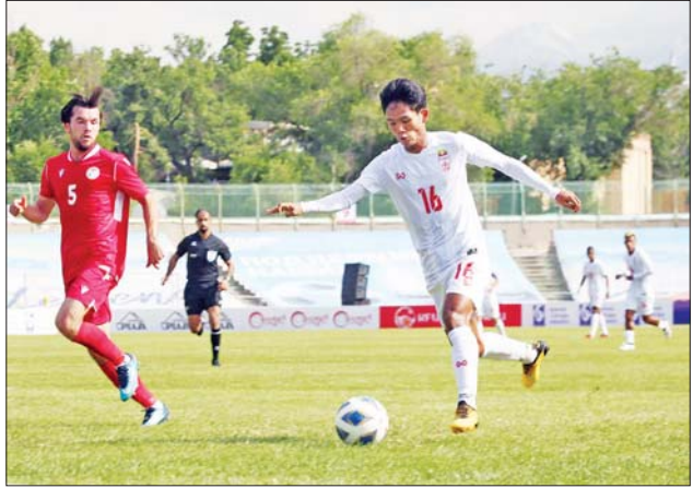
မြန်မာနှင့် တာဂျစ်ကစွတန်အသင်း ယှဉ်ပြိုင်ကစားနေစဉ်။