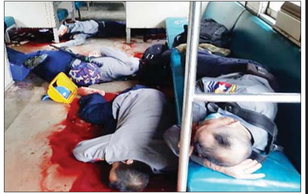
၁၄-၈-၂၀၂၁ ရက်က ရန်ကုန်မြို့ပတ်ရထား၌ လုံခြုံရေးရဲတပ်ဖွဲ့ဝင်များ ပစ်ခတ်ခံရမှု။