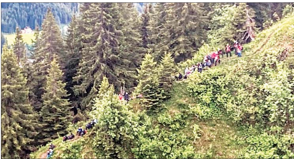
တောင်တက်နေသော ကျောင်းသား ကျောင်းသူ ကလေးငယ်များကို တွေ့ရစဉ်။

သြစတြေးလျအပိုင် အယ်လ်ပိုင်း တောင်တက်ခရီး လမ်းကြောင်း တွင် ပိတ်မိနေပြီးနောက် ဂျာမန် ကျောင်းသား ကျောင်းသူ များနှင့် ဆရာ ဆရာမများ အပါအဝင် လူပေါင်း ၁၀၀ ကျော် ကို ကယ်တင်ခဲ့ရကြောင်းနှင့် အများစုကို လေယာဉ်ဖြင့် အန္တရာယ်ကင်းစွာ ကယ်တင်နိုင်ခဲ့ ကြောင်း နိုင်ငံတကာသတင်း တစ်ရပ်တွင် ဇွန် ၈ ရက်က ဖော်ပြလိုက်သည်။