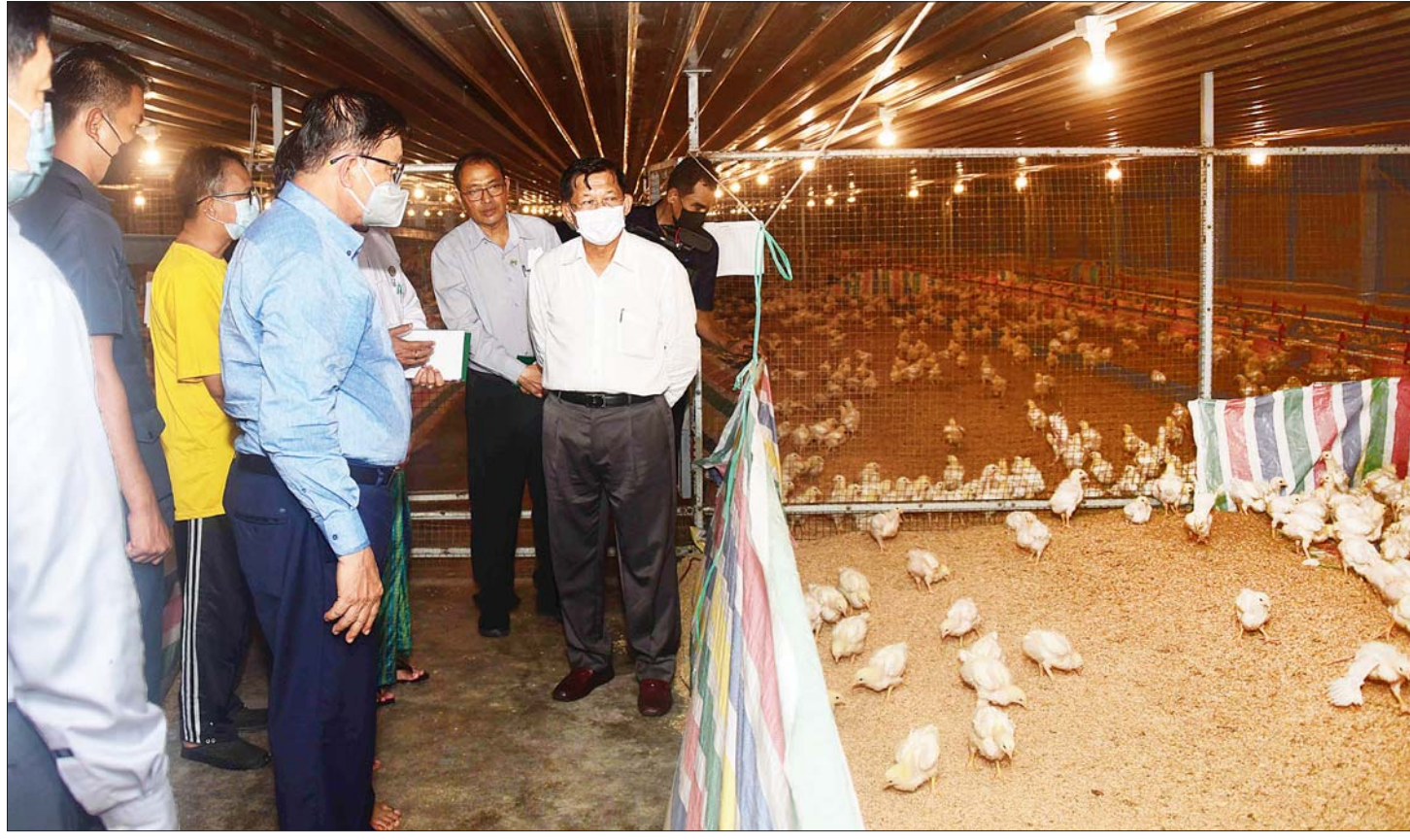
နိုင်ငံတော်စီမံအုပ်ချုပ်ရေးကောင်စီဥက္ကဋ္ဌ နိုင်ငံတော်ဝန်ကြီးချုပ် ဗိုလ်ချုပ်မှူးကြီး မင်းအောင်လှိုင်နှင့်အဖွဲ့ဝင်များ CJ Feed Myanmar ကြက်မွေးမြူရေးလုပ်ငန်းဆောင်ရွက်နေမှုအခြေအနေများကို ကြည့်ရှုစစ်ဆေးစဉ်။

ရှင်းလင်းတင်ပြမှုများအပေါ် နိုင်ငံတော်စီမံအုပ်ချုပ်ရေးကောင်စီဥက္ကဋ္ဌ နိုင်ငံတော်ဝန်ကြီးချုပ်က ရန်ကုန်မြို့ မိုင် ၃၀ ပတ်ဝန်းကျင်စိမ်းလန်းသာယာရေး၊ စာမျက်နှာ ၅ သို့