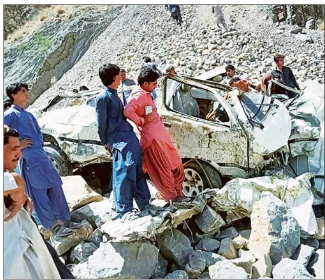
ချောက်ထဲသို့ ထိုးကျသွားပြီးနောက် ပျက်စီးသွားသော ဗင်ကားကို တွေ့ရစဉ်။

အစ္စလာမာဘတ် ဇွန် ၈ ဒုတိယကော်မရှင်နာ ကာစင်က ကားမောင်းသမားမှာ လမ်းကွေ့ တစ်ခုကို ချိုးကွေ့ရာမှ အရှိန် မထိန်းနိုင်ဘဲ ချောက်ထဲသို့ ထိုးကျ သွားခြင်းဖြစ်ကြောင်း ပြောသည်။ ထို့ပြင် အဆိုပါ ယာဉ် မတော်တဆမှုမှ ပြင်းထန်စွာ ထိခိုက်ဒဏ်ရာ ရရှိခဲ့သူများကို နီးစပ်ရာဆေးရုံသို့ ပို့ဆောင် ပေးခဲ့ကြောင်း ၎င်းက ဆက်ပြော သည်။ အဆိုပါ ယာဉ်မတော်တဆ မှုကြောင့် သေဆုံးသူများထဲတွင် အမျိုးသမီးအများစု အပါအဝင် ကလေးငယ်များနှင့် ကားမောင်း သူတို့ ပါဝင်ကြောင်း သိရ သည်။