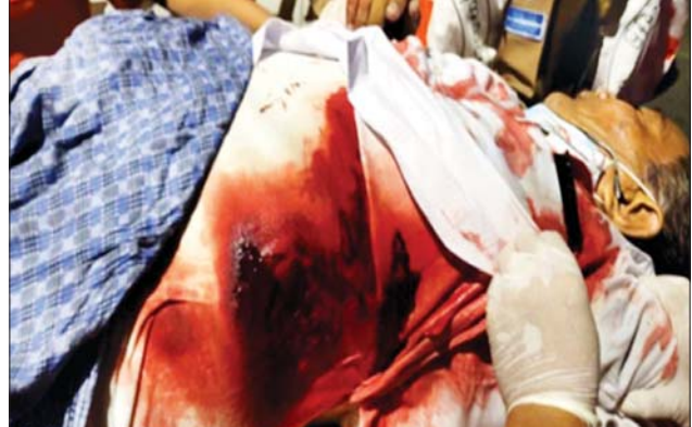
၃-၆-၂၀၂၁ ရက်က ဒေါပုံမြို့နယ် ရပ်ကွက်စီမံအုပ်ချုပ်ရေးအဖွဲ့ရုံး၌ အပြစ်မဲ့ပြည်သူ ၁ ဦး သတ်ဖြတ်ခံရမှု။