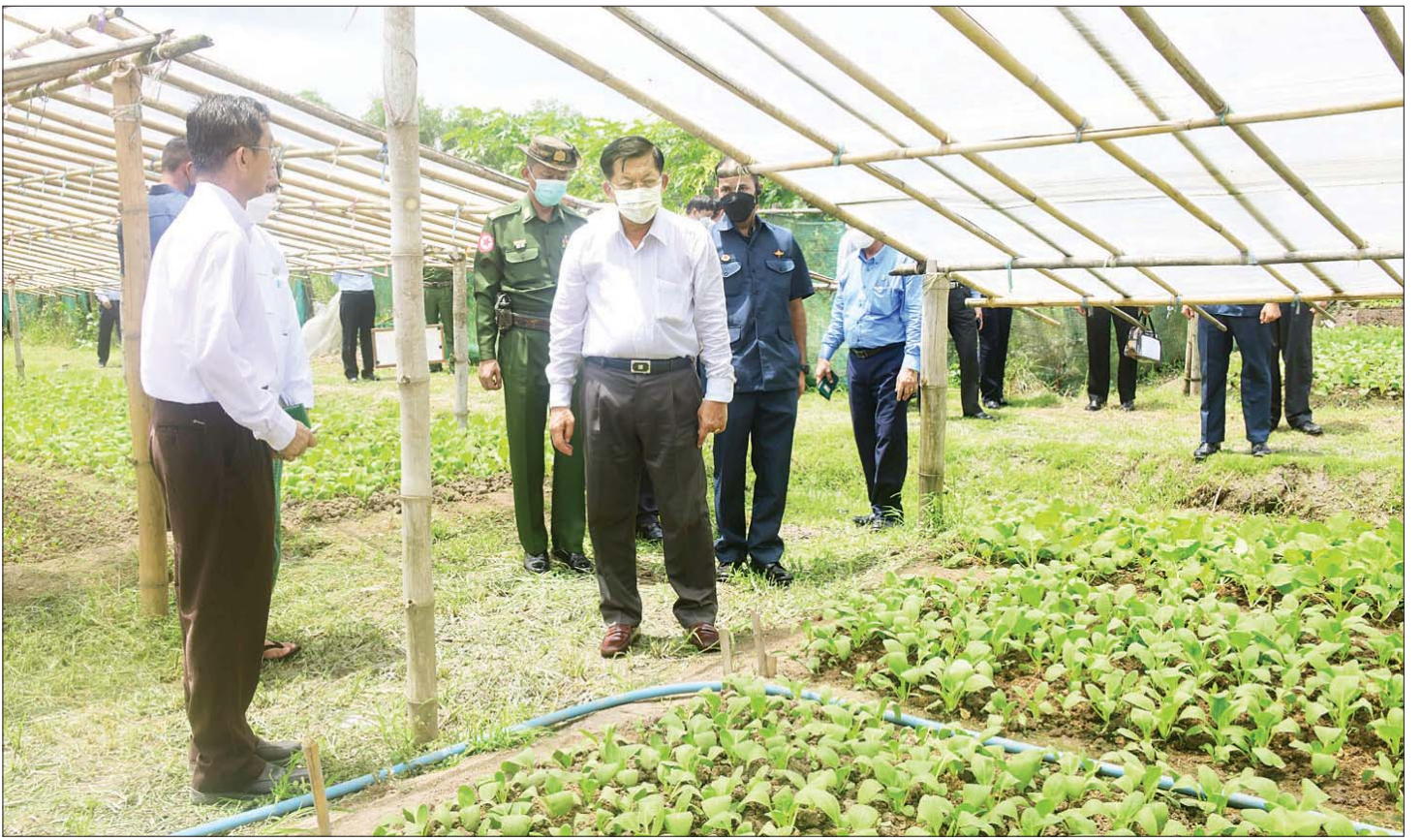
နိုင်ငံတော်စီမံအုပ်ချုပ်ရေးကောင်စီဥက္ကဋ္ဌ နိုင်ငံတော်ဝန်ကြီးချုပ် ဗိုလ်ချုပ်မှူးကြီး မင်းအောင်လှိုင်နှင့်အဖွဲ့ဝင်များ ညောင်နှစ်ပင် စိုက်ပျိုးမွေးမြူရေးဇုန်အတွင်း ရှိ စိုက်ပျိုးရေးဦးစီးဌာနနှင့် စိမ်းလန်းသမဝါယမအဖွဲ့တို့ ပူးပေါင်းဆောင်ရွက်သည့် ဓာတုကင်းလွတ် ဟင်းသီးဟင်းရွက်စိုက်ခင်းအား ကြည့်ရှုစစ်ဆေးစဉ်။

အဆိုပါ အမျိုးသားညီလာခံ ကျင်းပခဲ့သည့် ပြည်ထောင်စုခန်းမအဆောက်အဦတွင် ဖွဲ့စည်းပုံအခြေခံဥပဒေ (၂၀၀၈ ခုနှစ်) အတည်ပြုပြဋ္ဌာန်းနိုင်ရေးအတွက် ၂၀၀၄ ခုနှစ်မှ ၂၀၀၇ အထိ အစုအဖွဲ့ ၈ ဖွဲ့မှ ကိုယ်စားလှယ် ၇၂၂ ဦးဖြင့် အမျိုးသားညီလာခံ ၇ ကြိမ် ကျင်းပခဲ့ကြောင်း၊ ဖွဲ့စည်းပုံအခြေခံဥပဒေ (၂၀၀၈ ခုနှစ်) အတည်ပြုပြဋ္ဌာန်းပြီးချိန်တွင် အဆိုပါ