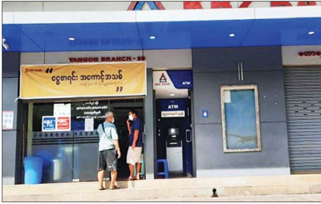
၂၂-၁၀-၂၀၂၁ ရက်က ဗိုလ်တထောင်မြို့နယ် (၉)ရပ်ကွက်ရှိ ကမ္ဘောဇဘဏ်ခွဲအား ဓားပြတိုက်ခံရမှု။