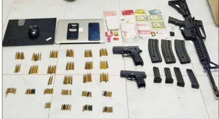
ဒဂုံဆိပ်ကမ်းမြို့နယ် ရတနာလမ်း ရတနာနှင့်ဆီအိမ်ရာ တိုက်အမှတ်(3/B) အခန်းအမှတ်(B-0907)၌ မောင်ကျော်(ခ) ဖြိုးဇေယျာသော်နှင့်အတူ ဖမ်းဆီးရမိခဲ့ သည့် လက်နက်/ခဲယမ်းများ မှတ်တမ်းဓာတ်ပုံ။