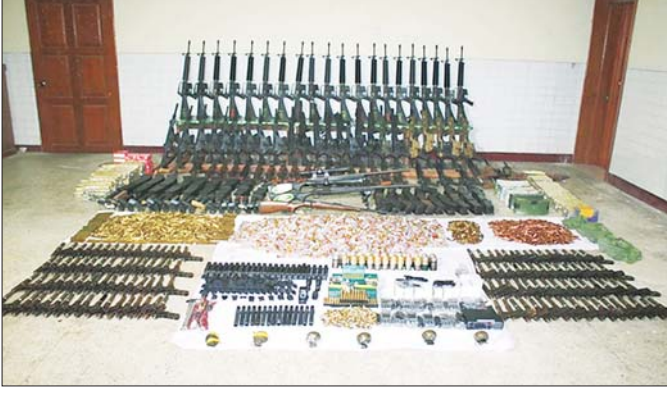
သယံဇာတကျွန်းမြို့နယ် (၂၉) ရပ်ကွက် သုခိတာလမ်း ခြံအမှတ်(၆၇)နှင့် သယံဇာတကျွန်းမြို့နယ် (၈) မြောက်ရပ်ကွက် ပြည်သာယာလမ်းသွယ်(၂) အမှတ်(၁၄၂)ရှိ မောင်ကျော်(ခ)ဖြိုးဇေယျာသော်၏ နေအိမ်များမှ သိမ်းဆည်းရမိခဲ့သည့် လက်နက်/ခဲယမ်းများ မှတ်တမ်းဓာတ်ပုံ။