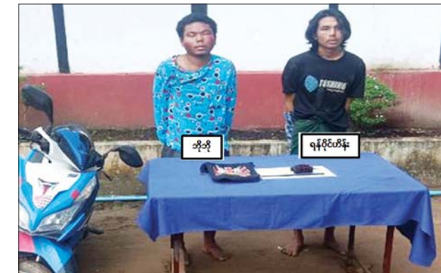
၇-၁၀-၂၀၂၁ ရက်တွင် တွံတေးမြို့နယ် ဘုရားငုတ်တို စစ်ဆေး ရေးဂိတ်ကို ဖောက်ခွဲဖျက်ဆီးရန် လာရောက်စဉ် ဖမ်းဆီးရမိသည့် တရားခံနှစ်ဦးကို တွေ့ရစဉ်။