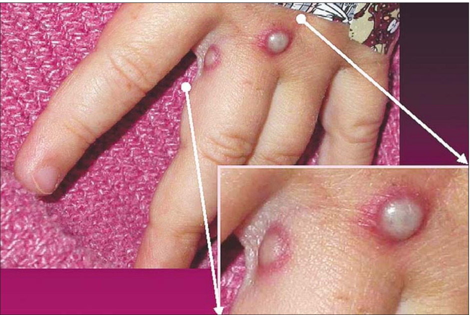
မျောက်ကျောက်ရောဂါလက္ခဏာများ။

အခု နှစ်ပေါင်းလေးဆယ်ကျော်အတွင်း လူငယ်၊ လူလတ်ပိုင်းမှာ ကျောက်ရောဂါဆိုတာလည်း မကြားဖူးတော့ဘူး။ ကျောက်ဆေးလည်း မထိုးရ တော့ဘူး။ လက်မောင်းတွေမှာလည်း ဆေးထိုး အမာရွတ်တွေ မတွေ့နိုင်တော့ပါဘူး။ တစ်ဖက် ကလည်း သုတေသီတွေက ကျောက်ဆေးထိုးထားရုံ နဲ့ ရေကျောက်ရောဂါတွေကို အတိုင်းအတာတစ်ခု အထိ ကာကွယ်နိုင်တယ်လို့ဆိုလာတော့ အမေရိကန် နိုင်ငံမှာ ကျောက်ဆေးပြန်ထိုးဖို့ အကြံပြုသံတွေ ထွက်လာပါတယ်။