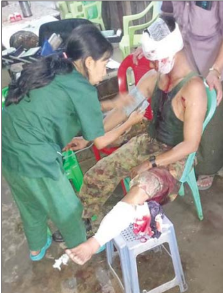
၇-၁၀-၂၀၂၁ ရက်တွင် အင်းစိန်မြို့နယ် ဖော့ကန် ရပ်ကွက် အုပ်ချုပ်ရေးမှူးရုံး ဖုံးပေါက်ကွဲမှုကြောင့် ဒဏ်ရာရရှိသည့် စစ်သည်ကို တွေ့ရစဉ်။