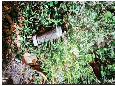
၂၁-၅-၂၀၂၁ ရက်တွင် တွံတေးမြို့ ရွှေဆံတော် ရပ်ကွက်ရှိ အမက(မူလွန်)ကျောင်း ခြံစည်းရိုးတွင် ပေါက်ကွဲခဲ့သည့် လက်လုပ်ဖုံးတစ်လုံးကို တွေ့ရစဉ်။