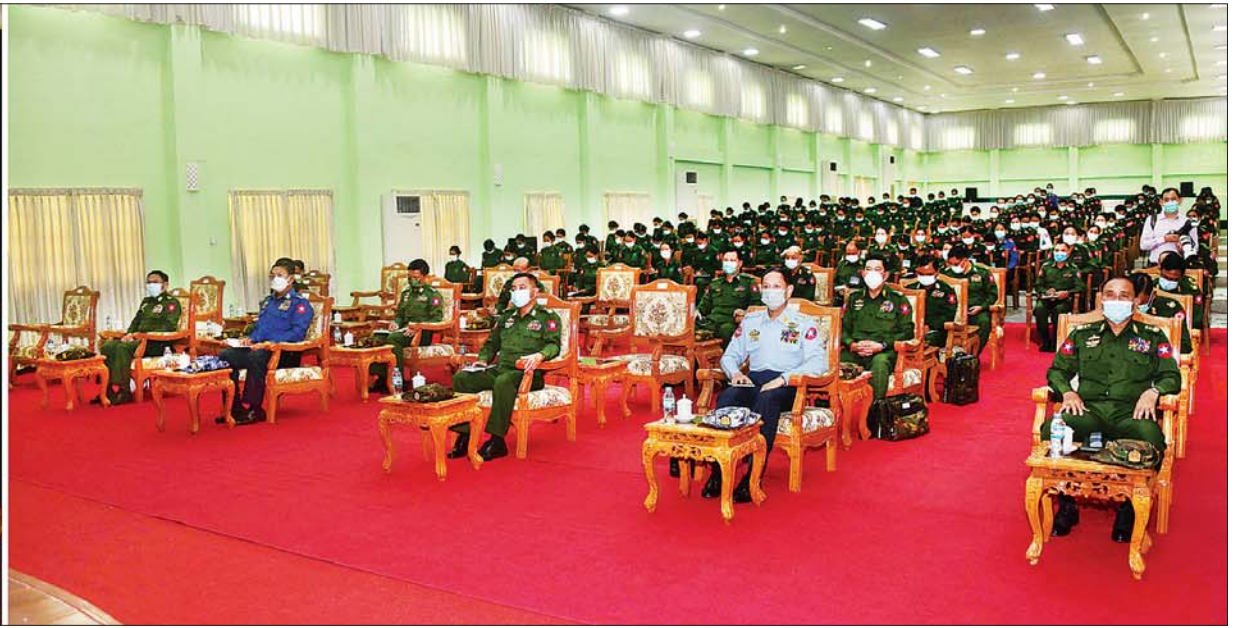
နိုင်ငံတော်စီမံအုပ်ချုပ်ရေးကောင်စီဥက္ကဋ္ဌ တပ်မတော်ကာကွယ်ရေးဦးစီးချုပ် ဗိုလ်ချုပ်မှူးကြီး မင်းအောင်လှိုင် တပ်မတော်(ကြည်း) ဗိုလ်သင်တန်းကျောင်း(မှော်ဘီ)မှ နည်းပြအရာရှိကြီးများ၊ အမျိုးသမီးဗိုလ်လောင်း သင်တန်းသူများ၊ အမျိုးသမီးခြေလျင်တပ်စုမှူးသင်တန်းမှ သင်တန်းသူများအား တွေ့ဆုံအမှာစကား ပြောကြားစဉ်။