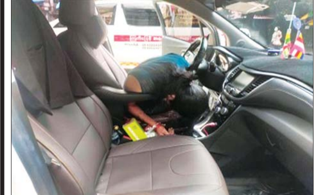
၈-၆-၂၀၂၁ ရက်က တာမွေမြို့နယ် ကျားကွက်သစ်ရပ်ကွက်၌ အပြစ်မဲ့ပြည်သူ ၁ ဦး သတ်ဖြတ်ခံရမှု။