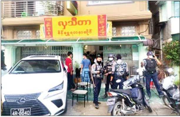
၁၁-၇-၂၀၂၁ ရက်က မရမ်းကုန်းမြို့နယ် ဘုရင့်နောင်(၂)ရပ်ကွက်ရှိ “လှသီတာ”ရွှေဆိုင်အား ဓားပြတိုက်ခံရမှု။