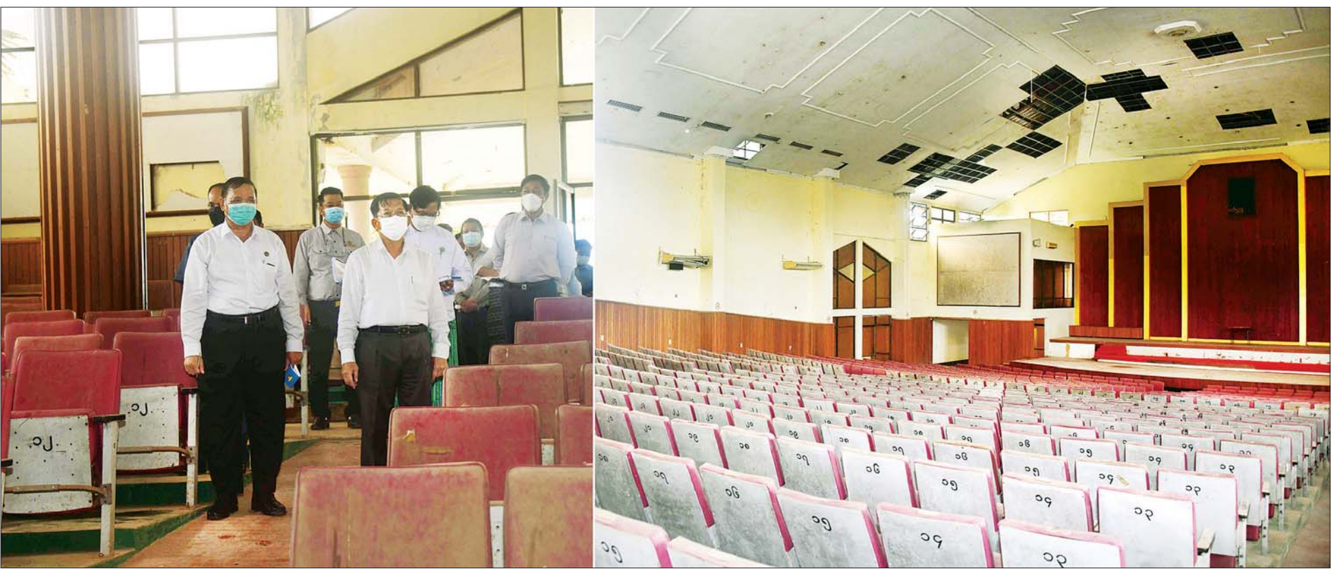
နိုင်ငံတော်စီမံအုပ်ချုပ်ရေးကောင်စီဥက္ကဋ္ဌ နိုင်ငံတော်ဝန်ကြီးချုပ် ဗိုလ်ချုပ်မှူးကြီး မင်းအောင်လှိုင် ရန်ကုန်တိုင်းဒေသကြီး လှည်းကူးမြို့နယ် ညောင်နှစ်ပင်ကျေးရွာအနီးရှိ ဖွဲ့စည်းပုံအခြေခံဥပဒေ (၂၀၀၈ ခုနှစ်) ရေးဆွဲရန် အမျိုးသားညီလာခံ ကျင်းပခဲ့သည့် ပြည်ထောင်စုခန်းမကြီးအတွင်း ကြည့်ရှုစစ်ဆေးစဉ်။

နေပြည်တော် ဇွန် ၈ နိုင်ငံတော်စီမံအုပ်ချုပ်ရေးကောင်စီဥက္ကဋ္ဌ နိုင်ငံတော်ဝန်ကြီးချုပ် ဗိုလ်ချုပ်မှူးကြီး မင်းအောင်လှိုင်သည် ယနေ့နံနက်ပိုင်းတွင် ကောင်စီဝင် ဗိုလ်ချုပ်ကြီး တင်အောင်စန်း၊ ကောင်စီတွဲဖက်အတွင်းရေးမှူး ဒုတိယဗိုလ်ချုပ်ကြီး ရဲဝင်းဦး၊ ဆောက်လုပ်ရေးဝန်ကြီးဌာန ပြည်ထောင်စုဝန်ကြီး ဦးရွှေလေး၊ ရန်ကုန်တိုင်းဒေသကြီး ဝန်ကြီးချုပ် ဦးစိုးသိန်း၊ ကာကွယ်ရေးဦးစီးချုပ်ရုံးမှ တပ်မတော်အရာရှိကြီးများ၊ ရန်ကုန်တိုင်းစစ်ဌာနချုပ် တိုင်းမှူး ဗိုလ်ချုပ် ညွန့်ဝင်းဆွေ၊ မြို့တော်ဝန် ဦးဘိုဌေး၊ ဒုတိယဝန်ကြီးများနှင့် တာဝန်ရှိသူများလိုက်ပါ၍ ရန်ကုန်တိုင်းဒေသကြီး လှည်းကူးမြို့နယ် ညောင်နှစ်ပင်ကျေးရွာအနီးရှိ ဖွဲ့စည်းပုံအခြေခံဥပဒေ (၂၀၀၈ ခုနှစ်) ရေးဆွဲရန် အမျိုးသားညီလာခံ ကျင်းပခဲ့သည့် ပြည်ထောင်စုခန်းမကြီးသို့ သွားရောက်ကြည့်ရှုစစ်ဆေးသည်။ စာမျက်နှာ ၃ ကော်လံ ၁ ❁