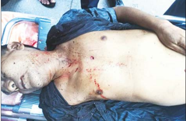
၂၇-၅-၂၀၂၁ ရက်က သာကေတမြို့နယ် မာန်ပြေရပ်ကွက်၌ အပြစ်မဲ့ပြည်သူ ၁ ဦး သတ်ဖြတ်ခံရမှု။