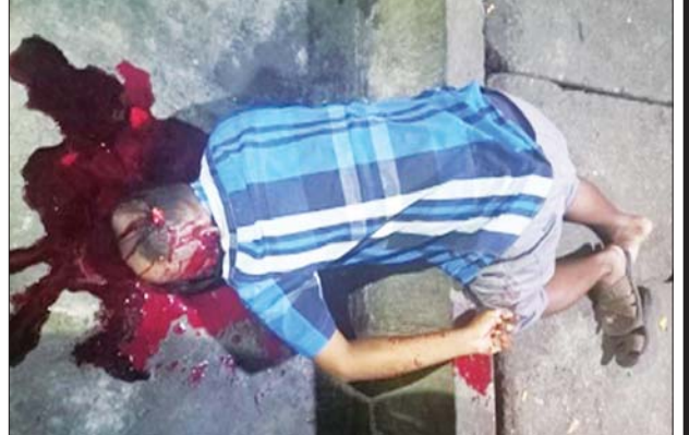
၂၉-၅-၂၀၂၁ ရက်က လှိုင်မြို့နယ် အမှတ်(၁)ရပ်ကွက်၌ အပြစ်မဲ့ပြည်သူ ၁ ဦး သတ်ဖြတ်ခံရမှု။