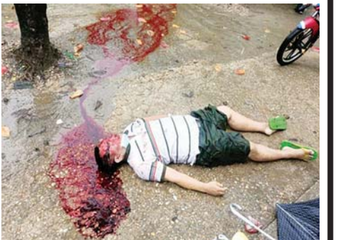
၁၆-၆-၂၀၂၁ ရက်က လှိုင်သာယာမြို့နယ် (၁၃)ရပ်ကွက်၌ အပြစ်မဲ့ပြည်သူ ၁ ဦး သေဆုံးဖြင့် ပစ်ခတ်ခံရမှု။

ရန်ကုန်မြို့တွင်းရှိ အကြမ်းဖက်အဖွဲ့ ၂၀ ကိုဦးဆောင်၍ ရန်ကုန်မြို့အတွင်း အကြမ်းဖက်ဖောက်ခွဲဖျက်ဆီး မှုပြုလုပ်ခြင်း၊ လုံခြုံရေးဂိတ်များ၊ ရဲစခန်းများ၊ ဌာန ဆိုင်ရာရုံးများနှင့် နယ်မြေခံတပ်များအား တိုက်ခိုက် ဖောက်ခွဲဖျက်ဆီးခြင်း၊ အပြစ်မဲ့ပြည်သူများကို လုပ်ကြံသတ်ဖြတ်ခြင်း စသည့် အကြမ်းဖက်လုပ်ငန်း များ ဆောင်ရွက်ရာတွင် စီစဉ်ညွှန်ကြားခြင်းတို့ ကြောင့် ၂၀၂၂ ခုနှစ် ဇန်နဝါရီ ၂၁ ရက်တွင် စစ်အုပ်ချုပ်ရေး (Martial Law) စစ်ဆေး မှုများဆောင်ရွက်ခဲ့ရာ အကြမ်းဖက်မှုတိုက်ဖျက်ရေး ဥပဒေပုဒ်မ ၄၉(က)၊ ၅၀(ဈ)နှင့် ၅၀(ည)တို့အရ “သေဒဏ်” အမိန့် ချမှတ်ခဲ့ကြောင်း သိရှိရသည်။ သတင်းစဉ်