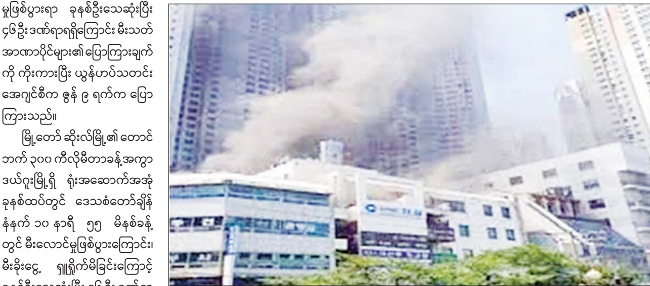
မီးလောင်မှုဖြစ်ပွားနေသော ရုံးအဆောက်အအုံကို တွေ့ရစဉ်။

ဆိုးလ် ဇွန် ၉ ဒါဇင်နှင့်ချီသည့် လူများထွက်ပြေး တပ်ဖွဲ့ဝင် ၁၆၀ ခန့် သွားရောက် သည့် အကြောင်းရင်းကို စုံစမ်း တောင်ကိုရီးယားနိုင်ငံ အရှေ့ ကြေးမုံမြို့နယ်ရှိ ရုံးအဆောက်အအုံ တစ်ခု မီးလောင်မှုဖြစ်ပွားရာ နေရာ သို့ မီးသတ်ကား ၅၀ နှင့် မီးသတ် မီးငြိမ်းသတ်ရာ မိနစ် ၂၀ ခန့် အကြာတွင် မီးငြိမ်းသွားကြောင်း သိရသည်။ မီးလောင်မှုဖြစ်ပွားရ သည့် အကြောင်းရင်းကို စုံစမ်း စစ်ဆေးနေဆဲဖြစ်ကြောင်း သိရ သည်။