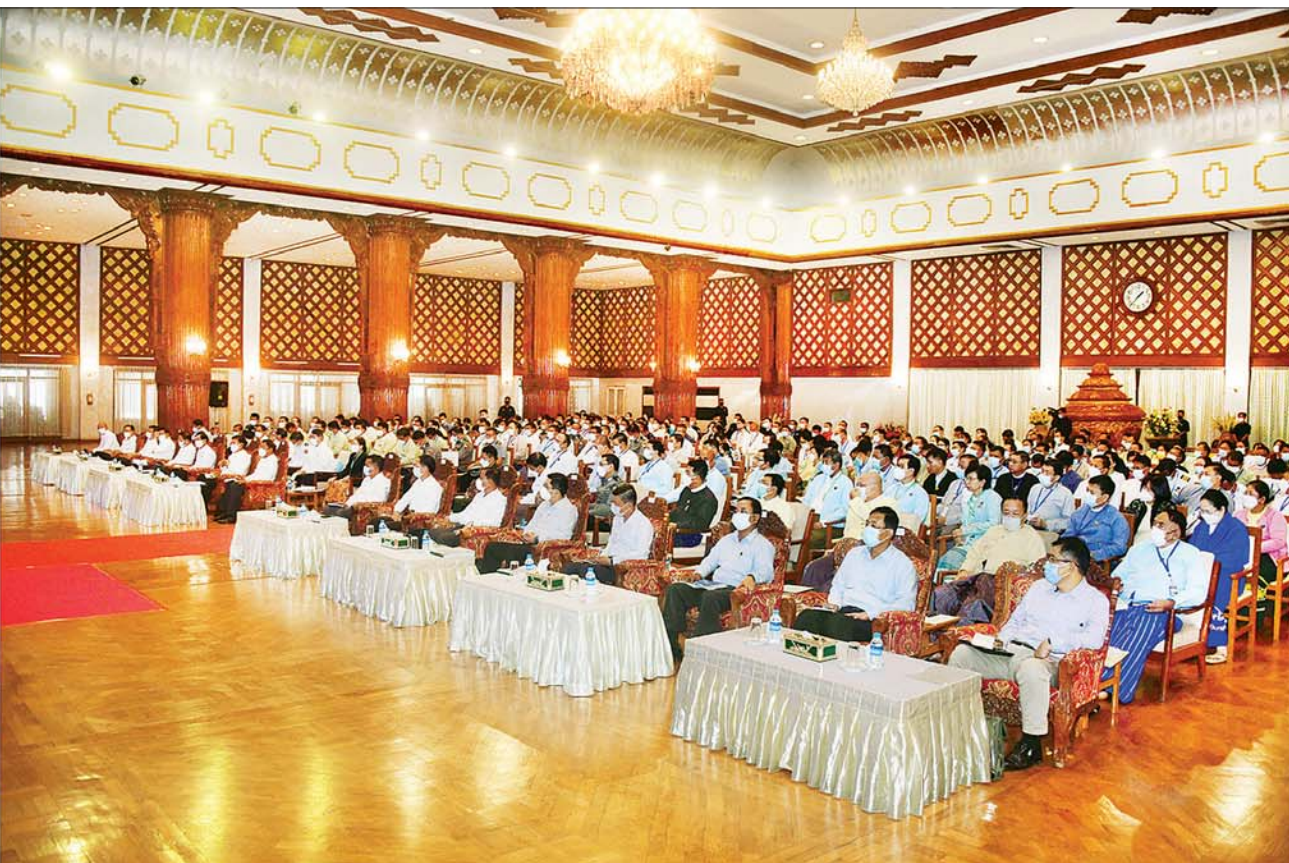
နိုင်ငံတော်စီမံအုပ်ချုပ်ရေးကောင်စီဥက္ကဋ္ဌ နိုင်ငံတော်ဝန်ကြီးချုပ် ဗိုလ်ချုပ်မှူးကြီး မင်းအောင်လှိုင် ရန်ကုန်တိုင်းဒေသကြီးအစိုးရအဖွဲ့ဝန်ကြီးများနှင့် တာဝန်ရှိသူများအား တွေ့ဆုံအမှာစကားပြောကြားစဉ်။