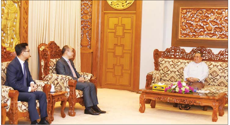
သည် ကိစ္စရပ်များသည် နိုင်ငံ၏ ပြည်တွင်းရေးသာ ဖြစ်ပြီး ဒေသတွင်းနှင့် နိုင်ငံတကာကိစ္စရပ်အဖြစ် ပုံဖော်မှုမပြုသင့်ပါကြောင်း၊ အာဆီယံ၏ တူညီဆန္ဒ(၅) ချက်ကို အကောင်အထည်ဖော်ရာတွင် မြန်မာနိုင်ငံ၏ တည်ဆဲဥပဒေ၊ နည်းဥပဒေများနှင့်အညီ အာဆီယံအဖွဲ့ဝင်နိုင်ငံအားလုံးနှင့် ပူးပေါင်းဆောင်ရွက်သွားမည်ဖြစ်ကြောင်း ပြောကြားသည်။ သတင်းစဉ်

အကောင်အထည်ဖော်ဆောင်သွားရန် ဆွေးနွေးပြောကြားသည်။ ပြည်ထောင်စုဝန်ကြီးက မြန်မာနိုင်ငံအစိုးရအနေဖြင့် ပြည့်ဝသောဒီမိုကရေစီ တည်ဆောက်ရေးအတွက် ငြိမ်းချမ်းရေးနှင့် သာယာဝပြောရေးသည် အခြေခံအုတ်မြစ်များဖြစ်သည့်အားလျော်စွာ တိုင်းရင်းသားလက်နက်ကိုင်အဖွဲ့များနှင့် ငြိမ်းချမ်းရေးဆွေးနွေးခြင်းများ ဆောင်ရွက်လျက်ရှိပြီး ဒီမိုကရေစီပြန်လည်ဖော်ဆောင်ရေး ကြိုးပမ်းလျက်ရှိကြောင်း၊ မြန်မာပြည်သူများ၏အကျိုးကို ရည်ရွယ်၍ အာဆီယံ၏ တူညီဆန္ဒ(၅) ချက် အကောင်အထည်ဖော်ဆောင်ရေး၌ သိသာထင်ရှားသော ဖြစ်ပေါ်တိုးတက်မှုများရှိပါကြောင်း၊ မြန်မာနိုင်ငံ၌ ဖြစ်ပေါ်