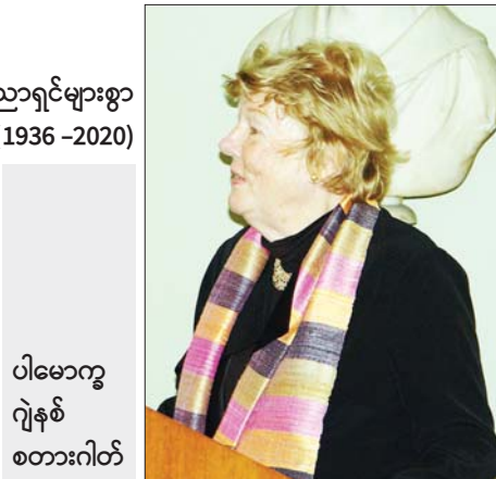
ပါမောက္ခဂျန်စစ်စတားဂါတ်

လုပ်ဆောင်လာနိုင်ခြင်း၊ ရှာဖွေတူးဖော်ကာ စနစ်တကျ သုတေသနလုပ်ငန်းများ ဆောင်ရွက်လာနိုင်ခြင်း၊ နိုင်ငံတကာပညာရှင်များ လာရောက်လေ့လာဆွေးနွေးခြင်း၊ ကွင်းဆင်းလေ့လာနိုင်ခြင်းတို့မှာ ၂၀၀၇ ခုနှစ်က ရှေးဟောင်းသုတေသန နည်းပညာသင်တန်းကျောင်းကို ပြည်မြို့အနီး ဖွင့်လှစ်နိုင်ခဲ့ခြင်းက များစွာ ပံ့ပိုးပေးနိုင်ခဲ့ပါသည်။ ယဉ်ကျေးမှုဝန်ကြီးဌာန ဝန်ကြီး ဗိုလ်ချုပ်ကြည်အောင် (၂၀၀၀-၂၀၀၆) တာဝန်ယူစဉ်ကာလတွင် ပျူရှေးဟောင်းဒေသတူးဖော်လေ့လာရေးများကို စာတွေ့လက်တွေ့သင်ကြားပေးနိုင်ရန်၊ ဘွဲ့လွန်သင်တန်းကျောင်းအဖြစ် ရည်ရွယ်ကာ ဆောက်လုပ်ဖွင့်လှစ်ပေးခဲ့ခြင်းဖြစ်ပါသည်။ ပျူခေတ်ရှေးဟောင်းလက်ရာများဖြစ်သော အထိမ်းအမှတ်ဆိုင်ရာ အဆောက်အဦများနှင့် ခံတပ်များကဲ့သို့ အုတ်အဆောက်အဦများကို ဦးစားပေးတူးဖော်ရာမှ အုတ်နှင့် မြေသားဖြင့် ပြုလုပ်ထားသော အရိုးအိုးများ မြေမြှုပ်ထားရာ လှေကားထစ်အဆင့်များကိုပါ သရေခေတ္တရာမြို့ဟောင်း တောင်ဘက်ရှိ အုတ်ရိုးအပြင်ဘက်တွင် တွေ့ရှိတူးဖော်နိုင်ခဲ့ပါသည်။ ထို့အပြင် ပါမောက္ခကြီး၏ ဖိတ်ကြားချက်အရ ပြည်မြို့ ရှေးဟောင်းသုတေသနနည်းပညာ သင်တန်းကျောင်းက ကျောင်းအုပ်များ အဆက်ဆက်ကို အင်္ဂလန်နိုင်ငံ ကိန်းဘရစ်တက္ကသိုလ်တွင် ဧည့်သုတေသီများအဖြစ် သွားရောက်ဆောင်ရွက်ကာ ပျူနှင့်ပတ်သက်သော တူးဖော်ချက်၊ တွေ့ရှိချက်များနှင့် ပတ်သက်၍ သုတေသနစာတမ်းဖတ်ပွဲများ ကျင်းပခြင်း၊ ဆွေးနွေးပွဲများ ပြုလုပ်ခြင်းများ ကျင်းပနိုင်ခဲ့ပါသည်။