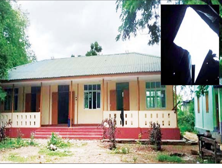
ပုံးသီးနှစ်လုံးကျရောက်သည့် ကျောင်းအဆောက်အဦနှင့် ကျောင်းခေါင်မိုး ပေါက်ကွဲပျက်စီးမှု မှတ်တမ်းဓာတ်ပုံ။

နေပြည်တော် ဇွန် ၉ စစ်ကိုင်းတိုင်းဒေသကြီး ရွှေဘိုမြို့နယ် အခြေခံပညာ မူလတန်းလွန်ကျောင်း (တည်သီးတော) အား PDF အမည်ခံအကြမ်းဖက်သမားများက ယနေ့နံနက်ပိုင်း တွင် Drone ယာဉ်များ အသုံးပြုကာ ပုံးခွဲတိုက်ခိုက်ခဲ့ ကြောင်း သိရှိရသည်။ ဖြစ်စဉ်မှာ ယနေ့နံနက် ၁၀ နာရီခွဲခန့်တွင် စစ်ကိုင်းတိုင်းဒေသကြီး ရွှေဘိုမြို့နယ် အခြေခံပညာ မူလတန်းလွန်ကျောင်း (တည်သီးတော)၌ ဆရာ ဆရာမများနှင့် ကျောင်းသား ကျောင်းသူများအား စာသင်ကြားပေးနေစဉ် PDF အမည်ခံ အကြမ်းဖက် သမားများက ယုတ်မာရိုင်းစိုင်းသော ရည်ရွယ်ချက် ဖြင့် Drone ယာဉ်များ အသုံးပြု၍ လက်လုပ်ပုံးသီး များဖြင့် လေကြောင်းမှ ပုံးခွဲတိုက်ခိုက်ခဲ့ပြီး အဆိုပါ Drone များသည် ကျောင်း၏အနောက်တောင်ဘက်သို့ စာမျက်နှာ ၂၂ ကော်လံ ၁ □