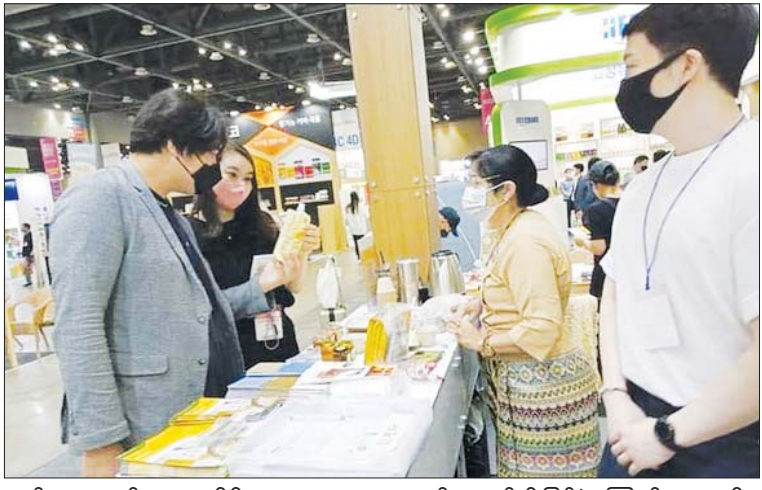
ရက်က ကျင်းပရာ ကိုရီးယားသမ္မတ တက်ရောက်ချီးမြှင့်ခဲ့ကြောင်း သိရ နိုင်ငံဆိုင်ရာ မြန်မာသံအမတ်ကြီး သည်။

များက စိတ်ဝင်စားမှုရှိကြောင်း သိရှိရသည်။ အာဆီယံနိုင်ငံများမှ ထုတ်ကုန် ပစ္စည်းများ ကိုရီးယားဈေးကွက်သို့ ဝင်ရောက်နိုင်စေရန်၊ နှစ်နိုင်ငံကုန်သွယ်မှု တိုးတက်စေရန်နှင့် အာဆီယံ SMEs လုပ်ငန်းရှင်များအကြား ကုန်သွယ်မှု ဆိုင်ရာ အကျိုးကျေးဇူးများ အပြန်အလှန် ရရှိစေခြင်းဖြင့် SMEs လုပ်ငန်းများ တိုးတက်စေရန်ရည်ရွယ်၍ ကျင်းပ ကြောင်း သိရှိရသည်။ ကုန်စည်ပြပွဲအခမ်းအနားကို ဇွန် ၇