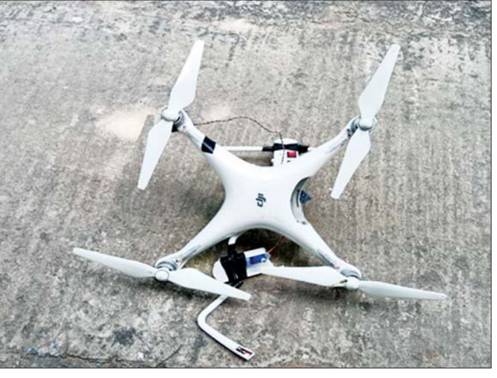
သိမ်းဆည်းရရှိသည့် DJI-1313 အမျိုးအစား Drone ယာဉ်၏ မှတ်တမ်း ဓာတ်ပုံ။