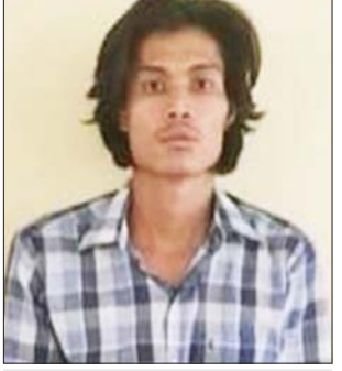
အောင်သူရဇော်(ခ)ကတိုး(ခ)သူရ