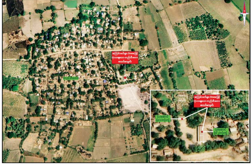
ရွှေဘိုမြို့နယ် တည်သီးတောရွာ စာသင်ကျောင်းသို့ အကြမ်းဖက်များ Drone ဖြင့် ဖုံးချသော နေရာပြပုံ။