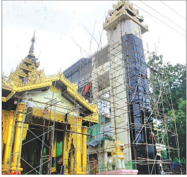
ဟင်္သာကုန်း စေတီတော်မြတ်ကြီးသို့ အနယ်နယ်အရပ်ရပ်မှ ဘုရားဖူး လာကြသော ပြည်သူအများအနေဖြင့် စောင်းတန်းလှေကားမှ အတက်/ အဆင်း ပြုလုပ်နိုင်သည့်အပြင် ဓာတ်လှေကားဖြင့်လည်း သက်သောင့် သက်သာ အတက်/အဆင်းပြုလုပ် ဖူးမြော်နိုင်မည်ဖြစ်ကြောင်း သိရ တင်စိုး(ပဲခူး)

ယခုအခါ ဓာတ်လှေကားတပ်ဆင်မှု ရာနှုန်းပြည့် ပြီးစီးနေပြီဖြစ်၍ မကြာမီရက်ပိုင်းအတွင်း ဖွင့်လှစ်ပေးသွားမည်ဖြစ်ပြီး ဖွင့်လှစ်ပြီးပါက