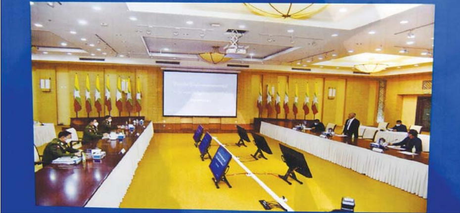
နိုင်ငံတော်၏ငြိမ်းချမ်းရေးဆွေးနွေးရေးအဖွဲ့နှင့် တိုင်းရင်းသားအဖွဲ့အစည်း ကိုယ်စားလှယ်များ တွေ့ဆုံဆွေးနွေးမှု မှတ်တမ်းဓာတ်ပုံ

ပျက်သည်ဟူ၍ ပြောနေကြကြောင်း၊ ထိုအခြေ အနေများကိုမည်သို့ ပြေလည်အောင် ဖြေရှင်းပေး နိုင်၊ မပေးနိုင်သလိုကြောင်း၊ ယခုကဲ့သို့ အချိန်ပိုင်း ပေးမည့်စနစ်က မည်မျှကြာမြင့်မည်ကို သိလို ကြောင်း မေးမြန်းသည်။