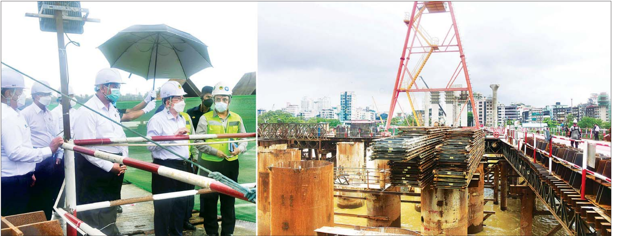
နိုင်ငံတော်စီမံအုပ်ချုပ်ရေးကောင်စီဥက္ကဋ္ဌ နိုင်ငံတော်ဝန်ကြီးချုပ် ဗိုလ်ချုပ်မှူးကြီး မင်းအောင်လှိုင်နှင့် အဖွဲ့ဝင်များ မြန်မာ-ကိုရီးယား ချစ်ကြည်ရေး(ဒလ)တံတား တည်ဆောက်ရေးစီမံကိန်း၌ လုပ်ငန်းဆောင်ရွက်နေမှု အခြေအနေများကို ကြည့်ရှုစစ်ဆေးစဉ်။