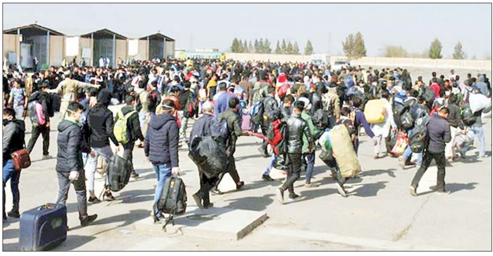
၂၀၂၁ ခုနှစ်က အီရန်နိုင်ငံမှ အာဖဂန်ဒုက္ခသည်များ နေရပ်ပြန်လာသည်ကို တွေ့ရစဉ်။

ကဘူးလ် ဇွန် ၉ ဒုက္ခသည်များနှင့် နေရပ်ပြန်ပို့ရေး ပြည်နယ် နယ်စပ်ဖြတ်ကျော်ဂိတ် အိမ်နီးချင်း ပါကစ္စတန်နိုင်ငံနှင့် ဝန်ကြီးဌာနက ဇွန် ၉ ရက်က များမှတစ်ဆင့် အာဖဂန်နိုင်ငံသား ၄၉၈၆ ဦးနှင့် ပါကစ္စတန်နိုင်ငံမှ အာဖဂန်နိုင်ငံတောင်ပိုင်း ကန်ဒါ ပိုင်းနှင့် အီရန်နိုင်ငံ ဟီရတ် ဟာပြည်နယ်အတွင်း အထောက် အထားမဲ့ ဒုက္ခသည် ၁၇၃ ဦး ရောက်ရှိလာခြင်း ဖြစ်ကြောင်း ဝန်ကြီးဌာန၏ ထုတ်ပြန်ချက်တွင် ဖော်ပြထားသည်။