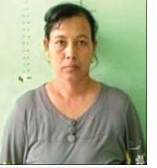
မြင့်မြင့်အေး