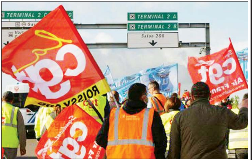
သပိတ်မှောက်နေသော လေယာဉ်ဝန်ထမ်းများကို တွေ့ရစဉ်။

ကိုဗစ်-၁၉ ကပ်ရောဂါကြောင့် အလုပ်အကိုင် များ ရှားပါးပြတ်လပ်ခဲ့ပြီး ဝန်ထမ်းအင်အား ပြတ်တောက်နေချိန်တွင် သပိတ်မှောက်အလုပ် သမား ၈၀၀ ခန့် လေဆိပ်အပြင်ဘက်တွင် လုပ်ခ လစာကို ယူရို ၃၀၀ (အမေရိကန်ဒေါ်လာ ၃၂၀) ခန့် တိုးမြှင့်ပေးရန် သပိတ်မှောက်ခဲ့သည်။ အေအက်ဖ်ပီ