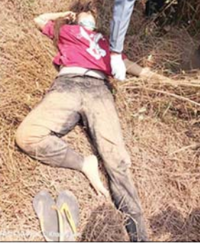
ရက်စက်စွာ သတ်ဖြတ်ခံခဲ့ရသည့် အပြစ်မဲ့ပြည်သူ၏ မှတ်တမ်းဓာတ်ပုံ။