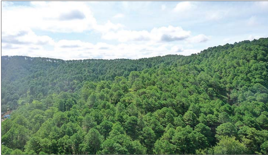
ကလောမြို့ဝန်းကျင်ရှိ သဘာဝထင်းရှူးတောများကို တွေ့ရစဉ်။

ကလောမြို့ဝန်းကျင်သည် နေရာသီဥတုအပူရောင် အပန်းဖြေစခန်းအဖြစ်၊ မိုးရာသီ၌ စိမ်းစိုလတ်ဆတ်သော ထင်းရှူးရနံ့ထုံမွှမ်းသော မြို့ကလေးအဖြစ်၊ ဆောင်းရာသီ၌ အေးစိမ့်နေသည့် နှင်းမြို့တော်အဖြစ် သဘာဝဆန်ဆန် လှပလျက်ရှိသည်။ ပြည်တွင်း ပြည်ပခရီးသွားများကို တစ်ခေါက်ရောက်ပြီးသော် လည်း နောက်ထပ်လာလည်ချင်သည့်စိတ် ဖြစ်ပေါ်လာအောင် သဘာဝအလှအပများစွာဖြင့် ဆွဲဆောင်ထားနိုင်သည့် တောင်ပေါ်မြို့လေးဖြစ်သည်။