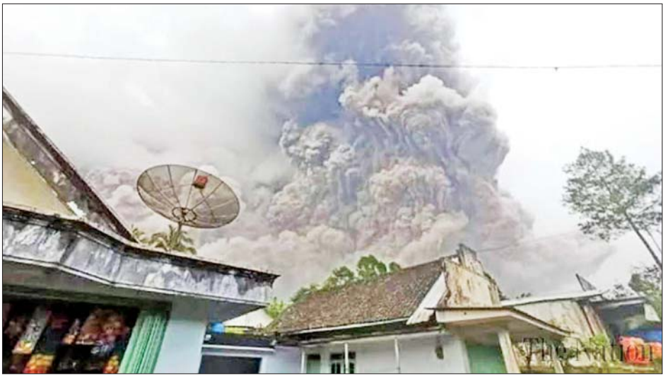
သိရသည်။ မီးတောင်မှချော်ရည်များမှာ အနီးအနားရှိမြစ်များထဲသို့ စီးဆင်းသွားနိုင်သဖြင့် အဆိုပါမြစ်ချောင်းများအနီးသို့ သွားရောက်ခြင်းမပြုရန် ဒေသခံများအား တာဝန်ရှိသူများက ညွှန်ကြားခဲ့သည်။ ကိုးကား-ဆင်ဟွာ၊ ဘာသာပြန်-စိုးသူရ

ပြောကြားသည်။ ထို့ပြင် ကိုယ်ဝန်ဆောင်အမျိုးသမီးနှစ်ဦးအပါအဝင် အဆိုပါဖြစ်စဉ်အတွင်း ထိခိုက်ဒဏ်ရာရရှိခဲ့သူများကို နီးစပ်ရာဆေးရုံများ၌ ဆေးကုသမှုခံယူရန် တာဝန်ရှိသူများက ဆောင်ရွက်ပေးခဲ့ကြောင်းနှင့် ဒေသခံ ၉၀၂ ဦးအား ဘေးလွတ်ရာသို့ ရွှေ့ပြောင်းပေးခဲ့ကြောင်း သိရသည်။ ၎င်းမီးတောင်ပေါက်ကွဲမှုမှ ထွက်ပေါ်လာသော ပြာမှုန်များသည် ဒေသအတွင်းရှိ လူနေအိမ်များ၊ လမ်းများနှင့် တံတားတစ်ခုအပေါ်သို့ ဖုံးလွှမ်းသွားခဲ့ကြောင်း သိရသည်။ ဒေသဆိုင်ရာတာဝန်ရှိသူများသည် စက်ယန္တရားကြီးများအသုံးပြုကာ လမ်းများပေါ်တွင် ဖုံးလွှမ်းနေသော ပြာမှုန်များကိုဖယ်ရှားပြီး မီးတောင်ပေါက်ကွဲမှုဖြစ်စဉ်အတွင်း ပျောက်ဆုံးလျက်ရှိသူများအား ဆက်လက်ရှာဖွေလျက်ရှိကြောင်း