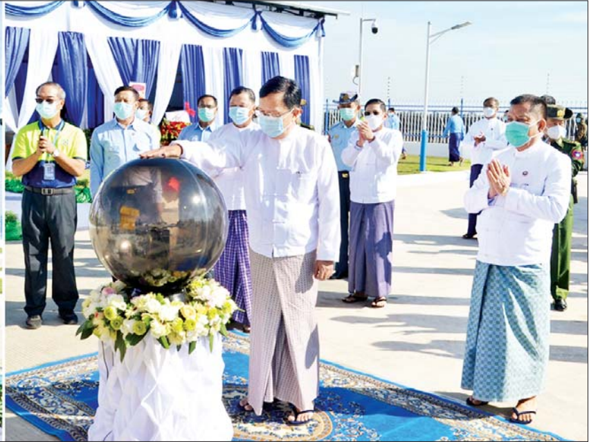
နိုင်ငံတော်စီမံအုပ်ချုပ်ရေးကောင်စီ အတွင်းရေးမှူး ဒုတိယဗိုလ်ချုပ်ကြီး အောင်လင်းဒွေး သပြေ နေရောင်ခြည်စွမ်းအင်သုံးဓာတ်အားပေးစက်ရုံ ကမ္ဘည်းမော်ကွန်း ကျောက်စာတိုင်ကို စက်ခလုတ်နှိပ်ဖွင့်လှစ်ပေးစဉ်။

တက်ရောက် ဖွင့်ပွဲအခမ်းအနားသို့ နိုင်ငံတော်စီမံ အုပ်ချုပ်ရေးကောင်စီ အတွင်းရေးမှူး ဒုတိယဗိုလ်ချုပ်ကြီး အောင်လင်းဒွေး၊ လျှပ်စစ်နှင့် စွမ်းအင်ဝန်ကြီးဌာန ပြည်ထောင်စုဝန်ကြီး ဦးအောင်သန်းဦး၊ မန္တလေးတိုင်းဒေသကြီး ဝန်ကြီးချုပ် ဦးမောင်ကို၊ ဌာနဆိုင်ရာအကြီးအကဲများ၊ စာမျက်နှာ ၇ ကော်လံ ၁ သို့ □