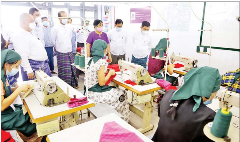
အသုံးပြု၍ ကျွမ်းကျင်မှုစစ်ဆေးရည် ဖြေဆိုနေသည့် အထည်ချုပ်လုပ်သားများကို ကြည့်ရှုစစ်ဆေးခဲ့ကြောင်း သိရသည်။ သတင်းစဉ်

စစ်ဆေးအကဲဖြတ်ရေးလုပ်ငန်းစဉ်တို့ကို ရှင်းလင်းတင်ပြကြရာ ပြည်ထောင်စုဝန်ကြီးက လိုအပ်သည်များ မှာကြားသည်။ ထို့နောက် တစ်ချောင်းချုပ် အပ်ချုပ်စက်၊ ဓားစက်၊ ကြယ်သီးတပ်စက်၊ ကြယ်သီးဖောက်စက်၊ ချည်တုပ်စက် စသည့်စက်များကို အသုံးပြု၍ ကျွမ်းကျင်မှုစစ်ဆေးရည်ဖြေဆိုနေသည့် အထည်ချုပ်လုပ်သား ၅၀ ဧါဖြေဆိုနေမှုကို ကြည့်ရှုစစ်ဆေးသည်။ ဆက်လက်၍ ပြည်ထောင်စုဝန်ကြီးနှင့်အဖွဲ့သည် ရေနီမြို့ရှိ Lat War Co., Ltd. အထည်ချုပ်စက်ရုံ၏ Assessment Center သို့ ရောက်ရှိကြရာ တာဝန်ရှိသူများက စက်ရုံတည်ထောင်ထားရှိမှု၊ လုပ်ငန်းလည်ပတ်နေမှုအခြေအနေနှင့် အထည်ချုပ်လုပ်သားများ၏ ကျွမ်းကျင်မှုစစ်ဆေးအကဲဖြတ်ရေးလုပ်ငန်းစဉ်တို့ကို ရှင်းလင်းတင်ပြကြရာ ပြည်ထောင်စုဝန်ကြီးက လိုအပ်သည်များ မှာကြားပြီး စက်များ