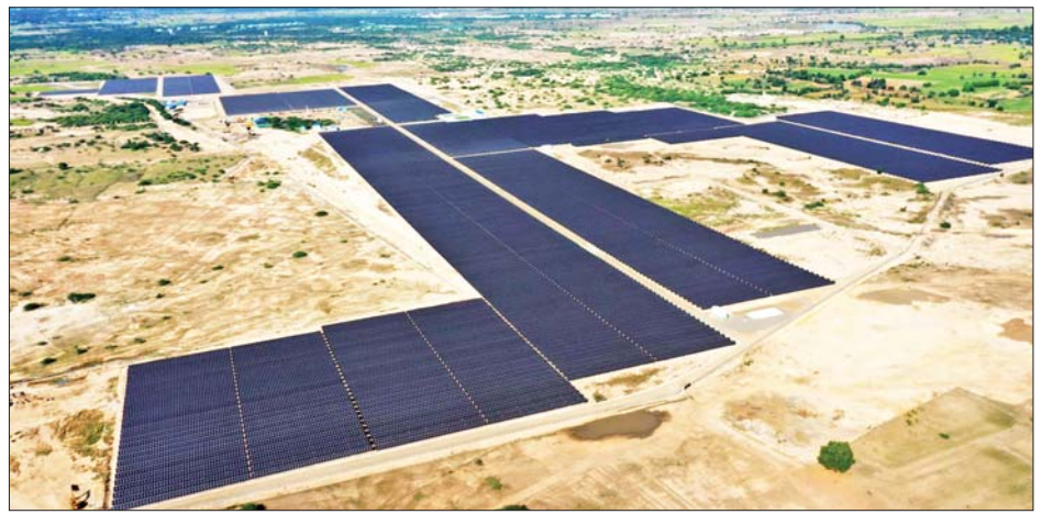
သပြေ နေရောင်ခြည်စွမ်းအင်သုံး ဓာတ်အားပေးစက်ရုံစီမံကိန်းကို တွေ့ရစဉ်။

ရေး စီစဉ်ဆောင်ရွက်လျက်ရှိပါ ကြောင်း၊ ယခု သပြေ နေရောင် ခြည်စွမ်းအင်သုံး ဓာတ်အားပေး စက်ရုံစီမံကိန်း၏ စက်တပ်ဆင် အင်အားမှာ မဂ္ဂါဝပ် ၃၀ ဖြစ်ကာ မြန်မာနိုင်ငံတွင် ဒုတိယမြောက် အကောင်အထည်ဖော် တည် ဆောက်ပြီးစီးခဲ့သည့် စီမံကိန်း တစ်ခု ဖြစ်ပါကြောင်း၊ အဆိုပါ စီမံကိန်းမှ တစ်ရက်လျှင် လျှပ်စစ် ယူနစ်ကီလိုဝပ် နာရီနှစ်သိန်းကျော် ခန့် ထုတ်လုပ်နိုင်ပြီး တစ်နှစ်လျှင် လျှပ်စစ်ဓာတ်အားကီလိုဝပ် နာရီ သန်းပေါင်း ၇၀ ဒသမ ၅၉၉ ထုတ်လုပ်ပေးနိုင်မည် ဖြစ်ကာ ထွက်ရှိလာမည့် လျှပ်စစ်ဓာတ် အားများကို သပြေ ပင်မဓာတ် အားဦးစိုက်စနစ်နှင့် နိုင်ငံတော် ဓာတ်အားစနစ်သို့ ချိတ်ဆက် ပို့လွှတ် ဖြန့်ဖြူးသွားမည်ဖြစ်ပါ ကြောင်း။ လက်ရှိအချိန်တွင် နိုင်ငံအတွင်း အိမ်ထောင်စုပေါင်း ၁၀ ဒသမ ၉ သန်းကျော်ရှိသည့် အနက် အိမ် ထောင်စု ၆ ဒသမ ၆ သန်းခန့်ကို နိုင်ငံတော် ဓာတ်အားစနစ်မှ မီးပေးနိုင်ပြီးဖြစ်၍ အိမ်ထောင်စု စုစုပေါင်း၏ ၆၁ ရာခိုင်နှုန်းကို ဓာတ်အား ဖြန့်ဖြူးပေးနိုင်ခဲ့ပြီ ဖြစ်ပါကြောင်း၊ နိုင်ငံတော်အစိုးရ အနေဖြင့် လျှပ်စစ်မီးရရှိသုံးစွဲပြီး သူများအား တည်ငြိမ်သော လျှပ်စစ်ဓာတ်အား ရရှိအောင် ဆောင်ရွက်ပေးနေသကဲ့သို့လျှပ်စစ်