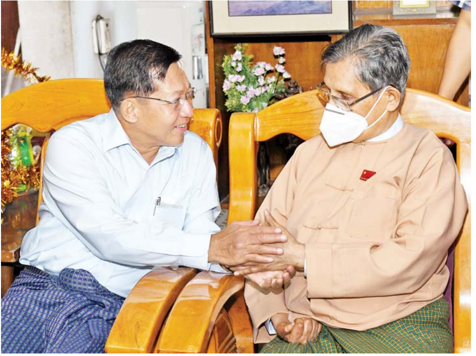
နိုင်ငံတော်စီမံအုပ်ချုပ်ရေးကောင်စီဥက္ကဋ္ဌ၊ နိုင်ငံတော်ဝန်ကြီးချုပ် ဗိုလ်ချုပ်မှူးကြီး မင်းအောင်လှိုင် တပ်မတော်ကာကွယ်ရေးဦးစီးချုပ်ဟောင်း၊ အမျိုးသားဒီမိုကရေစီအဖွဲ့ချုပ် နာယက ဗိုလ်ချုပ်ကြီး(ဟောင်း) ဦးတင်ဦး အား ရင်းရင်းနှီးနှီးနှုတ်ဆက်ပြီး ကျန်းမာရေးအခြေအနေများ မေးမြန်းအားပေးစကားပြောကြား စဉ်။

ကျန်းမာရေးအခြေအနေများနှင့် လိုအပ်ချက်များ ရရှိပါက အချိန်တိုအတွင်း ဖြည့်ဆည်းဆောင်ရွက်ပေးနိုင်ရေး၊ တပ်မတော်ဆေးရုံများတွင် လိုအပ် သည့် ဆေးကုသမှုများခံယူနိုင်ရေး တို့အတွက် တာဝန်ရှိသူများနှင့် ညှိနှိုင်းဖြည့်ဆည်းဆောင်ရွက်ပေး ကာ အားဖြည့်ငှက်သိုက်များနှင့် တပ်မတော်စက်ရုံထုတ်စားသောက် ဖွယ်ရာပစ္စည်းများ ပေးအပ်သည်။ ယင်းနောက် နိုင်ငံတော်စီမံအုပ် ချုပ်ရေးကောင်စီဥက္ကဋ္ဌ၊ နိုင်ငံတော် ဝန်ကြီးချုပ်သည် မရမ်းကုန်းမြို့ နယ်ရှိ နိုင်ငံတော်အေးချမ်းသာယာ ရေးနှင့် ဖွံ့ဖြိုးရေးကောင်စီ ဝန်ကြီး ချုပ်(ဟောင်း)၊ ဗိုလ်ချုပ်ကြီး (ဟောင်း) ဦးခင်ညွန့်၏ နေအိမ်သို့ သွားရောက်တွေ့ဆုံ၍ ကျန်းမာရေး အခြေအနေများကို ရင်းရင်းနှီးနှီး မေးမြန်းအားပေးစကားပြောကြား သည်။ စာမျက်နှာ ၅ သို့ ❖