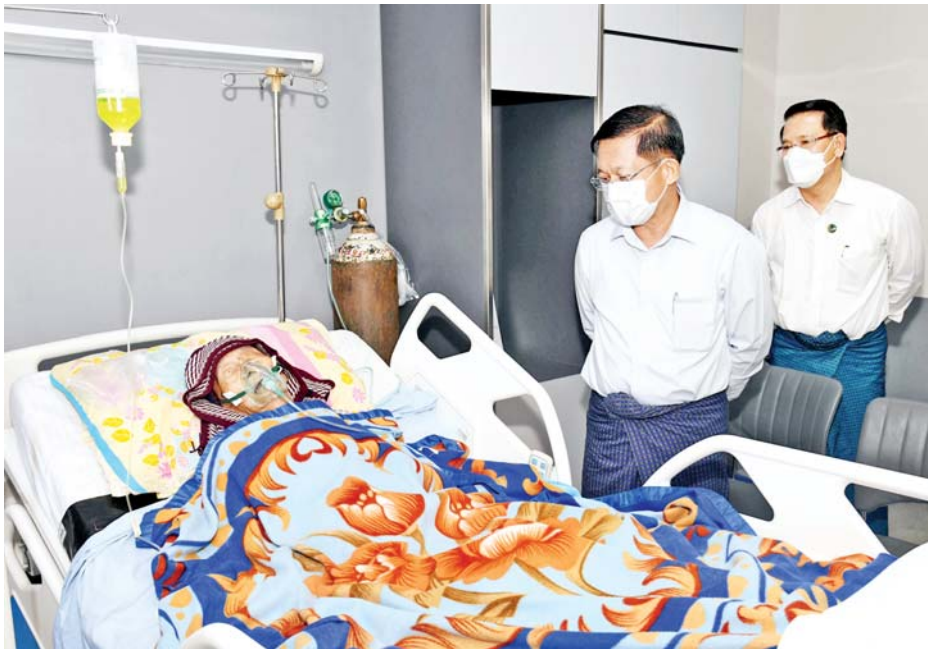
နိုင်ငံတော်စီမံအုပ်ချုပ်ရေးကောင်စီဥက္ကဋ္ဌ၊ နိုင်ငံတော်ဝန်ကြီးချုပ် ဗိုလ်ချုပ်မှူးကြီးမင်းအောင်လှိုင် နိုင်ငံတော်အေးချမ်းသာယာရေးနှင့် ဖွံ့ဖြိုးရေးကောင်စီ ဝန်ကြီးချုပ်(ဟောင်း) ဗိုလ်ချုပ်ကြီး(ဟောင်း) ဦးခင်ညွန့်အား တွေ့ဆုံ၍ ကျန်းမာရေးအခြေအနေများကို ရင်းရင်းနှီးနှီး မေးမြန်း အားပေးစကား ပြောကြားစဉ်။