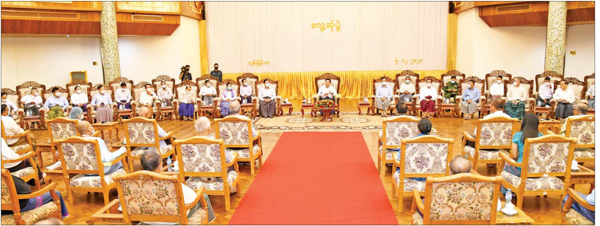
နိုင်ငံတော်စီမံအုပ်ချုပ်ရေးကောင်စီဥက္ကဋ္ဌ၊ နိုင်ငံတော်ဝန်ကြီးချုပ် ဗိုလ်ချုပ်မှူးကြီးမင်းအောင်လှိုင် ဘာသာပေါင်းစုံချစ်ကြည်ညီညွတ်ရေးအဖွဲ့ (ဗဟို)ဥက္ကဋ္ဌနှင့် အလုပ်အမှုဆောင်များအား တွေ့ဆုံနှုတ်ဆက်စကားပြောကြားစဉ်။