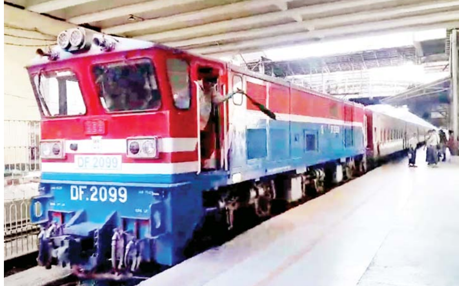
ရန်ကုန်-ပြည်လမ်းပိုင်း၊ သာစည်-ရွှေညောင် လမ်းပိုင်းတို့တွင် စာပို့ရထားနှစ်စင်းစီ၊ ရန်ကုန်- ပဲခူးလမ်းပိုင်း၊ သာစည်-မြင်းခြံလမ်းပိုင်း၊ ပုဂံ-မန္တလေး လမ်းပိုင်း၊ ပျဉ်းမနား- တောင်တွင်းကြီးလမ်းပိုင်း၊ မော်လမြိုင်-ရေးလမ်းပိုင်းနှင့် ပုသိမ်-ကြံခင်း

နေပြည်တော် ဒီဇင်ဘာ ၅ မြန်မာ့မီးရထားအနေဖြင့် ပြည်သူများခရီးသွားလာမှု လွယ်ကူအဆင်ပြေစေရေးနှင့် ကုန်စည်စီးဆင်းမှု မှန်ကန်မြန်ဆန်စေရေးအတွက် စီစဉ်ဆောင်ရွက်ပေး လျက်ရှိရာ ရထားလမ်းပိုင်းအသီးသီးတွင် လူစီး ရထားများ ပြေးဆွဲပေးခြင်းကို ကျန်းမာရေးဝန်ကြီး ဌာန၏ ခရီးသွားလာမှုဆိုင်ရာ လိုက်နာဆောင်ရွက် ရမည့်အချက်များ၊ Standard Operation Procedure - SOP လမ်းညွှန်ချက်နှင့်အညီ ပြေးဆွဲဆောင်ရွက် ပေးလျက်ရှိပါသည်။ ခရီးစဉ်များ တိုးချဲ့ပြေးဆွဲခဲ့ ကိုဗစ်-၁၉ ရောဂါ တတ်ယလှိုင်းအပြီးတွင် ရုံးဌာနများ၊ စက်ရုံ/အလုပ်ရုံများ ပြန်လည်ဖွင့်လှစ်ချိန် မှစ၍ ခရီးသွားလာကြမည့်ပြည်သူများနှင့် ကုန်စည် များအဆင်ပြေချောမွေ့စွာ သယ်ယူပို့ဆောင်နိုင်ရေး အတွက် မြန်မာ့မီးရထားက ခရီးစဉ်များ တိုးချဲ့ပြေးဆွဲ ခဲ့ရာ ဒီဇင်ဘာ ၄ ရက်အထိ ရန်ကုန်-မန္တလေးလမ်းပိုင်း တွင် အမြန်ရထား နှစ်စင်း၊ စာပို့ရထားနှစ်စင်း၊ နေပြည်တော်-ရန်ကုန်လမ်းပိုင်း၊ ရန်ကုန်- မော်လမြိုင်လမ်းပိုင်းတို့တွင် အမြန်ရထား နှစ်စင်းစီ