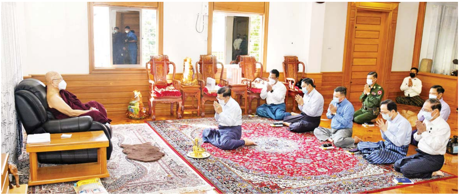
နိုင်ငံတော်စီမံအုပ်ချုပ်ရေးကောင်စီဥက္ကဋ္ဌ၊ နိုင်ငံတော်ဝန်ကြီးချုပ် ဗိုလ်ချုပ်မှူးကြီးမင်းအောင်လှိုင်နှင့်အဖွဲ့ဝင်များ နိုင်ငံတော်ဩဝါဒါစရိယ၊ ရွှေတိဂုံစေတီတော် ဂေါပကအဖွဲ့ ဩဝါဒါစရိယ အင်းစိန်ရွာမဆရာတော် အဂ္ဂမဟာပဏ္ဍိတ ဘဒ္ဒန္တတိလောကာဘိဝံသထံမှ ငါးပါးသီလ ခံယူဆောက်တည်ကြစဉ်။

ထို့နောက် နိုင်ငံတော်စီမံအုပ်ချုပ်ရေး ကောင်စီ ဥက္ကဋ္ဌ၊ နိုင်ငံတော်ဝန်ကြီးချုပ်က အင်းစိန်ရွာမဆရာတော်ဘုရားကြီးထံ နေပြည်တော် ဒက္ခိဏသီရိမြို့နယ်ရှိ ဗုဒ္ဓ ဥယျာဉ်တော်အတွင်း၌ ကမ္ဘာပေါ်ရှိ ထိုင်တော်မူကျောက်ဆစ်ဗုဒ္ဓရုပ်ပွားတော် များအနက် ဉာဏ်တော်အမြင့်ဆုံးဖြစ်လာ မည့် “မာရဝိဇယ” ထိုင်တော်မူ ကျောက်ဆစ်ဗုဒ္ဓရုပ်ပွားတော်မြတ်ကြီး တည်ဆောက်ရေးလုပ်ငန်းဆိုင်ရာများကို နိုင်ငံတော်သံဃမဟာနာယကအဖွဲ့ ဆရာ တော်ကြီးများ၏ ဩဝါဒများ၊ သာသနာ တော်ထုံး၊ ရုပ်ပွားဆင်းတုတော်ထုံး၊ မြန်မာ့ရိုးရာတည်ထုံးများနှင့်အညီ ထုဆစ် ပူဇော်လျက်ရှိသည့်အခြေအနေ၊ ထို့ပြင်