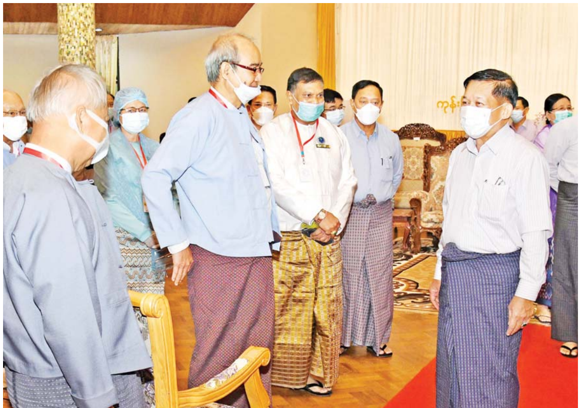
နိုင်ငံတော်စီမံအုပ်ချုပ်ရေးကောင်စီဥက္ကဋ္ဌ၊ နိုင်ငံတော်ဝန်ကြီးချုပ် ဗိုလ်ချုပ်မှူးကြီးမင်းအောင်လှိုင် ဘာသာပေါင်းစုံ ချစ်ကြည်ညီညွတ်ရေးအဖွဲ့(ဗဟို)ဥက္ကဋ္ဌနှင့် တာဝန်ရှိသူများအား ရင်းရင်းနှီးနှီး နှုတ်ဆက်စဉ်။

❖ စာမျက်နှာ ၄ မှ ထို့နောက်သာသာနားရေးနှင့် ယဉ်ကျေး မှုဝန်ကြီးဌာန ပြည်ထောင်စုဝန်ကြီး ဦးကိုကိုက ဆွေးနွေးပြောကြားရာတွင် မိမိတို့နိုင်ငံ၏ ဖွဲ့စည်းပုံအခြေခံဥပဒေ (၂၀၀၈ ခုနှစ်) တွင် ခရစ်ယာန်ဘာသာ၊ အစ္စလာမ်ဘာသာ၊ ဟိန္ဒူဘာသာနှင့် အခြား နတ်ကိုးကွယ်မှုများကိုလည်း ကိုးကွယ်ရာဘာသာဟူ၍ အသိအမှတ်ပြု သည်ဟု ပါရှိပါကြောင်း၊ ထို့ကြောင့် ဘာသာပေါင်းစုံတို့၏ လိုအပ်ချက်များကို တတ်စွမ်းသရွေ့ ဖြည့်ဆည်းဆောင်ရွက် ပေးရန် မိမိတို့ဝန်ကြီးဌာန၌ တာဝန်ရှိပါ ကြောင်းပြောကြားပြီး ဘာသာပေါင်းစုံ ချစ်ကြည်ညီညွတ်ရေးအဖွဲ့အား ပြန်လည် ဖွဲ့စည်းဆောင်ရွက်ခဲ့ရာတွင် လိုအပ်သည် များ ဆောင်ရွက်ပေးခဲ့မှုနှင့် လိုအပ်ချက် များ တင်ပြထားရှိမှုကိုလည်း ကဏ္ဍများ အလိုက် ဖြေရှင်းဆောင်ရွက်ပေးလျက်ရှိ သည့် အခြေအနေများနှင့်ပတ်သက်၍ ဆွေးနွေးပြောကြားသည်။