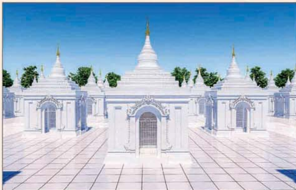
ကျောက်စာရုံစေတီ(၁၂ x ၁၂ x ၁၈)ပေ ၁ ဆူ တန်ဖိုး- ၂၇၉ သိန်း