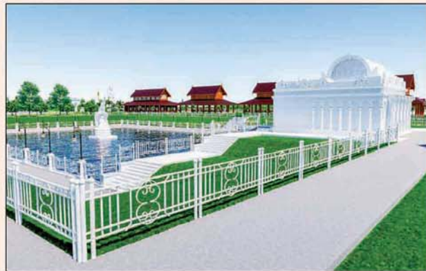
မုစလိန္နုအိုင်

၁။ နိုင်ငံတော်စီမံအုပ်ချုပ်ရေးကောင်စီဥက္ကဋ္ဌ၊ တပ်မတော်ကာကွယ်ရေးဦးစီးချုပ် ဗိုလ်ချုပ်မှူးကြီးမင်းအောင်လှိုင် ဦးဆောင်သည့် (၇)ရက်သား၊ သမီး၊ ဘုရားဒါယကာ၊ ဒါယိကာမတို့က မာရဝိဇယပုဒ္ဒရုပ်ပွားတော်မြတ်ကြီးအား မြန်မာနိုင်ငံတွင် ထေရဝါဒဗုဒ္ဓသာသနာတော်ထွန်းလင်းတောက်ပလျက်ရှိသည်ကို ကမ္ဘာကိုပြသရန်၊ တိုင်းပြည်အေးချမ်းသာယာမှုရှိစေရန်၊ ရုပ်ပွားတော်မြတ်ကြီးအား ပြည်တွင်း၊ ပြည်ပဘုရားဖူးများလာရောက်ခြင်းဖြင့် ဒေသတိုးတက်စည်ကားမှုကို အထောက်အကူဖြစ်စေရန်၊ နိုင်ငံတော်ဖွံ့ဖြိုးတိုးတက်မှုအား အထောက်အကူဖြစ်စေရန် ရည်သန်လျက် ပြည်ထောင်စုနယ်မြေ နေပြည်တော်၊ ဒက္ခိဏသီရိမြို့နယ်အတွင်း၌ သာသနာတော်ထုံး၊ ရုပ်ပွားဆင်းတုတော်ထုံး၊ မြန်မာ့ရိုးရာတည်ထုံးများနှင့်အညီ တည်ဆောက်ပူဇော်လျက် ရှိပါသည်။