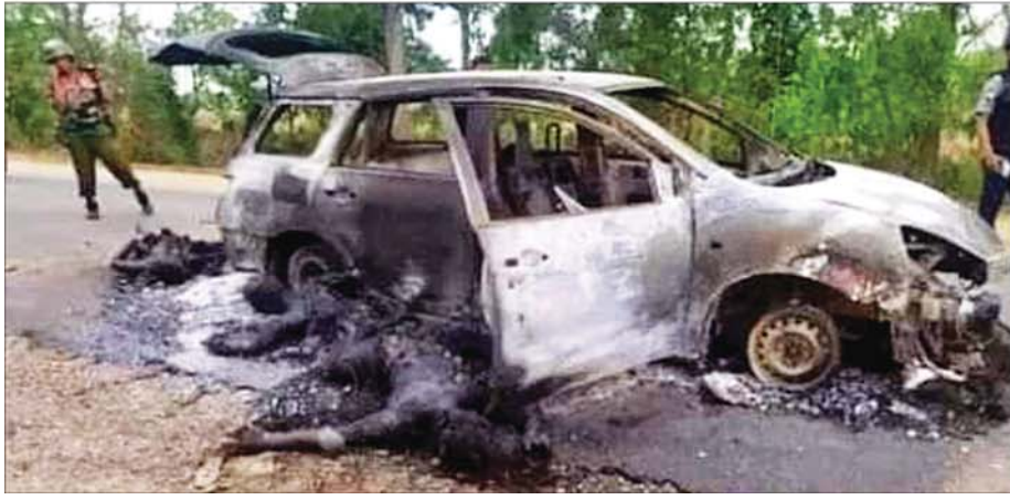
ဂန့်ဂေါမြို့နယ်၌ အကြမ်းဖက်သောင်းကျန်းသူများက ပညာရေးဝန်ထမ်းများ စီးနင်းလိုက်ပါလာသည့် မော်တော်ယာဉ် တစ်စီးအား တားဆီး၍ သေနတ်ဖြင့် ပိုင်းဝန်းပစ်ခတ်ပြီး ယာဉ်အား မီးရှို့ဖျက်ဆီးခဲ့သဖြင့် ငါးဦးသေဆုံးကာ တစ်ဦး ဒဏ်ရာရရှိမှု မှတ်တမ်းဓာတ်ပုံ။