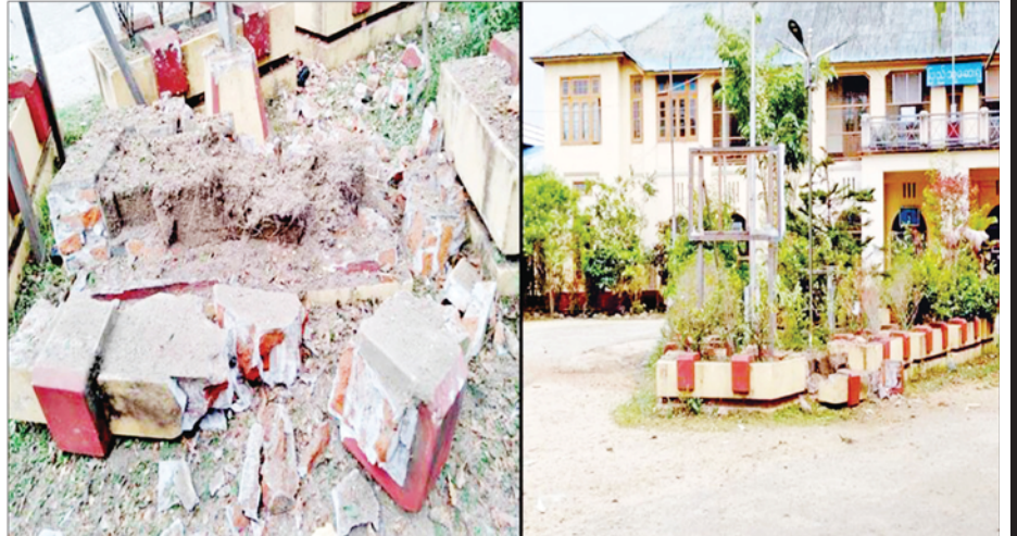
၄-၅-၂၀၂၁ ရက်တွင် ဗန်းမော်မြို့ ပြည်သူ့ဆေးရုံ၌ မိုင်းပေါက်ကွဲမှု။