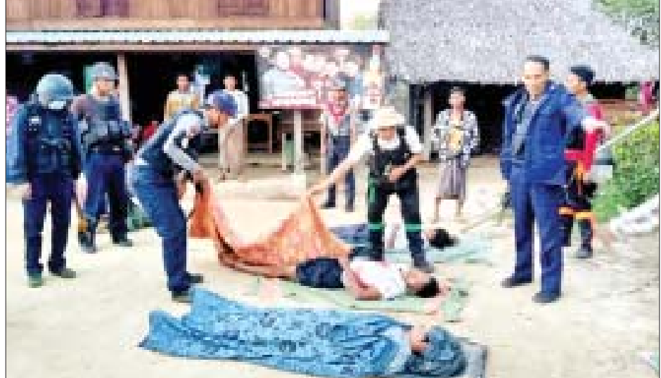
တန့်ဆည်မြို့နယ်၌ PDF အကြမ်းဖက်လက်နက်ကိုင်အဖွဲ့က နေအိမ်လေးလုံးအား မီးရှို့ပြီး အမျိုးသား ငါးဦးကို သတ်ဖြတ်ခဲ့သည့် မှတ်တမ်းဓာတ်ပုံ။