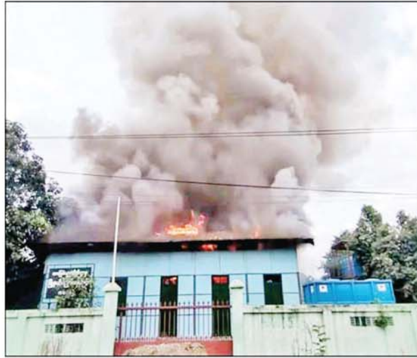
၂၇-၁၁-၂၀၂၁ ရက်တွင် စစ်ကိုင်းတိုင်းဒေသကြီး ကလေးမြို့နယ်၌ မြို့နယ်ပညာရေးမှူးရုံး မီးရှို့ဖျက်ဆီးခံရမှု။