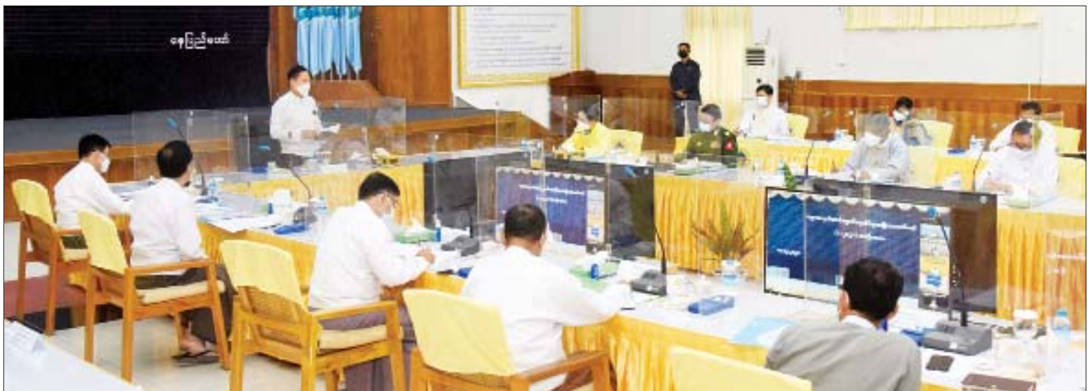
လူမှုကာကွယ်စောင့်ရှောက်ရေးဆိုင်ရာအမျိုးသားကော်မတီဥက္ကဋ္ဌ၊ နိုင်ငံတော်စီမံအုပ်ချုပ်ရေးကောင်စီ ဒုတိယဥက္ကဋ္ဌ၊ ဒုတိယဝန်ကြီးချုပ် ဒုတိယဗိုလ်ချုပ်မှူးကြီးစိုးဝင်း လူမှုကာကွယ်စောင့်ရှောက်ရေးဆိုင်ရာ အမျိုးသားကော်မတီအစည်းအဝေး (၁/၂၀၂၁) တွင် အမှာစကား ပြောကြားစဉ်။

နေပြည်တော် ဒီဇင်ဘာ ၁၄ လူမှုကာကွယ်စောင့်ရှောက်ရေး ဆိုင်ရာ အမျိုးသားကော်မတီ အစည်းအဝေး(၁/၂၀၂၁)ကို ယနေ့ မွန်းလွဲ ၂ နာရီတွင် နေပြည်တော်ရှိ လူမှုဝန်ထမ်း၊ ကယ်ဆယ်ရေးနှင့် ပြန်လည်နေရာချထားရေးဝန်ကြီးဌာန အစည်းအဝေးခန်းမ၌ ကျင်းပရာ လူမှုကာကွယ်စောင့်ရှောက်ရေးဆိုင်ရာ အမျိုးသားကော်မတီဥက္ကဋ္ဌ၊ နိုင်ငံတော်စီမံအုပ်ချုပ်ရေးကောင်စီ ဒုတိယဥက္ကဋ္ဌ၊ ဒုတိယဝန်ကြီးချုပ် ဒုတိယဗိုလ်ချုပ်မှူးကြီးစိုးဝင်း တက်ရောက်အမှာစကား ပြောကြားသည်။ စာမျက်နှာ ၇ ကော်လံ ၁ သို့ ၀