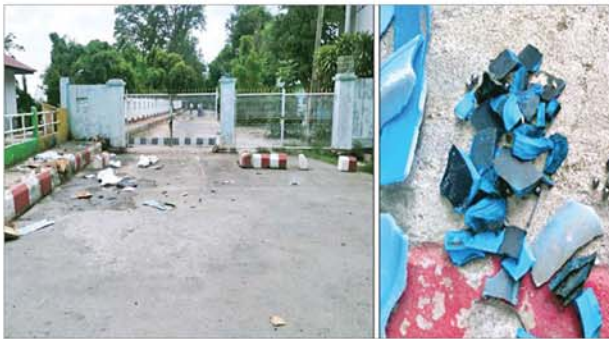
၁၈-၅-၂၀၂၁ရက်တွင် စစ်ကိုင်းမြို့ပညာရေးဒီဂရီကောလိပ်အနီး၌ လက်လုပ်မိုင်းတစ်လုံး ပေါက်ကွဲမှု။