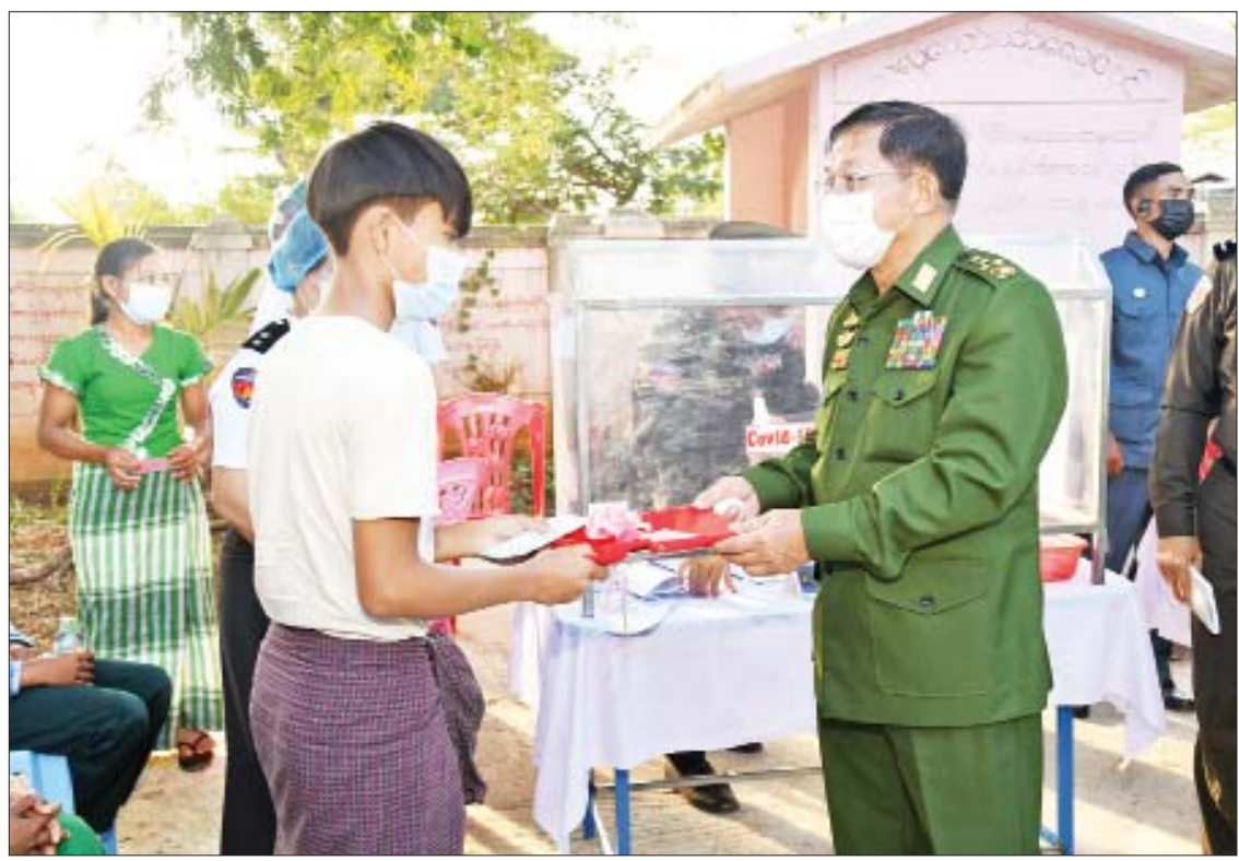
နိုင်ငံတော်စီမံအုပ်ချုပ်ရေးကောင်စီဥက္ကဋ္ဌ၊ နိုင်ငံတော်ဝန်ကြီးချုပ် ဗိုလ်ချုပ်မှူးကြီး မင်းအောင်လှိုင် ဒေသခံပြည်သူတစ်ဦးအား နိုင်ငံသား စိစစ်ဆေးရေးကတ်ပြား ပေးအပ်စဉ်။

အဆိုပါ မိတ္ထီလာမြို့နယ် မြင်းကန်အုပ်စုရှိ ဆည်ကုန်းကျေးရွာတွင် အိမ်ထောင်စု ၁၉၈ စု၊ လူဦးရေ ၉၅၉ ဦးရှိပြီး ကျေးရွာတွင် နေထိုင်လျက်ရှိသည့် နိုင်ငံသားစိစစ်ရေးကတ် မရရှိသေးသော ပြည်သူများမှတ်ပုံတင်ရရှိရေး ပန်းခင်း