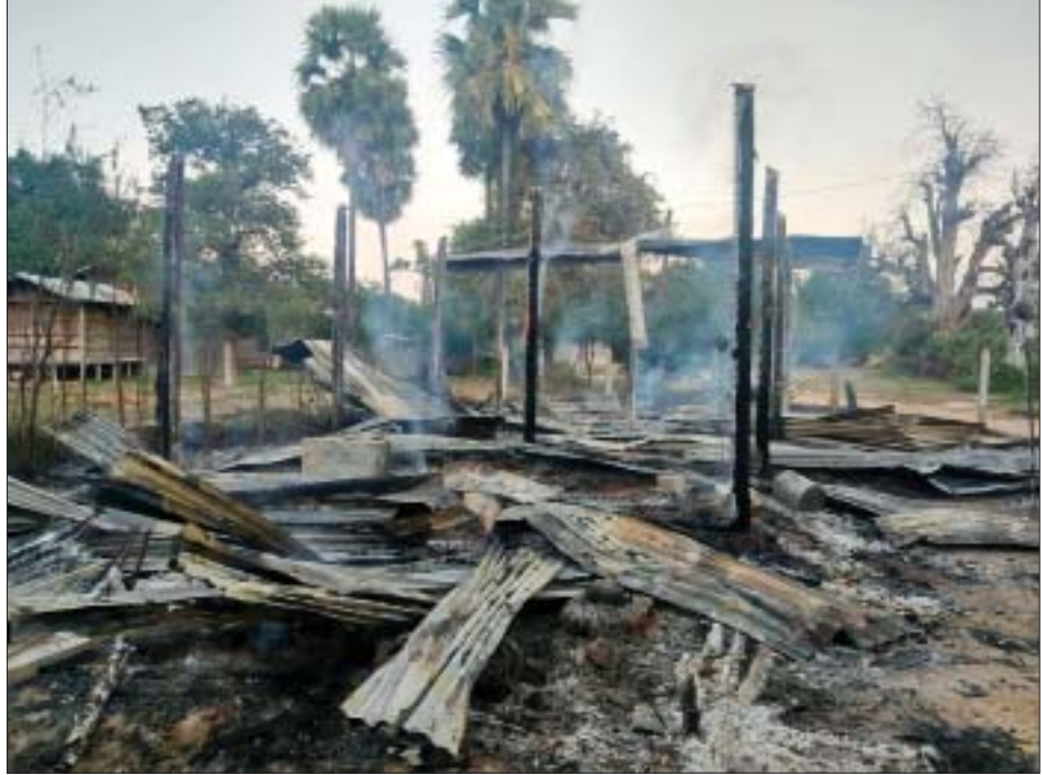
တန့်ဆည်မြို့နယ်၌ PDF အကြမ်းဖက်လက်နက်ကိုင်အဖွဲ့က နေအိမ်များအား မီးရှို့သည့် မှတ်တမ်းဓာတ်ပုံ။