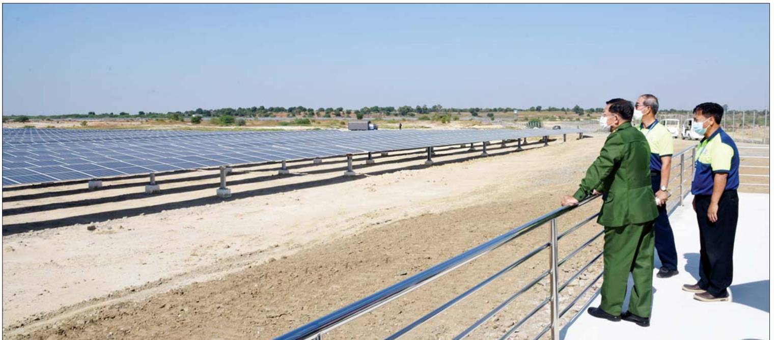
နိုင်ငံတော်စီမံအုပ်ချုပ်ရေးကောင်စီဥက္ကဋ္ဌ၊ နိုင်ငံတော်ဝန်ကြီးချုပ် ဗိုလ်ချုပ်မှူးကြီး မင်းအောင်လှိုင် မဂ္ဂါဝပ် ၃၀ သပြေဝနေရောင်ခြည်စွမ်းအင်သုံး ဓာတ်အားပေးစက်ရုံစီမံကိန်းကို ကြည့်ရှုစစ်ဆေးစဉ်။

နိုင်ငံတော်စီမံအုပ်ချုပ်ရေးကောင်စီဥက္ကဋ္ဌ၊ နိုင်ငံတော်ဝန်ကြီးချုပ် ဗိုလ်ချုပ်မှူးကြီး မင်းအောင်လှိုင်သည် ကောင်စီအဖွဲ့ဝင်များ ဖြစ်ကြသည့် ဗိုလ်ချုပ်ကြီးတင်အောင်စန်း၊ ဗိုလ်ချုပ်ကြီးမောင်မောင်ကျော်၊ ဒုတိယဗိုလ်ချုပ်ကြီးမိုးမြင့်ထွန်း၊ ကောင်စီတွဲဖက်အတွင်းရေးမှူး ဒုတိယဗိုလ်ချုပ်ကြီး ရဲဝင်းဦး၊ ပြည်ထောင်စုဝန်ကြီးများဖြစ်ကြသည့် ဦးအောင်သန်းဦး၊ ဒေါက်တာချာလီသန်း၊ ဦးခင်ရီ၊ ကာကွယ်ရေးဦးစီးချုပ်ရုံးမှ တပ်မတော်အရာရှိကြီးများနှင့် အလယ်ပိုင်းတိုင်းစစ်ဌာနချုပ်တိုင်းမှူး ဗိုလ်ချုပ်ကိုကိုဦးတို့ လိုက်ပါပြီး ယနေ့နံနက်ပိုင်းတွင် မန္တလေးတိုင်းဒေသကြီး မိတ္ထီလာခရိုင် သာစည်မြို့နယ် သပြေဝကျေးရွာရှိ Clean Power Energy Co., Ltd. မှ အကောင်အထည်ဖော်ဆောင်ရွက်လျက်ရှိသည့် မဂ္ဂါဝပ် ၃၀ သပြေဝနေရောင်ခြည်စွမ်းအင်သုံး ဓာတ်အားပေးစက်ရုံ စီမံကိန်းသို့ သွားရောက်ကြည့်ရှုစစ်ဆေးသည်။