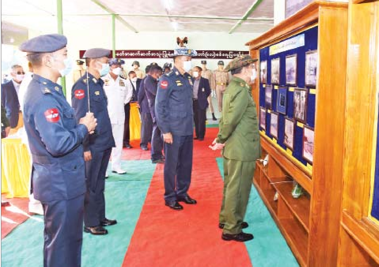
နိုင်ငံတော်စီမံအုပ်ချုပ်ရေးကောင်စီဥက္ကဋ္ဌ၊ တပ်မတော်ကာကွယ်ရေးဦးစီးချုပ် ဗိုလ်ချုပ်မှူးကြီးမင်းအောင်လှိုင်နှင့်အဖွဲ့ မိတ္ထီလာတပ်နယ်ရှိ လေကြောင်းအတတ်သင် လေတပ်စခန်းဌာနချုပ်၌ ပြသထားသည့် (၇၄)နှစ်မြောက် တပ်မတော်(လေ)နှစ်ပတ်လည်နေ့အထိမ်းအမှတ် ပြခန်းများအား ကြည့်ရှုကြစဉ်။

နေပြည်တော် ဒီဇင်ဘာ ၁၄ နိုင်ငံတော်စီမံအုပ်ချုပ်ရေးကောင်စီဥက္ကဋ္ဌ၊ တပ်မတော် ကာကွယ်ရေးဦးစီးချုပ် ဗိုလ်ချုပ်မှူးကြီးမင်းအောင်လှိုင်သည် ဇနီး ဒေါ်ကြူကြူလှ၊ ကာကွယ်ရေးဦးစီးချုပ် (ရေ) ဗိုလ်ချုပ်ကြီးမိုးအောင်နှင့် ဇနီး၊ ကာကွယ်ရေးဦးစီးချုပ်(လေ) ဗိုလ်ချုပ်ကြီး မောင်မောင်ကျော်နှင့်ဇနီး၊ ပြည်ထောင်စု ဝန်ကြီးများ၊ အငြိမ်းစားကာကွယ်ရေး ဦးစီးချုပ်(လေ)များနှင့် ဇနီးများ၊ ကာကွယ် ရေးဦးစီးချုပ်ရုံးမှ တပ်မတော်အရာရှိကြီး များနှင့် ဇနီးများ၊ အလယ်ပိုင်းတိုင်းစစ် ဌာနချုပ် တိုင်းမှူးတို့ လိုက်ပါပြီး ယနေ့ နံနက်ပိုင်းတွင် မိတ္ထီလာတပ်နယ်ရှိ လေကြောင်းအတတ်သင်လေတပ်စခန်း ဌာနချုပ်၌ ပြသထားသည့် (၇၄)နှစ်မြောက် တပ်မတော်(လေ) နှစ်ပတ်လည်နေ့ အထိမ်းအမှတ်ပြခန်းများအား ကြည့်ရှု သည်။