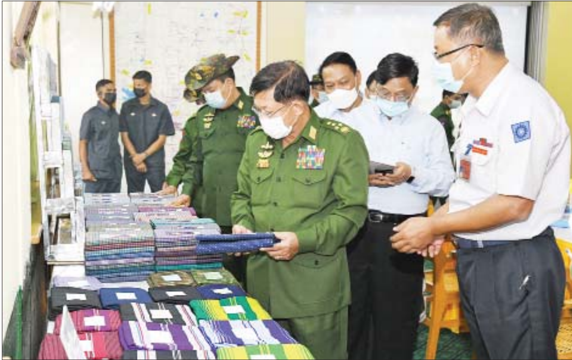
နိုင်ငံတော်စီမံအုပ်ချုပ်ရေးကောင်စီဥက္ကဋ္ဌ၊ တပ်မတော်ကာကွယ်ရေးဦးစီးချုပ် ဗိုလ်ချုပ်မှူးကြီး မင်းအောင်လှိုင် စက်ရုံမှထုတ်လုပ်ထားသည့် ချည်ချောလုံချည်များကို ကြည့်ရှုစစ်ဆေးစဉ်။

ထို့နောက် စက်ရုံမှူး ဦးနိုင်လင်းက စက်ရုံသမိုင်းအကျဉ်း၊ စက်ရုံလုပ်ငန်းဆောင်ရွက်နေမှုအခြေအနေ၊ စက်ရုံမှ ချည်မျှင်နှင့်အထည်များ ထုတ်လုပ်နိုင်မှုအခြေအနေ၊ ဝန်ထမ်းများတာဝန်ထမ်းဆောင်နေမှုအခြေအနေများကို ရှင်းလင်းတင်ပြသည်။