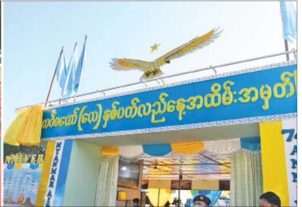
နိုင်ငံတော်စီမံအုပ်ချုပ်ရေးကောင်စီဥက္ကဋ္ဌ၊ တပ်မတော်ကာကွယ်ရေးဦးစီးချုပ် ဗိုလ်ချုပ်မှူးကြီးမင်းအောင်လှိုင် (၇၄) နှစ်မြောက် တပ်မတော်(လေ) နှစ်ပတ်လည်နေ့ အထိမ်းအမှတ်ပြခန်းနှင့် အမှတ်တရ ပစ္စည်းအရောင်းဆိုင်များ ဖွင့်ပွဲအခမ်းအနားအား စက်ခလုတ်နှိပ်ဖွင့်လှစ်ပေးစဉ်။

ရှေးဦးစွာ တပ်မတော်(လေ) နှစ်ပတ်လည်နေ့ အထိမ်းအမှတ်ပြခန်းအတွင်း ပြသထားသည့် လေကြောင်းသမိုင်းမှတ်တမ်းများ၊ ခေတ်အဆက်ဆက် အသုံးပြုခဲ့သည့် တပ်မတော်(လေ) ဝတ်စုံများ၊ တပ်မတော်(လေ) သမိုင်းမှတ်တမ်းဓာတ်ပုံများ၊ ကာကွယ်ရေးဦးစီးချုပ်(လေ) တာဝန်ထမ်းဆောင်ခဲ့သူများ၏ မှတ်တမ်းဓာတ်ပုံများ၊ မိုင်းယန်း၊ မဲသေ၊ စီစီစီတပ်စခန်းတိုက်ပွဲများတွင် တပ်မတော်(လေ)မှ ပါဝင်ဆောင်ရွက်ခဲ့သော မှတ်တမ်းဓာတ်ပုံများ၊ တပ်မတော်(လေ)မှ စွမ်းရည်တုံ့တံဆိပ်ရရှိခဲ့သူများ၏ မှတ်တမ်းဓာတ်ပုံများ၊ လေယာဉ်၊ ရဟတ်ယာဉ်များ၊ တပ်တော်ဝင်အခမ်းအနား မှတ်တမ်းဓာတ်ပုံများ၊ တပ်မတော်(လေ)