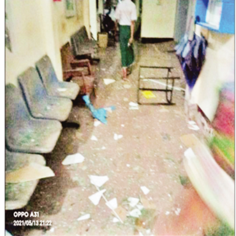
၁၃-၅-၂၀၂၁ ရက်တွင် လှိုင်းဘွဲ့မြို့ ပြည်သူ့ဆေးရုံ၌ အသံဖုံးတစ်လုံး ပေါက်ကွဲမှု။