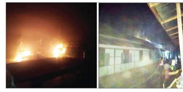
၁၂-၂-၂၀၂၁ ရက်တွင် ဧရာဝတီတိုင်းဒေသကြီး မြန်အောင် မြို့နယ်၌ အခြေခံပညာအထက်တန်းကျောင်းအား ဆူပူ အကြမ်းဖက်သူများက မီးရှို့ဖျက်ဆီးမှု။