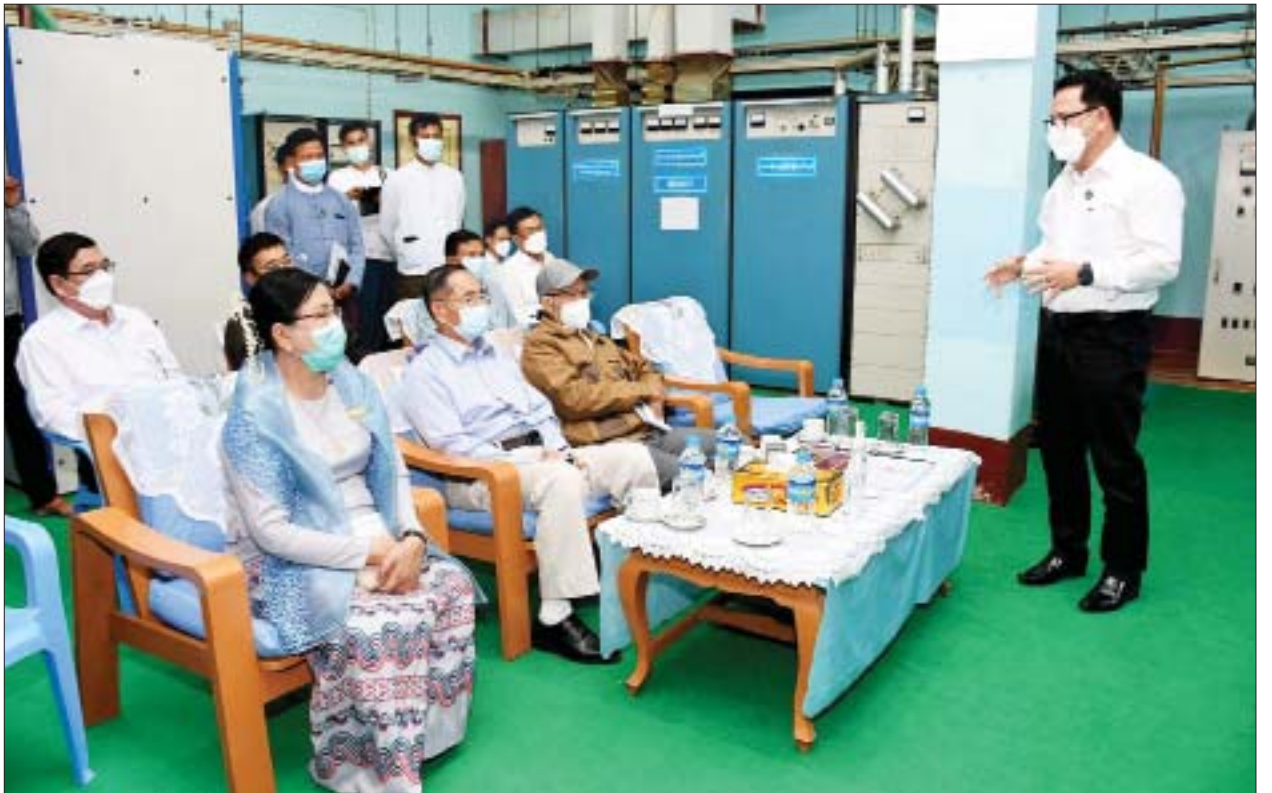
နိုင်ငံတော်စီမံအုပ်ချုပ်ရေးကောင်စီဝင်များအား ပြည်ထောင်စုဝန်ကြီး ဦးမောင်မောင်အုန်းက မြန်မာ့အသံနှင့် ရုပ်မြင်သံကြားထပ်ဆင့်လွှင့် စက်ရုံ၌ ရုပ်သံထုတ်လွှင့်နေမှုအခြေအနေများကို ရှင်းလင်းတင်ပြစဉ်။

ဆက်လက်၍ မြန်မာ့အသံနှင့် ရုပ်မြင်သံကြား ထပ်ဆင့်လွှင့်စက်ရုံသို့ ရောက်ရှိရာ ညွှန်ကြားရေးမှူးချုပ် ဦးရဲနိုင်နှင့် တာဝန်ရှိသူများ က ရခိုင်ပြည်နယ်အတွင်း ရုပ်မြင်သံကြား လွှမ်းခြုံထုတ်လွှင့်နိုင်ရေး အခြေအနေများကို လည်းကောင်း၊ ပြည်ထောင်စုဝန်ကြီး ဦးမောင်မောင်အုန်းက အများပြည်သူဝန်ဆောင်မှုမီဒီယာပုံစံဖြင့် ပြုပြင် ပြောင်းလဲထုတ်လွှင့်နေမှု အခြေအနေများကို လည်းကောင်း ရှင်းလင်း တင်ပြကြသည်။ ထို့နောက် စက်ရုံအတွင်း လှည့်လည်ကြည့်ရှုစစ်ဆေးကာ