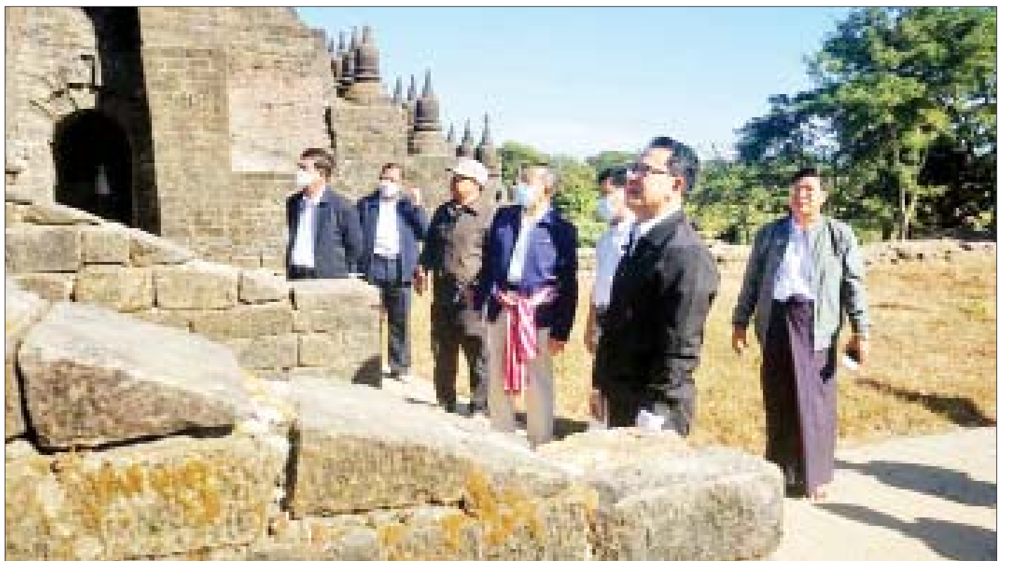
နိုင်ငံတော်စီမံအုပ်ချုပ်ရေးကောင်စီအဖွဲ့ဝင်များနှင့်အဖွဲ့ မြောက်ဦးမြို့ရှိ ကိုးသောင်းဘုရားတွင် ကြည့်ရှုလေ့လာစဉ်။

ထို့နောက် စန္ဒသူရိယစက္ကမင်း ပူဇော်ခဲ့သော