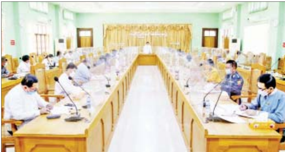
အခမ်းအနား အောင်မြင်စွာကျင်းပနိုင်ရေး ဆွေးနွေး ဆွေးနွေးတင်ပြခဲ့ကြပြီး ပြည်နယ်ဝန်ကြီးချုပ်က တင်ပြကြကာ ကရင်နှစ်သစ်ကူးနေ့အခမ်းအနား လိုအပ်သည်များကို ပေါင်းစပ်ညှိနှိုင်းဆောင်ရွက်ပေး ကျင်းပနိုင်ရေး သက်ဆိုင်ရာကော်မတီအလိုက် ခွဲသည်။ စောမျိုးမင်းသိန်း(ပြန်/ဆက်)

ကျင်းပသည့် ကရင်နှစ်သစ်ကူးနေ့အခမ်းအနားကို ကရင်တိုင်းရင်းသားတို့၏ ရိုးရာယဉ်ကျေးမှု ဓလေ့ ထုံးတမ်းအစဉ်အလာများအတိုင်း ကိုဗစ်-၁၉ ရောဂါ ဆိုင်ရာ စည်းကမ်းသတ်မှတ်ချက်များနှင့်အညီ စနစ် တကျဖြင့် အနှစ်သာရပြည့်ဝစွာ ကျင်းပသွားမည် ဖြစ်ကြောင်း၊ ကရင်အမျိုးသားအလံတင်အခမ်းအနား၊ ကရင်နှစ်သစ်ကူးနေ့အခမ်းအနား၊ ဖိဗူးယော် ကောက်သစ်စားပွဲနှင့် ပျော်ပွဲရွှင်ပွဲများကို ထည့်သွင်း ကျင်းပသွားမည်ဖြစ်ကြောင်း သိရသည်။ အစည်းအဝေးတွင် ကရင်နှစ်သစ်ကူးနေ့ကျင်းပရေး စီမံခန့်ခွဲမှုကော်မတီဥက္ကဋ္ဌ ကရင်ပြည်နယ်ဝန်ကြီးချုပ် ဦးစောမြင့်ဦးက အဖွင့်အမှာစကားပြောကြားပြီး ပြည်နယ်ဝန်ကြီးများက ကရင်နှစ်သစ်ကူးနေ့