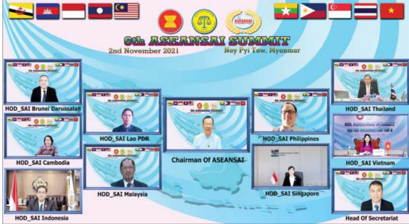
ASEANSAI အဖွဲ့ဝင် ၁၀ နိုင်ငံနှင့် အတွင်းရေးမှူးရုံးမှအကြီးအကဲများ (၆)ကြိမ်မြောက် ASEANSAI ထိပ်သီးအစည်းအဝေးကို ဗီဒီယိုကွန်ဖရင့်ဖြင့် ကျင်းပစဉ်။

ASEANSAI ၏ အထူးလုပ်ငန်းတာဝန်များကို ထမ်းဆောင်နိုင်ရန် စုံညီအစည်းအဝေးမှ ဆုံးဖြတ် ချက်ဖြင့် ကော်မတီများကိုဖွဲ့စည်းပြီး ကော်မတီ တစ်ခုတွင် အနည်းဆုံးအဖွဲ့ဝင် သုံးနိုင်ပါဝင်ရပါ သည်။ ကော်မတီ (၄) ရပ်ဖွဲ့စည်းထားပြီး အဖွဲ့၏ မဟာဗျူဟာကို ရေးဆွဲပြင်ဆင်နိုင်ရန် မဟာဗျူဟာ ရေးဆွဲရေးကော်မတီ၊ စည်းမျဉ်းနှင့် လုပ်ထုံး လုပ်နည်းများကို အချိန်နှင့်တစ်ပြေးညီ ရေးဆွဲ ပြင်ဆင်နိုင်ရန် စည်းမျဉ်းနှင့် လုပ်ထုံးလုပ်နည်းများ ဆိုင်ရာကော်မတီ၊ အသိပညာမျှဝေရေး အစီအစဉ် များ ရေးဆွဲအကောင်အထည်ဖော်နိုင်ရန် အသိ ပညာမျှဝေရေးကော်မတီ၊ သင်တန်းပို့ချရေး အစီအစဉ်များ ရေးဆွဲအကောင်အထည်ဖော်နိုင်ရန် သင်တန်းပို့ချရေးကော်မတီတို့ကို ဖွဲ့စည်းထားပါ သည်။ ဗီယက်နမ်၊ စင်ကာပူ၊ မလေးရှားနှင့် ဖိလစ်ပိုင်နိုင်ငံတို့၏ စာရင်းစစ်ချုပ်ရုံးများက ကော်မတီဥက္ကဋ္ဌများအဖြစ် အသီးသီးတာဝန်ယူ ဆောင်ရွက်လျက်ရှိပါသည်။ စာမျက်နှာ ၁၁ သို့