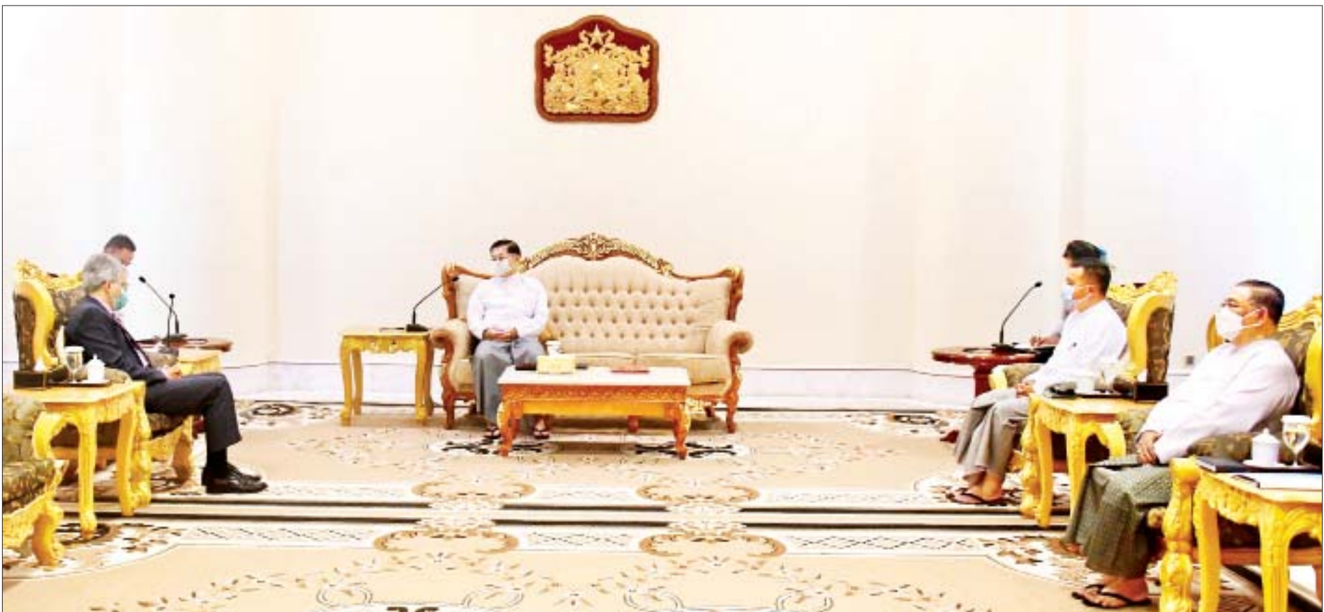
နိုင်ငံတော်စီမံအုပ်ချုပ်ရေးကောင်စီဥက္ကဋ္ဌ၊ နိုင်ငံတော်ဝန်ကြီးချုပ် ဗိုလ်ချုပ်မှူးကြီး မင်းအောင်လှိုင် မြန်မာနိုင်ငံဆိုင်ရာ အိန္ဒိယနိုင်ငံသံအမတ်ကြီး H.E. Mr. Saurabh Kumar အား လက်ခံတွေ့ဆုံစဉ်။