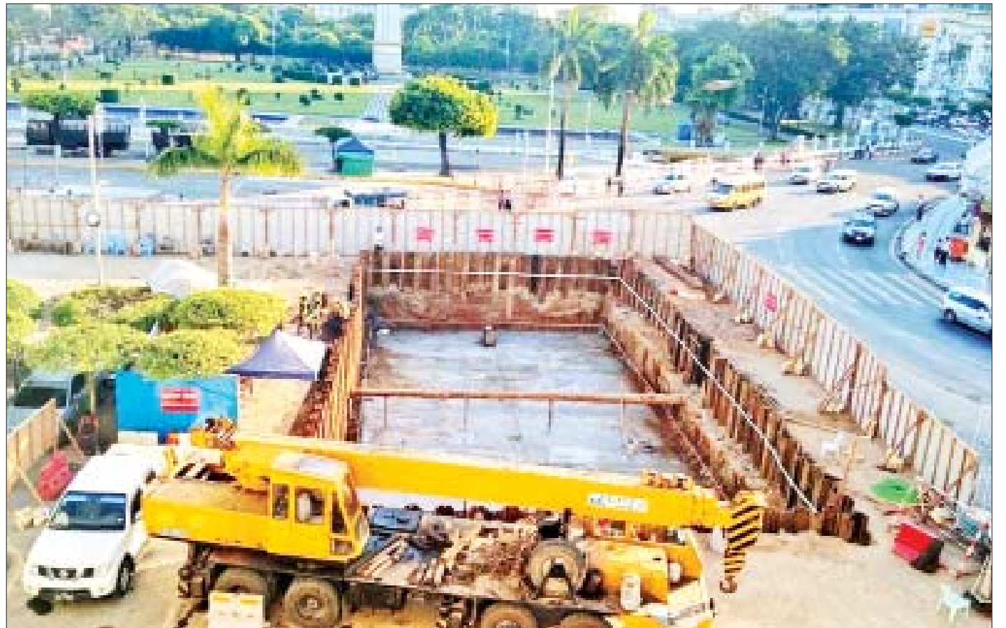
ရေဂါလန်တစ်သိန်းဆုံရေစုကန် တည်ဆောက်နေမှုကို တွေ့ရစဉ်။

“အဓိကတော့ ဆူးလေဘုရားလမ်းတစ်ဝိုက်နဲ့ မဟာဗန္ဓုလလမ်းတစ်လျှောက် အပါအဝင် မြို့တော်ခန်းမဝန်းကျင်မှာ မိုးတွင်းကာလ နှစ်စဉ်နှစ်တိုင်း ရေကြီး ရေလျှံမှုတွေ ဖြစ်ပေါ်နေတာမို့ မိုးတွင်းကာလ ရေကြီးရေလျှံဖြစ်ပေါ်နေမှုကို ဒီရေစုကန်မှာစုပြီး မိုးတိတ်သွားတဲ့အချိန်မှာ ပန်နဲ့စုပ်ထုတ်ဖို့အတွက် ရေဂါလန် တစ်သိန်းဆုံ ရေစုကန်တည်ဆောက်နေတာပဲ ဖြစ်ပါတယ်။ အချိန်ကြာမိုးရွာသွန်း နေရင်လည်း ပန်နဲ့စုပ်ထုတ်မှာဖြစ်သလို စာမျက်နှာ ၁၅ ကော်လံ ၁ သို့ ၂