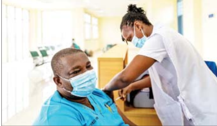
ကိုဗစ်-၁၉ ရောဂါ ကူးစက်ခံရမှုဒုတိယ ရောဂါကူးစက်ခံရမှု အနည်းဆုံးဒေသဖြစ် ကြောင်း သိရသည်။ ကိုးကား - ဆင်ဟွာ ဘာသာပြန် - အလင်းသစ်

ပေါင်း ၁၁ နိုင်ငံတွင် အိုမီခရွန်ဗီဇပြောင်း ပိုင်းရပ်စ်ကူးစက်မှုများ ဖြစ်ပွားလျက်ရှိ ကြောင်း သိရသည်။ အာဖရိကနိုင်ငံများ သည် ကိုဗစ်-၁၉ ရောဂါ ကာကွယ်ဆေး အလုံးရေ ၂၄၅ သန်း ဝယ်ယူထားပြီး အာဖရိကတိုက် လူဦးရေစုစုပေါင်း၏ ၇ ဒသမ ၃၅ ရာခိုင်နှုန်းခန့်သည် ကိုဗစ်-၁၉ ရောဂါ ကာကွယ်ဆေးနှစ်ကြိမ်ထိုးနှံမှု ခံယူပြီးဖြစ်ကြောင်း သိရသည်။ အာဖရိကတိုက်၌ အာဖရိကတောင် ပိုင်းဒေသသည် ကိုဗစ်-၁၉ ရောဂါကူးစက် ခံရမှုအများဆုံးဒေသဖြစ်ပြီး အာဖရိက မြောက်ပိုင်းနှင့် အရှေ့ပိုင်းဒေသများသည်