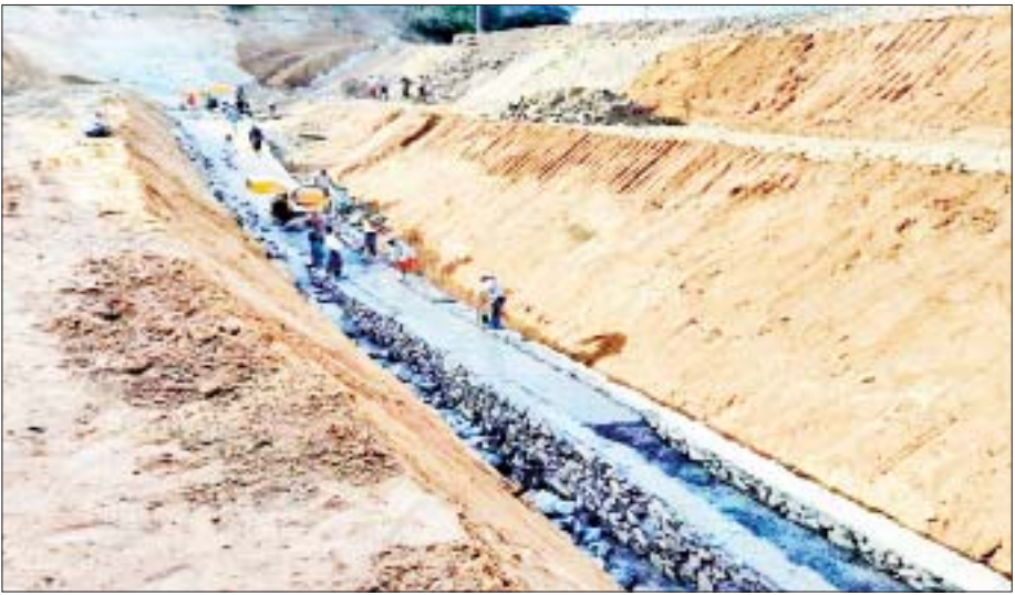
ဝါခင်းကြီးချောင်းမြေအောက်တံမံ တည်ဆောက်ဆဲကာလတွင် ကျောက်ကြီးစီကွန်ကရစ်လောင်းခြင်းလုပ်ငန်း ဆောင်ရွက်နေမှုကို တွေ့ရစဉ်။

ညောင်ဦးမြို့နယ်သည် အပူပိုင်းဇုန်တွင် ပါဝင်သောမြို့နယ်ဖြစ်၍ ပူပြင်းခြောက်သွေ့ကာ ရေရှားပါးလျက်ရှိပြီး ဧရာဝတီမြစ်ရေကို လျှပ်စစ်ရေတင်စနစ် အဆင့်ဆင့်ဖြင့် ကျေးရွာများသို့ ရေဖြန့်ဝေပေးနေသော်လည်း ကျေးရွာများပြားလှသဖြင့် ရေလုံလောက်မှု အလွန်နည်းပါးနေသော မြို့နယ်နေလေသည်။ ထိုကျေးရွာများအား ပညာရှင်တို့ အဖြေရှာနေရသည်။