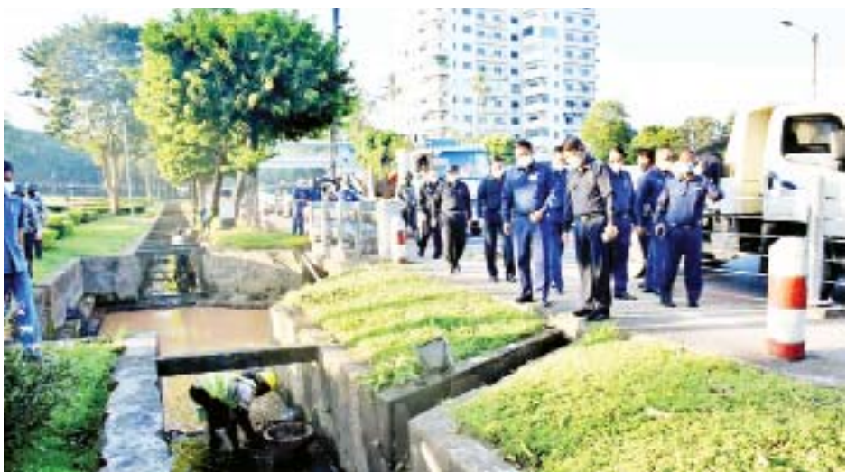
အလျား ပေ ၇၀ ၊ အနံ ၃၃ ပေ အနက် ၇ ပေရှိ ရေဂါလန် ကြည့်ရှုစစ်ဆေးပြီး လိုအပ်သည်များမှာကြား တစ်သိန်းခွဲရေစုကန် တည်ဆောက်နေမှုလုပ်ငန်းကို ဆောင်ရွက်ပေးသည်။ သတင်းစဉ်

ထိုမှတစ်ဆင့်မြို့တော်ဝန်သည် အင်ဂျင်နီယာဌာန (ရေစီးရေလာစီမံခန့်ခွဲမှု) မြို့ပြပတ်ဝန်းကျင် ထိန်းသိမ်းရေးနှင့် သန့်ရှင်းရေးဌာနနှင့် ပန်းဥယျာဉ် နှင့်အားကစားကွင်းများဌာနများမှအင်းလျားကန်ပေါင် စိမ်းလန်းစိုပြည်ရေးနှင့် သန့်ရှင်းသာယာသပ်ရပ်ရေး လုပ်ငန်းများ ဆောင်ရွက်ထားရှိမှု၊ အင်းလျားရေ မြောင်းနှင့် ကမာရွတ်ချောင်းအတွင်း ရေစီးရေလာ ကောင်းမွန်စေရန် အမှုကော်မတီ၊ သဲမြေများကို Excavator ယန္တရားယာဉ်ဖြင့် ဆယ်ယူရှင်းလင်း ဆောင်ရွက်နေမှုနှင့် လူသွားစင်္ကြံဘေး မြက်ပင်များ ရှင်းလင်းနေမှုတို့ကို ကြည့်ရှုစစ်ဆေးသည်။ ထို့နောက် ကျောက်တံတားမြို့နယ် မဟာဗန္ဓုလ လမ်း ရန်ကုန်မြို့တော်ခန်းမအတွင်း အင်ဂျင်နီယာ ဌာန (ရေစီးရေလာစီမံခန့်ခွဲမှု)မှ ဆောင်ရွက်နေသော