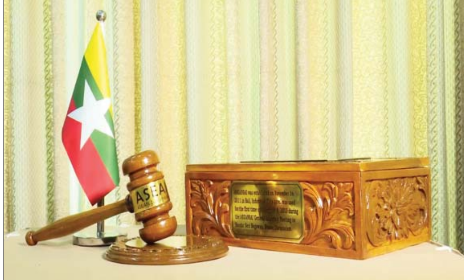
ASEANSAI အထိမ်းအမှတ်ပစ္စည်းဖြစ်သော “တူ”နှင့် “သေတ္တာ”ကို တွေ့ရစဉ်။

လုပ်ငန်းတာဝန်များ (Functions) ASEANSAI ၏ လုပ်ငန်းတာဝန်များမှာ နိုင်ငံပိုင် ကဏ္ဍ စာရင်းစစ်ဆေးခြင်းနယ်ပယ်တွင် အကောင်း ဆုံးအလေ့အထများ၊ စံများနှင့် နည်းပညာများအတွက် အချက်အလက်များကို Data bank ဖြင့် ထိန်းသိမ်း ထားရန်၊ နိုင်ငံပိုင်ကဏ္ဍ စာရင်းစစ်ဆေးခြင်းနယ်ပယ် တွင် အသိပညာနှင့် ဗဟုသုတများဖလှယ်ခြင်းဆိုင်ရာ