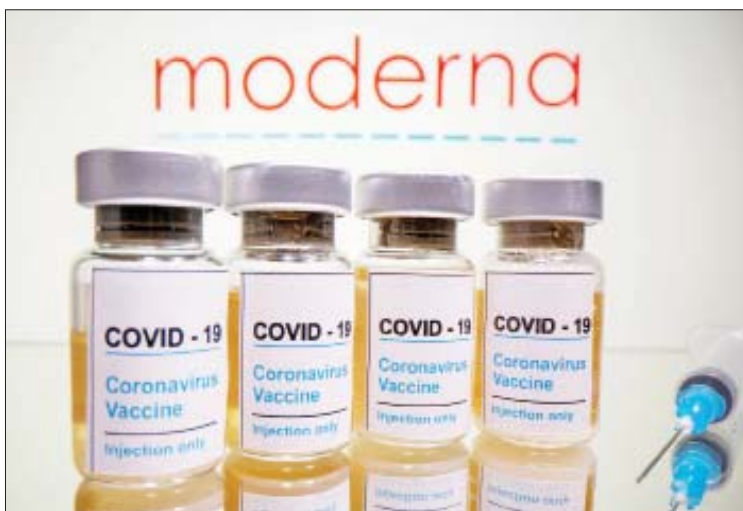
အပိုဆောင်းထိုးနှံမှု ခံယူနိုင်ရေးအတွက် ဂျပန်နိုင်ငံ၌ အပိုဆောင်းထိုးနှံမှု ခံယူနိုင်ရေးအတွက် ဖြန့်ဖြူးပေးရန် ကျန်းမာရေးဝန်ကြီးဌာနက ဒေသန္တရတာဝန်ရှိသူများအား ညွှန်ကြားထားသည်။ ကိုးကား - အင်န်အိတ်ချီကော ဘာသာပြန် - စိုးသူရ

ဆောင်ရွက်သွားမည် ဖြစ်ကြောင်း ကျန်းမာရေးဝန်ကြီးဌာနက ပြောကြား သည်။ Pfizer ကိုဗစ်-၁၉ ရောဂါ ကာကွယ်ဆေးဖြင့် ကာကွယ်ဆေးနှစ်ကြိမ် ထိုးနှံပြီးစီးသူများသည်လည်း Moderna ကိုဗစ်-၁၉ ရောဂါ ကာကွယ်ဆေးဖြင့် အပိုဆောင်းထိုးနှံမှု ခံယူနိုင်ကြောင်း သိရသည်။ ဂျပန်နိုင်ငံ၌ ယခုလအစောပိုင်း တွင် ကျန်းမာရေးဝန်ထမ်းများအား Pfizer ကိုဗစ်-၁၉ ရောဂါကာကွယ်ဆေးဖြင့် ကိုဗစ်-၁၉ ရောဂါ ကာကွယ်ဆေးအပို ဆောင်းထိုးနှံပေးခဲ့ကြောင်း သိရသည်။ Moderna ကိုဗစ်-၁၉ ရောဂါ ကာကွယ် ဆေးများအား နိုင်ငံအတွင်းရှိ ဒေသ ဆိုင်ရာ ကျန်းမာရေးဝန်ထမ်းများ