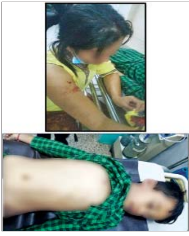
ဒီဇင်ဘာ ၉ ရက်တွင် တောင်ဥက္ကလာပမြို့နယ် ရဲတပ်ဖွဲ့စခန်း ဝင်းအား ၄၀ မမ ဖုံးသီးဖြင့် ပစ်ခတ်ခံရမှုကြောင့် သေဆုံးဒဏ်ရာရရှိခဲ့မှု မှတ်တမ်းဓာတ်ပုံ။