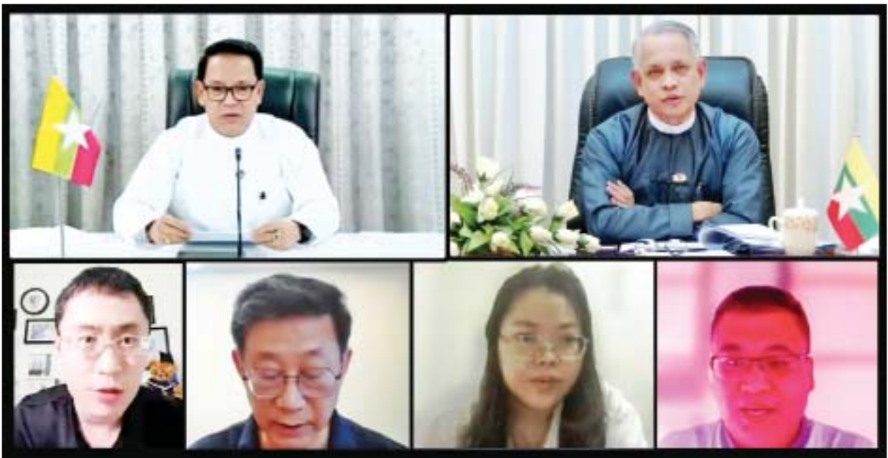
ပြည်ထောင်စုဝန်ကြီး ဦးမောင်မောင်အုန်းနှင့် ဦးအောင်နိုင်ဦးတို့ တရုတ်နိုင်ငံ သတင်းမီဒီယာများမှ သတင်းထောက်များအား အွန်လိုင်းမှ တစ်ဆင့် တွေ့ဆုံပြီး မေးမြန်းချက်များကို ပြန်လည်ဖြေကြားစဉ်။

ရန်ကုန် ဒီဇင်ဘာ ၂၂ ပြန်ကြားရေး ဝန်ကြီးဌာန ပြည်ထောင်စု ဝန်ကြီး ဦးမောင်မောင်အုန်းနှင့် ရင်းနှီး မြှုပ်နှံမှုနှင့် နိုင်ငံခြားစီးပွား ဆက်သွယ်ရေး ဝန်ကြီးဌာန ပြည်ထောင်စု ဝန်ကြီး ဦးအောင်နိုင်ဦးတို့သည် ယနေ့ မွန်းလွဲပိုင်းတွင် တရုတ်ပြည်သူ့ သမ္မတနိုင်ငံမှ သတင်းမီဒီယာ များဖြစ်သည့် CCTV သတင်းဌာန၊ People's Daily သတင်းဌာန၊ Guanming Daily သတင်းဌာနနှင့် Xinhua News Agency တို့မှ သတင်းထောက်များအား အွန်လိုင်း မှတစ်ဆင့် လက်ခံတွေ့ဆုံ၍ နိုင်ငံတော်အစိုးရ၏ ကိုဗစ်-၁၉ ကပ်ရောဂါ ကာကွယ်တိုက်ဖျက် ရေး ဆောင်ရွက်ချက်များ၊ နှစ်နိုင်ငံ နယ်စပ်ကုန်သွယ်ရေး တိုးမြှင့် ဆောင်ရွက်လျက်ရှိသည့် အခြေအနေ၊ နိုင်ငံစီးပွားရေး ပြန်လည် ဦးမော့လာစေရေး အတွက် ဆောင်ရွက်လျက်ရှိသည့် အခြေအနေ၊ နှစ်နိုင်ငံ ပူးပေါင်း ဆောင်ရွက်ရေးနှင့် စီမံကိန်းများ အကောင်အထည်ဖော်ရေးဆိုင်ရာ ကိစ္စရပ်များနှင့် တည်ငြိမ်ရေးနှင့် လုံခြုံ အေးချမ်းရေးအတွက် ဆောင်ရွက်လျက်ရှိသည့် အခြေ အနေများနှင့် စပ်လျဉ်းသည့် မေးမြန်းချက်များကို ဖြေကြား ကြသည်။ တည်ငြိမ်မှုရရှိလာပြီ ရှေးဦးစွာ ပြည်ထောင်စုဝန်ကြီး ဦးမောင်မောင်အုန်းက ကိုဗစ်-