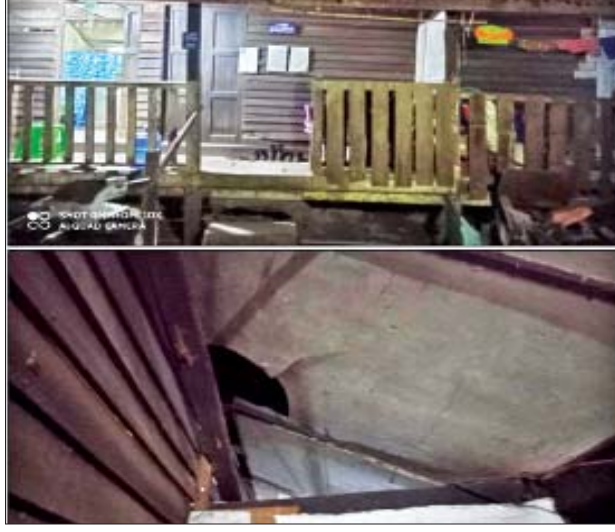
ဒီဇင်ဘာ ၉ ရက်တွင် တောင်ဥက္ကလာပမြို့နယ် ရဲတပ်ဖွဲ့စခန်း ဝင်းအား ၄၀ မမ ဖုံးသီးဖြင့် ပစ်ခတ်ခံရသည့် မှတ်တမ်းဓာတ်ပုံ။