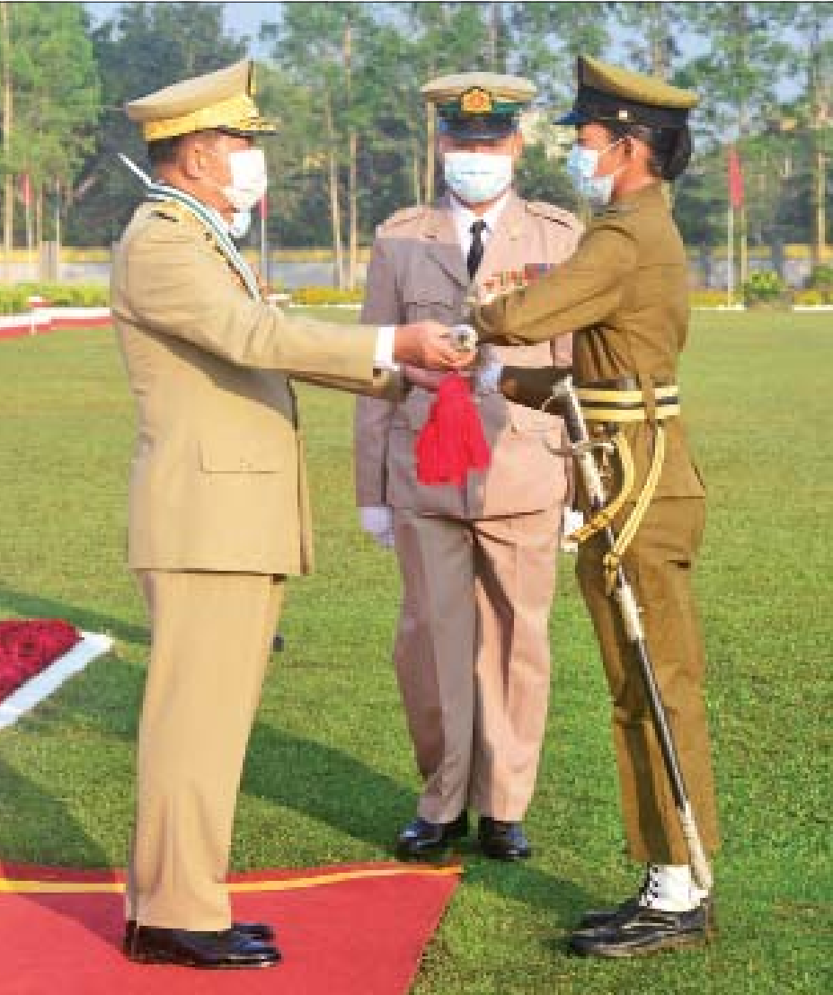
နိုင်ငံတော်စီမံအုပ်ချုပ်ရေးကောင်စီဥက္ကဋ္ဌ၊ တပ်မတော်ကာကွယ်ရေးဦးစီးချုပ် ဗိုလ်ချုပ်မှူးကြီး မဟာသရေစည်သူ မင်းအောင်လှိုင် ဘွဲ့ရအမျိုးသမီးဗိုလ်လောင်းသင်တန်း အမှတ်စဉ်(၈)မှ အကောင်းဆုံး ဗိုလ်လောင်းဆုရရှိသူ ဗိုလ်လောင်း မေသက်နွယ်အား ဆုပေးအပ်ချီးမြှင့်စဉ်။

အခြေခံပြီး တပ်တွင်းစည်းလုံးညီညွတ်ရေးကို ကျစ်လျစ်ခိုင်မာစွာ တည်ဆောက်ထားကြရမည် ဖြစ်ကြောင်း၊ တပ်တွင်းစည်းလုံးညီညွတ်ရေးကို တည်ဆောက်ရာတွင် လေ့ကျင့်ရေး၊ အုပ်ချုပ်ရေး၊ သက်သာချောင်ချိရေး၊ စိတ်ဓာတ်ဟူသည့် တပ်တည်ဆောက်ရေး လုပ်ငန်းကြီး ၄ ရပ်နှင့်အညီ တည်ဆောက်ရမည်ဖြစ်ကြောင်း၊ တပ်မတော်သား တိုင်းကလည်း ရဲဘော်အချင်းချင်းအပေါ် ထားရှိရမည့် မေတ္တာတရား၊ သံယောဇဉ်တရားနှင့် သစ္စာစောင့်သိမှု တရား ဟူသည့် ရဲဘော်စိတ်ကို ထာဝစဉ်မွေးမြူထား ရမည်ဖြစ်ကြောင်း၊ သို့မှသာ ကျစ်လျစ်ခိုင်မာသည့် တပ်တွင်းစည်းလုံးညီညွတ်ရေးကို တည်ဆောက်နိုင် မည်ဖြစ်ကြောင်း။ မိမိတို့ တပ်မတော်သားအားလုံးအတွက်