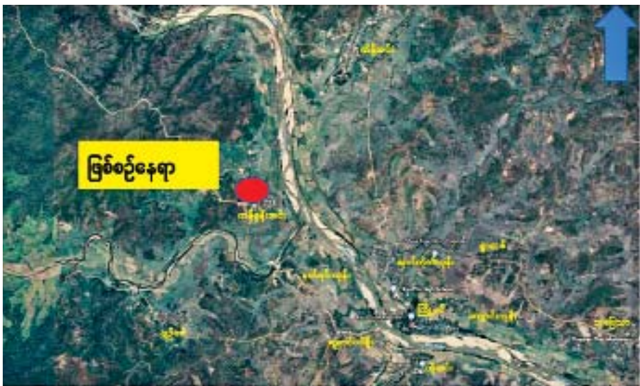
စစ်ကိုင်းတိုင်းဒေသကြီး ကျွန်းလှမြို့နယ် ကန်စွန်းအင်းကျေးရွာအတွင်း အကြမ်းဖက်လုပ်ရပ်များ လုပ်ဆောင်ရန်စုဝေးနေသော အကြမ်းဖက်သမားများအား ဝင်ရောက်ဖမ်းဆီးရမိသည့်နေရာပြပုံ။

နေပြည်တော် ဒီဇင်ဘာ ၂၂ CRPH၊ NUG နှင့် PDF အမည်ခံ အကြမ်းဖက်အဖွဲ့များသည် ပြည်သူ့လူထု အထိတ်တလန့်ဖြစ်စေရန်အတွက် မိုင်းထောင်ဖောက်ခွဲဖျက်ဆီးခြင်း၊ အပြစ်မဲ့ပြည်သူများနှင့် ဆရာတော်၊ သံဃာတော်များပါမကျန် လုပ်ကြံသတ်ဖြတ်ခြင်းများ လုပ်ဆောင်လျက်ရှိသည့်အပြင် အချို့ကျေးရွာများအတွင်း ဝင်ရောက်၍ အကြမ်းဖက်အဖျက်အမှောင့် လုပ်ရပ်များကို လုပ်ဆောင်လျက်ရှိသဖြင့် အများပြည်သူ အေးချမ်းတည်ငြိမ်စွာနေထိုင်နိုင်ရေးအတွက် လုံခြုံရေးတပ်ဖွဲ့ဝင်များက ဒေသခံပြည်သူများနှင့်ပူးပေါင်း၍ လိုအပ်သည့်လုံခြုံရေးလုပ်ငန်းများ ဆောင်ရွက်လျက်ရှိသည်။ အကြမ်းဖက်သမားများစုဝေးရောက်ရှိနေ ထိုသို့ ဆောင်ရွက်လျက်ရှိရာ ယနေ့နံနက်ပိုင်းတွင် စစ်ကိုင်းတိုင်းဒေသကြီး ကျွန်းလှမြို့နယ် ကန်စွန်းအင်းကျေးရွာအတွင်း အကြမ်းဖက်လုပ်ရပ်များ လုပ်ဆောင်ရန်အတွက် KIA အဖွဲ့နှင့် PDF အမည်ခံ အကြမ်းဖက်သမားများ စုဝေးရောက်ရှိနေကြောင်း သတင်းအရ ညနေ ၃ နာရီ မိနစ် ၅၀ ခန့်တွင် သွားရောက်၍ လိုအပ်သည့် လုံခြုံရေးလုပ်ငန်းများ