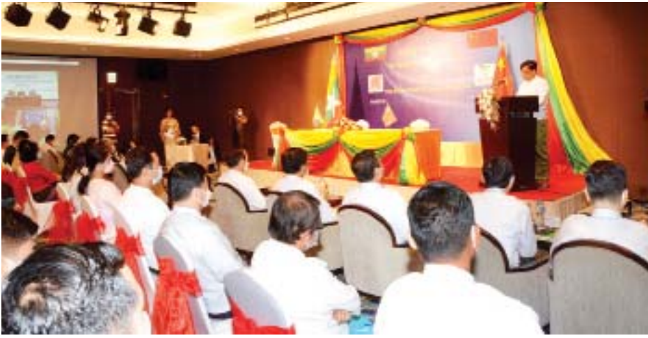
ကိုဗစ်-၁၉ ရောဂါကာကွယ်ဆေး ထုတ်လုပ်ရေး ကြီးကြပ်မှုဗဟိုကော်မတီဥက္ကဋ္ဌ၊ ပြည်ထောင်စု ဝန်ကြီး ဒေါက်တာချာလီသန်း Sinopharm ကိုဗစ်-၁၉ ရောဂါကာကွယ်ဆေး (RTF Bulk) Doses ၁၀ သန်း ဝယ်ယူရေး သဘောတူစာချုပ် လက်မှတ်ရေးထိုးပွဲအခမ်းအနားတွင် အမှာစကားပြောကြားစဉ်။

ကမ္ဘာ့နိုင်ငံအသီးသီးတွင်လည်း ကိုဗစ်-၁၉ ရောဂါကာကွယ်ဆေး ထုတ်လုပ်နိုင်ရေးကို ကြိုးပမ်း ဆောင်ရွက်ကြလျက်ရှိရာ ၂၀၂၁ ခုနှစ်အတွင်း မြန်မာ နိုင်ငံအနေဖြင့် Sinopharm ကိုဗစ်ကာကွယ်ဆေး Doses ၂၆ သန်းဝယ်ယူခဲ့ပြီး ယခုအခါ ထိုးနှံပေးလျက် ရှိပါကြောင်း၊ ကျန်းမာရေးဝန်ကြီးဌာနမှ သတင်း အချက်အလက်များအရ Sinopharm ကိုဗစ်-၁၉ ရောဂါကာကွယ်ဆေးသည် ဘေးထွက်ဆိုးကျိုး