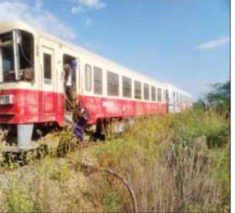
ပေါ်၌ မိုင်းထောင်ဖောက်ခွဲခြင်း၊ ခရီးသည် များအား ဖော်ထုတ်ဖမ်းဆီးရမိနိုင်ရေး များ တင်ဆောင်မောင်းနှင်လာသည့် လုံခြုံရေးတပ်ဖွဲ့ဝင်များက ဆက်လက် မီးရထားတို့အား မိုင်းဆွဲတိုက်ခိုက်ခြင်း ဆောင်ရွက်လျက်ရှိကြောင်း သတင်းရရှိ များ ကျူးလွန်ခဲ့သည့် အကြမ်းဖက်သမား သတင်းစဉ်