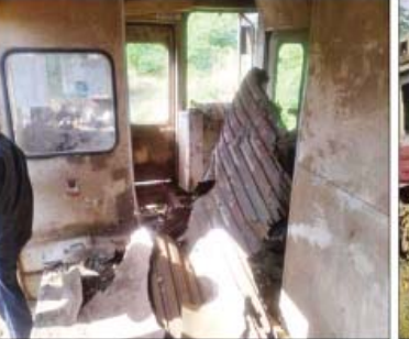
ပခုက္ကူဘူတာမှ ကျွန်းချောင်းဘူတာသို့ ထွက်ခွာလာသည့် အမှတ်(၂)အစုန် ရထားအား ကွန်ပျူတာတက္ကသိုလ်ဘူတာနှင့် ဘဲကြီးဘူတာကြား၌ အကြမ်းဖက်သမားများက မိုင်းဆွဲတိုက်ခိုက်ခဲ့သဖြင့် ထိခိုက်ဒဏ်ရာရရှိခဲ့မှုနှင့် ပျက်စီးခဲ့မှု မှတ်တမ်းဓာတ်ပုံ။

ကြေးနန်းတိုင်အမှတ် (၃၆၁/၁၁-၁၂) ကြားရှိ မိုင်းကျော်တံတားကို အကြမ်းဖက်သူများက လက်လုပ်မိုင်းဖြင့် ဖောက်ခွဲမှုကြောင့် မီးရထားသံလမ်း သစ်သား ဇလီဖားတုံးနှင့် သံလမ်းအဆက်တစ်ခု တို့ပျက်စီးခဲ့ပြီး လုံခြုံရေးတပ်ဖွဲ့ဝင်များ စစ်ဆေးနေစဉ် လက်လုပ်မိုင်းတစ်လုံး ထပ်မံပေါက်ကွဲခဲ့သဖြင့် လုံခြုံရေးတပ်ဖွဲ့ဝင် နှစ်ဦးတွင် မိုင်းစထိမှန်ဒဏ်ရာအနည်းငယ် ရရှိခဲ့ကြောင်း သိရသည်။ အထက်ပါဖြစ်စဉ်များမှ လမ်းပန်းဆက်သွယ်ရေးပြတ်တောက်သွားစေရန် ရည်ရွယ်ချက်ဖြင့် မီးရထားသံလမ်းများ