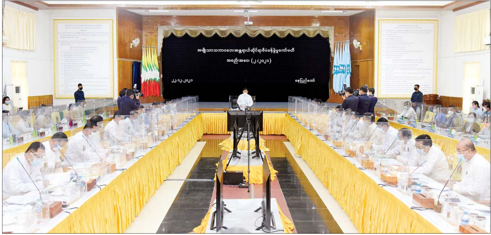
နိုင်ငံတော်စီမံအုပ်ချုပ်ရေးကောင်စီ ဒုတိယဥက္ကဋ္ဌ၊ ဒုတိယဝန်ကြီးချုပ် ဒုတိယဗိုလ်ချုပ်မှူးကြီး စိုးဝင်း အမျိုးသားသဘာဝဘေးအန္တရာယ်ဆိုင်ရာစီမံခန့်ခွဲမှုကော်မတီ အစည်းအဝေး (၂/၂၀၂၁)တွင် အမှာစကားပြောကြားစဉ်။

နေပြည်တော် ဒီဇင်ဘာ ၂၂ အမျိုးသားသဘာဝဘေးအန္တရာယ်ဆိုင်ရာ စီမံခန့်ခွဲမှုကော်မတီ အစည်းအဝေး(၂/၂၀၂၁)ကို ယနေ့ မွန်းလွဲ ၁ နာရီတွင် နေပြည်တော်ရှိ လူမှုဝန်ထမ်း၊ ကယ်ဆယ်ရေးနှင့် ပြန်လည်နေရာချထားရေးဝန်ကြီးဌာန အစည်းအဝေးခန်းမ၌ ကျင်းပရာ အမျိုးသားသဘာဝဘေးအန္တရာယ်ဆိုင်ရာ စီမံခန့်ခွဲမှုကော်မတီဥက္ကဋ္ဌ၊ နိုင်ငံတော်စီမံအုပ်ချုပ်ရေးကောင်စီ ဒုတိယဥက္ကဋ္ဌ၊ ဒုတိယဝန်ကြီးချုပ် ဒုတိယဗိုလ်ချုပ်မှူးကြီး စိုးဝင်း တက်ရောက် အမှာစကားပြောကြားသည်။ အစည်းအဝေးသို့ အမျိုးသားသဘာဝဘေးအန္တရာယ်ဆိုင်ရာ စီမံခန့်ခွဲမှုကော်မတီ ဒုတိယဥက္ကဋ္ဌများ၊ ကော်မတီဝင် ပြည်ထောင်စုဝန်ကြီးများနှင့် တာဝန်ရှိသူများ စာမျက်နှာ ၇ ကော်လံ ၁ သို့ ◆