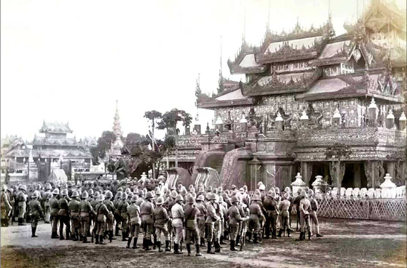
ပါတော်မူစ မန္တလေး၌ ဗြိတိသျှတပ်များကို တွေ့ရစဉ်။

ပထမ အင်္ဂလိပ်-မြန်မာ စစ်ပွဲမှာ အကျအဆုံး များခဲ့ကြပါတယ်။ အင်္ဂလိပ်ဘက်က ဗိုလ်ချုပ် ကင်းဘဲလ်၊ မြန်မာဘက်က မဟာမင်းလှကျော်ထင် တို့ စစ်ပြေငြိမ်းစာချုပ် “a commercial treaty” ကို