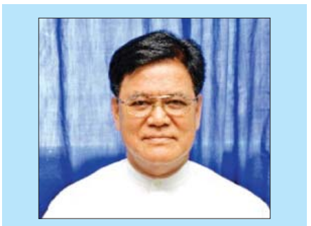
ဆောင်းပါးရှင်၏ ကိုယ်ရေးအကျဉ်း

မင်းတုန်းမင်းတရားကြီး နန်းတက်တဲ့ ၁၈၅၃ ခုနှစ်မှာပဲ ဂျပန်ကျွန်းတွေဆီကို ရေတပ်ဗိုလ်ချုပ် ကိုမိုခို မက်သရူးပယ်ရီ (Commodore Mathew Perry) ဟာ အနက်ရောင်သင်္ဘောကြီးနဲ့ ရောက်ခဲ့ ပါတယ်။ ရှေးယခင်က ဂျပန်နိုင်ငံဟာ ကမ္ဘာနဲ့ ကင်းကွာခဲ့တဲ့ ကျွန်းနိုင်ငံတစ်ခုအဖြစ် ရပ်တည် ခဲ့ပါတယ်။ တစ်နိုင်ငံနဲ့တစ်နိုင်ငံ ကူးလူးဆက်ဆံမှု ကို ထိန်းချုပ်ခဲ့ပါတယ်။ သဘာဝကပေးတဲ့ လက်ဆောင်နဲ့ပဲ ကျေနပ်ရောင့်ရဲတဲ့လူမျိုးဖြစ်ပါ တယ်။ ရှေးက ဂျပန်တို့ရဲ့ပညာရေးဟာ ဆွဲဆောင်မှု ရှိပုံမပေါ်၊ ပညာထက် နည်းပညာတွေ ဖော်ထုတ်သုံးစွဲ