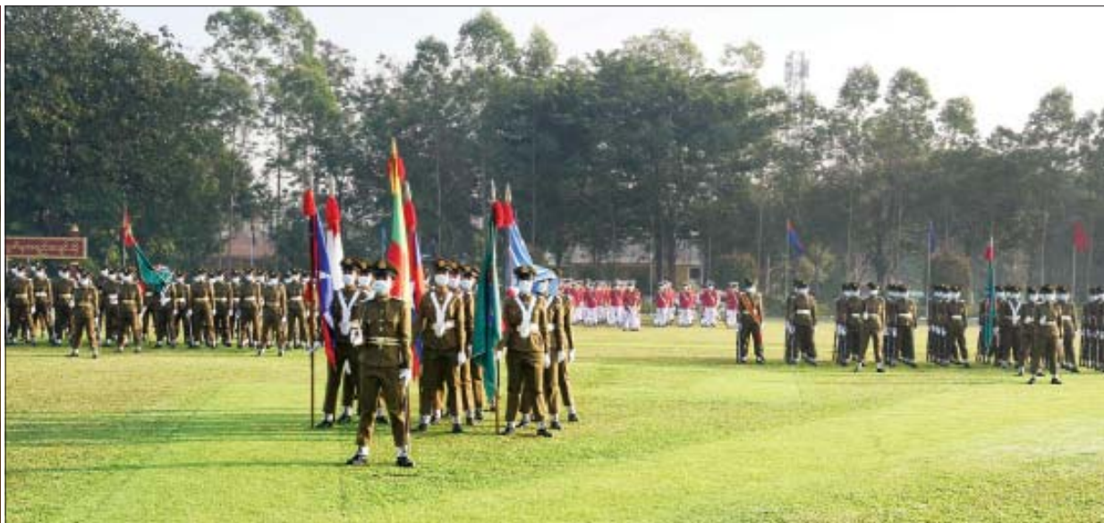
နိုင်ငံတော်စီမံအုပ်ချုပ်ရေးကောင်စီဥက္ကဋ္ဌ၊ တပ်မတော်ကာကွယ်ရေးဦးစီးချုပ် ဗိုလ်ချုပ်မှူးကြီး မဟာသရေစည်သူ မင်းအောင်လှိုင် ဘွဲ့ရအမျိုးသမီးဗိုလ်လောင်းသင်တန်း အမှတ်စဉ်(၈) သင်တန်းဆင်း ဂုဏ်ပြုစစ်ရေးပြအခမ်းအနားတွင် မိန့်ခွန်းပြောကြားစဉ်။

● ရှေ့ဖုံးမှ ဦးစွာ နိုင်ငံတော်စီမံအုပ်ချုပ်ရေးကောင်စီဥက္ကဋ္ဌ၊ တပ်မတော်ကာကွယ်ရေးဦးစီးချုပ် ဗိုလ်ချုပ်မှူးကြီး မဟာသရေစည်သူ မင်းအောင်လှိုင်က ဗိုလ်လောင်း တပ်ခွဲများ၏ အလေးပြုခြင်းကိုခံယူပြီး ကျောင်းဆင်း ဗိုလ်လောင်းတပ်ခွဲအား စစ်ဆေးသည်။ ထို့နောက် ဗိုလ်လောင်းတပ်ခွဲများက တပ်မတော်ကာကွယ်ရေး ဦးစီးချုပ် ဗိုလ်ချုပ်မှူးကြီး မဟာသရေစည်သူ မင်းအောင်လှိုင်အား အနေလျှောက်၊ အမြန်လျှောက် ဖြင့် ချီတက်အလေးပြုကြသည်။ ပေးအပ်ချီးမြှင့် ယင်းနောက် နိုင်ငံတော်စီမံအုပ်ချုပ်ရေးကောင်စီ ဥက္ကဋ္ဌ၊ တပ်မတော်ကာကွယ်ရေးဦးစီးချုပ် ဗိုလ်ချုပ်မှူးကြီး မဟာသရေစည်သူ မင်းအောင်လှိုင် က တပ်မတော်(ကြည်း) ဗိုလ်သင်တန်းကျောင်း (မှော်ဘီ) ဘွဲ့ရအမျိုးသမီး ဗိုလ်လောင်းသင်တန်း အမှတ်စဉ်(၈)မှ အကောင်းဆုံးဗိုလ်လောင်းဆုရရှိသူ ဗိုလ်လောင်း မေသက်နွယ်အား အကောင်းဆုံး