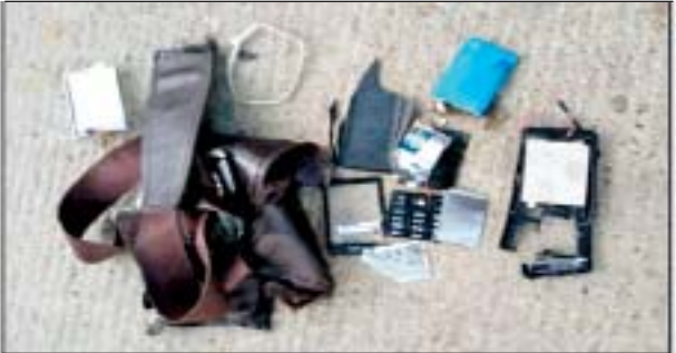
အောက်တိုဘာ ၂၈ ရက်တွင် ဒဂုံမြို့သစ်(မြောက်ပိုင်း)မြို့နယ် မဝတလမ်းဆုံအနီး၌ လက်လုပ်ပုံးတွေ့ရှိမှု မှတ်တမ်းဓာတ်ပုံ။