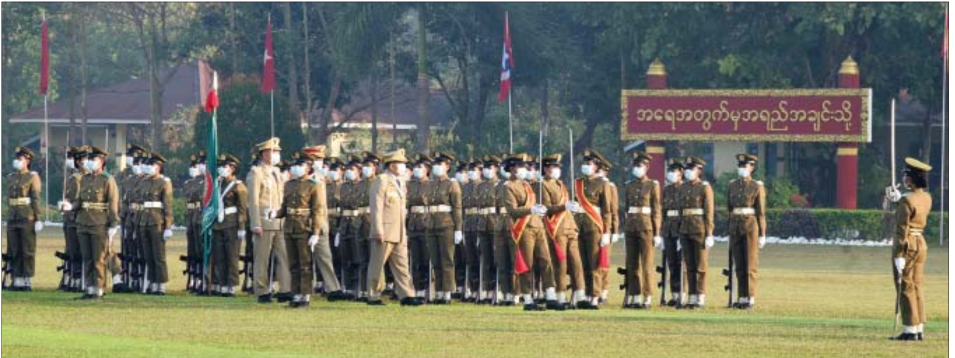
နိုင်ငံတော်စီမံအုပ်ချုပ်ရေးကောင်စီဥက္ကဋ္ဌ၊ တပ်မတော်ကာကွယ်ရေးဦးစီးချုပ် ဗိုလ်ချုပ်မှူးကြီး မဟာသရေစည်သူ မင်းအောင်လှိုင် ဘွဲ့ရအမျိုးသမီးဗိုလ်လောင်းသင်တန်း အမှတ်စဉ်(၈) သင်တန်းဆင်း ဂုဏ်ပြုစစ်ရေးပြအခမ်းအနားတွင် ဗိုလ်လောင်းတပ်ခွဲအား စစ်ဆေးစဉ်။