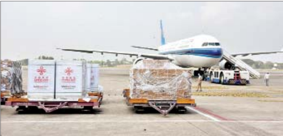
တရုတ်ပြည်သူ့သမ္မတနိုင်ငံမှ မြန်မာနိုင်ငံသို့လှူဒါန်းသည့် ကိုဗစ်-၁၉ ရောဂါ ကာကွယ်ဆေး Sinovac doses တစ်သန်း ရန်ကုန်အပြည်ပြည်ဆိုင်ရာလေဆိပ်သို့ ရောက်ရှိစဉ်။

အခမ်းအနားတွင် တရုတ်ပြည်သူ့သမ္မတနိုင်ငံ သံအမတ်ကြီး မစ္စတာချန်းဟိုင်က ကာကွယ်ဆေးများ လှူဒါန်းရသည့်အကြောင်းရင်းကို ရှင်းလင်းပြောကြား ရာ ယနေ့ရောက်ရှိသော ကာကွယ်ဆေး Sinovac doses တစ်သန်းသည် တရုတ်ပြည်သူ့သမ္မတနိုင်ငံမှ မြန်မာနိုင်ငံသို့ ထပ်မံလှူဒါန်းသည့် Sinovac ကာကွယ်ဆေး doses နှစ်သန်းအနက် ပထမအသုတ် အဖြစ် ရောက်ရှိလာခြင်းဖြစ်ပါကြောင်း၊ ကျန်ရှိသည့် ကာကွယ်ဆေး တစ်သန်းကို လာမည့်နှစ်ဆန်းပိုင်း တွင် တရုတ်-မြန်မာ နယ်စပ်မှတစ်ဆင့် ပေးပို့လှူဒါန်း သွားမည်ဖြစ်ကြောင်း၊ တရုတ်နိုင်ငံအစိုးရမှ အကူအညီပေးအပ်သည့် မြန်မာနိုင်ငံ ရောဂါထိန်းချုပ် ရေးဗဟိုဌာန (CDC) နှင့် ကျန်းမာရေးဝန်ထမ်းများ အတွက် လေ့ကျင့်ရေးသင်တန်းကျောင်း စီမံကိန်း ပြီးစီးပါက ကပ်ရောဂါကာကွယ်ရေး၊ အရေးပေါ်