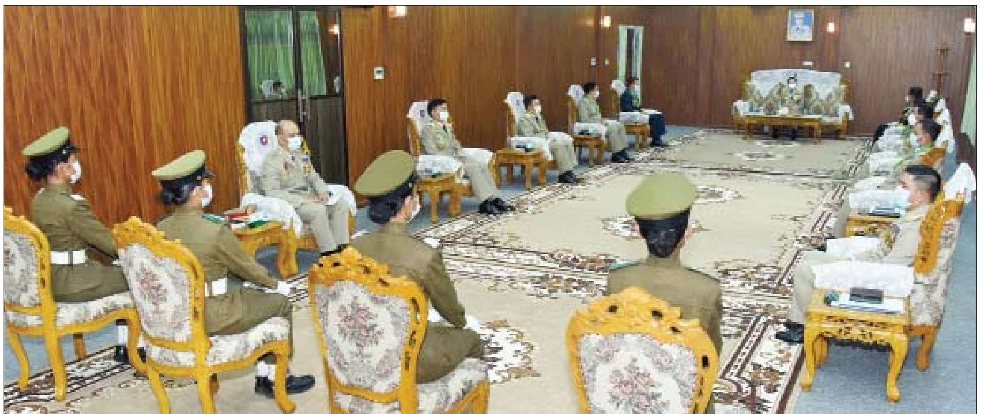
နိုင်ငံတော်စီမံအုပ်ချုပ်ရေးကောင်စီဥက္ကဋ္ဌ၊ တပ်မတော်ကာကွယ်ရေးဦးစီးချုပ် ဗိုလ်ချုပ်မှူးကြီး မဟာသရေစည်သူ မင်းအောင်လှိုင် ထူးချွန်ဆုရရှိကြသည့် ဗိုလ်လောင်းများကို တွေ့ဆုံ၍ ဂုဏ်ပြုအမှာစကား ပြောကြားစဉ်။

(နိုင်ငံတော်စီမံအုပ်ချုပ်ရေးကောင်စီဥက္ကဋ္ဌ၊ နိုင်ငံတော်ဝန်ကြီးချုပ် ဗိုလ်ချုပ်မှူးကြီးမင်းအောင်လှိုင် ၂၀၂၁-၂၀၂၂ ခုနှစ်တွင် နိုင်ငံတော်စီမံအုပ်ချုပ်ရေးကောင်စီ အစည်းအဝေး (၁၈/ ၂၀၂၁) ၌ ပြောကြားသည့် အမှာစကားမှ ကောက်နုတ်ချက်)