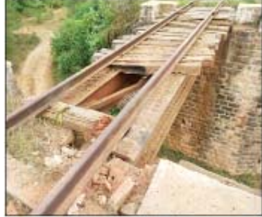
ကျောက်ပန်းတောင်းမြို့နယ် ကန်ပေါက်ကျေးရွာအနီး ကျောက်ပန်းတောင်း-ပျဉ်းမနား မီးရထားလမ်းပေါ်ရှိ မိုင်းကျော်တံတား၌ အကြမ်းဖက်သမား၏ မိုင်းထောင်ဖောက်ခွဲမှုကြောင့် ပျက်စီးခဲ့မှု မှတ်တမ်းဓာတ်ပုံ။

နေပြည်တော် ဒီဇင်ဘာ ၂၂ အကြမ်းဖက်အဖွဲ့များဖြစ်သော CRPH၊ NUG အမည်ခံအဖွဲ့များနှင့် ၎င်းတို့၏ လက်ဝေခံ PDF အဖွဲ့များအနေဖြင့် ၎င်းတို့၏ ကိုယ်ကျိုးစီးပွားအတွက် နိုင်ငံတော်တည်ငြိမ်အေးချမ်းမှုနှင့် တရားဥပဒေစိုးမိုးမှုကို ပျက်ပြားစေရန်၊ လမ်းပန်းဆက်သွယ်မှုများ ပြတ်တောက်စေရန် ရည်ရွယ်ကာ မီးရထားသံလမ်းများပေါ်၌ မိုင်းထောင်ထားခြင်း၊ ဖောက်ခွဲဖျက်ဆီးခြင်းများကဲ့သို့ အကြမ်းဖက်မှု လုပ်ရပ်များ လုပ်ဆောင်လျက်ရှိသည်။ ထိုသို့ အကြမ်းဖက်လုပ်ရပ်များ လုပ်ဆောင်ခဲ့ရာတွင် ဒီဇင်ဘာ ၂၁ ရက် နံနက် ၇ နာရီခွဲတွင် မကွေးတိုင်းဒေသကြီး ပခုက္ကူမြို့ဘူတာမှ ထွက်ခွာလာသည့် ပခုက္ကူ-ကျွန်းချောင်း အမှတ်(၂)အစုန် ရထားသည် နံနက် ၈ နာရီ ၁၀ မိနစ်တွင် မီးရထားလမ်းမိုင်တိုင်အမှတ် (၄၇၄/၆-၇) ကြားအရောက်၌ အကြမ်းဖက်သမားများ ထောင်ထားသည့် လက်လုပ်မိုင်းတစ်လုံး ပေါက်ကွဲခဲ့ပြီး ပေါက်ကွဲမှုကြောင့် စက်ခေါင်းမောင်း၊ အကူစက်ခေါင်းမောင်း နှင့် လုံခြုံရေးတပ်ဖွဲ့ဝင်တစ်ဦးတို့မိုင်းစ ထိမှန်ဒဏ်ရာများရရှိကာ အဆိုပါရထား စက်ခေါင်းမှာလည်း မိုင်းစထိမှန်ပျက်စီး