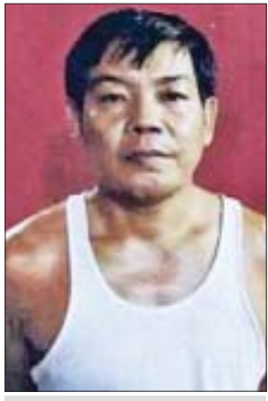
ကျော်မင်းမင်းကို(ခ)သူရ