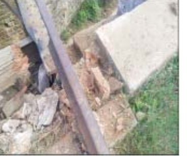
ကျောက်ပန်းတောင်းမြို့နယ် ကန်ပေါက်ကျေးရွာအနီး ကျောက်ပန်းတောင်း-ပျဉ်းမနား မီးရထားလမ်းပေါ်ရှိ မိုင်းကျော်တံတား၌ အကြမ်းဖက်သမား၏ မိုင်းထောင်ဖောက်ခွဲမှုကြောင့် ပျက်စီးခဲ့မှု မှတ်တမ်းဓာတ်ပုံ။