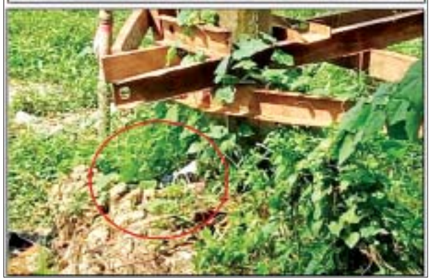
အောက်တိုဘာ ၂၇ ရက်တွင် ဒဂုံမြို့သစ်(မြောက်ပိုင်း)မြို့နယ် ၃၃ ရပ်ကွက် သီတဂူဘုန်းတော်ကြီးကျောင်းအနီး၌ လက်လုပ်ဗုံး တွေ့ရှိမှု မှတ်တမ်းဓာတ်ပုံ။