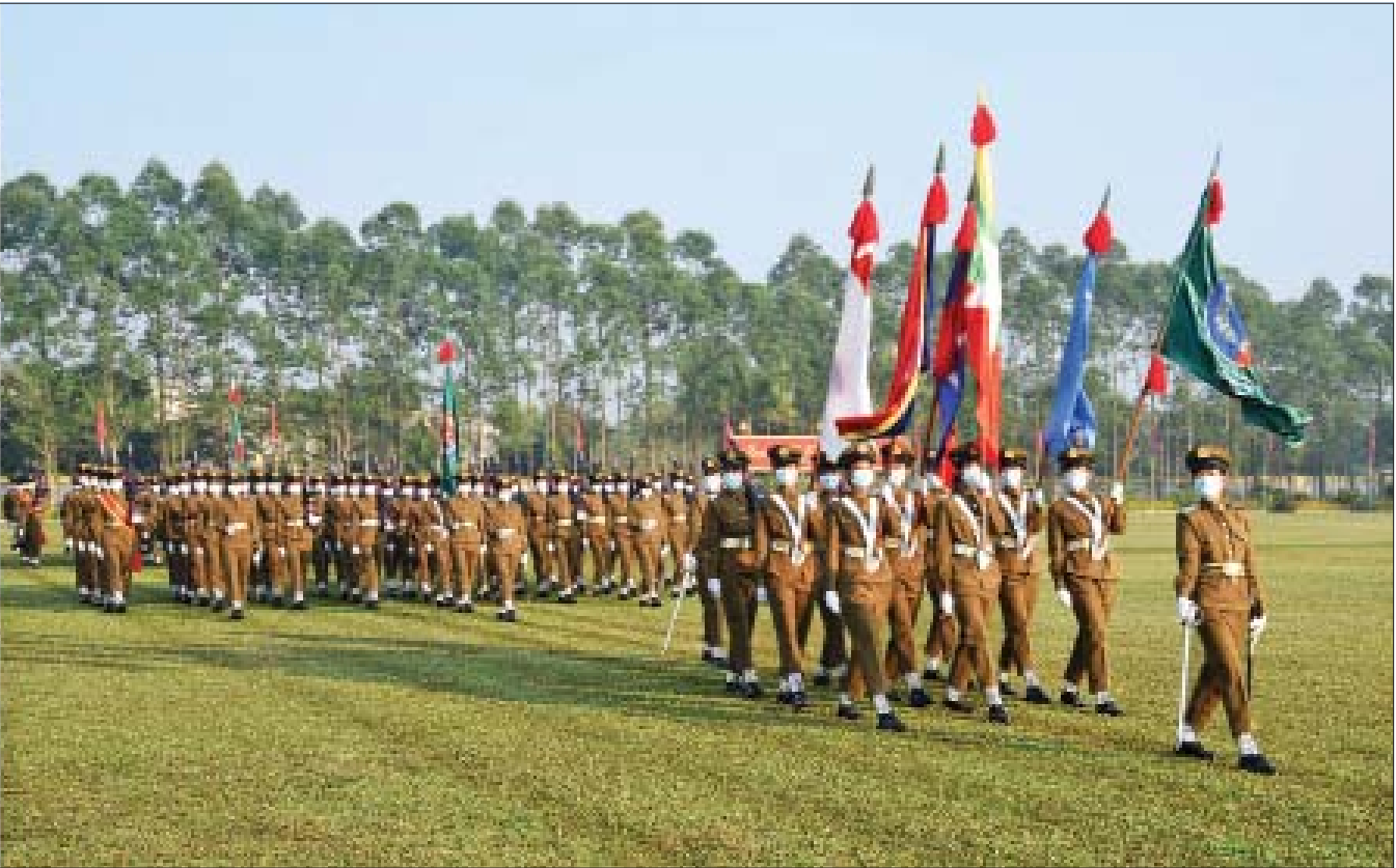
နိုင်ငံတော်စီမံအုပ်ချုပ်ရေးကောင်စီဥက္ကဋ္ဌ၊ တပ်မတော်ကာကွယ်ရေးဦးစီးချုပ် ဗိုလ်ချုပ်မှူးကြီး မဟာသရေစည်သူ မင်းအောင်လှိုင်အား ဘွဲ့ရအမျိုးသမီးဗိုလ်လောင်းသင်တန်း အမှတ်စဉ်(၈) သင်တန်းဆင်း ဂုဏ်ပြုစစ်ရေးပြအခမ်းအနားတွင် ဗိုလ်လောင်းတပ်ခွဲများက အနူးအလျှောက် အမြန်လျှောက်ဖြင့် ချီတက်အလေးပြုကြစဉ်။

နေပြည်တော် ဒီဇင်ဘာ ၂၂ တပ်မတော်၏ အမျိုးသမီးစစ်မှန်ထမ်းများ၏ အခန်းကဏ္ဍကို အားသစ် လောင်းမည့် ဘွဲ့ရအမျိုးသမီးဗိုလ်လောင်းသင်တန်း အမှတ်စဉ်(၈) သင်တန်းဆင်းဂုဏ်ပြု စစ်ရေးပြအခမ်းအနားကို ယနေ့နံနက်ပိုင်းတွင် ရန်ကုန်မြို့ရှိ တပ်မတော်(ကြည်း) ဗိုလ်သင်တန်းကျောင်း(မှော်ဘီ)