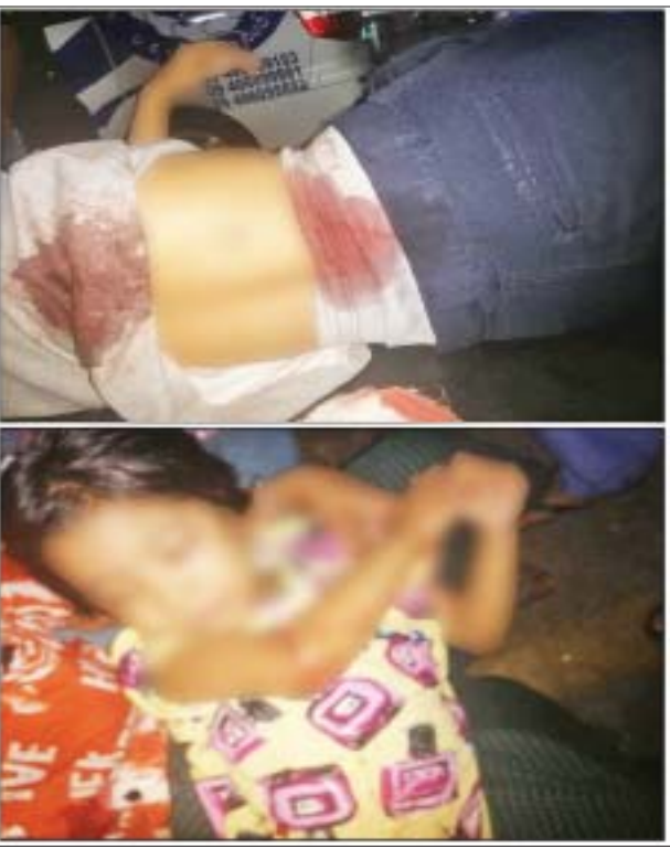
ဒီဇင်ဘာ ၉ ရက်တွင် တောင်ဥက္ကလာပမြို့နယ် ရဲတပ်ဖွဲ့စခန်း ဝင်းအား ၄၀ မမ ဖုံးသီးဖြင့် ပစ်ခတ်ခံရမှုကြောင့် သေဆုံးဒဏ်ရာရရှိခဲ့မှု မှတ်တမ်းဓာတ်ပုံ။

အထက်ပါ ဖမ်းဆီးရမိ တရားခံများအား ဥပဒေအရ ထိရောက်စွာ အရေးယူနိုင်ရေး ဆက်လက်ဆောင်ရွက်သွားမည်ဖြစ်ကြောင်းနှင့် ဆက်စပ်တရားခံများအား အမြန်ဆုံး ဖမ်းဆီးရမိရေးအတွက် ၎င်းတို့ ပုန်းခိုရာနေရာများ၊ လှုပ်ရှားသွားလာနေထိုင်မှုသတင်းများ ရရှိပါက သက်ဆိုင်ရာသို့ လျှို့ဝှက်စွာသတင်းပေး တိုင်ကြားနိုင်ပါကြောင်းနှင့် မြို့ရွာများ အမြန်ဆုံး အေးချမ်းတည်ငြိမ်ရေးအတွက် ပြည်သူတစ်ရပ်လုံး ပူးပေါင်းပါဝင် ကြိုးပမ်းဆောင်ရွက်နိုင်ပါရန် မေတ္တာရပ်ခံ အသိပေး ထုတ်ပြန်ထားကြောင်း သက်ဆိုင်ရာမှ သတင်းရရှိသည်။ သတင်းစဉ်