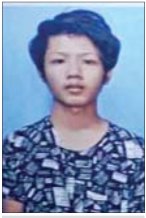
မျိုးမြင့်မြတ်အောင်(ခ)မျိုးကြီး