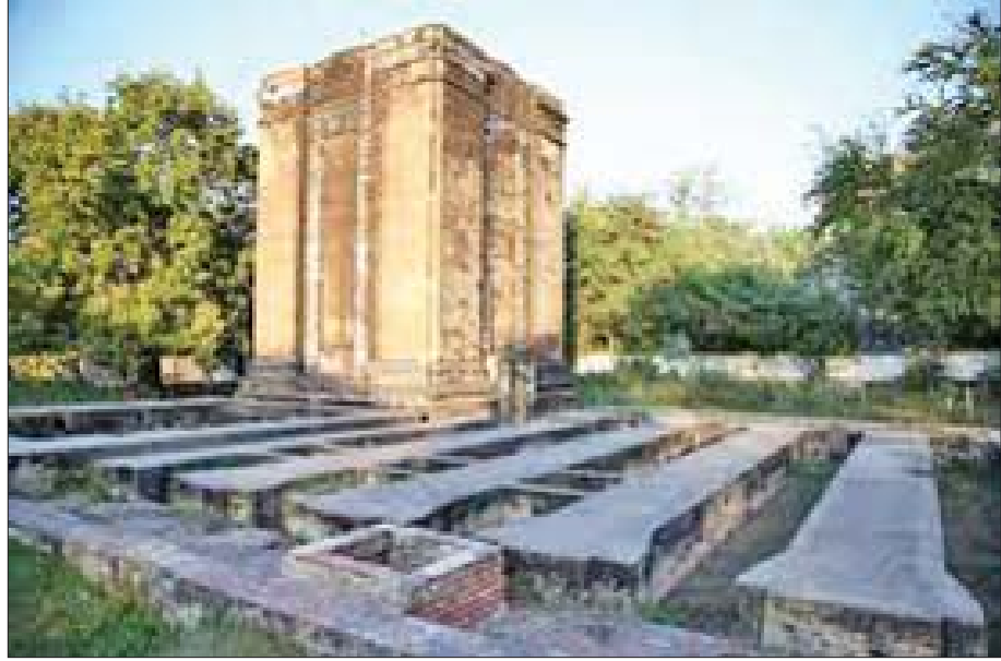
ကနောင်မင်းသားကြီးတည်ဆောက်ခဲ့သည့် သံချက်ဖိုအား တွေ့ရစဉ်။

မြန်မာနိုင်ငံအောက်ပိုင်း အင်္ဂလိပ်လက်အောက် ရောက်သွားခြင်းဟာ ကြီးမားတဲ့ဆိုးရွားမှုဖြစ်ခဲ့ပါ တယ်။ မင်းတုန်းမင်းသားဟာ နန်းတွင်းအရေး ကြောင့်ပဲဖြစ်ဖြစ် အောက်မြန်မာနိုင်ငံ အင်္ဂလိပ် လက်အောက်ရောက်ရတာ နောင်တော်ပုဂံမင်း ကြောင့်လို့ အကြောင်းပြု နောင်တော်ကို နန်းချကာ၊ နိုင်ငံတော်ရဲ့ အုပ်ချုပ်ရေး၊ စစ်မက်ရေးနဲ့ တရားရေး တို့အတွက် လွှတ်ရုံးငါးရပ်နဲ့ ဖွဲ့စည်းကာ၊ သိက္ခာ၊ သမာဓိ၊ ပညာနဲ့ ပြည့်စုံသူ ဝန်ကြီးရစ်ပါး၊ အသည် ဝန် အသီးသီးတို့ရဲ့ ဓမ္မဝတ်၊ ရာဇဝတ်၊ လောကဝတ် အကြောင်းသုံးပါးဆိုင်ရာ ကျွမ်းကျင်သိနားလည်မှု တို့ကိုရယူကာ နိုင်ငံတော် စည်ပင်သာယာဝပြော အောင် နန်းသက် ၂၆ နှစ်အတွင်းမှာ မင်းတုန်း မင်းကြီးက ဦးဆောင်ခဲ့ပါတယ်။ ဘုရင့်အတိုင်ပင်ခံ မျိုးကြီးမတ်ရာတွေဟာ ဘုရင်ကိုယ်တော်တိုင် ကြည့်ဖြူမြှောက်စားထားတဲ့ ဘက်တော်သားတွေ ဖြစ်ရကား ဝန်ကြီး၊ ဝန်ထောက်၊ အတွင်းဝန်၊ မြင်းစု ကြီးဝန်၊ အသည်ဝန်တို့ရဲ့ ပင်ကိုအရည်အသွေး ထက်မြက်ထူးချွန်ခြင်း၊ တော်တည့်ဖြောင့်မတ် အစွမ်းသတ္တိရှိခြင်းတို့ဟာ ဘုရင်မင်းမြတ်ရဲ့ ဘုန်း တန်ခိုးအရှိန်အဝါကို ပိုမိုကြီးထွားစေလျက် တရား စောင့်တဲ့ မင်းကောင်းမင်းမြတ်ဆိုတဲ့ ဝိသေသကို