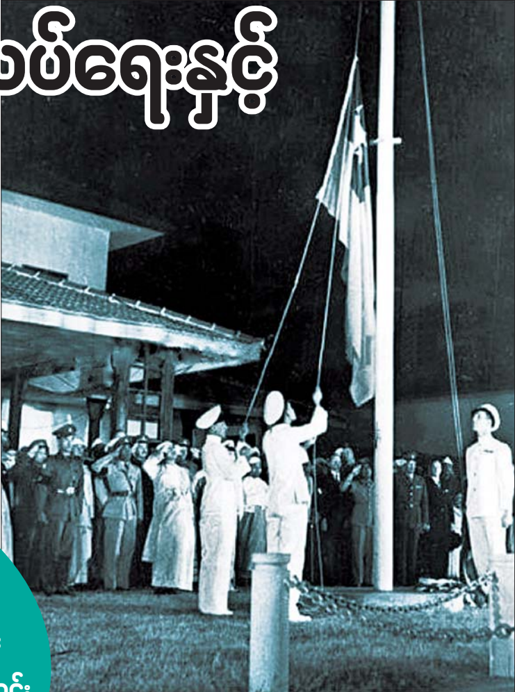
၁၉၄၈ ခုနှစ် ဇန်နဝါရီ ၄ ရက် နံနက်က တိုင်းပြည်ပြုလွှတ်တော်၌ မြန်မာနိုင်ငံတော်အလံ လွှင့်တင်သည့် အခမ်းအနား ကျင်းပစဉ်။

လွတ်လပ်ရေး မတိုင်မီကပင် ပေါက်ပွားလာသော နိုင်ငံရေးစိတ်ဝမ်းကွဲမှုနှင့် လွတ်လပ်ရေးနှင့်အတူ ပေါက်ပွားလာသော အချင်းချင်းတိုက်ခိုက်မှုများ မည်သည့်အချိန်မှ အတောသတ်မည်မသိ။ ယင်းအကြောင်း တရားများကို ဖြေရှင်းနိုင်မှသာ လွတ်လပ်သော နိုင်ငံ၊ လွတ်လပ်သော နိုင်ငံသားများခံစားခွင့်ကို အပြည့်အဝရရှိခံစားနိုင်မည်