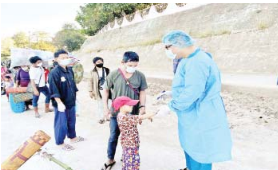
မြန်မာဘာသာ စကားများဖြင့် ပြန်လည်ဖိတ်ခေါ်ခြင်း၊ ထိုင်း- မြန်မာ နယ်ခြားကော်မတီများမှ လိုအပ်သည်များ ညှိနှိုင်းဆောင် ရွက်ခြင်းများကြောင့် ထွက်ပြေး တိမ်းရှောင်နေသူများအနက်မှ ယနေ့တွင် အင်ကြင်းမြိုင်၊ မယ်ထော်သလေးနှင့် ဖလူးကြီး ကျေးရွာတို့၌ နေထိုင်သူ အမျိုးသား ၃၉၆ ဦး၊ အမျိုးသမီး ၃၅၅ ဦး စုစုပေါင်း ၇၅၁ ဦးတို့သည် ၎င်းတို့နေရပ်အသီးသီးသို့ ထပ်မံ ပြန်လည်ဝင်ရောက်လာကြောင်း သိရသည်။ အဆိုပါ ပြန်လည်ဝင်ရောက် လာသူများကို သက်ဆိုင်ရာတာဝန် ရှိသူများက စနစ်တကျ လက်ခံ ခဲ့ပြီး ထိုသို့ လက်ခံရာတွင် သက်ဆိုင်ရာ ပြည်သူ့ဆေးရုံများမှ ကျန်းမာရေးဆိုင်ရာ တာဝန်ရှိသူ များ၊ တပ်မတော်ဆေးတပ်ဖွဲ့ဝင် များက ကိုဗစ်-၁၉ ရောဂါ စစ်ဆေး ပေးခြင်း၊ Quarantine ဝင်ရောက် ရမည့် အထောက်အထား စာရွက်

နေပြည်တော် ဇန်နဝါရီ ၃ ကရင်ပြည်နယ် လေးကေကော် မြို့သစ်တစ်ဝိုက် ရောက်ရှိနေသည့် NUG နှင့် PDF အမည်ခံ အကြမ်း ဖက်သမားများအား လုံခြုံရေး တပ်ဖွဲ့ဝင်များက ဖော်ထုတ် ဖမ်းဆီးခဲ့ရာမှ စတင်၍ KNU/ KNLA အဖွဲ့မှ အကြမ်းဖက်မှုကို လိုလားပြီး NCA ကို ပျက်စီးစေလို သည့် ခေါင်းဆောင်အချို့ ပါဝင် သော အဖွဲ့၊ NUG၊ PDF အမည်ခံ အကြမ်းဖက် အဖွဲ့များနှင့် လုံခြုံရေးတပ်ဖွဲ့ဝင်များ ဒီဇင်ဘာ ၁၅ ရက်မှစတင်၍ ထိတွေ့ တိုက်ပွဲများဖြစ်ပွားခဲ့ပြီး အဆိုပါ ဒေသမှ အပြစ်မဲ့ပြည်သူများ တစ်ဖက်နိုင်ငံသို့ ထွက်ပြေးတိမ်း ရှောင်လျက်ရှိသည်။ အဆိုပါဒေသတစ်ဝိုက် လုံခြုံ ရေးတပ်ဖွဲ့ဝင်များက ဒီဇင်ဘာ ၂၈ ရက်မှစ၍ ပြန်လည်ထိန်းချုပ် နိုင်ခဲ့ပြီး ဒေသတည်ငြိမ်အေးချမ်း မှုရှိသည့်အတွက် တစ်ဖက်နိုင်ငံ သို့ ထွက်ပြေးတိမ်းရှောင်နေသည့် အပြစ်မဲ့ပြည်သူများ ပြန်လည် နေထိုင်နိုင်ရေးအတွက် အသံချဲ့ စက်များဖြင့် ကရင်ဘာသာ၊