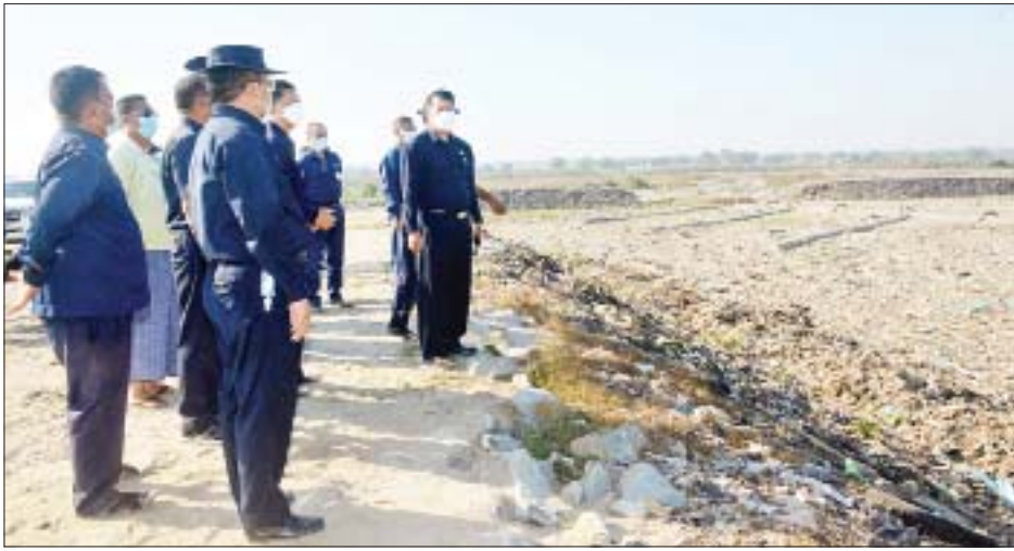
ဆောင်ရွက်သွားရန်လိုကြောင်း မှာကြားသည်။ ထို့နောက် မြို့တော်ဝန်နှင့်အဖွဲ့သည် ထိန်ပင် FDS အတွင်း မီးသတ်ရေငုတ်တိုင်များ အသုံးပြုနေမှု၊ မြေအောက်ရေမှ Sedimentation၊ Iron နှင့် Carbon အဆင့်ဆင့်သန့်စင်၍ တစ်နာရီလျှင် ရေဂါလန် ၆၂၅၀၀ သန့်စင်ပေးသော သံဓာတ်ဖယ်ရှားသည့်စနစ် တပ်ဆင်ထားရှိမှု၊ အလျား ပေ ၉၆၀ ၊ အနံ ပေ ၈၈၀၊ အနက် ၁၁ ပေရှိပြီး ရေဂါလန် ၅၈ သန်း သိုလှောင်နိုင် သည့် မိုးရေစုကန်ထိန်းသိမ်းထားမှုနှင့် ကန်ပတ် ဝန်းကျင် သန့်ရှင်းသာယာသပ်ရပ်ရေး ဆောင်ရွက်

ရန်ကုန်မြို့တော်စည်ပင်သာယာရေးကော်မတီ ဥက္ကဋ္ဌ(မြို့တော်ဝန်) ဦးဗိုလ်ဌေးနှင့်အဖွဲ့သည် ယနေ့ နံနက် ၇ နာရီတွင် ထိန်ပင်နောက်ဆုံးစွန့်ပစ်အမှိုက်ပုံ (Final Disposal Site - FDS) သို့ ရောက်ရှိပြီး တာဝန်ရှိသူများကို အမှိုက်စွန့်ပစ်မှုစီမံခန့်ခွဲရေးကို တစိုက်မတ်မတ် ကြိုးပမ်းဆောင်ရွက်ခဲ့သည့်အတွက် နည်းပညာအသုံးပြုမှုနှင့် လုပ်ငန်းစွမ်းဆောင်ရည် တိုးတက်လာသည်ကို တွေ့ရှိရကြောင်း၊ နိုင်ငံတကာ တွင် စီးပွားရေးလုပ်ငန်းရှင်များက အမှိုက်စွန့်ပစ်မှု စီမံခန့်ခွဲရေးအား တာဝန်ယူဆောင်ရွက်နေသည့် နည်းတူ ထိန်ပင်နောက်ဆုံးအမှိုက်ပုံကိုလည်း စွမ်းအင်ထုတ်လုပ်နိုင်ရေးအတွက် လုပ်ငန်းရှင် များစွာက စိတ်ပါဝင်စားစွာ လာရောက်လေ့လာသည် ကို တွေ့ရှိရသဖြင့် Feasibility Study ဖြစ်နိုင်ခြေ လေ့လာမှုများ ဆောင်ရွက်နိုင်ရန် အားပေးစီစဉ် သွားရမည်ဖြစ်ကြောင်း၊ အမှိုက်စွန့်ပစ်မှုလျော့ချ နိုင်ရေးအတွက် ပြည်သူများကို Awareness Campaign အသိပညာပေးခြင်းများ စဉ်ဆက်မပြတ်