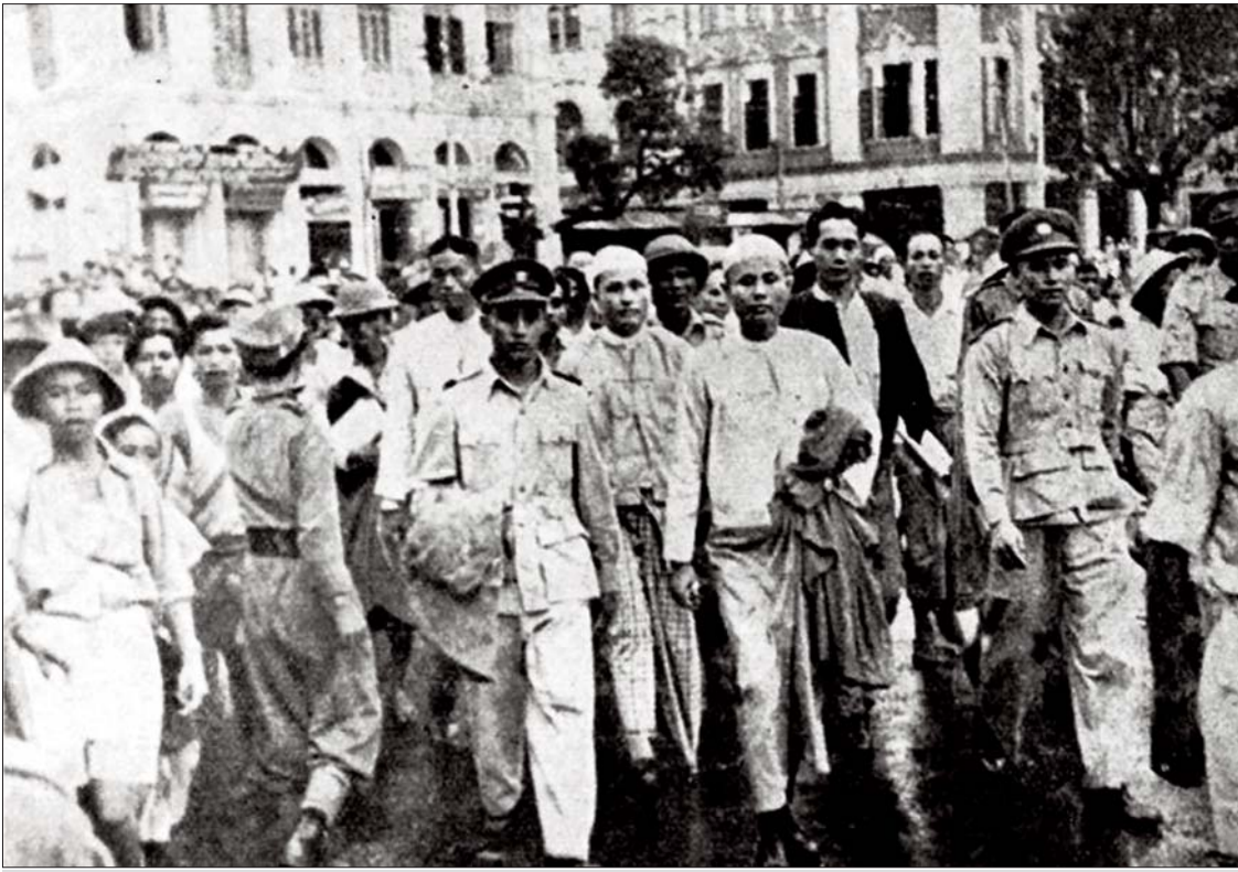
၁၉၄၇ ခုနှစ် ဇွန် ၉ ရက်က ရန်ကုန်မြို့ မဟာပန္နလပန်းခြံတွင် ပြုလုပ်သော လူထုအစည်းအဝေးအပြီး ဦးအောင်ဆန်းနှင့်အဖွဲ့ တိုင်းပြုပြည်ပြုလွှတ်တော်သို့ တက်ရောက်စဉ်။

သို့သော် နယ်ချဲ့တို့၏ လက်အောက်မှ လွတ်လပ်ရေးရခဲ့သော မြန်မာနိုင်ငံသည်