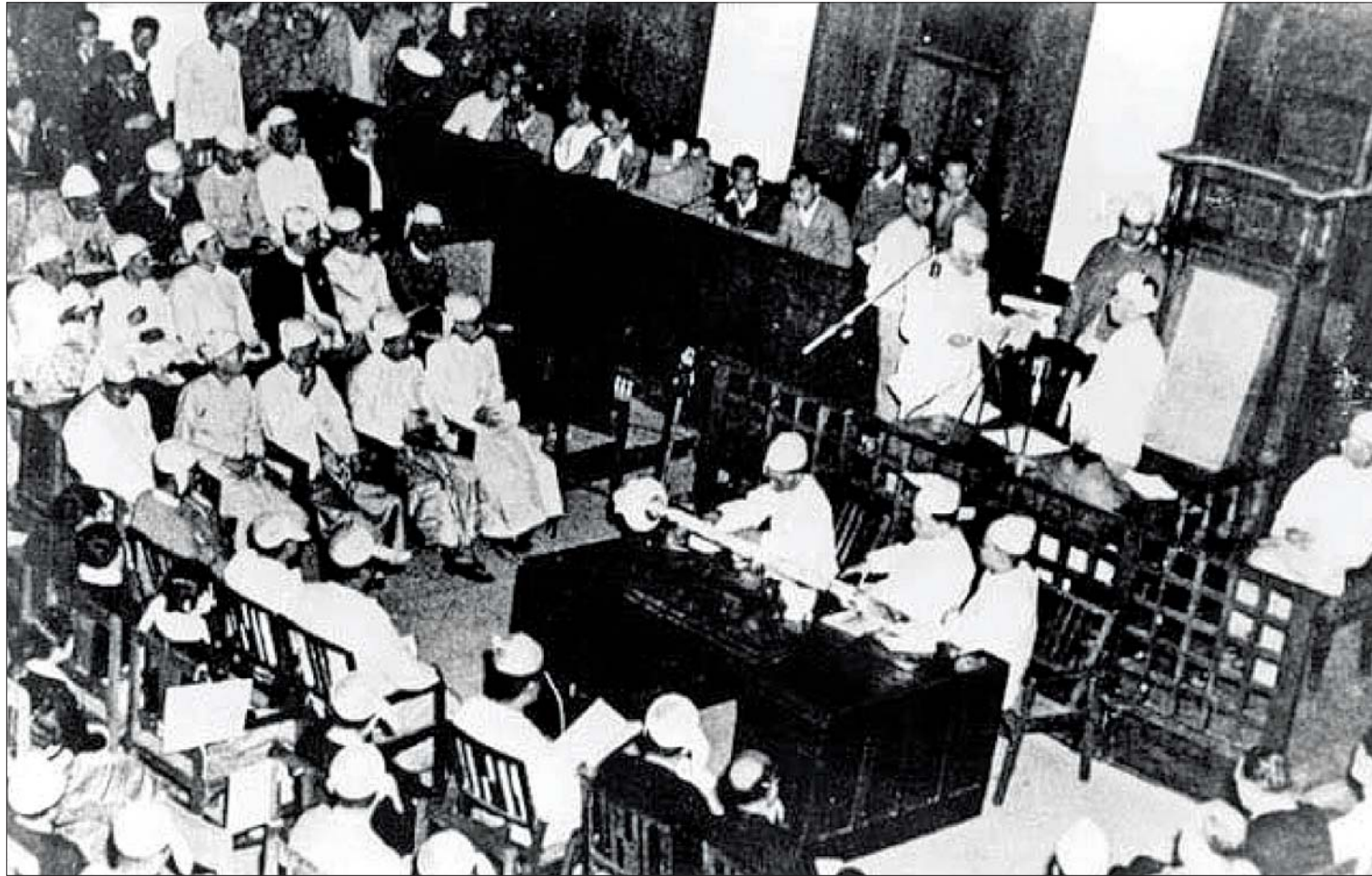
ပထမအကြိမ် လွတ်လပ်ရေးနေ့ အခမ်းအနားအပြီးတွင် မြန်မာအစိုးရအဖွဲ့သစ် ကတိသစ္စာခံယူပွဲပြုလုပ်စဉ်။

ယနေ့ဆိုလျှင် နိုင်ငံရေး ပဋိပက္ခများ ဖြေရှင်း၍ ဖက်ဒရယ်နှင့် ဒီမိုကရေစီ တည်ဆောက်ရေးအတွက် အသွင်ကူးပြောင်းဆဲ ကာလ တွင်ရှိနေ ကာလရှည်ကြာ တည်ရှိ နေဆဲ ပဋိပက္ခများ၊ အချင်း ချင်း တိုက်ခိုက်မှုများ၊ အယူအဆ ကွဲပြားမှုများ ဖြေရှင်းနိုင်မှသာ ဒီမို ကရေစီနှင့် ဖက်ဒရယ်ခရီး ကို ဆက်လက်လျှောက် လှမ်းနိုင်မည်