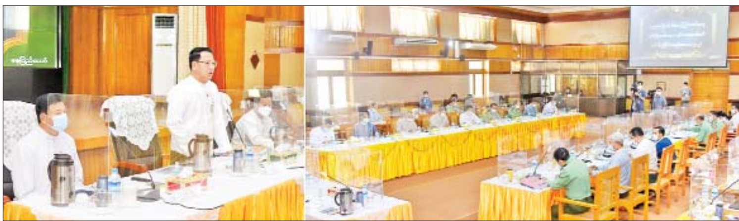
ပြည်ထောင်စုဝန်ကြီး ဦးမောင်မောင်အုန်း (၇၅)နှစ်မြောက် စိန်ရတုပြည်ထောင်စုနေ့ ဂုဏ်ပြုအခမ်းအနားကျင်းပရေးကော်မတီ လုပ်ငန်းညှိနှိုင်းအစည်းအဝေးတွင် အမှာစကားပြောကြားစဉ်။

နေပြည်တော် ဇန်နဝါရီ ၃ (၇၅)နှစ်မြောက်စိန်ရတုပြည်ထောင်စု နေ့ ဂုဏ်ပြုအခမ်းအနားကျင်းပရေး ကော်မတီလုပ်ငန်းညှိနှိုင်းအစည်းအဝေး (၁/၂၀၂၂)ကို ယနေ့ နံနက် ၁၀ နာရီတွင် နေပြည်တော်ရှိ ပြန်ကြားရေးဝန်ကြီးဌာန စုဝေးခန်းမ၌ ကျင်းပသည်။