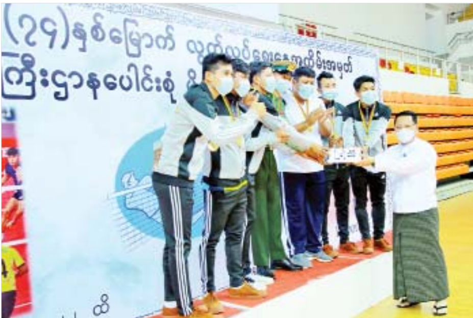
ပြည်ထောင်စုဝန်ကြီး ဦးမောင်မောင်အုန်း ပိုက်ကျော်ခြင်း(အမျိုးသား)ပြိုင်ပွဲတွင် ပထမဆုရရှိ ခဲ့သည့် ကာကွယ်ရေးဝန်ကြီးဌာနအသင်းကို ဆုချီးမြှင့်စဉ်။

ဆက်လက်၍ ဘော်လီဘောပြိုင်ပွဲ ဆုချီးမြှင့်ပွဲ