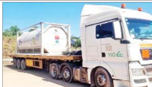
ဝင်ရောက်ကြည့်ရှုနိုင်ရေး စီစဉ်ဆောင်ရွက်ပေးထားကြောင်း သိရသည်။

သည်။ အောက်ဆီဂျင် (အရည်) Bowser ယာဉ်တစ်စီးမှာ မြဝတီကုန်သွယ်ရေးဇန်နီမှ ရန်ကုန်မြို့သို့ဖြစ်ကြောင်း သိရသည်။ ကိုဗစ်-၁၉ ရောဂါကာကွယ်၊ ထိန်းချုပ်၊ ကုသရေးဆိုင်ရာပစ္စည်းများကို သက်ဆိုင်ရာဌာနများနှင့် ညှိနှိုင်းထားသည့် SOP များနှင့်အညီ ဦးစားပေးတင်သွင်းခွင့်ပြုပေးလျက်ရှိကြောင်းနှင့် ဆေးဝါးနှင့် ဆက်စပ်ပစ္စည်းများ တင်သွင်းခြင်းနှင့် ဆက်စပ်သည့် အသိပေးကြေညာချက်များကိုလည်း အများပြည်သူသိရှိစေရန် ဝန်ကြီးဌာန Website ဖြစ်သည့် www.commerce.gov.mm တွင်