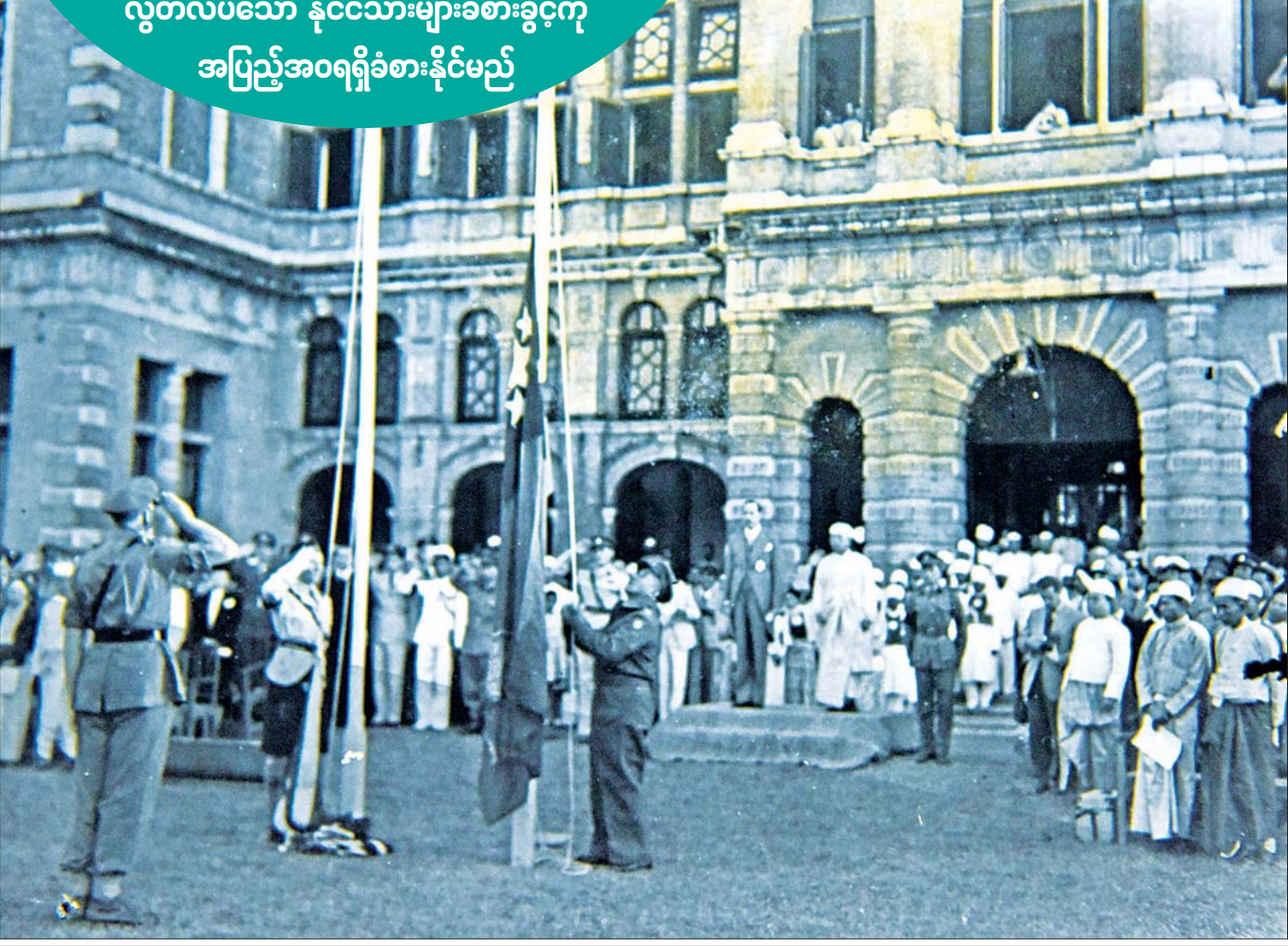
၁၉၄၈ ခုနှစ် ဇန်နဝါရီလ ၄ ရက်က ရန်ကုန်မြို့ အလုံလမ်းရှိ ဗြိတိသျှဘုရင်ခံအိမ်တော်(အစိုးရအိမ်တော်)တွင် ယူနိုက်တက်အလံကို မြေသို့ချပြီး မြန်မာနိုင်ငံတော်အလံကို လွှင့်တင်စဉ်။

ရာသို့ ရှောင်တိမ်းနေခဲ့ကြရသည်။ နေရာအတည်တကျ မရှိသဖြင့် သားသမီးများမှာလည်း အညာဒေသတွင် မွေးသူ၊ ရှမ်းပြည်အတွင်း မွေးသူများဖြင့် မွေးရပ်ဇာတိမတူကြချေ။ မေမေအစ်မ ကြီးဆိုလျှင် ရှမ်းစကားပင် ပြောတတ် သည်။ အဘိုး၊ အဘွားတို့မှာ စစ်ဘေးကင်း ရာသို့ ပြေးနေကြရသဖြင့် သားသမီးများ ပညာရေးကို ကောင်းကောင်းဂရုမစိုက် နိုင်ခဲ့ကြ။ စစ်ဘေးကြောင့် မူလတန်းအထိ သာ ကျောင်းနေခဲ့ကြကြောင်း မေမေက ပြောရှာသည်။ စစ်အတွင်းဆိုတော့ မေမေ တို့က သေစာရှင်စာပဲသင်ခဲ့ကြတာကွယ် ဟု ပြောသည့်အခါ များစွာစိတ်မကောင်း ဖြစ်ရသည်။ သူတစ်ပါး၏ အုပ်ချုပ်မှု အောက်၊ စစ်ဘေးဒဏ်များ အောက်တွင် ပညာကိုလည်း မရှာနိုင်၊ စီးပွားရေးကို လည်း ဂရုမစိုက်နိုင်ခဲ့ကြသော ခက်ခဲ ကြမ်းတမ်းသည့်ဘဝများတွင် ကျင်လည် ခဲ့ရသဖြင့် ယင်းအချိန်က လွတ်လပ်ရေးကို တမ်းတမိကြောင်း မေမေက ပြောပြပါ သည်။