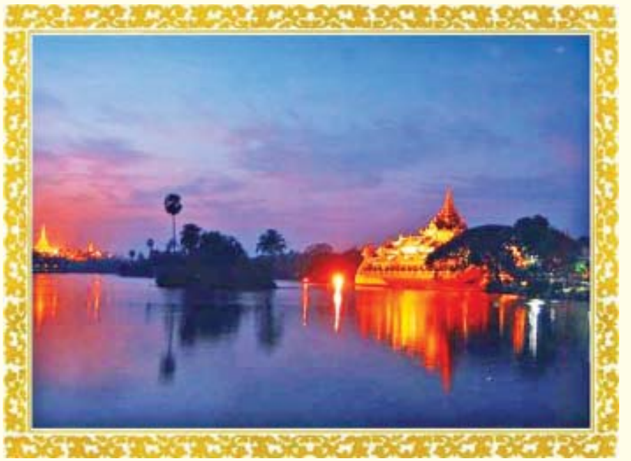
ရွှေတိဂုံဘုရားနှင့် ကရဝိက် ဓာတ်ပုံ - ပြန်/ဆက်

အမျိုးသားညီညွတ်ရေးဆိုသည်မှာ ခေါင်းဆောင်များသာ ညီညွတ်ခြင်းကို မဆိုလို။ လူမျိုး၊ ဘာသာ၊ ယောက်ျား၊ မိန်းမ၊ ဂိုဏ်းဂဏမရွေး တစ်နိုင်ငံလုံး ပြည်သူပြည်သား၊ လူထုတစ်ခုလုံး အပြောသာမဟုတ်၊ အလုပ်နှင့်တကွ အမျိုးသားတို့၏ အလိုဆန္ဒများ ပြည့်ဝနိုင်ရန် အမျိုးသားတို့၏ လုပ်ငန်းများတွင် သောင်းသောင်းဖြဖြ စိတ်ရောကိုယ်ပါ ညီညွတ်ကြသည်ကို ဆိုလိုသည်။