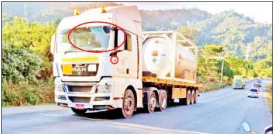
KNLA အဖွဲ့နှင့် PDF အမည်ခံ အကြမ်းဖက်အဖွဲ့က လက်နက်ငယ်များဖြင့် ပစ်ခတ်ခဲ့မှုကြောင့် အောက်ဆီဂျင်တင်မော်တော်ယာဉ်ပျက်စီးခဲ့မှု မှတ်တမ်းဓာတ်ပုံ။

နေပြည်တော် ဇန်နဝါရီ ၃ နိုင်ငံတော်စီမံအုပ်ချုပ်ရေး ကောင်စီအနေဖြင့် ကိုဗစ်-၁၉ ရောဂါ ကာကွယ်၊ ထိန်းချုပ်၊ ကုသရေးလုပ်ငန်းများကို အလေးအနက်ထား ဆောင်ရွက်လျက် ရှိပြီး အောက်ဆီဂျင်လိုအပ်မှုများ ရှိခဲ့ချိန်နှင့် လက်ရှိအချိန်တွင် ပြည်တွင်း ထုတ်လုပ်မှုများအပြင် ပြည်ပနိုင်ငံများမှ ဝယ်ယူတင်သွင်း ဖြည့်ဆည်းဆောင်ရွက်ပေးလျက်ရှိပြီး လိုအပ်ချက်များ အပေါ်မူတည်၍ တိုင်းဒေသကြီးနှင့် ပြည်နယ်များသို့ ခွဲဝေဖြန့်ဖြူးပေးခြင်း၊ လူမှုရေးအသင်းအဖွဲ့များနှင့် ပူးပေါင်း၍ အောက်ဆီဂျင် ထုတ်လုပ် ဖြန့်ဖြူးခြင်းများ ဆောင်ရွက်ပေးလျက်ရှိသည်။ အကြောင်းမဲ့ပစ်ခတ် ထိုသို့ ဆောင်ရွက်လျက်ရှိရာ ထိုင်းနိုင်ငံမှ မှာယူ၍ အောက်ဆီဂျင်အရည် တန် ၂၀ တင်ဆောင်ကာ ကရင်ပြည်နယ် မြဝတီမြို့မှ ရန်ကုန်မြို့သို့ ထွက်ခွာလာသည့် မော်တော်ယာဉ်သည် ယနေ့မုန်းလွဲ ၂ နာရီခွဲခန့်တွင် မြဝတီမြို့နယ် အပြင်ကွင်း ကလေးကျေးရွာ၏ အနောက်မြောက်ဘက် မိတာ