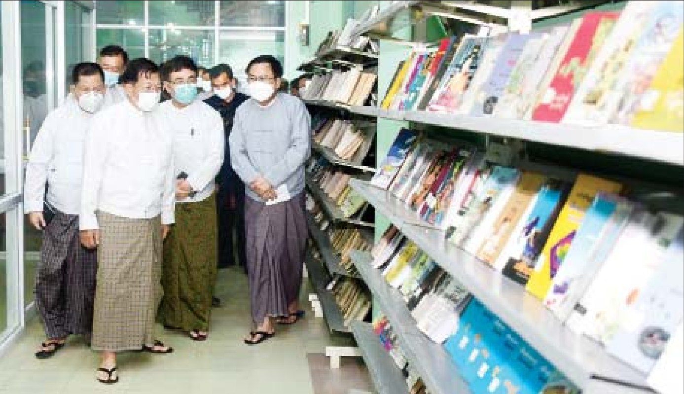
နိုင်ငံတော်စီမံအုပ်ချုပ်ရေးကောင်စီဥက္ကဋ္ဌ၊ နိုင်ငံတော်ဝန်ကြီးချုပ် ဗိုလ်ချုပ်မှူးကြီးမင်းအောင်လှိုင်နှင့်အဖွဲ့ဝင်များ နိုဝင်ဘာ ၃ ရက်က မန္တလေးတက္ကသိုလ် ပင်မစာကြည့်တိုက်အတွင်း လှည့်လည်ကြည့်ရှုစဉ်။

နိုင်ငံတော် စီမံအုပ်ချုပ်ရေးကောင်စီ၏ ကိုးလပြည့် နိုင်ငံတော်တာဝန်ထမ်းဆောင်ခဲ့မှုနှင့် ပတ်သက်၍ နိုင်ငံတော်စီမံအုပ်ချုပ်ရေးကောင်စီ ဥက္ကဋ္ဌ၊ နိုင်ငံတော်ဝန်ကြီးချုပ် ဗိုလ်ချုပ်မှူးကြီး မင်းအောင်လှိုင်က ပြည်သူများထံသို့ နိုဝင်ဘာ ၁ ရက်တွင် မိန့်ခွန်းပြောကြားခဲ့သည်။ ကိုးလတာ အတွင်း နိုင်ငံတော်စီမံအုပ်ချုပ်ရေးကောင်စီ၏ ဆောင်ရွက်မှု၊ ကိုဗစ်-၁၉ ရောဂါ ကာကွယ်၊ ထိန်းချုပ်၊ ကုသရေးလုပ်ငန်းဆောင်ရွက်မှု၊ လွတ်ငြိမ်းချမ်းသာခွင့်အစီအစဉ်များ၊ ကာကွယ် ဆေးထိုးနှံမှုအစီအစဉ်များ၊ စာသင်ကျောင်းများ ဖွင့်လှစ်မှုအစီအစဉ်၊ စီးပွားရေးကဏ္ဍတွင် စိုက်ပျိုးရေး၊ မွေးမြူရေး တိုးမြှင့်ထုတ်လုပ်နိုင်စေဖို့၊ စက်သုံးဆီနှင့် စားသုံးဆီသုံးစွဲမှု ခြီးမြှင့်တင်ရေး စေ့ငြိမ်ရေးနှင့် ညီညွတ်စွာ စားသောက် နေထိုင်၍ ပြည်သူများ ကျန်းမာကြံ့ခိုင်ရေး၊ စက်မှု ကုန်ထုတ်နှင့် ကုန်သွယ်မှုလုပ်ငန်းများ ဖွံ့ဖြိုး တိုးတက်ရေး အစရှိသည့် ဆောင်ရွက်ချက်များကို ပြောကြားခဲ့သည်။