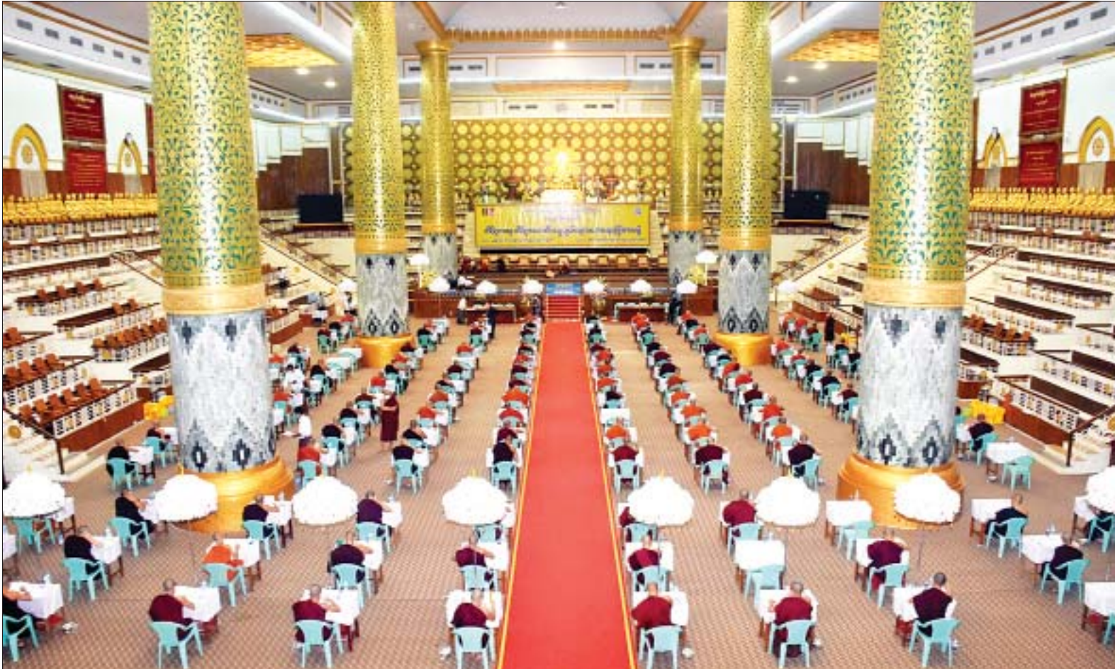
(၇၄)ကြိမ်မြောက် တိပိဋကဓရ တိပိဋကကောဝိဒ ရွေးချယ်ရေး(သဘောရေးဖြေ)စာမေးပွဲ ဖြေဆိုနေကြစဉ်။

ရန်ကုန် ဇန်နဝါရီ ၅ သဘာဝရေးနှင့် ယဉ်ကျေးမှု ဝန်ကြီးဌာနက ကြီးမှူးကျင်းပ သော (၇၄)ကြိမ်မြောက် တိပိဋက ဓရ တိပိဋကကောဝိဒ ရွေးချယ်ရေး (သဘောရေးဖြေ) စာမေးပွဲ ဖွင့်ပွဲ အခမ်းအနားကို ယနေ့နံနက်ပိုင်း တွင် ရန်ကုန်မြို့ ကမ္ဘာအေး ကုန်းမြေ ဝိဇယမင်္ဂလာဓမ္မသာသင် ခန်းမ၌ ကျင်းပသည်။ တက်ရောက်ကြည့်ညို့ အခမ်းအနားသို့ နိုင်ငံတော် သံဃမဟာနာယကအဖွဲ့ ဥက္ကဋ္ဌ၊ အဘိဓမ္မမဟာရဋ္ဌဂူရု၊ အဘိဓမ္မ အဂ္ဂမဟာ သဒ္ဓမ္မဇောတိက ဗန်းမော်ဆရာတော် ဒေါက်တာ ဘဒ္ဒန္တကုမာရာဘိဝံသ (ဝဋ်သကာ ပါဠိ သိရော မဏိ) အမှူးပြုသော တိပိဋကဓရ တိပိဋကကောဝိဒ ဩဝါဒါစရိယအဖွဲ့ ဆရာတော်ကြီး များ၊ ပုစ္ဆကဆရာတော်ကြီးများ၊ ကြီးကြပ်ရေး ဆရာတော်ကြီးများ ကြွရောက်တော်မူကြပြီး ရန်ကုန် တိုင်းဒေသကြီး ဝန်ကြီးချုပ် ဦးလှစိုး၊ ရန်ကုန်တိုင်းစစ်ဌာနချုပ် စာမျက်နှာ ၃ ကော်လံ ၁ သို့