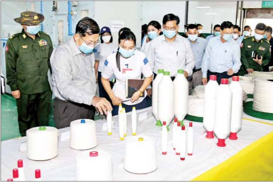
နိုင်ငံတော်စီမံအုပ်ချုပ်ရေးကောင်စီဥက္ကဋ္ဌ၊ နိုင်ငံတော်ဝန်ကြီးချုပ် ဗိုလ်ချုပ်မှူးကြီး မင်းအောင်လှိုင် နိုဝင်ဘာ ၁၁ ရက်က တပ်မတော်ချည်မျှင်နှင့် အထည်စက်ရုံ(သမိုင်း)အတွင်း ကြည့်ရှုစစ်ဆေးစဉ်။

မြန်မာနိုင်ငံစစ်မှုထမ်းဟောင်းအဖွဲ့ ညီလာခံ (၂၀၂၁)၏ ဒုတိယမြောက်နေ့ နိုဝင်ဘာ ၂၆ ရက်၌ မြန်မာနိုင်ငံစစ်မှုထမ်းဟောင်းအဖွဲ့ နာယက၊ တပ်မတော်ကာကွယ်ရေးဦးစီးချုပ်က တက်ရောက် မိန့်ခွန်းပြောကြားရာတွင် စစ်မှုထမ်းဟောင်းများ အဖြစ် တာဝန်ထမ်းဆောင်နေကြသူများသည် ယခင်က တိုင်းပြည်နှင့်လူမျိုးအတွက် မိမိတို့၏ အသက်ခန္ဓာကိုပင် မင့်ကွက်ဘဲ နိုင်ငံတော်က ပေးအပ်လာသည့်တာဝန်များကို စွမ်းစွမ်းတမ်း တမ်းဆောင်ခဲ့ကြသူများဖြစ်ကြောင်းနှင့် ယနေ့ အချိန်တွင် တိုင်းပြည်၏အမျိုးသားကာကွယ်ရေး