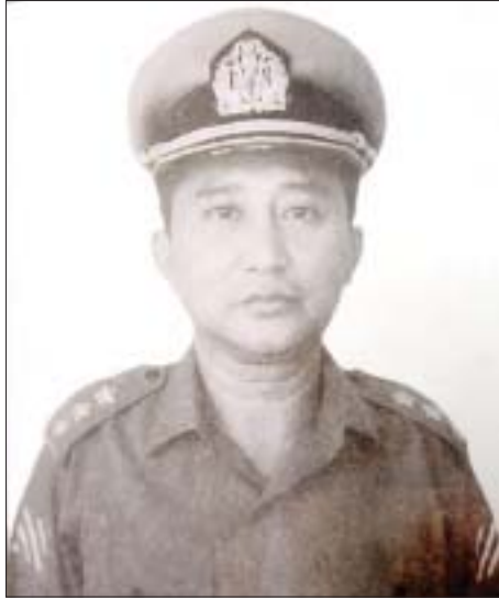
စာရေးဆရာ တင့်ဆွေ(ဖျာပုံ)

အမျိုးသားစာပေဆုရှင် စာရေးဆရာ တင့်ဆွေ (ဖျာပုံ)သည် ဇန်နဝါရီ ၅ ရက် နံနက်အစောပိုင်းက ကွယ်လွန်သွားခဲ့ပြီး ကွယ်လွန်ချိန်တွင် အသက် (၉၇)နှစ် ရှိပြီဖြစ်သည်။