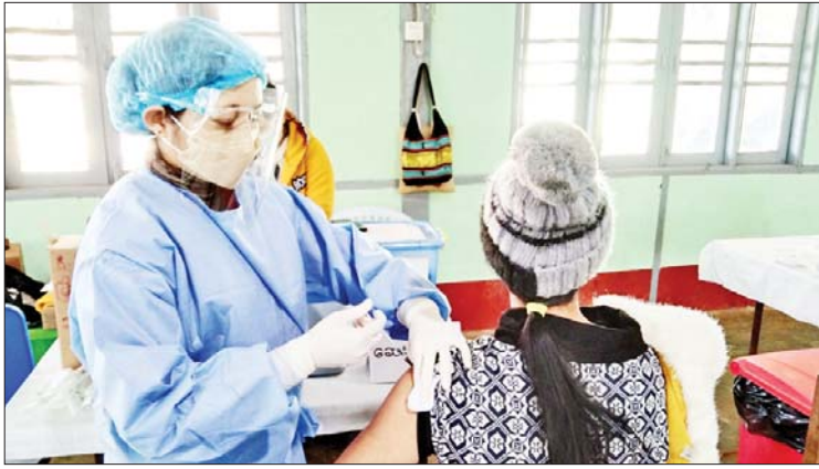
နေရာသို့ မြို့နယ် ကိုဗစ်-၁၉ ရောဂါ ကာကွယ်ထိန်းချုပ်ရေးကော်မတီဥက္ကဋ္ဌ က အနီးကပ်ကြီးကြပ်လျက် မြို့နယ်

နမ္မတူ ဇန်နဝါရီ ၉ ရှမ်းပြည်နယ်(မြောက်ပိုင်း) နမ္မတူ မြို့နယ် ကိုဗစ်-၁၉ ရောဂါ ကာကွယ် ထိန်းချုပ်ရေးကော်မတီအနေဖြင့် ဦးတည် အုပ်စုများအလိုက် ကိုဗစ်-၁၉ ရောဂါ ကာကွယ်ဆေးများ ထိုးနှံပေးလျက်ရှိရာ ဇန်နဝါရီ ၈ ရက်တွင် ပန်ဟိုက်ရပ်ကွက်ရှိ မြို့တော်ခန်းမ၌ အသက် ၁၈ နှစ်နှင့် အထက် ပြည်သူ ၇၁၀ အား ဒုတိယ အကြိမ် Sinopharm အမျိုးအစား ကိုဗစ်-၁၉ ရောဂါကာကွယ်ဆေး ထိုးနှံ ပေးခဲ့ကြောင်း သိရသည်။ အဆိုပါ ကာကွယ်ဆေးထိုးနှံရာ