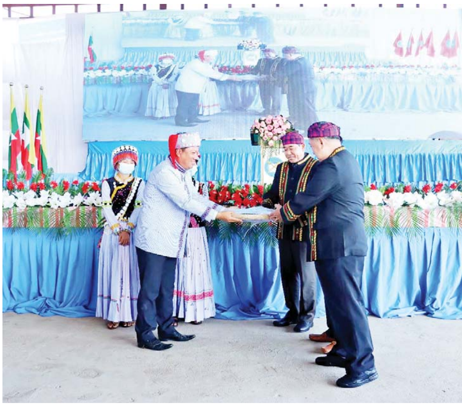
နိုင်ငံတော်စီမံအုပ်ချုပ်ရေးကောင်စီအဖွဲ့ဝင်များနှင့် ပြည်ထောင်စုဝန်ကြီးများအား မြန်မာနိုင်ငံ လီဆူစာပေနှင့် ယဉ်ကျေးမှုဗဟိုကော်မတီဥက္ကဋ္ဌ ဦးအားဖူရီလီမိက လီဆူရိုးရာ “ဇာဇော်” ပေးအပ်စဉ်။

○ နိုင်ငံတော်မှ တွေ့ဆုံပွဲတွင် နိုင်ငံတော်စီမံအုပ်ချုပ်ရေးအဖွဲ့ဝင် Jeng Phang နော်တောင်၊ ပြည်ထောင်စုဝန်ကြီး ဒုတိယဗိုလ်ချုပ်ကြီး ထွန်းထွန်း နောင်နှင့် ဦးစောထွန်းအောင်မြင့်တို့က နှုတ်ခွန်းဆက်စကား ပြောကြားပြီး မြန်မာနိုင်ငံလီဆူစာပေနှင့် ယဉ်ကျေးမှုဗဟိုကော်မတီဥက္ကဋ္ဌ ဦးအားဖူရီလီမိက ကျေးဇူးတင်စကားနှင့် စာပေနှင့်ယဉ်ကျေးမှုအဖွဲ့အတွက် လိုအပ်ချက်များကိုတင်ပြကာ နိုင်ငံတော်စီမံအုပ်ချုပ်ရေးကောင်စီ အဖွဲ့ဝင်များ၊ ပြည်ထောင်စုဝန်ကြီးများ၊ ပြည်နယ်ဝန်ကြီးချုပ်နှင့် တိုင်းမှူးတို့ထံ လီဆူရိုးရာ “ဇာဇော်”အား ပေးအပ်သည်။