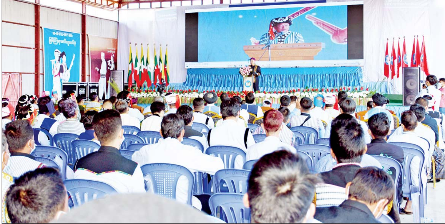
နိုင်ငံတော်စီမံအုပ်ချုပ်ရေးကောင်စီ အဖွဲ့ဝင်များနှင့် ပြည်ထောင်စုဝန်ကြီးများ မြစ်ကြီးနားမြို့၌ ဒေသခံလီဆူတိုင်းရင်းသားပြည်သူများနှင့် တွေ့ဆုံစဉ်။

မြစ်ကြီးနား ဇန်နဝါရီ ၉ နိုင်ငံတော်စီမံအုပ်ချုပ်ရေးကောင်စီ အဖွဲ့ဝင်များဖြစ်ကြသည့် Jeng Phang နော်တောင်၊ ဦးမောင်ဟာဦးစိုးလုံးဆိုင်၊ ဦးရွှေကြိမ်း၊ နယ်စပ်ရေးရာဝန်ကြီးဌာန ပြည်ထောင်စုဝန်ကြီး ဒုတိယဗိုလ်ချုပ်ကြီး ထွန်းထွန်းနောင်၊ လူဝင်မှုကြီးကြပ်ရေးနှင့် ပြည်သူ့အင်အားဝန်ကြီးဌာန ပြည်ထောင်စု ဝန်ကြီး ဦးခင်ရီ၊ တိုင်းရင်းသားလူမျိုးများ ရေးရာဝန်ကြီးဌာန ပြည်ထောင်စုဝန်ကြီး ဦးစောထွန်းအောင်မြင့်၊ ပြည်နယ် ဝန်ကြီးချုပ် ဦးခင်ထိန်နန်၊ မြောက်ပိုင်း တိုင်းစစ်ဌာနချုပ် တိုင်းမှူး ဗိုလ်မှူးချုပ် မြတ်သက်ဦးတို့သည် မြန်မာနိုင်ငံ လီဆူ စာပေနှင့် ယဉ်ကျေးမှုဗဟိုကော်မတီ အဖွဲ့ဝင်များ၊ တိုင်းရင်းသား မျိုးနွယ်စုများ နှင့် ယနေ့ နံနက်ပိုင်းတွင် ကျမ်းပြုနယ် မြစ်ကြီးနားမြို့ရှိ လီဆူရိုးရာယဉ်ကျေးမှု ဗဟိုကော်မတီရုံး လီဆူရိုးရာကွင်း၌ တွေ့ဆုံသည်။ စာမျက်နှာ ၄ ကော်လံ ၁ သို့ ၀