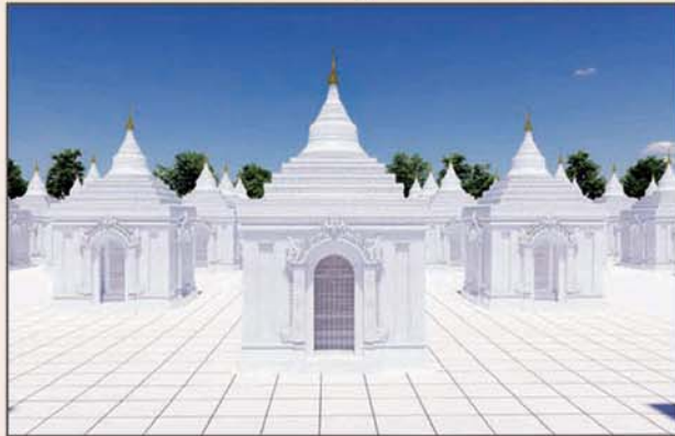
ကျောက်စာရုံစေတီ(၁၂ x ၁၂x ၁၈)ပေ ၁ ဆူ တန်ဖိုး- ၂၇၉ သိန်း