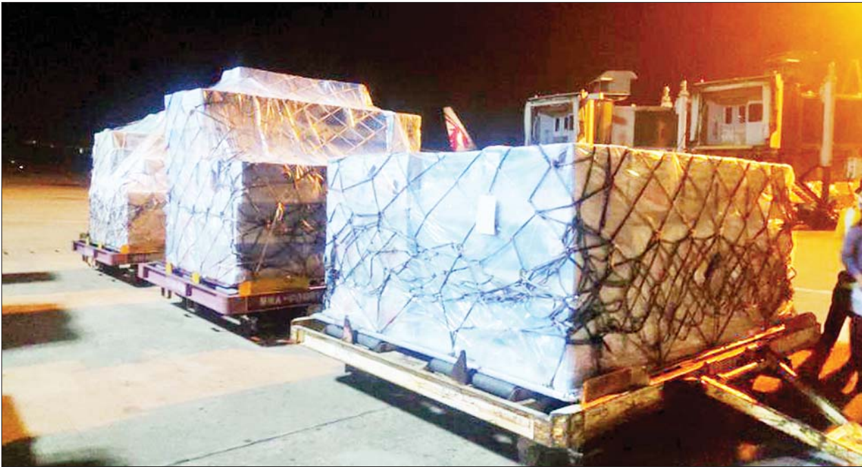
ဂျပန်နိုင်ငံ နီပွန်ဖောင်ဒေးရှင်းက မြန်မာနိုင်ငံသို့ လှူဒါန်းသည့် ကိုဗစ်-၁၉ ရောဂါကာကွယ်ဆေး Covaxin တစ်သန်း ရန်ကုန်အပြည်ပြည်ဆိုင်ရာလေဆိပ်သို့ ရောက်ရှိစဉ်။