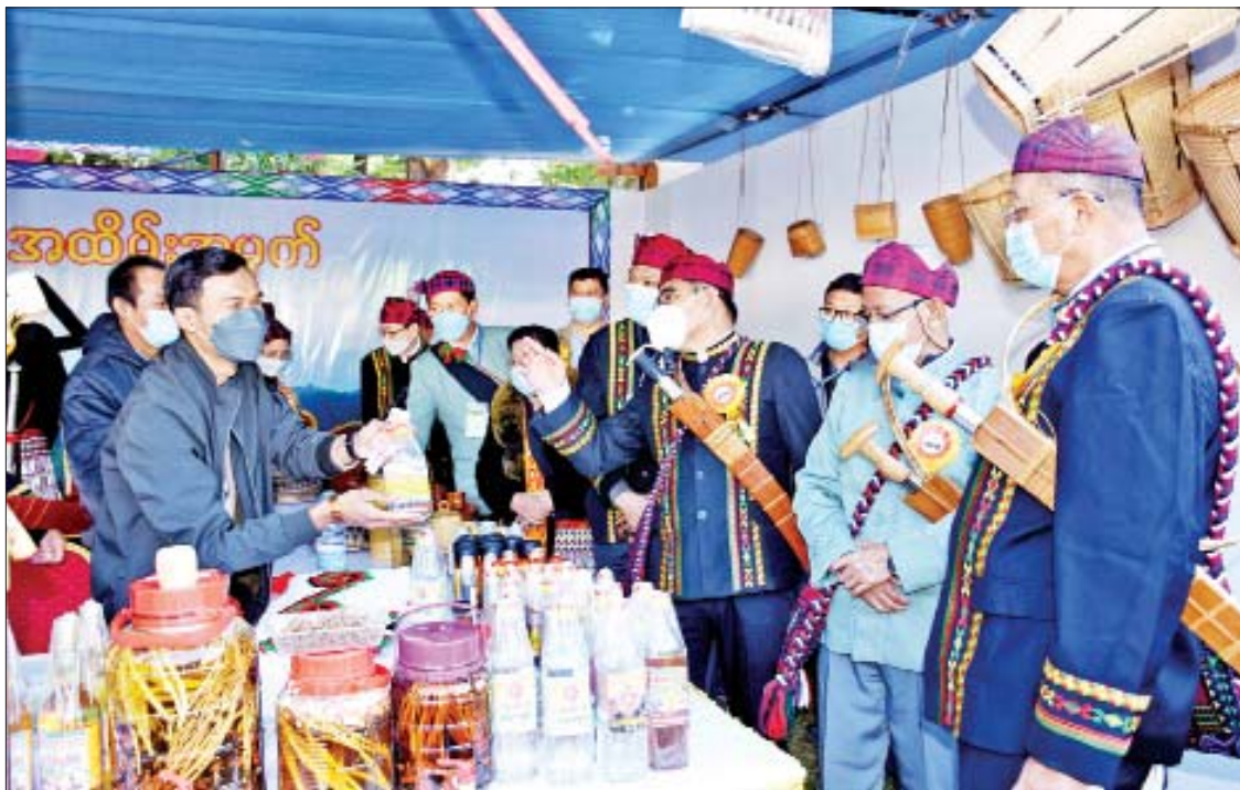
နိုင်ငံတော်စီမံအုပ်ချုပ်ရေးကောင်စီအဖွဲ့ဝင်များ၊ ပြည်ထောင်စုဝန်ကြီးများနှင့် တာဝန်ရှိသူများ (၇၄)နှစ်မြောက် ကချင် ပြည်နယ်နေ့ အခမ်းအနားတွင် ခင်းကျင်းပြသထားသည့် ရိုးရာထုတ်ကုန်ပြခန်းကို ကြည့်ရှုအားပေးစဉ်။