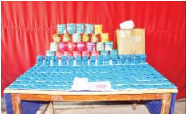
သိမ်းဆည်းရမိသည့် စိတ်ကြွေးသွပ်ဆေးပြားများကို တွေ့ရစဉ်။