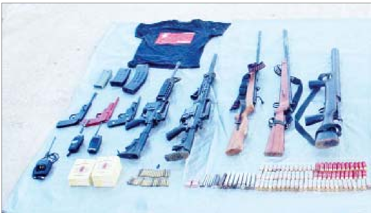
ယင်းမာပင်မြို့နယ်အတွင်း အကြမ်းဖက်လုပ်ငန်းများ လုပ်ဆောင်ရန် ဦးနှောက်ကျေးရွာ၌ စုဝေးရောက်ရှိနေသည့် အကြမ်းဖက်အဖွဲ့များ အား ဝင်ရောက်ဖမ်းဆီးစဉ် သိမ်းဆည်းရမိသည့် လက်နက်၊ ခဲယမ်းများကို တွေ့ရစဉ်။