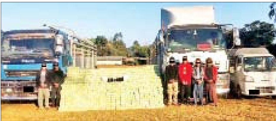
ဖြစ်မှုကျူးလွန်သူများအား သိမ်းဆည်းရမိသည့် အိုက်စ (မက်သ်အဖက်တမင်း)များနှင့်အတူ တွေ့ရစဉ်။

ဖြစ်စဉ်မှာ မူးယစ်ဆေးဝါး တားဆီးနှိမ်နင်းရေး ရဲတပ်ဖွဲ့မှ တပ်ဖွဲ့ဝင်များပါဝင်သော ပူးပေါင်းအဖွဲ့သည် ဇန်နဝါရီ ၇ ရက် ညနေ ၆ နာရီခန့်တွင် ရှမ်းပြည်နယ် (တောင်ပိုင်း) လွိုင်လင်မြို့နယ် လွိုင်လင်-တောင်ကြီးသွားကားလမ်း ဟိုတင်ကျေးရွာအနီး၌ လွိုင်လင်မှ တောင်ကြီးဘက်သို့ မြင့်စိုး မောင်းနှင်ပြီး ကျော်စိုင်း (ခ) အားကျိုး လိုက်ပါလာသည့် ISUZU ၁၂ ဘီးယာဉ်အား အရ ရှာဖွေရာ ယာဉ်ပေါ်မှ အိုက်စ (မက်သ်အဖက်တမင်း) ၆၃၅ ကီလို သိမ်းဆည်းရမိခဲ့ပြီး သတင်းကွင်းဆက်အရ ည ၇ နာရီခန့်တွင်