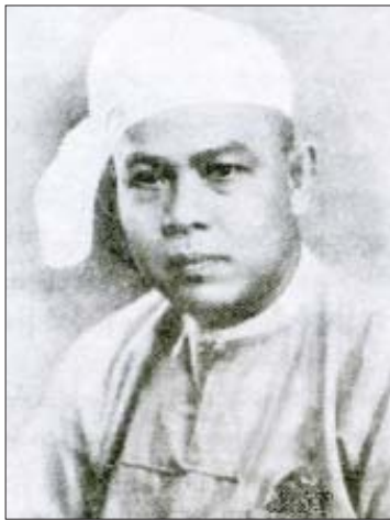
မြတ်သူဘားမား ဦးညွန့်

ဘယ်သူတွေကတော့ မိမိတို့နိုင်ငံ၊ မိမိတို့လူမျိုးကို ဘေးဒုက္ခအမျိုးမျိုး၊ ကပ်ဆိုးရောဂါဆိုး ပျံ့နှံ့ကူးစက် သေကျေပျက်စီးစေချင်နေတာလဲ။ လက်တွေ့ထင်ထင်ရှားရှား ခွဲခြားပြီး သိရမြင်ရတာက အမြတ်ပဲပေါ့။ အင်္ဂလန်တို့၊ ဥရောပတို့၊ အမေရိကန်တို့မှာလည်း ကပ်ရောဂါ