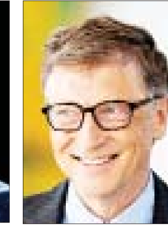
ဘီလ်ဂိတ်

မေးမြန်းလေ့လာ အမှတ်စဉ်(၅)အချက် လူတွေနဲ့ စကားပြောပါဆိုတာ ကိုယ်ကသွားပြီးလေ ပေါနေဖို့ မဟုတ်ပါ။ သူတို့အမြင်၊ သူတို့ အတွေး၊ သူတို့ဘဝအတွေးအကြံ၊ သူတို့ ခံစားချက်၊ သူတို့ထင်မြင်ချက်၊ သူတို့ရဲ့ လက်တွေ့ဘဝထဲကို ထဲထဲဝင်ဝင် သိမြင် နားလည်ပါမှ ကိုယ်ပြောမယ့်၊ လုပ်မယ့်၊