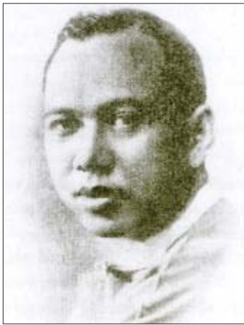
ပဲရော့ ဦးဆန်နီ

မြန်မာနိုင်ငံမှာလည်း ကမ္ဘာနိုင်ငံအချို့မှာ စတင်ဖြစ်ပွားစဉ်ကပင် ဒီရောဂါဟာ ပေါ့ဆလို့မရဘူး။ စနစ်တကျ စည်းကမ်းလိုက်နာပြီး ကျန်းမာရေးသတိရှိရှိ ကြိုတင်ကာကွယ်ခြင်း၊ ကာကွယ်တဲ့ နှာခေါင်းစည်းတပ်ခြင်း၊ လူစုလူဝေးကို ရှောင်ကြဉ်ခြင်း၊ လူစုလူအုပ်စုရုံးများ မပြုလုပ်ခြင်း၊ မကြာခဏလက်ကို ဆပ်ပြာနဲ့ ဆေးကြောခြင်း၊ တစ်ယောက်နဲ့ တစ်ယောက်ခြောက်ပေအကွာထက် ပိုပြီးမကပ်ခြင်း စတဲ့ စည်းကမ်းတွေကို လိုက်နာကြတဲ့ အရပ်ဒေသတွေမှာ ရောဂါဖြစ်တာနည်းတယ်။ သက်သာတယ်။ အသေအကျေ နည်းတယ်။