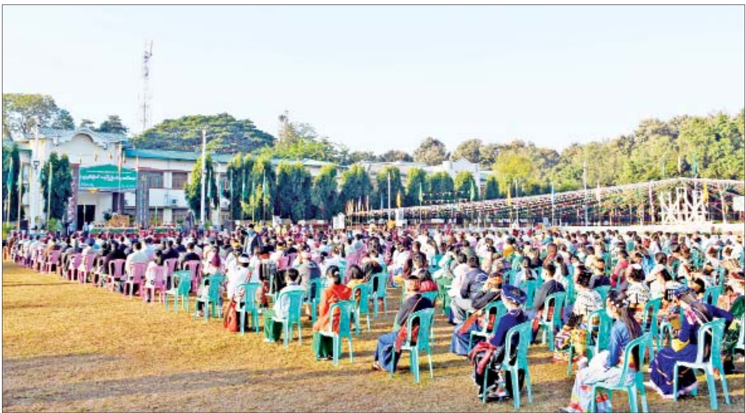
(၇၄)နှစ်မြောက် ကချင်ပြည်နယ်နေ့ အခမ်းအနားကျင်းပစဉ်။

ထို့နောက် နိုင်ငံတော်စီမံအုပ်ချုပ်ရေး ကောင်စီအဖွဲ့ဝင်များနှင့် ပြည်ထောင်စု