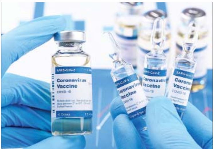
ရောဂါဖြင့် သေဆုံးခဲ့ကြောင်း သိရသည်။ အနက် ၁၁၆ သန်းကို ဒုတိယအကြိမ် ထိုးနှံရန် အင်ဒိုနီးရှားအစိုးရသည် ကိုဗစ်-၁၉ ရောဂါ ကာကွယ်ဆေး ထိုးနှံ ပေးခဲ့ပြီးဖြစ်သည်။ ကိုးကား - အေပီ ဘာသာပြန် - ဂျေတီ

အင်ဒိုနီးရှားအစိုးရသည် ယမန်နှစ် ဇူလိုင်လအတွင်းက တတိယအကြိမ် အပိုဆောင်းကိုဗစ်-၁၉ ရောဂါ ကာကွယ် ဆေးထိုးနှံရန်လိုအပ်သော ကာကွယ်ဆေး များအား ကျန်းမာရေးဝန်ထမ်းများ အတွက် ဖြန့်ဖြူးခဲ့သည်။ ထို့ပြင် သက်ကြီးရွယ်အိုများနှင့် ကိုဗစ်-၁၉ ရောဂါ ကူးစက်ခံရဖွယ် အန္တရာယ်များသော ပြည်သူများအတွက် အပိုဆောင်း ကိုဗစ်-၁၉ ရောဂါ ကာကွယ် ဆေးကို အခမဲ့ဖြန့်ဖြူးပေးခဲ့ပြီးဖြစ်ကြောင်း သိရသည်။ ဇန်နဝါရီ ၉ ရက်အထိ ရရှိသည့် အချက်အလက်များအရ အင်ဒိုနီးရှားနိုင်ငံ တွင် ကိုဗစ်-၁၉ ရောဂါ ကူးစက်ခံရသူ ပေါင်း ၄ ဒသမ ၂ သန်းကျော်ရှိပြီး ၎င်းတို့ အနက် ၁၄၄၀၀၀ ကျော်သည် အဆိုပါ