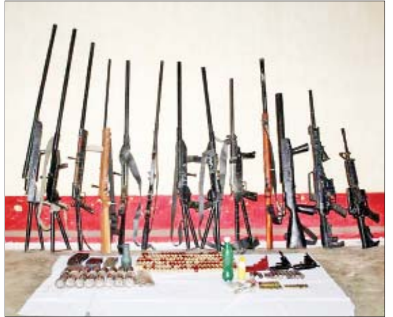
ယင်းမာပင်မြို့နယ်အတွင်း အကြမ်းဖက်လုပ်ငန်းများလုပ်ဆောင်ရန် ဦးနှောက်ကျေးရွာသို့ စုဝေးရောက်ရှိနေသည့် အကြမ်းဖက်အဖွဲ့များအား ဝင်ရောက်ဖမ်းဆီးစဉ် သိမ်းဆည်းရမိသည့် လက်နက်၊ ခဲယမ်းများကို တွေ့ရစဉ်။