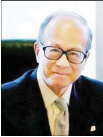
လီကာရှင်း

၂။ Contribute - လူ့အဖွဲ့အစည်း to society အတွင်းမှာ အပြု သဘော ပါဝင် လုပ်ဆောင်ပါ။