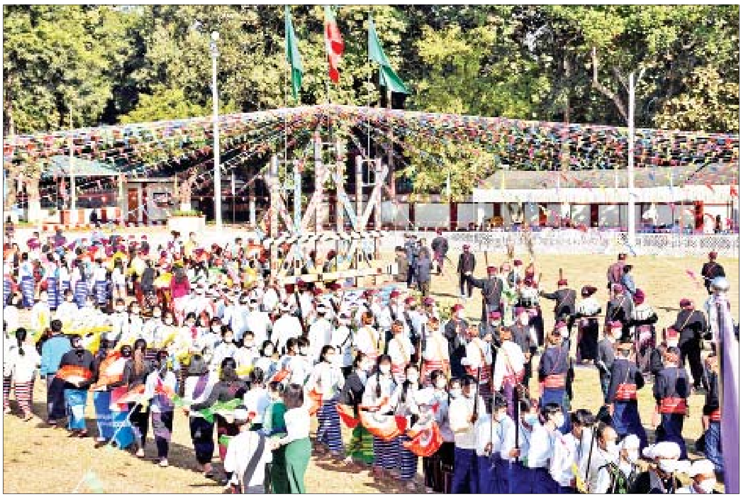
နိုင်ငံတော်စီမံအုပ်ချုပ်ရေးကောင်စီအဖွဲ့ဝင်များ၊ ပြည်ထောင်စုဝန်ကြီးများ၊ တာဝန်ရှိသူများနှင့် ဒေသခံတိုင်းရင်းသားများ ကချင်ရိုးရာမနောပွဲတော်ကို ပျော်ရွှင်စွာ ပါဝင်ဆင်နွှဲကြသည်။

နေပြည်တော် ဇန်နဝါရီ ၁၀ (၇၄)နှစ်မြောက် ကချင်ပြည်နယ်နေ့ အခမ်းအနားကို ယနေ့ နံနက်ပိုင်းတွင် ကချင်ပြည်နယ် အစိုးရအဖွဲ့ရုံး မြက်ခင်း ပြင်၌ ပြုလုပ်သည်။ တက်ရောက် အခမ်းအနားသို့ နိုင်ငံတော်စီမံ အုပ်ချုပ်ရေးကောင်စီအဖွဲ့ဝင် Jeng Phang နော်တောင်၊ ဦးမောင်ဟာ၊ ဦးစိုင်းလုံးဆိုင်း၊ ဦးရွှေကြိမ်း၊ ပြည်ထောင်စု ဝန်ကြီးများဖြစ်ကြသည့် ဒုတိယ ဗိုလ်ချုပ်ကြီးထွန်းထွန်းနောင်၊ ဦးခင်ရီ၊ ဦးစောထွန်းအောင်မြင့်၊ ပြည်နယ် ဝန်ကြီးချုပ် ဦးခက်ထိန်နန်နှင့် အဖွဲ့ဝင် များ၊ မြောက်ပိုင်းတိုင်းစစ်ဌာနချုပ် တိုင်းမှူး ဗိုလ်မှူးချုပ်မြတ်သက်ဦးနှင့် အဖွဲ့ဝင်များ၊ ဌာနဆိုင်ရာများမှ တာဝန် ရှိသူများနှင့် ဒေသခံတိုင်းရင်းသား ပြည်သူများ တက်ရောက်ကြသည်။ ဦးစွာ နိုင်ငံတော်စီမံအုပ်ချုပ်ရေး ကောင်စီအဖွဲ့ဝင်များ၊ ပြည်ထောင်စု ဝန်ကြီးများနှင့် တက်ရောက်လာကြသည့် ဧည့်ပရိသတ်များက နိုင်ငံတော်အလံအား အလေးပြုကြသည်။ ထို့နောက် ပြည်ထောင်စုသမ္မတ မြန်မာနိုင်ငံတော် နိုင်ငံတော်စီမံအုပ်ချုပ် ရေးကောင်စီဥက္ကဋ္ဌ၊ နိုင်ငံတော်ဝန်ကြီးချုပ် စာမျက်နှာ ၃ ကော်လံ ၁ သို့ ☸