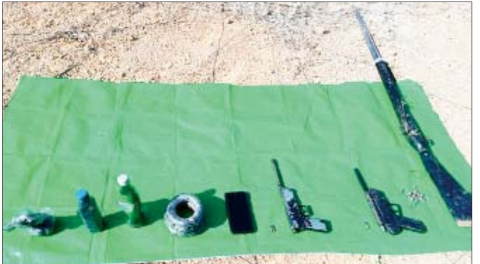
တကောင်းနီကယ်စက်ရုံအား သွယ်တန်းထားသည့် လျှပ်စစ်တာဝါတိုင်များအား မိုင်းထောင်ဖောက်ဆီးခဲ့သည့် အကြမ်းဖက်သမားများထံမှ သိမ်းဆည်းရမိသည့် လက်နက်/ခဲယမ်းများနှင့် ဆက်စပ်ပစ္စည်းများကို တွေ့ရစဉ်။

အခြားဆေးဝါးများ၏ဈေးနှုန်းများကို Website (www.mccpmd.org)နှင့် Facebook Page https://www.facebook.com/323302521392189/posts/1720802588308835/?d=n တို့တွင် ဝင်ရောက်ကြည့်ရှုနိုင်ပါသည်။