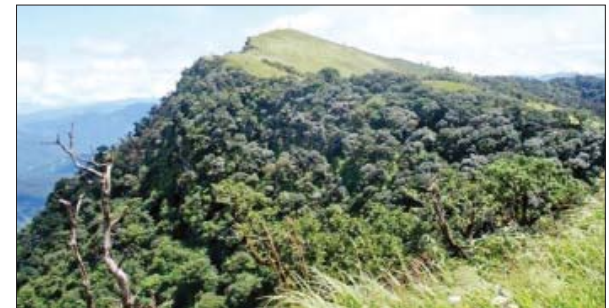
ဇိန်မူတောင် အမျိုးသားဥယျာဉ်