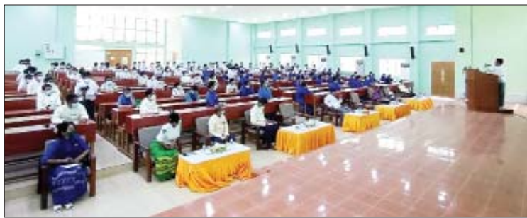
သို့ မြန်မာနိုင်ငံသတင်းမီဒီယာကောင်စီ ဥက္ကဋ္ဌ ဦးအုန်းမောင် (မြင်းမူမောင်နိုင်မိုး)၊ ဝန်ကြီးဌာန ဦးအောင်ပြည့်စုံ၊ ကောင်စီ

ရန်ကုန် မတ် ၁၅ မြန်မာနိုင်ငံ သတင်းမီဒီယာ ကောင်စီနှင့် နယ်စပ်ရေးရာဝန်ကြီးဌာန (ပညာရေးနှင့် လေ့ကျင့်ရေးဦးစီးဌာန) တို့ပူးပေါင်း၍ သတင်းအမှား၊ သတင်းအမှန် ခွဲခြားသုံးသပ်နိုင်ရေး အသိပညာပေးဟောပြောပွဲကို ယနေ့တွင် ပြည်ထောင်စုတိုင်းရင်းသားလူငယ်များ စွမ်းရည်ဖွံ့ဖြိုးရေး ဒီဂရီကောလိပ် (ရန်ကုန်) Theatre ခန်းမ၌ ကျင်းပသည်။ အဆိုပါ အသိပညာပေးဟောပြောပွဲ