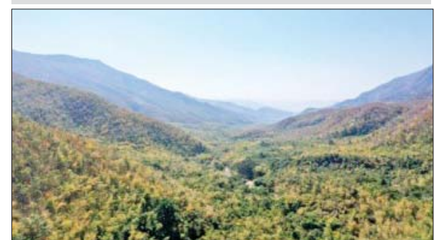
ဟန်လင်းတောင် ကြိုးပြင်ကာကွယ်တော