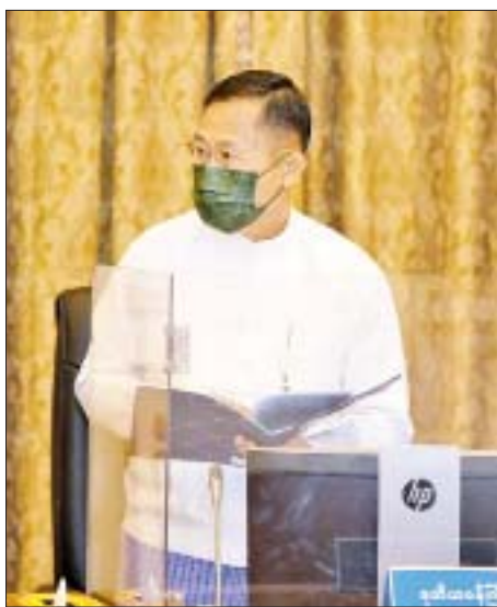
အမျိုးသားစီမံကိန်းကော်မရှင် ဒုတိယဥက္ကဋ္ဌ ဒုတိယဝန်ကြီးချုပ် ဒုတိယဗိုလ်ချုပ်မှူးကြီး စိုးဝင်း ဆွေးနွေးပြောကြားစဉ်။

အလားတူ ကျန်းမာသန်စွမ်းသည့် လူမှုအဖွဲ့အစည်း တည်ထောင်နိုင်ရေးနှင့် လူတစ်ဦးချင်းစီ၏ ပျမ်းမျှသက်တမ်းတိုးမြှင့်နိုင်ရန်အတွက် ကျန်းမာရေး ဝန်ဆောင်မှုများ တိုးမြှင့်ခြင်း၊ ဘေးအန္တရာယ် ကင်းရှင်းပြီး လုံခြုံစိတ်ချရသည့် အစားအသောက် များကို မျှတစွာစားသုံးနိုင်ရန် ပညာပေးလုပ်ငန်းများ မြှင့်တင်ခြင်း၊ အစားအစာဘေးကင်းလုံခြုံရန်အတွက် စစ်ဆေးခြင်းများနှင့် ကျန်းမာရေးအတွက် လိုအပ် သည့်ဆေးဝါးနှင့် ကုသရေးကိရိယာများ ခေတ်မီစွာ သုံးစွဲနိုင်ရေးကိုလည်း အလေးထားဆောင်ရွက်မည့် အစီအမံများကိုလည်း ရေးဆွဲရမည်ဖြစ်ပါကြောင်း၊ တိုင်းရင်းဆေးဝါးများ အဆင့်မြှင့်တင်နိုင်ရန်နှင့် ကျေးလက်ဒေသ ကျန်းမာရေးလုပ်ငန်းများ လက်လှမ်းမီစေရေးအတွက်လည်း ဘဏ္ဍာငွေခွဲဝေ ချထားပေးလျက်ရှိသည့်အတွက် ရည်မှန်းထားသည့် လုပ်ငန်းများ အောင်မြင်ရေးကို ဝိုင်းဝန်းကြိုးပမ်း ဆောင်ရွက်သွားရမည်ဖြစ်ပါကြောင်း။