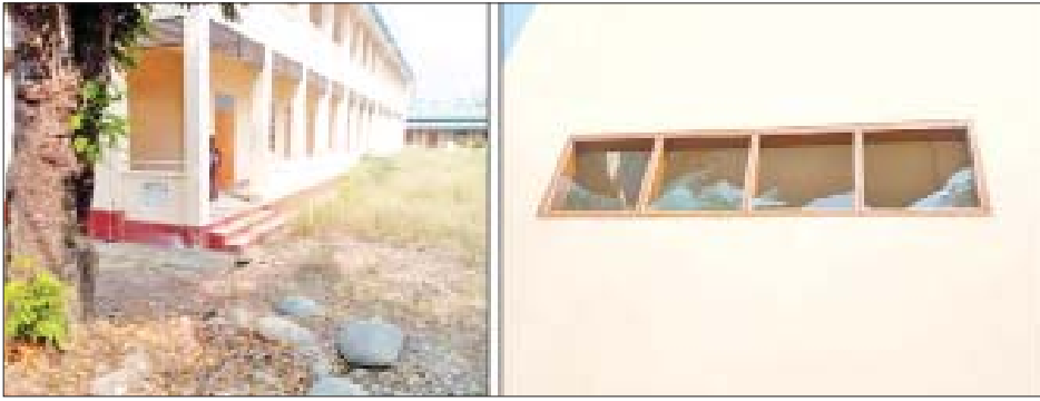
ကလေးမြို့နယ် အမှတ်(၂)အခြေခံပညာအလယ်တန်းကျောင်းဝင်းအတွင်း ပေါက်ကွဲမှု မှတ်တမ်းဓာတ်ပုံ။

နေပြည်တော် မတ် ၁၅ အနာဂတ်လူငယ် လူရွယ်များ ပညာရည် မြင့်မားရေးအတွက် စာသင်ကျောင်းများ ဖွင့်လှစ်၍ စာပေသင်ကြားပေးလျက်ရှိသည့် ကို လိုလားမှုမရှိသည့် နိုင်ငံရေး အစွန်းရောက် အကြမ်းဖက်သမား များအနေဖြင့် ပညာရေးဆိုင်ရာရုံး ဌာနများနှင့် စာသင်ကျောင်းများကို စာမျက်နှာ ၁၄ ကော်လံ ၁ သို့ ❖