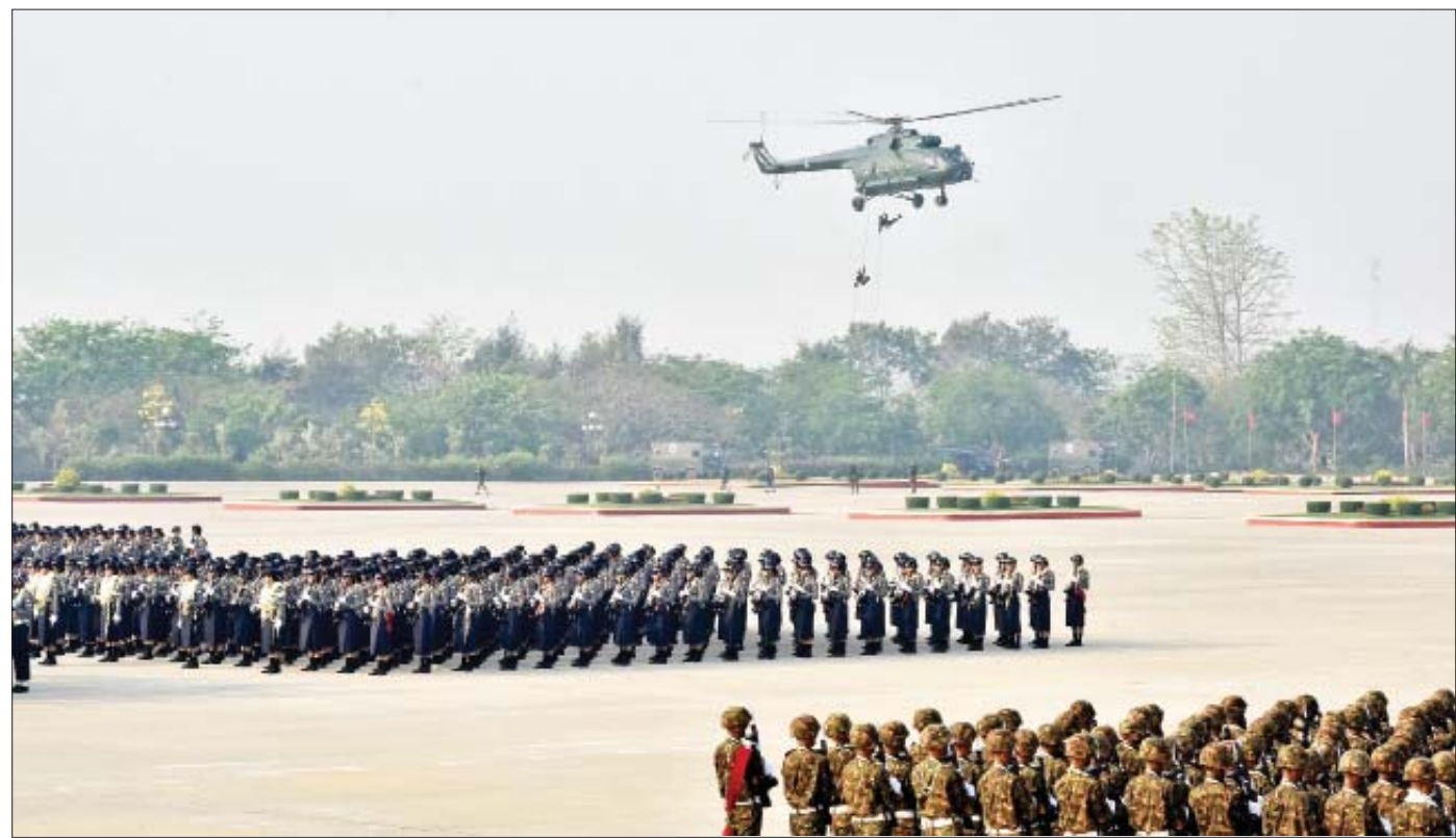
၂၀၁၉ ခုနှစ် (၇၄) နှစ်မြောက်တပ်မတော်နေ့ စစ်ရေးပြအခမ်းအနားကျင်းပစဉ်။

မြန်မာနိုင်ငံ လွတ်လပ်ရေးရရှိပြီးသည့်အချိန်မှ စ၍ ပေါ်ပေါက်လာခဲ့သော ပြည်တွင်းရောင်စုံ သောင်းကျန်းသူများနှင့် ပြည်ပကျူးကျော်မှုများကို တပ်မတော်သည် ရင်ဆိုင်ဖြေရှင်း နှိမ်နင်းခဲ့ရပြန်