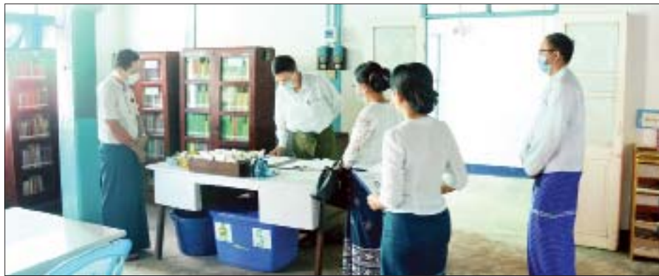
ဒုတိယဝန်ကြီး ဦးရဲတင့် တောင်ငူခရိုင် ပြန်ကြားရေးနှင့် ပြည်သူ့ဆက်ဆံရေးဦးစီးဌာနရုံး စာကြည့်တိုက်ကို ကြည့်ရှုစစ်ဆေးစဉ်။

ထို့နောက် ညောင်လေးပင်မြို့နယ်ရှိ ပြန်ကြားရေးနှင့် ပြည်သူ့ဆက်ဆံရေးဦးစီးဌာနရုံးနှင့် စာကြည့်တိုက်တို့ကို ကြည့်ရှုစစ်ဆေးပြီး မြို့နယ်ဦးစီးအရာရှိနှင့် ဝန်ထမ်းများ၊ ရွှေကျင်၊ ဒိုက်ဦးနှင့် ကျောက်တံခါးမြို့နယ်တို့မှ မြို့နယ်ဦးစီးအရာရှိများအား တွေ့ဆုံသည်။ မွန်းလွဲပိုင်းတွင် တောင်ငူခရိုင် ပြန်ကြားရေးနှင့် ပြည်သူ့ဆက်ဆံရေးဦးစီးဌာနရုံးနှင့် စာကြည့်တိုက်တို့ကို ကြည့်ရှုစစ်ဆေးပြီး ခရိုင်လက်ထောက်ညွှန်ကြားရေးမှူးချုပ်နှင့် ဝန်ထမ်းများ၊ ပြူး၊ အုတ်တွင်း၊