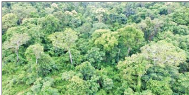
ခါချင်တောင် ကြိုးပြင်ကာကွယ်တော

၁-၂-၂၀၂၁ ရက်မှ ၁-၂-၂၀၂၂ ရက်နေ့ထိ ကြိုးဝိုင်း/ ကြိုးပြင် ကာကွယ်တော (၄၀၄,၁၅၈)ဧက၊ သဘာဝထိန်းသိမ်းရေးနယ်မြေ (၅၈၁,၈၀၄)ဧက ဖွဲ့စည်းနိုင်ခဲ့ရာ ယနေ့အထိ ကြိုးဝိုင်း/ ကြိုးပြင် ကာကွယ်တောဧရိယာ (၄၃,၁၁၁,၇၀၅)ဧက နိုင်ငံ့ဧရိယာ၏ (၂၅.၇၉) ရာခိုင်နှုန်း၊ သဘာဝထိန်းသိမ်းရေးနယ်မြေဧရိယာ (၁၀,၇၅၀,၆၂၅) ဧက နိုင်ငံ့ဧရိယာ၏ (၆.၄၃)ရာခိုင်နှုန်း ဖွဲ့စည်းသတ်မှတ်နိုင်ခဲ့ပြီး ဖြစ်သည်။ ထိုကဲ့သို့ဖွဲ့စည်းသတ်မှတ်နိုင်ခြင်းကြောင့် ရာသီဥတုပြောင်းလဲမှု လျော့ချနိုင်ခြင်း၊ ဇီဝမျိုးစုံမျိုးကွဲများနှင့် မျိုးဆက်ပျက်သုဉ်းမှုအန္တရာယ် ရှိသည့် တောရိုင်းတိရစ္ဆာန်များ၊ အပင်မျိုးစိတ်များနှင့် ယင်းတို့၏ နေရင်းဒေသများကို ကာကွယ်ထိန်းသိမ်းနိုင်ခြင်း၊ ဂေဟစနစ် ပိုမိုကောင်းမွန်စေပြီး ပတ်ဝန်းကျင်ဆိုင်ရာ ဝန်ဆောင်မှုများ တိုးပွား လာခြင်း၊ သဘာဝရေထွက်များနှင့် ရေဝေရေလဲဒေသများကို ကာကွယ်ထိန်းသိမ်းနိုင်ခြင်း၊ သဘာဝဘေးအန္တရာယ်ကို တားဆီး ကာကွယ်နိုင်ခြင်း၊ သဘာဝသယံဇာတများကို ထိန်းသိမ်းကာကွယ် နိုင်ခြင်းနှင့် သစ်တောထွက်ပစ္စည်းများကို စဉ်ဆက်မပြတ် ထုတ်ယူသုံးစွဲနိုင်ခြင်း စသည့်အကျိုးကျေးဇူးများ ရရှိနိုင်မည် ဖြစ်သည်။ သယံဇာတနှင့်သဘာဝပတ်ဝန်းကျင်ထိန်းသိမ်းရေးဝန်ကြီးဌာန