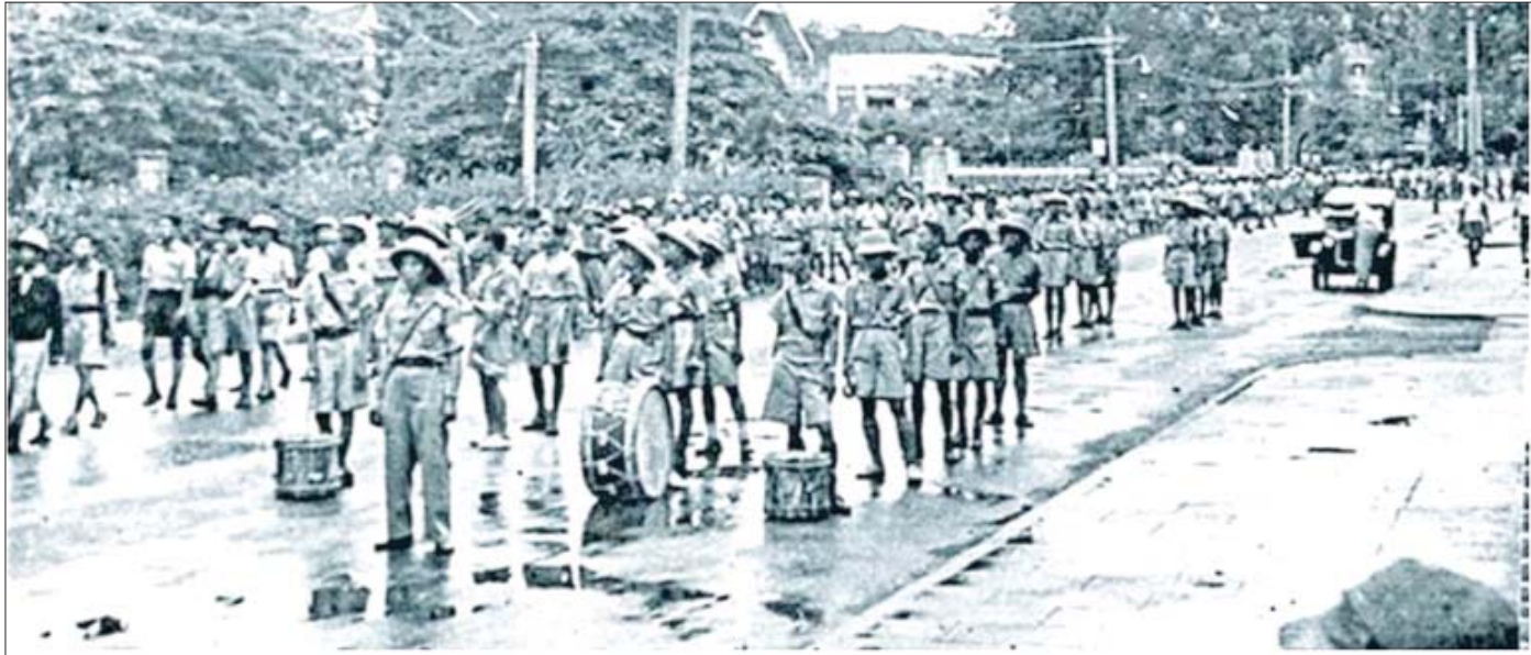
မြန်မာ့လွတ်လပ်ရေး ပြန်လည်ရရှိရန် တိုက်ပွဲဝင်ခဲ့သော ဗမာ့လွတ်လပ်ရေးတပ်မတော် (ဘီအိုင်အေ) ရန်ကုန်မြို့သို့ ရောက်ရှိလာစဉ်။

အမျိုးသားနိုင်ငံရေးစိတ်ဓာတ် တပ်မတော်သည် မြန်မာတိုင်းရင်းသားပြည်သူတို့၏ အမျိုးသားလွတ်မြောက်ရေး သမိုင်းစဉ်နှင့် တစ်ဆက်တစ်စပ်တည်းဖြစ်ပေါ်လာသော အမျိုးသားနိုင်ငံရေး အသိစိတ်ဓာတ်အပြည့်အဝဖြင့် ပေါက်ဖွားလာခဲ့သော အဖွဲ့အစည်းဖြစ်ပါသည်။ သူ့ကျွန်မခံသည့် စွန့်လွှတ်စွန့်စားသော လက်နက်ကိုင်တိုက်ပွဲများ၊ တိုင်းချစ်ပြည်ချစ် စိတ်ဓာတ်အပြည့်အဝဖြင့် လှုပ်ရှားသည့် နိုင်ငံရေးတိုက်ပွဲများ၊ ကျောင်းသားသပိတ်တိုက်ပွဲများ၊ တောင်သူလယ်သမားအရေးတော်ပုံ၊ အလုပ်သမားအရေးတော်ပုံ၊ လူထုတိုက်ပွဲများ၊ လက်ရုံးတပ်များ၊ အမျိုးသားရဲတပ်ဖွဲ့များ၊ သံမဏိတပ်ဖွဲ့များ၏ အသွင်အမျိုးမျိုး လှုပ်ရှားမှုများနှင့် တစ်ဆက်တစ်စပ်တည်း ပေါ်ပေါက်လာသော အဖွဲ့အစည်းဖြစ်ပါသည်။