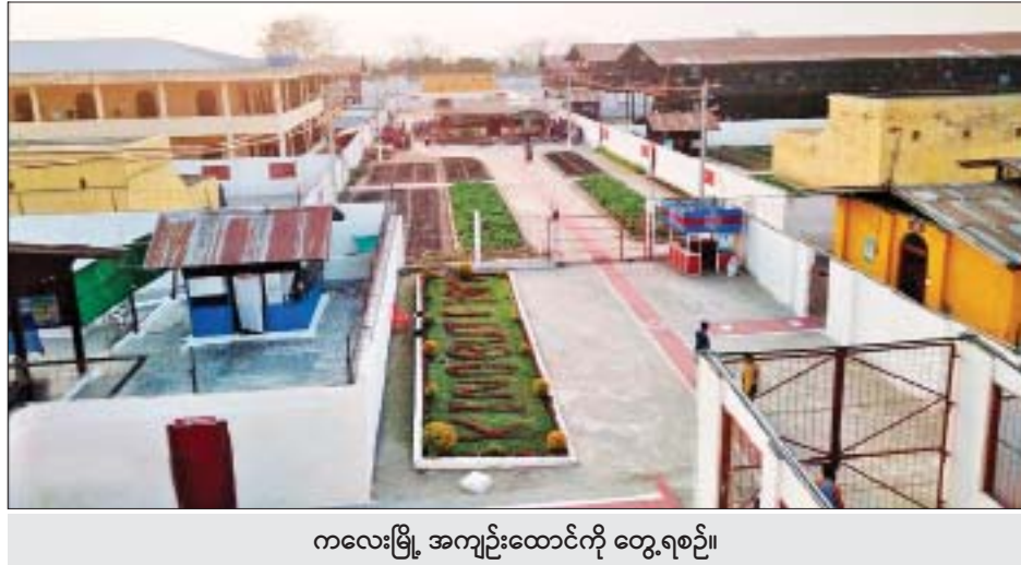
ကလေးမြို့ အကျဉ်းထောင်ကို တွေ့ရစဉ်။