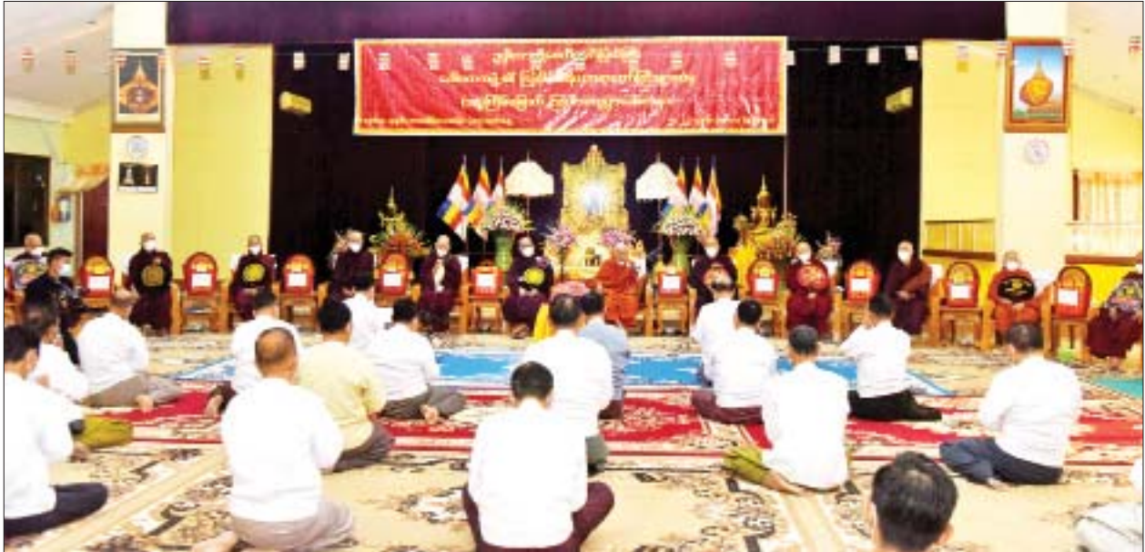
ပြည်ထောင်စုဝန်ကြီး ဦးကိုကို၊ နေပြည်တော်ကောင်စီဥက္ကဋ္ဌ ဒေါက်တာမောင်မောင်နိုင်နှင့် အခမ်းအနားတက်ရောက်လာကြသူများက မန္တလေးမြို့ ဗန်းမော်ကျောင်းတိုက်ဆရာတော် ဒေါက်တာဘဒ္ဒန္တကုမာရာ ဘိဝံသထံမှ ငါးပါးသီလခံယူကြစဉ်။

အခမ်းအနားသို့ ဥပ္ပိတသန္တိစေတီတော်ဂေါပကအဖွဲ့၏ ဩဝါဒါစရိယ နိုင်ငံတော် သံဃမဟာနာယကအဖွဲ့ဥက္ကဋ္ဌ အဘိဓမ္မမဟာရဋ္ဌဂုရု အဘိဓမ္မအဂ္ဂမဟာ သဒ္ဓမ္မဇောတိက မန္တလေးမြို့ ဗန်းမော်ကျောင်းတိုက် ဆရာတော် ဒေါက်တာဘဒ္ဒန္တ ကုမာရာဘိဝံသ အမှူးပြုသော ဥပ္ပိတသန္တိစေတီတော်ဂေါပကအဖွဲ့၏ ဩဝါဒါစရိယဆရာတော်များ ကြွရောက်တော်မူကြပြီး သာသနာရေးနှင့် ယဉ်ကျေးမှုဝန်ကြီးဌာန ပြည်ထောင်စုဝန်ကြီးဦးကိုကို၊ နေပြည်တော်ကောင်စီဥက္ကဋ္ဌ ဒေါက်တာမောင်မောင်နိုင်၊ သာသနာရေးနှင့် ယဉ်ကျေးမှုဝန်ကြီးဌာန ဒုတိယဝန်ကြီးများဖြစ်သည့် ဦးအေးထွန်း၊ ဦးထွန်းအံ့၊ နေပြည်တော်ဒုတိယမြို့တော်ဝန် ဦးမောင်မောင်၊ နေပြည်တော်တိုင်းစစ်ဌာနချုပ် ဒုတိယတိုင်းမှူး ဗိုလ်မှူးချုပ်ကျော်စိုးဦး၊ နေပြည်တော်ကောင်စီဝင်များ၊ အမြဲတမ်းအတွင်းဝန်၊ နေပြည်တော် သာသနာရေးမှူး၊ ဂေါပကအဖွဲ့ဝင်များနှင့် တာဝန်ရှိသူများ တက်ရောက်ကြည့်ကြည့်ကြသည်။