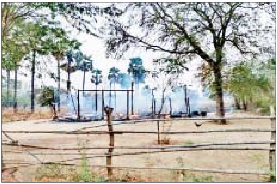
PDF အမည်ခံ အကြမ်းဖက်သမားများက စစ်ကိုင်းမြို့နယ် ညောင်ငုတ်တိုကျေးရွာအတွင်း ပြည်သူများ၏ နေအိမ်များအား မီးရှို့ဖျက်ဆီးထားမှုကို တွေ့ရစဉ်။

နေပြည်တော် ဧပြီ ၇ စစ်ကိုင်းတိုင်းဒေသကြီး စစ်ကိုင်းမြို့နယ် ညောင်ငုတ်တိုကျေးရွာရှိ သစ္စာရွှေရ ဘုန်းတော်ကြီးကျောင်း၌ ဖွင့်လှစ်ထားသည့် “မေတ္တာရိပ်” မိဘမဲ့ဂေဟာမှ စေတနာ့ဝန်ထမ်း ဆရာမတစ်ဦးကို PDF အမည်ခံ အကြမ်းဖက်သမားများက သေနတ်ဖြင့် ရက်စက်စွာ ပစ်ခတ်သတ်ဖြတ်ပြီး ကျေးရွာအတွင်းရှိ ပြည်သူများ၏ နေအိမ်များအား မီးရှို့ဖျက်ဆီးခဲ့ကြောင်း သိရသည်။ ဖြစ်စဉ်မှာ ဧပြီ ၆ ရက် ညနေ ၅ နာရီ ၄၅ မိနစ်ခန့်တွင် စစ်ကိုင်းမြို့နယ် ညောင်ငုတ်တိုကျေးရွာအတွင်းသို့ PDF အမည်ခံ အကြမ်းဖက်သမားများက ဝင်ရောက်လာပြီး ပြည်သူများ၏ နေအိမ်များအား မီးရှို့ဖျက်ဆီးနေကြောင်း သတင်းအရ လုံခြုံရေးတပ်ဖွဲ့ဝင်များပါဝင်သော ပူးပေါင်းအဖွဲ့က သွားရောက်စစ်ဆေးရာ ကျေးရွာအဝင်သို့ရောက်ရှိစဉ် အကြမ်းဖက်သမားများက လုံခြုံရေးတပ်ဖွဲ့ဝင်များအား စာမျက်နှာ ၁၃ ကော်လံ ၁ သို့