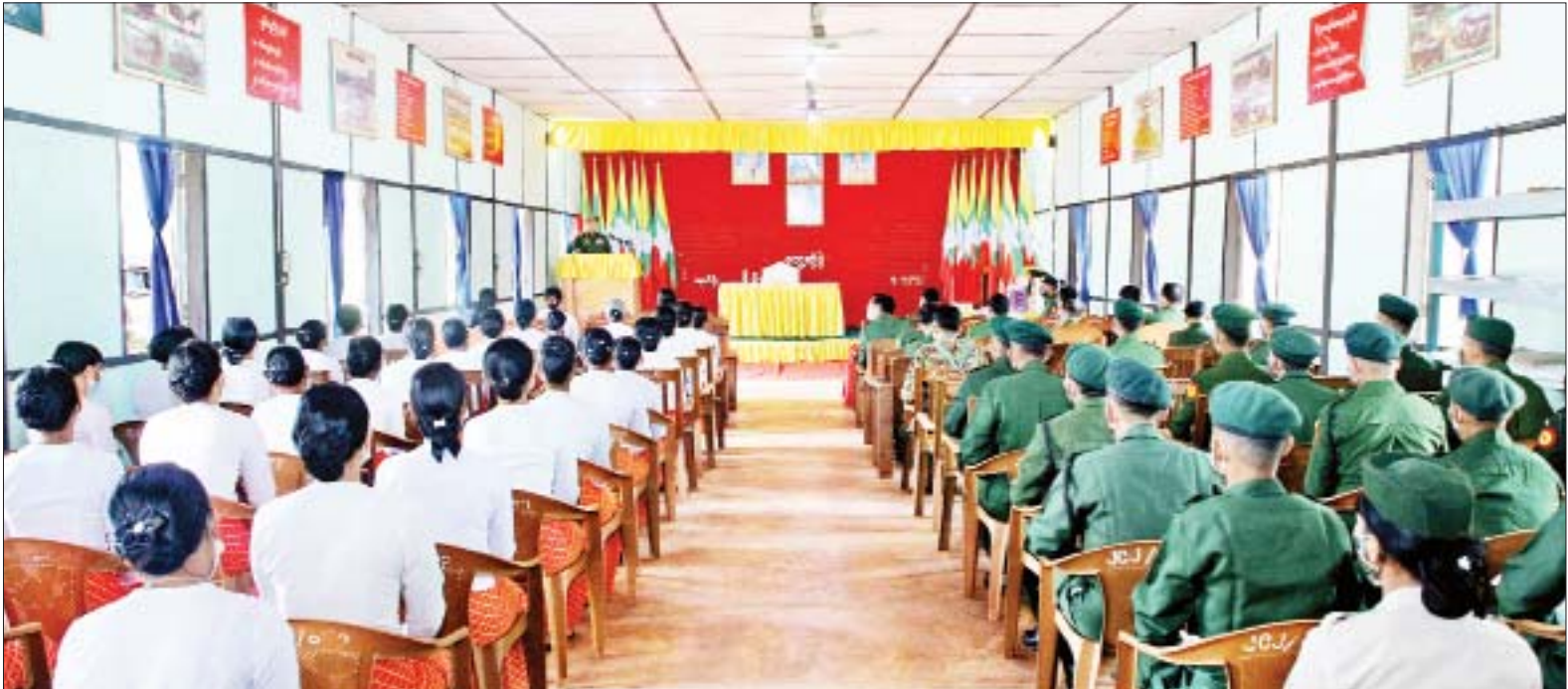
နိုင်ငံတော်စီမံအုပ်ချုပ်ရေးကောင်စီ ဒုတိယဥက္ကဋ္ဌ ဒုတိယတပ်မတော်ကာကွယ်ရေးဦးစီးချုပ် ကာကွယ်ရေးဦးစီးချုပ် (ကြည်း) ဒုတိယဗိုလ်ချုပ်မှူးကြီးစိုးဝင်း နောင်ပိုင်းတပ်နယ်ရှိ အရာရှိ၊ စစ်သည်၊ မိသားစုများအား တွေ့ဆုံအမှာစကားပြောကြားစဉ်။

နေပြည်တော် ဧပြီ ၇ နိုင်ငံတော် စီမံအုပ်ချုပ်ရေး ကောင်စီ ဒုတိယဥက္ကဋ္ဌ ဒုတိယ တပ်မတော်ကာကွယ်ရေးဦးစီးချုပ် ကာကွယ်ရေးဦးစီးချုပ် (ကြည်း) ဒုတိယဗိုလ်ချုပ်မှူးကြီး စိုးဝင်းသည် ကာကွယ်ရေးဦးစီးချုပ်ရုံး(ကြည်း)မှ ဒုတိယဗိုလ်ချုပ်ကြီး အောင်ဇော်အေး၊ ကာကွယ်ရေးဦးစီးချုပ်ရုံး(ကြည်း)၊ ရေ၊ လေ)မှ တပ်မတော်အရာရှိကြီးများ လိုက်ပါ၍ ယနေ့နံနက်ပိုင်းတွင် နောင်ပိုင်း၊ ကျိုင်းခမ်း၊ မိုင်းပျဉ်းနှင့် တောင်ကြီးတပ်နယ်တို့ရှိ နယ်မြေခံတပ်များသို့ သွားရောက်၍ အရာရှိ စစ်သည်၊ မိသားစုများအား သီးခြားစီ တွေ့ဆုံအမှာစကား ပြောကြားသည်။ စာမျက်နှာ ၃ ကော်လံ ၁ သို့ *