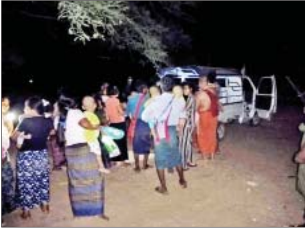
PDF အမည်ခံ အကြမ်းဖက်သမားများ၏ အန္တရာယ်ကို ကြောက်ရွံ့၍ ဘေးလွတ်ရာသို့ ထွက်ပြေးတိမ်းရှောင်နေကြသူများကို တွေ့ရစဉ်။