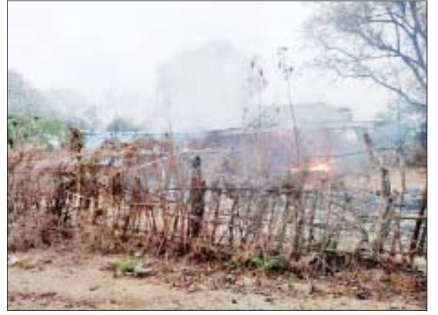
PDF အမည်ခံ အကြမ်းဖက်သမားများက စစ်ကိုင်းမြို့နယ် ညောင်ငုတ်တိုကျေးရွာအတွင်း ပြည်သူများ၏ နေအိမ်များအား မီးရှို့ဖျက်ဆီးထားမှုကို တွေ့ရစဉ်။

ကျောပုံးမှ လက်လုပ်မိုင်း ၁၀ လုံးဖြင့် ဖောက်ခွဲတိုက်ခိုက်ပြီး လက်နက်ငယ်များဖြင့် ဝိုင်းဝန်းပစ်ခတ်ခဲ့သဖြင့် လုံခြုံရေးတပ်ဖွဲ့ဝင်များက ပြန်လည်ခန့်ခွဲပစ်ခတ်ခဲ့ရာ အကြမ်းဖက်သမားများသည် ညောင်ငုတ်တိုကျေးရွာ၏ အရှေ့မြောက်ဘက်သို့ ဆုတ်ခွာထွက်ပြေးသွားခဲ့သည်။ ထို့နောက် လုံခြုံရေးတပ်ဖွဲ့ဝင်များသည် ကျေးရွာအတွင်း ဝင်ရောက်၍ အကြမ်းဖက်သမားများ မီးရှို့ဖျက်ဆီးခဲ့သည့် နေအိမ်များအား ဝိုင်းဝန်းမီးရှို့သတ်ခဲ့သော်လည်း နေအိမ် ၁၃ လုံး မီးလောင်ပျက်စီးဆုံးရှုံးခဲ့ကြောင်း သိရသည်။ ထို့ပြင် အဆိုပါကျေးရွာရှိ သစ္စာရွှေဂူ