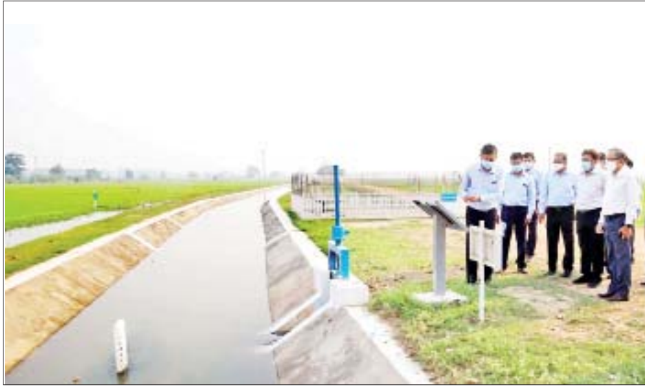
ပြည်ထောင်စုဝန်ကြီး ဦးတင်ထွဋ်ဦး ဆည်ရေပေးဝေမှုတိုးတက်ခေတ်မီရေး ရှေ့ပြေးစီမံကိန်းလုပ်ငန်း များ အကောင်အထည်ဖော်ဆောင်ရွက်နေမှုများကို ကြည့်ရှုစစ်ဆေးစဉ်။

တင်ပြချက်များနှင့်စပ်လျဉ်း၍ ပြည်ထောင်စု ဝန်ကြီးက ဌာနကစံနမူနာပြုဆောင်ရွက်ပေးခြင်း သည် ရေရှည်တွင် လယ်သမားလုပ်နိုင်သော နည်း စနစ်ဖြစ်ရန်နှင့် လက်တွေ့အကျိုးရှိရန်လိုကြောင်း၊ တူးမြောင်းများ ရေသယ်ယူမှု ပိုမိုကောင်းမွန် လာရေး၊ ရေအလေအလွင့် လျော့နည်းသက်သာ