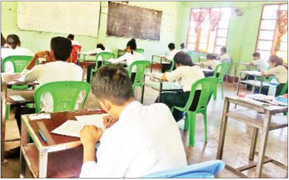
သောကြာနေ့တွင် သမိုင်းဘာသာရပ်နှင့် ဧပြီ ၉ ရက် ဖြေဆိုကြရမည်ဖြစ်ကြောင်း သိရသည်။ စနေနေ့တွင် စိတ်ကြိုက်မြန်မာစာဘာသာရပ်ကို သတင်းစဉ်

လုံခြုံရေးအဖွဲ့ဝင်များ၊ ကျန်းမာရေးဝန်ထမ်းများ၊ မီးသတ်တပ်ဖွဲ့ဝင်များနှင့် ရပ်ကွက်/ကျေးရွာအုပ်ချုပ်ရေးအဖွဲ့ဝင်များက စနစ်တကျစောင့်ကြပ်ကြည့်ရှုပေးလျက်ရှိသည်။ ယနေ့တွင် စာမေးပွဲ သတ္တမနေ့အဖြစ် ပထဝီဝင်ဘာသာရပ်များကို ဆက်လက်ဖြေဆိုကြရာ လာရောက်ဖြေဆိုသူ စုစုပေါင်း ၅၄၇၄၃ ဦးရှိကာ ဖြေဆိုသူ ၈၈ ဒသမ ၉၃ ရာခိုင်နှုန်းရှိကြောင်း ပညာရေးဝန်ကြီးဌာနမှ သိရသည်။ ထိုသို့ ကျောင်းသားကျောင်းသူများ၏ ၂၀၂၁-၂၀၂၂ ပညာသင်နှစ် တက္ကသိုလ်ဝင်စာမေးပွဲ ဖြေဆိုနေမှုများကို တိုင်းဒေသကြီးနှင့် ပြည်နယ်အလိုက် တာဝန်ရှိသူများက သွားရောက်ကြည့်ရှုအားပေး၍ လိုအပ်သည်များ ညှိနှိုင်းဆောင်ရွက်ပေးကြသည်။ တက္ကသိုလ်ဝင်စာမေးပွဲကို ဧပြီ ၈ ရက်