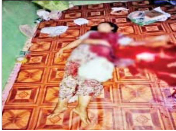
PDF အမည်ခံ အကြမ်းဖက်သမားများ၏ သေနတ်ဖြင့် ပစ်ခတ်မှုကြောင့် သေဆုံးခဲ့သည့် စေတနာ့ဝန်ထမ်း ဆရာမ ဒေါ်ဟေမာ။