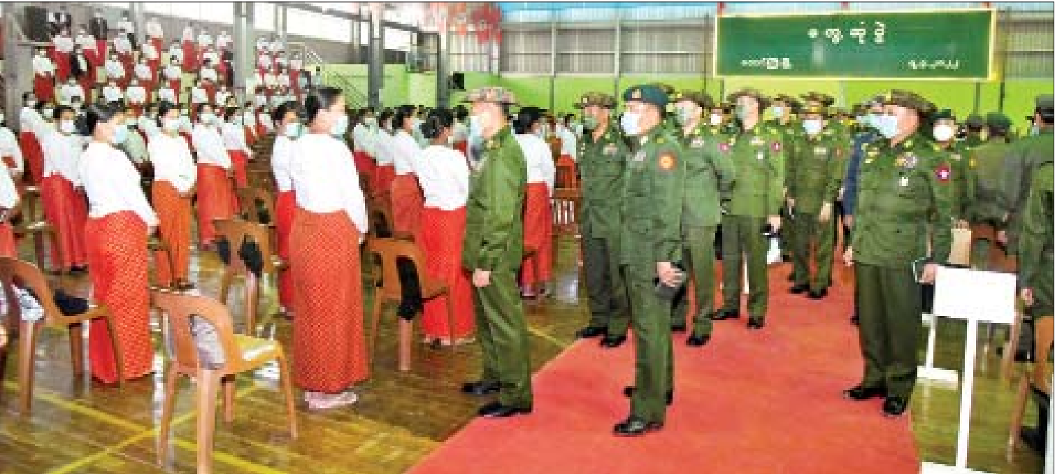
နိုင်ငံတော်စီမံအုပ်ချုပ်ရေးကောင်စီဒုတိယဥက္ကဋ္ဌ ဒုတိယတပ်မတော်ကာကွယ်ရေးဦးစီးချုပ် ကာကွယ်ရေးဦးစီးချုပ်(ကြည်း) ဒုတိယဗိုလ်ချုပ်မှူးကြီး စိုးဝင်း တောင်ကြီးတပ်နယ်ရှိ အရာရှိ၊ စစ်သည်၊ မိသားစုများအား ရင်းရင်းနှီးနှီး နှုတ်ဆက်စဉ်။

အလေးထားစောင့်ထိန်းရန်လိုအပ်သော တပ်မတော်သားများအနေဖြင့် နိုင်ငံတော်မှ ပေးအပ်သော လစာနှင့် ရိက္ခာကို ရရှိခံစားနေခြင်းဖြစ်၍ သစ္စာအဓိဋ္ဌာန် (၄)ချက်ပါအတိုင်း နိုင်ငံတော်နှင့် နိုင်ငံသားတို့၏သစ္စာအပေါ် အလေးထားစောင့်ထိန်းရန်လိုကြောင်း၊ သစ္စာစောင့်သိမှုတွင် နှုတ်ဖြင့်သာ စောင့်သိရန်မဟုတ်ဘဲ လက်တွေ့အမှန် တာဝန်သိမှုဖြင့် စောင့်ထိန်းရန်လိုကြောင်း၊ ပေးအပ်သည့် တာဝန်ကို ကျေပွန်စွာထမ်းဆောင်ခြင်း