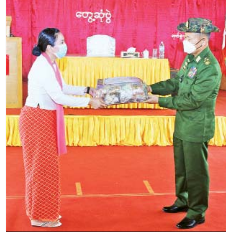
နိုင်ငံတော်စီမံအုပ်ချုပ်ရေးကောင်စီဒုတိယဥက္ကဋ္ဌ ဒုတိယတပ်မတော်ကာကွယ်ရေးဦးစီးချုပ် ကာကွယ်ရေးဦးစီးချုပ်(ကြည်း) ဒုတိယဗိုလ်ချုပ်မှူးကြီး စိုးဝင်း ကျိုင်းခမ်းတပ်နယ်ရှိ အရာရှိ၊ စစ်သည်၊ မိသားစုများအတွက် စားသောက်ဖွယ်ရာများပေးအပ်ရာ တာဝန်ရှိသူတစ်ဦးက လက်ခံရယူစဉ်။

လက်ခံရယူ တွေ့ဆုံပွဲများအပြီးတွင် နိုင်ငံတော်စီမံအုပ်ချုပ်ရေးကောင်စီ ဒုတိယဥက္ကဋ္ဌ ဒုတိယတပ်မတော်ကာကွယ်ရေးဦးစီးချုပ် ကာကွယ်ရေးဦးစီးချုပ်(ကြည်း) ဒုတိယဗိုလ်ချုပ်မှူးကြီး စိုးဝင်းက တပ်နယ်အသီးသီးမှ အရာရှိ၊ စစ်သည်၊ မိသားစုများအတွက် စားသောက်ဖွယ်ရာများနှင့် ထောက်ပံ့ငွေများကိုပေးအပ်ရာ တိုင်းမှူးနှင့် တာဝန်ရှိသူများက လက်ခံရယူကြသည်။ ဆက်လက်၍ ကာကွယ်ရေးဦးစီးချုပ်ရုံး(ကြည်း)မှ ဒုတိယဗိုလ်ချုပ်မှူးကြီးအောင်ဇော်အေးက စိုက်ပျိုးရေးမျိုးစေ့များနှင့် စားသောက်ဖွယ်ရာများကို ပေးအပ်ရာ တာဝန်ရှိသူများက လက်ခံရယူကြသည်။ ထို့နောက် နိုင်ငံတော်စီမံအုပ်ချုပ်ရေးကောင်စီဒုတိယဥက္ကဋ္ဌ ဒုတိယတပ်မတော်ကာကွယ်ရေးဦးစီးချုပ် ကာကွယ်ရေးဦးစီးချုပ်(ကြည်း) ဒုတိယဗိုလ်ချုပ်မှူးကြီး စိုးဝင်းနှင့် အဖွဲ့ဝင်များသည် တက်ရောက်လာကြသည့် တပ်နယ်အသီးသီးမှ အရာရှိ၊ စစ်သည်၊ မိသားစုများအား ရင်းရင်းနှီးနှီး လိုက်လံနှုတ်ဆက်ခဲ့ကြောင်း သိရသည်။