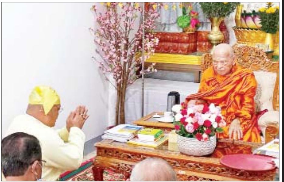
ကြသူများက နိုင်ငံတော်သံဃမဟာနာယက ဥက္ကဋ္ဌ လှူဒါန်းခဲ့ကြောင်း သိရသည်။ ဗန်းမော်ဆရာတော်ကြီးအား နေ့ဆွမ်းဆက်ကပ် သတင်းစဉ်