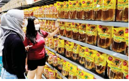
စာမျက်နှာ » ၁၃

အင်ဒိုနီးရှားနိုင်ငံက စားအုန်းဆီတင်ပို့မှု တားမြစ်ပိတ်ပင်