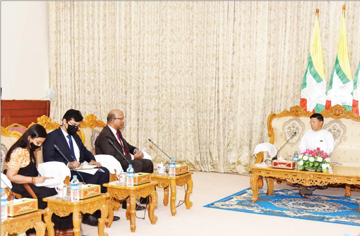
နေမှုနှင့် ရွေးကောက်ပွဲဆိုင်ရာလုပ်ငန်းများနှင့်စပ်လျဉ်း၍ အကူအညီ ပေးနိုင်ရေးအတွက် နှစ်နိုင်ငံပူးပေါင်းဆောင်ရွက်နိုင်မည့် အခြေအနေ များကို ရင်းနှီးပွင့်လင်းစွာဆွေးနွေးကြသည်။

မေးမြန်းမှုများနှင့်စပ်လျဉ်း၍ ပြည်ထောင်စုရွေးကောက်ပွဲ ကော်မရှင်ဥက္ကဋ္ဌက ရွေးကောက်ပွဲကျင်းပနိုင်ရေးအတွက် မဲဆန္ဒရှင် စာရင်းများ ပြုစုဆောင်ရွက်နေမှု၊ နိုင်ငံရေးပါတီများကို စစ်ဆေး ဆောင်ရွက်နေမှု၊ PR စနစ် ပြောင်းလဲကျင့်သုံးနိုင်ရေး ပြင်ဆင်ဆောင်ရွက်