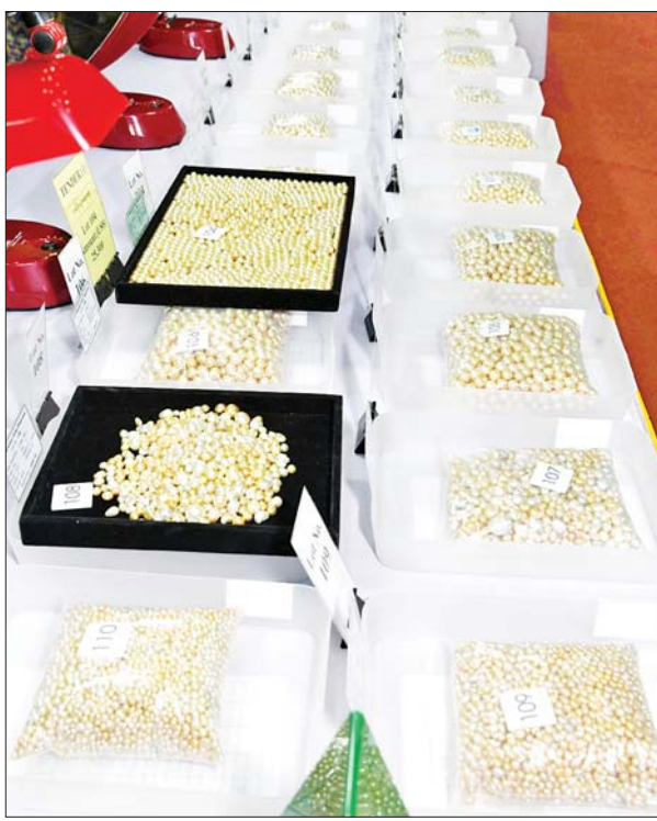
(၅၇)ကြိမ်မြောက် မြန်မာ့ကျောက်မျက်ရတနာပြပွဲ၌ ခင်းကျင်း ပြသထားသည့် ပုလဲအတွဲများကို တွေ့ရစဉ်။

ပုလဲအတွဲများအတွက် အနိမ့်ဆုံးအခြေခံဈေးကို အမေရိကန် ဒေါ်လာ တစ်ထောင် သတ်မှတ်ထားပြီး ကျောက်မျက်အတွဲများ အတွက် အနိမ့်ဆုံးအခြေခံဈေးမှာ ယူရီ ၅၀၀ ဖြစ်သည်။ ထို့အတူ