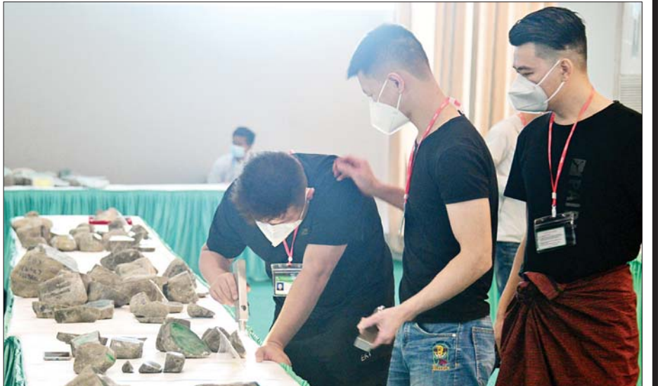
(၅၇)ကြိမ်မြောက် မြန်မာ့ကျောက်မျက်ရတနာပြပွဲ၌ ခင်းကျင်းပြသထားသည့် ကျောက်စိမ်းအတွဲ များကို ရတနာကုန်သည်များက စိတ်ကြိုက်လေ့လာကြည့်ရှုစဉ်။

ပြပွဲများအတွင်း နေပြည်တော်ရှိ မဏိရတနာကျောက်စိမ်းခန်းမ၌ ပြုလုပ် ခဲ့သည့် ၂၀၁၃ ခုနှစ် အကြိမ်(၅၀)မြောက်ကျောက်မျက်ရတနာပြပွဲသည် ယူရီငွေ ၁၃၁၇ ဒဿမ ၉၁ သန်းဖြင့် အများဆုံးရောင်းချရရှိခဲ့သည်။ ထို့အတူ နိုင်ငံခြားငွေယူရီ ၃၃ ဒဿမ ၃၃ သန်းဖြင့် ရောင်းချရရှိခဲ့သော ကျောက်စိမ်းတွဲ သည် ဈေးအများဆုံးရောင်းရသောကျောက်စိမ်းအတွဲအဖြစ် ၂၀၁၁ ခုနှစ် (၄၈)ကြိမ်မြောက် ကျောက်မျက်ရတနာပြပွဲတွင် ရောင်းချနိုင်ခဲ့သည်။ ဈေးအများဆုံးကျောက်မျက်ရိုင်းအနေဖြင့် ၁၉၉၃ ခုနှစ် နှစ်လယ်မြန်မာ့ ကျောက်မျက်ရတနာပြပွဲတွင် အမေရိကန်ဒေါ်လာ ၅၈၆၁၁၈၀ ဖြင့် အလေးချိန် ၃၈ ဒဿမ ၁၂ ကရက်ရှိ မိုးကုတ်ပတ္တမြားကို ရောင်းချနိုင်ခဲ့