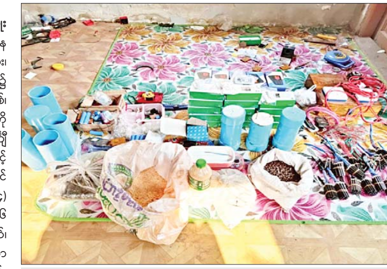
၂၀၂၂ ခုနှစ် ဧပြီ ၉ ရက်တွင် မဟာအောင်မြေမြို့နယ် ရဲမွန်တောင်ရပ်ကွက်ရှိ နေအိမ်၌ သိမ်းဆည်းရမိသည့် လက်နက်/ ခဲယမ်းများ၏ မှတ်တမ်းဓာတ်ပုံ။