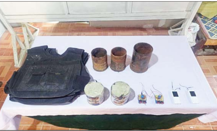
၂၀၂၂ ခုနှစ် ဧပြီ ၁၄ ရက်တွင် ချမ်းမြသာစည်မြို့နယ် ၆၉ လမ်း(ဆ/၄) ရပ်ကွက် အိမ်အမှတ် (၁၁၂)၌ သိမ်းဆည်းရမိခဲ့သည့် ဖောက်ခွဲရေးပစ္စည်းများ၏ မှတ်တမ်းဓာတ်ပုံ။