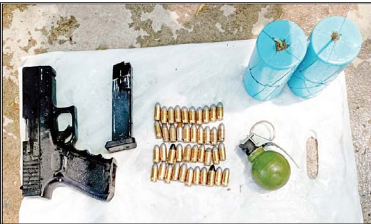
၂၀၂၂ ခုနှစ် ဧပြီ ၈ ရက်တွင် ပြည်ကြီးတံခွန်မြို့နယ် သင်ပန်းကုန်းရပ်ကွက်၌ သိမ်းဆည်းရမိခဲ့သည့် လက်နက်/ခဲယမ်းများ၏ မှတ်တမ်းဓာတ်ပုံ။

ဖြစ်စဉ်တွင် ဖမ်းဆီးရမိတရားခံအမျိုးသား ၁၁ ဦး၊ အမျိုးသမီးနှစ်ဦး စုစုပေါင်း ၁၃ ဦးကို KA-25 သေနတ်လေးလက်၊ ကိုးမမပစ္စတိုတစ်လက်၊ လက်လုပ်သေနတ်နှစ်လက်၊ ကျည်အိမ်မျိုးစုံ ၁၆ ခု၊ ကျည်မျိုးစုံ ၇၂၇ တောင့်၊ လက်ပစ်ဗုံး ခြောက်လုံး၊ အီနာဂါဗုံးသီး ၂၅ လုံး၊ ၁၀၇ မမ ရှော့တိုက်ခွဲသီးတစ်လုံး၊ လက်လုပ်မိုင်းမျိုးစုံ ၁၀ လုံး၊ ဒီတိုနေတာ ၃၇၅ ချောင်း၊ ကျည်ကာအင်္ကျီ ခြောက်ထည်၊ ပြောက်ကျားယူနီဖောင်းသုံးစုံ၊ Keypad ဖုန်း ၂၂ လုံး၊ ဆေးပစ္စည်းမျိုးစုံထည့်ထားသည့် ဝိနံအိတ် ၂၇ အိတ်နှင့် ဖောက်ခွဲရေး ဆက်စပ်ပစ္စည်းများနှင့်အတူ ဖမ်းဆီးရမိခဲ့သည်။