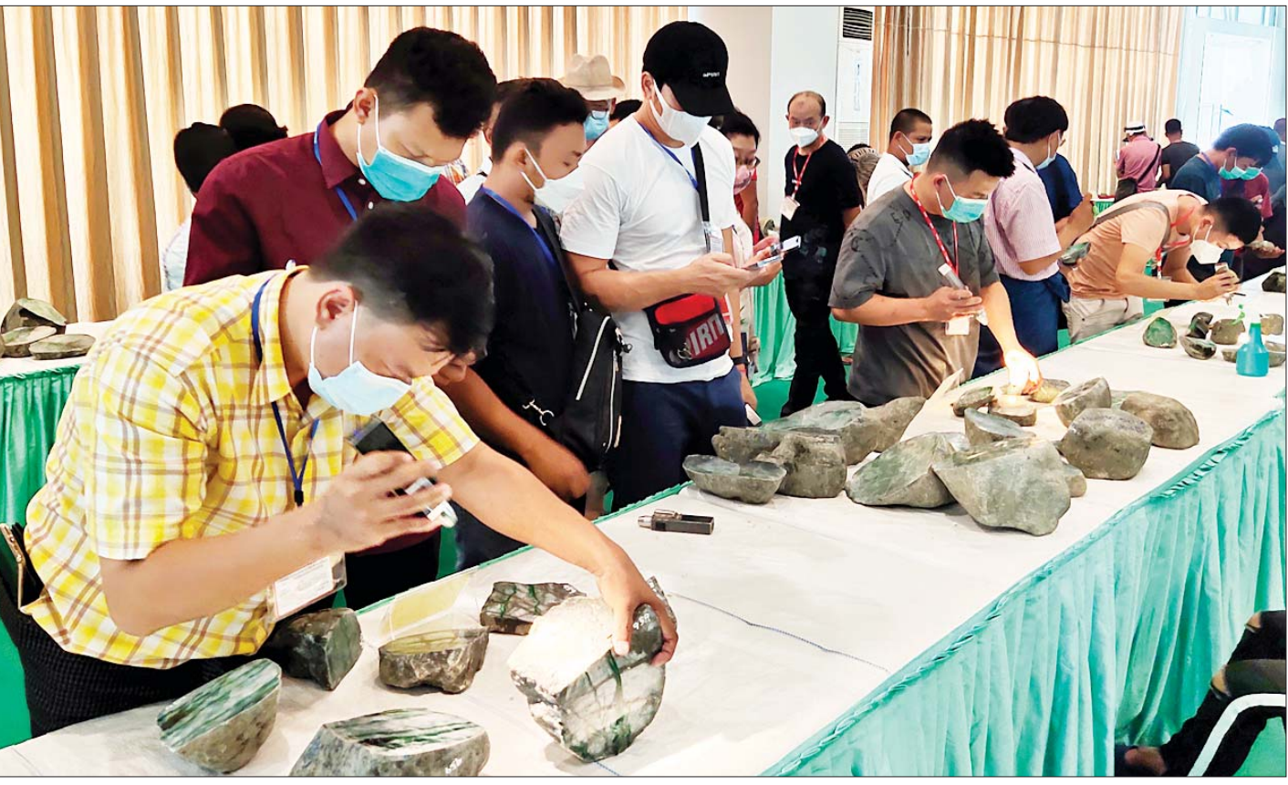
(၅၇)ကြိမ်မြောက် မြန်မာ့ကျောက်မျက်ရတနာပြပွဲတွင် ခင်းကျင်းပြသထားသည့် ကျောက်စိမ်းအတွဲများကို ပြည်တွင်း ပြည်ပ ရတနာကုန်သည်များက စိတ်ကြိုက်လေ့လာကြည့်ရှုကြစဉ်။

နိုင်ငံတော်ဖွံ့ဖြိုးတိုးတက်ရေး လူတိုင်းညီညာပါဝင်ပေး စာမျက်နှာ » ၁၇