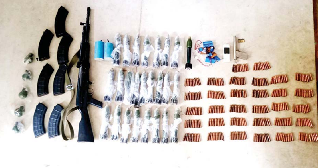
ဧပြီ ၉ ရက်က မဟာအောင်မြေမြို့နယ် ရဲမှန်တောင်ရပ်ကွက်ရှိ နေအိမ်၌ သိမ်းဆည်းရမိသည့် လက်နက်/ခဲယမ်းများ မှတ်တမ်းဓာတ်ပုံ။

နေပြည်တော် ဧပြီ ၂၅ နိုင်ငံတော်စီမံအုပ်ချုပ်ရေးကောင်စီ သတင်းထုတ်ပြန်ရေးအဖွဲ့၏ (၁၃) ကြိမ်မြောက် သတင်းစာရှင်းလင်းပွဲကို ဧပြီ ၂၇ ရက် မွန်းလွဲ ၁ နာရီတွင် နေပြည်တော်ရှိ ပြန်ကြားရေးဝန်ကြီးဌာန ဝန်ကြီးရုံး စုပေါင်းအစည်းအဝေးခန်းမ၌ ကျင်းပမည် ဖြစ်သည်။ ယင်းသတင်းစာ ရှင်းလင်းပွဲကို မြန်မာ့အသံနှင့်ရုပ်မြင်သံကြား MRTV-HD၊ MRTV News၊ MWD၊ MWD Variety၊ MITV၊ MOI Website၊ MOI Youtube၊ MRTV Website နှင့် မြန်မာ့အသံရေဒီယို၊ သဇင် FM၊ မန္တလေး FM၊ ပုဇွန် FM၊ ရွှေ FM၊ ပတ္တမြား FM နှင့် ချယ်ရီ FM တို့မှ တိုက်ရိုက် (LIVE) ထုတ်လွှင့်ပြသသွားမည်ဖြစ်သည်။ သတင်းစဉ်