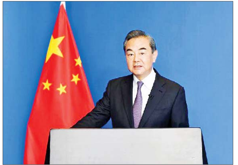
တရုတ်နိုင်ငံခြားရေးဝန်ကြီး ဝမ်ယီ။