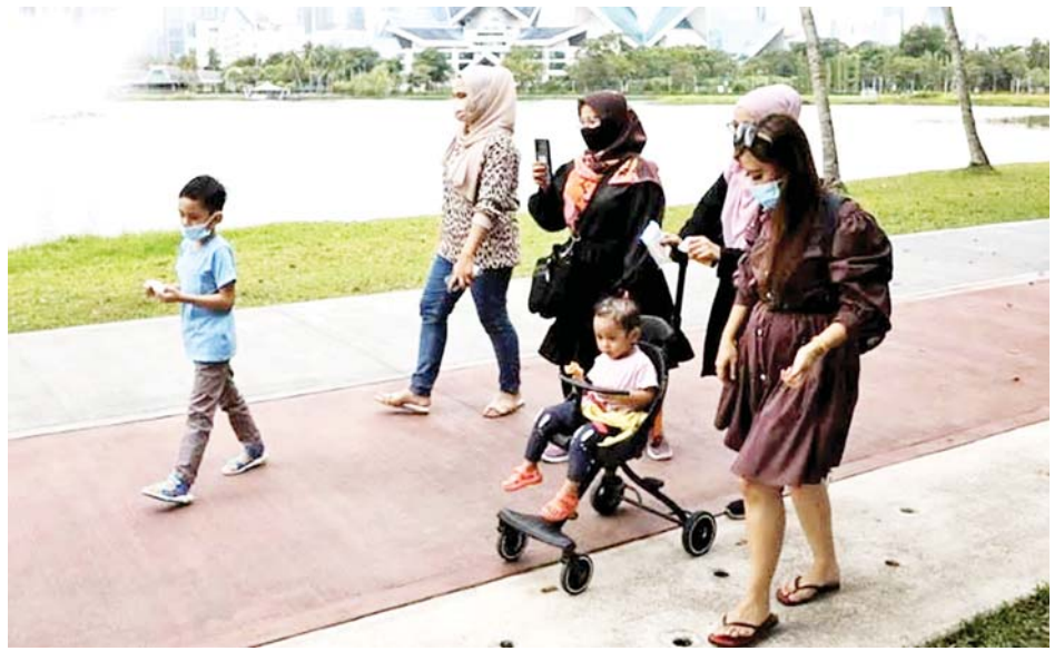
ကြောင်း သိရသည်။ ထို့ပြင် ထိုင်းနိုင်ငံ၌ လာမည့်လအတွင်း ကာကွယ်ဆေးထိုးနှံမှုခံယူပြီးသည့် ခရီးသွားများအား ရောဂါရှိ မရှိ စစ်ဆေးမှုမပြုတော့ဘဲ နိုင်ငံအတွင်းသို့ ဝင်ရောက်ခွင့်ပြုမည်ဖြစ်ကြောင်း ထိုင်းအစိုးရက လွန်ခဲ့သော ရက်သတ္တပတ်က ကြေညာခဲ့သည်။ ကိုးကား- အင်န်အိတ်ချီကေ ဘာသာပြန်- အောင်ကျော်ကျော်

တွေ့ရှိသည်။ ယခုလအတွင်း နေ့စဉ်ကူးစက်မှု အရေအတွက်သည် လွန်ခဲ့သောလကအရေအတွက်ထက် များစွာလျော့ကျလာကြောင်း သိရသည်။ လွန်ခဲ့သောလအတွင်း နေ့စဉ်ကူးစက်မှုအရေအတွက် ၃၀၀၀၀ ကျော်တွေ့ရှိရသည်။ သွားလာခွင့်ပြုမည် လက်ရှိတွင် နယ်စပ်ဒေသများ၌ ကာကွယ်ဆေးထိုးနှံမှုခံယူပြီးသည့် ခရီးသွားများအား ရောဂါရှိမရှိ ထပ်မံစစ်ဆေးခြင်းမပြုတော့ဘဲ ဖြတ်သန်းသွားလာခွင့်ပြုမည်ဖြစ်ကြောင်း သိရသည်။ အလားတူ စင်ကာပူနိုင်ငံ၌ ကိုဗစ်-၁၉ ရောဂါဆိုင်ရာ ကျန်းမာရေးစည်းမျဉ်းများကို လွန်ခဲ့သောလမှစပြီး ပြန်လည်ဖြေလျှော့ပေးလျက်ရှိသည်။ ဧပြီ ၂၆ ရက်တွင် လုပ်ငန်းခွင်နေရာများနှင့် လူမှုရေးဆိုင်ရာပွဲတော်၊ အခမ်းအနားများတွင် လူဦးရေကန့်သတ်ထားရှိမှုကို ပြန်လည်ဖြေလျှော့ပေးခဲ့