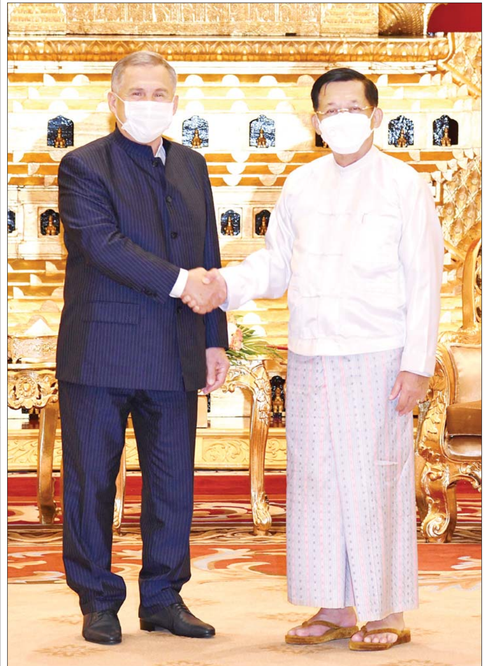
နိုင်ငံတော်စီမံအုပ်ချုပ်ရေးကောင်စီဥက္ကဋ္ဌ နိုင်ငံတော်ဝန်ကြီးချုပ် ဗိုလ်ချုပ်မှူးကြီး မင်းအောင်လှိုင် Republic of the Tatarstan သမ္မတ Mr. Rustam Nurgaliyevich Minnikhanov အား ရင်းရင်းနှီးနှီး နှုတ်ဆက်စဉ်။

နေပြည်တော် ဧပြီ ၂၈ နိုင်ငံတော် စီမံအုပ်ချုပ်ရေး ကောင်စီဥက္ကဋ္ဌ နိုင်ငံတော် ဝန်ကြီးချုပ် ဗိုလ်ချုပ်မှူးကြီး မင်းအောင်လှိုင်သည် မြန်မာနိုင်ငံ သို့အလုပ်သဘောခရီးစဉ်ရောက်ရှိ နေသည့် Republic of the Tatarstan သမ္မတ Mr. Rustam Nurgaliyevich Minnikhanov ကို ယနေ့ နံနက်ပိုင်းတွင် နေပြည်တော်ရှိ နိုင်ငံတော်စီမံ အုပ်ချုပ်ရေးကောင်စီဥက္ကဋ္ဌရုံး သံတမန်ဆောင် ဧည့်ခန်းမ၌ လက်ခံတွေ့ဆုံသည်။ တက်ရောက် တွေ့ဆုံပွဲသို့ နိုင်ငံတော်စီမံ အုပ်ချုပ်ရေးကောင်စီ ဥက္ကဋ္ဌ နိုင်ငံတော်ဝန်ကြီးချုပ်နှင့် အတူ ကောင်စီတွဲဖက်အတွင်းရေးမှူး ဒုတိယဗိုလ်ချုပ်ကြီး ရဲဝင်းဦး၊ ရင်းနှီးမြှုပ်နှံမှုနှင့် နိုင်ငံခြား စီးပွားဆက်သွယ်ရေး ဝန်ကြီးဌာန ပြည်ထောင်စုဝန်ကြီး ဦးအောင် နိုင်ဦး၊ အပြည်ပြည်ဆိုင်ရာ ပူးပေါင်း ဆောင်ရွက်ရေး ဝန်ကြီးဌာန ပြည်ထောင်စုဝန်ကြီး ဦးကိုကိုလှိုင်၊ နိုင်ငံခြားရေးဝန်ကြီးဌာန ဒုတိယ ဝန်ကြီး ဦးကျော်မျိုးထွဋ်နှင့် တာဝန်ရှိသူများ တက်ရောက်ကြ ပြီး Republic of the Tatarstan သမ္မတနှင့်အတူ မြန်မာနိုင်ငံ ဆိုင်ရာ ရုရှားနိုင်ငံသံအမတ်ကြီး H.E. Dr. Nikolay Listopadov၊ တာတာစတန်ပြည်နယ် ဒုတိယ ဝန်ကြီးချုပ်နှင့် စက်မှုနှင့်ကုန်သွယ် ရေးဝန်ကြီး Mr. KARIMOV Albert Anvarovich နှင့် အဖွဲ့ဝင်များ တက်ရောက်ကြသည်။ စာမျက်နှာ ၃ ကော်လံ ၁ သို့ ☆