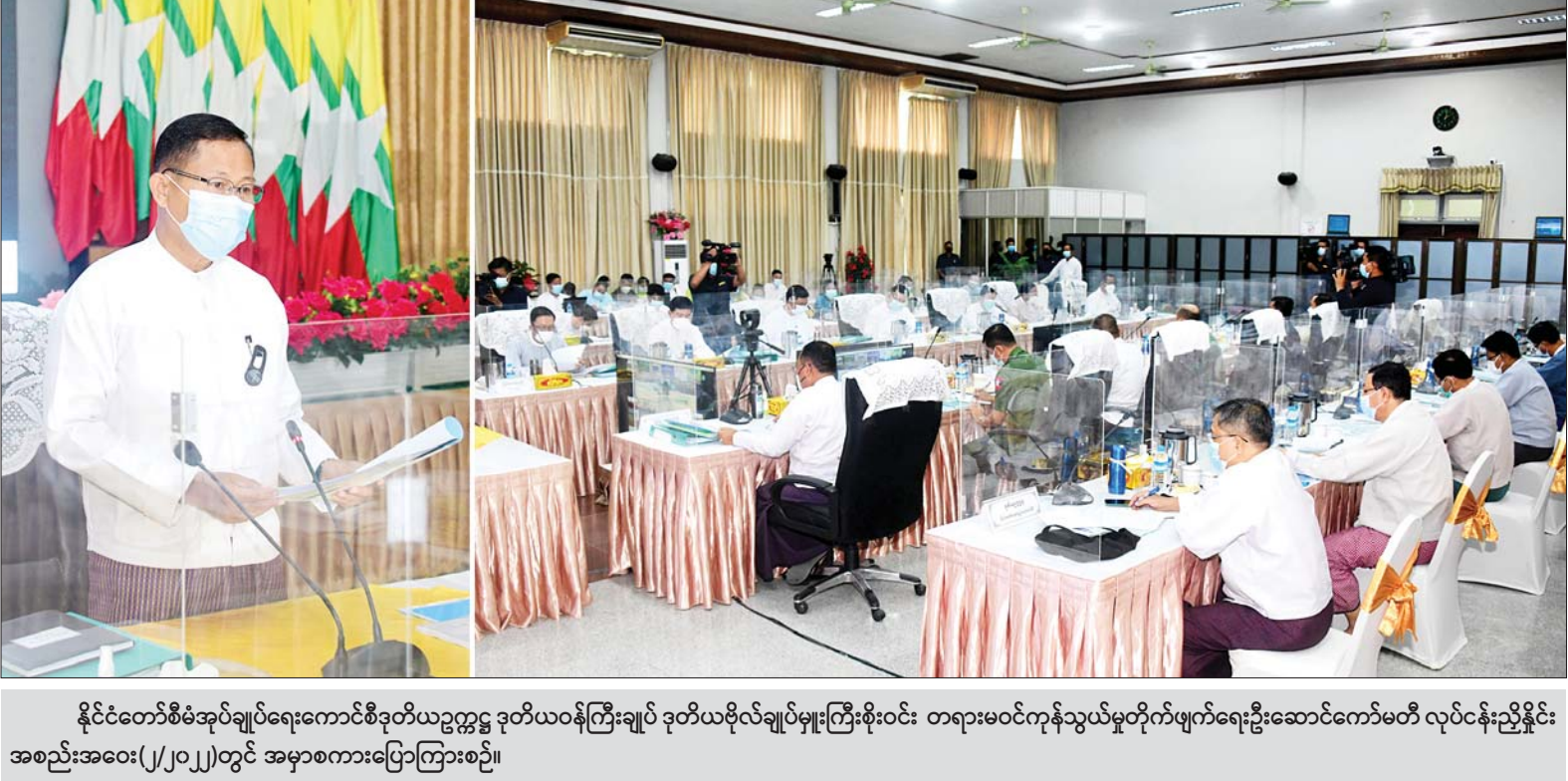
နိုင်ငံတော်စီမံအုပ်ချုပ်ရေးကောင်စီဒုတိယဥက္ကဋ္ဌ ဒုတိယဝန်ကြီးချုပ် ဒုတိယဗိုလ်ချုပ်မှူးကြီးစိုးဝင်း တရားမဝင်ကုန်သွယ်မှုတိုက်ဖျက်ရေးဦးဆောင်ကော်မတီ လုပ်ငန်းညှိနှိုင်းအစည်းအဝေး(၂/၂၀၂၂)တွင် အမှာစကားပြောကြားစဉ်။

နေပြည်တော် ဧပြီ ၂၈ တရားမဝင် ကုန်သွယ်မှု တိုက်ဖျက်ရေး ဦးဆောင်ကော်မတီ လုပ်ငန်းညှိနှိုင်းအစည်းအဝေး (၂/၂၀၂၂) ကို ယနေ့ မွန်းလွဲ ၂ နာရီတွင် နေပြည်တော်ရှိ စီးပွားရေးနှင့် ကူးသန်းရောင်းဝယ်ရေး ဝန်ကြီးဌာန ညီလာခံခန်းမ၌ ကျင်းပရာ တရားမဝင်ကုန်သွယ်မှု တိုက်ဖျက်ရေး ဦးဆောင်ကော်မတီ ဥက္ကဋ္ဌ နိုင်ငံတော်စီမံအုပ်ချုပ်ရေးကောင်စီ ဒုတိယဥက္ကဋ္ဌ ဒုတိယဝန်ကြီးချုပ် ဒုတိယဗိုလ်ချုပ်မှူးကြီးစိုးဝင်း တက်ရောက်အမှာစကားပြောကြားသည်။ အစည်းအဝေးသို့ ပြည်ထောင်စုဝန်ကြီးများ၊ ဒုတိယဝန်ကြီးများ၊ နေပြည်တော် ကောင်စီဝင်၊ အခွန်အယူခံခုံအဖွဲ့ ဥက္ကဋ္ဌ၊ စာမျက်နှာ ၄ ကော်လံ ၁ သို့ ၀