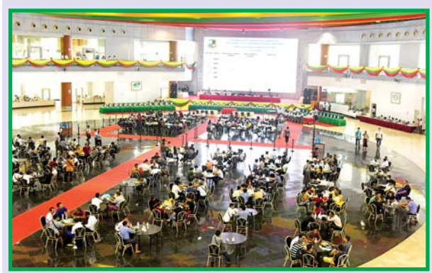
(၅၇)ကြိမ်မြောက် မြန်မာ့ကျောက်မျက်ရတနာ ပြပွဲ အောင်မြင်စွာ ကျင်းပပြီးစီး စာမျက်နှာ » ၈