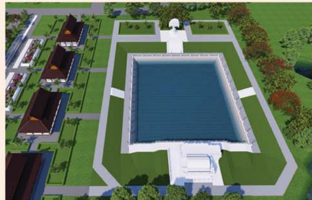
ကျောက်စာရုံစေတီ(၁၂ x ၁၂ x ၁၈)ပေ ၁ ဆူ တန်ဖိုး- ၂၇၉ သိန်း