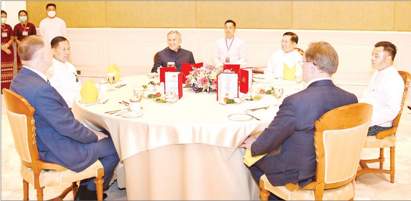
နိုင်ငံတော်စီမံအုပ်ချုပ်ရေးကောင်စီဥက္ကဋ္ဌ နိုင်ငံတော်ဝန်ကြီးချုပ် ဗိုလ်ချုပ်မှူးကြီး မင်းအောင်လှိုင် Republic of the Tatarstan သမ္မတ Mr. Rustam Nurgaliyevich Minnikhanov နှင့် အဖွဲ့ဝင်များကို ဂုဏ်ပြုနေ့လယ်စာဖြင့် တည်ခင်းဧည့်ခံစဉ်။

နေ့လယ်စာ သုံးဆောင်နေစဉ်အတွင်း သာသနာရေးနှင့် ယဉ်ကျေးမှုဝန်ကြီးဌာန အနုပညာဦးစီးဌာနမှ အနုပညာရှင်များက တေးသံသာများဖြင့် သီဆိုတီးမှုတ် ကပြဖျော်ဖြေကြသည်။ နေ့လယ်စာစားပွဲအပြီးတွင် နိုင်ငံတော်စီမံအုပ်ချုပ်ရေးကောင်စီဥက္ကဋ္ဌ နိုင်ငံတော်ဝန်ကြီးချုပ်နှင့် Republic of the Tatarstan သမ္မတတို့သည် အမှတ်တရလက်ဆောင်ပစ္စည်းများ အပြန်အလှန်ပေးအပ်ကြသည်။ ယင်းနောက် နိုင်ငံတော်စီမံအုပ်ချုပ်ရေးကောင်စီဥက္ကဋ္ဌ နိုင်ငံတော်ဝန်ကြီးချုပ်နှင့် Republic of the Tatarstan သမ္မတတို့သည် သီဆိုတီးမှုတ်ကပြဖျော်ဖြေခဲ့ကြသည့် ယဉ်ကျေးမှုအဖွဲ့များအား ချီးမြှင့်ငွေများ ပေးအပ်ခဲ့ကြောင်း သိရသည်။ သတင်းစဉ်