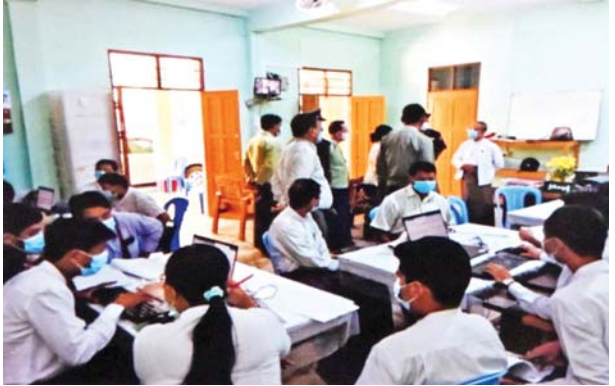
ရော့ဝတီတိုင်းဒေသကြီး လပွတ္တာမြို့နယ်၌ အခြေခံမဲဆန္ဒရှင် စာရင်းများ ပြည့်စုံမှန်ကန်ရေး ပြည်ထောင်စုရွေးကောက်ပွဲကော်မရှင် အဖွဲ့ဝင်များ ကွင်းဆင်းကြပ်မတ်ဆောင်ရွက်ခဲ့မှု မှတ်တမ်းဓာတ်ပုံ။

❖ စာမျက်နှာ ၁၁ မှ တိုင်းရင်းသားလက်နက်ကိုင်အဖွဲ့ အားလုံးကို မိမိကိုယ်တိုင် တွေ့ဆုံဆွေးနွေးမှုများ ပြုလုပ်သွား မည်ဖြစ်ကြောင်း၊ ဆွေးနွေးပွဲကို တက်ရောက်မည့်သူ ပုဂ္ဂိုလ်များ၏ အမည်ကို ၂၀၂၂ ခုနှစ် မေလ ၉ ရက် နောက်ဆုံးထားပြီး ပြန်ကြားပေးရန်နှင့် တိုင်းရင်း သားပြည်သူ့အားလုံး ငြိမ်းချမ်းရေးနှင့် ဖွံ့ဖြိုးတိုး တက်မှုအရသာကို ခံစားနိုင်ရေး အားလုံးလက်တွဲပြီး ရိုးသားပွင့်လင်းစွာ ဆွေးနွေးသွားကြရန်” တိုက်တွန်း ထားသည်ကို တွေ့ရပါကြောင်း။ ပြည်ထောင်စုသားအားလုံး၏အကျိုးကို ရှေးရှု ပြီး အားလုံးပူးပေါင်းဆောင်ရွက်နိုင်မည်ဟု မျှော်လင့် ပါကြောင်း၊ ထိုကိစ္စနှင့်ပတ်သက်ပြီး NCA လက်မှတ် ရေးထိုးထားသည့် EAO အဖွဲ့များ၊ NCA လက်မှတ် မရေးထိုးထားသည့် EAO အဖွဲ့များဖြင့် မိမိတို့ ဆက်သွယ်မှုများ ဆောင်ရွက်ခဲ့ပါကြောင်း၊ ဆက်သွယ်မှု များ ဆောင်ရွက်သည့်နေရာတွင် NCA လက်မှတ်ရေး ထိုးထားသည့်အဖွဲ့ ၁၀ ဖွဲ့ရှိပါကြောင်း၊ KNU၊ (RCSS/ SSA)၊ PNLO၊ CNF၊ KNLA၊ DKBA၊ ABSDF၊ ALP၊ NMSP၊ LDU ၁၀ ဖွဲ့ရှိကြောင်း၊ ထို၁၀ ဖွဲ့ထဲမှ ကိုးဖွဲ့ဖြင့် အဆက်အသွယ်ရရှိပြီး ဖြစ်ကြောင်း၊ တက်ရောက်နိုင် သည့် အခြေအနေကောင်းများရှိသည်ဟု ပြောလိုပါ ကြောင်း၊ NCA လက်မှတ်မရေးထိုးထားသည့် အဖွဲ့ ၁၁ ဖွဲ့ UWSA၊ NDA၊ NSCN၊ KIO၊ KIA၊ KNPP၊ ANC၊ SSPP၊ TNLA၊ MNDA၊ WNO၊ AA ထို ၁၁