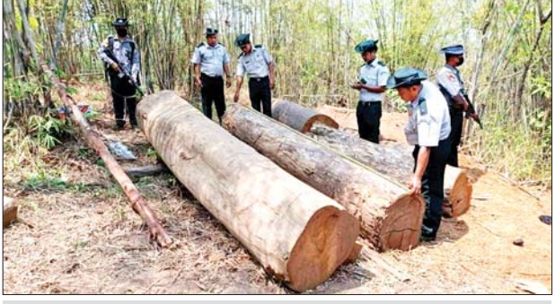
ပဲခူးတိုင်းဒေသကြီးအတွင်း၌ သိမ်းဆည်းရမိသည့် တရားမဝင် သစ်များအား တွေ့ရစဉ်။

နေပြည်တော် ဧပြီ ၂၈ တရားမဝင် ကုန်သွယ်မှု တိုက်ဖျက်ရေး ဦးဆောင် ကော်မတီ၏ ကြီးကြပ်ကွပ်ကဲ မှုဖြင့် တရားမဝင်ကုန်သွယ်မှုများ ကို ဥပဒေနှင့်အညီ ထိရောက်စွာ တားဆီး အရေးယူနိုင်ရေး ဆောင်ရွက်လျက်ရှိရာ ဧပြီ ၂၆ ရက်တွင် မကွေးတိုင်းဒေသကြီး တရားမဝင် ကုန်သွယ်မှုတိုက်ဖျက် ရေးအထူးအဖွဲ့၏ စီမံခန့်ခွဲမှုဖြင့် သစ်တောဦးစီးဌာန ဦးဆောင် သော စစ်ဆေးရေးအဖွဲ့က စစ်ဆေးမှုများ ဆောင်ရွက်ခဲ့ရာ သရက်ခရိုင် အောင်လံမြို့နယ် အတွင်း တရားမဝင် ပျဉ်းကတိုး ခွဲသား ၇ ဒသမ ၂၉၃၂ တန်၊ (ခန့်မှန်း တန်ဖိုးငွေကျပ် ၃၆၄၆၆၀၀)ကို သစ်တောဥပဒေ နှင့်အညီ အရေးယူဆောင်ရွက် လျက်ရှိပြီး မင်းဘူးမြို့နယ် ထောက်ရှာပင်-ထန်းကိုင်-ရေနံမ ရေနံမြေအတွင်း တရားမဝင် ရေနံစိမ်း ၁၀ ဂါလန်ခန့်ပါ အိတ် ၃၀ (ခန့်မှန်းတန်ဖိုးငွေကျပ် ၅၀၉၃၀၀) ကို သိမ်းဆည်းရမိခဲ့ပြီး မင်းဘူးမြို့မရေစခန်းသို့ လွှဲပြောင်း ၍ အရေးယူဆောင်ရွက်လျက် ရှိသည်။ အလားတူ မွန်ပြည်နယ် တရားမဝင် ကုန်သွယ်မှု တိုက်ဖျက်ရေး အထူးအဖွဲ့၏