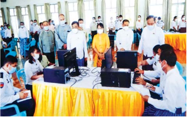
တနင်္သာရီတိုင်းဒေသကြီး ပြည်မြို့နယ်၌ အခြေခံမဲဆန္ဒရှင် စာရင်းများ ပြည့်စုံမှန်ကန်ရေး ပြည်ထောင်စုရွေးကောက်ပွဲကော်မရှင် အဖွဲ့ဝင်များ ကွင်းဆင်းကြပ်မတ်ဆောင်ရွက်ခဲ့မှု မှတ်တမ်းဓာတ်ပုံ။

ပခုက္ကူစာပေဆု ဆုရရှိသူများသည် စာတည်းမှူးချုပ် စာပေဗိမာန် အမှတ် (၅၂၉-၅၃၁) ကုန်သည်လမ်း ရန်ကုန်မြို့၊ စာတည်း မှူးချုပ် ဖုန်း- ၀၁-၂၄၀၀၄၈ နှင့် စီမံရေးရာဌာန ဖုန်း- ၀၁-၉၈၁၄၄၉ သို့ ဆက်သွယ်ကြရန်နှင့် ပခုက္ကူဦးအုံးဖေတည်ထောင်သော ပခုက္ကူစာပေ ဆု ချီးမြှင့်ပွဲအခမ်းအနားတွင် ပညာရည်ချွန်ဆုနှင့် စာကြည့်တိုက် စာအုပ်ဆုပါ ချီးမြှင့်သွားမည်ဖြစ်ပြီး ကျင်းပမည့်အချိန်၊ နေရာ၊ ရက် တို့ကို ထပ်မံကြေညာသွားမည်ဖြစ်ကြောင်း သိရသည်။ သတင်းစဉ်