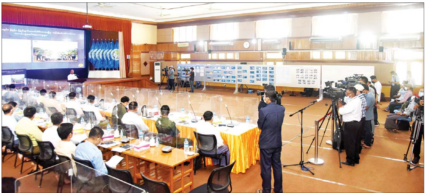
နိုင်ငံတော်စီမံအုပ်ချုပ်ရေးကောင်စီ သတင်းထုတ်ပြန်ရေးအဖွဲ့၏ (၁၃)ကြိမ်မြောက် သတင်းစာရှင်းလင်းပွဲ ကျင်းပစဉ်။

ပထမဆုံး မေးခွန်းအနေဖြင့် ၂၀၂၀ ပြည့်နှစ် နိုဝင်ဘာလ အထွေထွေရွေးကောက်ပွဲတွင် မဲမသမာမှု