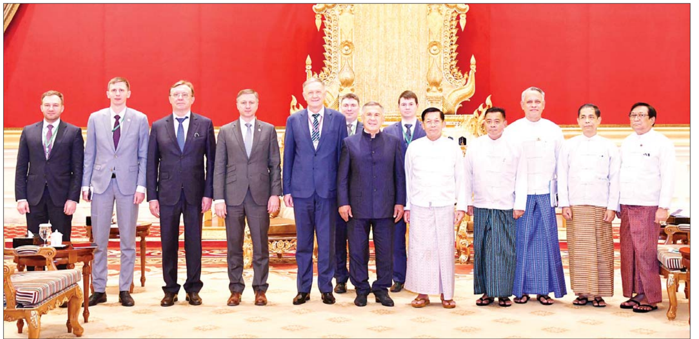
နိုင်ငံတော်စီမံအုပ်ချုပ်ရေးကောင်စီဥက္ကဋ္ဌ နိုင်ငံတော်ဝန်ကြီးချုပ် ဗိုလ်ချုပ်မှူးကြီး မင်းအောင်လှိုင်နှင့် တာဝန်ရှိသူများ Republic of the Tatarstan သမ္မတ Mr. Rustam Nurgaliyevich Minnikhanov နှင့် အဖွဲ့ဝင်များနှင့်အတူ စုပေါင်းမှတ်တမ်းတင် ဓာတ်ပုံရိုက်စဉ်။

တွေ့ဆုံပွဲတွင် နိုင်ငံတော်စီမံအုပ်ချုပ်ရေးကောင်စီဥက္ကဋ္ဌ နိုင်ငံတော်ဝန်ကြီးချုပ်က နှုတ်ခွန်းဆက်စကားပြောကြားရာ၌ ၂၀၂၁ ခုနှစ် ဇွန်လအတွင်း လာရောက်ခဲ့သည့် မိမိ၏ တာတာစတန်ပြည်နယ်ခရီးစဉ်အတွင်း အဆင်ပြေချောမွေ့စေရေး စီမံဆောင်ရွက်ပေးခဲ့မှုများအတွက် ကျေးဇူးတင်ရှိကြောင်း ပြောကြားပြီး Republic of the Tatarstan သမ္မတက ယခုခရီးစဉ်အတွင်း မာရဝီယေဗုဒ္ဓယျာဉ်တော်သို့ သွားရောက်လေ့လာခဲ့ပါကြောင်း၊ မာရဝီယေ ဗုဒ္ဓရုပ်ပွားတော်မြတ်ကြီးသည် ကမ္ဘာပေါ်ရှိ ကျောက်ဆစ်ရုပ်ပွားတော်များတွင် အကြီးဆုံးရုပ်ပွားတော် တစ်ဆူဖြစ်လာမည်ဟု သိရှိကြောင်း၊ ကျောက်ဆစ်လုပ်ငန်းများ ဆောင်ရွက်ရာတွင် ခေတ်မီစက်ကိရိယာများအသုံးပြု၍ ဆောင်ရွက်လျက်ရှိသည်ကို တွေ့ရှိရကြောင်း၊ အလားတူ ဗုဒ္ဓယျာဉ်အတွင်းတွင် ပိဋကတ်သုံးပုံ ကျောက်စာချပ်များကို စိုက်ထူဆောင်ရွက်နေသည်ကိုလည်း တွေ့ရှိရကြောင်း၊ ယခုမာရဝီယေ ဗုဒ္ဓယျာဉ်တည်ဆောက်ရေးတွင် အဆွေတော် ဝန်ကြီးချုပ်ကိုယ်တိုင် စီမံဆောင်ရွက်နေသည်ကို သိရှိရသည့်အတွက် အထူးပင်ဂုဏ်ယူဝမ်းမြောက်ပါကြောင်း၊ မိမိ၏ ယခုခရီးစဉ် အဆင်ပြေချောမွေ့စေရေး စီမံဆောင်ရွက်ပေးမှုများအတွက်လည်း အထူးပင်ကျေးဇူးတင်ရှိပါကြောင်း ပြန်လည်ပြောကြားသည်။