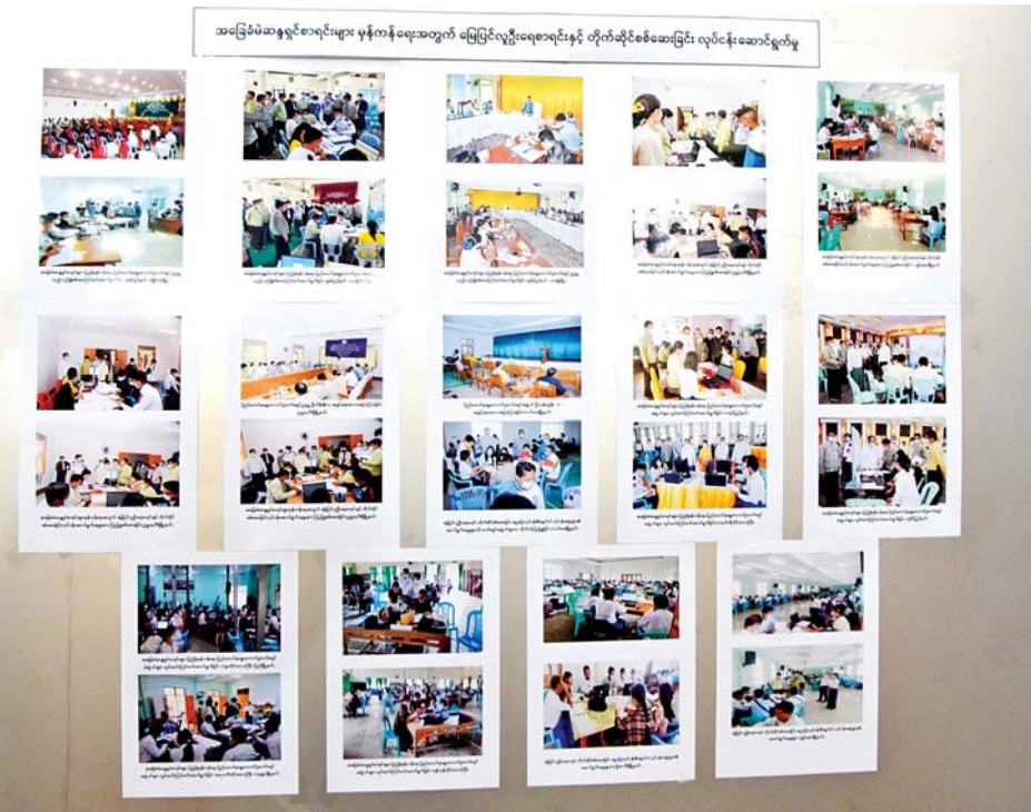
နိုင်ငံတော်စီမံအုပ်ချုပ်ရေးကောင်စီ သတင်းထုတ်ပြန်ရေးအဖွဲ့၏ (၁၃)ကြိမ်မြောက် သတင်းစာ ရှင်းလင်းပွဲတွင် ခင်းကျင်းပြသထားသည့် မှတ်တမ်းဓာတ်ပုံများ။

အချို့သောမီဒီယာများသည် ထိုသို့ကျင့်ဝတ် ကို အလေးထားသည့် မီဒီယာများအပေါ် စွပ်စွဲရေး သားခြင်းများ စိတ်မကောင်းဖွယ် တွေ့ရပါကြောင်း၊ ၎င်းတို့စကားဖြင့် ပြောရလျှင် “အဘဘောမ မီဒီယာ”၊ “အဘဘောမ မီဒီယာသမား” ဆိုပြီး တံဆိပ်ကပ် ပါကြောင်း၊ ထိုမီဒီယာများသည် တပ်မတော်နှင့် အစိုးရတို့နှင့်လည်း ဆက်စပ်မှုမရှိဘဲ အစိုးရအဆက် ဆက်ဝေဖန်ရေးသားပြီး အမှန်အတိုင်းရေးနေသူ များသာဖြစ်ကြောင်း၊ သို့သော် နည်းနည်းရေးမိ သည့်နှင့် “အဘဘောမ မီဒီယာ” ၊ “အဘဘောမ မီဒီယာသမား” ဆိုပြီး တံဆိပ်ကပ်ပါကြောင်း၊ ထိုသို့ပြောနေသည့် ပြည်ပကျော်မီဒီယာများကို မိမိပြောလိုပါကြောင်း၊ ပကတိအခြေအနေကို မျက်ကွယ်ပြုပြီးလုပ်နေသည့် လုပ်ရပ်များ၊ သွေးထိုး လှုံ့ဆော်နေသည့်များလည်း ဒီဘက်ကပြောသလိုမျိုး၊ အကြမ်းဖက်အဖွဲ့ NUG ကိုပြောနေသည်ရှိပါကြောင်း၊ NUG အနုဂျီဟု ပြောနေသည်များရှိကြောင်း။