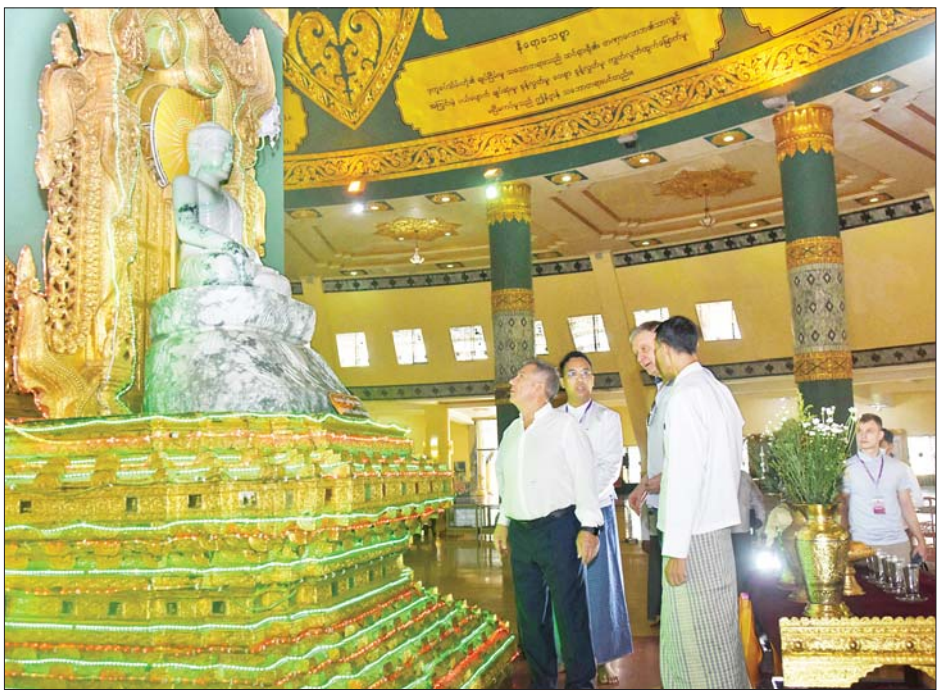
Republic of the Tatarstan သမ္မတ Mr. Rustam Nurgaliyevich Minnikhanov ဥပျာတသန္တိစေတီ တော်မြတ်ကြီး၏ လိုဏ်တော်အတွင်းရှိ ကျောက်စိမ်းရုပ်ပွားတော်များအား ဖူးမြော်ကြည့်ရှုစဉ်။