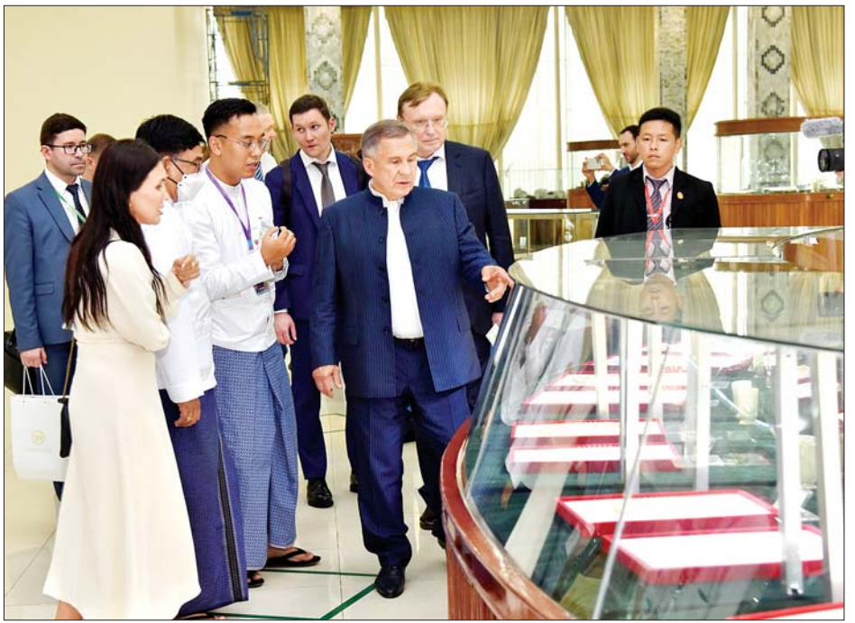
Republic of the Tatarstan သမ္မတ Mr. Rustam Nurgaliyevich Minnikhanov မြန်မာ့ကျောက်မျက် ရတနာပြတိုက်(နေပြည်တော်) ပြခန်းမဆောင်အတွင်း ကျောက်စိမ်း၊ ကျောက်မျက်၊ ပုလဲ၊ ရွှေထည်၊ ငွေထည်နှင့် သယံဇာတပစ္စည်းများကို ပြကွက်အလိုက် ခင်းကျင်းပြသထားမှုကို ကြည့်ရှုလေ့လာစဉ်။