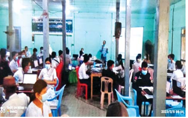
ပဲခူးတိုင်းဒေသကြီး ပြည်မြို့နယ်၌ အခြေခံမဲဆန္ဒရှင်စာရင်းများ ပြည့်စုံမှန်ကန်ရေး ပြည်ထောင်စုရွေးကောက်ပွဲကော်မရှင်အဖွဲ့ဝင် များ ကွင်းဆင်းကြပ်မတ်ဆောင်ရွက်ခဲ့မှု မှတ်တမ်းဓာတ်ပုံ။