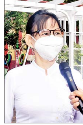
အထက (၂) လသာမှ ဆရာမတစ်ဦး

အဲဒီလို စီစဉ်ထားပေးပါတယ်။ လေးထပ်ကျောင်းဆောင်ကြီးရယ်၊ စာကြည့်တိုက်ရယ်ကို ကျောင်းသားဟောင်းကြီးတွေက ဦးဆောင် ဆောက်လုပ်ပေးထားတာပါ။ စာကြည့်တိုက်က နိုင်ငံတကာအဆင့်မီ e-Library ဖြစ်ပါတယ်။ နောက်ပြီး ကျောင်းသားဟောင်းကြီးတွေက တစ်လတစ်ခါ ကျန်းမာရေးစစ်ဆေးမှုတွေ လုပ်ပေးပါတယ်။ ပညာရေး က လူတစ်ဦး၊ နိုင်ငံတစ်ခုသာမကဘဲနဲ့ ကမ္ဘာ့အပြောင်းအလဲနဲ့ ရေရှည် ဖွံ့ဖြိုးတိုးတက်ဖို့ အဓိကအခန်းကဏ္ဍက ပါဝင်နေတာ တွေ့ရမှာဖြစ်ပါတယ်။ အဲဒီအတွက် ကျောင်းသားတွေကို ကျောင်းပုံမှန်တက်ပြီး ပညာ တတ်ဖြစ်ဖို့ ပညာသင်ကြားဖို့ ဆရာကြီးတို့က ကျောင်းတက်ကြဖို့ ဖိတ်ခေါ်ချင်ပါတယ်။ အခုလက်ရှိ လသာမြို့နယ်မှာ ကျောင်းသား ကျောင်းသူ ၂၀၀၀ ကျော်အပ်ထားပြီး ဖြစ်ပါတယ်။ မကြာခင်အတွင်းမှာ ကျောင်းသား ကျောင်းသူတွေကို ၅ နှစ်ကနေ ၁၂ နှစ်၊ ၁၂ နှစ်ကနေ ၁၅ နှစ်၊ ၁၅ နှစ်ကနေ ၁၈ နှစ် သုံးပိုင်းခွဲပြီး ကိုဗစ်ကာကွယ်ဆေး ထိုးပေးတော့ မှာ ဖြစ်ပါတယ်။ အဲဒီလို ဆေးထိုးပေးတဲ့အခါ မိဘဆန္ဒရှိမှထိုးပေးမှာပါ။ ဆေးမထိုးလည်း ကျောင်းတက်လို့ရပါတယ်” ဟု ပြောသည်။