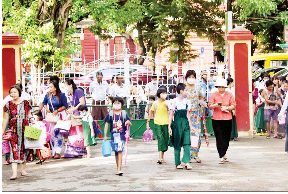
လသာမြို့နယ် အမှတ် (၂) အခြေခံပညာအထက်တန်းကျောင်း၌ ပညာသင်ကြားမည့် ကျောင်းသူလေး များကို တွေ့ရစဉ်။