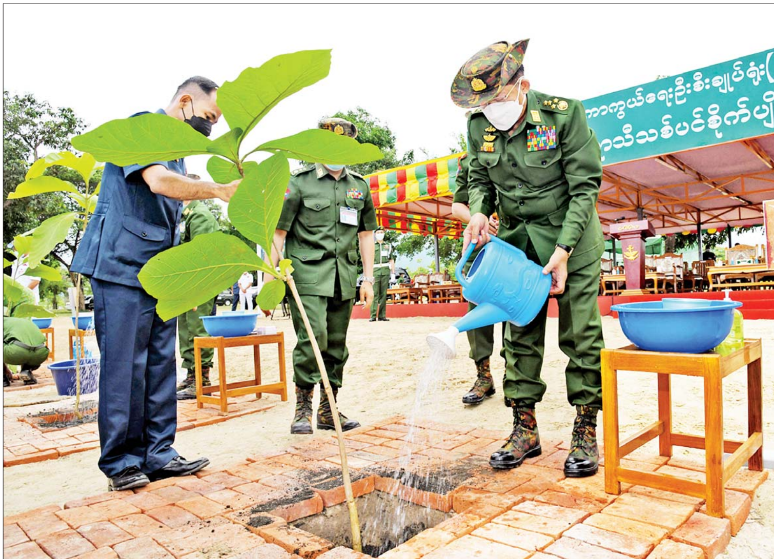
နိုင်ငံတော်စီမံအုပ်ချုပ်ရေးကောင်စီဥက္ကဋ္ဌ တပ်မတော်ကာကွယ်ရေးဦးစီးချုပ် ဗိုလ်ချုပ်မှူးကြီးမင်းအောင်လှိုင် ရတနာတန်းဝင်ကျွန်းပင်ကို စိုက်ပျိုးပေးစဉ်။

နေပြည်တော် ၅ ဇွန် ၂၂ - သဘာဝပတ်ဝန်းကျင်အား ထိန်းသိမ်းနိုင်စေရန်နှင့် ရာသီဥတုကို အထောက်အကူဖြစ်စေရန် အရိပ်အာဝါသရရှိစေရန်၊ နိုင်ငံစီးပွားရေးအတွက် တစ်ဖက်တစ်လမ်းမှ အထောက်အကူဖြစ်စေရန် ရည်ရွယ်၍ ကာကွယ်ရေးဦးစီးချုပ်ရုံး(ကြည်း၊ ရေ၊ လေ) မိသားစုများနှင့် တိုင်းစစ်ဌာနချုပ် အသီးသီးတို့တွင် ၂၀၁၁ ခုနှစ်မှစ၍ နှစ်စဉ် မိုးရာသီ တစ်အုပ်တစ်မ သစ်ပင်စိုက်ပျိုးပွဲများ ကျင်းပပြုလုပ်လျက်ရှိသည်။ ယနေ့တွင် ၂၀၂၂ ခုနှစ် ကာကွယ်ရေးဦးစီးချုပ်ရုံး(ကြည်း၊ ရေ၊ လေ) မိသားစုများ၏ ပထမအကြိမ် မိုးရာသီသစ်ပင်စိုက်ပျိုးပွဲအခမ်းအနားကို နေပြည်တော် ဇေယျာသီရိမြို့နယ် ရေဆင်းဆည်အနီး၌ ကျင်းပပြုလုပ်ရာ နိုင်ငံတော်စီမံအုပ်ချုပ်ရေးကောင်စီဥက္ကဋ္ဌ တပ်မတော်ကာကွယ်ရေးဦးစီးချုပ် ဗိုလ်ချုပ်မှူးကြီးမင်းအောင်လှိုင် တက်ရောက်၍ ရတနာတန်းဝင်ကျွန်းပင်ကို ဦးဆောင်စိုက်ပျိုးပေးသည်။ အဆိုပါအခမ်းအနားသို့ နိုင်ငံတော်စီမံအုပ်ချုပ်ရေးကောင်စီဥက္ကဋ္ဌ တပ်မတော်ကာကွယ်ရေးဦးစီးချုပ်၏ ဇနီး ဒေါ်ကြူကြူလှ၊ နိုင်ငံတော်စီမံအုပ်ချုပ်ရေးကောင်စီဒုတိယဥက္ကဋ္ဌ ဒုတိယတပ်မတော်ကာကွယ်ရေးဦးစီးချုပ် ကာကွယ်ရေးဦးစီးချုပ်(ကြည်း) ဒုတိယဗိုလ်ချုပ်မှူးကြီးစိုးဝင်းနှင့် ဇနီး ဒေါ်သန်းသန်းနွယ်၊ စာမျက်နှာ ၃ ကော်လံ ၁ သို့ ။