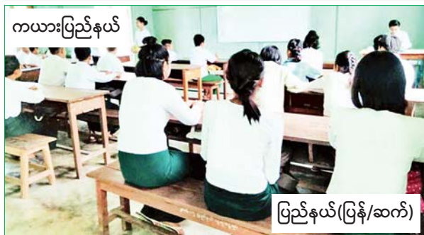
ကယားပြည်နယ်