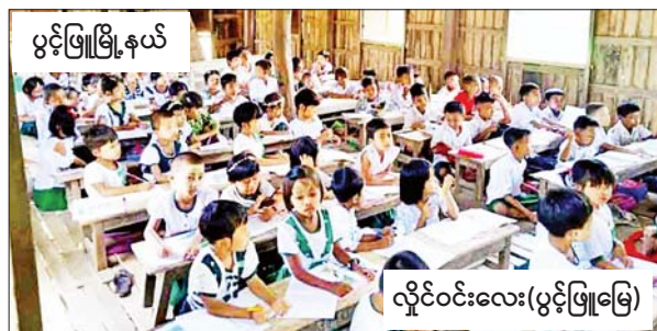
ပွင့်ဖြူမြို့နယ်