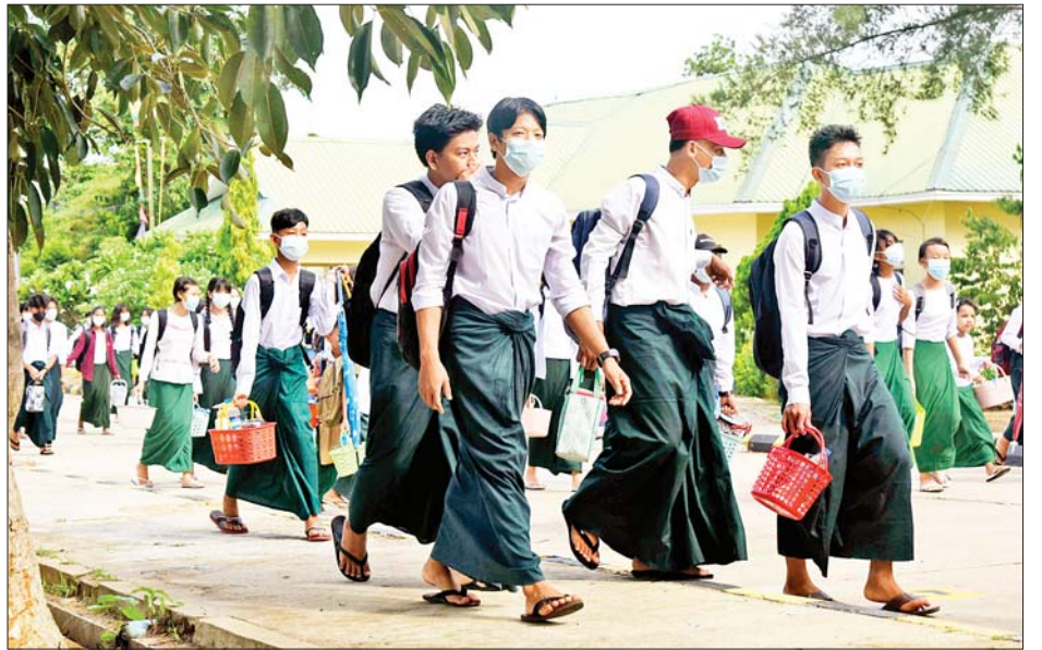
အမှတ် (၅) အခြေခံပညာအထက်တန်းကျောင်းမှ ကျောင်းသား ကျောင်းသူများကို တွေ့ရစဉ်။