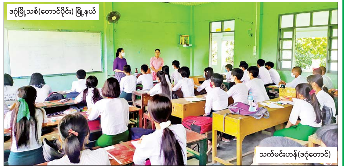
ဒဂုံမြို့သစ်(တောင်ပိုင်း) မြို့နယ်