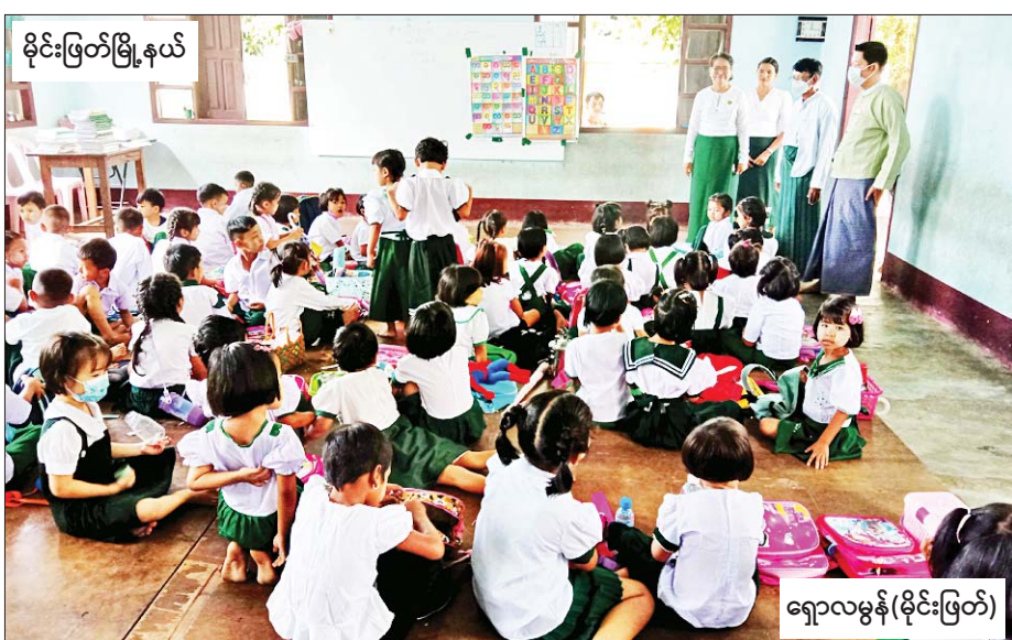
မိုင်းဖြတ်မြို့နယ်