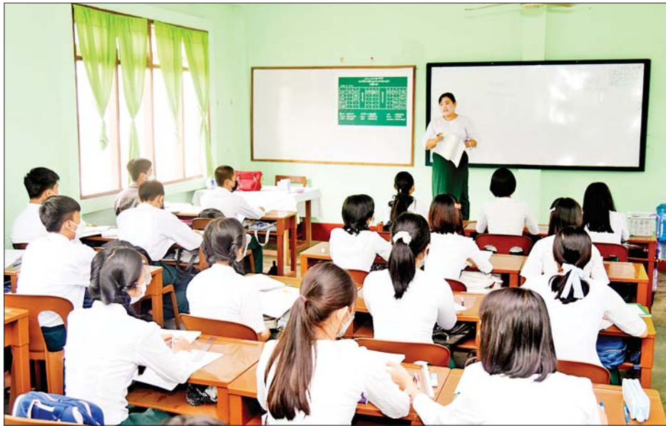
အမှတ် (၆) အခြေခံပညာအထက်တန်းကျောင်း၌ ပညာသင်ကြားနေကြသည့် ကျောင်းသား ကျောင်းသူများကို တွေ့ရစဉ်။