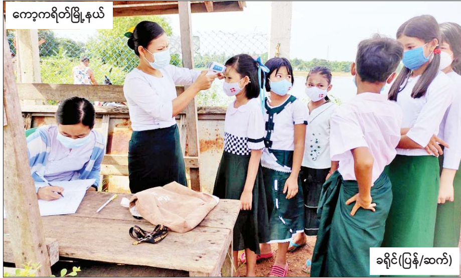
ကျော့ကရိတ်မြို့နယ်

၂၀၂၂-၂၀၂၃ ပညာသင်နှစ်အတွက် မြန်မာနိုင်ငံတစ်ဝန်းလုံးရှိ အခြေခံပညာကျောင်းများကို ယနေ့မှစတင်၍ ဖွင့်လှစ်ရာ ကျောင်းသား ကျောင်းသူများ အေးချမ်းပျော်ရွှင်စွာတက်ရောက်ပညာသင်ကြားနေမှုများကို ဖော်ပြလိုက်ရပါသည်။