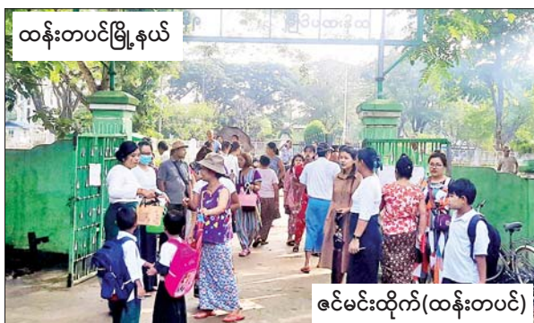
ထန်းတပင်မြို့နယ်