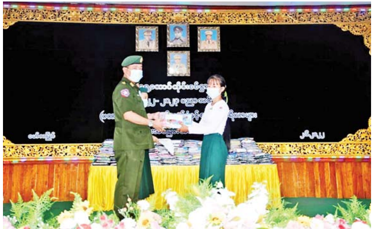
အရှေ့တောင်တိုင်းစစ်ဌာနချုပ်ရှိ ကျောင်းသား ကျောင်းသူများအတွက် ကျောင်းဝတ်စုံနှင့် စာရေးကိရိယာများ ပေးအပ်ရာ ကျောင်းသား ကျောင်းသူများက လက်ခံရယူကြသည်။

နှင့် စာရေးကိရိယာများ ပေးအပ်ရာ ကျောင်းသား ကျောင်းသူများက လက်ခံရယူကြသည်။ အလားတူ တိုင်းစစ်ဌာနချုပ် ကွပ်ကဲမှုအောက် တပ်ရင်း/ တပ်ဖွဲ့များ၌လည်း ကျောင်းသား ကျောင်းသူများအား ကျောင်းဝတ်စုံနှင့် စာရေးကိရိယာများကို တာဝန်ရှိသူများက ထောက်ပံ့ပေးအပ်ခဲ့ကြောင်း သိရသည်။ သတင်းစဉ်