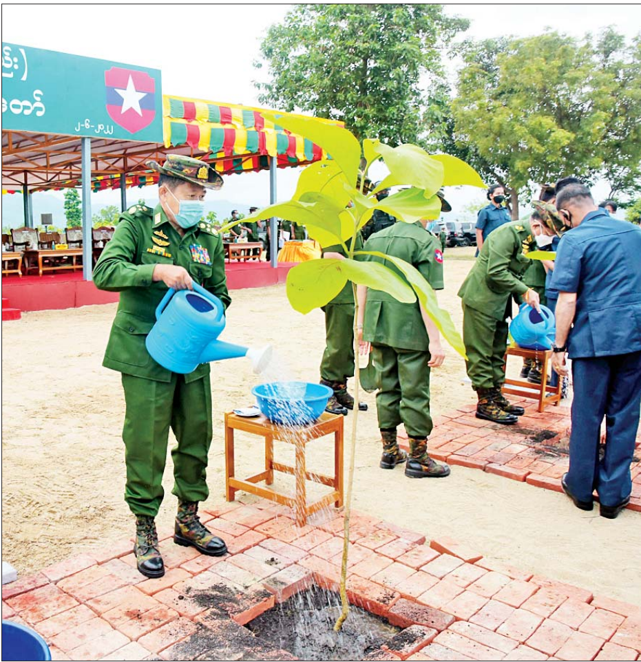
နိုင်ငံတော်စီမံအုပ်ချုပ်ရေးကောင်စီဒုတိယဥက္ကဋ္ဌ ဒုတိယတပ်မတော်ကာကွယ်ရေးဦးစီးချုပ် ကာကွယ်ရေးဦးစီးချုပ်(ကြည်း) ဒုတိယဗိုလ်ချုပ်မှူးကြီးစိုးဝင်း ရတနာတန်းဝင်ကျွန်းပင်ကို စိုက်ပျိုးပေးစဉ်။

သစ်ပင်များသည် သက်ရှိသတ္တဝါများအားလုံး၏ အဓိကအစာကွင်းဆက်ဖြစ်သကဲ့သို့ သက်ရှိသတ္တဝါများ အချိန်နှင့်အမျှ လွှဲပြောင်းနေသည့် အောက်ဆီဂျင်ကို ထုတ်ပေးနေသည့် သဘာဝအောက်ဆီဂျင်ထုတ်စက်များလည်းဖြစ်ကြောင်း၊ အပင်စိုက်ပျိုးခြင်းသည် စိုက်ပျိုးသူကိုယ်တိုင်နှင့် စိုက်ပျိုးသူများ၏ ပတ်ဝန်းကျင်ကို တိုက်ရိုက် သို့မဟုတ် သွယ်ဝိုက်၍ အကျိုးကျေးဇူးများကို ပေးစွမ်းနိုင်ပြီး မိမိတို့၏