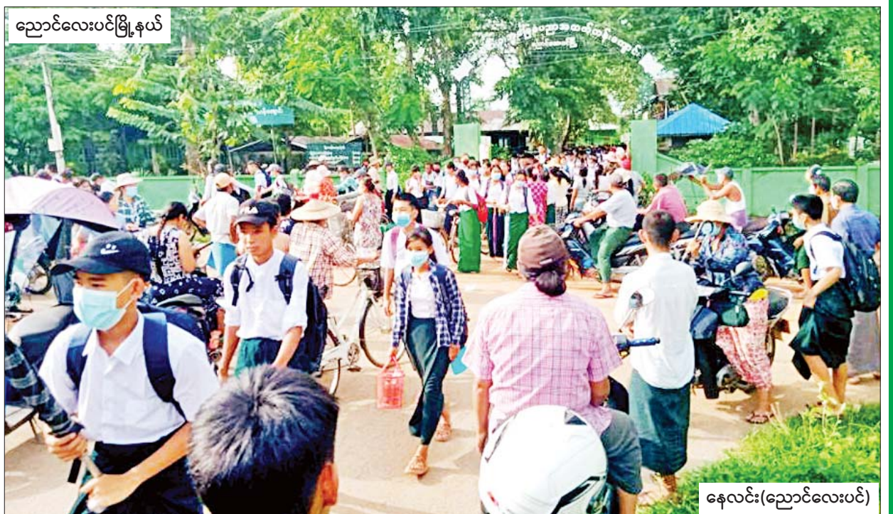
ညောင်လေးပင်မြို့နယ်