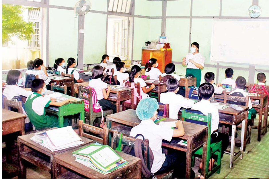
လသာမြို့နယ် အမှတ် (၁) အခြေခံပညာအထက်တန်းကျောင်း၌ ကျောင်းသား ကျောင်းသူများ ပညာသင်ကြားနေမှုကို တွေ့ရစဉ်။