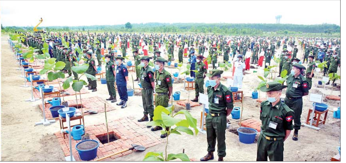
နိုင်ငံတော်စီမံအုပ်ချုပ်ရေးကောင်စီဥက္ကဋ္ဌ တပ်မတော်ကာကွယ်ရေးဦးစီးချုပ် ဗိုလ်ချုပ်မှူးကြီးမင်းအောင်လှိုင် ကာကွယ်ရေးဦးစီးချုပ်ရုံး(ကြည်း၊ ရေ၊ လေ) မိသားစုများ၏ ၂၀၂၂ ခုနှစ် ပထမအကြိမ် မိုးရာသီသစ်ပင်စိုက်ပျိုးပွဲအခမ်းအနားတွင် အမှာစကားပြောကြားစဉ်။