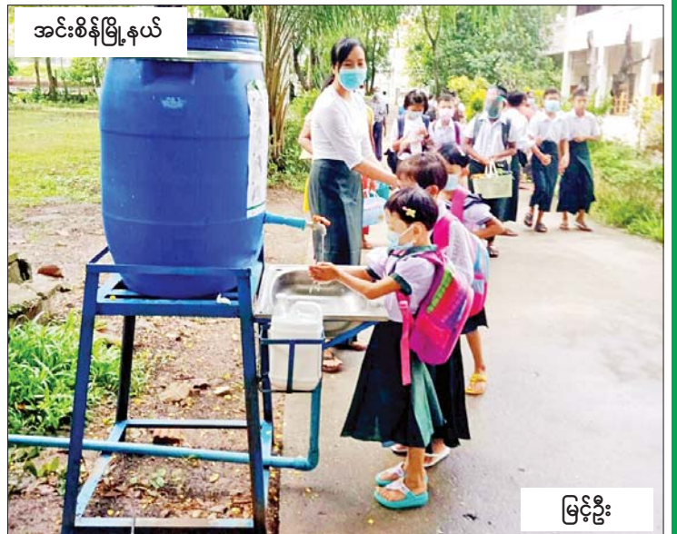
အင်းစိန်မြို့နယ်