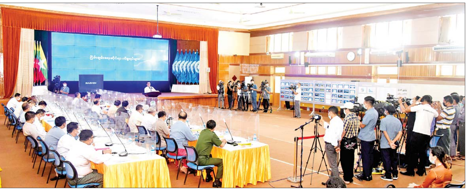
နိုင်ငံတော်စီမံအုပ်ချုပ်ရေးကောင်စီ သတင်းထုတ်ပြန်ရေးအဖွဲ့ (၁၅)ကြိမ်မြောက် သတင်းစာရှင်းလင်းပွဲပြုလုပ်စဉ်။

ပထမဦးဆုံးအနေဖြင့် ငြိမ်းချမ်းရေး ဆိုင်ရာကိစ္စရပ်များကို ပြောကြားသွားမည် ဖြစ်ကြောင်း၊ ယင်းသို့ပြောကြားသည့်အခါ အတိတ်သမိုင်းကြောင်းများနှင့် ဒီမိုကရေစီ အစိုးရစတင်ခဲ့သည့် ၂၀၁၀ ပြည့်နှစ် နောက်ပိုင်း ၁၀ နှစ်တာကာလတွင် ငြိမ်းချမ်းရေးလုပ်ငန်းဆောင်ရွက်ခဲ့မှု အခြေ အနေများ၊ ဖြစ်ပျက်မှုများ၊ ငြိမ်းချမ်းရေး ဆိုင်ရာကိစ္စရပ်များသည် တစ်သမတ်တည်း မရှိကြောင်း၊ နိုင်ငံတိုင်း၏ ငြိမ်းချမ်းရေး ဆိုင်ရာ ကြိုးပမ်းမှုကိစ္စများတွင်လည်း အနိမ့်အမြင့် အတက်အကျရှိကြောင်း၊ ပြည်တွင်း/ပြည်ပ အကျိုးသက်ရောက်မှု ပေါင်းစုံရှိကြောင်း၊ မိမိတို့အနေဖြင့် မည်သည့် လိုအပ်ချက်များရှိခဲ့ကြသည်ကို ပြောကြားသွားမည်ဖြစ်ကြောင်း၊ မီဒီယာ များအနေဖြင့် ယင်းအကြောင်းအရာ များကို သိရှိပြီးဖြစ်သော်လည်း ပြည်သူ လူထုသိရှိစေရန် ရှင်းလင်းပြောကြားခြင်း ဖြစ်ကြောင်း၊ မြန်မာနိုင်ငံသည် လွတ်လပ် ရေးရပြီးချိန်မှစ၍ ပြည်တွင်းပစ်ခတ် တိုက်ခိုက်မှုဖြစ်ပွားခဲ့ရာ ယခုဆိုလျှင်