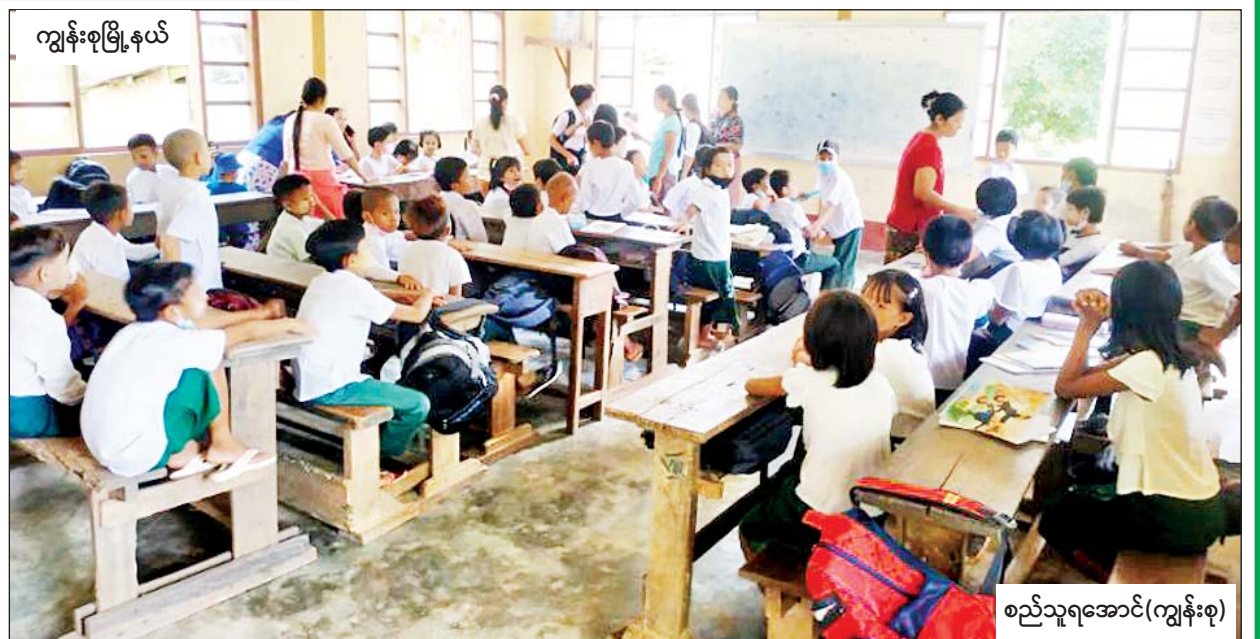
ကျွန်းစုမြို့နယ်