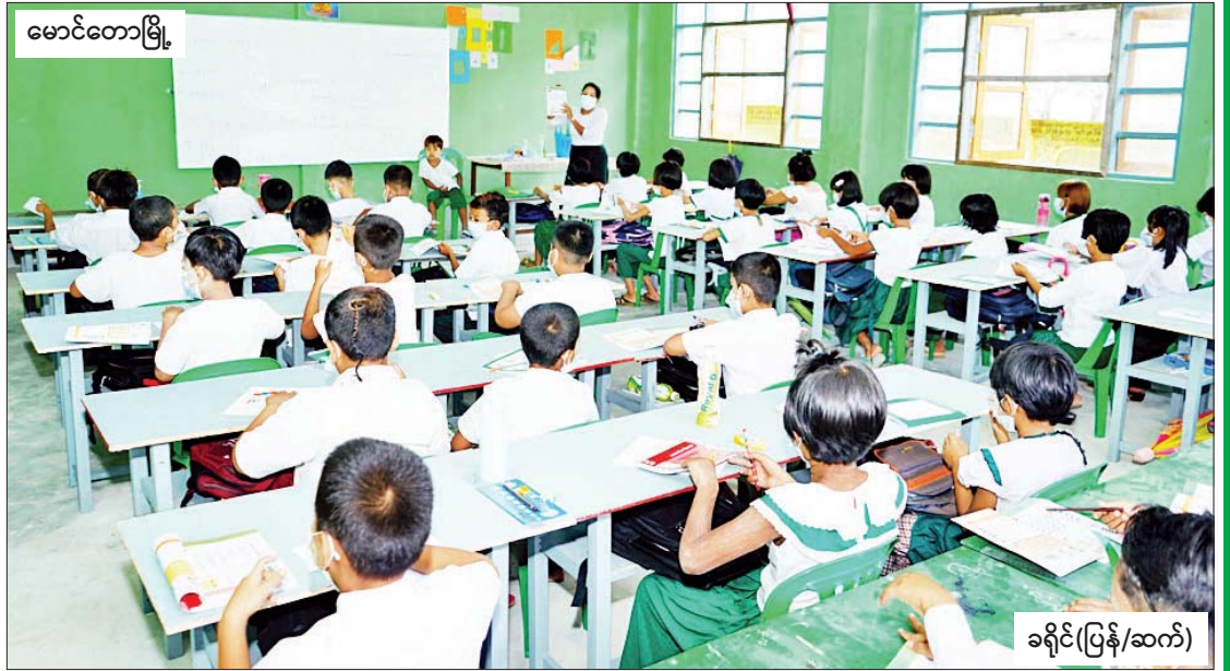
မောင်တောမြို့

၂၀၂၂-၂၀၂၃ ပညာသင်နှစ်အတွက် မြန်မာနိုင်ငံတစ်ဝန်းလုံးရှိ အခြေခံပညာကျောင်းများကို ယနေ့မှစတင်၍ ဖွင့်လှစ်ရာ ကျောင်းသားကျောင်းသူများ အေးချမ်းပျော်ရွှင်စွာ ပညာသင်ကြားနေမှုကို ဖော်ပြလိုက်ရပါသည်။