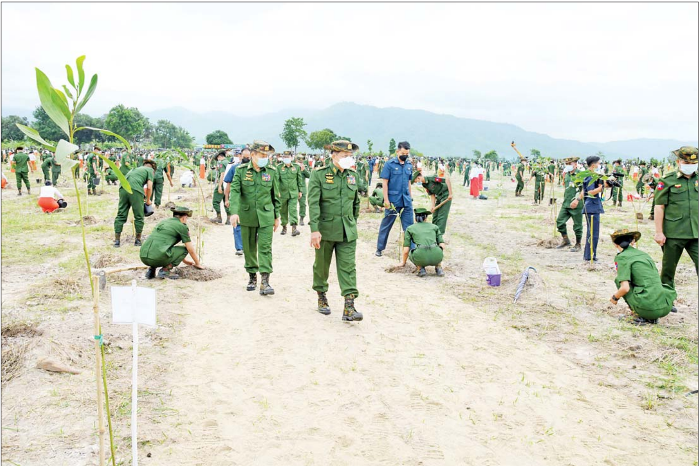
နိုင်ငံတော်စီမံအုပ်ချုပ်ရေးကောင်စီဥက္ကဋ္ဌ တပ်မတော်ကာကွယ်ရေးဦးစီးချုပ် ဗိုလ်ချုပ်မှူးကြီး မင်းအောင်လှိုင်နှင့် အဖွဲ့ဝင်များ အရာရှိ၊ စစ်သည် မိသားစုများ၏ စုပေါင်းသစ်ပင်စိုက်ပျိုးနေမှုအား ကြည့်ရှုအားပေးစဉ်။

ထို့နောက် နိုင်ငံတော်စီမံအုပ်ချုပ်ရေးကောင်စီဥက္ကဋ္ဌ တပ်မတော်ကာကွယ်ရေးဦးစီးချုပ်နှင့် ဇနီးတို့က ရတနာတန်းဝင်ကျွန်းပင်ကို ဦးဆောင်စိုက်ပျိုးပေးကြသည်။ ဆက်လက်ပြီး နိုင်ငံတော်စီမံအုပ်ချုပ်ရေးကောင်စီဒုတိယဥက္ကဋ္ဌ ဒုတိယတပ်မတော်ကာကွယ်ရေးဦးစီးချုပ် ကာကွယ်ရေးဦးစီးချုပ် (ကြည်း)နှင့် ဇနီး၊ ပြည်ထောင်စုဝန်ကြီးများနှင့် ဇနီးများ၊ ညှိနှိုင်းကွပ်ကဲရေးမှူး (ကြည်း၊ ရေ၊ လေ)နှင့် ဇနီး၊ ကာကွယ်ရေးဦးစီးချုပ်(ရေ)နှင့် ဇနီး၊ ကာကွယ်ရေးဦးစီးချုပ်(လေ)နှင့် ဇနီး၊ ကာကွယ်ရေးဦးစီးချုပ်ရုံးမှ တပ်မတော်အရာရှိကြီးများနှင့် ဇနီးများ၊ အခမ်းအနားတက်ရောက်လာကြသည့် အရာရှိ၊ စစ်သည် မိသားစုများက သတ်မှတ်နေရာအသီးသီးတွင် သစ်ပင်များကို စိုက်ပျိုးကြသည်။ ထို့နောက် နိုင်ငံတော်စီမံအုပ်ချုပ်ရေးကောင်စီဥက္ကဋ္ဌ တပ်မတော်ကာကွယ်ရေးဦးစီးချုပ်၊ ဇနီးနှင့် အဖွဲ့ဝင်များသည် အရာရှိ၊ စစ်သည် မိသားစုများ၏ စုပေါင်းသစ်ပင်စိုက်ပျိုးနေမှုအား