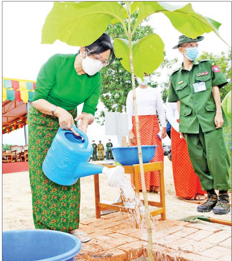
နိုင်ငံတော်စီမံအုပ်ချုပ်ရေးကောင်စီဥက္ကဋ္ဌ တပ်မတော်ကာကွယ်ရေးဦးစီးချုပ် ဗိုလ်ချုပ်မှူးကြီး မင်းအောင်လှိုင်၏ ဇနီး ဒေါ်ကြူကြူလှ ရတနာတန်းဝင်ကျွန်းပင်ကို စိုက်ပျိုးပေးစဉ်။

တိုင်းစစ်ဌာနချုပ်၌ ၁၃၂၇၇ ပင်၊ အရှေ့အလယ်ပိုင်းတိုင်းစစ်ဌာနချုပ်၌ ၁၄၃၀၀ ပင်၊ ကြိတ်ဒေသတိုင်းစစ်ဌာနချုပ်၌ ၂၉၆၀၀၊ အရှေ့တောင်တိုင်းစစ်ဌာနချုပ်၌ ၁၂၀၉၅ ပင်၊ ကမ်းရိုးတန်းဒေသတိုင်းစစ်ဌာနချုပ်၌ ၁၂၄၇၄ ပင်၊ ရန်ကုန်တိုင်းစစ်ဌာနချုပ်၌ ၁၅၁၂၈ ပင်၊ အနောက်တောင်တိုင်းစစ်ဌာနချုပ်၌ ၆၃၅၅ ပင်၊ အနောက်ပိုင်းတိုင်းစစ်ဌာနချုပ်၌ ၁၇၈၇၄ ပင်၊ အနောက်မြောက်တိုင်းစစ်ဌာနချုပ်၌ ၁၀၀၆၅ ပင်၊ အလယ်ပိုင်းတိုင်းစစ်ဌာနချုပ်၌ ၂၆၆၆၆ ပင်နှင့် တောင်ပိုင်းတိုင်းစစ်ဌာနချုပ်၌ ၁၃၉၀၉ ပင်တို့ကို တိုင်းမှူးများနှင့် တာဝန်ရှိသူများက စုပေါင်းစိုက်ပျိုးခဲ့ကြပြီး တပ်မတော်တစ်ရပ်လုံးအနေဖြင့် ယနေ့တွင် စုစုပေါင်းသစ်ပင် ၂၁၆၁၀၇ ပင်ကို စိုက်ပျိုးခဲ့ကြကြောင်း သိရသည်။ သတင်းစဉ်