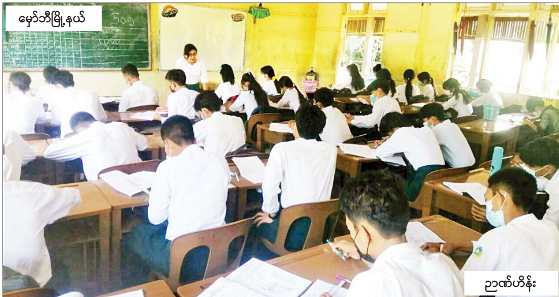
မှော်ဘီမြို့နယ်