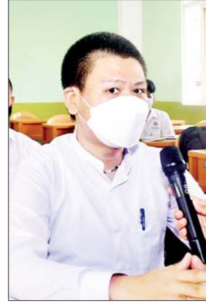
အထက (၁) လသာမှ ကျောင်းသားတစ်ဦး