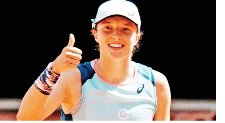
ငွေကြယ် - ရေးသားသည်

ပြင်သစ်အိုးပင်းတင်းနစ်ပြိုင်ပွဲရဲ့ အမျိုးသားတစ်ဦးချင်း ကွာတားဖိုင်နယ်အဆင့် မာရင်စီလစ်က ရာဘီလက်စ်ကို ၅-၇၊ ၆-၃၊ ၆-၄၊ ၃-၆၊ ၇-၆(၁၀-၂)နဲ့ အနိုင်ရရှိခဲ့တာ ဖြစ်ပြီး မာရင်စီလစ်ဟာ ဆီမီးပိုင်နယ်အဆင့်မှာ နော်ဝေတင်းနစ်ကစားသမား ကက်စပါရဒ် နဲ့ ယှဉ်ပြိုင်ကစားရမှာ ဖြစ်ပါတယ်။