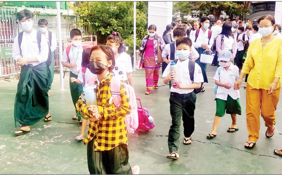
မန္တလေးမြို့ အမှတ်(၁၆)အခြေခံပညာအထက်တန်းကျောင်းတွင် ကျောင်းတက်ရန်လာရောက်ကြသည့် ကျောင်းသား ကျောင်းသူများကို တွေ့ရစဉ်။

မန္တလေး ဇွန် ၂ ၂၀၂၂-၂၀၂၃ ပညာသင်နှစ်အတွက် တစ်နိုင်ငံလုံးရှိ အခြေခံပညာကျောင်းများကို ယနေ့နံနက်ပိုင်းမှ စတင်ဖွင့်လှစ်ခဲ့ရာ မန္တလေးမြို့ရှိ အခြေခံပညာကျောင်းများတွင် ကျောင်းသား ကျောင်းသူများ အေးချမ်းပျော်ရွှင်စွာ ပညာသင်ကြားလျက်ရှိသည်။ ထိုသို့ ကျောင်းတက်ကြသည့် ကျောင်းသား ကျောင်းသူများကို တာဝန်ကျ ဆရာ ဆရာမများက ကျောင်းဝင်ပေါက်အသီးသီး၌ ကိုယ်အပူချိန်တိုင်းတာပေးခြင်း၊ နှာခေါင်းစည်းနှင့် မျက်နှာအကာများ တပ်ဆင်ထားခြင်း ရှိ၊ မရှိ စစ်ဆေးခြင်း၊ တပ်ဆင်ထားခြင်းမရှိပါက အသင့်ထားရှိသည့် နှာခေါင်းစည်းများ တပ်ဆင်စေခြင်း၊ ကျောင်းအတွင်းရှိ လက်ဆေးဘေစင်များတွင် စနစ်တကျလက်ဆေးစေခြင်းတို့ကို ကြီးကြပ်ဆောင်ရွက်ပေးလျက်ရှိသည်။