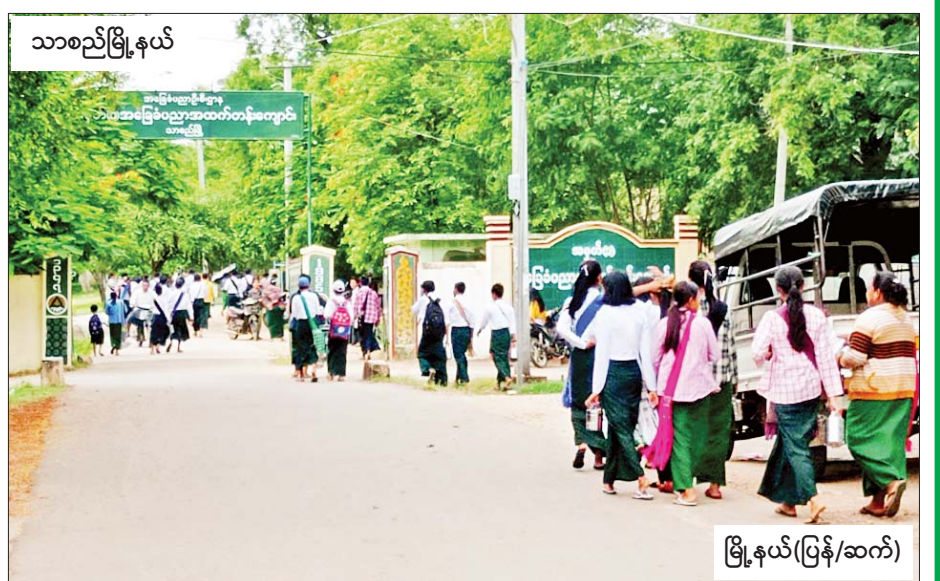
သာစည်မြို့နယ်