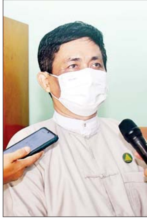
အထက (၁) လသာ ကျောင်းအုပ်ဆရာကြီး