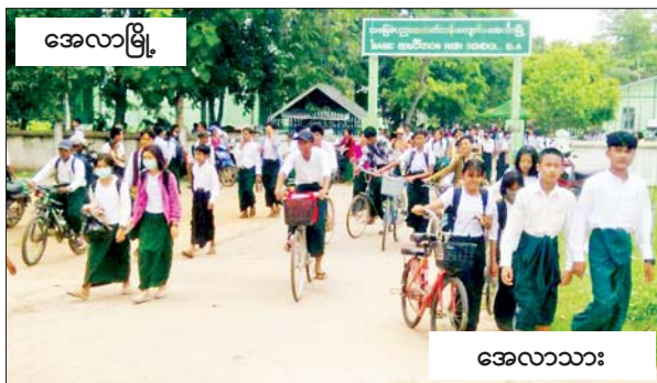
အေလာမြို့