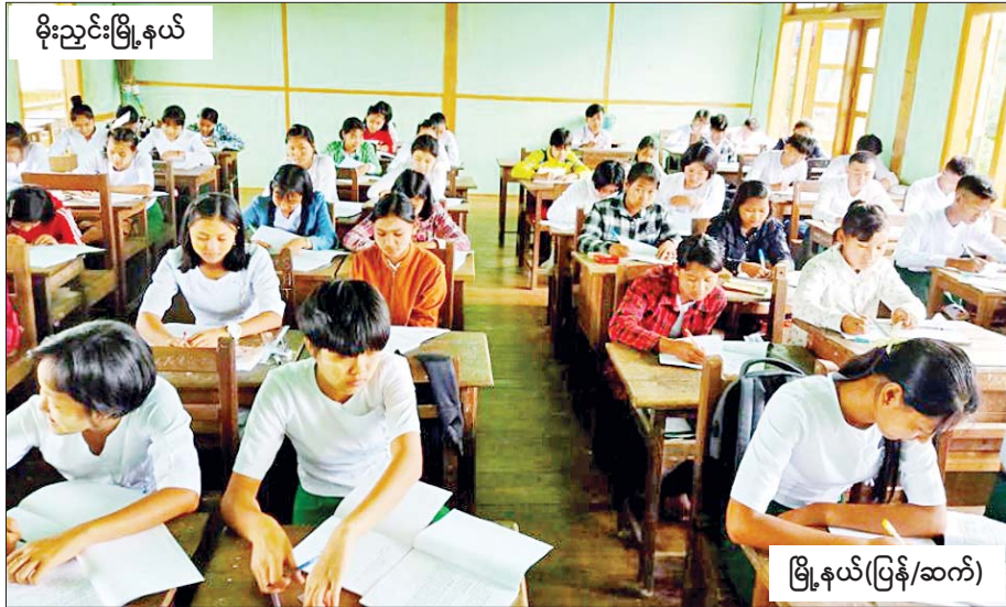
မိုးညှင်းမြို့နယ်