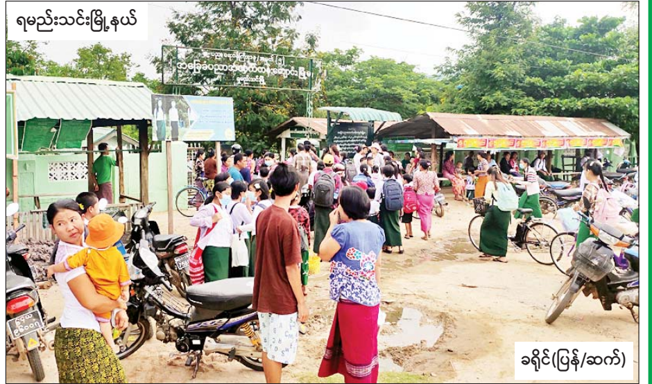
ရမည်းသင်းမြို့နယ်