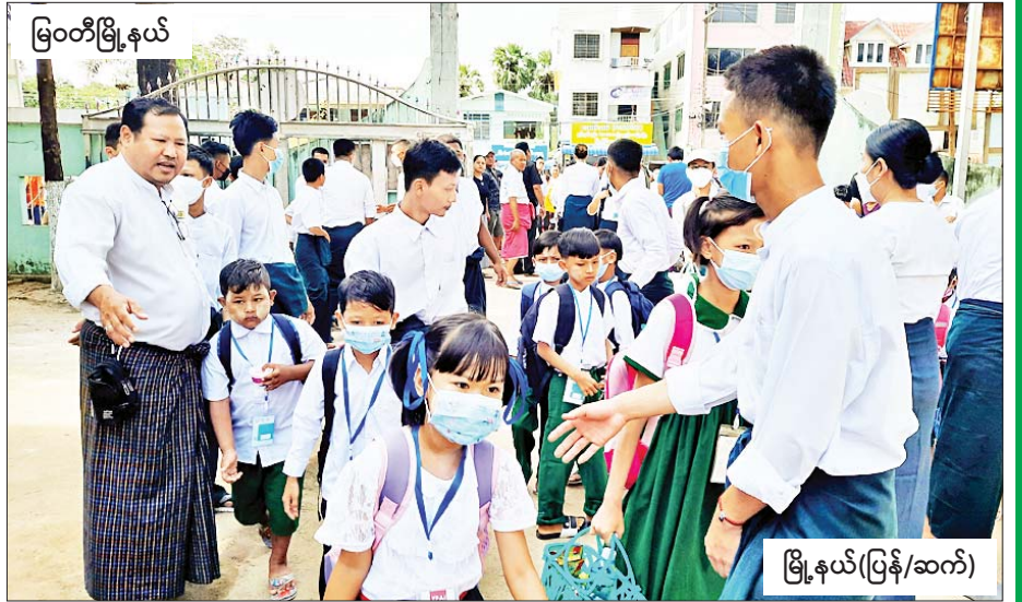
မြဝတီမြို့နယ်