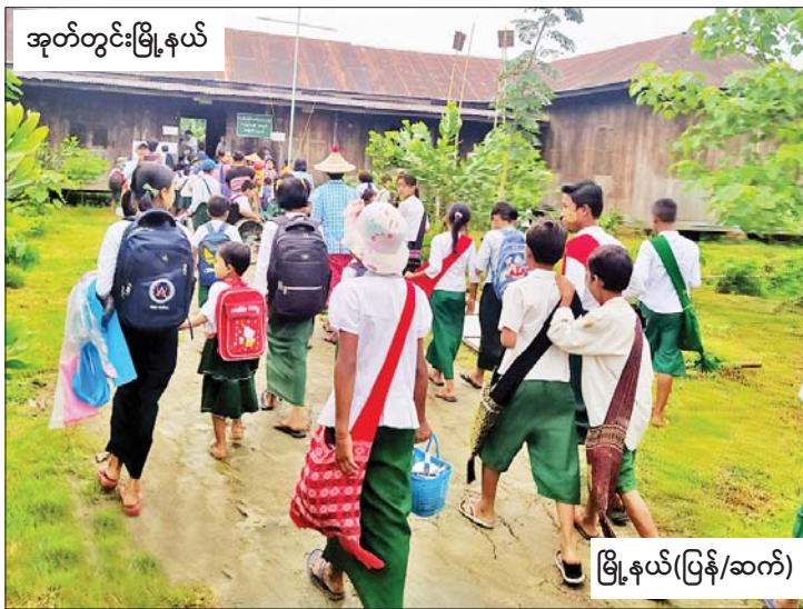
အုတ်တွင်းမြို့နယ်