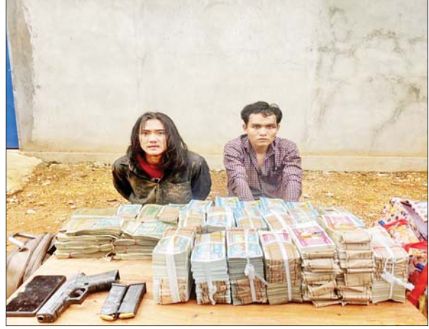
ဘားအံမြို့ အမှတ် (၉)ရပ်ကွက် ရေကျော်လမ်းရှိ CB ဘဏ် ဓားပြတိုက်မှုဖြစ်စဉ်တွင် ဖမ်းဆီးရမိသည့် မှတ်တမ်းဓာတ်ပုံ။