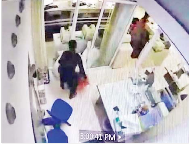
ဘားအံမြို့ အမှတ် (၉)ရပ်ကွက် ရေကျော်လမ်းရှိ CB ဘဏ် ဓားပြတိုက်မှုဖြစ်စဉ် CCTV မှတ်တမ်းဓာတ်ပုံ။