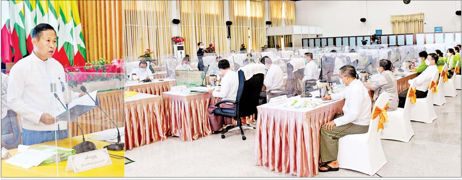
နိုင်ငံတော်စီမံအုပ်ချုပ်ရေးကောင်စီဒုတိယဥက္ကဋ္ဌ ဒုတိယဝန်ကြီးချုပ် ဒုတိယဗိုလ်ချုပ်မှူးကြီး စိုးဝင်း မူပိုင်ခွင့်ဆိုင်ရာ ဗဟိုကော်မတီအစည်းအဝေး (၁/၂၀၂၂)တွင် အမှာ စကားပြောကြားစဉ်။

နေပြည်တော် ဇွန် ၃ မူပိုင်ခွင့်ဆိုင်ရာ ဗဟိုကော်မတီ အစည်းအဝေး(၁/၂၀၂၂) ကို ယနေ့ မွန်းလွဲ ၂ နာရီတွင် နေပြည်တော်ရှိ စီးပွားရေးနှင့် ကူးသန်းရောင်းဝယ် ရေးဝန်ကြီးဌာန ညီလာခံခန်းမ၌ ကျင်းပရာ မူပိုင်ခွင့်ဆိုင်ရာဗဟို ကော်မတီဥက္ကဋ္ဌ နိုင်ငံတော်စီမံ အုပ်ချုပ်ရေးကောင်စီဒုတိယဥက္ကဋ္ဌ ဒုတိယဝန်ကြီးချုပ် ဒုတိယ ဗိုလ်ချုပ်မှူးကြီးစိုးဝင်း တက်ရောက် အမှာစကား ပြောကြားသည်။ အစည်းအဝေးသို့ ပြည်ထောင်စု ဝန်ကြီး ဒေါက်တာပွင့်ဆန်း၊ ဒုတိယဝန်ကြီးများ၊ အမြဲတမ်း အတွင်းဝန်၊ ညွှန်ကြားရေးမှူးချုပ် များနှင့်တာဝန်ရှိသူများ တက်ရောက် ကြသည်။ စာမျက်နှာ ၆ ကော်လံ ၁ သို့ *