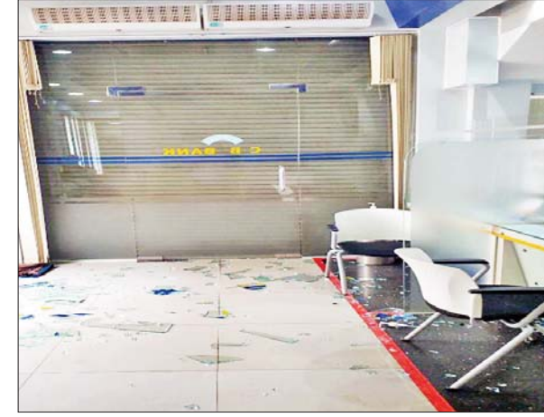
ဘားအံမြို့ အမှတ် (၉)ရပ်ကွက် ရေကျော်လမ်းရှိ CB ဘဏ် ဓားပြတိုက်မှုဖြစ်စဉ်တွင် ဘဏ်တွင်းပျက်စီးခဲ့မှု မှတ်တမ်းဓာတ်ပုံ။