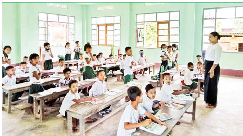
တောင်ကုတ်မြို့ရှိ အခြေခံပညာကျောင်းများတွင် ကျောင်းသား ကျောင်းသူများ အေးချမ်းစွာ ပညာသင်ကြားနေမှုအား တွေ့ရစဉ်။