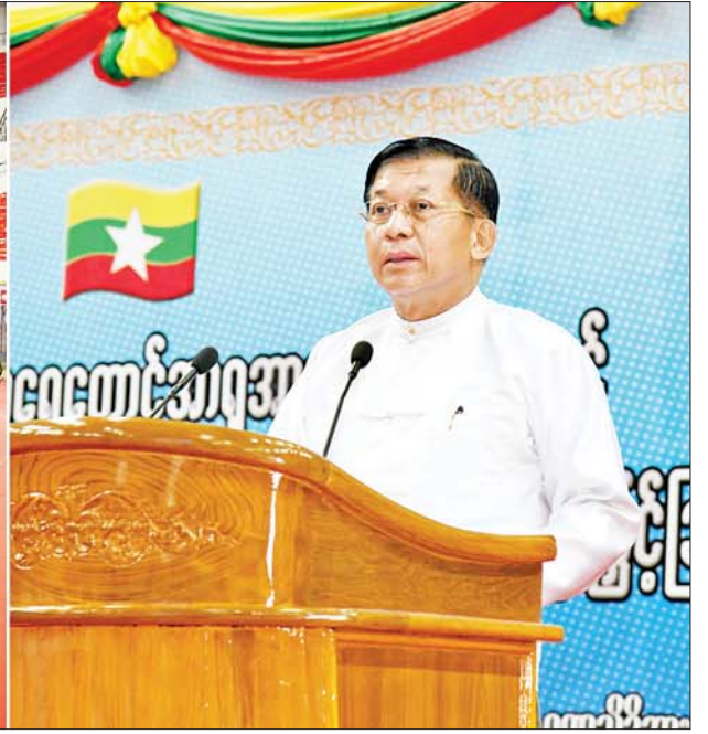
နိုင်ငံတော်စီမံအုပ်ချုပ်ရေးကောင်စီဥက္ကဋ္ဌ နိုင်ငံတော်ဝန်ကြီးချုပ် ဗိုလ်ချုပ်မှူးကြီး မင်းအောင်လှိုင် (၃၁)ကြိမ်မြောက် အရှေ့တောင်အာရှအားကစားပြိုင်ပွဲတွင် ဆုတံဆိပ်ရရှိခဲ့သည့် မြန်မာအားကစားအဖွဲ့များအား နိုင်ငံတော်က ဂုဏ်ပြုဆုချီးမြှင့်ခြင်းအခမ်းအနားတွင် အမှာစကားပြောကြားစဉ်။

ဝ ရှေ့ဖုံးမှ ပြည်ထောင်စုဝန်ကြီးများ၊ ပြည်ထောင်စု စာရင်းစစ်ချုပ်၊ ပြည်ထောင်စုရာထူးဝန် အဖွဲ့ဥက္ကဋ္ဌ၊ နေပြည်တော်ကောင်စီဥက္ကဋ္ဌ၊ မြန်မာနိုင်ငံတော်ဗဟိုဘဏ် ဥက္ကဋ္ဌ၊ ကာကွယ်ရေးဦးစီးချုပ်ရုံးမှ တပ်မတော် အရာရှိကြီးများ၊ နေပြည်တော်တိုင်းစစ်ဌာနချုပ် တိုင်းမှူး၊ ဒုတိယဝန်ကြီးများ၊ မြန်မာနိုင်ငံ အိုလံပစ်ကောင်စီအဖွဲ့ဝင်များ၊ မြန်မာနိုင်ငံ အားကစားအဖွဲ့ချုပ်များမှ ဥက္ကဋ္ဌများ၊ ဒုတိယဥက္ကဋ္ဌများ၊ ဖိတ်ကြားထားသူများ၊ နိုင်ငံ့ဂုဏ်ဆောင်အားကစားသမားများ၊ အုပ်ချုပ်သူများ၊ နည်းပြများနှင့်တာဝန်ရှိသူများတက်ရောက်ကြသည်။ ဂုဏ်ပြုအမှာစကားပြောကြား အခမ်းအနားတွင် နိုင်ငံတော်စီမံအုပ်ချုပ်ရေးကောင်စီဥက္ကဋ္ဌ နိုင်ငံတော်ဝန်ကြီးချုပ်က ဂုဏ်ပြုအမှာစကားပြောကြားရာတွင် အားကစားဆိုသည်မှာ နိုင်ငံတစ်နိုင်ငံ၊ လူမျိုး တစ်မျိုး၏ ကျန်းမာကြံ့ခိုင်မှု၊ စွမ်းရည်ကို ပေါ်လွင်စေနိုင်ပြီး အားကစားပြိုင်ပွဲများသည် တရားမျှတမှုရှိသည့် စွမ်းရည်ပြယုတ္တိပြိုင်ပွဲများဖြစ်ပါကြောင်း။ အလားတူ အားကစားသည် နိုင်ငံသူ၊ နိုင်ငံသားများ၏ စိတ်နှလုံးကို စွဲဆောင်သိမ်းသွင်းနိုင်ခြင်း၊ နိုင်ငံ့ဂုဏ်၊ အမျိုးဂုဏ်၊ ဇာတိဂုဏ်ကိုဆောင်ကာ အမျိုးသားရေး