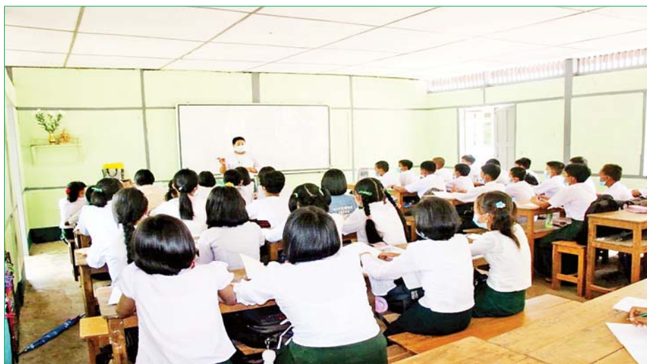
ပုသိမ်မြို့ရှိ အခြေခံပညာကျောင်းများတွင် ကျောင်းသား ကျောင်းသူများ အေးချမ်းစွာ ပညာသင်ကြားနေမှုအား တွေ့ရစဉ်။

နေပြည်တော် ဇွန် ၃ ၂၀၂၂-၂၀၂၃ ပညာသင်နှစ် အခြေခံပညာကျောင်းများကို ဇွန် ၂ ရက်မှစတင်၍ တိုင်းဒေသကြီးနှင့် ပြည်နယ်အသီးသီးရှိ အခြေခံပညာကျောင်းများ၊ ဘုန်းတော်ကြီးသင်ကျောင်းများနှင့် ကိုယ်ပိုင်ကျောင်းများ၌ စတင်ဖွင့်လှစ်သင်ကြားခဲ့ရာ ယနေ့တွင်လည်း ကျောင်းသား ကျောင်းသူများသည် သက်ဆိုင်ရာ အတန်းအလိုက် သင်ခန်းစာများကို အေးချမ်းပျော်ရွှင်စွာ သင်ကြားလျက်ရှိပါသည်။ ၉၃ ဒသမ ၁၉ ရာခိုင်နှုန်း ယနေ့တွင် တိုင်းဒေသကြီးနှင့် ပြည်နယ်အသီးသီးရှိ အခြေခံပညာကျောင်းများ၊ ဘုန်းတော်ကြီးသင်ကျောင်းများနှင့် ကိုယ်ပိုင်ကျောင်းများ၌ ကျောင်းသား ကျောင်းသူ စုစုပေါင်း ၅၆၃၁၈၃၈ ဦး တက်ရောက်ပညာသင်ကြားလျက်ရှိရာ တစ်နိုင်ငံလုံး ကျောင်းတက်ရာခိုင်နှုန်းအနေဖြင့် ၉၃ ဒသမ ၁၉