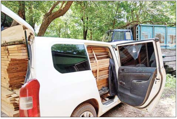
တံခါးနှင့် ကျွန်းတံခါး အပိုင်းအစများ သူညီ ဒသမ ၅၁၉၄ တန် (ခန့်မှန်း တန်ဖိုးငွေကျပ် ၃၄၂၈၀၄)နှင့် အဆိုပါသစ်များ တင်ဆောင်လာသည့် ယာဉ်တစ်စီး (ခန့်မှန်းတန်ဖိုးငွေကျပ် ၁၅၀၀၀၀၀) စုစုပေါင်း ခန့်မှန်း တန်ဖိုးငွေကျပ် ၁၅၃၄၂၈၀၄ ကို သိမ်းဆည်းရမိခဲ့ပြီး သစ်တောဥပဒေနှင့်အညီ အရေးယူ ဆောင်ရွက်လျက်ရှိသည်။ အလားတူ စစ်ကိုင်းတိုင်း

တရားမဝင် ကုန်သွယ်မှု တိုက်ဖျက်ရေး ဦးဆောင်ကော်မတီ၏ ကြီးကြပ်ကွပ်ကဲမှုဖြင့် တရားမဝင် ကုန်သွယ်မှုများကို ဥပဒေနှင့်အညီ ထိရောက်စွာ တားဆီး အရေးယူနိုင်ရေး ဆောင်ရွက်လျက်ရှိရာ ဇွန် ၃ ရက်တွင် ရန်ကုန်တိုင်းဒေသကြီး တရားမဝင် ကုန်သွယ်မှု တိုက်ဖျက်ရေး အထူးအဖွဲ့၏ စီမံခန့်ခွဲမှုဖြင့် သစ်တောဦးစီးဌာန ဦးဆောင်သော စစ်ဆေးရေးအဖွဲ့ က စစ်ဆေးမှုများ ဆောင်ရွက်ခဲ့ရာ ရန်ကုန်မြောက်ပိုင်းခရိုင် မော်ဘီမြို့နယ်အတွင်း တရားမဝင် ကျွန်းတံခါးချပ်၊ ကျွန်းပြတင်း