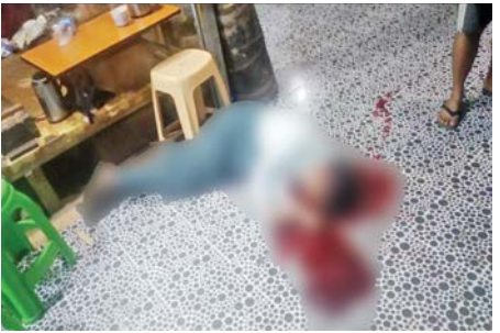
၁၀-၆-၂၀၂၂ ရက်တွင် ဗိုလ်တထောင်မြို့နယ် ရဲရိပ်သာရပ်ကွက်၌ အပြစ်မဲ့ပြည်သူတစ်ဦး သေနတ်ဖြင့် ပစ်ခတ်ခံရမှု။