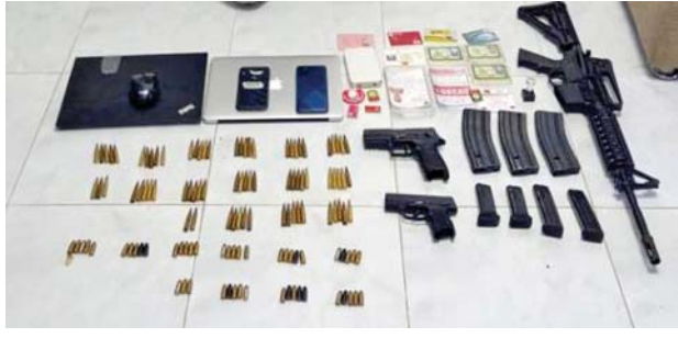
ဒဂုံဆိပ်ကမ်းမြို့နယ် ရတနာလမ်း ရတနာနှင့်ဆီအိမ်ရာ တိုက်အမှတ်(3/B)၊ အခန်းအမှတ်(B-0907)၌ မောင်ကျော်(ခ) ဖြိုးဇေယျာသော်နှင့်အတူ ဖမ်းဆီးရမိခဲ့သည့် လက်နက်/ခဲယမ်းများ မှတ်တမ်းဓာတ်ပုံ။