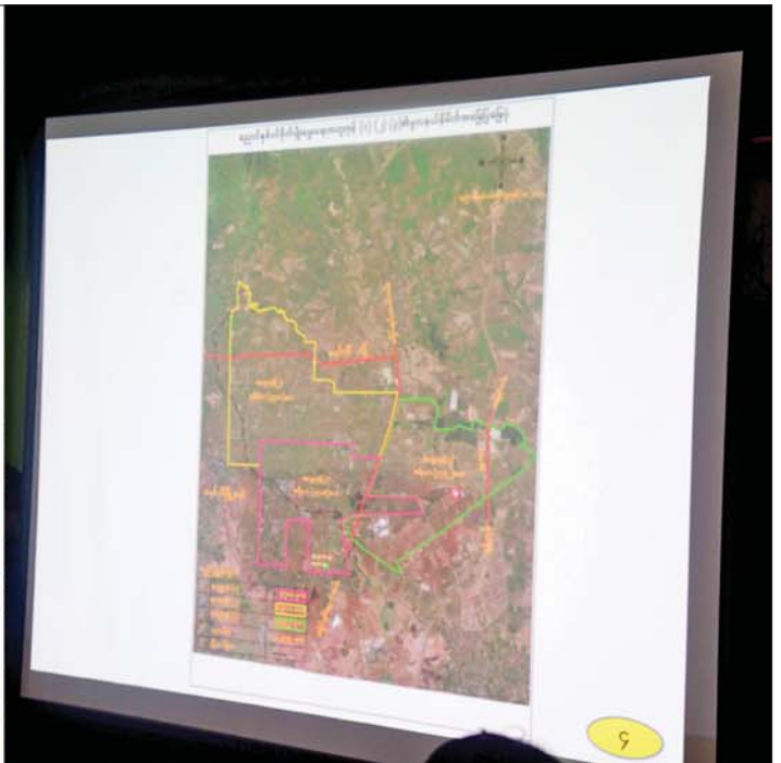
နိုင်ငံတော်စီမံအုပ်ချုပ်ရေးကောင်စီဥက္ကဋ္ဌ နိုင်ငံတော်ဝန်ကြီးချုပ် ဗိုလ်ချုပ်မှူးကြီးမင်းအောင်လှိုင်အား ညောင်နစ်ပင် စိုက်ပျိုးမွေးမြူရေးအထူးဇုန် အစည်းအဝေးခန်းမ၌ ရန်ကုန်တိုင်းဒေသကြီးဝန်ကြီးချုပ် ဦးစိုးသိန်းက စိုက်ပျိုးမွေးမြူရေးဇုန်အတွင်း စိုက်ပျိုးရေးနှင့် မွေးမြူရေးလုပ်ငန်းများ အပိုင်းလိုက်ခွဲခြားဆောင်ရွက်ထားရှိမှုအခြေအနေများကို ရှင်းလင်းတင်ပြစဉ်။