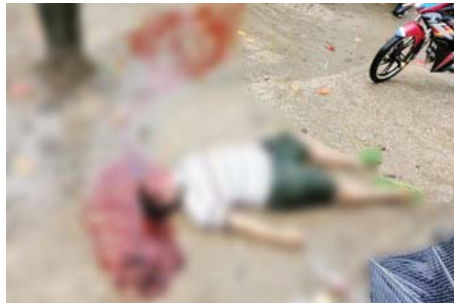
၁၆-၆-၂၀၂၂ ရက်တွင် လှိုင်သာယာမြို့နယ် (၁၃)ရပ်ကွက်၌ အပြစ်မဲ့ပြည်သူတစ်ဦး သေနတ်ဖြင့် ပစ်ခတ်ခံရမှု။