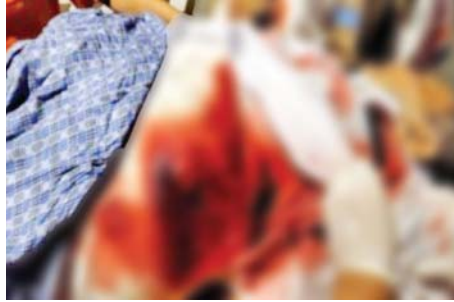
၃-၆-၂၀၂၂ ရက်တွင် ဒေါပုံမြို့နယ် ရပ်ကွက်စီမံအုပ်ချုပ်ရေးအဖွဲ့ရုံး၌ အပြစ်မဲ့ပြည်သူတစ်ဦး သတ်ဖြတ်ခံရမှု။