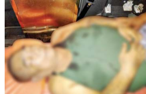
၂၆-၈-၂၀၂၂ ရက်တွင် ဒဂုံမြို့သစ်(ဆိပ်ကမ်း)မြို့နယ် (၉၄)ရပ်ကွက်တွင် အပြစ်မဲ့ပြည်သူတစ်ဦး သတ်ဖြတ်ခံရမှု။