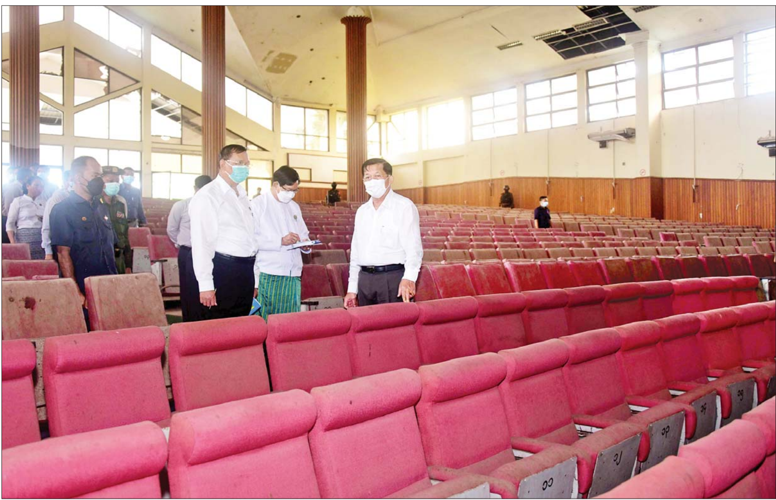
နိုင်ငံတော်စီမံအုပ်ချုပ်ရေးကောင်စီဥက္ကဋ္ဌ နိုင်ငံတော်ဝန်ကြီးချုပ် ဗိုလ်ချုပ်မှူးကြီးမင်းအောင်လှိုင် ဖွဲ့စည်းပုံအခြေခံဥပဒေ (၂၀၀၈ ခုနှစ်)ရေးဆွဲရန် အမျိုးသားညီလာခံ ကျင်းပခဲ့သည့် ပြည်ထောင်စုခန်းမကြီးအတွင်း ကြည့်ရှုစစ်ဆေးစဉ်။

နေပြည်တော် ဇွန် ၈ နိုင်ငံတော် စီမံအုပ်ချုပ်ရေး ကောင်စီဥက္ကဋ္ဌ နိုင်ငံတော် ဝန်ကြီးချုပ် ဗိုလ်ချုပ်မှူးကြီး မင်းအောင်လှိုင်သည် ယနေ့နံနက် ပိုင်းတွင် ကောင်စီဝင် ဗိုလ်ချုပ်ကြီး တင်အောင်စန်း၊ ကောင်စီတွဲဖက် အတွင်းရေးမှူး ဒုတိယဗိုလ်ချုပ်ကြီး ရဲဝင်းဦး၊ ဆောက်လုပ်ရေး ဝန်ကြီးဌာန ပြည်ထောင်စုဝန်ကြီး ဦးရွှေလေး၊ ရန်ကုန်တိုင်းဒေသကြီး ဝန်ကြီးချုပ် ဦးစိုးသိန်း၊ ကာကွယ် ရေးဦးစီးချုပ်ရုံးမှ တပ်မတော် အရာရှိကြီးများ၊ ရန်ကုန်တိုင်း စစ်ဌာနချုပ် တိုင်းမှူး ဗိုလ်ချုပ် ညွန့်ဝင်းဆွေ၊ မြို့တော်ဝန် ဦးဘိုဌေး၊ ဒုတိယဝန်ကြီးများနှင့် တာဝန်ရှိသူများ လိုက်ပါ၍ ရန်ကုန်တိုင်းဒေသကြီး လှည်းကူး မြို့နယ် ညောင်နှစ်ပင်ကျေးရွာ အနီးရှိ ဖွဲ့စည်းပုံအခြေခံဥပဒေ (၂၀၀၈ ခုနှစ်) ရေးဆွဲရန် အမျိုးသားညီလာခံ ကျင်းပခဲ့ သည့် ပြည်ထောင်စုခန်းမကြီး သို့ သွားရောက်ကြည့်ရှုစစ်ဆေး သည်။ စာမျက်နှာ ၃ ကော်လံ ၁ သို့ ။