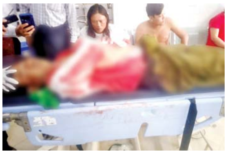
၁-၆-၂၀၂၁ ရက်တွင် လှိုင်သာယာမြို့နယ် (၁၁)ရပ်ကွက်၌ အပြစ်မဲ့ပြည်သူ တစ်ဦး သေဆုံးသဖြင့် ပစ်ခတ်ခံရမှု။

○ ကျောပုံးမှ သင်္ဃန်းကျွန်းမြို့နယ် (၈)မြောက်ရပ်ကွက် ပြည်သာယာလမ်းသွယ်(၂) အမှတ်(၁၄၂)ရှိ ၎င်း၏ နေအိမ်များတွင် M-16 ခုနှစ်လက်၊ AK-47 ရှစ်လက်၊ MK-12 ၁၅ လက်၊ M4 A1 ကာဘိုင် သုံးလက်၊ FCG-9 သုံးလက်၊ စနိုက်ပါ နှစ်လက်၊ ကာဘိုင် တစ်လက်၊ ပစ္စတို ၁၁ လက်၊ လက်လုပ်ပစ္စတို ၁၂၈ လက် စုစုပေါင်းသေဆုတ် ၁၇၈ လက်နှင့် ဖောက်ခွဲရေးဆက်စပ်ပစ္စည်းများ ထပ်မံသိမ်းဆည်းရမိခဲ့သည်။