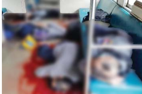
၁၄-၈-၂၀၂၂ ရက်တွင် ရန်ကုန်မြို့ပတ်ရထား၌ လုံခြုံရေးရဲတပ်ဖွဲ့ဝင်များ ပစ်ခတ်ခံရမှု။