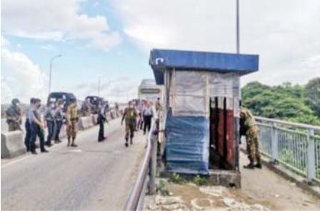
၂၂-၈-၂၀၂၂ ရက်တွင် လှိုင်သာယာမြို့နယ်၊ ဘုရင့်နောင်တံတားအဆင်းရှိ လုံခြုံရေးရဲကင်း ပစ်ခတ်ခံရမှု။