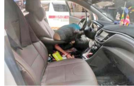
၈-၆-၂၀၂၂ ရက်တွင် တာမွေမြို့နယ် ကျားကွက်သစ်ရပ်ကွက်၌ အပြစ်မဲ့ပြည်သူတစ်ဦး သတ်ဖြတ်ခံရမှု။