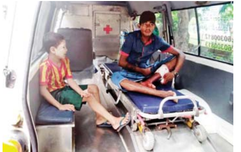
၃၀-၅-၂၀၂၁ ရက်တွင် ရွှေပြည်သာမြို့နယ် (၆)ရပ်ကွက်ရှိ မြို့နယ်စီမံအုပ်ချုပ်ရေးအဖွဲ့ရုံးရှေ့တွင် လက်လုပ်ဗုံးတစ်လုံး ပေါက်ကွဲခဲ့ရာ အပြစ်မဲ့ပြည်သူ နှစ်ဦး ဒဏ်ရာရရှိမှု။