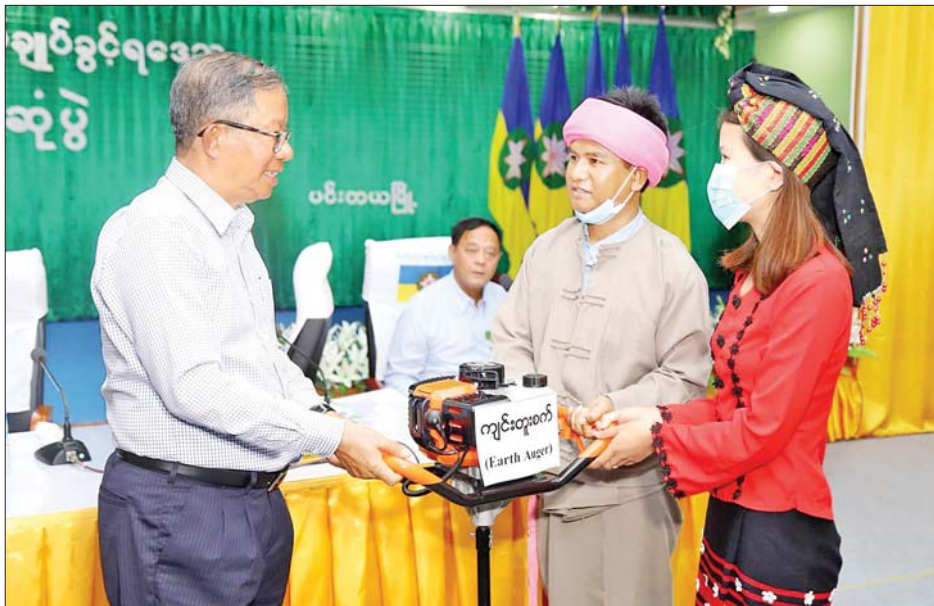
ပြည်ထောင်စုဝန်ကြီး ဦးတင်ထွဋ်ဦးက နေ့ကိုယ်ပိုင်အုပ်ချုပ်ခွင့်ရဒေသမှ ကော်ဖီနှင့် လက်ဖက်သီးနှံ အစုအဖွဲ့များအား အရည်အသွေးကောင်းမွန်စွာ ထုတ်လုပ်နိုင်ရေးအတွက် လိုအပ်သော အထောက်အကူပြု ပစ္စည်းများကို ထောက်ပံ့ပေးအပ်စဉ်။

အစည်းအဝေးတွင် ပြည်ထောင်စုဝန်ကြီး ဦးတင်ထွဋ်ဦးက မြန်မာ့ကော်ဖီကို ရည်မှန်းထားသည့် အတိုင်း မြန်မာနိုင်ငံ၏ အရည်အသွေးမြင့် အဓိက ပို့ကုန်ဖြစ်လာအောင် ဆောင်ရွက်ရာတွင် ဧရိယာ တိုးချဲ့စိုက်ပျိုးရန်နှင့် အရည်အသွေး ပိုမိုကောင်းမွန် လာရေး ကြိုးပမ်းကြရမည်ဖြစ်ကြောင်း၊ ကော်ဖီဖတ် အဖွဲ့အောက်တွင် တိုင်းဒေသကြီးနှင့် ပြည်နယ် အလိုက် လုပ်ငန်းအဖွဲ့များ ဖွဲ့စည်းဆောင်ရွက်ရေးနှင့် လက်ရှိစိုက်ပျိုးလုပ်ကိုင်နေသည့် ဒေသများရှိ အသေးစား၊ အလတ်စားများ အစုအဖွဲ့များကို ဦးစားပေးကာ တိုးချဲ့နိုင်ရေး ဆောင်ရွက်သွားမည် ဖြစ်ကြောင်း၊ ဈေးကွက်တစ်ပါတည်းရရှိရေးအတွက် ပြုပြင်ထုတ်လုပ်သူများနှင့် ချိတ်ဆက်လုပ်ဆောင် ပေးသွားမည်ဖြစ်ကြောင်း၊ ရောင်းဝယ်မှုအပိုင်းတွင် အရည်အသွေးထိန်းသိမ်းရန် လိုအပ်သည့် ဓာတ်ခွဲခန်း များအသုံးပြုနိုင်ရေးနှင့် ကော်ဖီအက်ဖြတ်နိုင်သည့် လူသားအရင်းအမြစ်များ လေ့ကျင့်မွေးထုတ်ပေးရေး