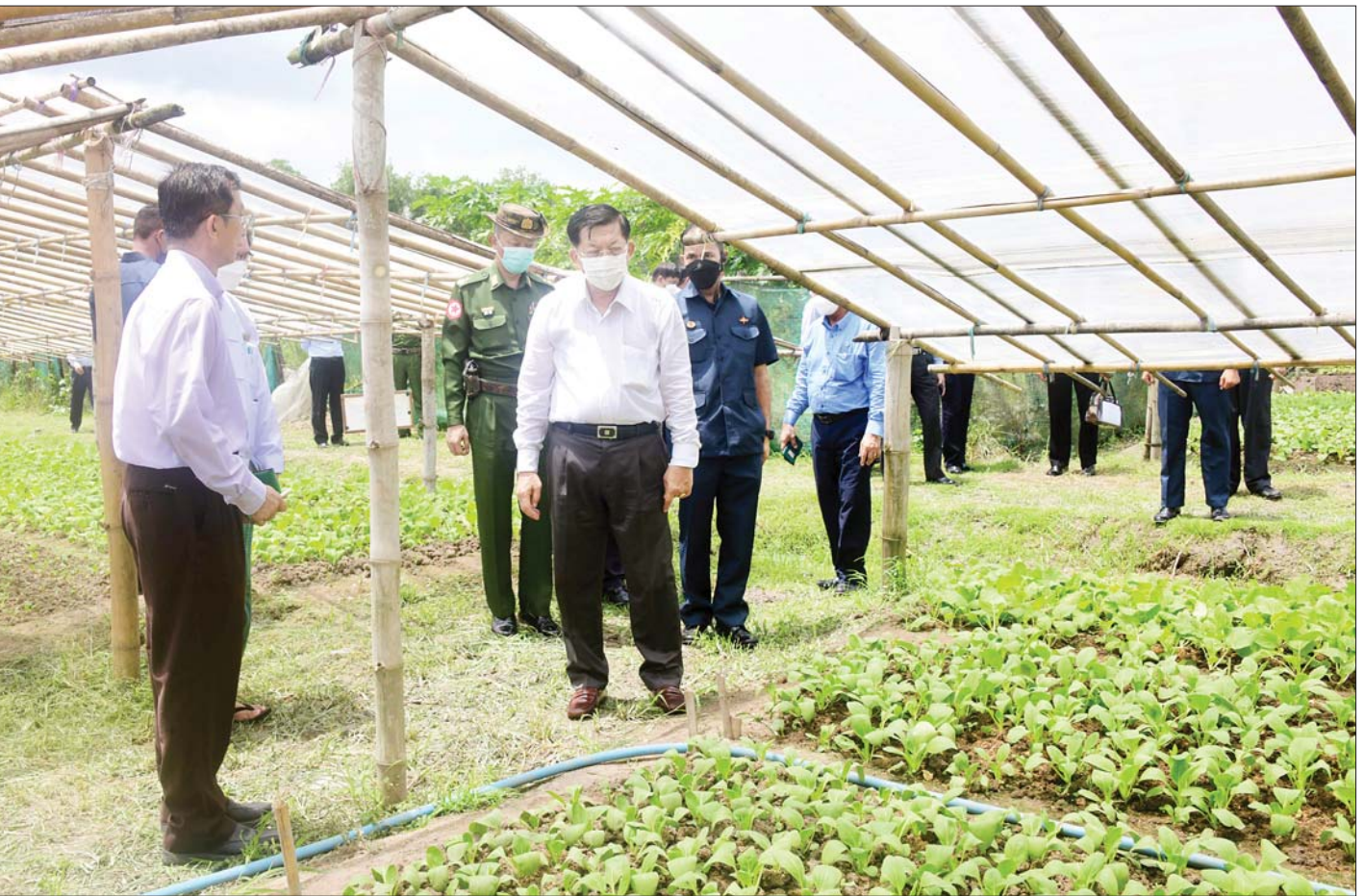
နိုင်ငံတော်စီမံအုပ်ချုပ်ရေးကောင်စီဥက္ကဋ္ဌ နိုင်ငံတော်ဝန်ကြီးချုပ် ဗိုလ်ချုပ်မှူးကြီးမင်းအောင်လှိုင် ညောင်နစ်ပင် စိုက်ပျိုးမွေးမြူရေးအထူးဇုန်အတွင်း စိုက်ပျိုးရေးဦးစီးဌာနနှင့် စိမ်းလန်းသမဝါယမအဖွဲ့တို့ ပူးပေါင်းဆောင်ရွက်သည့် ဓာတုကင်းလွတ်ဟင်းသီးဟင်းရွက် စိုက်ခင်းကို ကြည့်ရှုစဉ်။

ခုနစ်ကြိမ် ကျင်းပခဲ့ အဆိုပါ အမျိုးသားညီလာခံကျင်းပခဲ့သည့် ပြည်ထောင်စုခန်းမအဆောက်အဦတွင် ဖွဲ့စည်းပုံအခြေခံဥပဒေ (၂၀၀၈ ခုနှစ်) အတည်ပြုပြဋ္ဌာန်းနိုင်ရေးအတွက် ၂၀၀၄ ခုနှစ်မှ ၂၀၀၇ အထိ အစုအဖွဲ့ရှစ်ဖွဲ့မှ ကိုယ်စားလှယ် ၇၀၂ ဦးဖြင့် အမျိုးသားညီလာခံခုနစ်ကြိမ် ကျင်းပခဲ့ကြောင်း၊ ဖွဲ့စည်းပုံအခြေခံဥပဒေ (၂၀၀၈ ခုနှစ်) အတည်ပြုပြဋ္ဌာန်းပြီးချိန်တွင် အဆိုပါ ညီလာခံခန်းမကြီးကို အသုံးပြုခြင်းမရှိတော့ကြောင်း၊ အမျိုးသားညီလာခံကျင်းပပြုလုပ်ရာ မြေနေရာသည်