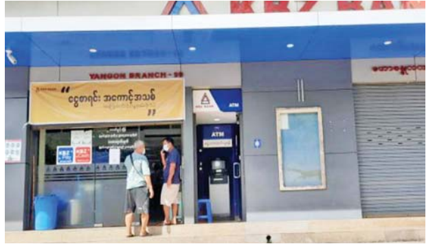
၂၂-၁၀-၂၀၂၁ ရက်တွင် ဗိုလ်တထောင်မြို့နယ် (၉)ရပ်ကွက်ရှိ ကမ္ဘောဇဘဏ်ခွဲအား ဓားပြတိုက်ခံရမှု။