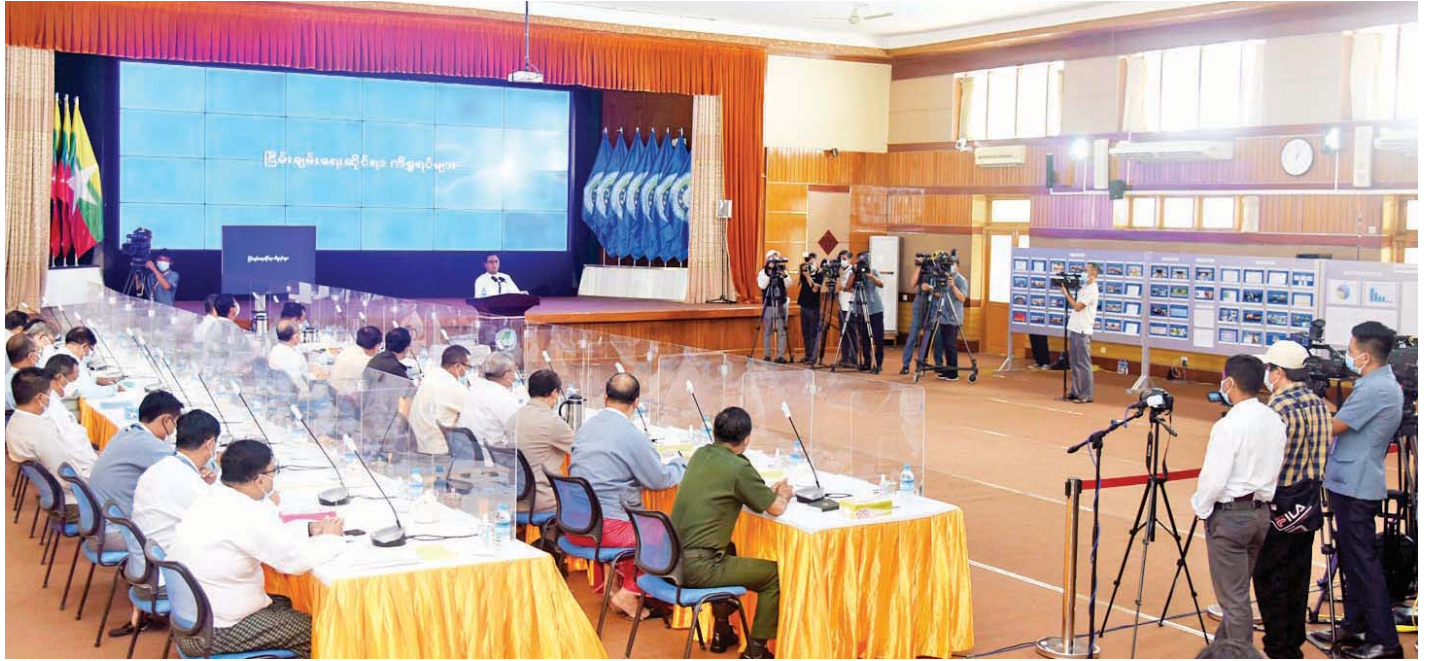
နိုင်ငံတော်စီမံအုပ်ချုပ်ရေးကောင်စီ သတင်းထုတ်ပြန်ရေးအဖွဲ့ (၁၅)ကြိမ်မြောက် သတင်းစာရှင်းလင်းပွဲပြုလုပ်စဉ်။