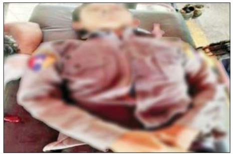
၂၃-၁၀-၂၀၂၁ ရက်တွင် ကြည့်မြင်တိုင်မြို့နယ် ဗားကရာမီးပွိုင့်ရှိ ယာဉ်ထိန်းရဲကင်းရုံ၌ လုံခြုံရေးတပ်ဖွဲ့ဝင် တစ်ဦး သေဆုံးခြင်း ပစ်ခတ်ခံရမှု။