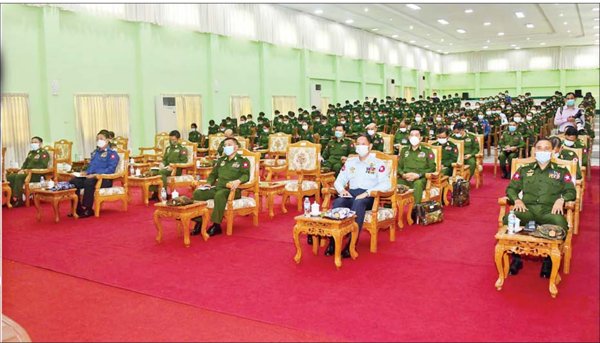
နိုင်ငံတော်စီမံအုပ်ချုပ်ရေးကောင်စီဥက္ကဋ္ဌ တပ်မတော်ကာကွယ်ရေးဦးစီးချုပ် ဗိုလ်ချုပ်မှူးကြီး မင်းအောင်လှိုင် တပ်မတော် (ကြည်း) ဗိုလ်သင်တန်းကျောင်း(မှော်ဘီ)မှ နည်းပြအရာရှိကြီးများ၊ အမျိုးသမီး ဗိုလ်လောင်းသင်တန်းသူများ၊ အမျိုးသမီးခြေလျင်တပ်စုမှူးသင်တန်းမှ သင်တန်းသူများအား တွေ့ဆုံအမှာစကားပြောကြားစဉ်။