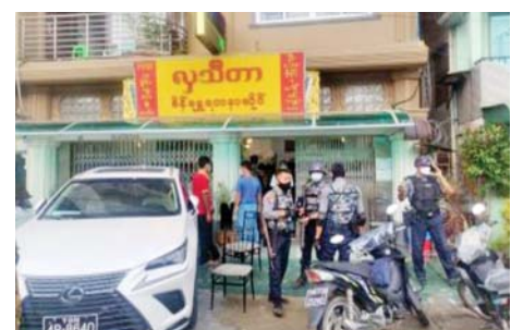
၁၁-၇-၂၀၂၂ ရက်တွင် မရမ်းကုန်းမြို့နယ် ဘုရင့်နောင်(၂)ရပ်ကွက်ရှိ "လှသီတာ"ရွှေဆိုင်အား ဓားပြတိုက်ခံရမှု။