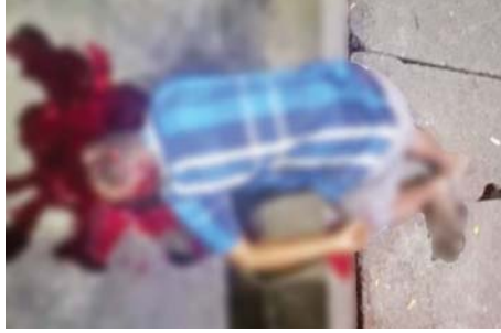
၂-၉-၂၀၂၂ ရက်တွင် လှိုင်မြို့နယ်၊ အမှတ်(၁)ရပ်ကွက်၌ အပြစ်မဲ့ပြည်သူတစ်ဦး သတ်ဖြတ်ခံရမှု။