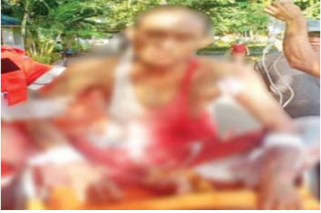
၁-၆-၂၀၂၂ ရက်တွင် မရမ်းကုန်းမြို့နယ် (၃)ရပ်ကွက်၌ အပြစ်မဲ့ပြည်သူတစ်ဦး ပစ်ခတ်ခံရမှု။