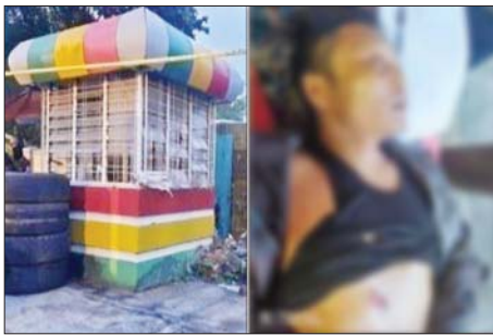
၂၃-၁၀-၂၀၂၁ ရက်တွင် ဗိုလ်တထောင်မြို့နယ် (၃)ရပ်ကွက်ရှိ ယာဉ်ထိန်းရဲကင်းရုံ၌ လုံခြုံရေးတပ်ဖွဲ့ဝင်တစ်ဦး သေဆုံးခြင်း ပစ်ခတ်ခံရမှု။