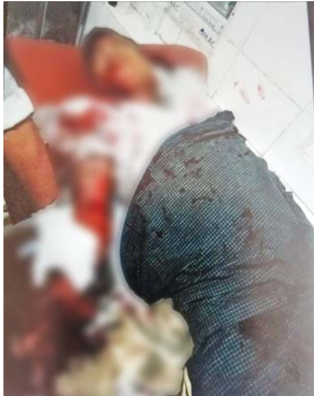
၂၉-၄-၂၀၂၁ ရက်တွင် လှိုင်သာယာမြို့နယ် (၁၆)ရပ်ကွက်ရှိ မြို့နယ်စီမံအုပ်ချုပ်ရေးအဖွဲ့ရုံးအား လက်လုပ်ဗုံးတစ်လုံး ပစ်ခတ်ခံရသဖြင့် အပြစ်မဲ့ပြည်သူတစ်ဦး ဒဏ်ရာရရှိမှု။