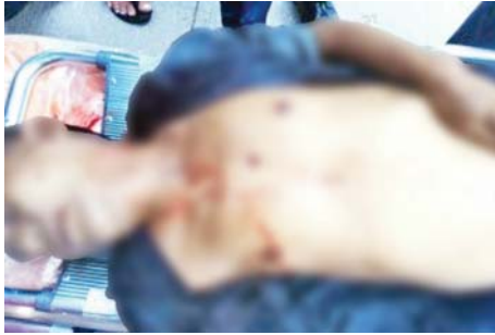
၂၇-၅-၂၀၂၁ ရက်တွင် သာကေတမြို့နယ် မာန်ပြေရပ်ကွက်၌ အပြစ်မဲ့ပြည်သူ တစ်ဦး သတ်ဖြတ်ခံရမှု။