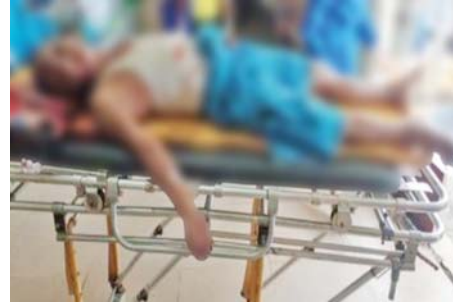
၁၇-၈-၂၀၂၂ ရက်တွင် တောင်ဒဂုံမြို့နယ် (၅၇)ရပ်ကွက်ရှိ မြို့နယ်စီမံအုပ်ချုပ်ရေးအဖွဲ့ရုံး၌ အပြစ်မဲ့ပြည်သူတစ်ဦး သေနတ်ဖြင့် ပစ်ခတ်ခံရမှု။