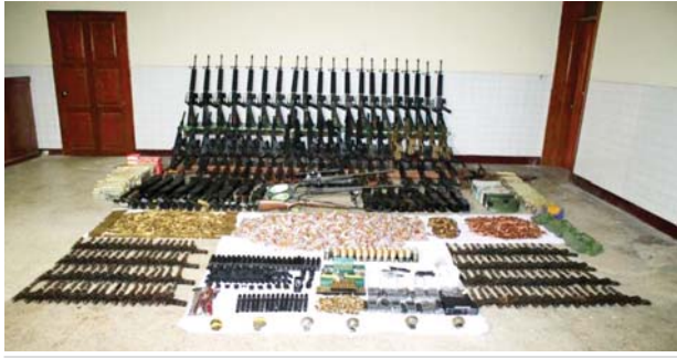
သင်္ဃန်းကျွန်းမြို့နယ် (၂၉)ရပ်ကွက် သုခိတာလမ်း ခြံအမှတ်(၆၇)နှင့် သင်္ဃန်းကျွန်းမြို့နယ် (၈)မြောက်ရပ်ကွက် ပြည်သာယာလမ်းသွယ်(၂) အမှတ်(၁၄၂) ရှိ မောင်ကျော်(ခ)ဖြိုးဇေယျာသော်၏ နေအိမ်များမှ သိမ်းဆည်းရမိခဲ့သည့် လက်နက်/ခဲယမ်းများ မှတ်တမ်းဓာတ်ပုံ။