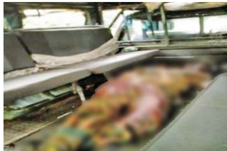
၉-၉-၂၀၂၂ ရက်တွင် စမ်းချောင်းမြို့နယ်၊ ဗဟိုလမ်း၌ လုံခြုံရေးတပ်ဖွဲ့ဝင်တစ်ဦး ပစ်ခတ်ခံရမှု။