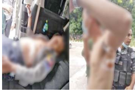
၇-၆-၂၀၂၂ ရက်တွင် သာကောတမြို့နယ် ၃ မာန်ပြေရပ်ကွက်တွင် လုံခြုံရေးတပ်ဖွဲ့ဝင်များ ပစ်ခတ်ခံရမှု။