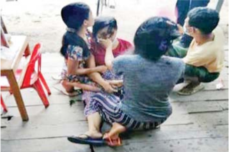
၅-၈-၂၀၂၂ ရက်တွင် ဒဂုံမြို့သစ်(မြောက်ပိုင်း)မြို့နယ် အမှတ်(၃၅) ရပ်ကွက် မြိုင်မဟာလက်ဖက်ရည်ဆိုင်၌ အပြစ်မဲ့ပြည်သူတစ်ဦး ပစ်ခတ်ခံရမှု။