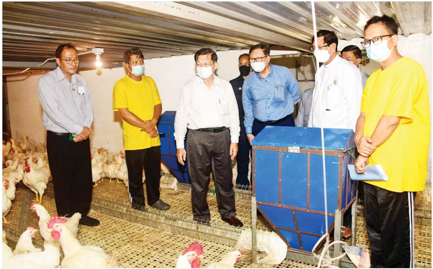
နိုင်ငံတော်စီမံအုပ်ချုပ်ရေးကောင်စီဥက္ကဋ္ဌ နိုင်ငံတော်ဝန်ကြီးချုပ် ဗိုလ်ချုပ်မှူးကြီးမင်းအောင်လှိုင် စိုက်ပျိုးရေးဦးစီးဌာနနှင့် စိမ်းလန်းသမဝါယမအဖွဲ့တို့ ပူးပေါင်းဆောင်ရွက်သည့် CJ Feed Myanmar ကြက်မွေးမြူရေးလုပ်ငန်းဆောင်ရွက်နေမှုအခြေအနေများကို ကြည့်ရှုစစ်ဆေးစဉ်။

ကောင်းမွန်အောင် ဆောင်ရွက်ရန်လိုကြောင်း၊ မွေးမြူရေးလုပ်ငန်းများဆောင်ရွက်ရာတွင်လည်း စနစ်တကျဖြင့်မွေးမြူရန်လိုကြောင်း၊ မွေးမြူရေးလုပ်ငန်းများ အောင်မြင်ဖြစ်ထွန်းစေရေးအတွက် တိရစ္ဆာန်များကို သတ်မှတ်ထားသည့်အစာများကို စနစ်တကျ ကျွေးမွေးရန်နှင့် တိရစ္ဆာန်မွေးမြူရေးလုပ်ငန်းများမှ ထွက်ရှိလာသည့် စွန့်ပစ်ပစ္စည်းများကို စိုက်ပျိုးရေးလုပ်ငန်းများအတွက် လိုအပ်သည့် ဇီဝမြေဩဇာအဖြစ် အသုံးပြုနိုင်ရန်လိုကြောင်း၊ စိုက်ပျိုးရေးလုပ်ငန်းများနှင့် မွေးမြူရေးလုပ်ငန်းများသည် အပြန်အလှန် မှီခိုလျက်ရှိကြောင်း၊ ခေတ်မီသည့် စိုက်ပျိုးမွေးမြူရေးစနစ်ကို ဆောင်ရွက်နိုင်ရန်လိုကြောင်း၊ စိုက်ပျိုးမွေးမြူရေးပညာရပ်များ တတ်ကျွမ်းစေရေးအတွက် သက်ဆိုင်ရာ ကျောင်းများ၊ တက္ကသိုလ်၊ ကောလိပ်များမှ စနစ်တကျ သင်ကြားပေးရန်လိုကြောင်း၊ ပုဂ္ဂလိကလုပ်ငန်းများအနေဖြင့် စိုက်ပျိုးမွေးမြူရေးဆောင်ရွက်ရန်အတွက် ခွင့်ပြုပေးထားသည့် မြေများကို ပြည့်ဝစွာစိုက်ပျိုးမွေးမြူရန်နှင့် စိုက်ပျိုးမွေးမြူရေးနှင့် မသက်ဆိုင်သည့် မြေအသုံးချမှုများမရှိစေရေး တာဝန်ရှိသူများက စနစ်တကျ ကြပ်မတ်ဆောင်ရွက်ရန်လိုကြောင်း၊ ရန်ကုန်မြို့တော်ရှိ ပြည်သူများ စားသောက်ရန်အတွက် အသားနှင့် ငါးများ နေ့စဉ်လိုအပ်ချက်ရှိကြောင်း၊ ငါးမွေးမြူရေးနှင့်ပတ်သက်၍ ချောင်းများ၊ မြောင်းများ၊ ပင်လယ်များမှရရှိသည့် ငါးသယံဇာတများကို ဖမ်းယူစားသုံးမှုများပြားလာခြင်းကြောင့် သဘာဝမှရရှိသည့်