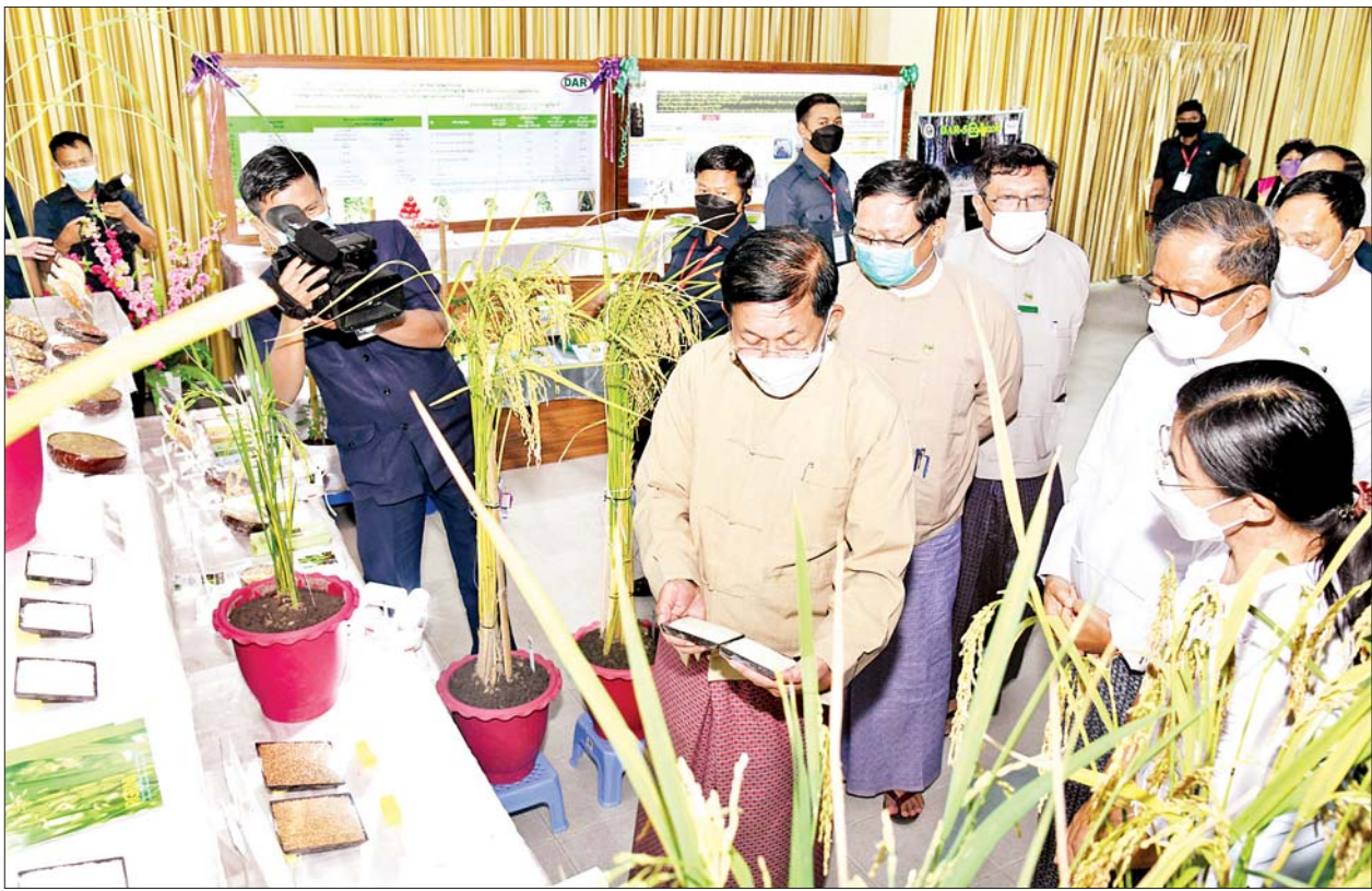
နိုင်ငံတော်စီမံအုပ်ချုပ်ရေးကောင်စီဥက္ကဋ္ဌ နိုင်ငံတော်ဝန်ကြီးချုပ် ဗိုလ်ချုပ်မှူးကြီးမင်းအောင်လှိုင်နှင့် တာဝန်ရှိသူများ စိုက်ပျိုးရေး သုတေသနဦးစီးဌာန ပြခန်းများကို ကြည့်ရှုကြစဉ်။

ဆီထွက်သီးနှံဖြစ်သည့် ပဲပုပ်များ စိုက်ပျိုးနိုင်ရေးအတွက်လည်း ဆောင်ရွက်လျက်ရှိကြောင်း၊ ပြည်တွင်းပဲပုပ်စိုက်ပျိုးမှုကို တိုးမြှင့် ဆောင်ရွက်ခြင်းဖြင့် ပြည်တွင်းဆီ ထုတ်လုပ်မှု တိုးတက်လာမည် ဖြစ်သကဲ့သို့ တိရစ္ဆာန်အစာအတွက် ပြည်ပမှ ပဲပုပ်ကြိတ်ဖတ်များ တင်သွင်းမှုကို လျှော့ချနိုင်မည်ဖြစ်ကြောင်း၊ အလားတူ နေကြာစိုက်ပျိုး မှုများကို ဆောင်ရွက်နိုင်ရန်လိုကြောင်း၊ ပြည်တွင်း၌ ဆီထွက်သီးနှံများကို တိုးမြှင့်စိုက်ပျိုးဆောင်ရွက်သွားမည်ဆိုပါက ပြည်တွင်းဆီဖူလုံမှုကို