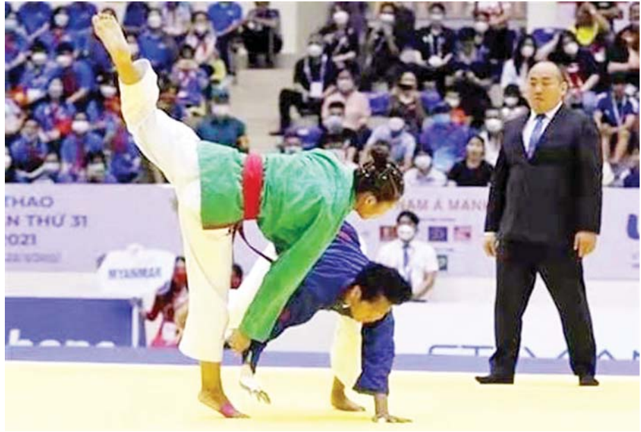
(၃၁)ကြိမ်မြောက် ဆီးဂိမ်းပြိုင်ပွဲ Kurash အားကစားနည်းတွင် မြန်မာအမျိုးသမီး အားကစားသမား ယှဉ်ပြိုင်နေစဉ်။

(၆) အားကစားနည်းအလိုက် နည်းပြများအား အဆင့်မြှင့်တင်ရေး အစီအမံများပြုလုပ်ရေး အားကစားတိုးတက်သည့် နိုင်ငံများကို လေ့လာကြည့်ပါက အားကစားနည်းအလိုက် နည်းပြများ၏ အခန်းကဏ္ဍမှာ အလွန်အရေးပါလျက်ရှိသည်ကို တွေ့မြင်နေရသည်။ ခေတ်နှင့်အညီ တိုးတက်ပြောင်းလဲလာသည့် နည်းစနစ်များ၊ နည်းဥပဒေများ၊ နည်းဗျူဟာများကို ခေတ်မီအားကစား အထောက်အကူပြုပစ္စည်း (Sports Equipment) များ ပြောင်းလဲအသုံးပြုရေး၊ Sports Science ပညာရပ်များနှင့်အညီ လေ့ကျင့်မှုပုံစံများ၊ ထိရောက်သည့် Training Programme များ ရေးဆွဲလေ့ကျင့်နိုင်ရေး စသည့် အချက်များသည် လွန်စွာအရေးပါသဖြင့် အားကစားနည်းပြများ၏အရည်အသွေး စာမျက်နှာ ၁၁ သို့ ★