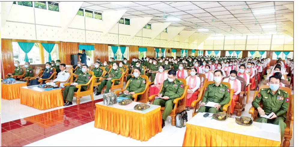
နိုင်ငံတော်စီမံအုပ်ချုပ်ရေးကောင်စီ ဒုတိယဥက္ကဋ္ဌ ဒုတိယတပ်မတော်ကာကွယ်ရေးဦးစီးချုပ် ကာကွယ်ရေးဦးစီးချုပ်(ကြည်း) ဒုတိယဗိုလ်ချုပ်မှူးကြီးစိုးဝင်း အမ်းတပ်နယ်မှ အရာရှိ၊ စစ်သည်မိသားစုဝင်များအား တွေ့ဆုံအမှာစကားပြောကြားစဉ်။

အလေးထားဆောင်ရွက် ဦးစွာ နိုင်ငံတော်စီမံအုပ်ချုပ်ရေးကောင်စီဒုတိယဥက္ကဋ္ဌ ဒုတိယတပ်မတော်ကာကွယ်ရေးဦးစီးချုပ် ကာကွယ်ရေးဦးစီးချုပ်(ကြည်း)က အမှာစကားပြောကြားရာတွင် နိုင်ငံတော်၏အနောက်ဘက် ကမ်းရိုးတန်းနှင့် ရေပြင်ပိုင်နက်ကို လုံခြုံအောင် ကာကွယ်စောင့်ရှောက်ရန် တာဝန်ထမ်းဆောင်နေသူ