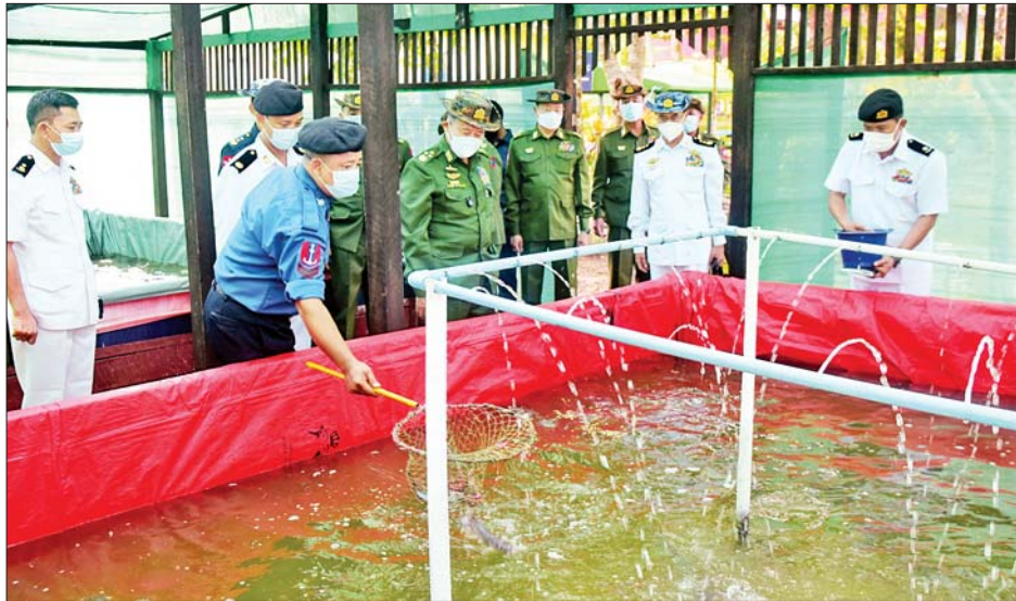
နိုင်ငံတော်စီမံအုပ်ချုပ်ရေးကောင်စီ ဒုတိယဥက္ကဋ္ဌ ဒုတိယတပ်မတော်ကာကွယ်ရေးဦးစီးချုပ် ကာကွယ်ရေးဦးစီးချုပ်(ကြည်း) ဒုတိယဗိုလ်ချုပ်မှူးကြီးစိုးဝင်းနှင့် အဖွဲ့ဝင်များ ဓညဝတီရေတပ်စခန်း ဌာနချုပ်ရှိ Aquaponic System ဖြင့် ငါးများ မွေးမြူထားရှိမှုကို ကြည့်ရှုစစ်ဆေးစဉ်။

များအလိုက် အရာရှိ၊ စစ်သည်၊ မိသားစုများအတွက် စားသောက်ဖွယ်ရာပစ္စည်းများ ပေးအပ်ရာ တာဝန် ရှိသူတို့က လက်ခံရယူကြသည်။