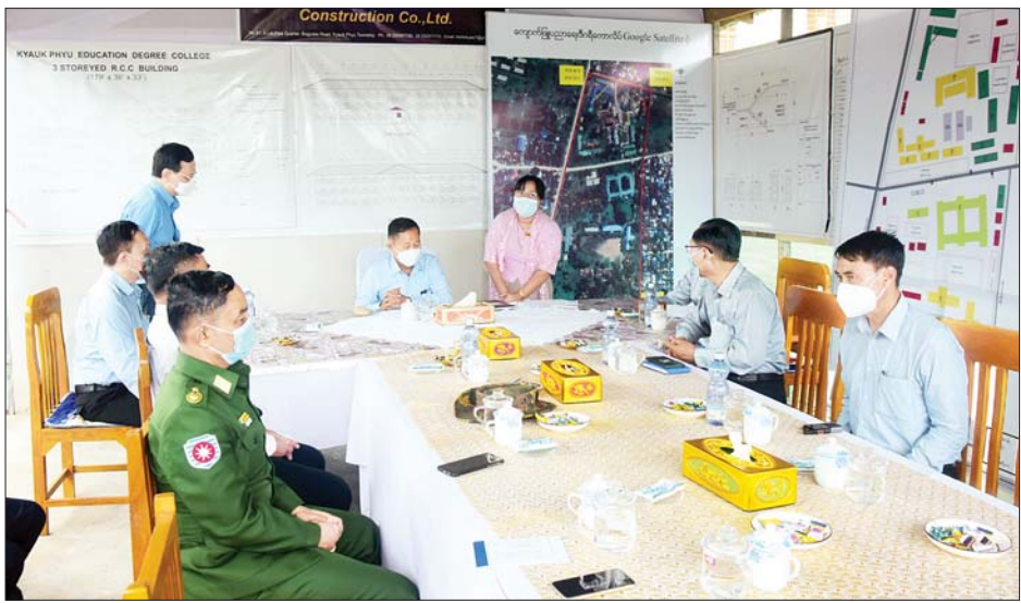
နိုင်ငံတော်စီမံအုပ်ချုပ်ရေးကောင်စီ ဒုတိယဥက္ကဋ္ဌ ဒုတိယတပ်မတော်ကာကွယ်ရေးဦးစီးချုပ် ကာကွယ်ရေးဦးစီးချုပ်(ကြည်း) ဒုတိယဗိုလ်ချုပ်မှူးကြီးစိုးဝင်း ကျောက်ဖြူပညာရေးဒီဂရီကောလိပ် တာဝန်ရှိသူများနှင့်တွေ့ဆုံကာ ကျောင်းအုပ်ချုပ်မှုဆိုင်ရာကိစ္စရပ်များနှင့် သင်ကြားရေးဆိုင်ရာကိစ္စရပ် များအား ဆွေးနွေးစဉ်။