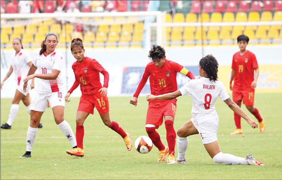
(၃၁)ကြိမ်မြောက် ဆီးဂိမ်းပြိုင်ပွဲ အမျိုးသမီးဘောလုံးပြိုင်ပွဲ တတိယနေရာလုပွဲတွင် မြန်မာအမျိုးသမီးလက်ရွေးစင်အသင်းနှင့် ဖိလစ်ပိုင်အသင်းတို့ ယှဉ်ပြိုင်နေစဉ်။

အဆိုပါပြိုင်ပွဲများကို အားကစားဝါသနာပါသည့် မြို့မိမြို့ဖများ၊ အားကစားဝါသနာရှင်များ၊ အလှူရှင်များနှင့် အားကစားဆပ်ကော်မတီများ ပူးပေါင်းကျင်းပခဲ့ခြင်း ဖြစ်သည်။ ၎င်းပြိုင်ပွဲများသည် ပြိုင်ဆိုင်မှုပြင်းထန်သည့်အတွက် လူငယ်လူရွယ်များအနေဖြင့်လည်း အားကစားကို စိတ်ပါဝင်စားပြီး လေ့လာလိုက်စားလိုသည့် လူငယ်များ များပြားလာသည့်အတွက် မလိုလားအပ်သည့်ဘက်သို့ ရောက်ရှိမှုများ ကင်းဝေးစေခဲ့သည်။ အဆိုပါပြိုင်ပွဲများ