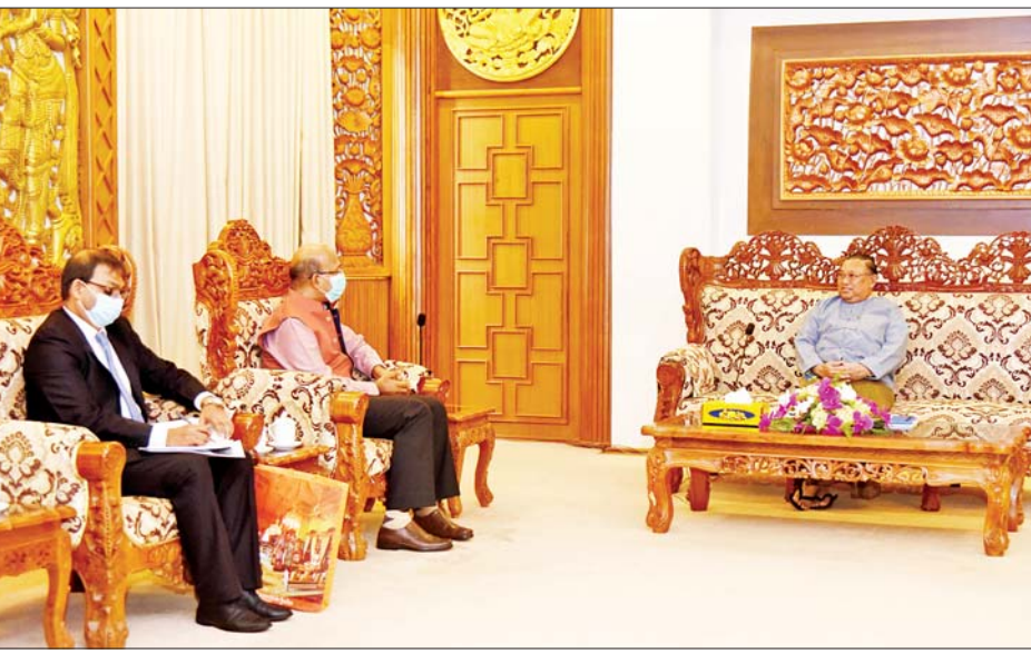
သတင်းစဉ်

ဆွေးနွေး တွေ့ဆုံစဉ် နှစ်နိုင်ငံဆက်ဆံရေးနှင့် ပူးပေါင်းဆောင်ရွက်မှုများမြှင့်တင်ရေး၊ နှစ်နိုင်ငံအကြား ဆောင်ရွက် လျက်ရှိသောစီမံကိန်းများ၊ ဒေသတွင်းနှင့် နိုင်ငံတကာမျက်နှာစာများတွင် နှစ်နိုင်ငံအကြား ပူးပေါင်း ဆောင်ရွက်မှု မြှင့်တင်သွားရေးကိစ္စ၊ ငြိမ်းချမ်းစွာအတူယှဉ်တွဲနေထိုင်ရေးမူကြီး (၅)ရပ်နှင့် အာဆီယံနှင့် ကုလသမဂ္ဂပဋိညာဉ်စာတမ်းပါမူများ လေးစားလိုက်နာသွားရေးတို့နှင့်စပ်လျဉ်း၍ ခင်မင်ရင်းနှီးစွာ အမြင်ချင်း ဖလှယ် ဆွေးနွေးခဲ့ကြကြောင်း သိရသည်။