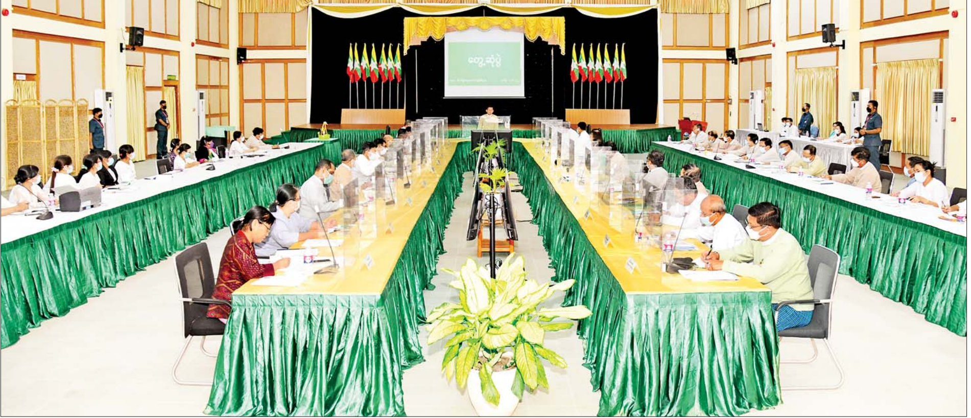
နိုင်ငံတော်စီမံအုပ်ချုပ်ရေးကောင်စီဥက္ကဋ္ဌ နိုင်ငံတော်ဝန်ကြီးချုပ် ဗိုလ်ချုပ်မှူးကြီးမင်းအောင်လှိုင် စိုက်ပျိုးရေး၊ မွေးမြူရေးနှင့် ဆည်မြောင်းဝန်ကြီးဌာနမှ တာဝန်ရှိသူများနှင့် တွေ့ဆုံ၍ စိုက်ပျိုးရေးကဏ္ဍဖွံ့ဖြိုးတိုးတက်ရေး ဆွေးနွေးမှာကြားစဉ်။