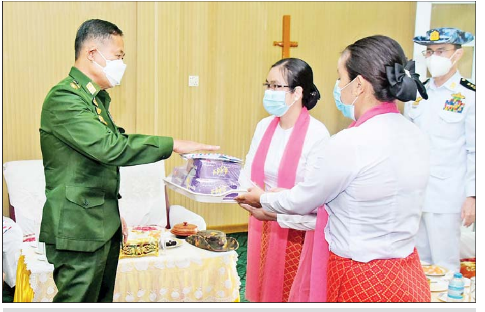
နိုင်ငံတော်စီမံအုပ်ချုပ်ရေးကောင်စီဒုတိယဥက္ကဋ္ဌ ဒုတိယတပ်မတော်ကာကွယ်ရေးဦးစီးချုပ် ကာကွယ်ရေးဦးစီးချုပ်(ကြည်း) ဒုတိယဗိုလ်ချုပ်မှူးကြီးစိုးဝင်း ကျောက်ဖြူတပ်နယ်ရှိ အရာရှိ၊ စစ်သည်၊ မိသားစုများအတွက် စားသောက်ဖွယ်ရာနှင့်ထောက်ပံ့ငွေများပေးအပ်ရာ တာဝန်ရှိသူများက လက်ခံ ရယူစဉ်။

ပြည်တွင်းပြည်ပ အကြမ်းဖက်သောင်းကျန်းသူ အဖျက်သမားများအနေဖြင့် နိုင်ငံတော်ကို ဖျက်ဆီးရန် ကြိုးပမ်းမှု မအောင်မြင်၍ ဖွဲ့စည်းပုံအရ ခိုင်မာ တောင့်တင်းသော တပ်မတော်ကို ဖြိုခွဲရန်ကြိုးစား