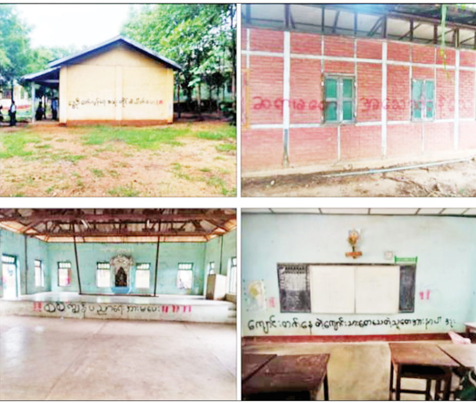
သရက်မြို့ အမှတ်(၂)အခြေခံပညာအထက်တန်းကျောင်းဝင်းအတွင်းရှိ ကျောင်းဆောင်အုတ်နံရံများ ၌ အကြမ်းဖက်သမားများက ဆန့်ကျင်ခြိမ်းခြောက်စာများရေးသားထားသည်ကို တွေ့ရစဉ်။

နေပြည်တော် ဇွန် ၁၄ နိုင်ငံတော်အစိုးရအနေဖြင့် နိုင်ငံ၏အနာဂတ် ဖြစ်သည့် မျိုးဆက်သစ်ရင်သွေးငယ်များ၏ ပညာရေး တွင် နောက်ကျကျန်ရစ်မှု မဖြစ်ပေါ်စေရေးအတွက် ပညာသင်ကြားနိုင်မှု အခွင့်အလမ်းကို ပြည့်ဝစွာ အသုံးပြုနိုင်စေရန် အခြေခံပညာကျောင်းများကို ဇွန် ၂ ရက်တွင် စတင်ဖွင့်လှစ်သင်ကြားပေးလျက်ရှိရာ NUG နှင့် ၎င်း၏လက်အောက်ခံ နိုင်ငံရေးအစွန်းရောက် အကြမ်းဖက်များက အနာဂတ်ရင်သွေးငယ်များ၏ ပညာသင်ကြားသင်ယူခွင့် အခွင့်အလမ်းများ ပျက်ပြား၍ ပညာမဲ့လူတန်းစားများဖြစ်ပေါ်လာစေ ရန်နှင့် ကျောင်းသား ကျောင်းသူ ဆရာ မိဘများအား အထိတ်တလန့်ဖြစ်စေရန် ယုတ်မာရိုင်းစိုင်းသော ရည်ရွယ်ချက်များဖြင့် စာသင်ကျောင်းများတွင် ဆန့်ကျင်ခြိမ်းခြောက်စာများ ရေးသားချိတ်ဆွဲ၍ ခြိမ်းခြောက်အကြမ်းဖက်ခြင်းများ လုပ်ဆောင်လျက် ရှိသည်ကို တွေ့ရှိရသည်။ ထိုသို့ဆောင်ရွက်လျက်ရှိရာ ဇွန် ၁၃ ရက် နံနက် ၉ နာရီ ၄၅ မိနစ်တွင် မကွေးတိုင်းဒေသကြီး သရက် မြို့ရှိ အမှတ်(၂)အခြေခံပညာအထက်တန်းကျောင်း ဝင်းအတွင်းရှိ ကျောင်းဆောင်အုတ်နံရံများ၌ အကြမ်း ဖက်သမားများက ဆန့်ကျင်ခြိမ်းခြောက်စာများ ရေးသားထားကြောင်းသတင်းအရ လုံခြုံရေးတပ်ဖွဲ့ ဝင်များက သွားရောက်စစ်ဆေးခဲ့ရာ အဆိုပါ ကျောင်းဝင်းအတွင်းရှိ တေအေဆောင်(၆)ခန်းတွဲ အရှေ့ဘက် အုတ်နံရံ၌ “CDM မလုပ်တဲ့ ဆရာ ဆရာမ များ အသေဆိုးနဲ့သေပါစေ၊ Grade-7 “ရွှေသွေး” အဆောင်အတွင်းအုတ်နံရံ၌ “စစ်ကျန်ပညာရေး အားမပေး”၊ Grade-10 “အောင်ရတနာ”အဆောင်(၃)