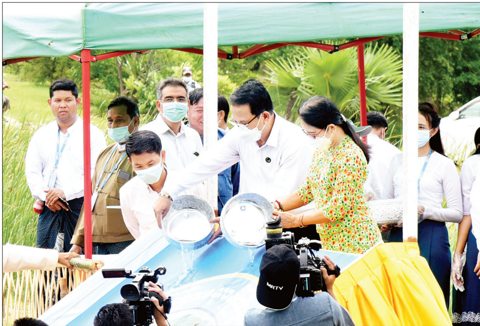
ပြည်ထောင်စုဝန်ကြီး ဦးမောင်မောင်အုန်းနှင့်အဖွဲ့ နေပြည်တော် ဝေယျာသီရိမြို့နယ် ခရေပင်လမ်းခွဲရှိ ပုံနှိပ်ရေးနှင့် ထုတ်ဝေရေးဦးစီးဌာန နေပြည်တော်ပုံနှိပ်စက်ရုံ၌ ဝန်ထမ်းများ၏ သစ်ပင်စိုက်ပျိုးနေမှုကို လှည့်လည်ကြည့်ရှုအားပေးစဉ်။