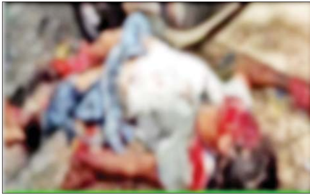
ဒဂုံမြို့နယ် ယောမင်းကြီးရပ်ကွက် ဗိုလ်ရာညွန့်လမ်းပေါ်၌ အကြမ်းဖက်သမားနှစ်ဦး လက်လုပ်မိုင်းတပ်ဆင်နေစဉ် ပေါက်ကွဲမှု ဖြစ်ပွား၍ အကြမ်းဖက်သမားတစ်ဦး သေဆုံးမှု မှတ်တမ်းဓာတ်ပုံ။

အလားတူ ဇွန် ၁၆ ရက် မွန်းလွဲ ၂ နာရီ ၁၅ မိနစ်တွင် ကျောက်တန်းမြို့ ရွှေကုန်းရပ်ကွက်ရှိ အခန်းငှားရမ်းထားရှိသည့်