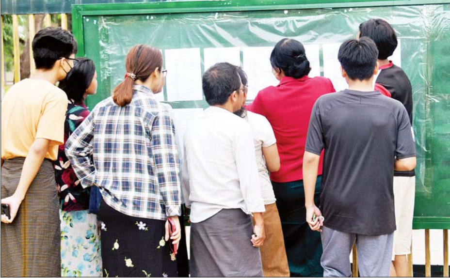
နေပြည်တော် အမှတ်(၆)အခြေခံပညာအထက်တန်းကျောင်း၌ ၂၀၂၂ ခုနှစ် တက္ကသိုလ်ဝင်စာမေးပွဲ အောင်စာရင်းလာရောက်ကြည့်ရှုကြသူများကို တွေ့ရစဉ်။

နေပြည်တော် ဇွန် ၁၇ ၂၀၂၂ ခုနှစ် မတ် ၃၁ ရက်မှ ဧပြီ ၉ ရက်အထိ တက္ကသိုလ်ဝင်စာမေးပွဲကို ကျင်းပခဲ့ရာ ယနေ့တွင် တစ်နိုင်ငံလုံးအတိုင်းအတာဖြင့် သက်ဆိုင်ရာစာစစ် ဌာနကျောင်းများ၌ လည်းကောင်း၊ မြန်မာနိုင်ငံစာစစ် ဦးစီးဌာန Website ၌လည်းကောင်း တက္ကသိုလ်ဝင် စာမေးပွဲအောင်စာရင်းများ ထုတ်ပြန်ကြေညာသည်။ လာရောက်ကြည့်ရှု အလားတူ နေပြည်တော်ကောင်စီနယ်မြေ အတွင်းရှိ စာစစ်ဌာနဖွင့်လှစ်သော ကျောင်းများ၌ နံနက်ပိုင်းမှစတင်၍ တက္ကသိုလ်ဝင်စာမေးပွဲ အောင်စာရင်းများကို ထုတ်ပြန်ကြေညာပေးခဲ့ရာ ကျောင်းသား ကျောင်းသူများ စိတ်အားထက်သန်စွာ ဖြင့် လာရောက်ကြည့်ရှုကြပြီး တာဝန်ကျ ဆရာ ဆရာမများအနေဖြင့်လည်း ကိုဗစ်-၁၉ ကာကွယ်ရေး နည်းလမ်းများနှင့်အညီ စနစ်တကျကြည့်ရှုနိုင်ကြ စေရန် ကြီးကြပ်ဆောင်ရွက်ပေးသည်။ စာမျက်နှာ ၇ ကော်လံ ၁ သို့ *