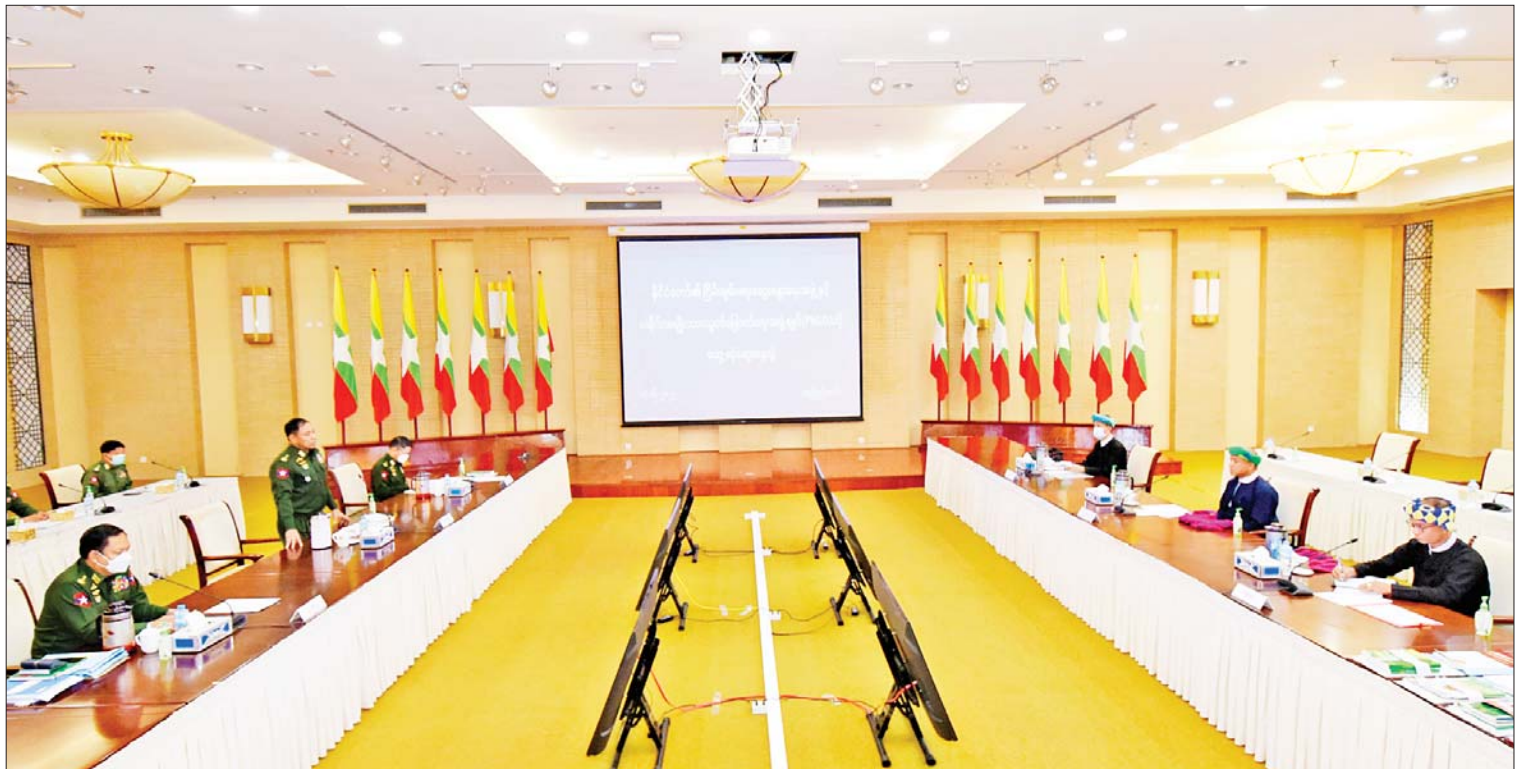
နိုင်ငံတော်၏ ငြိမ်းချမ်းရေးဆွေးနွေးရေးအဖွဲ့နှင့် ပအိုဝ်းအမျိုးသားလွတ်မြောက်ရေးအဖွဲ့ချုပ် (PNLO)ဒုတိယဥက္ကဋ္ဌ(၁) ဦးဆောင်သော ကိုယ်စားလှယ်အဖွဲ့တို့ တွေ့ဆုံဆွေးနွေးစဉ်။

တက်ရောက် တွေ့ဆုံဆွေးနွေးပွဲသို့ နိုင်ငံတော်စီမံ အုပ်ချုပ်ရေးကောင်စီအဖွဲ့ဝင် ပြည်ထောင်စု အစိုးရအဖွဲ့ရုံးဝန်ကြီးဌာန(၁) ပြည်ထောင်စု ဝန်ကြီး၊ အမျိုးသားစည်းလုံးညီညွတ်ရေး နှင့် ငြိမ်းချမ်းရေးဖော်ဆောင်မှုညွှန်ကြားရေး ကော်မတီဥက္ကဋ္ဌ ငြိမ်းချမ်းရေးဆွေးနွေးရေး အဖွဲ့ခေါင်းဆောင် ဒုတိယဗိုလ်ချုပ်ကြီး ရာပြည့်၊ အဖွဲ့ဝင်များဖြစ်ကြသည့် နိုင်ငံတော် စီမံအုပ်ချုပ်ရေးကောင်စီ အဖွဲ့ဝင် ဒုတိယဗိုလ်ချုပ်ကြီး မိုးမြင့်ထွန်း၊ အမျိုးသား စည်းလုံးညီညွတ်ရေးနှင့် စာမျက်နှာ ၃ ကော်လံ ၁ သို့ ။