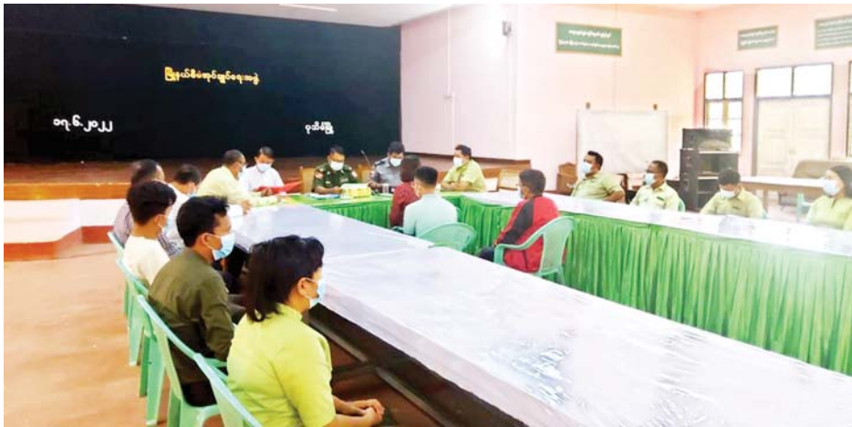
ရှိကြသဖြင့် သက်ဆိုင်ရာ တာဝန်ရှိသူများက ၎င်းတို့ လျက်ရှိကြောင်း သိရသည်။ ၎င်း၏ မိဘအုပ်ထိန်းသူများထံသို့ လွှဲပြောင်းအပ်နှံပေး သတင်းစဉ်

ထို့နောက် ဥပဒေဘောင်အတွင်း ဝင်ရောက်ခဲ့သည့် ပြစ်မှုကျူးလွန်ခြင်းမရှိခဲ့သော ပုသိမ်မြို့မှ PDF အဖွဲ့ဝင် အမျိုးသမီး တစ်ဦးကို ဝန်ခံကတိလက်မှတ် ရေးထိုးစေကာ ၎င်း၏ မိဘအုပ်ထိန်းသူများထံသို့ လွှဲပြောင်းအပ်နှံပေးကြသည်။ PDF အပါအဝင် အဖွဲ့အစည်းအမျိုးမျိုးတို့ အနေဖြင့် နိုင်ငံတော်၏ ရှေ့လုပ်ငန်းစဉ်များတွင် ပါဝင်ပူးပေါင်းဆောင်ရွက်နိုင်ရေး သတ်မှတ်စည်း ကမ်းချက်များနှင့်အညီ ဥပဒေဘောင်အတွင်းသို့ လက်နက်အပ်နှံပြီး ပြည်သူ့ဘဝသို့ပြန်လည်ဝင်ရောက် ခြင်းပြုမည်ဆိုပါက ကြိုဆိုလက်ခံသွားမည်ဖြစ် ကြောင်း နိုင်ငံတော်အစိုးရက ထုတ်ပြန်ထားပြီး ဖြစ်ရာ ပြစ်မှုကျူးလွန်ခြင်းမရှိသော PDF အဖွဲ့ဝင် များက တိုင်းဒေသကြီးနှင့် ပြည်နယ်အသီးသီး၌ ဥပဒေဘောင်အတွင်း ပြန်လည်ဝင်ရောက်လျက်