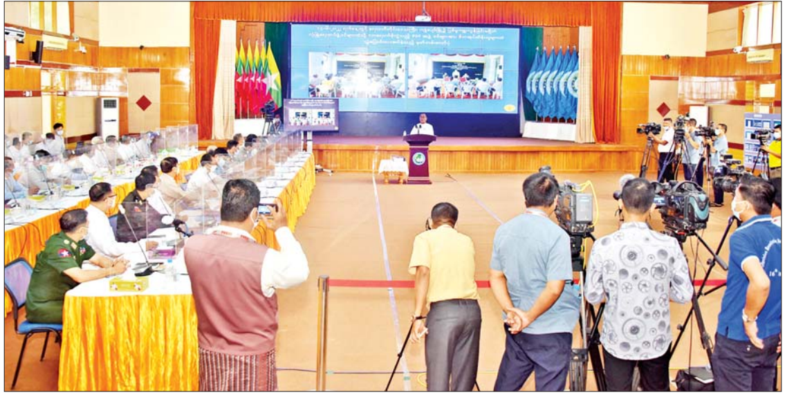
နိုင်ငံတော်စီမံအုပ်ချုပ်ရေးကောင်စီ သတင်းထုတ်ပြန်ရေးအဖွဲ့ (၁၆)ကြိမ်မြောက် သတင်းစာရှင်းလင်းပွဲ ကျင်းပစဉ်။

ဦးစွာ နိုင်ငံတော်စီမံအုပ်ချုပ်ရေး ကောင်စီ သတင်းထုတ်ပြန်ရေးအဖွဲ့ ခေါင်းဆောင် ဗိုလ်ချုပ်ဇော်မင်းထွန်းက ယနေ့သတင်းစာရှင်းလင်းပွဲတွင် ပြောမည့် အကြောင်းအရာများမှာ(တစ်) PDF အပါအဝင် အဖွဲ့အစည်းအမျိုးမျိုးအမည်ခံ၍ လက်နက်ကိုင်ဆန့်ကျင်လျက်ရှိသည့် အဖွဲ့အစည်းများမှ ဥပဒေဘောင်အတွင်းဝင်လိုသူများနှင့်ပတ်သက်၍ အသိပေးထုတ်ပြန်ရခြင်းအခြေအနေ၊ (နှစ်)ငြိမ်းချမ်းရေးဆိုင်ရာကိစ္စရပ်များ၊ (သုံး)တာဝန်မှ ကင်းကွာနေသော အခြေခံပညာရေး ဝန်ထမ်းများကို ပြန်လည်ဖိတ်ခေါ်ခြင်းနှင့် PDF အမည်ခံအကြမ်းဖက်သမားများ၏ အကြမ်းဖက်လုပ်ရပ်များသတ်မှတ်ခြင်း၊ (တစ်)မှ (သုံး)အထိ မိမိအနေဖြင့် ရှင်းလင်းပြောပြသွားမည်ဖြစ်ပြီး ရွေးကောက်ပွဲကော်မရှင်အဖွဲ့ကို ရွေးကောက်ပွဲကော်မရှင်အဖွဲ့ဝင် ဦးခင်မောင်ဦးက ရှင်းလင်းပြောကြားသွားမည်ဖြစ်ကြောင်း၊ ထို့နောက် မေး၊ ဖြေ ကဏ္ဍဖြစ်ကြောင်း၊ မေးခွန်းများမေးသည့်အခါ စနစ်တကျဖြစ်စေရေး အခမ်းအနားမှူးက မီဒီယာအမည်အလိုက် ဖိတ်ခေါ်သွားမည်ဖြစ်ကြောင်း၊ မီဒီယာတစ်ခုလျှင် အချိန်ကန့်သတ်ချက်အရ မေးခွန်းတစ်ခုစီ မေးမြန်းပေးရန် ဖြစ်ကြောင်း ပြောကြားသည်။