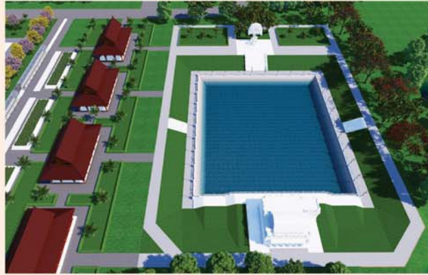
ကျောက်စာရုံစေတီ(၁၂ x ၁၂x ၁၈)ပေ ၁ ဆူ တန်ဖိုး-၂၇၉ သိန်း