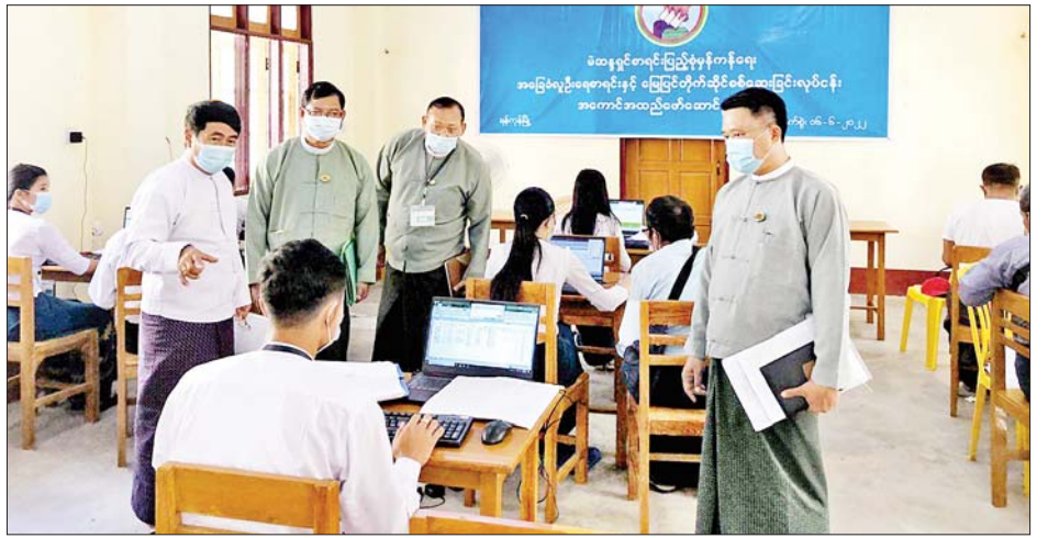
၁၁ ဦးဖြင့် အခြေပြုဆောင်ရွက်လျက်ရှိကြောင်းနှင့် များ၏မဲစာရင်းအခြေခံ လူဦးရေစာရင်းများကို လက်ရှိရွှေပြည်သာနှင့် ဒဂုံမြို့သစ်(တောင်ပိုင်း) မြို့နယ် စစ်ဆေးလျက်ရှိကြောင်း သိရသည်။ သတင်းစဉ်

အဆိုပါအခြေခံလူဦးရေစာရင်း မြေပြင်တိုက်ဆိုင် စစ်ဆေးခြင်းကို ပြည်ထောင်စုနယ်မြေမှ ထုတ်နုတ် ဝန်ထမ်းအင်အား ၆၀၊ ရန်ကုန်တိုင်းဒေသကြီးမှ ထုတ်နုတ်ဝန်ထမ်းအင်အား ၅၁ ဦး၊ ပေါင်းဝန်ထမ်း