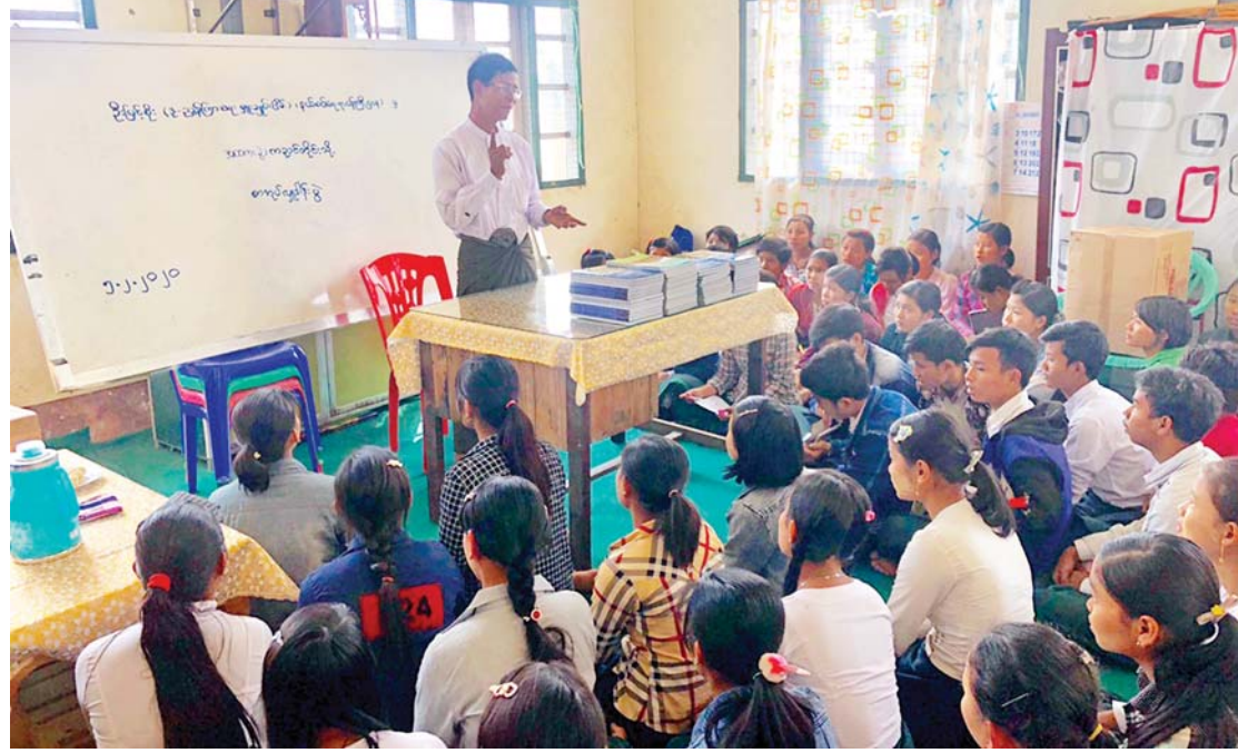
အထက ကညင်တိုင်း၌ ကျောင်းသားကျောင်းသူလေးများအား အားပေးတိုက်တွန်းစကားပြော ကြားစဉ်။

နယ်စပ်ဒေသများအပါအဝင် ပြည်နယ်နှင့် တိုင်း ဒေသကြီးအသီးသီးရှိ ကျောင်းသား ကျောင်းသူများ အနေဖြင့်လည်း မိမိတို့၏ရည်မှန်းချက်များ အောင်မြင် ရေးအတွက် ကျောင်းသားတာဝန်ကို ကျေပွန်စွာ ထမ်းဆောင်ခဲ့ကြပေပြီ။ နယ်စပ်ဒေသ၏ အောင်မြင် မှုများ၊ မွေးရပ်မြေ တိုင်းရောဝတီ၏ အောင်မြင်မှုများ၊ သမဝါယမနှင့် ကျေးလက်ဖွံ့ဖြိုးရေးဝန်ကြီးဌာန၏ အောင်မြင်မှုများကြောင့် ထိုနေ့က ကျွန်တော် ရင်ခုန်သံ နည်းနည်းမြန်ခဲ့