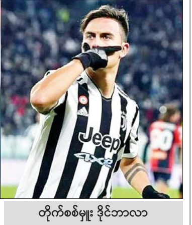
တိုက်စစ်မှူး လူကာကူ