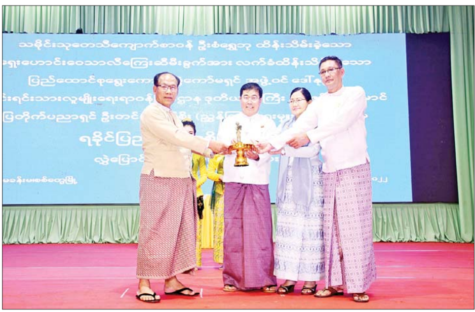
အဆိုပါ ဝေသာလီခေတ် ကြေးဆီမီးခွက်သည် အေဒီ ၃ ရာစုနှင့် ၈ ရာစုအကြား ဝေသာလီခေတ် တွင် ကြေးဝါဖြင့် သွန်းလောင်းခဲ့ပြီး အောက်ခံခုံ ခြေရင်းမှ အရုပ်ဦးစွန်းအထိ ကိုးလက်မ အမြင့်ရှိကာ အောက်ခံခုံပေါ်တွင် “အယနာ ကောင်းမှုတော်” ဟု ရက္ခဝဏ္ဏ အက္ခရာဖြင့် ရေထိုးထားသည့် ရှေးဟောင်း သမိုင်းဝင်လက်ရာတစ်ခုဖြစ်ကြောင်း သိရသည်။ တင်ထွန်း(ပြန်/ဆက်)

ထို့နောက် ရခိုင်ပြည်နယ်ယဉ်ကျေးမှုအကအဖွဲ့ က သျှင်ခိုင်အကဖြင့်လည်းကောင်း၊ မဟာနွယ်အက ဖြင့်လည်းကောင်း ကပြဖော်ပြကြသည်။