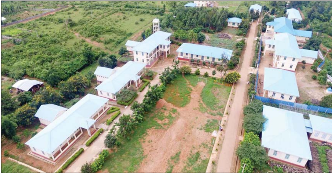
နယ်စပ်ဒေသတိုင်းရင်းသားလူငယ်များ ဖွံ့ဖြိုးရေးသင်တန်းကျောင်း (ပင်းတယ)။