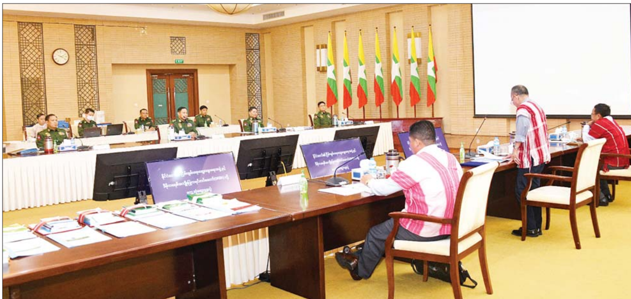
နိုင်ငံတော်၏ ငြိမ်းချမ်းရေးဆွေးနွေးရေးအဖွဲ့နှင့် ဒီမိုကရေစီအကျိုးပြုကရင်တပ်မတော် (DKBA) ကိုယ်စားလှယ်အဖွဲ့တို့ ဒုတိယနေ့ တွေ့ဆုံဆွေးနွေးကြစဉ်။