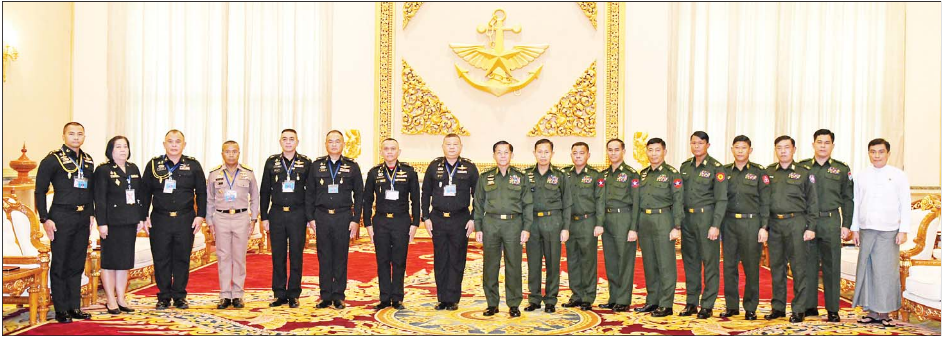
နိုင်ငံတော်စီမံအုပ်ချုပ်ရေးကောင်စီဥက္ကဋ္ဌ တပ်မတော်ကာကွယ်ရေးဦးစီးချုပ် ဗိုလ်ချုပ်မှူးကြီးမင်းအောင်လှိုင်နှင့် ထိုင်းဘုရင့်တပ်မတော်မှ Lt. Gen. Apichet Suesat တို့ အဖွဲ့ဝင်များနှင့်အတူ စုပေါင်းမှတ်တမ်းတင် ဓာတ်ပုံရိုက်စဉ်။

★ ရှေ့ဖုံးမှ အဆိုပါ တွေ့ဆုံပွဲသို့ နိုင်ငံတော်စီမံအုပ်ချုပ်ရေးကောင်စီဥက္ကဋ္ဌ တပ်မတော်ကာကွယ်ရေးဦးစီးချုပ်နှင့်အတူ နိုင်ငံတော်စီမံအုပ်ချုပ်ရေးကောင်စီ ဒုတိယဥက္ကဋ္ဌ ဒုတိယတပ်မတော်ကာကွယ်ရေးဦးစီးချုပ် ကာကွယ်ရေးဦးစီးချုပ်(ကြည်း) ဒုတိယဗိုလ်ချုပ်မှူးကြီးစိုးဝင်းနှင့် တပ်မတော်အရာရှိကြီးများ၊ ထိုင်းနိုင်ငံဆိုင်ရာ မြန်မာနိုင်ငံသံအမတ်ကြီး ဦးချစ်ဆွေတို့ တက်ရောက်ကြပြီး ထိုင်းကိုယ်စားလှယ်အဖွဲ့ခေါင်းဆောင်နှင့်အတူ မြန်မာနိုင်ငံဆိုင်ရာ ထိုင်းကြည်းတပ်စစ်သံမှူး Col. Saranyanis Sutthiwajachinadej နှင့် ထိုင်းဘုရင့်တပ်မတော်မှ အရာရှိကြီးများ တက်ရောက်ကြသည်။ ထိုသို့ တွေ့ဆုံရာတွင် နှစ်နိုင်ငံ တပ်မတော်နှစ်ရပ်အကြား ရှိရင်းစွဲချစ်ကြည်ရင်းနှီးမှုများနှင့် ပူးပေါင်းဆောင်ရွက်မှုများကို ပိုမိုတိုးမြှင့်ဆောင်ရွက်အောင် ဆက်လက်ဆောင်ရွက်သွားမည့် အခြေအနေ၊ နယ်စပ်ဒေသ တည်ငြိမ်အေးချမ်းရေး၊ တရားဥပဒေစိုးမိုးရေးနှင့် မူးယစ်