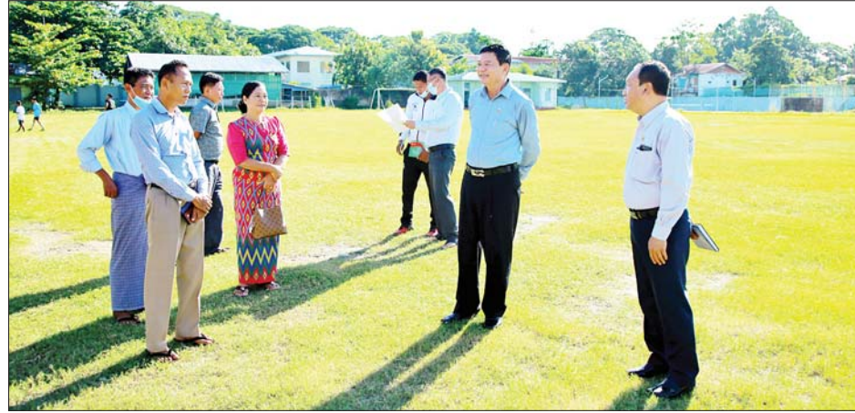
ပြည်ခရိုင်နှင့် ပြည်မြို့နယ်များမှ ဝန်ထမ်းများနှင့် ရင်းရင်းနှီးနှီးတွေ့ဆုံပြီး ဝန်ထမ်းများအား မိမိတို့၏ လုပ်ငန်းတာဝန်များကို ကျေပွန်အောင် ထမ်းဆောင်

နေပြည်တော် ၇ ဇွန် ၂၀ အားကစားနှင့် လူငယ်ရေးရာဝန်ကြီးဌာန ပြည်ထောင်စုဝန်ကြီး ဦးမင်းသိန်းဇံသည် တာဝန်ရှိသူများနှင့်အတူ ယနေ့နံနက်ပိုင်းတွင် ပဲခူးတိုင်းဒေသကြီး ပြည်မြို့နယ် ဘောလုံးအားကစားကွင်းနှင့် ပွဲကြည့်စင်ကိုလည်းကောင်း၊ ပြည်ခရိုင် အားကစားခန်းမနှင့် ဘောလုံးအားကစားကွင်းတို့ကိုလည်းကောင်း လိုက်လံကြည့်ရှုစစ်ဆေးသည်။ ထိုသို့ ကြည့်ရှုစစ်ဆေးစဉ် ပြည်ထောင်စုဝန်ကြီးက ပြည်ခရိုင်ဘောလုံးအားကစားကွင်းတွင် ပွဲကြည့်စင်နှင့် Inter Fencing တည်ဆောက်ပေးသွားမည့် ဖြစ်ကြောင်းနှင့် အားကစားကွင်း/အားကစားရုံများ ရေရှည်တည်တံ့အောင် ထိန်းသိမ်းဆောင်ရွက်သွားကြရန်လိုကြောင်း မှာကြားသည်။ ယင်းနောက် ပြည်ထောင်စုဝန်ကြီးသည်