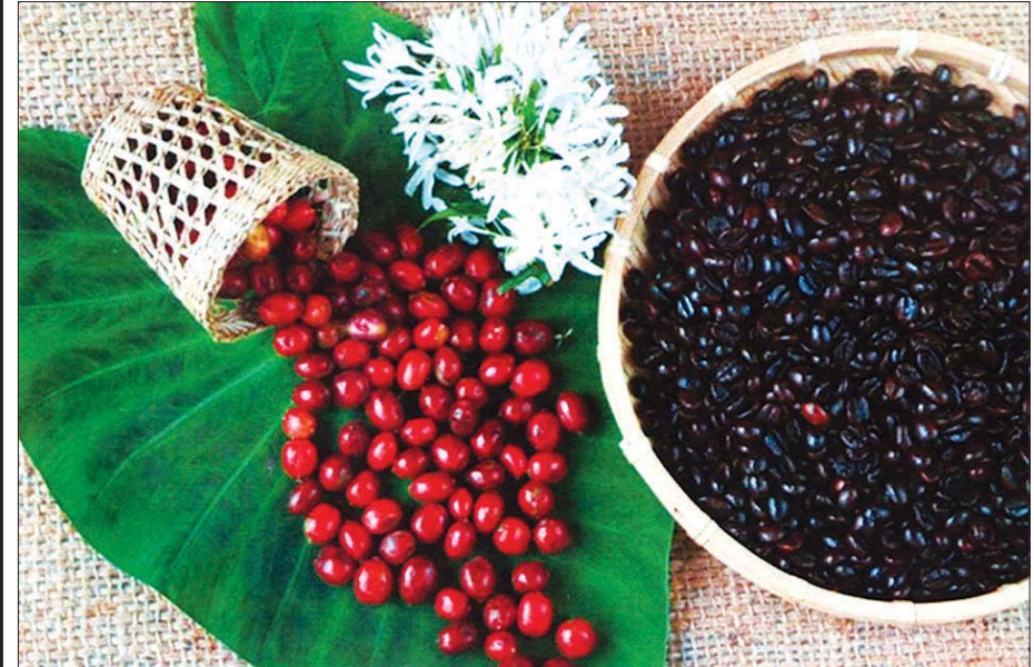
ခူးဆွတ်ပြီး ကော်ဖီစေ့ပုံ။

“အေးပါ။ ငါမှတ်မိပါတယ်။ ကျိုင်းတုံ မင်းတို့ဆီ ငါလာလည်တုန်းက မင်းက ရှေ့တန်းသွားနေတယ်။ တပ်မှာ အို၊ နာ၊ ကျိုးကန်း ရဲဘော်နဲ့ ရဲမေတွေပဲရှိ တော့ ရဲမေတွေက ကင်းစောင့်နေကြတယ်။ ငါက ယောက်ျားကြီးဖြစ်ပြီး ကင်းမစောင့်တော့ ငါ့ကိုယ်ငါ တောင် ရှက်လာပြီး၊ ရဲဘော်တွေ ကင်းစောင့်တဲ့ နေရာသွားပြီးနေခဲ့ဖြစ်တယ်။ ကဲမင်းတပ်တရားဟော တာ ထားပါဦး။ ကော်ဖီက ဘာဖြစ်လို့ စိုက်တာလဲ။”