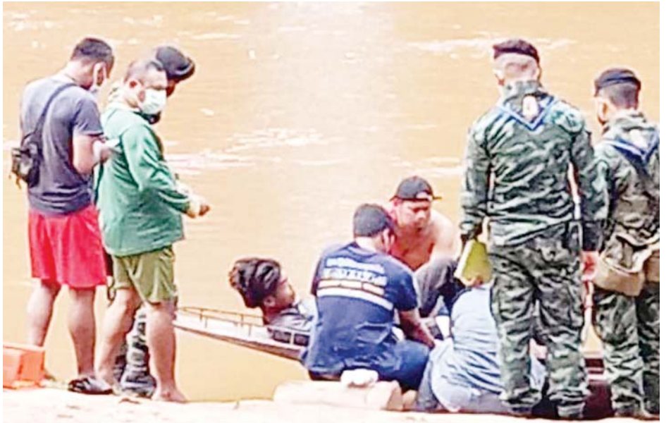
မြဝတီမြို့နယ်ရှိ ဥက္ကရစ်ထ စစ်ဆင်ရေးခြေကုပ်စခန်းအား လာရောက်တိုက်ခိုက်သည့် PDF အမည်ခံ အကြမ်းဖက်သမားများနှင့် KNLA ပူးပေါင်းအဖွဲ့တို့ ဆုတ်ခွာထွက်ပြေးမှုကို တွေ့ရစဉ်။

* ကရင်ပြည်နယ်မှ ထိုကဲ့သို့ အကြမ်းဖက်သမားများ အနေဖြင့် သာလွန်အင်အားအသုံးပြု၍ လက်နက်ကြီး၊ လက်နက်ငယ်များဖြင့် နေ့စဉ်အကြိမ်ကြိမ်လာရောက်တိုက်ခိုက် ခဲ့သော်လည်း စခန်းရှိ အရာရှိ၊ စစ်သည် များ၏ ရဲရင့်စွန့်စားသည့်စိတ်ဓာတ်ဖြင့် စနစ်တကျ တန်ပြန်ခုခံပစ်ခတ်မှုများ ကြောင့် စခန်းအားသိမ်းပိုက်နိုင်ခြင်း