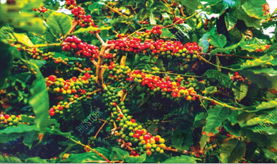
အောင်မြင်ဖြစ်ထွန်းနေသည့် ကော်ဖီသီးနှံပုံ။

ဓာတ်မြေဩဇာမပေးနိုင်တော့ သဘာဝ မြေဩဇာဆိုပြီး ပိုက်ဆံလျှော်မျိုးစေ့တွေလာ ပြီးပေးတယ်။ ပထမတော့ ငါလည်းဒီလောက်တန်ဖိုး မထားပါဘူး။ သူတို့ရှင်းပြတာကို လျှောက်ပြောနေ တယ်ထင်တာ။ အဲ သူတို့ပြန်သွားမှ ကျွဲတာက ဖိုးပျော့ပြောမှ ဒီပိုက်ဆံလျှော်က တကယ်ကောင်းတဲ့ သစ်စိမ်းမြေဩဇာဆိုတာသိရတယ်။ အဲဒါနဲ့ မင်း တပည့်ပြောတာက မင်းတို့ကော်ဖီ အစည်းအဝေး လုပ်နေတယ်ဆို။ မင်းတို့နဲ့ကွာ။ အလုပ်မရှိ အလုပ် ရှာ။ ဘာမဟုတ်တဲ့ ကော်ဖီများအစည်းအဝေးလုပ်နေ ရသေးတယ်။ စပါးတို့၊ မြေပဲတို့၊ ပြောင်းဖူးတို့၊ နေကြာတို့ အစည်းအဝေးလုပ်တယ်ဆိုရင် ငါလက်ခံ ပါတယ်။ အခုတော့ ကော်ဖီဆိုတာက မြို့ကလူတွေပဲ သောက်တာ။ ဒို့တောသားတွေနဲ့ ဘာမှမဆိုင်ပါဘူး။ ကဲ ပြောစမ်းပါဦး။ ကော်ဖီစိုက်ပျိုးရေးကို ဘာကြောင့် ရေးကြီးခွင့်ကျယ်လုပ်ပြီး အစည်းအဝေးလုပ်နေရ တာလဲ။”