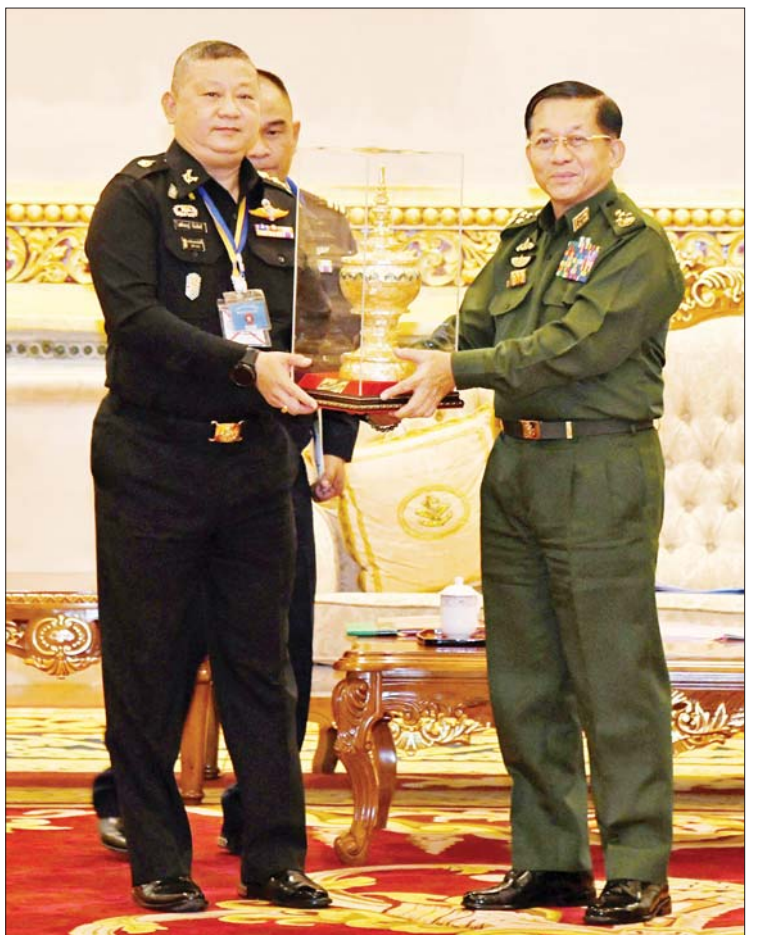
နိုင်ငံတော်စီမံအုပ်ချုပ်ရေးကောင်စီဥက္ကဋ္ဌ တပ်မတော်ကာကွယ်ရေးဦးစီးချုပ် ဗိုလ်ချုပ်မှူးကြီးမင်းအောင်လှိုင် ထိုင်းဘုရင့်တပ်မတော်မှ Lt. Gen. Apichet Suesat အား အမှတ်တရလက်ဆောင်ပစ္စည်း ပေးအပ်စဉ်။

သား လက်နက်ကိုင်အဖွဲ့များကို ငြိမ်းချမ်းရေးကမ်းလှမ်းဖိတ်ခေါ်ပြီး တွေ့ဆုံဆွေးနွေးနေမှု အခြေအနေ၊ နိုင်ငံတော်စီမံအုပ်ချုပ်ရေးကောင်စီမှ ထုတ်ပြန်ထားသည့် ပြည်တွင်း၊ ပြည်ပရှိ အချို့သော ကျောင်းသား ကျောင်းသူ လူငယ်လူရွယ်နှင့် CDM ဝန်ထမ်းများအား ဥပဒေဘောင်အတွင်း ပြန်လည်ဝင်ရောက်နိုင်ရေး အသိပေးထုတ်ပြန်ထားမှုကို ထိုင်းတပ်မတော်မှလည်း ၎င်းတို့၏နယ်စပ်ဒေသများမှ မြန်မာနိုင်ငံသို့ အလွယ်တကူ ပြန်လည်ဝင်ရောက်နိုင်ရေး လိုအပ်သည်များကို ကူညီဆောင်ရွက်ပေးသွားမည့် အခြေအနေနှင့်ပတ်သက်၍ ခင်မင်ရင်းနှီးစွာ အမြင်ချင်းဖလှယ် ဆွေးနွေးခဲ့ကြသည်။ တွေ့ဆုံပွဲအပြီးတွင် နိုင်ငံတော်စီမံအုပ်ချုပ်ရေးကောင်စီဥက္ကဋ္ဌ တပ်မတော်ကာကွယ်ရေးဦးစီးချုပ်နှင့် ထိုင်းကိုယ်စားလှယ်အဖွဲ့ခေါင်းဆောင်တို့သည် အမှတ်တရလက်ဆောင်ပစ္စည်းများ အပြန်အလှန်ပေးအပ်ခဲ့ပြီး အမှတ်တရ စုပေါင်းဓာတ်ပုံရိုက်ခဲ့ကြကြောင်း သိရသည်။