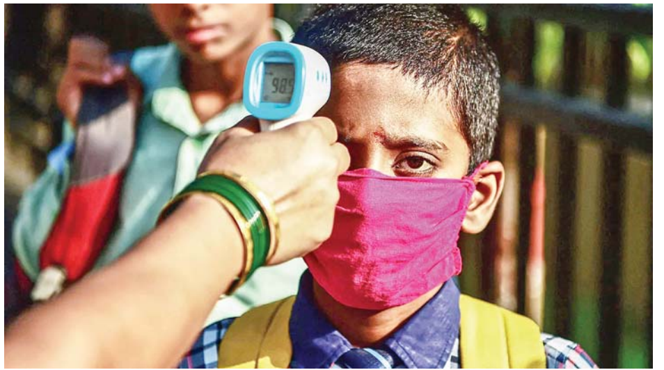
စစ်ဆေးတွေ့ရှိရသည်။

အလားတူ လွန်ခဲ့သော ၂၄ နာရီအတွင်း ကိုဗစ်- ၁၉ ရောဂါ ကူးစက်ခံရသူပေါင်း ၂၀၀၀ ကျော်