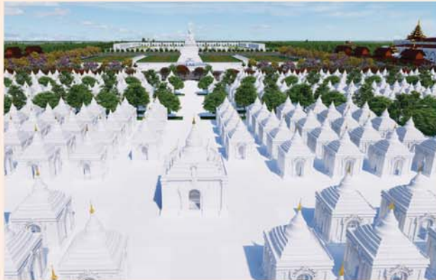
ကျောက်စာရုံစေတီ(၁၂ x ၁၂x ၁၈)ပေ ၁ ဆူ တန်ဖိုး-၂၇၉ သိန်း