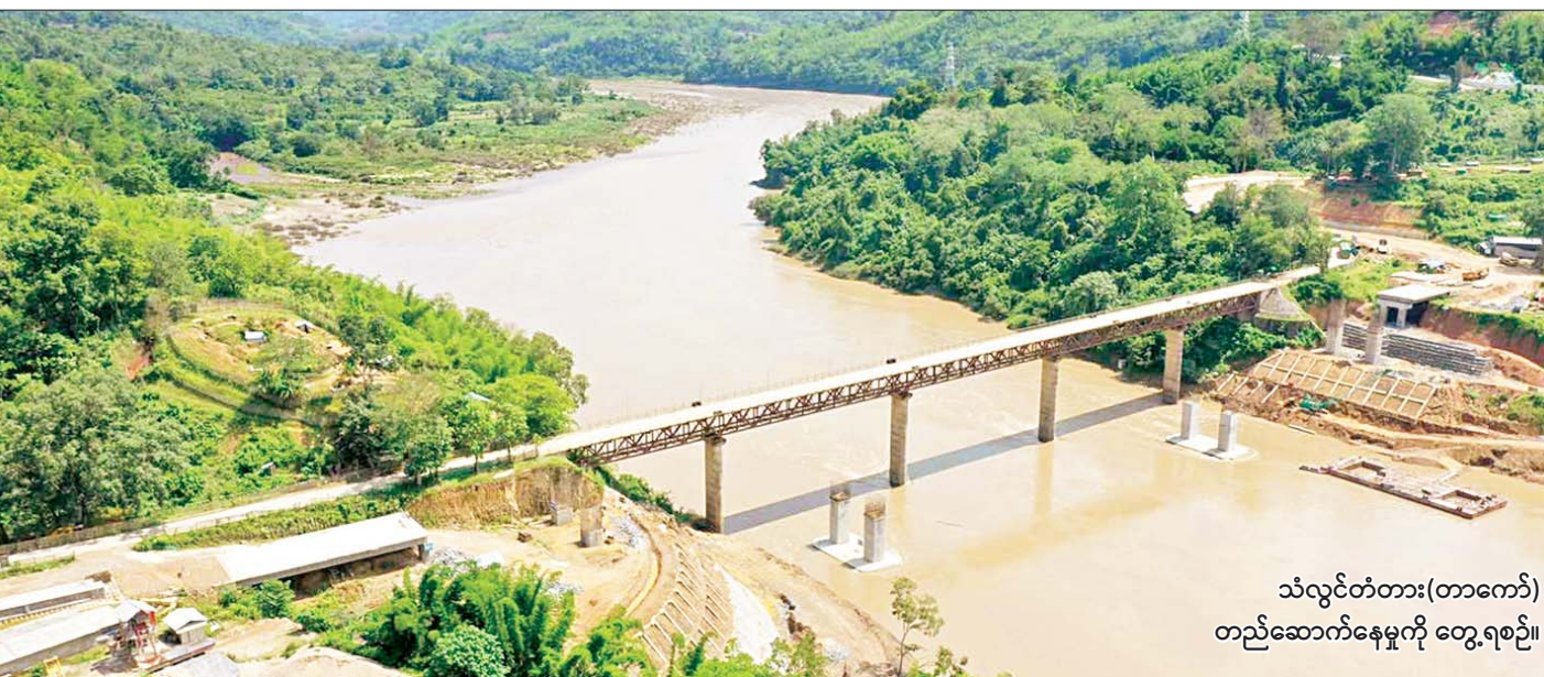
သံလွင်တံတား(တာကော်) တည်ဆောက်နေမှုကို တွေ့ရစဉ်။

ရေစီးသန်လှသည့် သံလွင်မြစ်ကြောင်း၏ တစ်ဖက်တစ်ချက်စီတွင် ယာဉ်ယန္တရားများ အသုံးပြု၍ တာဝန်ကျ ဝန်ထမ်းများ၏ နေ့ဆိုင်၊ ညဆိုင် လှုပ်ရှားမှု များဖြင့် သံလွင်မြစ်ကူးတံတားသစ်(တာကော်)တည်ဆောက်ရေးလုပ်ငန်းခွင်သည် စဉ်ဆက်မပြတ် လည်ပတ်လျက်ရှိပါသည်။ တံတားသစ်တည်ဆောက်ရေးလုပ်ငန်း၏ ဘေးဘက်(တာကော်)တံတားဟောင်းကြီးပေါ်မှလည်း ယာဉ်ကြီးယာဉ်ငယ်များက စဉ်ဆက်မပြတ်သွားလာဖြတ်သန်းနေဆဲ။ စာမျက်နှာ ၂၃ ကော်လံ ၁ သို့ ၀