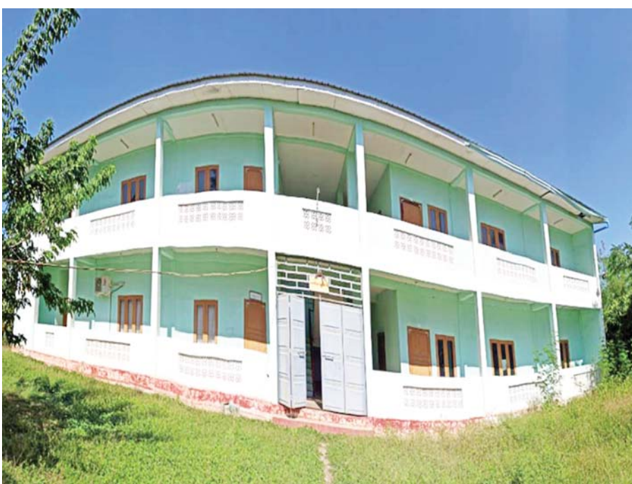
သမဝါယမစာရင်းရေး စာရင်းကိုင် သက်မွေးပညာသင်တန်းကျောင်း (မကွေး)။

ပညာရေးနှင့် သက်မွေးပညာသင်တန်းကျောင်း များ အဆင့်အတန်းမြင့်မားရေးနှင့် ဖွံ့ဖြိုးတိုးတက်ရေး အတွက် နိုင်ငံတော်စီမံအုပ်ချုပ်ရေးကောင်စီဥက္ကဋ္ဌ နိုင်ငံတော်ဝန်ကြီးချုပ် ဗိုလ်ချုပ်မှူးကြီး မင်းအောင်လှိုင်က ပြည်ထောင်စုအစိုးရအဖွဲ့ အစည်းအဝေးအမှတ်စဉ် (၄ / ၂၀၂၂) တွင် - မိမိတို့အစိုးရအနေဖြင့် ပညာရေးနှင့်ပတ်သက် ၍ပြုပြင်ပြောင်းလဲမှုအဖြစ် KG+9 ပညာရေးစနစ်ကို မသင်မနေရအဖြစ် အကောင်အထည်ဖော် ဆောင်ရွက်ခဲ့ကြောင်း၊ ငြိမ်းချမ်းရေးဆွေးနွေးပွဲများ တွင်လည်း အဆိုပါ ပညာရေးစနစ်နှင့်ပတ်သက်၍ ထည့်သွင်းဆွေးနွေး ရှင်းလင်းပြောကြားခဲ့ကြောင်း၊ ယင်းစနစ်သည် ၂၀၁၀ ပြည့်နှစ်က စတင်ခဲ့သည့် နှစ် ၃၀ အမျိုးသားပညာရေး မဟာဗျူဟာစီမံကိန်း တွင် ပြဋ္ဌာန်းထားပြီးဖြစ်ကြောင်း၊ KG+9 သင်ယူပြီး ပါက KG+10,11,12 မှတစ်ဆင့် အဆင့်မြင့်ပညာရေး သို့လည်းကောင်း၊ စိုက်ပျိုးမွေးမြူရေးအထက်တန်း ကျောင်း၊ စက်မှုလက်မှုအထက်တန်းကျောင်း အပါအဝင် သက်မွေးပညာသင်ကျောင်းများသို့ လည်းကောင်း ဆက်လက်တက်ရောက် သင်ကြား နိုင်ရေး ဆောင်ရွက်ပေးရမည်ဖြစ်ကြောင်း၊ တိုင်းဒေသကြီးနှင့် ပြည်နယ်အလိုက် အဆိုပါ သက်မွေးပညာသင်ကျောင်းများ ဖွင့်လှစ်နိုင်ရေး