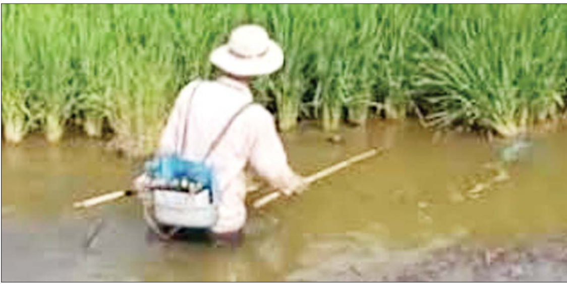
ဘက်ထရီရေတိုက်၍ ငါးဖမ်းနေသည်ကို တွေ့ရစဉ်။

ငါးသယံဇာတများ တဖြည်းဖြည်း လျော့နည်းလာခြင်းသည် မြန်မာ တစ်နိုင်ငံတည်းမဟုတ်ချေ။ ယမန်နှစ်က ထုတ်ပြန်ခဲ့သော နိုင်ငံတကာတွင် လူသိများထင်ရှားသည့် သဘာဝပတ်ဝန်းကျင်ထိန်းသိမ်းရေးအဖွဲ့ ၁၆ ဖွဲ့၏ ပူးပေါင်းလေ့လာမှုတစ်ရပ်က တစ်နှစ်အတွင်း ရေချိုငါးမျိုးစိတ် ၁၆ မျိုး မျိုးသုဉ်းပျောက်ကွယ်သွားကြောင်း၊ လွန်ခဲ့သည့် နှစ်ငါးဆယ်အတွင်း ရွှေ့ပြောင်းနေထိုင်သည့် ငါးကောင်ရေ လေးပုံသုံးပုံ လျော့ကျသွားကြောင်း၊ ပိုမိုကြီးမားသည့် ငါးမျိုးစိတ်အရေ