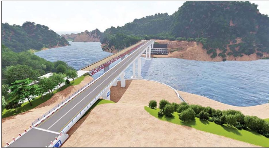
သံလွင်တံတားသစ်(တာကော်) တည်ဆောက်ပြီးစီးပါက တွေ့မြင်ရမည့်ပုံစံ။

သို့သော် နေ့စဉ် ကုန်စည်တင်ဆောင်ထားသော ကားကြီးများ ၉၃၀၀ ကျော်သန်းသွားလာနိုင်အောင် သံလွင်တံတား(တာကော်)သည် ၄၅ နှစ်ကျော် တာဝန်ထမ်းဆောင်ခဲ့ပြီးဖြစ်သည့်အတွက် ခံနိုင်ဝန်ကို လျှော့ချထားရပြီဖြစ်သည်။