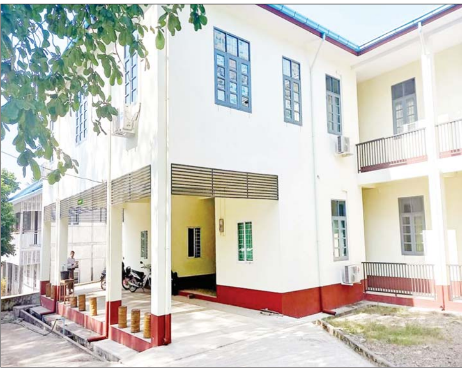
သမဝါယမစာရင်းရေး စာရင်းကိုင် သက်မွေးပညာသင်တန်းကျောင်း (မော်လမြိုင်)။

ယခုဖွင့်လှစ်မည့် သမဝါယမ စာရင်းရေးစာရင်းကိုင်သက်မွေးပညာ နှစ်နှစ်သင်တန်းကို အပိုင်းနှစ်ပိုင်းခွဲကာ ပထမနှစ်တွင် Business Accounting၊ Fundamentals of ICT၊ သမဝါယမပညာ၊ မြန်မာစာ၊ အင်္ဂလိပ်စာ၊ သင်္ချာ၊ ဘောဂဗေဒ ဘာသာရပ်များ သင်ကြားပေးမည်ဖြစ်ပြီး ဒုတိယနှစ်တွင် Cost Accounting၊ Financial Accounting၊ Computerized Accounting၊ Business Organization and Management၊ သမဝါယမစာရင်းကိုင်ပညာနှင့် စာရင်းစစ်ဆေးခြင်း၊ အင်္ဂလိပ်စာ၊ သင်္ချာ၊ ဘောဂဗေဒ ဘာသာရပ်များကို သက်ဆိုင်ရာ ဘာသာရပ်နယ်ပယ်အသီးသီးမှ ကျွမ်းကျင်